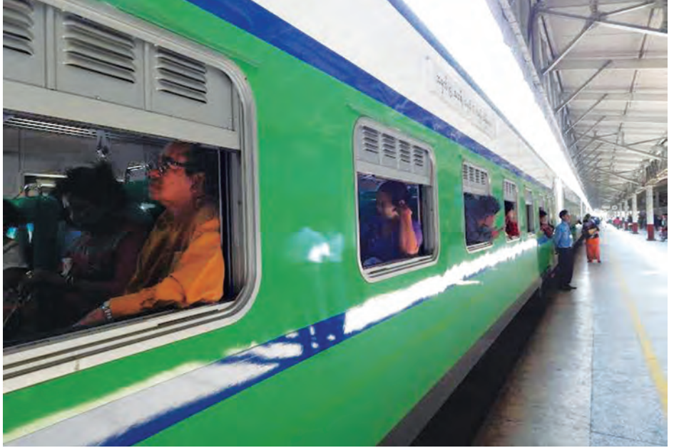
ရန်ကုန်-မန္တလေးလမ်း အမှတ်(၅)အဆန် ရထားတွဲဆိုင်သစ်မှ ရထားစီးခရီးသည်များအား တွေ့ရစဉ်။

ရန်ကုန်-မန္တလေးလမ်း အမှတ်(၅)အဆန်နှင့် မန္တလေး-ရန်ကုန်လမ်းအမှတ်(၆)အစုန် အမြန်ရထားများ ကို တွဲဆိုင်အသစ်မလဲလှယ်မီက ထိုင်ခုံခွဲလက်မှတ်လုံးဝ မရောင်းချရန်၊ ခရီးသည်နှင့်အတူ ပါလာမည့်ခွင့်ပြု အလေးချိန်အတွင်းပစ္စည်းများသာတင်ဆောင်ရန်၊ ယခင် ကကဲ့သို့ ရထားထိန်းတွဲ၌ တန်ဆာဖြင့်တင်ဆောင် ခွင့်ပြုထားသော ရောင်းဝယ်ဖောက်ကားမှုပစ္စည်းများကို တင်ဆောင်ခွင့်မပြုရန်၊ လက်မှတ်မဲ့များနှင့် ဈေးသည် များမပါရှိရန်အတွက် တိုင်းမန်နေဂျာများက ကိုယ်တိုင် တာဝန်ယူရန်၊ လက်မှတ်စစ်ကွင်းဆက်ဖျက်အတိုင်း မပျက်မကွက်စစ်ဆေးရန်၊ စက်မှုဌာနနှင့် သွားလာ၊ စီးပွား ဌာနမှ ရထားတာဝန်များများက နေ့စဉ်လိုက်ပါရန်၊ တွဲထိန်းများတွဲအလိုက် အင်အားပြည့်လိုက်ပါရန်၊ ခရီးသည်အသိပေးကြေညာချက်များကို ရထားစတင် ထွက်ခွာချိန်မှ ခရီးဆုံးအထိနှင့် လမ်းခရီးဘူတာရောက်၊ ထွက်တိုင်းအသိပေးရန်၊ တွဲဝဲခါးများကို ရထားမထွက်မီ ပိတ်ရန်၊ ဘူတာတွင်ရပ်ပြီးမှဖွင့်ရန်နှင့် မြန်မာ့မီးရထားမှ ဝန်ထမ်းများကိုပင် မည်သည့် pass များနှင့်မှ စီးနင်းမှုမပြု