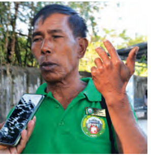
BRT Lite ဝိတ်မျိုး ဦးဆယ်တင်

BRT Lite ဝိတ်မျိုး ဦးဆယ်တင် က ပြောကြားရာတွင် “ပထမဆုံး ဘတ်စ်ကား ၁၈ စီးနဲ့လမ်းကြောင်း(၁) ပြေးဆွဲမှာပါ။ ထောက်ကြံ့လှောက်ထား လမ်းခွဲဝိတ်ဟောင်း မှတ်တိုင်အနီး BRT လိုင်းဝိတ်သစ်က နံနက် ၆ နာရီဝိတ်ထိုးထွက်ခွာပြီး ထောက်ကြံ့ အမှတ်(၁)လမ်းမကြီးက ပြည်လမ်း ဗိုလ်ချုပ်အောင်ဆန်းလမ်းကို ဖြတ်၍ ကမ္ဘာအေးဘုရားလမ်း၊ ပြည်လမ်း သို့မောင်းလာပြီး ဝိတ်ရင်းကိုပြန်ဝင် ရမှာဖြစ်ပါတယ်။ လမ်းကြောင်း(၂)က ထောက်ကြံ့၊ ပြည်လမ်း၊ ရှစ်မိုင် လမ်းဆုံ၊ ကမ္ဘာအေးဘုရားလမ်း၊ ဗိုလ်ချုပ်အောင်ဆန်းလမ်း၊ ၅၄ လမ်း၊ ဗိုလ်တထောင်ဘုရားလမ်း၊ ကမ်းနား လမ်း၊ ဘုန်းကြီးလမ်း၊ ပြည်လမ်း အတိုင်း ပြန်ဝင်လာရမယ်။ ၁၀ မိနစ် ခြားတစ်စီး လွှတ်ပေးတယ်။ ရုံးတက် ချိန်နဲ့ ရုံးဆင်းချိန်အခြေအနေကြည့် ပြီး လွှတ်ပေးဖို့မှာထားပါတယ်။ ကားတစ်စီးကို တစ်နေ့သုံးကြောင်း၊ ယာဉ်မောင်းကတစ်နေ့ ရှစ်နာရီပဲ မောင်းရမယ်။ တစ်ပတ်မှာ တစ်ရက် နားခွင့်ရတယ်။ စမ်းသပ်ကာလဖြစ်လို့ ယာဉ်ပေါ်မှာ i pay ကတ်ရောင်းချ သူဝန်ထမ်းပါတယ်” ဟု ပြောသည်။