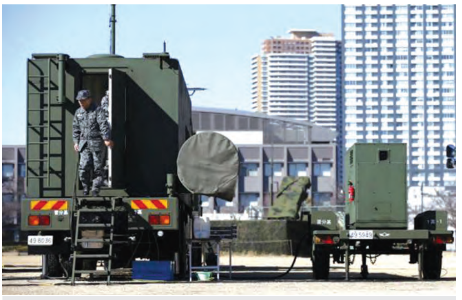
ဖေဖော်ဝါရီ ၇ ရက်က တိုကျိုရှိ (PAC-3)ပျံတစ်လုံးကို ဖြစ်တွေ့ရစဉ်။