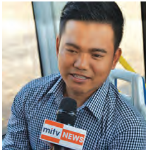
ခရီးသွားပြည်သူတစ်ဦး

ထို့နောက် ခရီးသွားပြည်သူ တစ်ဦးကပြောရာမှာ “ကျွန်တော် လည်း တစ်ထောင်ကျပ်တန်ကတ် ဝယ်ပြီးစီးတာပါ။ ခက်ခက်ခဲခဲမရှိပါ ဘူး။ ကျွန်တော်က ကုမ္ပဏီဝန်ထမ်း ဖြစ်လို့ အလုပ်ကို အမြန်ရောက်ချင် တယ်။ ဒီကနေ အရင်လို အငှား ယာဉ်စီးလျှင် ငွေကျပ် ၈၀၀၀ ကနေ