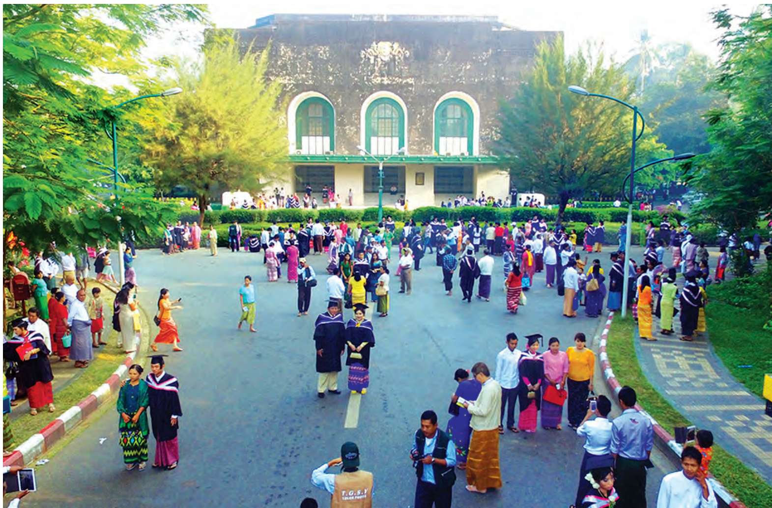
ရန်ကုန်တက္ကသိုလ် ဘွဲ့နှင်းသဘင်ခန်းမကြီးကို ဤသို့တွေ့ရသည်။