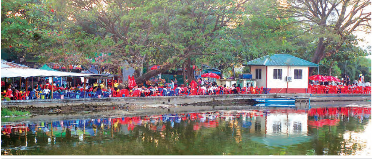
ရန်ကုန်တက္ကသိုလ်ကျောင်းသား ကျောင်းသူများ အပန်းဖြေရာ အင်းလျားကန်ပေါင်ရှိ စားသောက်ဆိုင်တန်းကို တွေ့ရစဉ်။

အရှေ့တောင် အာရှတွင် တစ်ခေတ်တစ်ခါက ဂုဏ်သတင်း မွှေးပျံ့ခဲ့သည့် ရန်ကုန်တက္ကသိုလ် သည် ရန်ကုန်တိုင်းဒေသကြီး ကမာရွတ်မြို့နယ် အမှတ်(၉)ရပ်ကွက် ၌ တည်ရှိပြီး ၁၉၂၀ ပြည့်နှစ် ဒီဇင်ဘာလ ၁ ရက်နေ့တွင် ရန်ကုန် တက္ကသိုလ်အဖြစ်လည်းကောင်း၊ ၁၉၆၄ ခုနှစ် အောက်တိုဘာလ ၁ ရက်နေ့