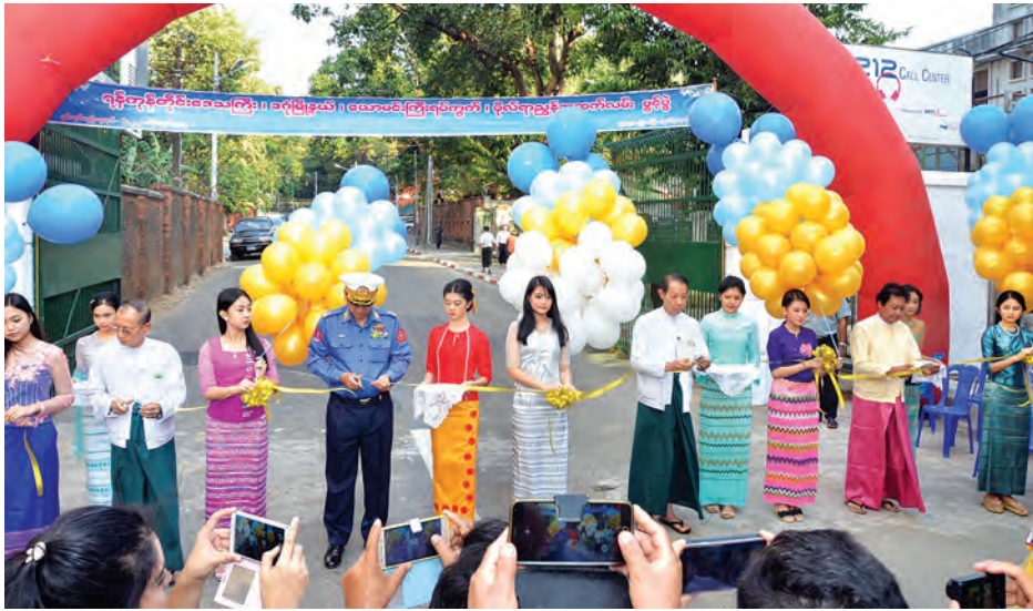
တွင် အ. ထ. က(၁)ဒဂုံရုံးကြီး ကျောင်း ယာဉ်များဖြင့် ယာဉ်ကြောကျပ်တည်း အဆိုပါ လမ်းဖွင့်လှစ်လိုက်ခြင်းဖြင့် ဖွင့်ရာသီတွင် ကျောင်းပို့ ကျောင်းကြို မှုများ မကြာခဏပေါ်ပေါက်ခဲ့ရာ ယာဉ်ကြောကျပ်တည်းမှု အထိုက်

အလျောက် ပြေလျော့သွားမည် ဖြစ်ကြောင်း ရပ်ကွက်နေပြည်သူများ ထံမှ သိရသည်။