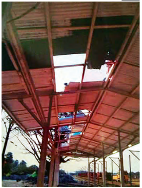
ဇင်းကျိုက်ဘူတာရုံ အမိုးသွပ်များလန်နေသည်ကို တွေ့ရစဉ်။

အဆိုပါ မိုးလေဝသဖြစ်စဉ်၏ အကျိုးသက်ရောက် မှုအဖြစ် မြန်မာနိုင်ငံတောင်ဘက်စွန်း တနင်္သာရီတိုင်း ဒေသကြီး ကျောသောင်းမြို့တွင် ဖေဖော်ဝါရီ ၆ ရက် ညဦးပိုင်းမှ စတင်ကာ အရှေ့လေပြင်းများ တိုက်ခတ် မှုခံစားနေရပြီဖြစ်သည်။ အဆိုပါ အရှေ့လေပြင်းများ တိုက်ခတ်မှုကြောင့် ဖေဖော်ဝါရီ ၇ ရက် နံနက်ပိုင်း တွင် ကျောသောင်းမြို့အတွင်း လေတိုက်နှုန်းမြင့်မား သဖြင့် မြို့၏ပင်လယ်ကမ်းစပ်သို့ လှိုင်းလုံးကြီးများ ဝင် ရောက်လျက်ရှိပြီး ငါးဖမ်းလှေများ လုပ်ငန်းခွင်သို့ထွက် ခွာနိုင်ခြင်းမရှိဘဲ ဆိပ်ကမ်းများ၌ ဆိုက်ကပ်ထားရ ကြောင်း၊ ဆိုက်ကပ်ထားသည့် ငါးဖမ်းလှေတချို့ ဆိပ် ကမ်းတွင်လှိုင်းဒဏ်ကြောင့် နစ်မြုပ်မှုများ ဖြစ်ပေါ်လျက် ရှိပြီး မြို့ပေါ်ရပ်ကွက်ရှိ ပြည်သူများ အိမ်တချို့ အမိုး သွပ်များလန်ထွက်ခြင်း၊ သစ်ပင်သစ်ကိုင်းများ ကျိုးကျ ခြင်းဖြစ်စဉ်များ ကြုံတွေ့နေကြကြောင်း၊ မီးသတ်ဦးစီး ဌာနမှ တာဝန်ရှိသူများ မြို့နေပြည်သူများလေတိုက်နှုန်း မြင့်မားလွန်းသဖြင့် မီးသုံးစွဲရာတွင် အထူးသတိပြုကြရန် မြို့ပေါ်ရပ်ကွက်များ၏ အရန်မီးသတ်တပ်ဖွဲ့ အကူအညီ ဖြင့် လိုက်လံနူးဆော်သတိပေးဆောင်ရွက်မှုများလုပ် ဆောင်လျက်ရှိကြောင်း၊ ဒေသတာဝန်ရှိအဖွဲ့အစည်းများ