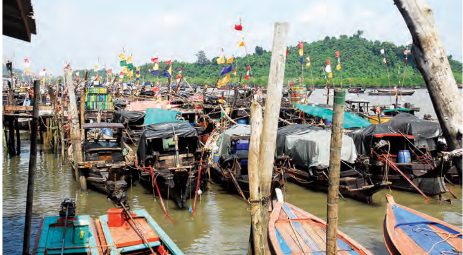
လေပြင်းတိုက်ခတ်မှုကြောင့် ပင်လယ်ပြင်မထွက်နိုင်သည့် စက်လှေများကို ကျောသောင်းမြို့ဆိပ်ကမ်း၌ တွေ့ရစဉ်။

လွန်ပင်လယ်ပြင်တို့တွင် လေတိုက်နှုန်း 2.5 - 15 mph၊ လှိုင်းအမြင့် (၃-၄ ပေ)၊ မြစ်ဝကျွန်းပေါ်နှင့် မုတ္တမကွေ့ ကမ်းလွန်ပင်လယ်ပြင်တို့တွင် လေတိုက်နှုန်း 23-25 mph လှိုင်းအမြင့် (၄-၅ ပေ)၊ တနင်္သာရီကမ်းရိုးတန်း နှင့် ကမ်းလွန်ပင်လယ်ပြင်တို့တွင် လေတိုက်နှုန်း 28 mph လှိုင်းအမြင့်(၆-၈ ပေ)၊ မြစ်ဝကျွန်းပေါ်-မွန်- တနင်္သာရီ-ကမ်းရိုးတန်းတစ်လျှောက်နှင့် ကမ်းလွန် ပင်လယ်ပြင်တို့တွင် အရှေ့လေပြင်းများ 20-30 mph