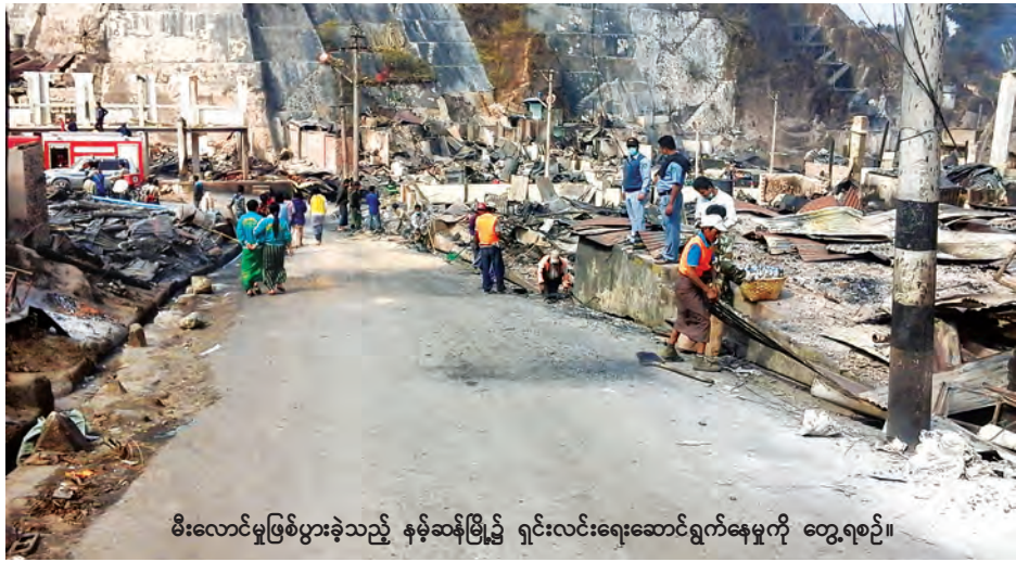
မီးလောင်မှုဖြစ်ပွားခဲ့သည့် နမ့်ဆန်မြို့၌ ရှင်းလင်းရေးဆောင်ရွက်နေမှုကို တွေ့ရစဉ်။

မီးဘေးသင့်ပြည်သူများ မီးလောင် ပြင်သန့်ရှင်းရေးလုပ်ငန်းများ ဆောင် ရွက်ရေးအတွက် သီပေါ၊ ကျောက်မဲ၊ လားရှိုးမြို့နယ်တို့မှ မီးသတ်တပ်ဖွဲ့ဝင် များအပြင် သီပေါမြို့မှ စေတနာ လုပ်အားရှင် ၅၀ တို့ ယနေ့ နမ့်ဆန် မြို့နယ်သို့ရောက်ရှိလာပြီး အခြား မြို့နယ်များမှ စေတနာလုပ်အားရှင် များလည်း ဆက်လက်ရောက်ရှိလာ မည်ဖြစ်ကြောင်း နမ့်ဆန်မြို့ တာဝန်ရှိသူတစ်ဦးထံမှ သိရ သည်။