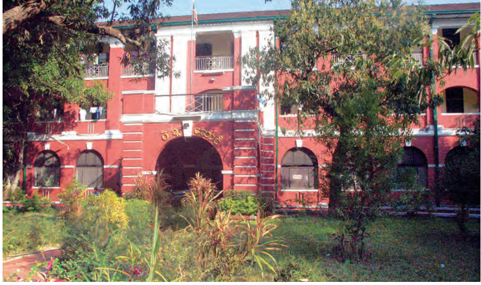
ပဲခူးဆောင်ကို ခံထည်စွာ တွေ့ရစဉ်။

ခေတ်ကာလများစွာ ကျော်ဖြတ် ခဲ့ပြီဖြစ်သည့် ရန်ကုန်တက္ကသိုလ်ကြီး သည် နှစ် ၁၀၀ သက်တမ်းကို