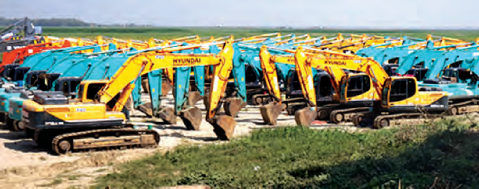
တူးမြောင်းတူးဖော်မည့် စက်ယန္တရားများကိုတွေ့ရစဉ်။

ဧရာဝတီတိုင်းဒေသကြီး ဝန်ကြီးချုပ် ဦးသိန်းအောင်သည် ဖေဖော်ဝါရီ ၂ ရက်က လေ့နပ်မြို့နယ် ငါးဆယ်ကျွန်းမှ ရွှေလာဘိတ်ကျွန်းသို့ ဧရာဝတီမြစ်ဖြတ် တူးမြောင်းတူးဖော်မည့် ကျေးရွာများရှိ ဒေသခံပြည်သူများနှင့် ရေလယ်သောင်လေး ရွှေတမံလေး ကျေးရွာတွင် တွေ့ဆုံခဲ့သည်။