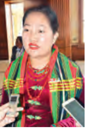
ဒေါ်ကျိန်ဒိုက်မန်

ဥပဒေကြမ်း ကော်မတီဖွဲ့စည်းခြင်းနှင့် ပြည်သူ့ငွေစာရင်းကော်မတီဖွဲ့စည်းခြင်းတို့တွင် တစ်ဖွဲ့လျှင် ကော်မတီဝင် ၁၅ ဦးစီဖြင့် ပါဝင်ဖွဲ့စည်းမည်ဖြစ်ကြောင်း၊ ပြည်သူ့လွှတ်တော်တွင် လေ့လာဆန်းစစ်မှု ဦးအောင်မင်းအား ပြည်သူ့ငွေစာရင်းကော်မတီဥက္ကဋ္ဌအဖြစ်လည်းကောင်း၊ တောင်ငူမဲဆန္ဒနယ်မှ ဦးခင်မောင်သန်းအား အတွင်းရေးမှူးအဖြစ်လည်းကောင်း၊ နောင်ချိုမဲဆန္ဒနယ်မှ ဦးထွန်းအောင်(ခ) ဦးထွန်းထွန်းဟိန်အား ဥပဒေကြမ်းကော်မတီအဖွဲ့ဥက္ကဋ္ဌအဖြစ်လည်းကောင်း၊ ကျိုင်းတုံမဲဆန္ဒနယ်မှ ဦးစတီဖန်အားအတွင်းရေးမှူးအဖြစ်လည်းကောင်း ရွေးချယ်တင်မြှောက်ခဲ့ပြီး အမျိုးသားလွှတ်တော်တွင် စစ်ကိုင်းတိုင်းဒေသကြီး မဲဆန္ဒနယ် အမှတ်(၆)မှ ဦးဇော်မင်းအား ဥပဒေကြမ်းကော်မတီဥက္ကဋ္ဌအဖြစ်လည်းကောင်း၊ ရန်ကင်းတိုင်းဒေသကြီး မဲဆန္ဒနယ် အမှတ်(၃)မှ ဒေါက်တာမြတ်ဉာဏစိုးအား အတွင်းရေးမှူးအဖြစ် လည်းကောင်း၊ ကရင်ပြည်နယ်မဲဆန္ဒနယ် အမှတ်(၂)မှ ဦးစောသန်းထွန်းအား ပြည်သူ့ငွေစာရင်း ကော်မတီဥက္ကဋ္ဌအဖြစ်လည်းကောင်း၊ ရှမ်းပြည်နယ် မဲဆန္ဒနယ် အမှတ်(၆)မှ ဒေါက်တာ စိုင်းဆိုင်ကျော်ဆမ်အား အတွင်းရေးမှူးအဖြစ်လည်းကောင်း ရွေးချယ်တင်မြှောက်ကြောင်း သိရသည်။