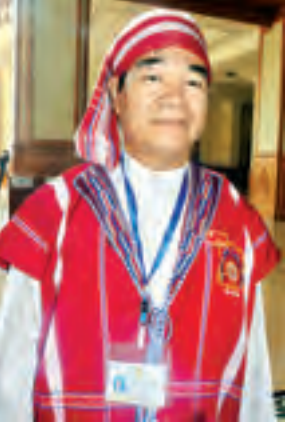
ဦးစောမိုးမြင့်