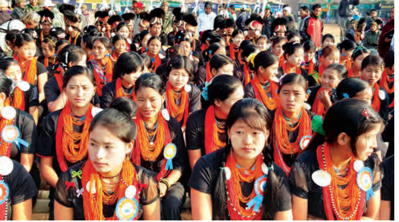
နာဂရိုးရာနှစ်သစ်ကူးပွဲတော်တွင် တွေ့မြင်ရသည့် နာဂမျိုးမေများ။

ပြင်ဆင်နေခြင်း၊ ရိုးရာအဝတ်အထည်နှင့် လက်မှုပစ္စည်းများရောင်းချရန် အရောင်းဆိုင်ခန်းများ ဆောက်လုပ်နေခြင်း၊ အထက (လဟယ်)မှ ကျောင်းသား ကျောင်းသူလေးများ၏ ဘင်ခရာအဖွဲ့ လေ့ကျင့်တီးမှုတ်နေခြင်း၊ တဖွဲဖွဲရောက်ရှိလာသော နာဂရိုးရာယဉ်ကျေးမှုအဖွဲ့များက ကွင်းအတွင်းဝင်ရောက်၍ အကများ လေ့ကျင့်ခြင်းတို့ကို အတိုင်းသားမြင်နေရသည်။ နာဂတေး သီချင်းသံများကိုလည်း ယခုထိ ပြန်လည်ကြားယောင်နေဆဲ။ နာဂလူလင်ပျိုလေးများ၏ လဟယ်မှ စံပြကျေးရွာအထိ အသွားအပြန် ၁၂ မိုင် မိနိမာရသွန်အပြေးပြိုင်ပွဲကို အားပေးသံများ၊ ချောတိုင်တက်ပြိုင်ပွဲ၊ ဘော်လီဘောပြိုင်ပွဲ၊ အမျိုးသား၊ အမျိုးသမီး လွန်ဆွဲပြိုင်ပွဲများတွင် (အောက်ပုံ)အုန်းအုန်းကျွက်ကျွက် အားပေးနေသည့် အသံများကလည်း ယနေ့အထိ တိုးတိတ်မသွားခဲ့။ ပြန်လည်တွက်စစ်ကြည့်လိုက်တော့ နာဂရိုးရာနှစ်သစ်ကူးပွဲတော်ကို ထိုကဲ့သို့ တစ်စု