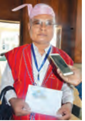
ဦးရှေးရယ်ရမောင်