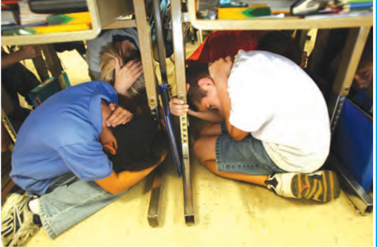
အမေရိကန်နိုင်ငံ ဗာဂျီးနီးယားပြည်နယ်ရှိ ကျောင်းတစ်ကျောင်းတွင် ကလေးများအား ငလျင်လှုပ်ချိန်တွင် အန္တရာယ်ကင်းအောင် နေထိုင်ရမည့်ပုံစံကို လေ့ကျင့်ပေးနေစဉ်။

ကြောင့် ပျက်စီးဆုံးရှုံးမှုများဖြစ်စေသဖြင့် အဆိုပါနောက်ဆက်တွဲဘေးအန္တရာယ်များဖြစ်သော နောက်ဆက်တွဲငလျင်များ၊ မီးဘေးအန္တရာယ်၊ ရေကာတာကြီးများ ကျိုးပျက်၍ ရေကြီးခြင်း၊ တောင်ပြိုခြင်း၊ မြေပြိုခြင်း၊ ရွှံ့မီးတောင်များ ပေါက်ကွဲခြင်း၊ ဆူနာမီလှိုင်းဖြစ်ပေါ် ရိုက်ခတ်ခြင်း၊ ကောလာဟလသတင်းလွှင့်ခြင်းတို့ကို သတိထားရန်လိုပါသည်။