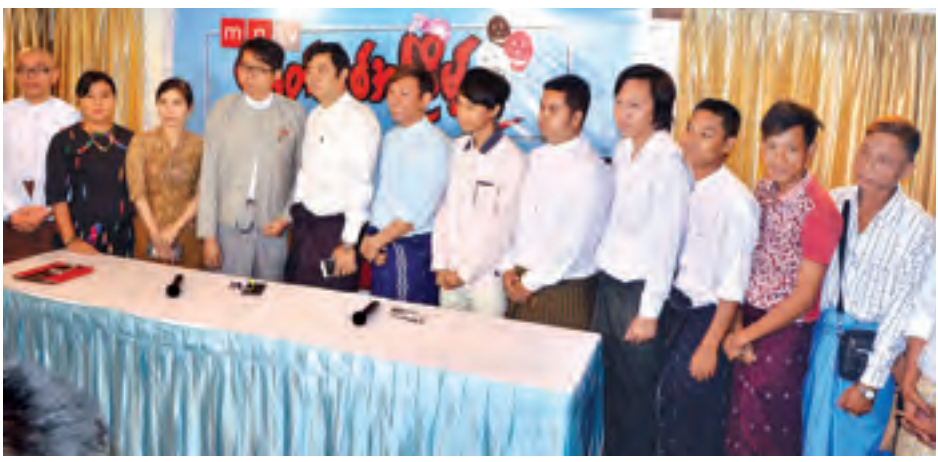
ခေတ်သစ်အငြိမ့်ပြိုင်ပွဲတွင် ယှဉ်ပြိုင်ကြမည့် လူရွှင်တော်များအား တွေ့ရစဉ်။

မျိုးဆက်သစ် လူရွှင်တော်ကောင်းများပေါ်ထွက်လာစေရန် ရည်ရွယ်ပြီး MNTV ရုပ်သံလိုင်းမှ စီစဉ်ဆောင်ရွက်သည့် ခေတ်သစ်အငြိမ့်ပြိုင်ပွဲတစ်ရပ်ကျင်းပသွားမည်ဖြစ်ကြောင်း ၎င်းရုပ်သံလိုင်းမှ တာဝန်ရှိသူတစ်ဦးက ပြောသည်။