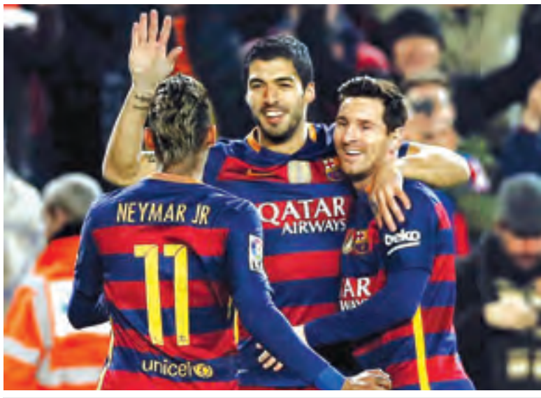
ဘာစီလိုနာတိုက်စစ်အတွဲ မက်ဆီ၊ ဆွာရက်စ်၊ နေမာတို့ အောင်ပွဲခံနေစဉ်။

ဒုတိယပိုင်းတွင် ဘာစီလိုနာအတွက် အနိုင်ဂိုးများကို ၅၉ မိနစ်နှင့် ၇၄ မိနစ်တွင် မက်ဆီက သွင်းယူခဲ့ပြီး ၈၃ မိနစ်နှင့် ၈၈ မိနစ်တွင် ဆွာရက်စ်က သွင်းယူခဲ့သည်။ ယင်းပွဲတွင် တိုက်စစ်မှူးနှစ်ဦး၏ သွင်းဂိုးများဖြင့် နူးကန်ကွင်း၌ ဂိုးမိုးများရွာခဲ့သည်။ ဆီမီးပိုင်နယ် ဒုတိယအကျော့ပွဲစဉ်ကို ဖေဖော်ဝါရီ ၁၀ ရက်တွင် ယှဉ်ပြိုင်ကစားမည်ဖြစ်ပြီး ဗီလီယာလီယိုတွင် ဆီဗီလာနှင့် ဆယ်လ်တာဗီဂိုအသင်းမှ အနိုင်ရသည့်အသင်းနှင့် တွေ့ဆုံမည်ဖြစ်သည်။