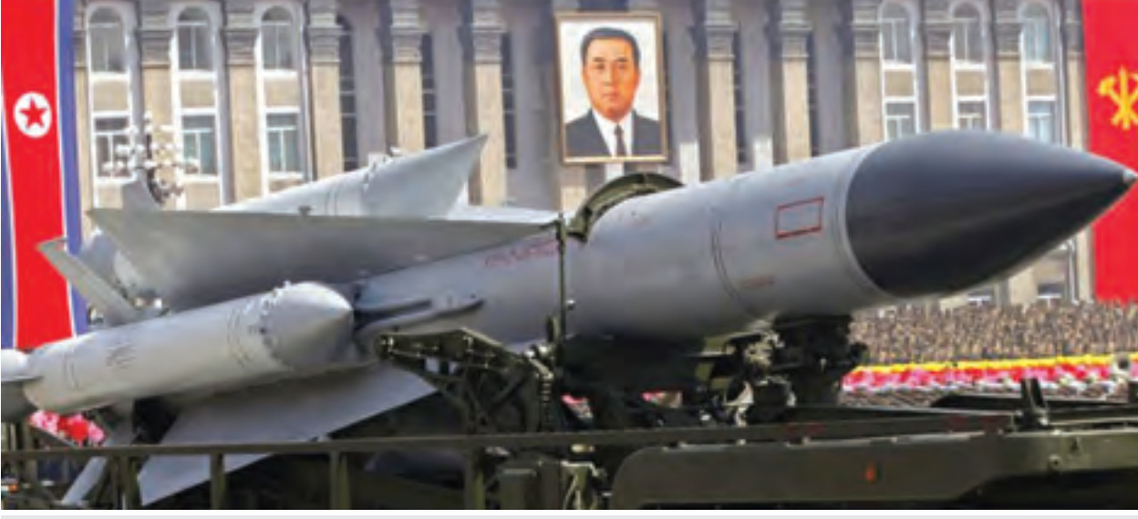
၂၀၁၄ ခုနှစ်က မြောက်ကိုရီးယားကမ်းရိုးတန်းမှ ဂျပန်နိုင်ငံကို ကျော်လွန်ပစ်လွှတ်ခဲ့သည့် ခုံးပုံအမျိုးအစားကို တွေ့ရစဉ်။

တိုက်ချင်းပစ်ခံပစ် ဝယ်ဆောင်လာသော မိုဘိုင်းခုံးပစ်စင်ကို မြောက်ကိုရီးယား အရှေ့ဘက် ကမ်းရိုးတန်းအနီး ရွှေ့ပြောင်းလျက်ရှိသည်ကို တွေ့ရကြောင်း၊ အနောက်ဘက်ကမ်းရိုးတန်း၌ လည်းတားဝေးပစ်ခံပစ်စင်ကို တွေ့ရကြောင်း ဂျပန် ပြည်သူ့ရုပ်သံအင်န်အိတ်ချီကေက ကြာသပတေး နေ့တွင် သတင်းထုတ်ပြန်သည်။ မြောက်ကိုရီးယားအနေဖြင့် စီစဉ်ထားသော ခုံးပုံပစ်လွှတ်မှုကိုရပ်ဆိုင်းရန် နိုင်ငံတကာက မိအားပေးနေချိန် အခြားဒိုးကျည်စမ်းသပ်မှုတစ်ရပ် ပြုလုပ်ခဲ့သည်။ ပြုယမ်းက ကုလသမဂ္ဂအေဂျင်စီ များသို့ ယခုသီတင်းပတ်အတွင်း ကမ္ဘာမြေလေ့လာ ရေးပြုဟ်တူလွှတ်တင်ရန် ပြောကြားပြီးကတည်းက စမ်းသပ်မှုများ ပြုလုပ်လျက်ရှိသည်။ ဂျပန်နိုင်ငံက ၎င်း၏ပိုင်နက်နယ်မြေအတွင်း ခြိမ်းခြောက်မှုရှိသော မည်သည့်ဒိုးကျည်မျှ ကျရောက်ခြင်းမရှိစေရန် ၎င်း၏တပ်ဖွဲ့များအား သတိပေးတပ်လှန့်မှုများ ပြုလုပ်လျက်ရှိသည်။ အဆိုပါရွှေ့ပြောင်းနိုင်သော ခုံးပစ်စင် သည် မြေအောက်ကဲ့သို့ အဆောက်အအုံနေရာ များတွင်ထားရှိနိုင်ကြောင်း အင်န်အိတ်ချီကေ သတင်းတွင် ဖော်ပြသည်။ မြောက်ကိုရီးယားက ၂၀၁၄ ခုနှစ် မတ်လတွင် ယင်းခုံးပစ်စင်ဖြင့် အရှေ့ဘက်ဂျပန်ကမ်းရိုးတန်းဆီသို့ ခုံးကျည် နှစ်စင်းပစ်ခတ်ခဲ့သည်။ (ရိုက်တာ)