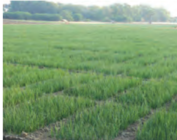
မိတ္ထီလာမြို့နယ် မင်းရွာကျေးရွာမှ ကြက်သွန်နီစိုက်ခင်းများ။