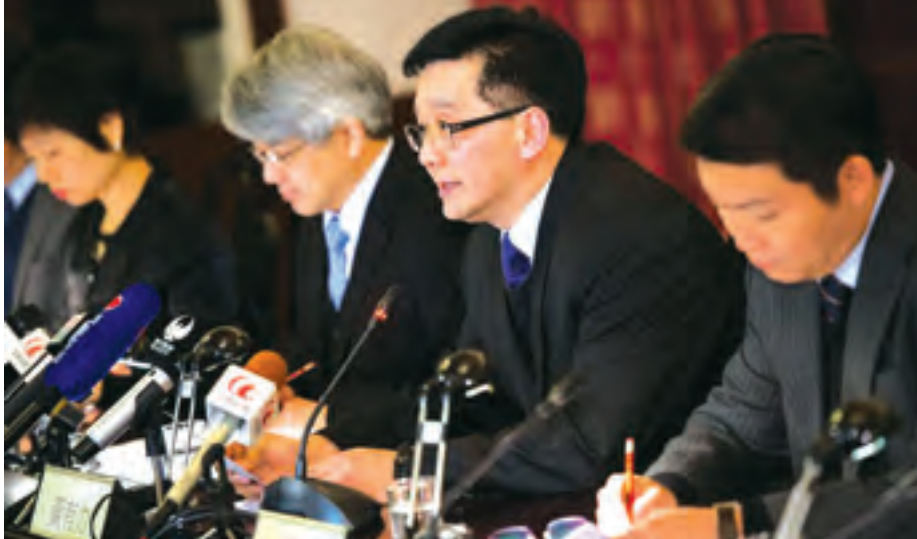
မကာအို၌ H7ပိုင်းရပ်စစ်တွေ့ရှိမှုနှင့် ပတ်သက်၍ တာဝန်ရှိသူများ သတင်းစာရှင်းလင်းပွဲ ပြုလုပ်နေစဉ်။

မကာအို ဖေဖော်ဝါရီ ၄ - မကာအိုရှိ လဟာပြင်ဈေးတွင် ရောင်းချသည့် မွေးမြူရေးကြက်များတွင် ကြက်၊ ငှက်တုပ်ကွေးပိုင်းရပ် (H7) တွေ့ရှိရကြောင်း မကာအိုမြို့တော် မြန်မာစီပယ်ရေးရာဇဝါဒီအဖွဲ့ချုပ် (IACM)နှင့် ကျန်းမာရေးဗျူရိုယို (SSM) က ဗုဒ္ဓဟူးနေ့တွင် ပြောကြားခဲ့သည်။ ကွမ်တုံပြည်နယ်ရှိ ကြက်ကောင်ရေ ၁၅၀၀၀ တို့တွင် ပိုင်းရပ်စစ်တွေ့ရှိ ကြောင်း အာဏာပိုင်များက အတည်ပြုခဲ့ပြီး လက်ကားရောင်းချသည့် ကြက်မွေးမြူရေးခြံများမှ ကြက်ငှက်တုပ်ကွေးရှိနေသည့် ကြက်များကို သုတ်သင်ဖယ်ရှားခဲ့ သည်။ ကြက်များမွေးမြူရောင်းချမှုကို သုံးရက်ကြာ ဆိုင်းငံ့ရပ်နားထားစေရန် အစိုးရက ဆုံးဖြတ်လိုက်သည်ဟု IACM က ပြောသည်။ မကာအိုဈေးရှိ မွေးမြူရေးအရောင်းဆိုင်များကို ပိုးသတ်ဆေးဖျန်းရှင်းလင်းရန် ဒေသဆိုင်ရာ အာဏာ ပိုင်များက မှာကြားခဲ့သည်။ သက်ဆိုင်ရာဌာနများအနေဖြင့်လည်း ကြက်၊ ငှက်တုပ်ကွေးပိုင်းရပ်စစ်၏ မူလဇစ်မြစ် ကို အတူတကွရှာဖွေဖော်ထုတ်သွားကြရန် IACM က အကူအညီတောင်းဆိုခဲ့သည်။ မွေးမြူရေးကို ထိတွေ့လုပ်ကိုင်နေရသည့် လုပ်သားများအား ကျန်းမာရေးလေ့လာစစ်ဆေးမှုများ ဆောင်ရွက် လျက်ရှိကြောင်း ကျန်းမာရေးအဖွဲ့က ဆိုသည်။ (ဆင်ယူ)