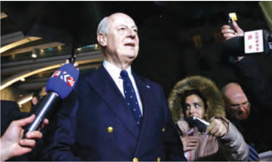
ဆီးရီးယားကိုယ်စားပြုကုလသမဂ္ဂမှ စေ့စပ်ညှိနှိုင်းရေးပုဂ္ဂိုလ်စတင်ဖန်ဒီမစ်တူရာအား သတင်းစာရှင်းလင်းပွဲ၌ တွေ့ရစဉ်။

ဂျီနီဗာ ဖေဖော်ဝါရီ ၄ - ငြိမ်းချမ်းရေးဆွေးနွေးပွဲကို ဗုဒ္ဓဟူး တူရကီမှ အလက်ပိုမြို့ရှိသပူန့် သူပုန်ထိန်းချုပ်ရာ အလက်ပိုမြို့ နေ့တွင် ကုလသမဂ္ဂသံတမန်က များကို အဓိကထောက်ပံ့ပေးရာ မြောက်ပိုင်းကို ရုရှားက လေကြောင်းမှ ၎င်း၏ကြိုးပမ်းမှုများကို ဆိုင်းငံ့ထား လမ်းကြောင်းကို ရုရှား၏လေကြောင်း တိုးမြှင့်တိုက်ခိုက်နေ၍ ဆီးရီးယား လိုက်သည်။