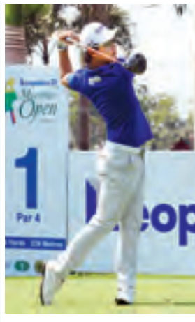
ငါးချက် လျှော့ရိုက်ထားသည့် ယောင်ဟန်ဆောင် (တောင်ကိုရီးယား) ယှဉ်ပြိုင်နေစဉ်။

နိုင်ငံသား ဂျော်ဒန်စပိဒ်ကို အနိုင်ရခဲ့သည့် ယောင်ဟန်ဆောင် (တောင်ကိုရီးယား) ထိုင်း