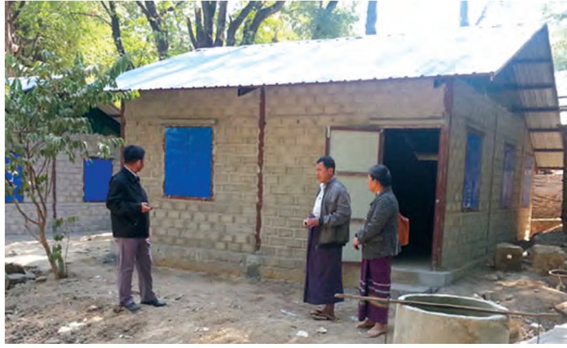
တည်ဆောက်ပြီးစီးတော့မည်ဖြစ်သော ကျေးလက်အိမ်ရာတစ်လုံး။