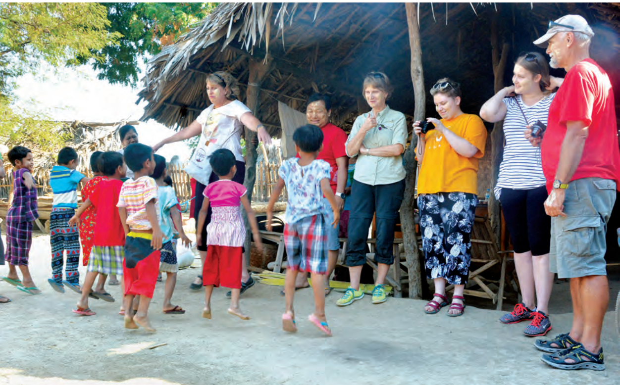
ကမ္ဘာလှည့်ခရီးသွားများ မြိုင်မြို့နယ် ကန်ကြီးတောအနောက်ရွာ၌ ဒေသခံကလေးငယ်များနှင့်အတူ ပျော်ရွှင်နေသည်ကို တွေ့ရစဉ်။

ကျွန်မအတွက်တော့ ဖော်ရွေတဲ့ နိုင်ငံ၊ ကြင်နာတတ်တဲ့ လူမျိုးတွေရှိတဲ့ နိုင်ငံ၊ ကမ္ဘာလှည့်ခရီးသွားတွေတွေ့တိုင်း ပြုံးပြန့်တက်ကျင်ရိုင်းပင်းတတ်တဲ့ ဓလေ့ရှိတဲ့ နိုင်ငံဖြစ်တာကြောင့် ဒီခရီးစဉ်ကို အမြဲသတိရနေမှာပါ။ ကျွန်မတို့ နိုင်ငံပြန်ရောက်ရင်လည်း မြန်မာဆိုတာ ဒီလိုနိုင်ငံ၊ မြန်မာလူမျိုးဆိုတာလည်း ကြင်နာတတ်ပြီး ချစ်ခင်ရင်းနှီးဖို့ကောင်းတဲ့ လူတွေလို့ ပြန်ပြောပြမယ်။