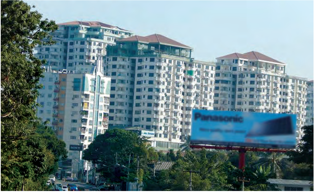
ရန်ကုန်မြို့၊ ကမ္ဘာအေးဘုရားလမ်းမပေါ်ရှိ ကွန်ဒိုတိုက်ခန်းများ။

တန်ဖိုးနည်းအိမ်ရာစီမံကိန်းများကို ရေရှည်စီမံကိန်းအနေဖြင့် အကောင်အထည်ဖော် ဆောင်ရွက်သင့်ပြီး ကြည့်မြင်တိုင်တစ်ဖက်ကမ်း တွဲတေး၊ သန်လျင်နှင့် မှော်ဘီမြို့နယ်များ၌ မြို့သစ်စီမံကိန်းများ အကောင်အထည်ဖော်ဆောင်ရွက်ခြင်းဖြင့် မြေယာရှားပါးမှု ပြဿနာများကို ပြေရှင်းပေးနိုင်ကာ မြေဈေးနှုန်းမြင့်တက်မှုများကို လျော့ကျစေနိုင်ကြောင်းလည်း ၎င်းက အကြံပြုပြောကြားခဲ့သည်။