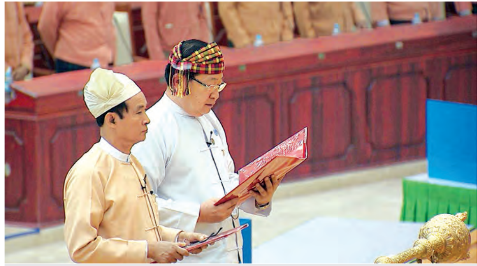
ပြည်သူ့လွှတ်တော် ဥက္ကဋ္ဌနှင့် ဒုတိယဥက္ကဋ္ဌတို့ သဘာပတိရွေးမှောက်၌ ကတိသစ္စာပြုကြစဉ်။ (သတင်းစဉ်)

ကိုယ်စားလှယ်များက သဘာပတိ၏ ရွေးမှောက်၌ ကတိသစ္စာပြုကြပြီး ကတိသစ္စာပြုလွှာပေါ်တွင် လက်မှတ်ရေးထိုးကြသည်။