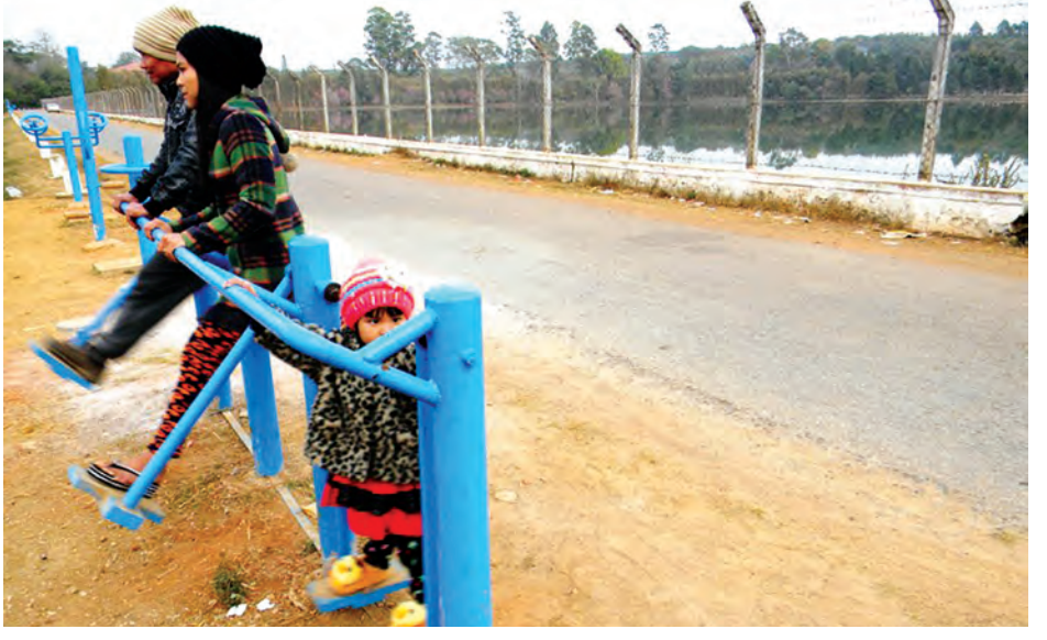
သက်နိုင်(ပြင်ဦးလွင်)

ပြင်ဦးလွင်မြို့မှ ဒေသခံပြည်သူများအနေဖြင့် ယခုဆောင်းရာသီကာလ နံနက်ပိုင်းအချိန်များတွင် မြို့ပတ်လမ်းတစ်လျှောက်နှင့် ကန်တော်ကြီး၊ ကန်တော်လေး စသည့်နေရာများသို့ သွားရောက်၍ လမ်းလျှောက်ခြင်းနှင့် ကျန်းမာရေးလေ့ကျင့်ခန်းများ ပြုလုပ်လေ့ရှိကြောင်း သိရသည်။