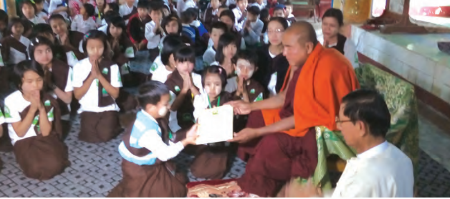
သီပေါ ဖေဖော်ဝါရီ ၁ ၊ ၂၅၀၀ တိုက်သစ်ကျောင်းတိုက် ဓမ္မစကူးဖောင်ဒေးရှင်း ပုဒ္ဒတာသာသင်တန်းကျောင်းဆင်းပွဲကို ရှေးဦးစွာ ခန္တီရာမကျောင်းတိုက် ဇနနဝါရီ ၃၁ ရက်က ရှမ်းပြည်နယ် (မြောက်ပိုင်း)သီပေါမြို့၊ သာသနာ့ ကြံ့မြဲ သာသနာ့ ၂၅၀၀ တိုက်သစ်ကျောင်းတိုက် ပြည်နယ်ဝန်ဆောင် ဘဒ္ဒန္တကောသလအရှင်သူမြတ်က ဓမ္မစကူးဖောင်ဒေးရှင်းနှင့် စပ်လျဉ်း၍ အနုမောဒနာဝမ်းမြောက်ဖွယ်ရာ

များကိုလည်းကောင်း၊ နောင်ချိုမြို့၊ ဓမ္မစကူးသင်တန်းကျောင်း ဆရာတော်ဘဒ္ဒန္တပုညသာမိ အရှင်သူမြတ်က နေရာသီပုဒ္ဒတာသာ သည်ကျေးလိမ္မာသင်တန်းဖွင့်လှစ်ရေး ကိစ္စရပ်များကိုလည်းကောင်း မိန့်ကြားရှင်းလင်းခဲ့သည်။