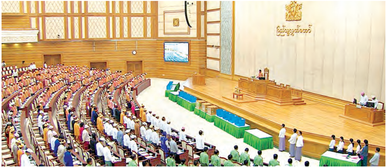
ပြည်သူ့လွှတ်တော်ကိုယ်စားလှယ်များ သဘာပတိရွေးမှောက်၌ ကတိသစ္စာပြုကြစဉ်။ (သတင်းစဉ်)

ထို့နောက် သဘာပတိ ဒေါ်ခင်ဌေးကြွယ်က ၂၀၁၃ ခုနှစ် ပြည်သူ့လွှတ်တော်ဆိုင်ရာ နည်းဥပဒေ ၁၅ အရ ပြည်သူ့လွှတ်တော်ဥက္ကဋ္ဌ ဦးဝင်းမြင့်အား တာဝန်လွှဲပြောင်း