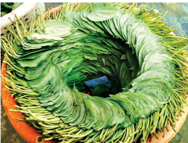
ကွမ်းယာအရောင်းဆိုင်ရှင် အမျိုးသမီး ပြန်လည် ဖြန့်ဖြူးသူများမှာလည်း တစ်ဦးကပြောသည်။ ကွမ်းရွက်များကို တစ်ဆင့် အတွက် ဖောက်သည်မယူကိုင်အောင်

ရေတာရှည် ဖေဖော်ဝါရီ ၁ အေးလွန်းသော ရာသီဥတုကြောင့် ကွမ်းရွက်အထွက်နှုန်း ကျဆင်း၍ နယ်စားကွက်၌ ဈေးနှုန်းမြင့်တက်ကာ ကွမ်းဆိုင်ရောင်းချသူများ ဆိုင်ပိတ်ရသည်အထိ အခက်ကြုံတွေ့ကြရကြောင်း သိရသည်။ “နယ်မြို့တွေက ဟာသာတဘက်ကလာတဲ့ကွမ်းကိုပဲ အဓိကဝယ်သုံးကြတာ။ ဒီရက်ပိုင်း အအေးပိုတာရယ်၊ မိုးရွာသွန်းတာတွေရယ်ကြောင့် ကွမ်းရွက်စိုက်ခင်းတွေ အထွက်တော်တော်လျော့သွားတယ်လို့သိရတယ်။ ကျွန်မတို့တောင် ပုံမှန်ယူနေကျလို့ရတာ။ အချို့ဆိုင်တွေ ဝယ်လို့တောင် မရတော့ဘူး”ဟု ရေတာရှည်မြို့ရှိ