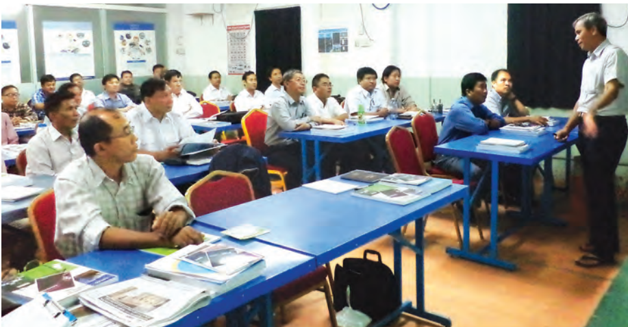
သင်တန်းသားအရာရှိများ သင်တန်းတက်ရောက်နေစဉ်။