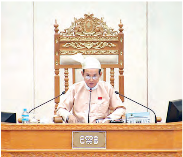
ပြည်သူ့လွှတ်တော်ဥက္ကဋ္ဌ ဦးဝင်းမြင့် နှုတ်ခွန်းဆက်စကားပြောကြားစဉ်။ (သတင်းစဉ်)

ထို့ပြင် တည်ဆဲဥပဒေများ၊ နည်းဥပဒေများ၊ အမိန့်များ၊ ကြေညာချက်များသည် ဒီမိုကရေစီကျင့်စဉ်နှင့်ညီ/မညီ၊ လူ့အခွင့်အရေး စံချိန်စံညွှန်းများနှင့် ကိုက်/မကိုက်၊ အပြည်ပြည်ဆိုင်ရာ သဘောတူညီချက်များနှင့် ဆီလျော်မှု ရှိ/မရှိ၊ နိုင်ငံတကာ စာချုပ်စာတမ်းများနှင့် အကျိုးဝင်/မဝင်၊ ပြည်သူ့လူထုအတွက် အကျိုးရှိ/မရှိ၊ ပြည်သူ့