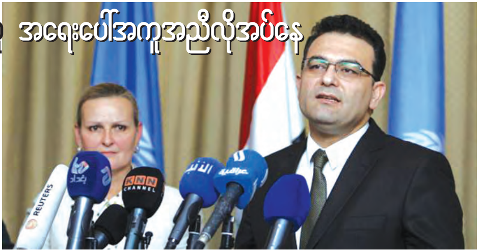
ပြောင်းရွှေ့အခြေချနေထိုင်သူများ နေရာပြန်လည်ချထားရေးဝန်ကြီး ဂျက်ဆင် မိုဟာမက် အယ်လ် ဂျက်စ် (ညာ) သည် အီရတ်နိုင်ငံ ကုလသမဂ္ဂလူသားချင်းစာနာမှုဆိုင်ရာ ညှိနှိုင်းရေးမှူး လိုက်စစ်ဂရန်နှင့်အတူ ဘဝဒက်တွင် ပူးတွဲကြေညာချက်တစ်ခုကို မီဒီယာသို့ ပြောကြားနေစဉ်။