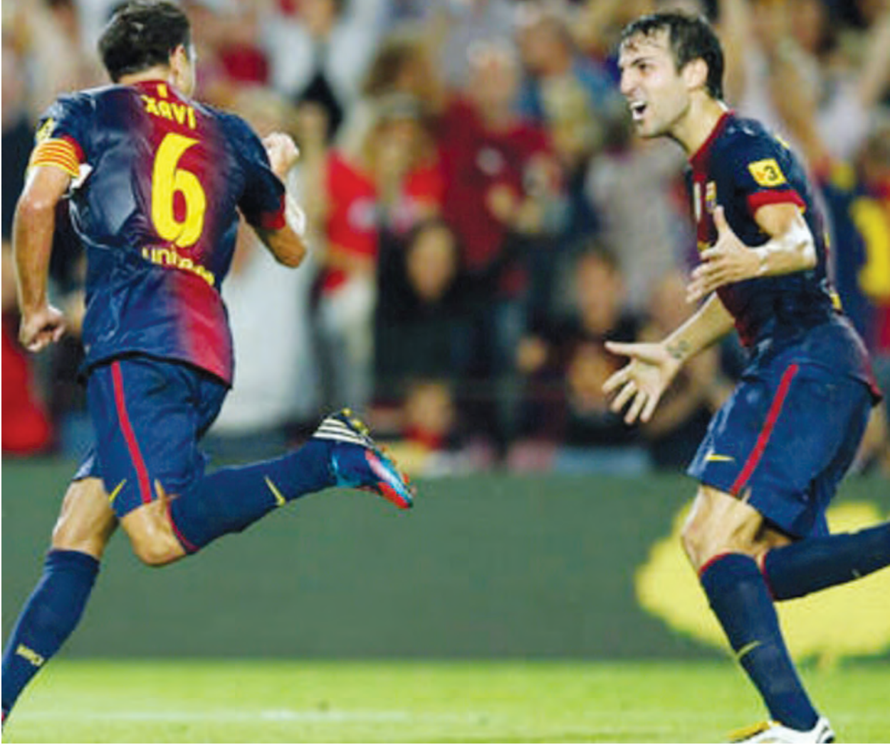
အကျိုးရှိမှာမို့ အနိုင်မခံ၊ အရှုံးမပေးဘဲ ဒီပွဲမှာ အပြန်အလှန်ဖိအားပေးမှုတွေနဲ့ အပြင်းအထန်အားထုတ်ကြမှာပါ။ လီဗန်တေးနဲ့ဆုံတိုင်း ဗယ်လီကာနိုတို့ ရှုံးပွဲမရှိအောင်ကစားနိုင်ခဲ့တာတွေက သတိပြုစရာဖြစ်နေတာမို့ အိမ်ကွင်းဆိုပေမယ့် လီဗန်တေးတို့ သိပ်တော့မလွယ်ပါဘူး။ ဒါ့အပြင် လီဗန်တေးတိုက်စစ်မှူးတွေက ဂိုးသွင်းစွမ်းရည်ကျဆင်းနေတာမို့ အခုပွဲမှာ ဧည့်သည်ဗယ်လီကာနိုတို့ အခက်အခဲကြားက အောင်ပွဲခံသွားဖို့ အခွင့်အရေးရသွားနိုင်ပါတယ်။

ဘာစီလိုနာနှင့် ဂရန်နာဒါ ပွဲတိုင်းတိုက်စစ်စွမ်းရည်မြင့်မားကြောင်း ပြသဖို့ကြိုးစားနေတဲ့ ဘာစီလိုနာ တို့ဟာ အခုပွဲမှာလည်း ဂိုးပြတ်သွင်း အောင်လံလွှင့်ဖို့ အားထုတ်လာဦးမှာ သေချာပါတယ်။ လူစုံပါဝင်ကစားဖို့ရှိနေတဲ့ ဘာစီလိုနာဟာ အိမ်ကွင်းလည်း ဖြစ်နေတာမို့ ဂရန်နာဒါတို့ အသက်ရှူမှားအောင် ခုခံကာကွယ်ရဖို့ရှိနေပါတယ်။ တန်းဆင်းရန်အတွင်း ကျဆင်းနေတဲ့ ဂရန်နာဒါတို့အတွက် အခုပွဲမှာလည်း ဂိုးပြတ်မရှုံးအောင်ကလွဲပြီး ကျန်တဲ့မျှော်လင့်ချက်ထားလို့မရတဲ့ပွဲပါ။ ဘာစီလိုနာတို့အတွက်ကတော့ အိမ်ကွင်းမှာ ဘယ်သူတွေ ဟက်ထရစ်သွင်းမလဲဆိုတာ စောင့်ကြည့်ရမှာဖြစ်ပါတယ်။