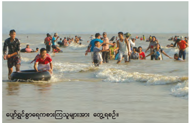
ပျော်ရွှင်စွာရေကစားကြသူများအား တွေ့ရစဉ်။

ထို့ကြောင့် စက်စဲကမ်းခြေ ရေရှည်တည်တံ့ရေးနှင့် ပိုမိုစည်ကားရေးအတွက် ရှိနှင့်ပြီးသားသဘာဝ အလှတရားများ ပျက်စီးခြင်းမှ ကာကွယ်စောင့်ရှောက်ရေးမှာ ကမ်းခြေတွင် စီးပွားရှာကြသူများနှင့် အပန်းဖြေကြသူများ အားလုံး၏ တာဝန်ပင်ဖြစ်ပြီး ပိုင်းဝန်းစောင့်ရှောက် ထိန်းသိမ်းသင့်ပြီးဖြစ်ပါကြောင်း တင်ပြလိုက်ရပါသည်။ ။