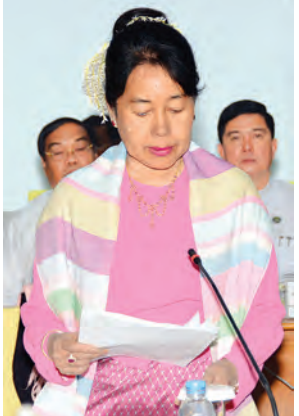
ပြည်ထောင်စုဝန်ကြီး ဒေါက်တာ ဒေါ်မြတ်မြတ်အုန်းခင်

ရေဘေးအန္တရာယ်၏ ကြီးမားစွာ ထိခိုက်နိုင်မှုနယ်ပယ်ကို မခန့်မှန်းနိုင် ခြင်းနှင့် ကြိုတင်သတိပေးစနစ် အား