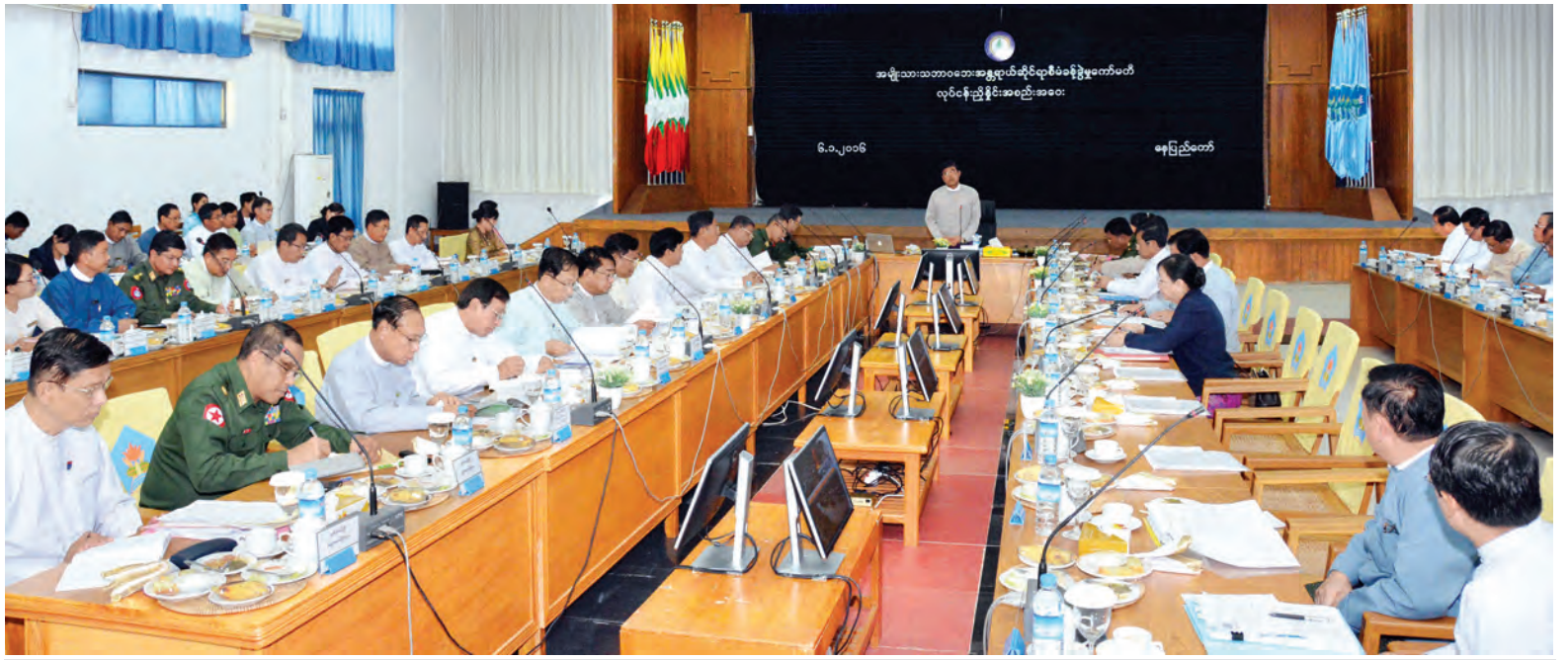
ဒုတိယသမ္မတ ဦးညွှန်ထွန်း အမျိုးသားသဘာဝဘေးအန္တရာယ်ဆိုင်ရာ စီမံခန့်ခွဲမှုကော်မတီ လုပ်ငန်းညှိနှိုင်းအစည်းအဝေးတွင် အမှာစကားပြောကြားစဉ်။ (သတင်းစဉ်)

မြန်မာနိုင်ငံတစ်ဝန်း မြစ်ကြီး များနှင့် မြစ်လက်တက်များတွင် မြစ်အောက်ကြမ်းပြင်များ တိမ်ကော လာခြင်း၊ မြစ်ကြောင်းပြောင်းလဲခြင်း နှင့် ကမ်းပါးပြိုမှုများ အလွယ်တကူ ဖြစ်ပေါ်လာခြင်းတို့ကြောင့် မိုးများ သည် မုတ်သုံကာလတွင် မြစ်ဝှမ်း ဒေသများနှင့် ကမ်းရိုးတန်းဒေသ များတွင် ရေလွှမ်းမိုးမှုအား ကာကွယ်