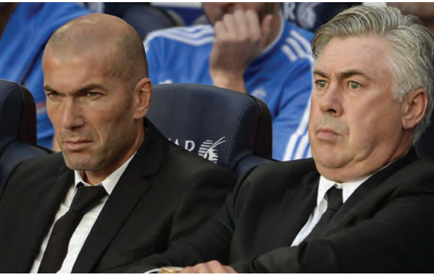
ကောင်းမြတ်သူ ➤ စုစည်းသည်

ပြင်သစ်အသင်းနဲ့အတူ ကမ္ဘာ့ဖလားဆွတ်ခူးနိုင်ခဲ့တဲ့ ပြင်သစ်ဂန္ထဝင်ဘောလုံးသမား ဇီဒန်းဟာ နည်းပြအတွေ့အကြုံအနေနဲ့ ကာစတင်အသင်းနဲ့သာ အတွေ့အကြုံရှိခဲ့ဖူးတယ်လို့ သိရပါတယ်။ အသက် ၄၃ နှစ်အရွယ်သာ ရှိသေးတဲ့ ဇီဒန်းကို ရီးရဲမက်ဒရစ်အသင်းဥက္ကဋ္ဌ ပီယက်စ်က ၂၅ ပွဲကြာ ကိုင်တွယ်ခဲ့တဲ့ ဘင်နီတက်ဇ်နေရာမှာ ခန့်အပ်လိုက်ပြီဖြစ်ကြောင်း တနင်္လာနေ့က အတည်ပြုပြောကြားလိုက်ပါတယ်။ ဒီအသင်းက “ခင်ဗျားအသင်း၊ ခင်ဗျားရဲ့ကွင်း၊ ခင်ဗျားကို အားလုံးကထောက်ခံပါတယ်” လို့ အသင်းဥက္ကဋ္ဌ ပီယက်စ်က ဆိုပါတယ်။ နည်းပြသစ်ဖြစ်လာတဲ့ ဇီဒန်းက “ရီးရဲမက်ဒရစ်အသင်းကို ကိုင်တွယ်ခွင့်ပေးခဲ့တဲ့အတွက် အသင်းဥက္ကဋ္ဌကိုရော အသင်းတာဝန်ရှိသူတွေကိုပါ ကျေးဇူးတင်ပါတယ်။ ကျွန်တော့်အနေနဲ့ စပိန်လာလီဂါဖလားကို ဒီနှစ်ထဲမှာပဲ အရယူဖို့ ဆုံးဖြတ်လိုက်ပါပြီ” လို့ ဆိုပါတယ်။ “ရီးရဲမက်ဒရစ်အသင်းဟာ ကမ္ဘာ့ပရိသတ်ထောက်ခံအားပေးမှု အများဆုံးအသင်းဖြစ်သလို အကောင်းဆုံးအသင်းလည်းဖြစ်တဲ့အတွက် ဖလားရအောင်ယူသွားဖို့ ဆုံးဖြတ်ထားတာပါ” လို့ ဇီဒန်းကဆိုပါတယ်။