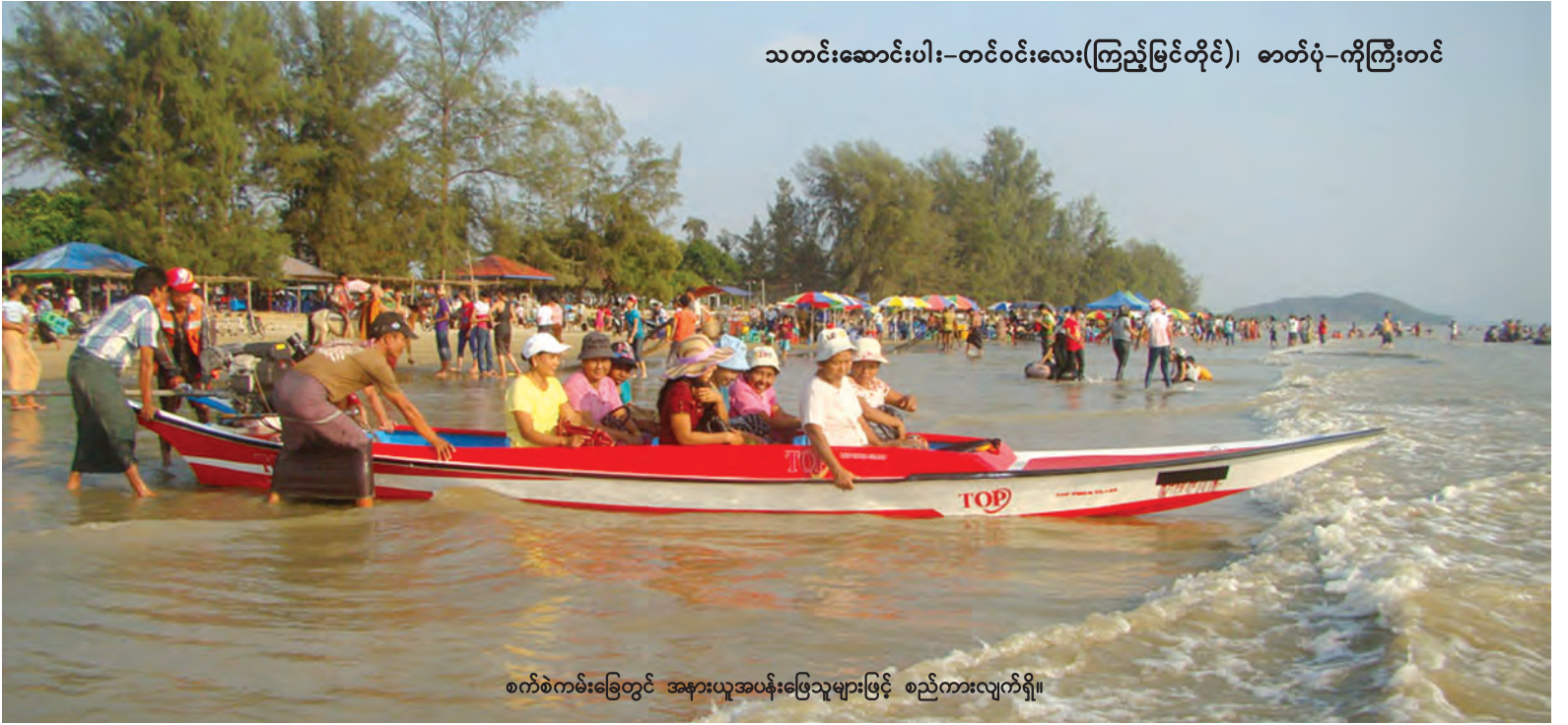
သတင်းဆောင်းပါး-တင်ဝင်းလေး(ကြည့်မြင်တိုင်)

လူငယ်များ၏ ပျော်ရွှင်စွာ အော်ဟစ်သံများကို ပင်လယ်ရေစပ်တွင် အဆက်မပြတ်ကြားရသကဲ့သို့ အဆက်မပြတ် မြင့်တက်ကာ ကမ်းသို့ တစ်ဝှမ်းစွာ ရိုက်ခတ်လာသည့် လှိုင်းလုံးများကြောင့်လည်း ကမ်းခြေသည် အလွန်ပျော်ရွှင်ဖွယ်မြင်ကွင်းများဖြစ်နေသည်။ စက်စဲကမ်းခြေရှိ လှိုင်းလုံးများသည် လာရောက်အပန်းဖြေသူများကို စိတ်ရောကိုယ်ပါ လွတ်လပ်ပေါ့ပါးစေပြီး တစ်ခါတစ်ရံတွင် လူပါလွင့်ပါမတတ် အင်အားကောင်းလှသည်ကိုလည်း မြင်တွေ့ရသည်။ မျက်စိတစ်ဆုံး မြင်တွေ့ရသည်