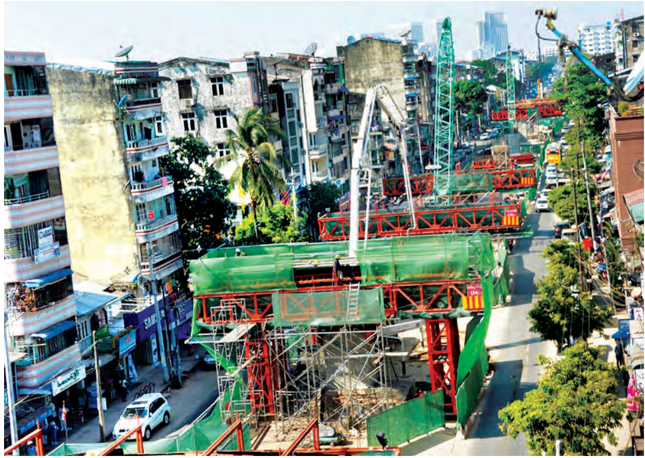
ဆောက်လုပ်ဆဲ တာမွေလမ်းဆုံ ဝိုင်ပုံသဏ္ဍာန် ခုံးကျော်တံတားလုပ်ငန်းခွင်ကို တွေ့ရစဉ်။

တာမွေလမ်းဆုံ ဝိုင်ပုံသဏ္ဍာန်ခုံးကျော်တံတားသည် တိုင်းဒေသကြီးတာမွေမြို့နယ် ဗညားဒလလမ်း၊ ဦးချစ်မောင်လမ်းနှင့် အရှေ့မြင်းပြိုင်ကွင်းလမ်း ငါးခွဆုံကို ဝိုင်ပုံသဏ္ဍာန်တည်ဆောက်သွားမည်ဖြစ်ပြီး ရန်ကုန်မြို့တွင်း တည်ဆောက်ပြီး ခုံးကျော်တံတားများနှင့် တည်ဆောက်ဆဲ ခုံးကျော်တံတားများအထဲတွင် အရှည်ဆုံးဖြစ်ပေါ်လာမည့် ခုံးကျော်တံတားကြီးဖြစ်သည်။ တံတားပုံသဏ္ဍာန်မှာ ဝိုင်ပုံသဏ္ဍာန်ဖြစ်ပြီး ဗညားဒလလမ်းနှင့် ဦးချစ်မောင်လမ်းဘက်ခြမ်း တံတားအရှည်သည် ၂၈၅၅ ဒဿမ ၀၇ ပေရှိပြီး နှစ်လမ်းမောင်း လေးလမ်းသွားဖြစ်ကာ အရှေ့မြင်းပြိုင်ကွင်းလမ်းဘက်သို့ခွဲထွက်သွားသော လက်တက်ပွားနှစ်လမ်းမောင်း တစ်လမ်းသွားအဖြစ်အသုံးပြုမည့် ခုံးကျော်တံတားသည် အရှည် ၁၉၇၁ ဒဿမ ၅၂ ပေ ရှည်မည်ဖြစ်သည်။ တံတားအမျိုးအစားမှာ သံကူကွန်ကရစ်လွန်တူးဘိုးပိုင်ဖြစ်ပြီး တံတားအပေါ်ထည်ကို သံမဏိရက်မနှင့် သံကူကွန်ကရစ် ကြမ်းခင်းလက်ရန်းများ တပ်ဆင်တည်ဆောက်လျက်ရှိသည်။ တံတား အကျယ်မှာ ဗညားဒလလမ်း-