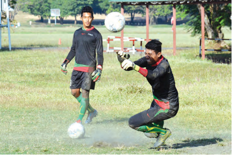
ဇေယျာရွှေမြေအသင်း လေ့ကျင့်မှုများပြုလုပ်နေစဉ်။

ရန်ကုန် ဇန်နဝါရီ ၆ ပရိုလိဂ်ပြိုင်ပွဲ စတင်ချိန်က အသင်းကြီးတစ်သင်းအဖြစ် ရပ်တည်နိုင်ခဲ့သည့် ဇေယျာရွှေမြေအသင်းမှာ ယခုနောက်ပိုင်းနှစ်များတွင် အောင်မြင်မှုဝေးကွာလာသောကြောင့် အသင်းကြီးတစ်သင်းပြန်ဖြစ်ပြီး အောင်မြင်မှုများရယူနိုင်ရန် ကြိုးပမ်းလျက်ရှိသည်။