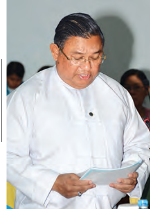
ပြည်ထောင်စုဝန်ကြီး ဦးဝဏ္ဏမောင်လွင်

ပြုစုပြီး ပြန်လည်ထူထောင်ရေး မဟာဗျူဟာချမှတ်၍ စနစ်တကျ ဆောင်ရွက်လျက် ရှိပါကြောင်း၊ ပြည်ထောင်စုဘဏ္ဍာ ရန်ပုံငွေ၊ ပြည်တွင်းပြည်ပမှ ထောက်ပံ့ငွေ၊ လျှော့ဒါနိုးငွေများဖြင့် ထူထောင်ထား