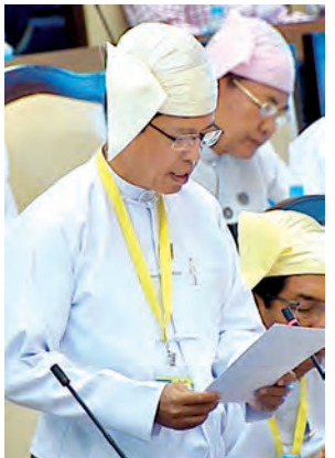
ဒုတိယဝန်ကြီး ဦးဇော်ယော်ဖြေကြားစဉ်။

ကြားသည်။ ချင်းပြည်နယ် မဲဆန္ဒနယ်အမှတ် (၁)မှ ဦးကျွန်းခဲ၏ ချင်းပြည်နယ်၌ ၂၀၁၅ ခုနှစ် ဇူလိုင်လတွင် မိုးအဆက်မပြတ် ရွာသွန်းမှုကြောင့် မြေပြိုမှုနှင့် ကြုံတွေ့နေရသော အိမ်ထောင်စုများအတွက် ဖလမ်းမြို့နယ် ဝေဘူလအုပ်စု