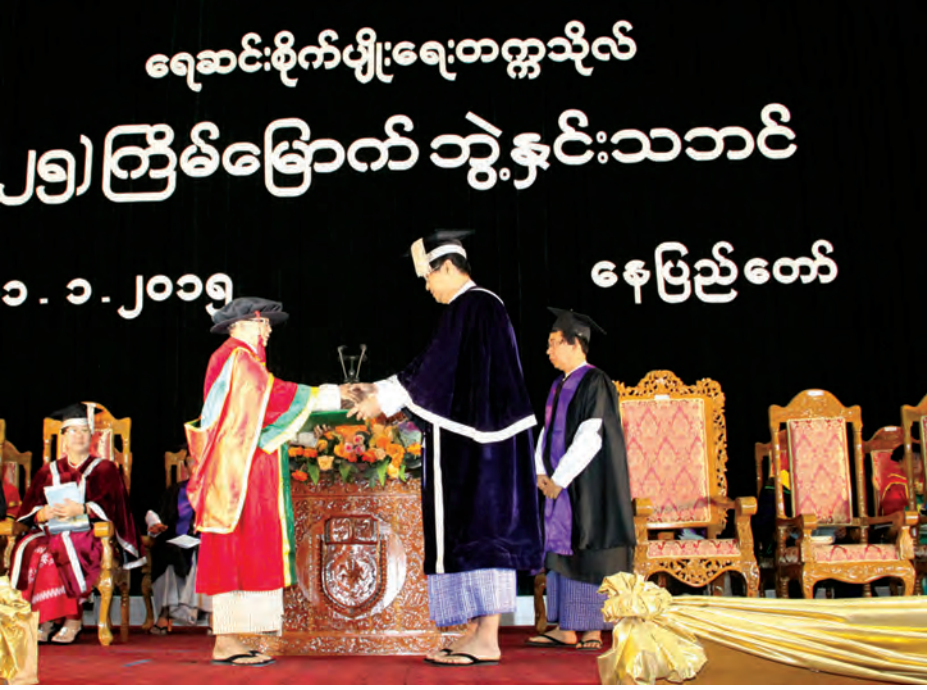
ဇယား (၁) အာဆီယံနိုင်ငံများအကြား စိုက်ပျိုးရေးတက္ကသိုလ် စိုက်ပျိုးမွေးမြူရေး တက္ကသိုလ် ကျောင်းသား/ သူများ နှိုင်းယှဉ်ချက်

ပြည်ထောင်စုသမ္မတမြန်မာနိုင်ငံတော်သည် စိုက်ပျိုးရေးအဓိကနိုင်ငံဖြစ်ပြီး လယ်ယာကဏ္ဍသည် တစ်မျိုးသားလုံး ပြည်တွင်း အသားတင်ထုတ်လုပ်မှုတန်ဖိုး(GDP) ၂၂.၁% (၂၀၁၄-၂၀၁၅) စုစုပေါင်း ဝိသေသတန်ဖိုး၏ ၂၀% နှင့် နိုင်ငံ၏ အလုပ်လုပ်သူဦးရေ ၆၁.၂% ကျော် ပါဝင်ဆောင်ရွက်လျက်ရှိပါသည်။ (Source : MOAI 2015, Myanmar Agriculture in Brief) ထိုသို့ ထုတ်လုပ်ရာတွင် ကျွမ်းကျင်သောနည်းပညာရှင်များ၊ စိုက်ပျိုးရေးသိပ္ပံပညာရှင်များကို လူ့စွမ်းအားအရင်းအမြစ် ဖွံ့ဖြိုးတိုးတက်ရေး (Human Resource Development) သည် ကျွန်တော်တို့နိုင်ငံအတွက် အရေးပါလာသလို စီမံကိန်းနှင့်အညီ ကျွမ်းကျင်ပညာရှင်များနှင့်စဉ်မွေးထုတ်ပေးရန် စဉ်းစားလာရပါမည်။ ရေဆင်းစိုက်ပျိုးရေးတက္ကသိုလ်သည် မြန်မာနိုင်ငံအတွက်စိုက်ပျိုးရေးဘွဲ့ရပညာရှင်များ မွေးထုတ်ပေးရာ တစ်ခုတည်းသောတက္ကသိုလ်ဖြစ်ပါသည်။ နှစ်စဉ် စိုက်ပျိုးရေးဘွဲ့ ၄၀၀ ခန့်၊ မဟာစိုက်ပျိုးရေးပညာနှင့် ပါရဂူဘွဲ့ ၂၀ မှ ၃၀ ခန့် မွေးထုတ်ပေးနေပါသည်။ ၂၀၀၇-၂၀၀၈ ပညာသင်နှစ်မှ စတင်၍ စိုက်ပျိုးရေးတက္ကသိုလ် အခြေခံပညာအထက်တန်းအောင်ပြီး၍ ပထမနှစ်သို့ တက်ရောက်လိုသူ လျှောက်လွှာပေါင်းမှာ တစ်နှစ်ထက်တစ်နှစ် မြင့်တက်လျှောက်ထားလာသည်မှာ ၁၂၀၀ မှ ၂၀၀၀ ခန့်အထိရောက်ရှိလာပါပြီ။ ရေဆင်းစိုက်ပျိုးရေးတက္ကသိုလ်အနေဖြင့် အများဆုံးလက်ခံနိုင်သော ဦးရေမှာ ၅၀၀ ခန့်အထိသာရှိပြီးစိုက်ပျိုးရေးကျောင်းသား ကျောင်းသူများ တိုးချဲ့လက်ခံသင်ကြားပေးနိုင်ရေးမှာ အနာဂတ်၏ စိန်ခေါ်မှုတစ်ရပ် (Future Challenge) ဖြစ်လာပါပြီ။