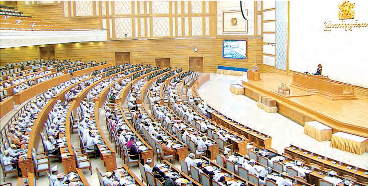
အမည်စာရင်း တင်သွင်းနိုင်ကြောင်း ကြေညာသည်။ ထို့နောက် ပြည်ထောင်စုအစိုးရအဖွဲ့မှပေးပို့သော အမျိုးသားဘက်စုံ

ယင်းနောက် ပြည်ထောင်စုလွှတ်တော်နာယက က အဆိုပါဥပဒေကြမ်း၏ မှုနှင့် အခြေခံသဘော အပါအဝင် စီမံကိန်းလုပ်ငန်းများနှင့် စပ်လျဉ်း၍ ဆွေးနွေးလိုသည့် လွှတ်တော် ကိုယ်စားလှယ်ရှိပါက