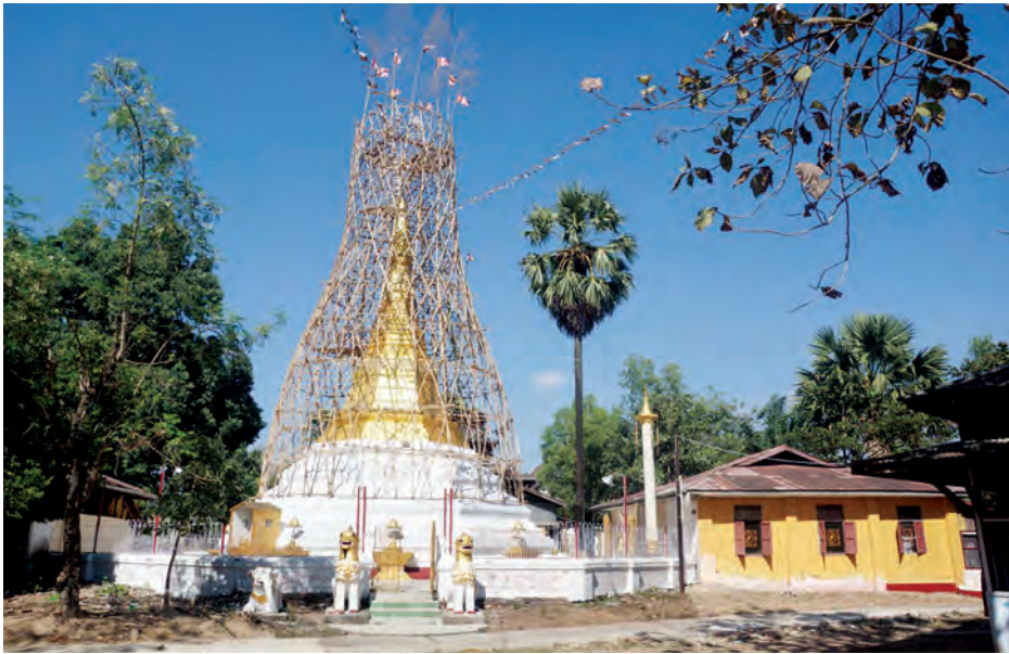
ရွှေထီးတော်၊ စိန်ဖူးတော်၊ ငှက်မြတ်နားတော်တို့အား ဇန်နဝါရီ ၁၀ ရက်၌ သန်လျင်မြို့တွင် လှည့်လည်

ရန်ကုန် ဇန်နဝါရီ ၆ ရန်ကုန် တောင်ပိုင်းခရိုင် သန်လျင်မြို့၊ ဗိုလ်ချုပ်ကျေးရွာ မြောက်ကျောင်းတိုက်အတွင်းရှိ ရှေးဟောင်းသမိုင်းဝင် ကျိုက်မောဂူလိ မိုးကောင်းစေတီမြတ်ကြီး ရွှေထီးတော်၊ စိန်ဖူးတော်၊ ငှက်မြတ်နားတော် ပြန်လည်ပြုပြင် တင်လှူပူဇော်မည် ဖြစ်ကြောင်း သိရသည်။ (ယာပုံ)