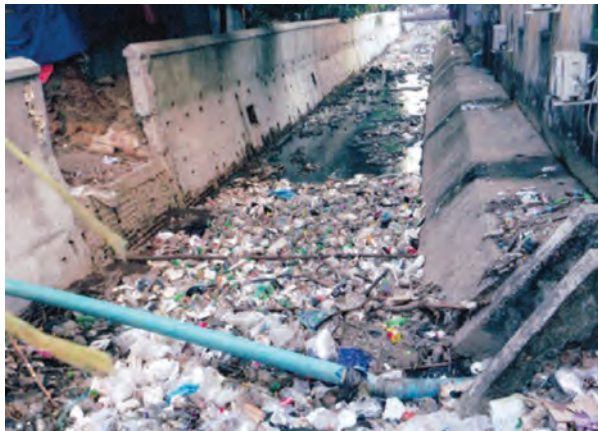
လိုက်လံပြုပြင်လျက်ရှိသည်ကို နေ့စဉ်မြင်တွေ့နေရသည်။ အများပြည်သူမြင်ကင်းကဲ့သို့ပင် ကျုံးကြီးမြောင်းအတွင်း စွန့်ပစ်ပစ္စည်းများကိုလည်း သယ်ယူရှင်းလင်းပေးရန် မြို့နေပြည်သူများက မျှော်လင့်လျက်ရှိကြောင်း သိရသည်။ ခင်ဆိုင်

ရန်ကုန်မြို့လမ်းမတော်နှင့် အလုံမြို့နယ်အကြားရှိ ရွာသစ်ချောင်းအတွင်းသို့ စီးဝင်သော ကျုံးကြီးမြောင်းကြီး၏ လမ်းသစ်လမ်းပြတ်နားပေါက်အဝင် တစ်လျှောက်တွင် စွန့်ပစ်ပစ္စည်းများစွာဖြင့် ရေပြင်ပေါ်တွင် ပေါလောပေါ် ပြည့်ကျပ်နေကာ ရေစီးဆင်းမှုကို ပိတ်ဆို့နေကြောင်း ကျုံးကြီးမြောင်းဘေးစပ်တိုက်ခန်းတွင် နေထိုင်သူ အငြိမ်းစား နိုင်ငံ့ဝန်ထမ်းတစ်ဦးက ပြောသည်။ ရန်ကုန်မြို့တွင်း ရေကြီးရေလျှံမှုလျော့နည်းရန် ရွာသစ်ချောင်းတွင် ရေထိန်းတံခါးတပ်ဆင်ခြင်း၊ ကွင်းချောင်း၊ ဟာဘီချောင်း၊ ရွာသစ်ချောင်းမြေထိန်းအုတ်နံရံများကို မြေပြင်အထက် ရောက်သည်အထိ အသစ်ပြုလုပ်ပေးခြင်းများ ရှိခဲ့သည်။