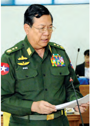
ပြည်ထောင်စုဝန်ကြီး ဒုတိယဗိုလ်ချုပ်ကြီး ကိုကို

လည်း ရေလွှမ်းမိုးမှုနှင့် ဒီရေမန်တိုင်း အန္တရာယ်တို့မှ ကာကွယ်နိုင်ရန် ရေလွှမ်းမိုးမှုကာကွယ်ရေး စီမံ ကိန်းကြီးများ တည်ဆောက်ခြင်း၊ ရေသဘာဝ ပတ်ဝန်းကျင်အား ကာကွယ်နိုင်သော ဘက်စုံစုစည်းသည့် ကြိုးပမ်းမှုများ ဆောင်ရွက်ခြင်း၊