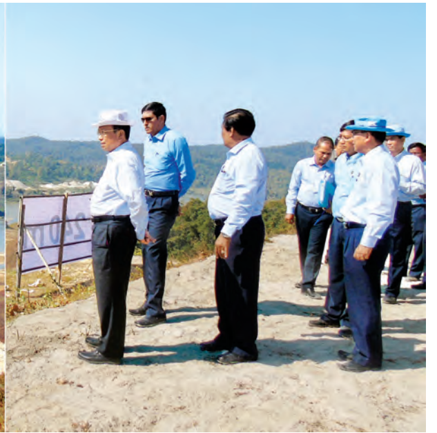
ပြည်ထောင်စုဝန်ကြီး ဦးခင်မောင်စိုးနှင့် တာဝန်ရှိသူများ ရွှေလီအမှတ်(၃) ရေအားလျှပ်စစ်စီမံကိန်း တည်ဆောက်ရေးလုပ်ငန်းခွင်ကို ကြည့်ရှုစစ်ဆေးစဉ်။