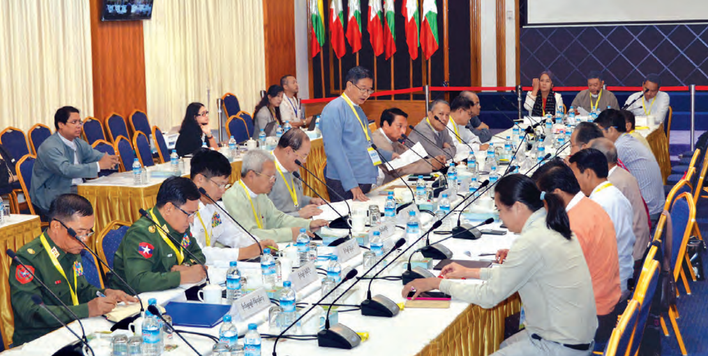
သတင်း-မြတ်သန္တာမောင်

ရန်ကုန် ဇန်နဝါရီ ၅ ပြည်ထောင်စုငြိမ်းချမ်းရေး ညီလာခံကျင်းပရေး အတွက် UPDJC အတွင်းရေးမှူးအဖွဲ့ အစည်းအဝေးကို ယနေ့နံနက် ၉ နာရီခွဲတွင် ရန်ကုန်မြို့၊ ရွှေလီလမ်းရှိ မြန်မာ နိုင်ငံငြိမ်းချမ်းရေးပြန်လည်ထူထောင်ရေးလုပ်ငန်းဗဟို ဌာန (MPC) ၌ စတင်ကျင်းပသည်။ ယနေ့ပြုလုပ်သည့် အစည်းအဝေးတွင် အစိုးရအစု အဖွဲ့၊ ကိုယ်စား ပြည်ထောင်စုဝန်ကြီး ဦးအောင်မင်း၊ တိုင်းရင်းသားလက်နက်ကိုင်အစုအဖွဲ့၊ ကိုယ်စား ပဒို စောကွယ်ထူးဝင်းနှင့် နိုင်ငံရေးပါတီအစုအဖွဲ့၊ ကိုယ်စား ဦးသုဝေတို့က အဖွင့်နှုတ်ခွန်းဆက်စကား ပြောကြားကြ သည်။