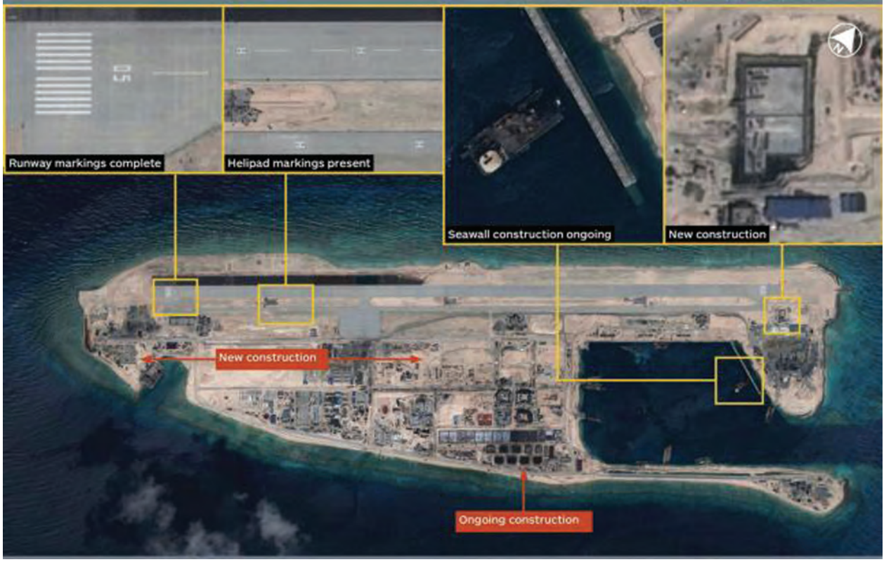
အိုဘားမားအစိုးရအနေဖြင့် တရုတ်လုပ် အဆိုပါကျွန်းတို့မှ ရေပိုင် ၁၂ မိုင်အကွာ နောက်ထပ်လွတ်လပ်စွာ ကင်းလှည့်ရေးမှာ နှေးကွေးနေကြောင်း ဆီးနိတ်အမတ် ဂျွန်မက်ကန်းက ဝေဖန်ပြောဆိုလိုက်သည်။ တရုတ်နိုင်ငံသည် လွန်ခဲ့သော တစ်နှစ်ကျော်က အဆိုပါကျွန်းတို့ပေါ်တွင် လေယာဉ်