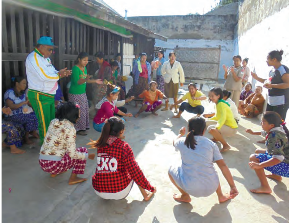
အားကစားပြိုင်ပွဲများ ကျင်းပခြင်း အထိမ်းအမှတ် လက်ဆောင်ပစ္စည်း နှင့်ပတ်သက်၍ ပြောကြားသည်။ ပြိုင်ပွဲများအပြီးတွင် ဝန်ထမ်း မိသားစုများအား လွတ်လပ်ရေးနေ့ မြှင့်ကာ အခမ်းအနားသို့ လာရောက် သူ အားလုံးကို ထမင်းဟင်းများ ကျွေးမွေးညှိခဲ့ကြောင်း သိရသည်။