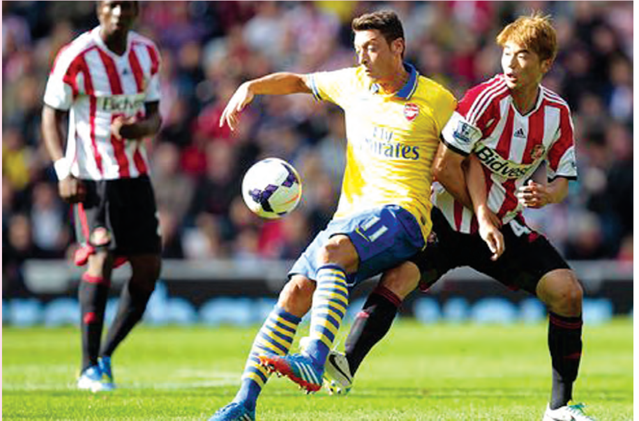
ချန်ပီယံရှစ်မှာ ဘရစ္စတိုးစီးတီးတို့ တန်းဆင်းဖို့အထိ ခြေစွမ်းကျဆင်းနေတာပဲ ဝက်စ်ဘရမ်းဟာ ဒီပွဲကို အနိုင်နဲ့ အဆုံးသတ်ပါလိမ့်မယ်။

ဝက်စ်ဘရမ်းတို့အတွက် ဒီပွဲဟာ အခွင့်အရေးကောင်းတစ်ရပ်အဖြစ် အသုံးပြုနိုင်မလား စောင့်ကြည့်ရမှာဖြစ်ပါတယ်။ ဒီနှစ်သင်းရဲ့ နောက်ဆုံးတွေ့ဆုံခဲ့တဲ့ ပွဲမှာ ဘရစ္စတိုးစီးတီးအသင်းက နှစ်ဂိုး-တစ်ဂိုးနဲ့ နိုင်ခဲ့တာပဲ အဲဒီနှစ်ကြောင့် ဒီပွဲမှာ ဝက်စ်ဘရမ်းတို့ ပြန်ဆပ်ပါလိမ့်မယ်။ လောလောဆယ်မှာတော့