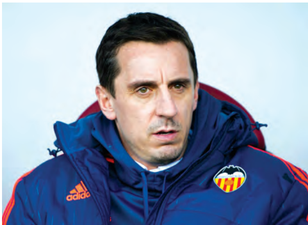
လိုက်ပါတယ်။ မန်ယူ နောက်တန်းကစားသမားဟောင်း ဂယ်ရီနဗီးလ်အနေနဲ့ ဗလင်စီယာအသင်းကို ကိုင်တွယ်မှု လေးပွဲအတွင်းမှာ ရမှတ် သုံးမှတ်သာ စုဆောင်းနိုင်ပါသေးတယ်။

လာမယ့်ရာသီမှာ ဗလင်စီယာနည်းပြအဖြစ် ဆက်လက်ရရှိလိုတယ်လို့ ဂယ်ရီနဗီးလ်က ရိုးရဲမက်ဒရစ်နဲ့ တစ်ဖက် နှစ်ဂိုးစီသရေကျပြီးနောက် ပြောဆိုလိုက်ပါတယ်။ ခြောက်လစာချုပ်နဲ့ ယာယီနည်းပြလုပ်နေတဲ့ ဂယ်ရီနဗီးလ်က ဗလင်စီယာအသင်းကို ဆက်လက်ကိုင်တွယ်သွားဖို့ ဆန္ဒပြင်းပြနေတာပါ။ သူ့အနေနဲ့ စပိန်ထိပ်သီးကလပ် ဗလင်စီယာကို နှစ်ရှည် ကိုင်တွယ်နိုင်တဲ့ နည်းပြဖြစ်လာဖို့ ကြိုးစားနေတာပါ။ ကျွန်တော့်အနေနဲ့ ဗလင်စီယာနည်းပြအဖြစ် ခြောက်လတာဝန် ထမ်းဆောင်ရမှာဖြစ်ပေမယ့် လာမယ့်နှစ်မှာလည်း ဗလင်စီယာနည်းပြအဖြစ် ဆက်လက်ရပ်တည်နိုင်ဖို့ မျှော်လင့်ထားပါတယ်လို့ မန်ယူကစားသမားဟောင်း ဂယ်ရီနဗီးလ်က ပြောဆို