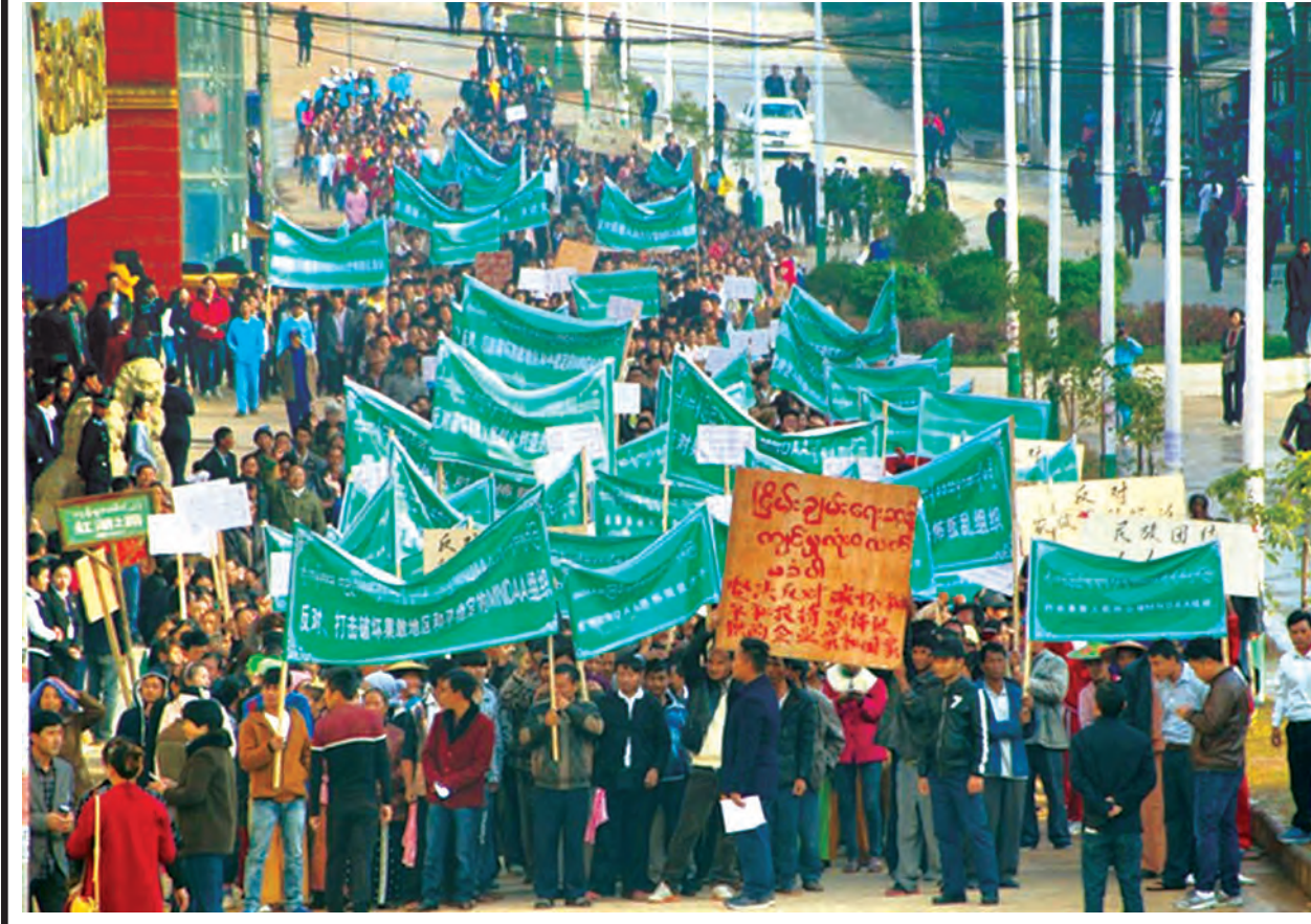
နေပြည်တော် ဇန်နဝါရီ ၅

ရှမ်းပြည်နယ်(မြောက်ပိုင်း) ကိုးကန့်ကိုယ်ပိုင်အုပ်ချုပ်ခွင့်ရဒေသ လောကကိုင်မြို့ ဇန်နဝါရီ ၄ ရက် နံနက် ၉ နာရီက လောကကိုင်မြို့မှ ရပ်မိရပ်ဖများနှင့် ကိုးကန့်လူငယ်အသင်းတို့ ဦးဆောင်၍ MNDAA သောင်းကျန်းသူများကို ရုတ်ချပဲ့အခမ်းအနားပြုလုပ်ရာ လောကကိုင်မြို့ပေါ် နှင့် ပတ်ဝန်းကျင်ကျေးရွာများမှ တိုင်းရင်းသားပြည်သူလူထု ၈၀၀၀ ခန့် တက်ရောက်ခဲ့ကြသည်။ (ခုံ)