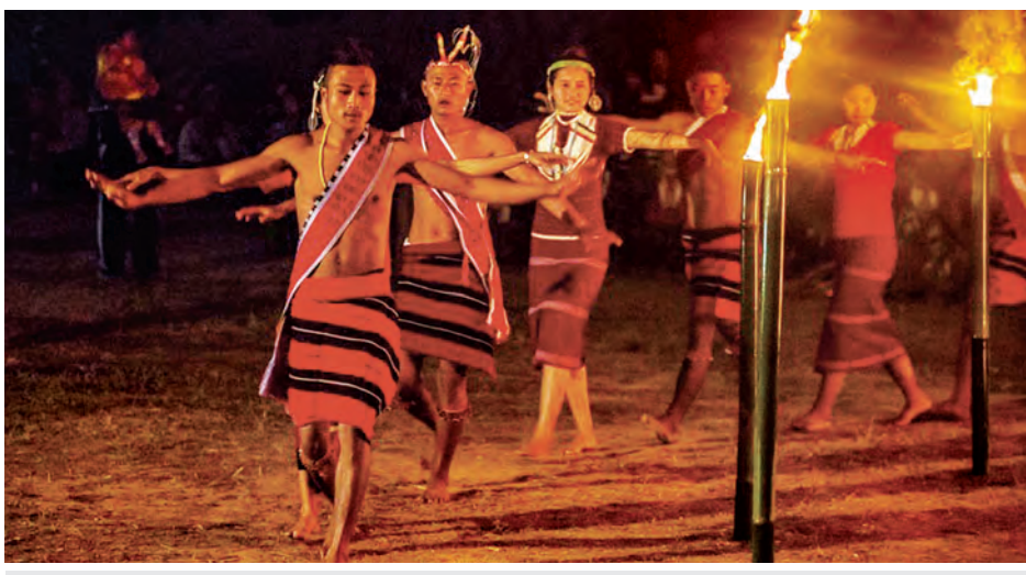
ယမန်နှစ်က နာဂလူမျိုးများ၏ရိုးရာနှစ်သစ်ကူးပွဲတော်မြင်ကွင်း။

ရန်ကုန် ဇန်နဝါရီ ၅ ဇန်နဝါရီ ၁၅ ရက်တွင် ကျင်းပမည့် နာဂရိုးရာ နှစ်သစ်ကူးပွဲကို စည်ကားသိုက်မြိုက်စွာကျင်းပသွားမည် ဖြစ်ပြီး ပွဲတော်သို့ အနယ်နယ်အရပ်ရပ်မှ လာရောက်ကြ မည့် နာဂလူမျိုးများနှင့်အခြားမည်သူမဆို လွယ်ကူစွာ လာရောက်နိုင်ရေးအတွက် ပွဲတော်ရက်များအတွင်း ဆင်သေမှ လဟယ်အထိ ခရီးစဉ်ကို အခမဲ့ ပို့ဆောင်ပေး မည်ဖြစ်ကြောင်းသိရသည်။ နာဂလူမျိုးများ၏ ရိုးရာနှစ်သစ်ကူးပွဲတော်သည် ခန္တီး၊ လေရိုး၊ လဟယ်နှင့် နန်းယွန်းမြို့နယ်တို့တွင် စည်ကား သိုက်မြိုက်စွာ ကျင်းပသည့် ရိုးရာပွဲတော်တစ်ခုဖြစ်ပြီး လူမှုရေးပွဲတော်များအနက် နာဂလူမျိုးများအားလုံး ပျော်ရွှင်စွာတက်ရောက်သည့် အခမ်းအနားပွဲတော်တစ်ခု လည်း ဖြစ်သည်။ ကုန်လွန်ခဲ့သည့်နှစ်နှစ်၏ အတွေ့အကြုံများနှင့် ကြုံတွေ့ရသည့် စာမျက်နှာ ၈ ကော်လံ ၁ *