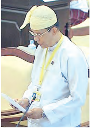
ဒုတိယဝန်ကြီး ဒေါက်တာလင်းအောင် ဖြေကြားစဉ်။

ရုံး၊ မရှိ မေးခွန်းနှင့် စပ်လျဉ်း၍ အားကစားဝန်ကြီးဌာန ဒုတိယဝန်ကြီး ဦးသောင်းထိုက်က မတူမီမြို့နယ် ရေဧာမြို့တွင် မိုးလုံလေလုံအားကစားရုံတည်ဆောက်ပေးနိုင်ရေးအတွက် အားကစားဝန်ကြီးဌာန အနေဖြင့် ချင်းပြည်နယ်အစိုးရအဖွဲ့ထံ စီစဉ်ဆောင်ရွက်ပေးရန် ညှိနှိုင်းခဲ့ပြီးဖြစ်ပါကြောင်း၊ ချင်းပြည်နယ်အစိုးရအဖွဲ့၏ ပြန်ကြားချက်အရ ချင်းပြည်နယ် မတူမီမြို့နယ် ရေဧာမြို့တွင် ပေ ၆၀၀၊ ပေ ၃၅၀ အတိုင်းအတာရှိသည့် ပွဲကြည့်စင်ပေါ်ဘောလုံးကွင်း အသစ်တည်ဆောက်ရန် ၂၀၁၆-၂၀၁၇ ဘဏ္ဍာရေးနှစ်တွင် ရန်ပုံငွေကျပ်သန်း ၁၅၀ လျာထားပြီး ဖြစ်ပါကြောင်း၊ သို့မဟုတ်မိုးလုံလေလုံအားကစားရုံ တည်ဆောက်ပေးရန် အစီအစဉ် မရှိပါကြောင်းဖြေကြားသည်။