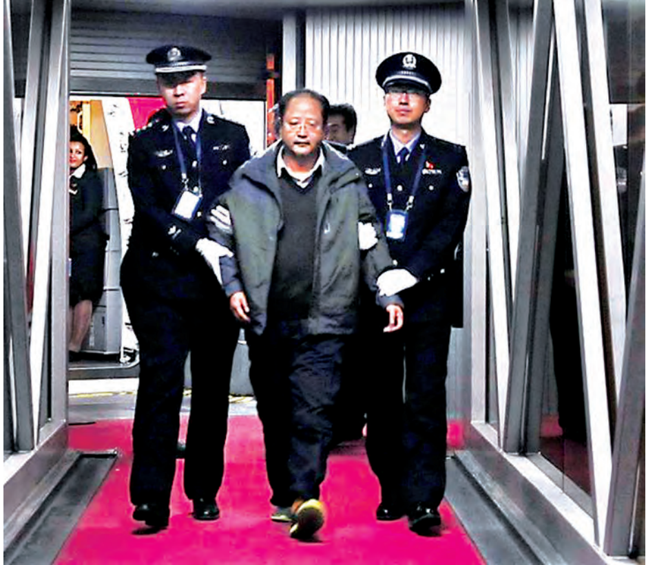
အကျင့်ပျက်ခြစားမှုဖြင့် တရုတ်နိုင်ငံ၏အလိုချင်ဆုံး တရားခံပြေး ပေကျင်းချင်ကို တရုတ်နိုင်ငံ ပေကျင်းအပြည်ပြည်ဆိုင်ရာလေဆိပ်တွင် ဇန်နဝါရီ ၁ ရက်က ရဲများဖြင့် ဝန်းရံစောင့်ကြပ်ခေါ်ဆောင်လာသည်ကို တွေ့ရစဉ်။

ပေကျင်း ဇန်နဝါရီ ၂ နှစ်နိုင်ငံတရားဥပဒေ စိုးမိုးရေး အာဏာပိုင်အဖွဲ့များ၏ ပူးပေါင်း ဆောင်ရွက်မှုများကြောင့် အကျင့်ပျက်ခြစားမှုဖြင့် တရုတ်နိုင်ငံ၏ အလိုချင်ဆုံး တရားခံပြေးတစ်ဦးကို ဂီနီနိုင်ငံမှ သောကြာနေ့က ပြန်လည်ခေါ်ဆောင်လာနိုင်ခဲ့ကြောင်း ဆင်ဟွာသတင်းတစ်ရပ်တွင် ဖော်ပြသည်။ တရုတ်နိုင်ငံတကာ ပူးပေါင်း ဆောင်ရွက်ရေးကုမ္ပဏီ၏ သွင်းကုန် ထုတ်ကုန်ဌာန ညွှန်ကြားရေးမှူးဟောင်း (၄၈ နှစ်) ရှိ ပေကျင်းချင်သည် အကျင့်ပျက်ခြစားမှုဖြင့် သံသယရှိနေသူဖြစ်ပြီး ၂၀၀၉ ခုနှစ် နိုဝင်ဘာလက ထွက်ပြေးတိမ်းရှောင်သွားခဲ့သည်။ တရုတ်နိုင်ငံသည် စီးပွားရေး ဆိုင်ရာ ဖြစ်မှုများဖြင့် စွပ်စွဲခံထားရသော သံသယရှိသူ အယောက် ၁၀၀ ကို ပြန်လည်ခေါ်ဆောင်နိုင်ရန် ရည်ရွယ်၍ ၂၀၁၅ ခုနှစ် ဧပြီလတွင် စတိုးဆိုင်က လှုပ်ရှားဆောင်ရွက်မှုကို စတင်ခဲ့သည်။ ပြည်ပနိုင်ငံတစ်ခုသို့ ထွက်ပြေးတိမ်းရှောင်ခဲ့သော အကျင့်ပျက်ခြစားမှုသံသယရှိသူ ပေသည် တရုတ်နိုင်ငံ၏ အလိုချင်ဆုံး နံပါတ် ၁၀ စာရင်းတွင် ဖော်ပြထားကြောင်း သိရသည်။ ဂီနီနှင့် တရုတ်နိုင်ငံတို့မှ တရားဥပဒေစိုးမိုးရေးအရာရှိများ၏