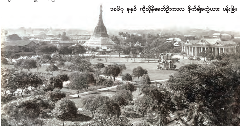
၁၈၆၇ ခုနှစ် ကိုလိုနီခေတ်ဦးကာလ ဖိုက်ချစ်ကွဲယား ပန်းခြံ။

ပြီးခဲ့သည့်နှစ်ကုန်ပိုင်းက ရန်ကုန်မြို့ပြအမွေအနှစ် ထိန်းသိမ်းစောင့်ရှောက်ရေးအဖွဲ့မှ ရန်ကုန်မြို့ပြအမွေအနှစ်ဆိုင်ရာ အထိမ်းအမှတ်အပြာရောင်ကမ္ဘည်းပြားကို ဒသမမြောက်အဖြစ် မဟာဗန္ဓုလပန်းခြံကြီး၌ တပ်ဆင်ခဲ့ပြီးဖြစ်သဖြင့် ပိုမိုခွဲညားမှုအပြင် ပြည်တွင်းပြည်ပခရီးသွားများအတွက် ဗဟုသုတရမ္မယ်ရာ နှစ်ပေါင်း ၁၅၀ ကျော်ခန့် သက်တမ်းရှိ ပန်းခြံကြီးအဖြစ် မြင်တွေ့ရပါကြောင်း။