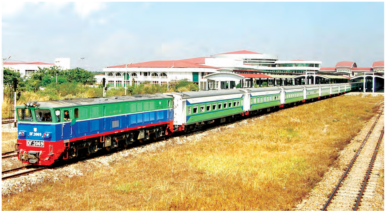
စက်ခေါင်းသစ်နှင့် လူစီးတွဲသစ် ၁၈ တွဲပါ ရထားတစ်စင်း နေပြည်တော်မှ ရန်ကုန်ဘက်သို့ စမ်းသပ်ခတ်မောင်းနေစဉ်။

သံဖြူဇရပ် ဇန်နဝါရီ ၂ ဒုတိယကမ္ဘာစစ် ကာလ အတွင်း ဖက်ဆစ်ဂျပန်တို့က မြန်မာ နိုင်ငံဒေသအသီးသီးမှ ချွေးတပ် လုပ်သား ထောင်ပေါင်းများစွာ၏ လုပ်အားကို အသုံးပြုဖောက်လုပ်ထား သည့် မြန်မာ(သံဖြူဇရပ်)-ထိုင်း သေမင်းတမန်မီးရထားလမ်း၏ ပြယုဂ် ဖြစ်သော သံဖြူဇရပ်မြို့ သေမင်းတမန် မီးရထားပြတိုက် (Death Railway) ဖွင့်လှစ်ခြင်းကို ဇန်နဝါရီ ၄ ရက် တွင် ကျင်းပမည်ဖြစ်သည်။ အဆိုပါ မီးရထားပြတိုက်ဖွင့်လှစ် ခြင်းနှင့်အတူ မွန်ပြည်နယ်အစိုးရ အဖွဲ့ မြန်မာ့မီးရထားဌာနနှင့် တလမွန်ကုမ္ပဏီတို့ ပူးပေါင်းဆောင် ရွက်မှုဖြင့် မြန်မာ-ထိုင်း မီးရထား လမ်း အစပြုရာ မီးရထားပြတိုက်ဘေး ရှိ မူလမီးရထားလမ်းဟောင်းနေရာမှ စတင်ကာ ဂျပန်တို့ မြန်မာနိုင်ငံစစ် မြေပြင်မှ စစ်ဆုတ်ခွာရမည့်အချိန် တွင်တည်ထားခဲ့သော ဂျပန်ဘုရား (ရန်ပြေမာန်ပြေစေတီ) အနီးအထိ (ထိုစဉ်က ကန်တော်ဘူတာရုံ)ပထမ အဆင့် ၀ ဒသမ ၅မိုင်ခန့်ကို ပြတိုက် သို့ လာရောက်လေ့လာကြမည့် ပြည် တွင်း ပြည်ပမှခရီးသွားများ စီးနင်း စာမျက်နှာ ၃ ကော်လံ ၃