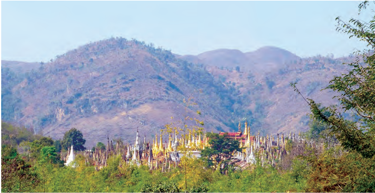
တောင်တန်းများနောက်ခံပြုလျက် ရွှေအင်းတိန်စေတီပုထိုးများကို အဝေးမှဖူးမြင်ရစဉ်။