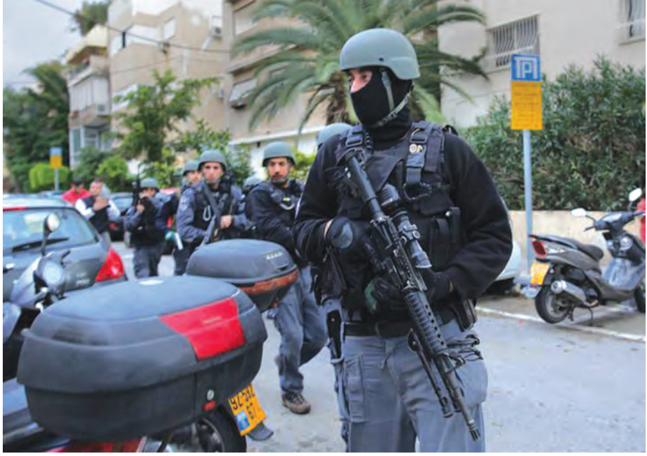
အစ္စရေး လုံခြုံရေးတပ်ဖွဲ့များက တဲလ်အပစ်ပစ်ခတ်မှုတွင် သံသယရှိသူကို ပိုက်စိပ်တိုက်ရှာဖွေနေစဉ်။