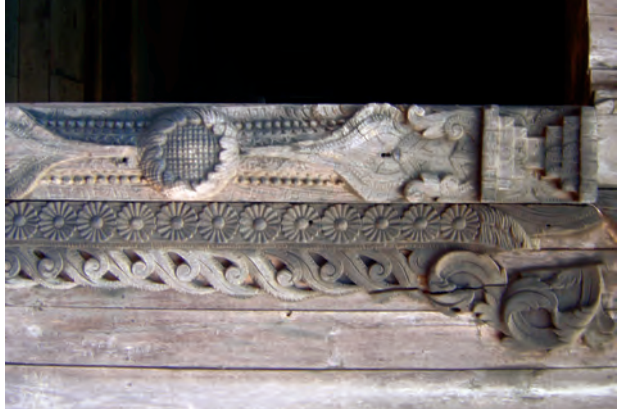
ပခန်းကြီးကျောင်းရှိ ရှေးဟောင်းအနုပညာလက်ရာများကို တွေ့ရစဉ်။

ပခန်းကြီး ရှေးဟောင်းသုတေသနပြုတိုက်တွင် ကျောက်စာ၊ ပေစာ ဟောင်းများ၊ ဒဂိုးများ၊ မြေအိုးမြေခွက်များ၊ ဆင်းတုတော်ရုပ်ပွားများ၊ မင်းတုန်းမင်း လက်ထက်တံတော်များနှင့် ရှေးခေတ်စစ်သည်တော်သုံး လှံ၊ ဓား၊ မောက်တို့၊ မောက်ရှည်များကို ပြသထားကြောင်း ကြားသိခဲ့ရသော်