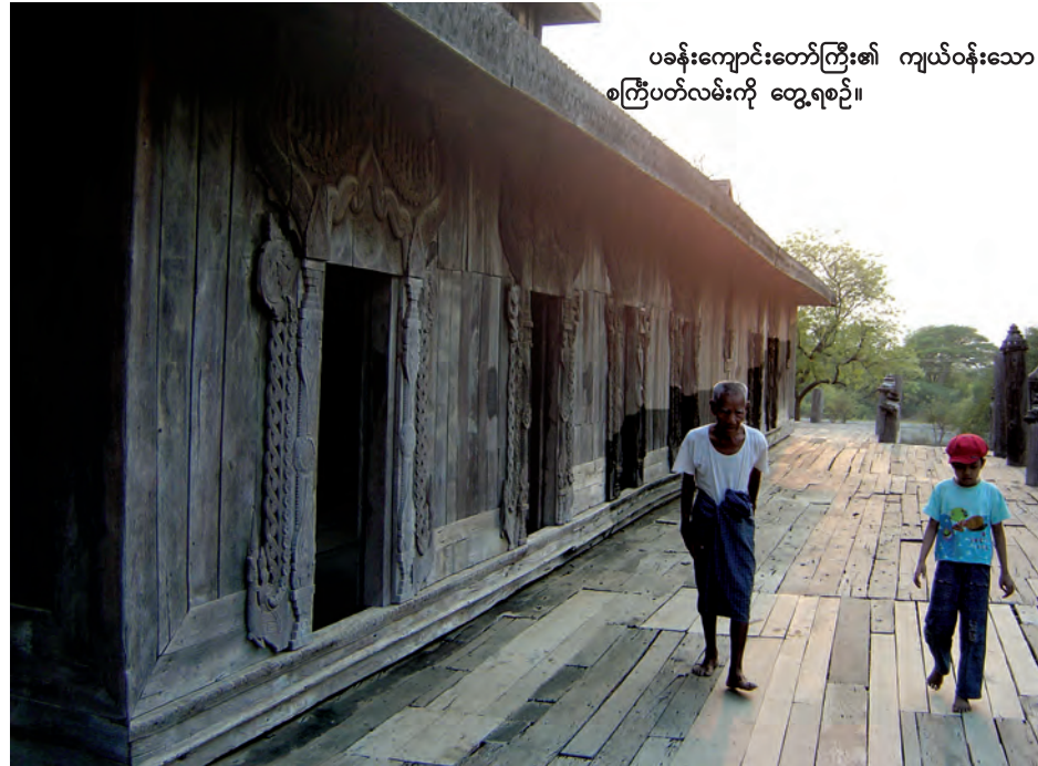
ပခန်းကျောင်းတော်ကြီး၏ ကျယ်ဝန်းသော စင်္ကြံပတ်လမ်းကို တွေ့ရစဉ်။

ပခန်းမြို့ရိုးသည် မြန်မာ နိုင်ငံရှိ ရှေးမြို့ဟောင်းများ အနက် ထုထည်အလွန်ကြီးမား သော မြို့ရိုးတစ်ခုဖြစ်ကြောင်း သိရှိရသည်။ ရှေးဟောင်းသုတေ သနနှင့် အမျိုးသားပြတိုက်ဦးစီး ဌာနက ပခန်းကြီးကျောင်းတော် ကြီးကို ၁၉၉၂ ခုနှစ်တွင် ထိန်း သိမ်းထားခဲ့သည်