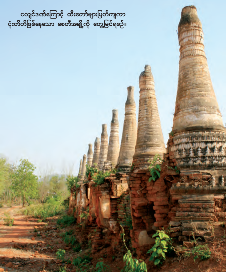
လျှင်ဒဏ်ကြောင့် ထီးတော်များပြတ်ကျကာ ငုံးတိတ်ဖြစ်နေသော စေတီအချို့ကို တွေ့မြင်ရစဉ်။

ရွှေအင်းတိန် ဘုရားစေတီ များမှာ ထူးခြားမှုရှိသည်က အမှန် ပင်။ မြေပြင်တွင် ပစ္စယာအခံ မရှိဘဲ တည်ထားခြင်းဖြစ်သည့် အပြင် စေတီတိုင်း၌ ကြာမှောက်၊ ကြာလှန်အောက် ဖောင်းရစ်နေရာ တွင် မြင်တွေ့နေကျ စေတီများ ထက် ရှည်ရှည်တည်ထားခြင်း ဖြစ်သည်။ ရွှေအင်းတိန် စေတီ အားလုံး ပိသုကာဒီဇိုင်း ပုံစံများ တူညီသော်လည်း အချို့စေတီများ က အောက်ခြေတွင် ဂူများပါဝင် တည်ထားသည်ကို တွေ့ရသည်။