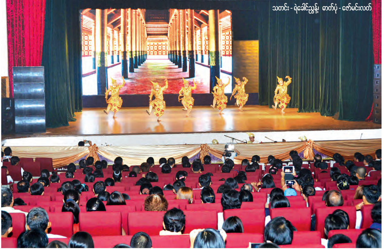
သတင်း - ရဲခေါင်ညွန့်

ယနေ့ဖော်ပြောသည့် သုဝဏ္ဏသာမဇာတ်တော်ကြီးနှင့် ပဒေသာကပွဲကို