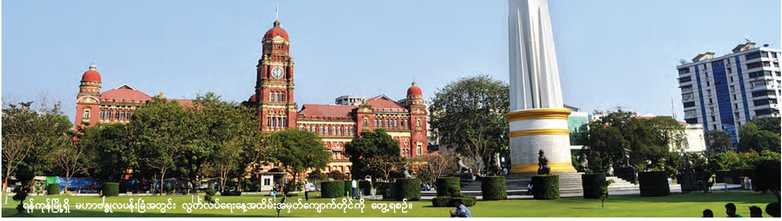
ရန်ကုန်မြို့ရှိ မဟာဗန္ဓုလပန်းခြံအတွင်း လွတ်လပ်ရေးနေ့အထိမ်းအမှတ်ကျောက်တိုင်ကို တွေ့ရစဉ်။