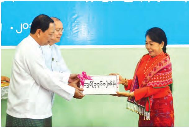
(သတင်းစဉ်)

၂၀၁၅ ခုနှစ် ဇွန်လနောက်ပိုင်း၌ ရေကြီးရေလျှံမှုများနှင့် မြေပြိုမှုများကြောင့် မြန်မာနိုင်ငံအတွင်း သဘာဝဘေးသင့်ပြည်သူများအတွက် ပြန်လည်ထူထောင်ရေးလုပ်ငန်းများဆောင်ရွက်ရန် ပြည်ထောင်စုကြံ့ခိုင်ရေးနှင့် ဖွံ့ဖြိုးရေးပါတီမှ အလှူငွေကျပ် သိန်း ၃၇၆၀ ပေးအပ်လှူဒါန်းပွဲ အခမ်းအနားကို ဒီဇင်ဘာ ၃၀ ရက် နံနက် ၁၀ နာရီက လှူမှုဝန်ထမ်း၊ ကယ်ဆယ်ရေးနှင့် ပြန်လည်နေရာချထားရေးဝန်ကြီးဌာန နေပြည်တော်၌ ကျင်းပရာ ပါတီတွဲဖက်အထွေထွေ အတွင်းရေးမှူး ဦးသက်နိုင်ဝင်းနှင့် အတွင်းရေးမှူး ဒေါက်တာကျော်ကျော်ဌေးတို့က ပေးအပ်ပြီး (ယာဝုံ) အမျိုးသားသဘာဝဘေးအန္တရာယ်ဆိုင်ရာ စီမံခန့်ခွဲမှုလုပ်ငန်းကော်မတီဥက္ကဋ္ဌ ပြည်ထောင်စုဝန်ကြီး ဒေါက်တာဒေါ်မြတ်မြတ်အုန်းခင်က လက်ခံ၍ ဂုဏ်ပြုမှတ်တမ်းလွှာ ပေးအပ်ကာ ကျေးဇူးတင်စကား ပြန်လည်ပြောကြားခဲ့ကြောင်း သတင်းရရှိသည်။