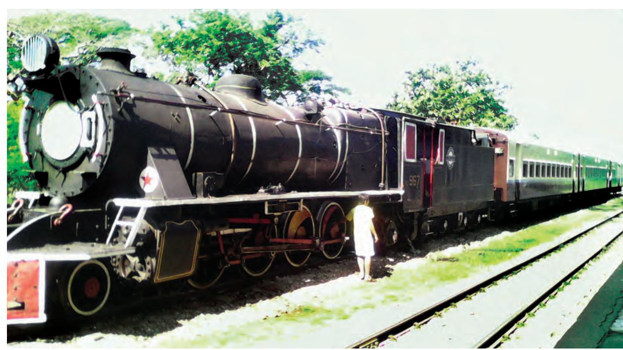
■ ရှေ့ဖိုးမှ

ပို့ဆောင်ပေးနိုင်ရေးအတွက် အဆိုပါ YB ရေနေ့ငွေစက်ခေါင်းနှင့် တွဲဆိုင်ကို မြန်မာ့မီးရထားဌာန တာဝန်ရှိသူ