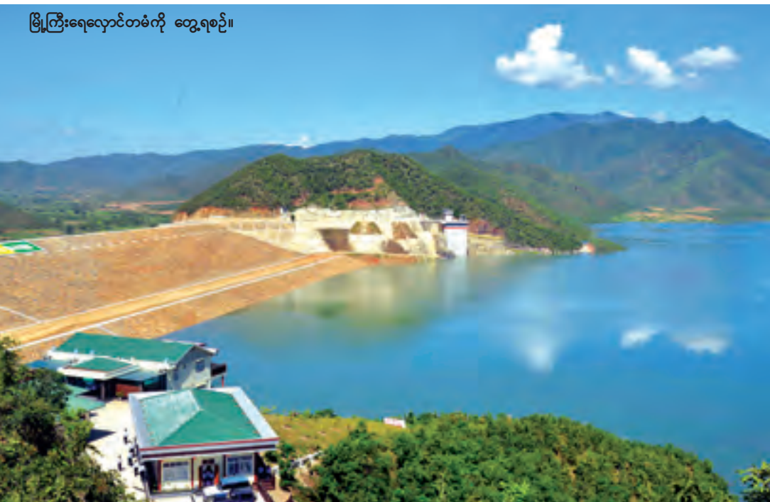
မြို့ကြီးရေလှောင်တံတံကို တွေ့ရစဉ်။

ထူးခြားသည့် ညအပူချိန်များမှာ ဟားခါးမြို့၌ ၄ ဒီဂရီစင်တီဂရိတ်၊ လှိုင်လင်မြို့နှင့် ပြင်ဦးလွင်မြို့တို့တွင် ၆ ဒီဂရီစင်တီဂရိတ်စီ၊ ပင်လောင်းမြို့၊ မိုးမိတ်မြို့နှင့် ဖလမ်းမြို့တို့၌ ၇ ဒီဂရီစင်တီဂရိတ်စီတို့ ဖြစ်ကြသည်။ ဘင်္ဂလားပင်လယ်အော်အခြေအနေမှာ ကပ္ပလီပင်လယ်ပြင်နှင့် ဘင်္ဂလားပင်လယ်အော်တို့တွင် တိမ်အသင့်အတင့်မှ တိမ်ထူထပ်နေသည်။ (မိုး/ဇေလ)