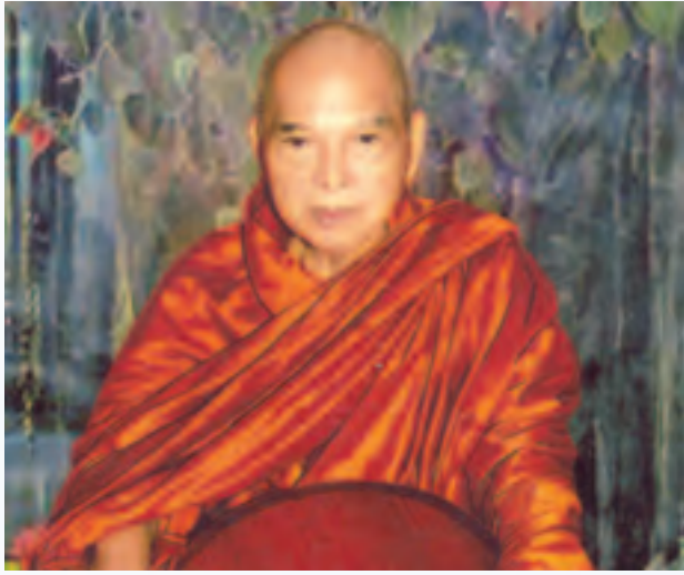
ကြပါစေ၊ ရောဂါအန္တရာယ်ကင်းပြီး စီးပွားဥစ္စာတိုးတက်ကြပါစေ။ ၂၀၁၅ ခုနှစ် ဒီဇင်ဘာ ၂၁ ရက်က ၂၉ရက်အထိ ဘုန်းဘုန်းတို့ တရုတ်ပြည်ကိုသွားရောက်ခဲ့တယ်။ အဲဒီမှာ ကြားလိုက်ရတဲ့ စကား

၂၀၁၆ ခုနှစ် နှစ်ဆန်း နှစ်သစ်ကူးမင်္ဂလာအနေနဲ့ ကမ္ဘာသူ ကမ္ဘာသား တို့နှင့်တကွ မြန်မာနိုင်ငံသူနိုင်ငံသားတို့အတွက် သံယုတ်ပါဠိတော်လာ မြတ်စွာဘုရားရှင် ဟောကြားတော်မူတဲ့ အောင်ဂါထာရဲ့ အနက်အဓိပ္ပာယ် ဖြစ်တဲ့ “နေမင်းကြီးက အလွန်တရာထွန်းလင်းတောက်ပပေမယ့် နေ့အခါ သာထွန်းလင်းတောက်ပပြီး ညအခါ မထွန်းလင်းဘူး။ လမင်းကြီးသည်လည်း အလွန်တရာ သာယာတောက်ပပေမယ့် ညအချိန်မှာသာ တောက်ပပြီး နေ့အခါ မတောက်ပဘူး။ မင်းမြောက်တန်ဆာ ငါးပါးဆင်ယင်မှ ဘုရင်မင်းမြတ်တွေလည်း လှပတင့်တယ်တယ်၊ မင်းမြောက်တန်ဆာ မပါရင် သာမန် လူလိုပဲ။ ရဟန္တာပုဂ္ဂိုလ်များသည်လည်း ဈာန်ဝင်စားမှသာလျှင် ကြည်ညိုဖွယ်ကောင်းပြီး လောက၌တင့်တယ်တယ်၊ ဈာန်မဝင်စားသည့် အချိန်တွင် မတင့်တယ်ဘူး။ မြတ်စွာဘုရားသည် နေ့အခါဖူးလည်း တင့်တယ် တယ်၊ ညအခါဖူးလည်း တင့်တယ်တယ်၊ ဈာန်မဝင်စားဘဲနေလည်း သပ္ပာယ်တင့်တယ်တယ်၊ ဘယ်အချိန်ကြည့်ကြည့် မြတ်စွာဘုရားက ကြည်ညိုဖွယ်ဆောင်တယ်။ ဒီလိုဂုဏ်ထူးဝိသေသတွေနဲ့ ပြည့်စုံတဲ့ မြတ်စွာဘုရားကို ကမ္ဘာသူကမ္ဘာသား မြန်မာနိုင်ငံသူ နိုင်ငံသားအပေါင်းတို့က လက်စုံမိုး၍ ရှိခိုးကန်တော့ရသော ကုသိုလ်စေတနာကြောင့် အားလုံးသော ကမ္ဘာသူ ကမ္ဘာသား မြန်မာနိုင်ငံသူနိုင်ငံသားအပေါင်း ကျန်းမာချမ်းသာ