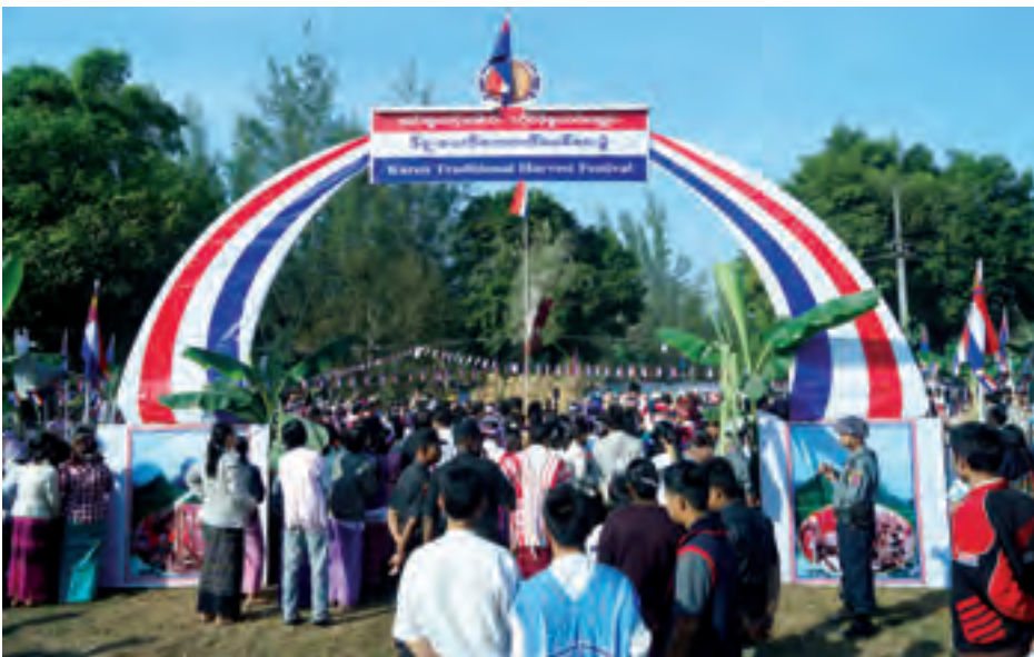
ဘားအံမြို့ရှိ ပြည်နယ်သီရိကွင်း၌ ၂၀၁၄ ခုနှစ်က ကရင်နှစ်သစ်ကူးပွဲတော်ကျင်းပစဉ်။

ဘားအံမြို့တွင် နှစ်စဉ်ကျင်းပမြဲ ဖြစ်သော ပြည်နယ် သီရိကွင်း၌ နံနက် ၆ နာရီ တွင် ကရင်အမျိုးသား အလံကို ကရင်တိုင်းရင်းသားကြီး များက ကျွဲချိုမှုတ်ပြီး ဖားစည်တီးကာ လွှင့်ထူကြမည်ဖြစ်သည်။ နံနက် ၇ နာရီတွင် ကရင်နှစ်သစ်ကူးနေ့အခမ်း အနားကို ကျင်းပမည်ဖြစ်သည်။