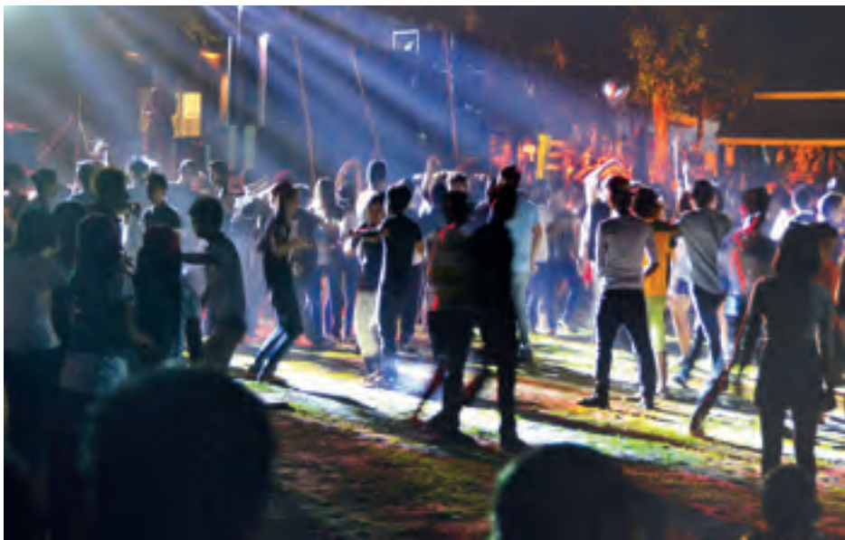
ဒီဇင်ဘာ ၃၁ ရက်ညက ရန်ကုန်မြို့ ကရဝိတ်ဥယျာဉ်တွင် နှစ်သစ်ကူးကြိုဆိုရန် လူငယ်များ စည်းကားစွာဖြင့် ပျော်ရွှင်မြူးထူးနေမှုကို တွေ့ရစဉ်။