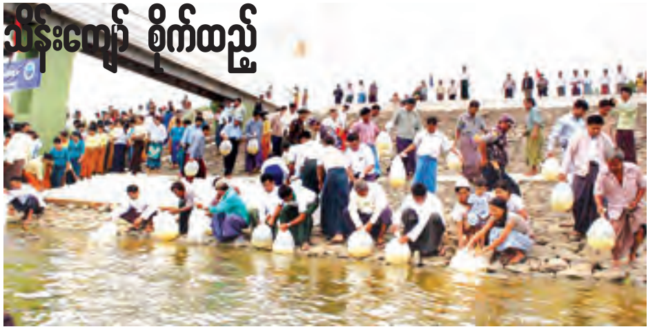
ငါးမျိုးများပြုန်းတီးမှုမရှိစေရေး ဆည်မြောင်းတာတံခံနှင့် စပါးများအတွင်းသို့ ငါးသန်ကောင်ရေ ၂၉ သိန်း ကျော် စိုက်ထည့်စဉ်။

စစ်ကိုင်းတိုင်းဒေသကြီးအတွင်း ၂၀၀၄-၂၀၁၅ဘဏ္ဍာနှစ်တွင် မြစ်ချောင်း၊ ဆည်၊ တာတံခံများနှင့် စပါးခင်းများ အတွင်းသို့ ငါးသားပေါက်ငါးသန်ကောင်ရေ ၃၅ ဒသမ ၉၅၀ သိန်းကို မျိုးစိုက်ထည့်ပေးနိုင်ခဲ့ပြီး ၂၀၁၅-၂၀၁၆ ဘဏ္ဍာနှစ်တွင် မြစ်ချောင်း၊ တာတံခံများအတွင်းသို့ ငါးသန်ကောင်ရေ သိန်း ၂၅ ဒသမ ၉၅၀၊ စပါးခင်းများအတွင်း