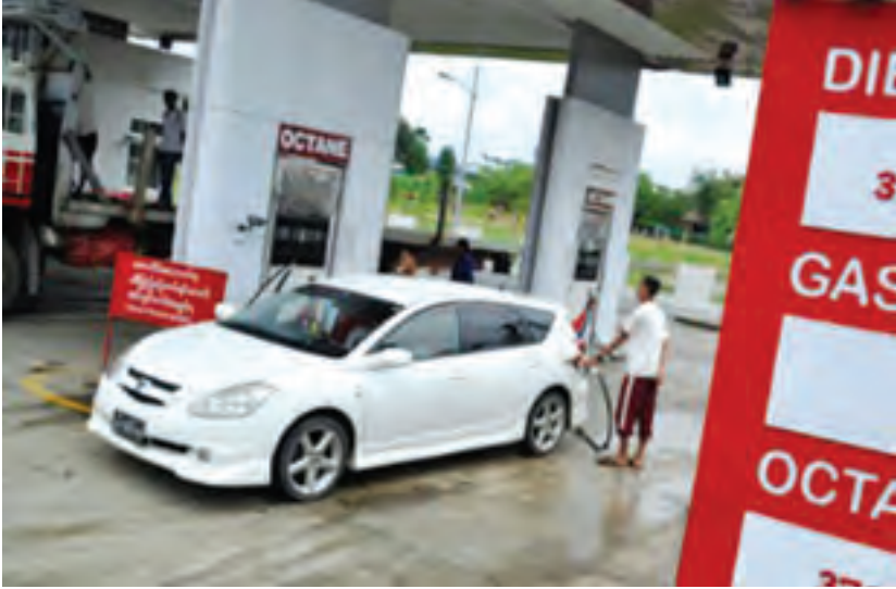
မကွေးမြို့မှ ဓာတ်ဆီဆိုင်တစ်ဆိုင်။

“ပုဂ္ဂလိက ဓာတ်ဆီအရောင်းဆိုင်၊ ပန်ဆိုင်တွေက အရောင်းဝန်ထမ်းတွေအနေနဲ့ လုပ်ငန်းခွင်အတွင်း ဓာတ်ဆီဖြည့်ခိုက်မှာ နှာခေါင်းစွပ်(mask) တွေကို မမေ့မလျော့ တပ်ဆင်ထားသင့်တယ်။ ဆိုင်ရှင်တွေကလည်း ဒါကိုစည်းကမ်းတစ်ရပ်အနေနဲ့ တင်းတင်းကျပ်ကျပ် သတ်မှတ်ဆောင်ရွက်သင့်တယ်။ ဓာတ်ဆီအငွေ့ အဓိကအားဖြင့် (Octane) အငွေ့တွေကို နေ့စဉ်ရွံ့ရှိုက်မှုများလာရင် အာရုံကြောရောင်တဲ့ရောဂါ ဖြစ်နိုင်တယ်။ ဦးနှောက်နဲ့ အာရုံကြောတွေ ပျက်စီးနိုင်တဲ့အထိ ဖြစ်နိုင်တယ်။ အထူးသဖြင့် ခေါင်းကိုက်၊ ခေါင်းမူး၊ မအီမသာ ဖြစ်တာတွေ ခံစားရပြီး အကိုက်အခဲပျောက်ဆေးတွေသောက်လည်း မထူးတာမျိုးတွေ ဖြစ်လာတတ်တယ်”ဟု ၎င်းက ဆက်လက်ပြောပြသည်။ မကွေးတိုင်းဒေသကြီးအတွင်း လမ်းပန်းဆက်