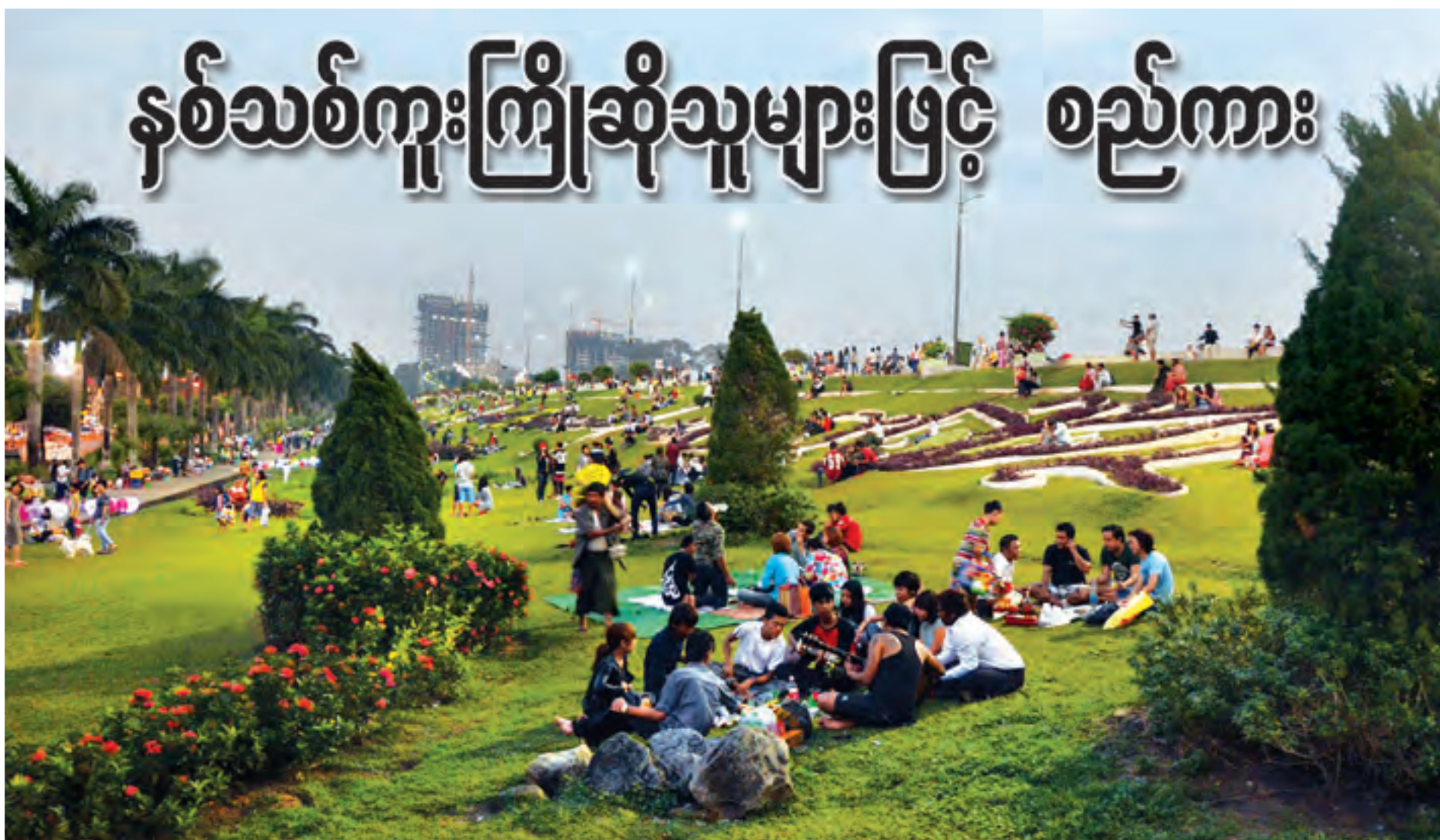
ဒီဇင်ဘာ ၃၁ ရက် ညနေပိုင်းမှစတင်ပြီး ရန်ကုန်မြို့ အင်းလျားကန်ပေါင်ပေါ်တွင် ၂၀၁၆ နှစ်သစ်ကူးကြိုဆိုသူများနှင့် စည်ကားနေသည်ကို ဤသို့တွေ့ရသည်။