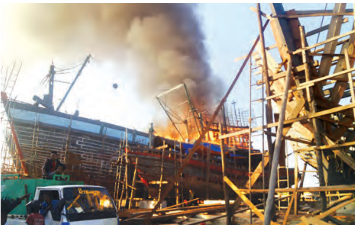
ငါးကဲ့လှေနှစ်စင်းတို့၏ လှေပေါင်းမိုးနှင့် အတွင်းပိုင်း မီးလောင်ကျွမ်းခဲ့သဖြင့် ရဲစခန်းက အမှုဖွင့်အရေးယူဆောင်ရွက်လျက်ရှိကြောင်း သိရသည်။