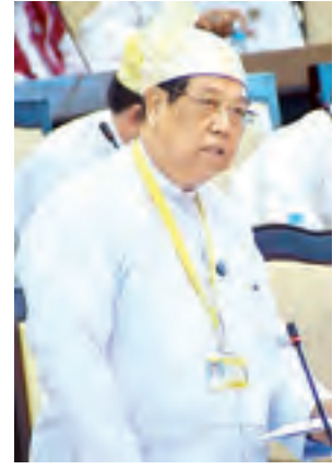
ဒုတိယဝန်ကြီး ဦးစိုးတင့် ဖြေကြားစဉ်။

အစည်းအဝေးတွင် ရန်ကုန်တိုင်းဒေသကြီး မဲဆန္ဒနယ်အမှတ်(၁၂)က ဦးဆွေအောင်၏ နိုင်ငံတော်အစိုးရက ဒေသဖွံ့ဖြိုးရေးအတွက် ဆေး-လောင်းရှည်-စေတုတ္တရာ လမ်းဖောက်လုပ်ရာတွင် နှစ်ပေါင်းများစွာ စားမဦးချလုပ်ကိုင်ခဲ့သော လယ်ယာမြေများ ပျက်စီးဆုံးရှုံး နစ်နာရခြင်းအတွက်