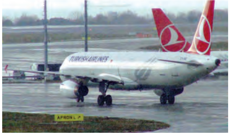
ဒီဇင်ဘာ ၃၀ ရက်က နှင်းမုန်တိုင်းတိုက်ခတ်မှုကြောင့် တူရကီလေကြောင်းလိုင်းမှ လေယာဉ်တစ်စင်း တူရကီနိုင်ငံ အစ္စတန်ဘူလ်လေဆိပ်တွင် ရပ်နားထားစဉ်။

ထားသည်။ နှင်းရှင်းယာဉ် အစီးတစ်ထောင် ကျော်နှင့် အခြားအကြီးစားယာဉ်များ အပါအဝင် လူပေါင်း ၅၀၀၀ ကျော် သည် အရေးပေါ်အခြေအနေအတွက် အဆင်သင့်ရှိနေကြောင်း အစ္စတန် ဘူလ်မြို့တော်မြို့နယ်က ကြေညာ ထားသည်။ (ဆင်ယွာ)