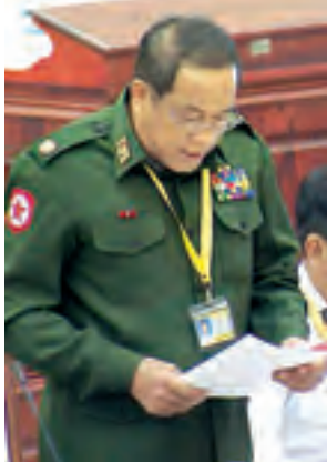
ဒုတိယဝန်ကြီး ဗိုလ်မှူးချုပ် ကျော်ကျော်ထွန်း ဖြေကြားစဉ်။

ဥပဒေ၊ နည်းဥပဒေများနှင့်အညီ ဆက်လက်စီစဉ် ဆောင်ရွက်လျက် ရှိပါကြောင်း၊ ယခင်နေထိုင်ခဲ့သည့် မြို့နယ်များတွင် စာရင်း ရှိ၊ မရှိ စိစစ်ခြင်း၊ မှန်ကန်ပါက စာရင်းပယ်ဖျက်၍ အမြဲအခြေချနေထိုင်မည့် မြို့နယ်တွင် အိမ်ထောင်စု လူဦးရေစာရင်းထုတ်ပေးခြင်းနှင့် အိမ်ထောင်စုလူဦးရေစာရင်းထုတ်ပေးပြီးပါက မြန်မာနိုင်ငံသားဥပဒေနှင့်အညီ နိုင်ငံသားစိစစ်ရေးကတ်ပြားထုတ်ပေးခြင်းလုပ်ငန်းများကို တည်ဆဲဥပဒေ၊ နည်းဥပဒေများနှင့်အညီ ဆက်လက်စီမံဆောင်ရွက်ပေးလျက်ရှိပါကြောင်း၊ နိုင်ငံသား စိစစ်ရေးကတ်ပြား