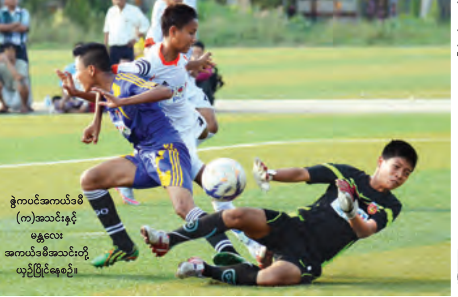
ဇွဲကပင်အကယ်ဒမီ (က)အသင်းနှင့် မန္တလေးအကယ်ဒမီအသင်းတို့ ယှဉ်ပြိုင်နေစဉ်။