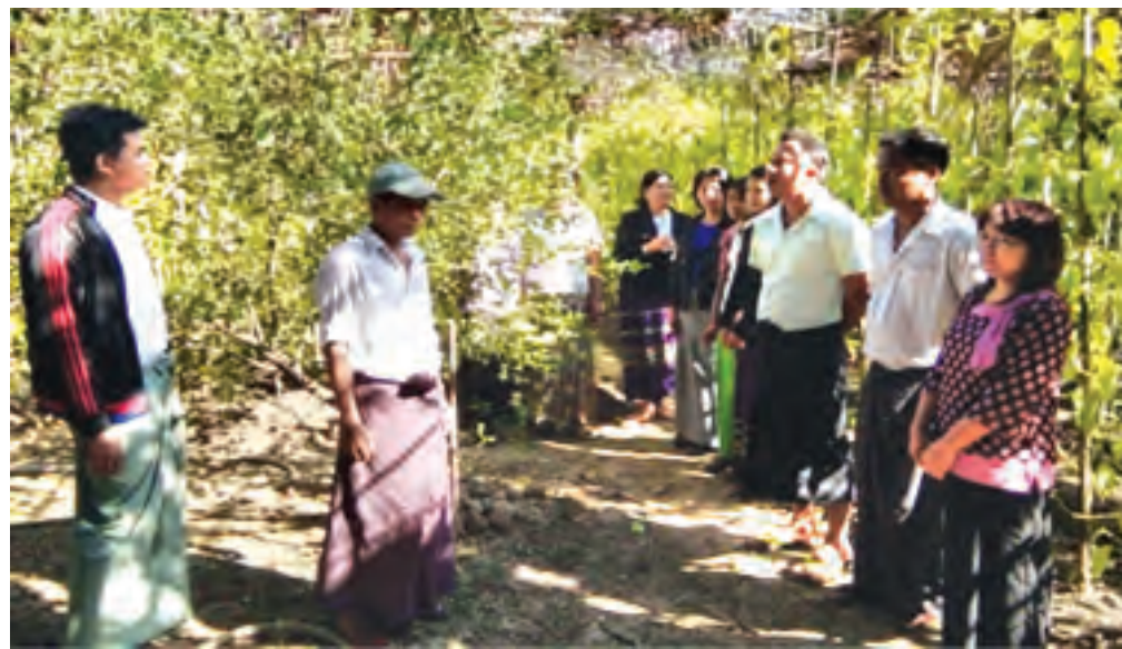
(မြို့နယ် ပြန်/ဆက်)

ယင်းကျေးရွာများတွင် မြစ်စိမ်းရောင် ရန်ပုံငွေဖြင့် အကောင်အထည်ဖော် ဆောင်ရွက်လျက်ရှိသောလုပ်ငန်းများမှာ မွေးမြူရေး၊ စိုက်ပျိုးရေး၊ အရောင်းအဝယ်နှင့် အသက်မွေးဝမ်းကျောင်း လုပ်ငန်းများဖြစ်ကြောင်း သိရသည်။ ကွင်းဆင်းစစ်ဆေးခဲ့သည့် အဖွဲ့မှ အဆိုပါ ကျေးရွာများတွင် မြစ်စိမ်းရောင် စီမံကိန်းချေးငွေဖြင့် အကောင်အထည်ဖော် ဆောင်ရွက်ထားသော လုပ်ငန်းများစစ်ဆေးခြင်း၊ ငွေစာရင်းပုံစံများ စနစ်တကျ ရေးသွင်း ထိန်းသိမ်းထားရှိမှုများကို စစ်ဆေးခဲ့ကြောင်း သိရသည်။