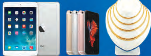
အမှန်တကယ်ဆုပေးမည့် မရွတ်ဖူးများသည် ကြော်ငြာတွင်ဖော်ပြထားသောပစ္စည်းများနှင့် အနည်းငယ်ကွာခြားမှုရှိနိုင်ပါသည်