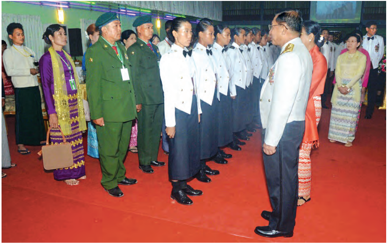
နှင့်အဖွဲ့ဝင်များ၊ ကျောင်းဆင်းအရာရှိ ဘွဲ့နှင်းသဘင် ခန်းမဆောင်၌ အဖွဲ့တို့၏ ဖျော်ဖြေတင်ဆက်မှု ကြည့်ရှုအားပေးခဲ့ကြကြောင်း သတင်းရရှိသည်။

အဆိုပါ သင်တန်းဆင်း ဂုဏ်ပြု ညစာစားပွဲ အခမ်းအနားသို့ တပ်မတော်ကာကွယ်ရေးဦးစီးချုပ်၏ ဇနီး ဒေါ်ကြူကြူလှ၊ ညှိနှိုင်းကွပ်ကဲရေးမှူး (ကြည်း၊ ရေလေ) ပူးတွဲတာဝန် ကာကွယ်ရေးဦးစီးချုပ်(လေ) ဗိုလ်ချုပ်ကြီး ခင်အောင်မြင့်နှင့်ဇနီး၊ ကာကွယ်ရေးဦးစီးချုပ်(ရေ) ဒုတိယဗိုလ်ချုပ်ကြီး တင်အောင်စန်းနှင့်ဇနီး၊ ကာကွယ်ရေးဦးစီးချုပ်(ကြည်း)မှ တပ်မတော် အရာရှိကြီးများနှင့် ဇနီးများ၊ ရန်ကုန်တိုင်းစစ်ဌာနချုပ်တိုင်းမှူး၊ တပ်မတော်(ကြည်း) ပိုလ်လောင်းသင်တန်းကျောင်း (မှော်ဘီ) စစ်တီးပိုင်းအဖွဲ့တို့က တေးသီချင်းများဖြင့် ဖျော်ဖြေကြပြီး တပ်မတော်ကာကွယ်ရေး ဦးစီးချုပ်က ဂုဏ်ပြုဆုငွေ ပေးအပ်ချီးမြှင့်သည်။