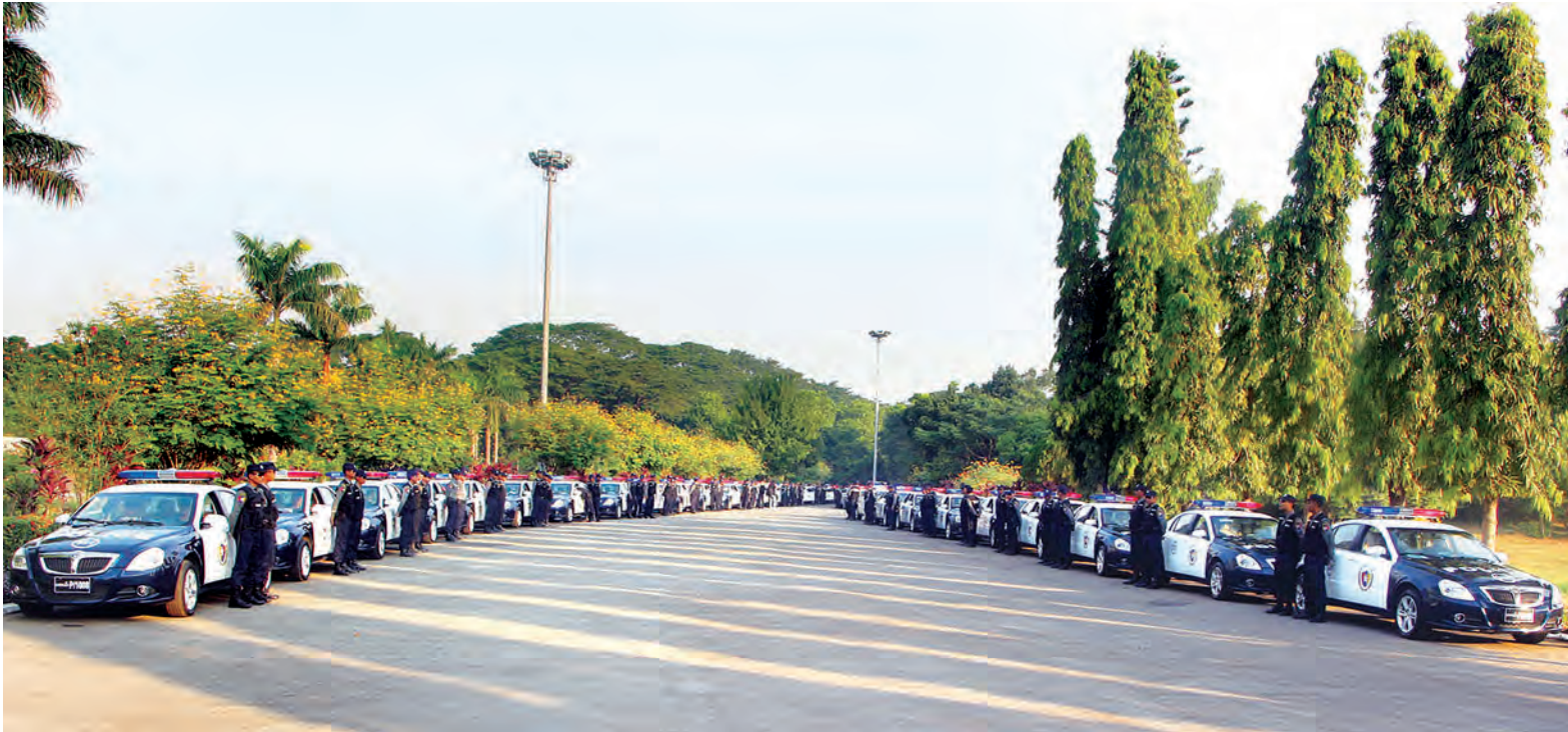
မုခင်းမြစ်ပွားသည့်နေရာများသို့ အချိန်မီရောက်ရှိထိန်းသိမ်းနိုင်ရန် မော်တော်ယာဉ်အချင်းချင်းဆက်သွယ်မှုစနစ်ဖြင့် ဆောင်ရွက်မည့် လှည့်ကင်းမီးတန်းမော်တော်ယာဉ်များကို တွေ့ရစဉ်။ သတင်း၊ စာမျက်နှာ-၃ (ဓာတ်ပုံ-သတင်းစဉ်)