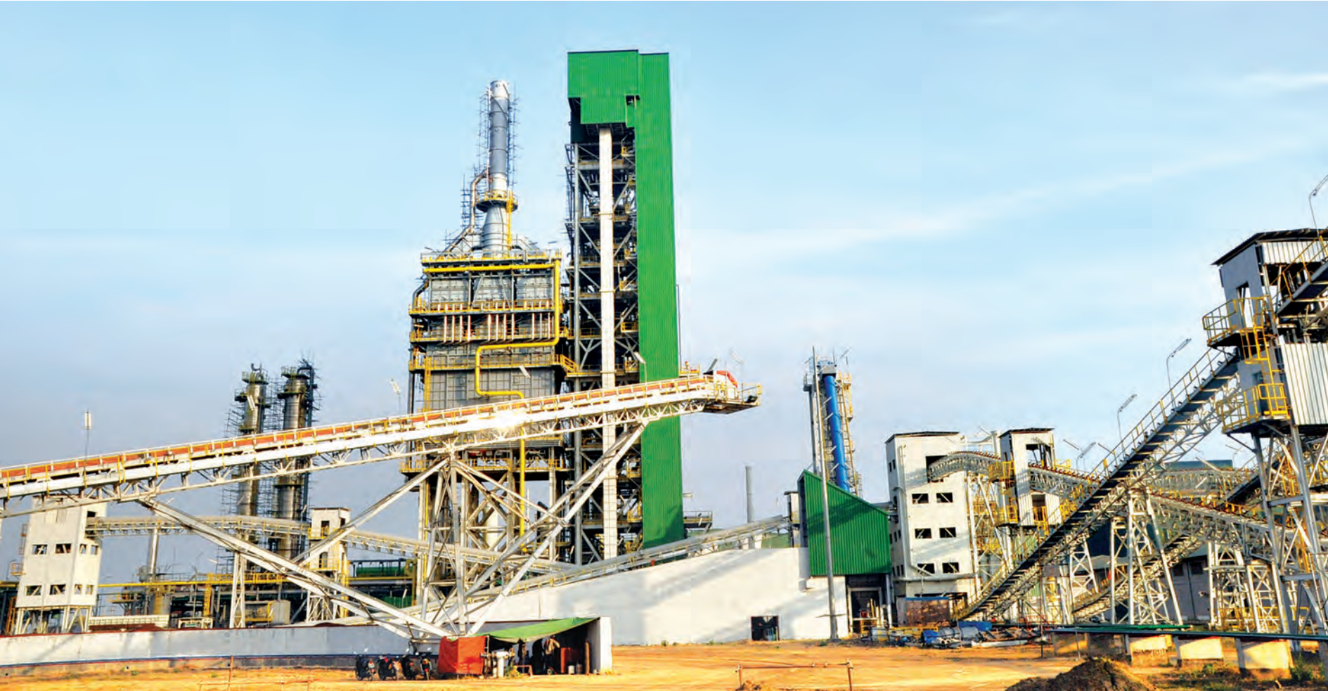
တစ်နှစ်လျှင် တန်ချိန် လေးသိန်း ထုတ်လုပ်နိုင်မည့် အမှတ် (၁) သံမဏိစက်ရုံ (မြင်းခြံ)စီမံကိန်း တည်ဆောက်ပြီးစီးမှုအခြေအနေကို တွေ့ရစဉ်။ သတင်း၊ စာမျက်နှာ-၃ (ဓာတ်ပုံ-သတင်းစဉ်)