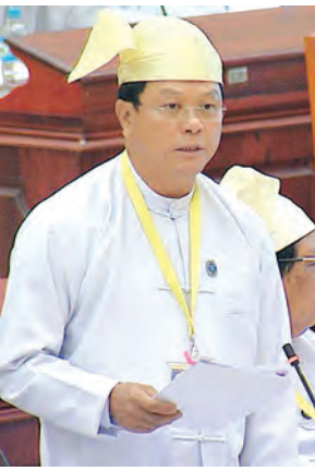
ဒုတိယဝန်ကြီး ဦးအောင်သန်းဦး ဖြေကြားစဉ်။

ထို့နောက် ရေးမဲဆန္ဒနယ်မှ ဒေါ်မိမြင့်သန်း၏ ရေးမြို့နယ် မဟာ ဓာတ်အားလှိုင်းလျှပ်စစ်စီမံကိန်း ၂၀၁၆- ၂၀၁၇ ဘဏ္ဍာရေးနှစ် အမျိုးသား စီမံကိန်း ဥပဒေတွင် ပါရှိသည့်