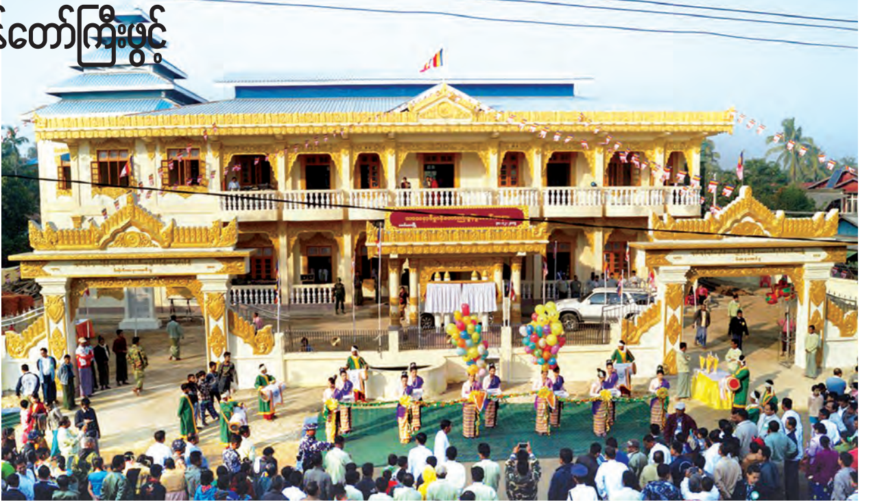
ပတ်ဖျန်းပေးခဲ့ကြသည်။

ဆက်လက်၍ မောင်တောမြို့ သာသနာ့ဗိမာန်တော်ကြီး ဖွင့်ပွဲအခမ်းအနားကို နံနက် ၉ နာရီတွင် ပြုလုပ်ရာ မောင်တောမြို့နယ် သံဃာယကအဖွဲ့ ဥက္ကဋ္ဌဆရာတော်၊ ပြည်နယ်ဝန်ကြီးချုပ် ဦးမြအောင်၊ အမှတ်(၁)နယ်ခြားစောင့် ရဲကွပ်ကဲမှူးအဖွဲ့၊ ရဲမှူးချုပ် တင်ကိုကို၊ လုံခြုံရေးနှင့် နယ်စပ်ရေးရာ ဝန်ကြီး ဗိုလ်မှူးကြီး ထိန်လင်းနှင့် မောင်တောခရိုင် အုပ်ချုပ်ရေးမှူး ဦးခင်မောင်လွင်တို့က သာသနာ့ဗိမာန်တော်ကြီးကို ဖဲကြီးဖြတ်ဖွင့်လှစ်ပေးကြပြီး ပြည်နယ်ဝန်ကြီးချုပ်က စက်ခလုတ်နှိပ်၍ သာသနာ့ဗိမာန်ဆိုင်းဘုတ်ကို ဖွင့်လှစ်ပေးကာ သာသနာ့ဗိမာန်တော်ကြီး ကမ္ဘာ့မော်ကွန်းကျောက်စာအား မြို့မိမြို့ဖများဖြစ်သော ဦးဝေသာမောင်နှင့် ဦးအောင်မြင့်သိန်းတို့က ဖဲကြီးဖြတ်၍ တက်ရောက်လာကြသော ဝန်ကြီးချုပ်နှင့်အဖွဲ့တို့က အမွှေးနံ့သာရည်များ