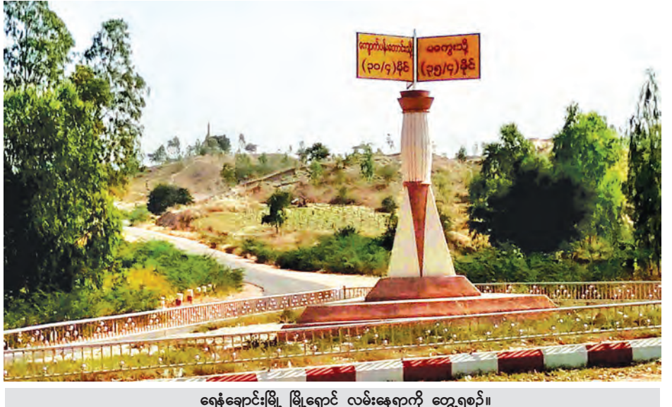
ရေနံချောင်းမြို့ မြို့ရှောင် လမ်းနေရာကို တွေ့ရစဉ်။