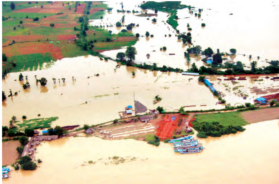
ကလေးဒေသ ရေကြီးရေလျှံမှုများဖြစ်ပေါ်စဉ်က ရေလွှမ်းစေရိယာများကို တွေ့ရစဉ်။

* ရှေ့မှ ဆည်မြောင်းဌာနကပါ”ဟု ၎င်းက ပြောသည်။ ရေကြောင်း တိုင်းတာရေး လုပ်ငန်းများတွင် ဦးစားပေး(၁) ကလေးဝါမြို့၊ မြစ်ဆုံမှ ပြင်သာရွာ (ကလေးမြို့)ထိ ၂၅ မိုင်၊ ဦးစားပေး (၂)အဖြစ် ပြင်သာရွာ(ကလေးမြို့)မှ တင်တားရွာ (မင်္ဂလာမြစ်ဝ)အထိ ၃၅ မိုင်၊ ဦးစားပေး(၃)အဖြစ်