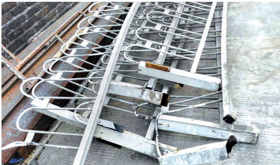
ယာဉ်တိုက်၍ ပြုတ်ထွက်ပျက်စီးသွားသည့်သံပန်းများ။