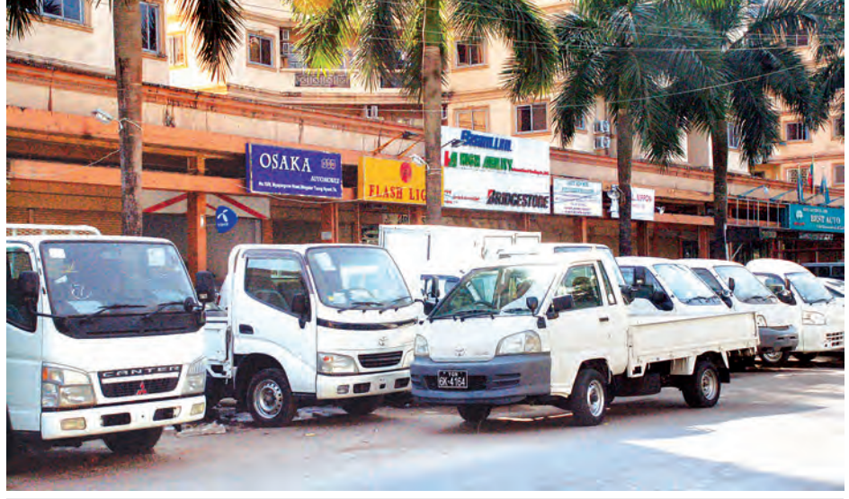
ကားအရောင်းအဝယ်မော်တော်ယာဉ်ပြခန်းတစ်ခု၌ ပြသထားသည့် ယာဉ်များကိုတွေ့ရစဉ်။