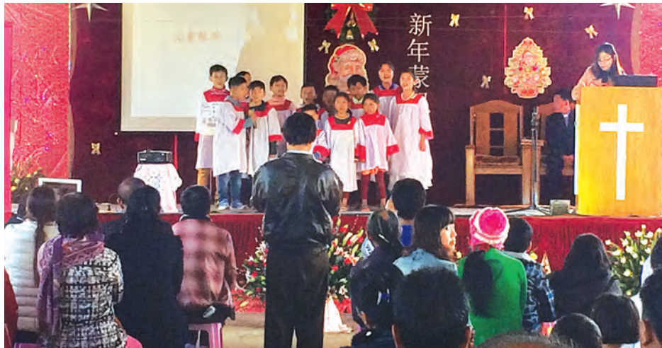
လားရှိုးမြို့ တက္ကသိုလ်လမ်း လားရှိုးမက်သဒစ်အသင်းတော်ကျောင်းခန်းမ၌ ခရစ္စမတ်နေ့အထိမ်းအမှတ် မေတ္တာပို့ဆုတောင်းပွဲ ကျင်းပစဉ်။