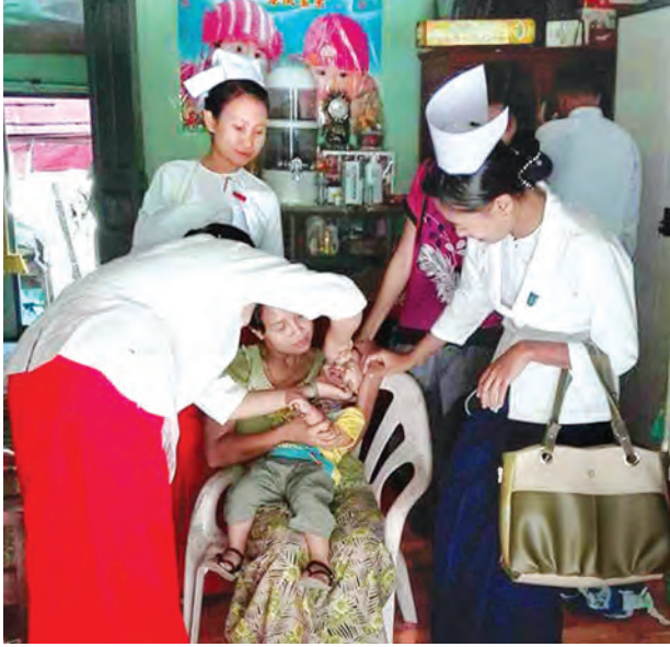
ကျန်းမာရေးဝန်ထမ်းများက ကလေးငယ်တစ်ဦးအား ပိုလီယိုကာကွယ်ဆေး တိုက်ကျွေးနေစဉ်။

အိမ်တိုင်ရာရောက် ကောက်သင်းကောက် ပိုလီယိုကာကွယ်ဆေးကို ဒီဇင်ဘာ ၅ ရက်မှ ၇ ရက်အထိ ရခိုင်ပြည်နယ်အတွင်းရှိ မြို့နယ် ၁၀ မြို့နယ်နှင့် နယ်နိမိတ်ချင်းထိစပ်သော ချင်းပြည်နယ်၊ ဧရာဝတီတိုင်းဒေသကြီး၊ ပဲခူးတိုင်းဒေသကြီး၊ မကွေးတိုင်းဒေသကြီးရှိ မြို့နယ်တချို့တွင် အသက်ငါးနှစ်အောက် ကလေးငယ်များကိုတိုက်ကျွေးခဲ့ပြီး တိုက်ကျွေးနေစဉ်ကာလမှာပင် လက်ရှိတွေ့ရှိထားသော ပိုလီယိုရောဂါအသွင်ပြောင်း ဗိုင်းရပ်စ်သည် ကူးစက်မြန် ဗိုင်းရပ်စ်တစ်မျိုးဖြစ်ကြောင်း၊ ထပ်မံသိရှိရသဖြင့် ဒုတိယအကြိမ်တွင် ရခိုင်ပြည်နယ်ရှိ မြို့နယ်အားလုံးတွင် အသက် ငါးနှစ်အောက်ကလေးငယ်များနှင့် ပိုလီယိုအသွင်ပြောင်း ရောဂါတွေ့ရှိရာ မောင်တောမြို့နယ် ယင်းနှင့် နီးစပ်ရာ ဘူးသီးတောင်မြို့နယ်တွင် အသက် ၁၀နှစ်အောက် ကလေးများကိုပါ တိုက်ကျွေးသွားမည်ဖြစ်ကြောင်းသိရသည်။