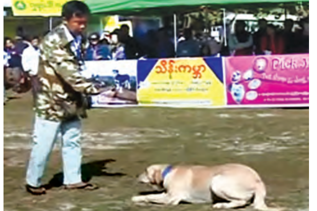
အိမ်မွေးမွေးတစ်ကောင် ပြိုင်ပွဲဝင်နေစဉ်။

မန္တလေးတိုင်းဒေသကြီး မွေးမြူရေးနှင့် ကုသရေးဦးစီးဌာန၊ မြန်မာနိုင်ငံ မွေးမြူရေးလုပ်ငန်းအဖွဲ့ချုပ်နှင့် အိမ်မွေးတိရစ္ဆာန်မွေးမြူသူများအသင်းတို့ ပူးပေါင်းကျင်းပသည့် (၁၁) ကြိမ်မြောက် မွေးမြူရေးဆိုင်ရာပြပွဲနှင့် (၅)