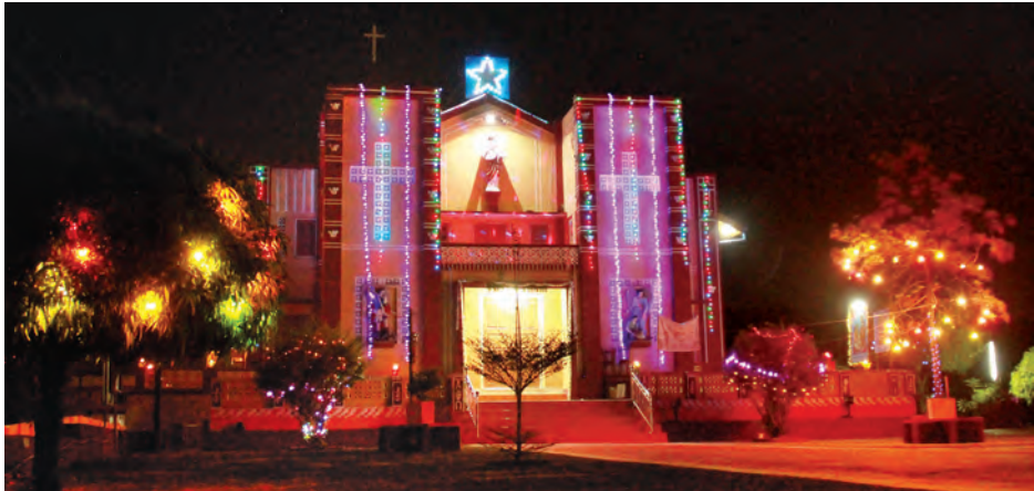
တောင်ငူမြို့ ဗိုလ်မှူးဖိုးကျွန်းလမ်း ကေတုမတီမုခ်ဦးအနီးရှိ ရွှေနန်းတော်ကန်သလစ်ဘုရားကျောင်းတွင် ခရစ္စမတ်နေ့ မီးရောင်စုံများ ထွန်းညှိထားရှိသည်ကို ဒီဇင်ဘာ ၂၅ ရက်က တွေ့ရစဉ်။