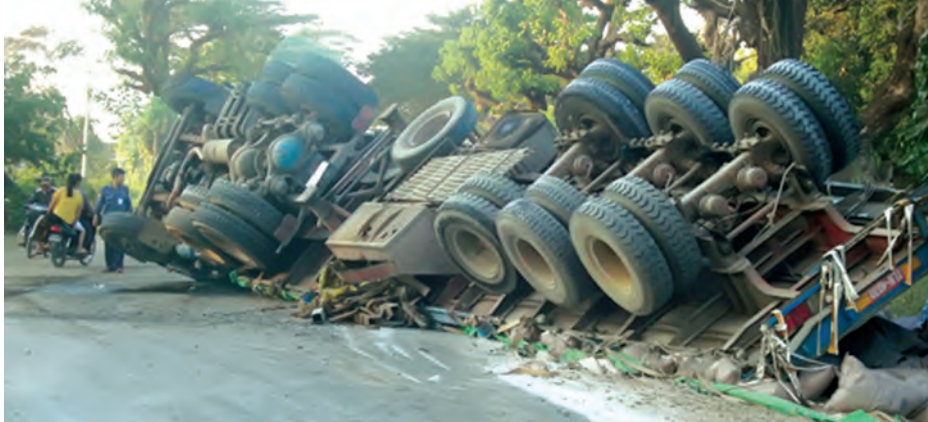
ပဲခူးတိုင်းဒေသကြီးကျောက်တံခါးမြို့နယ်သာယာကျွန်းကျေးရွာ မြောက်ဘက်ထိပ် ရန်ကုန်-မန္တလေး(လမ်းဟောင်း) မိုင်တိုင်အမှတ် (၁၀၉/၆) အနီးတွင် ဒီဇင်ဘာ ၂၄ ရက် ညနေပိုင်းက လမ်းမကြီးအတိုင်း တောင်မှမြောက်သို့ မောင်းနှင်လာသော ၆C/-----ဟွန်ဒါအပြာရောင် ၂၂ ဘီးသကြားအိတ်တင်ဆောင်လာသည့်ကုန်တင်ယာဉ် နှင့် မြောက်မှတောင်သို့မောင်းနှင်လာသောခြောက်ဘီးကုန်မျိုးစုံတင်ဆောင်လာသည့် ၆က/---နီဆန် ခဲရောင် ကုန်တင်ယာဉ်နှစ်စီးတို့ ပွတ်တိုက်မှုဖြစ်ပွားပြီး ၂၂ ဘီးယာဉ်တုံးလုံးလဲနေသည်ကို တွေ့ရစဉ်။