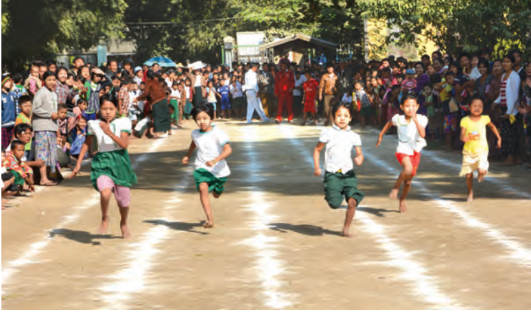
နေပြည်တော်ကောင်စီနယ်မြေ တပ်ကုန်းမြို့နယ် ကျောင်းပေါင်းရုံ လွတ်လပ်ရေးနေ့ အထိမ်းအမှတ် အားကစားပြိုင်ပွဲနှင့် ဘောလုံးပြိုင်ပွဲကို အထက(၁)နှင့် အထက(၂)ကျောင်းဝင်း အတွင်း ကျင်းပလျက်ရှိရာ ဒီဇင်ဘာ ၂၅ ရက်က အခြေခံပညာအထက်တန်း၊ အလယ်တန်း၊ မူလတန်းကျောင်းများမှ ကျောင်းသား ကျောင်းသူများ စီတာ ၁၀၀ ပြေးပွဲယှဉ်ပြိုင်နေကြစဉ်။