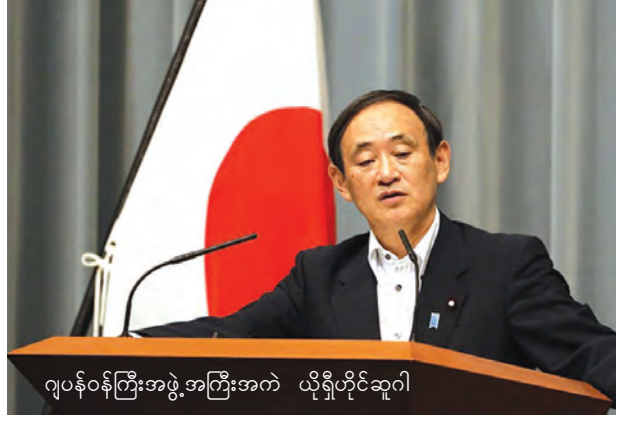
ဂျပန်ဝန်ကြီးအဖွဲ့အကြီးအကဲ ယိုရှိဟိုတိုဆူဂါ