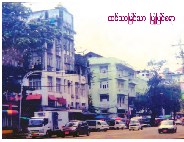
ထင်သာမြင်သာ ပြုပြင်စရာ