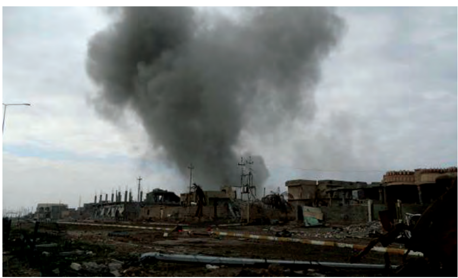
ရာမဒီမြို့ကို လေကြောင်းမှတိုက်ခိုက်မှု မြင်ကွင်းအားတွေ့ရစဉ်။

ရာမဒီ ဒီဇင်ဘာ ၂၅ အစိုးရတပ်များ အီရတ် အနောက်ပိုင်းမြို့ကို ပြန်လည်သိမ်းယူ ရေးတွင် စစ်ကူပေးသည့်အနေဖြင့် ညွှန်ပေါင်းအဖွဲ့ လေယာဉ်များက ကြာသပတေးနေ့တွင် အိုင်အက်စ် ထိန်းချုပ်ထားသော နေရာများကို ဗုံးကြဲ တိုက်ခိုက်လျက်ရှိကြောင်း ရိုက်တာသတင်းတစ်ရပ်တွင် ဖော်ပြ သည်။