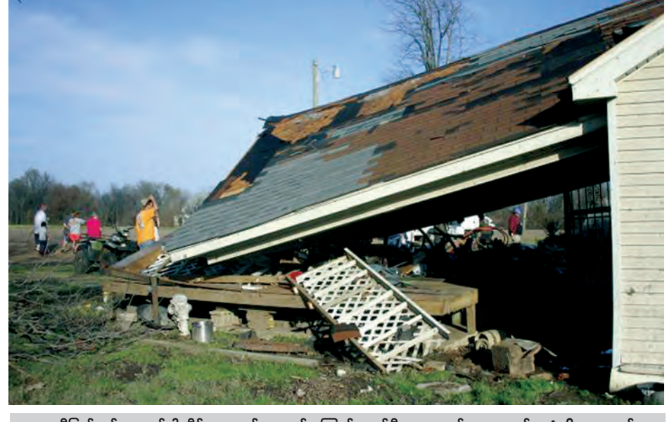
မစ္စူပီပြည်နယ် ကလပ်ဒါလီ၌ လေဆင်နှာမောင်းကြောင့် ပျက်စီးမှုများသည့် အဆောက်အအုံကို တွေ့ရစဉ်။