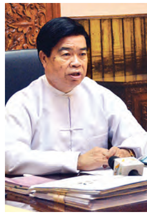
ရန်ကုန်မြို့တော်ဝန် ဦးလှမြင့် ရှင်းလင်းပြောကြားစဉ်။

များ၏ မှတ်တမ်းမှတ်ရာ အချက် အလက်များနှင့် အခွန်အခဆိုင်ရာ မှတ်တမ်းများအားလုံးကို ကိုလိုနီ ခေတ်ကတည်းက စာရွက်စာတမ်း များဖြင့် မှတ်သားပြီး သို့လျှင် ထိန်းသိမ်းခဲ့ရာ လုပ်ငန်းဆောင်ရွက် ရာတွင် အချိန်ကြန့်ကြာနှောင့်နှေး မှုများရှိခဲ့ပြီးဝန်ဆောင်မှုရယူသည့် ပြည်သူများအတွက် အဆင်မပြေမှုများ ကြုံတွေ့ခဲ့ရသည်။