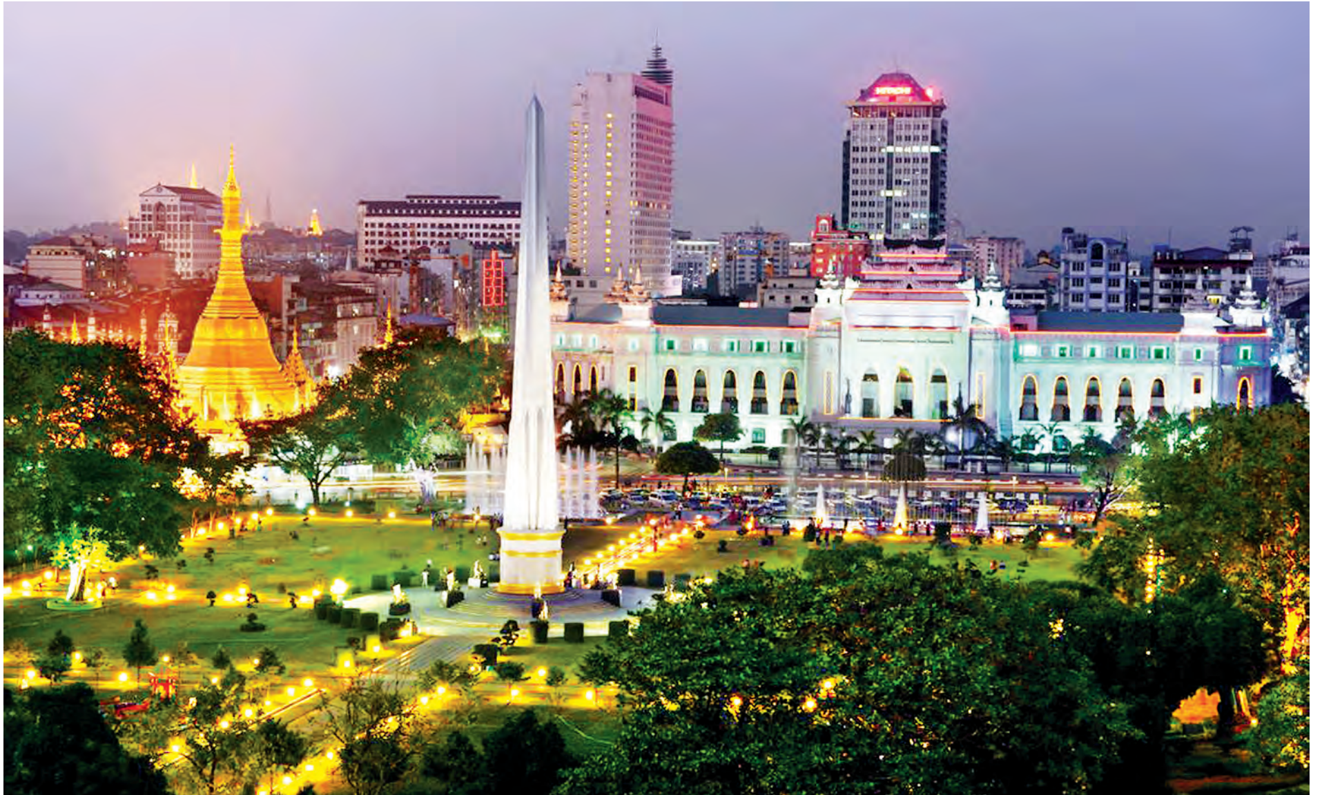
ရန်ကုန်မြို့တော်ခန်းမနှင့် ညရွာခင်းအလှကို တွေ့ရစဉ်။