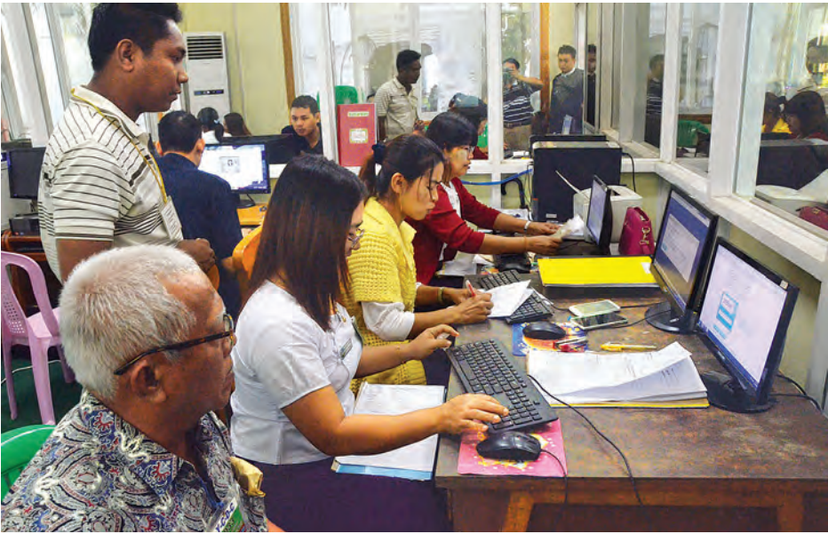
အဆောက်အအုံနှင့်ပတ်သက်၍ အွန်လိုင်းမှ ကိုယ်စားလှယ်များ လျှောက်ထားပေးစဉ်။