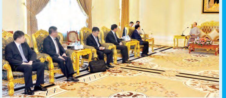
စာမျက်နှာ-၃