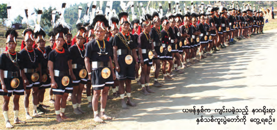
ယမန်နှစ်က ကျင်းပခဲ့သည့် နာဂရိုးရာနှစ်သစ်ကူးပွဲတော်ကို တွေ့ရစဉ်။

မှာ လဟယ်နဲ့ဆင်သေ ဒေသခံယာဉ်ပိုင်ရှင်တွေက အခမဲ့ကုသိုလ်ယူပြီး ပို့ဆောင်ပေးမှာ ဖြစ်ပါတယ်။ ပွင့်လင်းရာသီမှာ ဆင်သေကနေ လဟယ်တက်တဲ့ ယာဉ်စီးခအနေနဲ့ ခရီးသည်တစ်ဦး ငွေကျပ် ၂၅၀၀၀