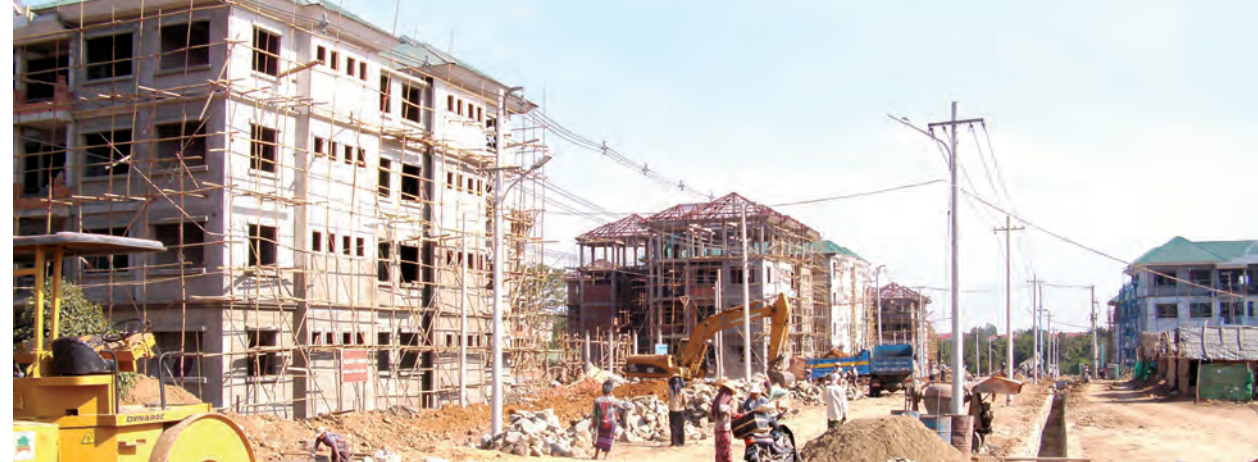
နေပြည်တော် ဒီဇင်ဘာ ၂၃

နေပြည်တော်ရှိ ဝန်ကြီးဌာနများတွင် လက်ရှိတာဝန်ထမ်းဆောင်လျက် ရှိသော နိုင်ငံ့ဝန်ထမ်းများနှင့် မိသားစုဝင်များ နေရေးထိုင်ရေးအခက်အခဲ မရှိအဆင်ပြေစေရန်အတွက် ခြောက်ခန်းတွဲလေးထပ်အိမ်ခန်းနှင့် ခန်းပါ အမှုထမ်းအိမ်ရာ RC အမျိုးအစား တိုက် ၂၁ လုံးနှင့် အမျိုးသား (လူပျိုဆောင်) RC