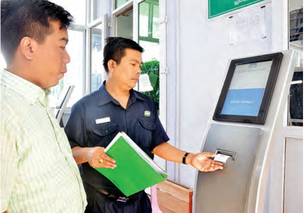
အဆောက်အအုံနှင့်ပတ်သက်၍ လျှောက်ထားသူများ တိုက်ခံပါတီ ထုတ်ယူနေမှုကို တွေ့ရစဉ်။

“၂၀၁၂ခုနှစ်မှာ Yangon City Website ကိုတင်ခဲ့ပါတယ်။ ဒါပေမယ့် နည်းပညာ မပြည့်စုံတာရော ကျွမ်းကျင်ဝန်ထမ်း နည်းတာကြောင့်ပါ သတင်းအချက်အလက် ပြန်ကြားပေး တဲ့အဆင့်လောက်သာ လုပ်နိုင်ခဲ့ပါ တယ်။ နောက်ပိုင်းမှာ ပြည်တွင်း ပြည်ပ နည်းပညာကုမ္ပဏီတွေနဲ့ ပူးပေါင်းပြီး ဝန်ထမ်းတွေကို အဆင့် မြှင့်တင်တာတွေ တောက်လျှောက် လုပ်ခဲ့ပါတယ်။ တစ်ဖက်မှာလည်း ကော်မတီရဲ့ ဝက်ဘ်ဆိုက်ကနေ နေ့စဉ်လှုပ်ရှားမှုတွေကို နာရီမလပ် ထုတ်ပြန်နိုင်အောင် ကြိုးပမ်းခဲ့ပြီး အွန်လိုင်းဝန်ဆောင်မှုတွေကို စတင် ခဲ့ပါတယ်။ အွန်လိုင်းဝန်ဆောင်မှုမှာ လည်း ရန်ကုန်မြို့တော် စည်ပင်သာ ယာရေးကော်မတီရဲ့ ငှာနအသီးသီး ချိတ်ဆက်မှု၊ မှတ်တမ်းမှတ်ရာ တွေကို ဒစ်ဂျစ်တယ်စနစ်နဲ့ သို့လျှင် သိမ်းဆည်းမှု၊ မှတ်တမ်းမှတ်ရာတွေ ရယူသုံးစွဲရာမှာလည်း Computerized စနစ် တစ်ခုလုံးအစားထိုးနိုင် အောင် အဆင့်ဆင့်ကြိုးပမ်းခဲ့တဲ့ အတွက် အခုအချိန်မှာ အများကြီး အောင်မြင် ပြောင်းလဲလာခဲ့ပါတယ်” ဟု ရန်ကုန်မြို့တော်ဝန် ဦးလှမြင့်က ပြောကြားသည်။