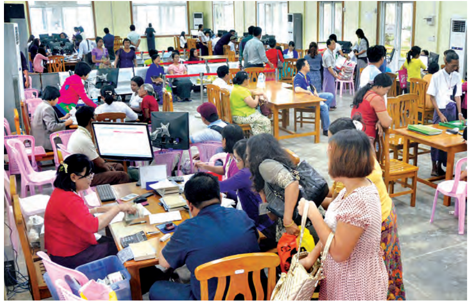
ရန်ကုန်မြို့တော်စည်ပင်သာယာရေးကော်မတီ မြို့ပြစီမံကိန်းနှင့် မြေစီမံခန့်ခွဲမှုဌာနတွင် ဆောင်ရွက်နေသည့် OSS ခန်းမကို တွေ့ရစဉ်။

ထိုကဲ့သို့ ဆောင်ရွက်နိုင်ရေး အတွက် ရန်ကုန်မြို့တော် စည်ပင် သာယာရေးကော်မတီ၏ မှတ်တမ်း မှတ်ရာများကို စာရွက်စာတမ်းများဖြင့် သိမ်းဆည်းသည့်စနစ်မှသည် ဒစ်ဂျစ် တယ်စနစ်ဖြင့် သိမ်းဆည်းသည့်အဆင့် သို့ ကူးပြောင်းနိုင်ရေးအတွက် ကော်မတီပိုင် Data Center ကို ၂၀၁၃ခုနှစ် ဇူလိုင်လတွင် စတင်တည် ဆောက်ခဲ့သည့်အပြင် အကြောင်း အမျိုးမျိုးကြောင့် အချက်အလက် သို့လျှင်သိမ်းဆည်းမှုများ ဆုံးရှုံး မှုမရှိစေရေးအတွက် ၃၈ လမ်း၌ Backup Data Center တစ်ခုကို လုပ်ငန်းအလိုက် ငှာနအသီးသီးခွဲကာ ပြည်သူများအား ဝန်ဆောင်မှုပေး လျက်ရှိသည်။ မြို့တော်စည်ပင် သာယာနယ်နိမိတ်အတွင်းရှိ အိုးအိမ်