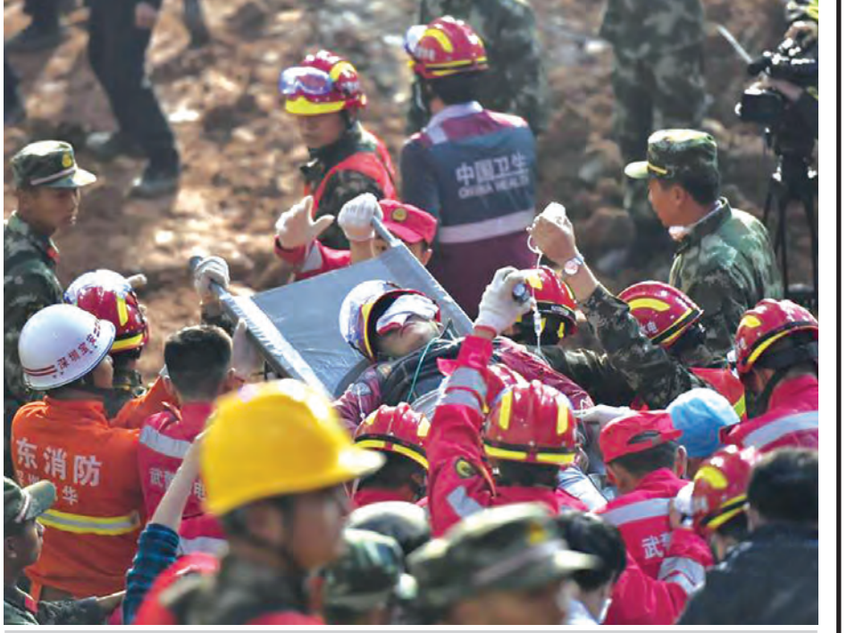
အပျက်အစီးမြေစာပုံထဲမှ ခဲရာခဲဆစ်ကယ်တင်နိုင်ခဲ့သော အသက်ရှင်လျက်ရှိသည့်တီယန်ကို တွေ့ရစဉ်။

အကောင်းဆုံး ကြိုးစားကုသမည် ဖြစ်ကြောင်း ဆေးရုံအုပ်ကြီး ဝမ်က ဆက်လက်ပြောကြားသည်။ ၎င်းသည် မြေပြိုမှုကြောင့် ပျောက်ဆုံးနေသော ၇၆ ဦးစာရင်းမှ တစ်ဦးအပါအဝင်ဖြစ်ကြောင်း သိရ သည်။ ကယ်ဆယ်ရေးသမားများနှင့် ရဲတပ်ဖွဲ့များသည် ပျက်စီးနေသော စက်ရုံအောက်ဘက် ၎င်းတည်ရှိရာ နေရာကို ဗုဒ္ဓဟူးနေ့ နံနက် ၁ နာရီ တွင် အတည်ပြုနိုင်ခဲ့ပြီး ယင်းနေ့ နံနက် ၃ နာရီခွဲတွင် ကယ်ဆယ် မှုများပြုလုပ်နိုင်ခဲ့ခြင်း ဖြစ်သည်။ (ဆင်ဟွာ)