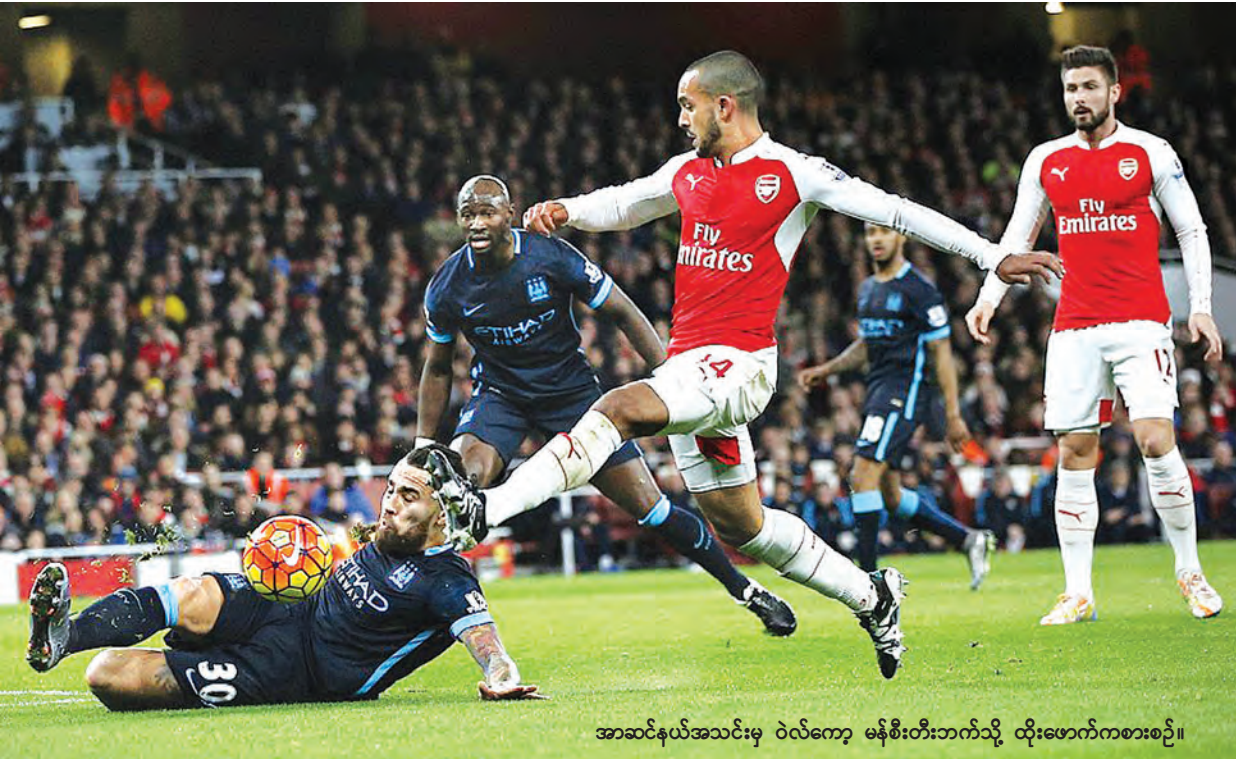
အာဆင်နယ်အသင်းမှ ဝဲလ်ကော့ မန်စီးတီးဘက်သို့ ထိုးဖောက်ကစားစဉ်။

ယင်းပြိုင်ပွဲယှဉ်ပြိုင်မည့် မြန်မာလူငယ်တင်းနစ်သမားများရွေးချယ်ရန် လူရွေးပွဲကို ဒီဇင်ဘာ ၂၈ ရက်မှ ၃၀ ရက်အထိသိမ်ဖြူတင်းနစ်ကွင်း၌ ကျင်းပမည်ဖြစ်ပြီး ဒီဇင်ဘာ ၂၆ ရက် နောက်ဆုံးထားကာ မြန်မာနိုင်ငံတင်းနစ်အဖွဲ့ချုပ်သို့ မှတ်ပုံတင် (သို့မဟုတ်) မွေးစာရင်းမိတ္တူနှင့်အတူ လာရောက်စာရင်းပေးသွင်းနိုင်သည်။ လူရွေးပွဲယှဉ်ပြိုင်မည့် တင်းနစ်အားကစားသမားများမှာ ၂၀၀၂ ခုနှစ် ဇန်နဝါရီလနောက်ပိုင်း မွေးဖွားသူများဖြစ်ရမည်ဖြစ်ပြီး အသေးစိတ် သိရှိလိုပါက ဖုန်း ၀၁-၃၇၂၃၆၀ နှင့် ၀၉-၂၅၀၀၇၀၄၀ တို့သို့ဆက်သွယ် မေးမြန်းနိုင်ကြောင်း သိရသည်။ မိုးသော်ဇင်