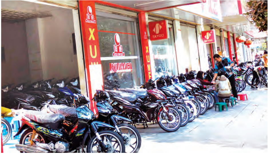
မူဆယ်-ကျယ်ဂေါင် နယ်စပ်ဒေသရှိ ဆိုင်ကယ်ရောင်းဝယ်ရေးဆိုင်များကို တွေ့ရစဉ်။

မူဆယ် ဒီဇင်ဘာ ၂၂ ရှမ်းပြည်နယ်(မြောက်ပိုင်း)မူဆယ်ခရိုင် တရုတ်နိုင်ငံ နယ်စပ် မူဆယ်မြို့၌ ဆိုင်ကယ်သစ်ရောင်းသူများနှင့် ကုန်ရောင်း/ကုန်ဝယ်သမားများ ယခုရက်ပိုင်းအတွင်း ငွေဈေးမြင့်တက်မှုကြောင့် သိသိသာသာလျော့နည်း သွားကြောင်း သိရသည်။ အဆိုပါ ဆိုင်ကယ်ရောင်းချသူများနှင့် ကုန်ရောင်း/ ကုန်ဝယ်သမားများ လျော့နည်းသွားခြင်းမှာ တရုတ် ငွေဈေး အသစ်တန်မြင့်တက်သွားခြင်း၊ နယ်စပ်ကုန် သွယ်ရေးမို့တိုင်းအဖွဲ့မှ ဖမ်းဆီးစစ်ဆေးခြင်း စသည့် အကြောင်းအမျိုးမျိုးကြောင့် ဖြစ်သည်။ နယ်စပ်ဒေသ မူဆယ်-ကျယ်ဂေါင်၊ ဝမ်တီနီ၊ ရွှေလီမြို့များတွင် မြန်မာပြည်အနယ်နယ်အရပ်ရပ်မှ ခရီးသွားပြည်သူများ၊ ဆိုင်ကယ်ဝယ် ရောင်းချသူများ၊ ကုန်ရောင်း/ကုန်ဝယ်သမားများနှင့် စည်ကားလျက်ရှိပြီး ယခုရက်ပိုင်း တရုတ်ငွေဈေးမြင့်တက်မှုကြောင့် ဆိုင်ကယ် ရောင်းချသူများနှင့် ကုန်ရောင်း/ကုန်ဝယ်သမားများ နည်းပါးသွားပြီး နယ်စပ် မူဆယ်-ကျယ်ဂေါင်မြို့များ၌ လူစည်ကားမှုမရှိတော့သည့်အပြင် ဒေသခံ ဈေးဆိုင်ခန်း များမှာလည်း အရောင်းအဝယ်ကျဆင်းသွားသည်အထိ ဖြစ်သည်။ တရုတ်နိုင်ငံ ကျယ်ဂေါင်မြို့ရှိ ဆိုင်ကယ်ဈေးကွက် များမှာ ကမ်ဘို(R-125)ဆိုင်ကယ်တစ်စီးကို တရုတ်ယွမ်