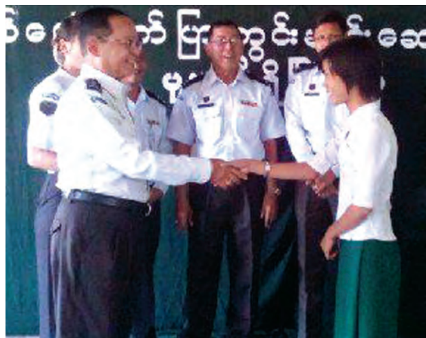
နေပြည်တော်ကောင်စီနယ်မြေ ပုဗ္ဗသီရိမြို့နယ်အတွင်းရှိ အထက (ကျည်တောင်ကန်)ကျောင်းမှ ကျောင်းသားကျောင်းသူများကို ပုဗ္ဗသီရိမြို့နယ် လဝကဦးစီးဌာနမှူးက နိုင်ငံသားစိစစ်ရေးကတ်ပြားများကို ဒီဇင်ဘာလ ၃ရက်ယပတ်က ကွင်းဆင်းဆောင်ရွက်ပေးခဲ့စဉ်။