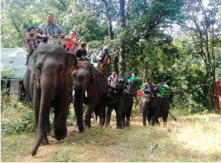
ယမန်နှစ်က ဘုရားဖူးလာပြည်သူများကို တွေ့ရစဉ်။

ဘုရားဖူးရာသီလမ်း ရက်ပြောင်းရွှေ့ဖွင့်လှစ်မည့် အခြေအနေနှင့်ပတ်သက်ပြီး အလောင်းတော်ကဿပအမျိုးသားဥယျာဉ်မှ တာဝန်ရှိသူတစ်ဦးက “ပြည်တွင်းပြည်ပနဲ့ အနယ်နယ် အရပ်ရပ်က ဘုရားဖူးလာသူတွေ စိတ်အေးချမ်းသာစွာ လာရောက်ဖူးမြော်နိုင်ရေးအတွက် ထပ်မံပြင်ဆင်ဖို့ အနည်းငယ်ရှိသေးလို့ လမ်းဖွင့်မယ်ရက်ကို နောက်ဆုတ်ထားပါတယ်။ ဒီဇင်ဘာ ၂၇ ရက် လောက် တော့ဖွင့်ဖြစ်မယ်လို့ ခန့်မှန်းထားပါတယ်။ ဥယျာဉ်ထိန်းသိမ်းရေးလုပ်ငန်းတွေအပြင် ဘုရားဖူးလာ မိဘပြည်သူ