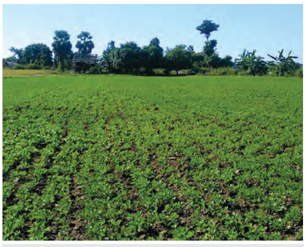
အောင်မြင်ဖြစ်ထွန်းနေသော မြေပဲစိုက်ခင်းတစ်ခုစင်။