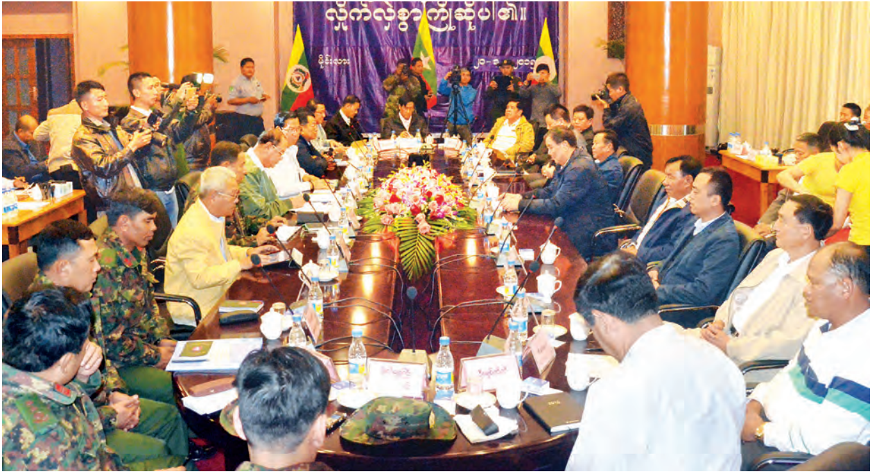
ပြည်ထောင်စုငြိမ်းချမ်းရေးဖော်ဆောင်ရေးလုပ်ငန်းကော်မတီ ဒုတိယဥက္ကဋ္ဌ ဦးသိန်းဇော်နှင့်အဖွဲ့ မိုင်းလားအထူးဒေသ(၄)ဥက္ကဋ္ဌ ဦးစိုင်းလင်း ဦးဆောင် သောအဖွဲ့နှင့် ငြိမ်းချမ်းရေးလုပ်ငန်းစဉ်များ ဆွေးနွေးစဉ်။

စိုက်ပျိုးရေး၊ သဘာဝပတ်ဝန်းကျင် ထိန်းသိမ်းရေး၊ မူးယစ်ဆေးဝါးနှိမ်နင်း ရေး၊ လမ်းတံတား၊ လျှပ်စစ်၊ ဟိုတယ် နှင့်ခရီးသွားလုပ်ငန်းများ ဖွံ့ဖြိုး တိုးတက်မှုအခြေအနေနှင့် လိုအပ် ချက်များကို ရှင်းလင်းတင်ပြသည်။ ထို့နောက် ပြည်ထောင်စု ငြိမ်းချမ်းရေးဖော်ဆောင်ရေးလုပ်ငန်း ကော်မတီ ဒုတိယဥက္ကဋ္ဌ ဦးသိန်းဇော် က နိုင်ငံတော်အနေဖြင့် ဖက်ဒရယ် စနစ်နှင့် ဒီမိုကရေစီစနစ်တို့ကို အခြေခံသော နိုင်ငံတော်ကိုထူထောင် မည်ဟု ပြောကြားပြီးဖြစ်ပါကြောင်း၊ ထို့အတူ တိုင်းရင်းသားအဖွဲ့အစည်း များအနေဖြင့်လည်း ခွဲထွက်ခြင်း မှုအားစွန့်လွှတ်ပြီး နိုင်ငံတော်အတွင်း အတူတကွ လက်တွဲနေထိုင်ကြမည် ဟု လည်းကောင်း၊ လက်နက်ကိုင်အဖွဲ့ အစည်းအားလုံးကလည်း ပြည်တွင်း ပဋိပက္ခများကို လက်နက်ကိုင်လမ်းစဉ် ဖြင့် ဖြေရှင်းမည့်အစား တွေ့ဆုံညှိနှိုင်း ခြင်းနည်းလမ်းဖြင့် အဖြေရှာကြမည် ဟုလည်းကောင်း အတွေးအခေါ် ပြောင်းလဲခဲ့ပြီဖြစ်ကြောင်း။ နိုင်ငံရေးပဋိပက္ခများကို နိုင်ငံရေး စားပွဲဝိုင်းတွင်သာ အဖြေရှာကြရ မည်ဖြစ်ပါကြောင်း၊ လာမည့်ဇန်နဝါရီ ၁၂ ရက်တွင် ပြည်ထောင်စုအဆင့် တွေ့ဆုံဆွေးနွေးပွဲ ဆောင်ရွက်ရန် ရှိပါကြောင်း၊ မိုင်းလားအထူးဒေသ(၄) အဖွဲ့ကိုလည်း အထူးဧည့်သည်တော် အဖြစ် တက်ရောက်နိုင်ရန် ဖိတ်ကြား ပါကြောင်း၊ ငြိမ်းချမ်းရေးလုပ်ငန်းစဉ် ဆောင်ရွက်ရာတွင် နိုင်ငံတော် အနေဖြင့် မည်သည့်အဖွဲ့ကိုမျှ ချန်ထားခဲ့ရန်မရှိပါကြောင်း၊ အချို့ အဖွဲ့အစည်းများနှင့် သီးခြားဆောင်