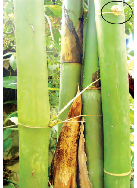
ငလိုက်ကြီးဝိုင်း အကွက်(၇၄)ရှိ ဝါးဘိုးမျက်ဆန်ကျယ် (ယာအစွန်ဝါးပင်၏ အဆစ်ရှိ မျက်စိအရွယ်အစားကြီးသည်ကို သတိပြုပါ။)

ဒါ့ကြောင့် သစ်တောသစ်ပင်အစား ဝါးကို ထိရောက်စွာ စိုက်ပျိုးအသုံးချ ဆောင်ရွက်နိုင်မယ်ဆိုရင် ပြည်တွင်းသစ်လိုအပ်ချက်ပြည့်မီနိုင်ပြီး သဘာဝပတ်ဝန်းကျင်ထိန်းသိမ်းရေးကိုပါ အထောက်အကူပြုလျက် ပြောင်းလဲနေတဲ့ရာသီဥတုခေတ်မှာ ကျွန်တော်တို့ ဆက်လက်ရှင်သန်နေနိုင်အောင် ရာသီဥတုပြောင်းလဲခြင်းအောက်မှာ လိုက်လံပြောင်းလဲရှင်သန်နိုင်သော၊ တစ်နည်းအားဖြင့်(Adaptive power/capacity) ရှိ