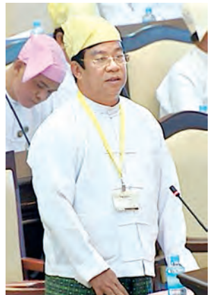
ဒုတိယဝန်ကြီး ဦးသန့်ရှင်း ဖြေကြားစဉ်။

ပထမအကြိမ် အမျိုးသားလွှတ်တော် (၁၃)ကြိမ်မြောက် ပုံမှန်အစည်းအဝေး ၁၇ ရက်မြောက်နေ့ကို ယနေ့ နံနက် ၁၀ နာရီတွင် ကျင်းပရာ အမျိုးသားလွှတ်တော် မဟာဗျူဟာ လေ့လာရေးနှင့် သုတေသနကော်မတီ၏ အစီရင်ခံစာအပါအဝင် အစီရင်ခံစာနှစ်ခု ဖတ်ကြားတင်သွင်းခြင်းနှင့် ပညာရေးကဏ္ဍဆိုင်ရာမေးခွန်းနှစ်ခု မေးမြန်းဖြေကြားခြင်းတို့ကို ဆောင်ရွက်ကြသည်။