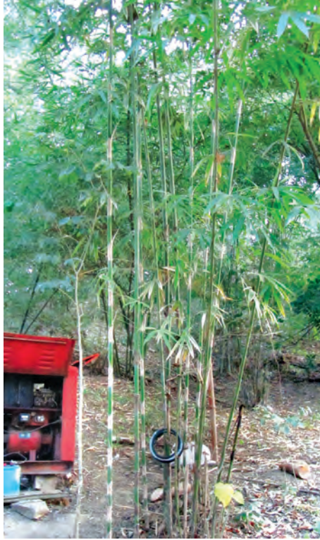
ငလိုက်ကြီးဝိုင်း အကွက်(၇၁) မိုးရွာသစ်တောသုတေသနစခန်းရှိ ကရင်ဝါး (ဝဲပုံ) နှင့် ကလွေဝါး (ယာပုံ)။

ကျွန်တော်တို့ လူသားတွေအတွက် စားဝတ်နေရေး အထောက်အပံ့ပြုတဲ့အပင်တွေဟာလည်း ရာသီဥတုအပေါ် မှီခိုနေရတော့ ရာသီဥတုပြောင်းလဲနေတဲ့ခေတ်မှာ သူတို့ရဲ့ တုံ့ပြန်မှုတွေကို သိရှိထားဖို့ လိုအပ်ပါတယ်။ သို့မှသာ စဉ်ဆက်မပြတ် ဖွံ့ဖြိုးတိုးတက်မှုရနိုင်မှာပါ။ သတင်းကောင်းဆိုတာကတော့... ရာသီဥတုပြောင်းလဲနေတဲ့ခေတ်မှာ သစ်တော သစ်ပင်၊ စိုက်ပျိုးရေးသီးနှံပင်တွေ အပါအဝင် ရာသီပြောင်းလဲခြင်းနဲ့အတူ လိုက်လံပြောင်းလဲရှင်သန်နေတဲ့ ကိစ္စနဲ့ပတ်သက်ပြီး သတင်းကောင်းလေး ပါးချင်လို့ပါ။