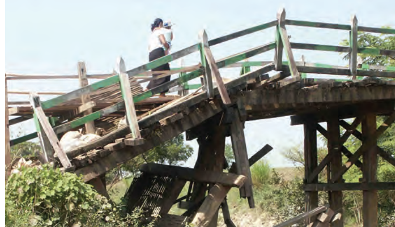
ထို့ကြောင့် ဒေသခံပြည်သူများက ကျေးရွာအများစုအတွက် အကျိုးပြုနေသည့် လိန်ပင်ချောင်းတံတားအား အန္တရာယ်ကင်းစွာ လိုရာခရီး စိတ်အေးချမ်းသာစွာ သွားလာနိုင်ရန် တံတားတစ်ခုလုံးမပျက်စီးခင် သက်ဆိုင်ရာမှ အချိန်မီ ပြန်လည်ပြုပြင်ပေးစေလိုကြောင်း သိရသည်။

ပဲခူးတိုင်းဒေသကြီး ညောင်လေးပင်မြို့နယ် ရေဖြူကန်ကျေးရွာအုပ်စု ညောင်လေးပင်-ရေဖြူကန် ကျေးရွာချင်း ဆက်လမ်းပေါ်ရှိ လိန်ပင်ချောင်း အမှတ်(၂)တံတားသည် မိုးတွင်းကာလ ရေကြီးနှစ်မြုပ်မှုကြောင့် တံတား၏ ချဉ်းကပ်ခြေသားများနှင့် အခင်းသစ်သားများ ရေတိုက်စားခဲ့ရာ စေတနာရှင်များနှင့် ကျေးရွာနေပြည်သူများ စုပေါင်း၍ အသေးစားပြုပြင်ခဲ့ခြင်းကြောင့် မိုးတွင်းကာလ၌ သွားလာနိုင်ခဲ့သည်။ ယခုအခါ အောက်ခြေတိုင်များ ကျိုးကျကာ တံတားတစ်ခြမ်းပါ ပြိုကျပျက်စီးလာသည်။ (ယာဝုံ) အဆိုပါတံတားပေါ်တွင် နေ့စဉ် သွားလာနေကြသော ကျောင်းသား ကျောင်းသူနှင့် ကျေးရွာနေပြည်သူများ အန္တရာယ်ကြားမှ သတိကြီးစွာသွားလာနေကြရသည်။ ယခုတွေ့မြင်နေရသည့် တံတားသည် အရှည် ပေ ၆၀၊ အကျယ် ၁၅ ပေရှိ သစ်သားတိုင်၊ သစ်သားအခင်းတံတားဖြစ်ပြီး ရေဖြူကန်ကျေးရွာအုပ်စု၊ ငွေးကုန်းကျေးရွာအုပ်စု၊ မိုးခို ကျေးရွာအုပ်စု၊ ဒလဆိပ်ကျေးရွာအုပ်စုနှင့် ရွှေကျင် မြို့နယ်အထိ ကျေးရွာ ၂၀ ခန့်မှ ပြည်သူများ နေ့စဉ် သွားလာနေသော အကျိုးပြုတံတားဖြစ်ကြောင်း သိရသည်။