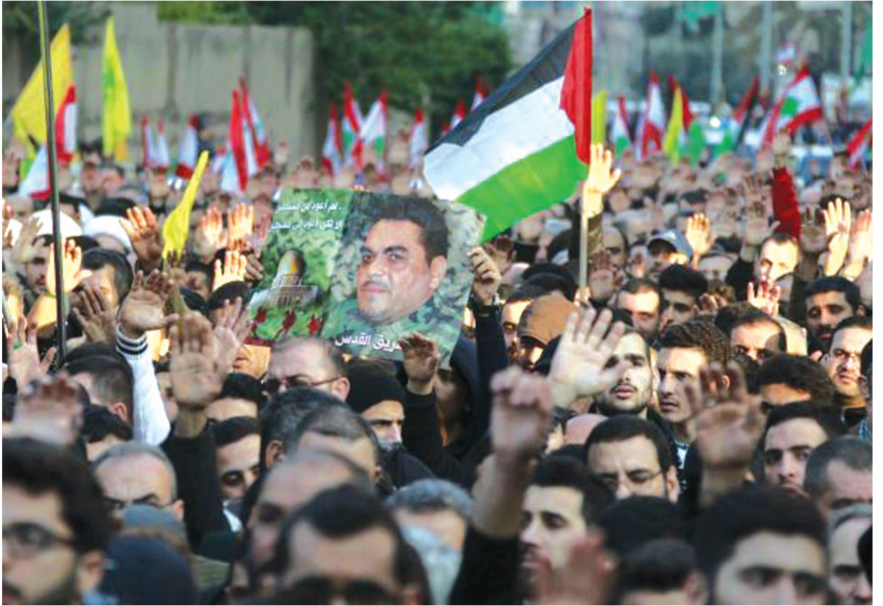
ဘေရွတ်တောင်ပိုင်းဆင်ခြေပုံ၌ ဆာမီယာကွန်တာ၏ အလောင်းကို ထမ်းလာသူများအား တွေ့ရစဉ်။

ဆီးရီးယားမြေမှ တိုက်ခိုက်မှုများပြုလုပ်ရန် စီစဉ်နေသော ၎င်းသေဆုံးမှုအတွက် အစွဲရောအား ကြိုဆိုလိုက်သည်။