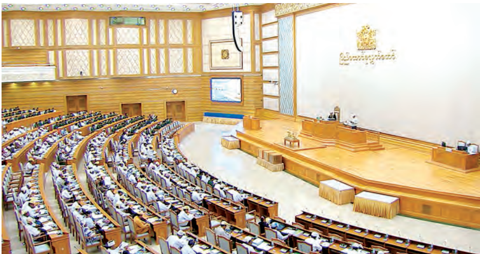
ပြည်ထောင်စုလွှတ်တော်အစည်းအဝေး ကျင်းပစဉ်။

ထို့ပြင် ကချင်ပြည်နယ်၏ စီမံကိန်းရည်မှန်းချက်တွင် ၁၁ ဒသမ ၃ ရာခိုင်နှုန်း တိုးတက်ရန်နှင့် လူတစ်ဦးချင်း ထုတ်လုပ်မှု တန်ဖိုးကျပ် ၉ ဒသမ ၄ သိန်းကျော်၊ ကယားပြည်နယ်၏ စီမံကိန်းရည်မှန်းချက်တွင် ၅ ဒသမ ၅ ရာခိုင်နှုန်း တိုးတက်ရန်နှင့် တစ်ဦးချင်းထုတ်လုပ်မှုတန်ဖိုး ကျပ် ၉ ဒသမ ၆ သိန်းကျော်၊ ကရင်ပြည်နယ်၏ စီမံကိန်းရည်မှန်းချက်တွင် ၇ ဒသမ ၇ ရာခိုင်နှုန်း တိုးတက်ရန်နှင့် တစ်ဦးချင်းထုတ်လုပ်မှုတန်ဖိုးကျပ် ၉ ဒသမ ၃ သိန်း၊ ချင်းပြည်နယ်