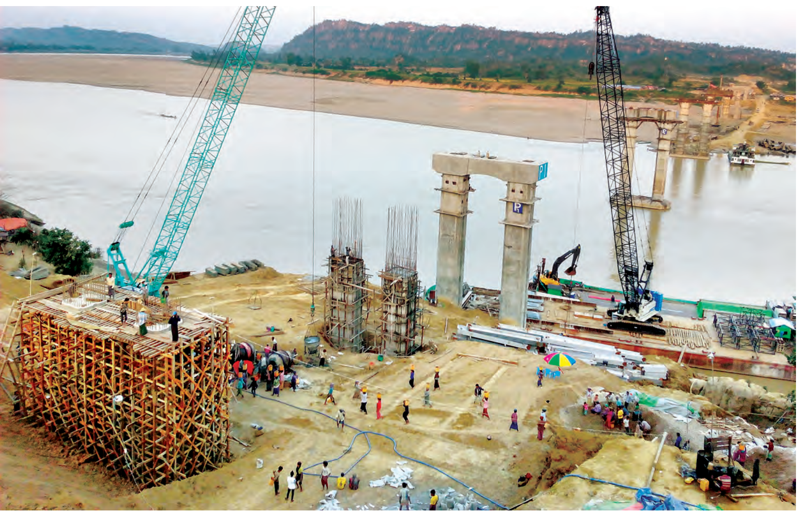
ကလေးဝချင်းတွင်းမြစ်ကူးတံတား တည်ဆောက်ရေးလုပ်ငန်းခွင်ကိုတွေ့ရစဉ်။

နေပြည်တော် ဒီဇင်ဘာ ၂၂ ပြည်ထောင်စုငြိမ်းချမ်းရေးဖော်ဆောင်ရေးလုပ်ငန်းကော်မတီ ဒုတိယဥက္ကဋ္ဌ ဦးသိန်းဇော်၊ ပြည်ထောင်စုဝန်ကြီး ဦးလှထွန်း၊ ဦးခင်မောင်စိုး၊ ရှမ်းပြည်နယ်ဝန်ကြီးချုပ် ဦးစစ်အောင်မြတ်၊ ကာကွယ်ရေးဦးစီးချုပ်ရုံး(ကြည်း)မှ ဒုတိယ ဗိုလ်ချုပ်ကြီးရာပြည့်၊ ကြိတ်ဒေသတိုင်းစစ်ဌာနချုပ်တိုင်းမှူး၊ အရှေ့မြောက်တိုင်းစစ်ဌာနချုပ်တိုင်းမှူးနှင့် တာဝန်ရှိသူ များသည် ဒီဇင်ဘာ ၂၀ ရက် မွန်းလွဲပိုင်းတွင် မော်တော်ယာဉ်များဖြင့် ရှမ်းပြည်နယ် (အရှေ့ပိုင်း) မိုင်းလားမြို့သို့ ရောက်ရှိကြရာ မိုင်းလားအထူးဒေသ(၄)ဥက္ကဋ္ဌ ဦးစိုင်းလင်း၊ ဒုတိယဥက္ကဋ္ဌ ဦးစန်ပေနှင့်တာဝန်ရှိသူများက ရင်းနှီးနှေးထွေးစွာ ကြိုဆိုနှုတ်ဆက်ကြသည်။ ထို့နောက် ပြည်ထောင်စုငြိမ်းချမ်းရေးဖော်ဆောင်ရေးလုပ်ငန်းကော်မတီ ဒုတိယဥက္ကဋ္ဌနှင့်အဖွဲ့သည် မိုင်းလား အထူးဒေသ(၄) ဥက္ကဋ္ဌ ဦးဆောင်သောအဖွဲ့နှင့် မိုင်းလားမြို့ ရွှေဟင်္သာဟိုတယ်၌တွေ့ဆုံ၍ ငြိမ်းချမ်းရေးလုပ်ငန်းစဉ်များကို ဆွေးနွေးကြသည်။ စာမျက်နှာ ၈ ကော်လံ ၁ ၀