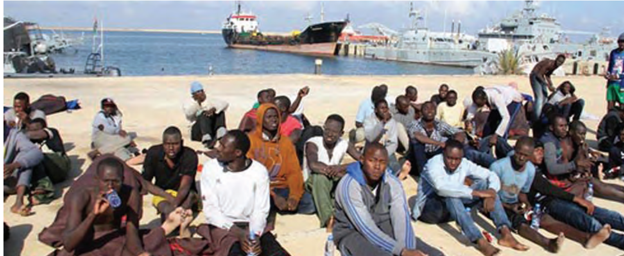
လစ်ဗျားကမ်းလွန်တွင် လှေနှစ်မြုပ်ရာမှ ကမ်းခြေစောင့်အဖွဲ့က ကယ်တင်ခဲ့သော တရားမဝင်ရွှေ့ပြောင်းဒုက္ခသည်အချို့ကို ဒီဇင်ဘာ ၂၁ ရက်က တွေ့ရစဉ်။

“နယူးဒေလီ အင်ဒီရာဂန္တီအပြည်ပြည်ဆိုင်ရာလေဆိပ်အနီးမှာ နယ်စပ်လုံခြုံရေးလေယာဉ်ပေါက်ကွဲမှုဖြစ်ပွားတဲ့သတင်းက တကယ်တော့ ရင်နှာစရာကောင်းပါတယ်။ လေယာဉ်ပေါက်ကွဲမှုပျက်ကျရာနေရာကို ချက်ချင်းသွားမယ်” ဟု အိန္ဒိယပြည်ထဲရေးဝန်ကြီး ရာဂျီနက်ဆ်ဆင်းဂျီက တွစ်တာတွင် ဖော်ပြသည်။ လေယာဉ်ပျက်ကျမှုသည် ဒေလီအနောက်တောင်ဘက် ဒွါကာမြို့ရှိ ရှာဟာဘတ်မီးရထားဘူတာရုံအနီးတွင်ဖြစ်ပွားခဲ့ခြင်းဖြစ်သည်။ အခင်းဖြစ်ပွားရာနေရာတွင် ရဲများနှင့် လုံခြုံရေးတပ်ဖွဲ့ဝင်များက သေဆုံးသူများကို ရှာဖွေနေကြောင်း သိရသည်။ (ဆင်ဟွာ)