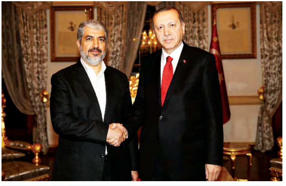
တူရကီသမ္မတ အာဒိုဂန်(ယာ)နှင့် ဟားမတ်ခေါင်းဆောင် ခါလက်မီရှာအဲတို့ ဒီဇင်ဘာ ၁၉ ရက်က အစ္စတန်ဘူလ်မြို့၌ တွေ့ဆုံစဉ်။