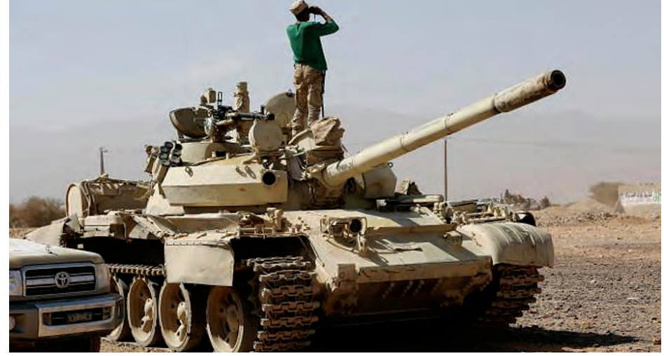
ယီမင်သမ္မတ သစ္စာခံတပ်မှ တင့်ကားတစ်စီးကို ဒီဇင်ဘာ ၁၈ ရက်က မာဂျက်ခရိုင်၌ တွေ့ရစဉ်။

အသိုင်းအဝိုင်းက ရိုက်တာသို့ပြောသည်။ ယီမင်နိုင်ငံ၌ အသစ်ထပ်မံ တိုက်ခိုက်မှုများသည် ငြိမ်းချမ်းရေး ဆွေးနွေးပွဲကို ခြိမ်းခြောက်နေပြီး