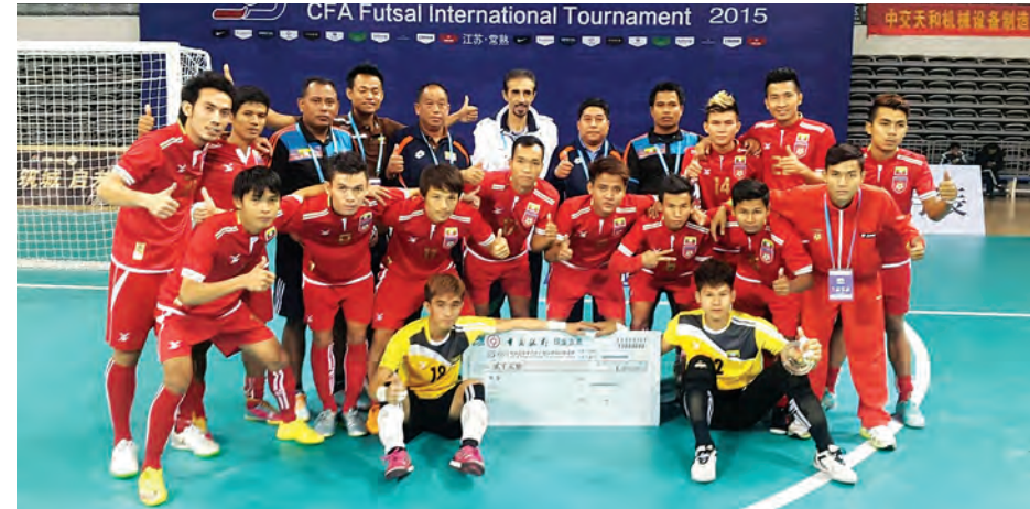
တရုတ်ဖိတ်ခေါ်ပြိုင်ပွဲ၌ တတိယနေရာရရှိခဲ့သည့် မြန်မာအသင်းကို ဆုယူအပြီးတွေ့ရစဉ်။