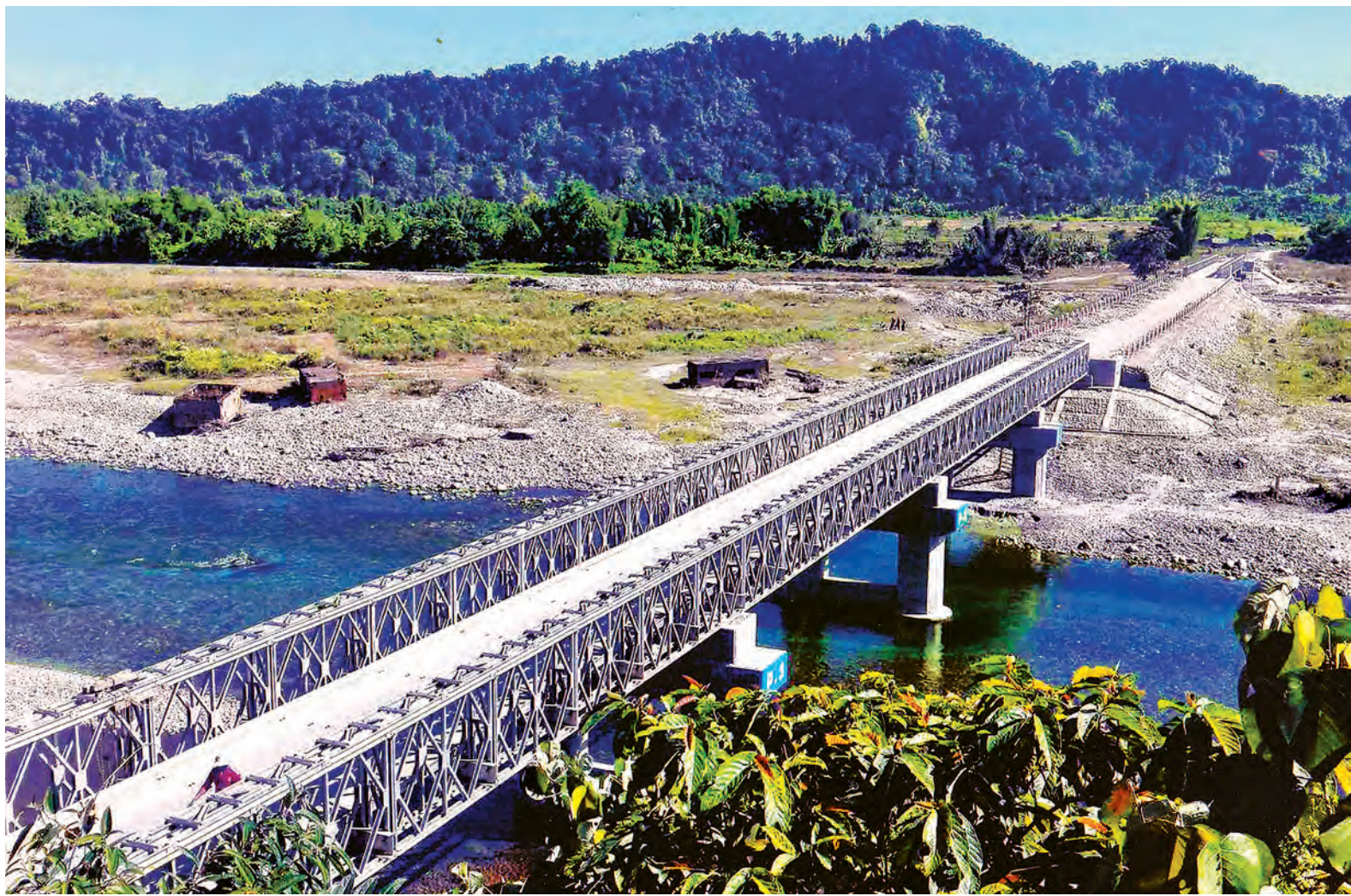
ကချင်ပြည်နယ် မြစ်ကြီးနား-ဆွမ်ပရာဘွမ်-ပူတာအို ကားလမ်းပေါ်မှ တန်ဂျာတံတား အမှတ်(၂)ကို တွေ့ရစဉ်။