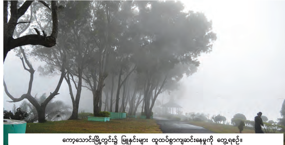
ကျော့သောင်းမြို့တွင်း၌ မြူနှင်းများ ထူထပ်စွာကျဆင်းနေမှုကို တွေ့ရစဉ်။

ပင်လယ်ပြင်၌ လှိုင်းထန်မှုကြောင့် ငါးဖမ်းလှေများ ကျော့သောင်းဆိပ်ကမ်း၌ ဆိုက်ကပ်ထားသည်ကို တွေ့ရစဉ်။