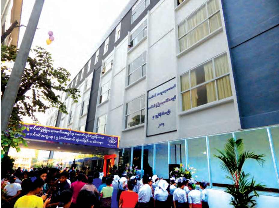
ခုတင် ၄၃၀ ဆံ့ တော်ဝင်အထူးကုသဆောင်

မြောက်ဥက္ကလာပ ဆေးရုံကြီး ဝင်းအတွင်း၌ ခုတင် ၄၃၀ ဆံ့ တော်ဝင် အထူးကုသဆောင်သစ် ကို လူနာရှင်ပြည်သူများအတွက် ဒီဇင်ဘာ ၂၀ ရက် နံနက်ပိုင်းက ဖွင့်လှစ်လိုက်ပြီဖြစ်သည်။ တော်ဝင် ဖွံ့ဖြိုးရေးဖောင်ဒေးရှင်းမှ ငွေကျပ် သိန်းပေါင်း ၅၅၀၀၀ အကုန်အကျခံ ကာ ဆောက်လုပ်လျှင်အားသော တော်ဝင် အထူးကုသဆောင်သစ်ဖွင့် ပွဲအခမ်းအနားကို ဒီဇင်ဘာ ၂၀ ရက် နံနက် ၉ နာရီက မြောက်ဥက္ကလာပ ဆေးရုံကြီးဝင်းအတွင်း၌ ကျင်းပရာ အခမ်းအနားသို့ ကျန်းမာရေးဝန်ကြီး ဌာန ပြည်ထောင်စုဝန်ကြီး ဒေါက်တာ သန်းအောင်၊ ကုသရေးဦးစီးဌာနမှ ညွှန်ကြားရေးမှူးချုပ် ပါမောက္ခ ဒေါက်တာမြင့်ဟန်၊ ကျန်းမာရေး ဝန်ကြီးဌာန အမြဲတမ်းအတွင်းဝန် ပါမောက္ခ ဒေါက်တာသက်ခိုင်ဝင်း၊ တော်ဝင်မိသားစုကုမ္ပဏီမှ စီအီးအို ဒေါ်ဝတ်ရည်ထွေးတို့ တက်ရောက် ဖဲကြီးဖြတ်ဖွင့်လှစ်ပေးခဲ့သည်။ ကျန်းမာရေးဝန်ကြီးဌာန ကုသ ရေးဦးစီးဌာနမှ ညွှန်ကြားရေးမှူးချုပ် ပါမောက္ခ ဒေါက်တာမြင့်ဟန်က “ကျွန်တော်တို့ နိုင်ငံမှာက ကူးစက် တတ်တဲ့ ရောဂါတွေထက်စာရင်