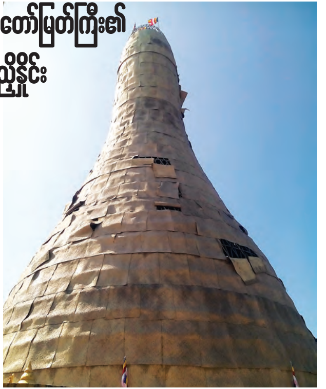
ထင်သာမြင်သာပြုပြင်စရာ

တစ်ဆူလုံးပြည့် ရွှေသင်္ကန်းကပ်လှူပူဇော်နိုင်ရေးအတွက် ငွေကျပ် ၃၂၅၇ သိန်း ကုန်ကျမည်ဖြစ်ပြီး စုစုပေါင်း အလှူခံရရှိငွေကျပ်သိန်း ၂၇၀၀ ဖြင့် လုပ်ငန်းများဆောင်ရွက်လျက်ရှိကြောင်း အလှူတော်ငွေများ လှူဒါန်းလိုပါက ၀၆၃-၅၀၀၁၊ ၀၉-၂၅၆၀၈၂၂၃ သို့ ဆက်သွယ်လှူဒါန်းနိုင်ကြောင်း သိရသည်။ (၀၂၁)