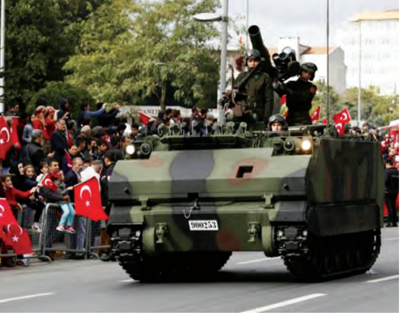
တူရကီသံချပ်ကာယာဉ်တစ်စီး အစ္စတန်ဘူလ်မြို့၌ စစ်ရေးပြနေမှုကို တွေ့ရစဉ်။

တူရကီအနေဖြင့် အဆိုပါ စစ်အခြေစိုက်စခန်းကို အခြေစိုက်ထားသော နီပင့်ပြည်နယ်မှ တပ်ဖွဲ့ဝင်အချို့ကို ဆက်လက်ရွှေ့ပြောင်းသွားမည်ဖြစ်ကြောင်း၊ သို့သော် တပ်ဖွဲ့ဝင်မည်မျှရွှေ့ပြောင်းမည်၊ မည်သည့်နေရာသို့ ရွှေ့ပြောင်းမည်ကိုမူ မပြောနိုင်ကြောင်း အဆိုပါဝန်ကြီးဌာနက ပြောသည်။ တူရကီအနေဖြင့် အိုင်အက်စ်တို့အားချေမှုန်းရန် အီရတ်ပြည်သူ့စစ်များကို လေ့ကျင့်သင်ကြားပေးနေသော ငှင်းတပ်ဖွဲ့ဝင်များအား ကာကွယ်ရန် ယခုလတွင် ဘာရှီကာအရပ်သို့ ရာနှင့်ချီသောတပ်ဖွဲ့ဝင်များ တပ်ဖြန့်ချိထားခဲ့သည်။