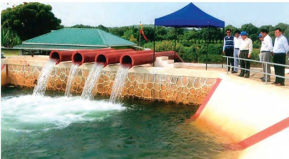
hanized Farm System အသုံးပြု ရေးညှိနှိုင်းဆောင်ရွက်ရန်၊ ကျေးရွာများ မိုးရေဖြင့် သောက်သုံးရ သို့လျှောင့်အသုံးပြုနိုင်ရေးအတွက် အမျိုးသားရေးလှုပ်ရှားမှုအသွင်ဖြင့် စည်းရုံးဆောင်ရွက်ရန်၊ ရေပေးခြင်းများ ရေပေးဝေမှုပိုမိုထိ ရောက်စေရန်အတွက် လိုင်နစ်စီခြင်းလုပ်ငန်းများအား ဦးစားပေး ဆောင်ရွက်ပြီးစီးမှုအခြေအနေ၊ မြစ်