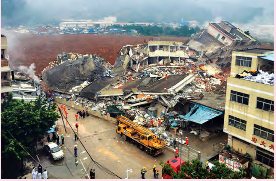
မြေပြိုမှုကြောင့် အဆောက်အအုံများပြိုကျခဲ့သဖြင့် ကယ်ဆယ်ရေးလုပ်သားများက အပျက်အစီးများကြားမှ ပျောက်ဆုံးသူများအား ရှာဖွေနေစဉ်။ လုပ်ငန်းများ ဆောင်ရွက်လျက်ရှိပြီး စံတော်ချိန် ညနေ ၅ နာရီက ခဲ့ကြောင်း သိရသည်။ ဒေသခံ ၉၀၀ ကျော်ကို ဒေသဘေးလွတ်ရာသို့ ရွှေ့ပြောင်းပေး (ဆင်ယူ)

ဖြစ်ပွားပြီးနောက် အနီးတွင်ရှိသော အနောက်မှ အရှေ့သို့သွယ်တန်းထားသည့် သဘာဝဓာတ်ငွေ့ပိုက်လိုင်း ပေါက်ကွဲမှုဖြစ်ပွားခဲ့ရာ စတုရန်းမီတာ တစ်သိန်းကျော်မှာ အပျက်အစီးများနှင့် ပြည့်နှက်သွားခဲ့သည်။ ကုမ္ပဏီအဆောက်အအုံဆီသို့ အနီးရောင်ရွှံ့များ တစ်ရိုက်ထိုးစီးဆင်းလာခဲ့ကြောင်း သို့သော် ယင်းအလုပ်လုပ်ကိုင်သည် ကုမ္ပဏီကို ထိခိုက်ခြင်းမရှိကြောင်း၊ ကုမ္ပဏီရှိ လူများအားလုံး ဘေးလွတ်ရာသို့ ရွှေ့ပြောင်းနိုင်ခဲ့ကြောင်း၊ အဆိုပါ စက်မှုဇုန်ရှိ နည်းပညာကုမ္ပဏီတစ်ခုတွင် လုပ်ကိုင်နေသော အလုပ်သမား တစ်ဦးက ပြောသည်။ ပထမဦးစွာ အဆောက်အအုံသို့ ရွံ့များမဝင်ရောက်မီ ငါးကန်အတွင်းသို့ စီးဝင်သွားကြောင်း၊ ယင်းငါးကန်မရှိလျှင် ပျက်စီးမှုမှာ ပိုများနိုင်ကြောင်း ၎င်းက ဆက်လက်ပြောပြသည်။ တရုတ်သမ္မတ ရှိကျင့်ဖျင်က ကယ်ဆယ်ရေးလုပ်ငန်းများ ချက်ချင်း ဆောင်ရွက်ရန်စေခိုင်းခဲ့ပြီး အဆိုပါ ဒေသရှိ အာဏာပိုင်များက ဒဏ်ရာရရှိသူများကို အမြန်ဆုံးကုသမှုပေးခဲ့၍ ဒဏ်ရာရသူများနှင့် သေဆုံးသူများ၏ မိသားစုဝင်များကို အားပေးနှစ်သိမ့်မှုများ ပြုလုပ်ခဲ့သည်။ မီးသတ်သမားများ၊ ရဲများနှင့် ကျန်းမာရေးဝန်ထမ်းများပါဝင်သော လူပေါင်း ၁၅၀၀ ကျော်သည် ကယ်ဆယ်ရေး