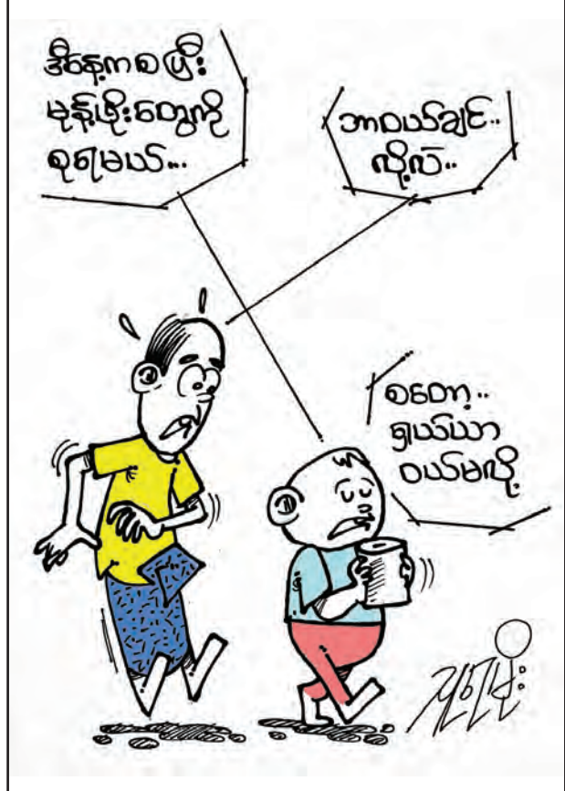
စာပေမြင့်မှ လူမျိုးတင့်မည်