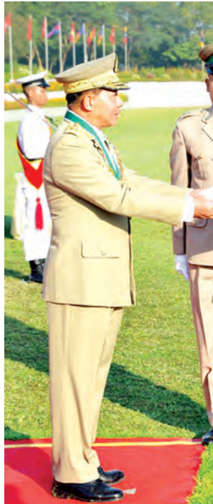
တပ်မတော်ကာကွယ်ရေးဦးစီးချုပ် ဗိုလ်ချုပ်မှူးကြီး သရေစည်သူ မင်းအောင်လှိုင် စာပေထူးချွန်ဆုရရှိသူ ဗိုလ်လောင်း ပိုင်စိုးဦးအား ဆုချီးမြှင့်စဉ်။

ကိုယ်စီကျန်းမာရေးအသိနှင့် မှန်ကန်စွာ နေထိုင်စားသောက်နိုင်ရေး ပညာပေးခြင်း၊ ရောဂါများမဖြစ်ပွားအောင် ကြိုတင်ကာကွယ်ခြင်းများကို ထိထိရောက်ရောက် ဆောင်ရွက်သွားရမည်ဖြစ်ကြောင်း၊ သမိုင်းစဉ် တစ်လျှောက်လုံး နိုင်ငံတော်နှင့်