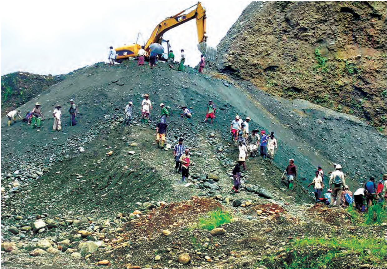
လုံးခင်း၊ ဖားကန့်ဒေသတွင် ကျောက်စိမ်းများ တူးဖော်ထုတ်လုပ်နေမှုကို တွေ့ရစဉ်။ (ဓာတ်ပုံ-သတ္တုတွင်း)

ဖြေ။ ။ ၁၉၉၅ ခုနှစ် နောက်ပိုင်းမှာ ကျောက်စိမ်းရိုင်းတူးဖော်မှုလုပ်ငန်း ကို အရွယ်အစားကြီးမားတဲ့ ကျောက်ဖောက်စက်၊ မြေကော်စက်နဲ့ မြေတူးစက် စတဲ့စက်ယန္တရားတွေကို အသုံးပြုပြီး ဟင်းလင်းဖွင့်စနစ်နဲ့ တူးဖော် ခွင့်ပြုခဲ့ပါတယ်။ တူးဖော်ရရှိတဲ့မြေစာတွေကို စက်ယန္တရားတွေအသုံးပြုပြီး ကျောက်စိမ်းရိုင်း ရှာဖွေခြင်းဖြစ်ပါတယ်။ အဲဒီလိုရှာဖွေပြီးတဲ့ မြေစာတွေကို မြေစာပုံတွေမှာ သွားရောက်စွန့်ပစ်ကြပါတယ်။ အဲဒီ စွန့်ပစ်မြေစာတွေမှာ