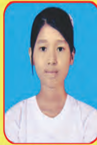
မမေမိမိမောင် ဆရာမ - ၂၉၅

အမှတ်ပေါင်း - ၅၅၁ မှတ် ဖြန့်ဖြူးပေးနိုင်ရုံအားဖြင့် (၆) လူ့စွမ်းရည်နှင့်ထက်ဝက်