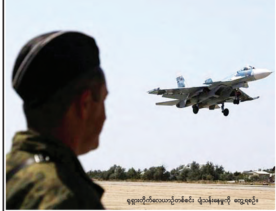
ရုရှားတိုက်လေယာဉ်တစ်စင်း ပျံသန်းနေမှုကို တွေ့ရစဉ်။

ကြာသပတေးနေ့ နောင်ပိုင်းက ပြောကြားသည်။ ရုရှားဗုံးကြဲလေယာဉ်များသည် ဗြိတိန် တိုက်လေယာဉ်များအနီး ပျံသန်းလာခြင်း၊ ရုရှားစစ်သင်္ဘောများ က ဗြိတိန်ရေပိုင်နက်အတွင်း ချဉ်းကပ်လာခြင်းတို့အပေါ် ဗြိတိန်က တိုင်တန်းမှုများ မြင့်တက်လာသည်။ ရုရှားနှင့် ဗြိတိန်လက်နက်ကိုင် တပ်များ နိုင်ငံတကာ ရေပြင်နှင့် ဝေဟင်တို့၌ မတော်တဆဖြစ်မှုများ ကို ရှောင်ရှားနိုင်ရန် ဆွေးနွေးခဲ့ကြောင်း ရုရှားကာကွယ်ရေးဝန်ကြီးဌာန၏ ကြေညာချက်တွင် ဖော်ပြသည်။ နိုဝင်ဘာ ၂၀ ရက်က ရုရှား ဗုံးကြဲလေယာဉ် (Tu-160) နှစ်စင်း အတ္တလန္တိတ်သမုဒ္ဒရာအပေါ် ဗြိတိန် ဝေဟင်ပိုင်နက် အနီး ဖြတ်သန်းသွားသဖြင့် ဗြိတိန်က စကော့တလန်ရှိ တိုင်ဖွန်းတိုက် လေယာဉ်များ ကြားဖြတ်တိုက်ရန် ချက်ချင်းပျံတက်ခဲ့ရသည်ဟု ဆိုသည်။ (ရိုက်တာ)