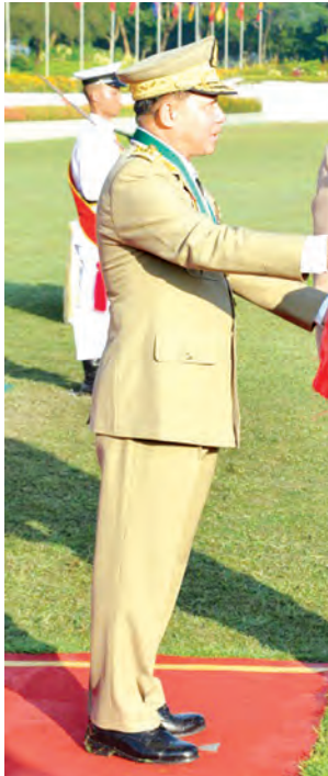
တပ်မတော်ကာကွယ်ရေးဦးစီးချုပ် ဗိုလ်ချုပ်မှူးကြီး သရေစည်သူ မင်းအောင်လှိုင် အောင်စစ်သည်ဆုနှင့် လေ့ကျင့်ရေးထူးချွန်ဆုရရှိသူ ဗိုလ်လောင်း ပြည့်ဖြိုးအောင်အား ဆုချီးမြှင့်စဉ်။

သရေစည်သူ မင်းအောင်လှိုင်က ဗိုလ်လောင်းတပ်ခွဲများ၏ အလေးပြုခြင်းကိုခံယူပြီး ကျောင်းဆင်း ဗိုလ်လောင်းတပ်ခွဲများကို စစ်ဆေးသည်။ (အပေါ်ပုံ)