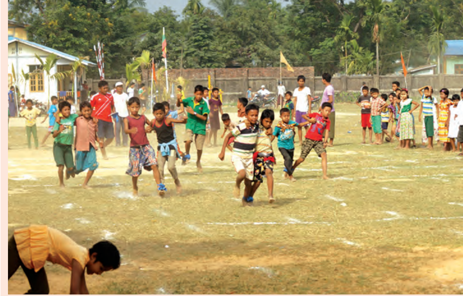
(၄၁)နှစ်မြောက် ရခိုင်ပြည်နယ်နေ့ အထိမ်းအမှတ် အားကစားပြိုင်ပွဲများ ကို ရခိုင်ပြည်နယ်နေ့ အားကစား ပြိုင်ပွဲကျင်းပရေးကော်မတီက ကြီးမှူး၍ ဘူးသီးတောင်မြို့၌ ဒီဇင်ဘာ ၁၄ ရက်မှစတင်ကျင်းပလျက်ရှိရာ ခြေထောက်ကြီးချည်အပြေးပြိုင်ပွဲတွင် ကလေးများ ပါဝင်ယှဉ်ပြိုင်နေစဉ်။ (မြို့နယ် ပြန်/ဆက်)