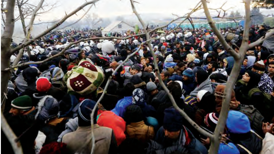
ဂရိ- မက်ဆီဒိုးနီးယားနယ်စပ် ဂရိနိုင်ငံ အိုင်ဒီမိုနီကျေးရွာအနီး ဒီဇင်ဘာ ၄ ရက်က နယ်စပ်ဖြတ်ကျော်ဝင်ရောက်ရန် စောင့်ဆိုင်းနေသော ရွှေ့ပြောင်းဒုက္ခသည်များကို တွေ့ရစဉ်။

ဂျီနီဗာ ဒီဇင်ဘာ ၁၈ ကမ္ဘာ့ရွှေ့ပြောင်း ဒုက္ခသည် အရေအတွက်သည် ဆီးရီးယား စစ်ပွဲနှင့် အခြားသော ပဋိပက္ခများကြောင့် ယခုနှစ်တွင် သန်း ၆၀ အထိ စံချိန်တင်မြင့်တက်ခဲ့ကြောင်း ကုလသမဂ္ဂက ဒီဇင်ဘာ ၁၈ ရက်တွင် ပြောသည်။ အဆိုပါ ခန့်မှန်းဒုက္ခသည်များတွင် စစ်ပွဲနှင့် ညှဉ်းပန်းနှိပ်စက်မှုများကြောင့် ထွက်ပြေးလာသူ ၂၀ ဒသမ ၂ သန်း ပါဝင်ကြောင်း၊ ယင်းမှာ ၁၉၉၂ ခုနှစ် နောက်ပိုင်း အများဆုံးဖြစ်ကြောင်း ကုလသမဂ္ဂ ဒုက္ခသည်များဆိုင်ရာ မဟာမင်းကြီးရုံး (ယူအင်န်အိတ်ချ်စီအာ)၏ ထုတ်ပြန်ချက်တစ်ရပ်တွင် ဖော်ပြသည်။ ထိုအတောအတွင်း ခိုလှုံ့ခွင့် တောင်းသူ ၂ ဒသမ ၅ သန်းနီးပါး ခိုလှုံ့ခွင့်တောင်းခံထားမှုကို ဆိုင်းငံ့ထားခဲ့ကြောင်း၊ ဂျာမနီ၊ ရုရှားနှင့် အမေရိကန်တို့က ရွှေ့ပြောင်း