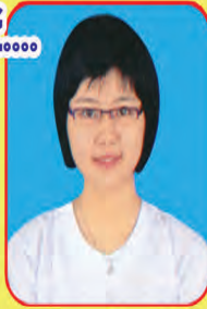
မငြိမ်းဆုသာ ဆရာမ - ၇၇

လာမည့်စာသင်နှစ် ၂၀၁၆-၁၇ အတွက် ကြိုတင်အပ်နှံနိုင်ပါပြီ။