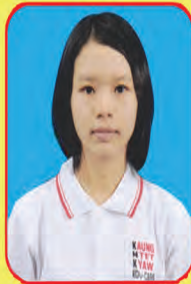
မနင်းရည်သင်း ဆရာမ - ၆၈၆

အမှတ်ပေါင်း - ၅၅၀ မှတ် ဖြန့်ဖြူးပေးနိုင်ရုံအားဖြင့် (၇)