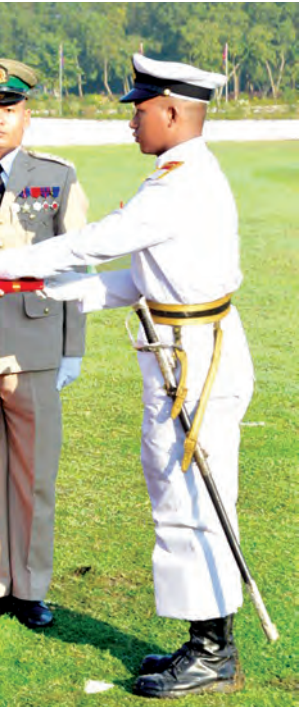
တပ်မတော်ကာကွယ်ရေးဦးစီးချုပ် ဗိုလ်ချုပ်မှူးကြီး သရေစည်သူ မင်းအောင်လှိုင် စာပေထူးချွန်ဆုရရှိသူ ဗိုလ်လောင်း ပိုင်စိုးဦးအား ဆုချီးမြှင့်စဉ်။ (မြဝတီ)

တတ်အားသရွေ့ ဆောင်ရွက်လျက် ရှိကြောင်း၊ ၂၀၁၃ ခုနှစ်မှ ၂၀၁၅ ခုနှစ် ဩဂုတ်လအထိ နိုင်ငံတစ်နံ တစ်လျားက ဒေသခံပြည်သူ ၂၇၀၅၀၀ ကို တပ်မတော်နယ်လှည့် ဆေးကုသရေးအဖွဲ့များဖြင့် ကုသပေးခဲ့ပြီး တပ်မတော်ဆေးရုံများသို့