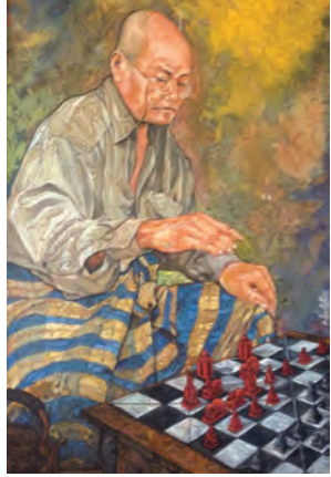
ဂုဏ်ထူးဆောင် ပန်းချီပညာရှင် ဆုရ ပန်းချီကျော်လှမောင်၏ လက်ထောက်ကထိက (ပန်းချီ)၏ လက်ရာပန်းချီကား။