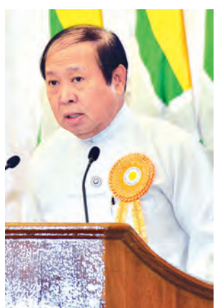
ပြည်ထောင်စုဝန်ကြီး ဦးအေးမြင့် ရှင်းလင်းပြောကြားစဉ်။

များစွာသော ရွှေ့ပြောင်းသွားလာ နေထိုင်လုပ်ကိုင်သူများသည် နိုင်ငံတွင်းနှင့် နိုင်ငံပြင်ပတွင် ၎င်းတို့၏ အခြေခံရပိုင်ခွင့်များနှင့် ပြုစုစောင့်ရှောက်မှုအနည်းဆုံးကိုသာ ရရှိပြီး အခက်အခဲများစွာနှင့် နေထိုင်လုပ်ကိုင်နေရသည့်အတွက် ၎င်းတို့၏ အတွေ့အကြုံနှင့် အသံများကို