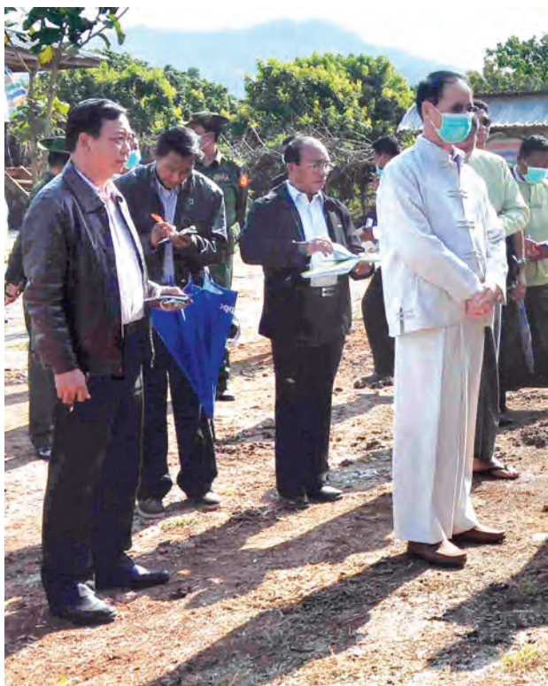
ဒုတိယသမ္မတ ဒေါက်တာ စိုင်းမောက်ခမ်း လားရှိုးမြို့နယ် မန်အိုင်ကျေးရွာရှိ ကြက်မွေးမြူရေးခြံကို ကြည့်ရှုလေ့လာစဉ်။

နေပြည်တော် ဒီဇင်ဘာ ၁၈ ပြည်ထောင်စုသမ္မတ မြန်မာနိုင်ငံတော် ဒုတိယသမ္မတ ဒေါက်တာစိုင်းမောက်ခမ်းသည် အဖွဲ့ဝင်များနှင့်အတူ ယနေ့နံနက်ပိုင်းက မြန်မာအမျိုးသား လေကြောင်းလိုင်းဖြင့် နေပြည်တော်မှ ရှမ်းပြည်နယ် (မြောက်ပိုင်း) လားရှိုးမြို့သို့ ရောက်ရှိကြသည်။ မွန်းလွဲပိုင်းတွင် ဒုတိယသမ္မတ ဒေါက်တာ စိုင်းမောက်ခမ်းသည် ဒုတိယဝန်ကြီး ဝိုင်းမျိုးချုပ် ကျော်ဇံ