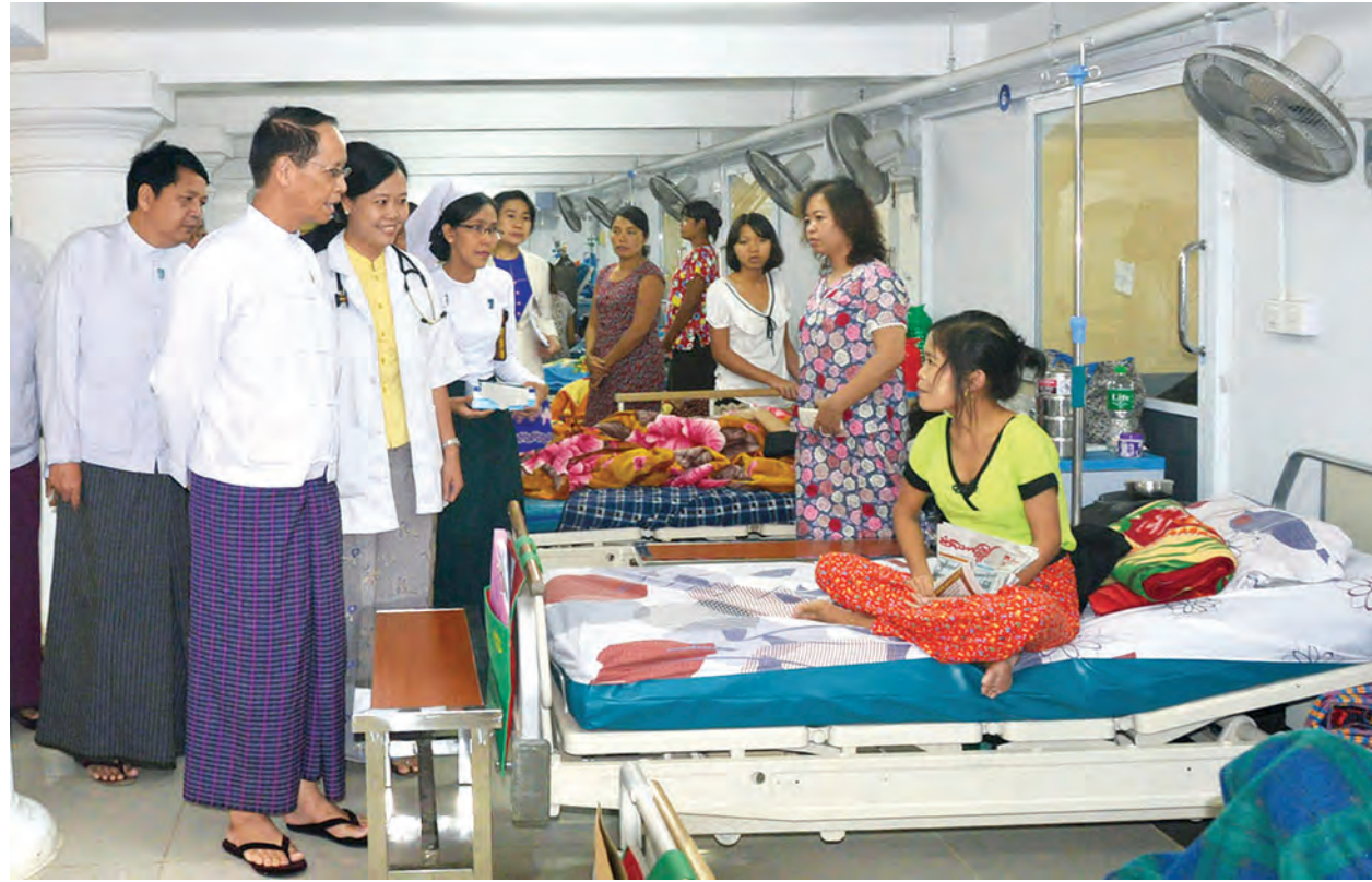
ဒုတိယသမ္မတ ဒေါက်တာ စိုင်းမောက်ခမ်း ရန်ကုန်ပြည်သူ့ဆေးရုံကြီး၌ ဆေးကုသမှုခံယူနေသော လူနာများအား ကြည့်ရှုအားပေးစဉ်။

ရာရရှိခဲ့သည့် လူနာ၏လက်ကို ကောင်းမွန်စွာ ပြန်လည်ခွဲစိတ်ကုသနိုင်မှု အခြေအနေကိုလည်း ကောင်း၊ ကြံရည်ကြိတ်စက်ညှပ်ကာ ဘယ်ဘက်လက်ချောင်း လေးချောင်း ကျိုးကြေသွားသည့် လက်ချောင်း အစားထိုး ခွဲစိတ်ကုသအောင်မြင်မှု အခြေအနေကိုလည်းကောင်း ကြည့်ရှုအားပေးသည်။ ဆက်လက်၍ ဒုတိယသမ္မတသည် ငါးထပ်ဆောင်အသစ်၊ ခွဲစိတ်