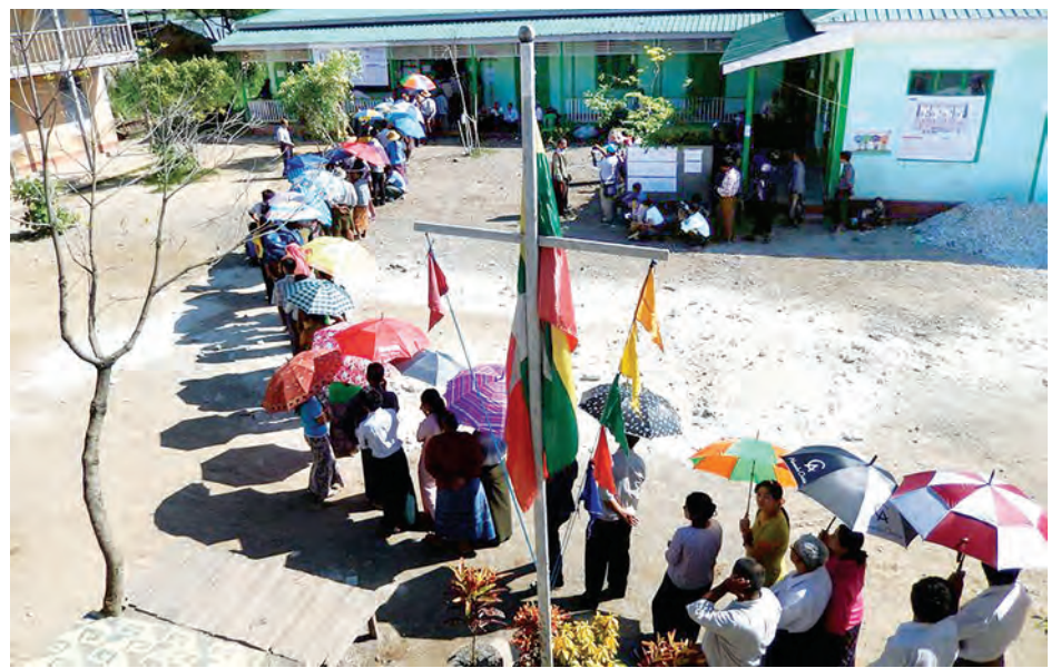
နောက်ဆုံးဆန်းစစ်ချက် မောင်ဘဦးရိုက်ကူးသည့် မဲရုံတစ်ရပ်၌ မဲပေးရန် စောင့်နေသည့် ပြည်သူများ ဓာတ်ပုံကို တွေ့ရစဉ်။

၏ပုံရိပ်များကို မှတ်တမ်းတင်သည့် ဓာတ်ပုံပြိုင်ပွဲကို ဥရောပသမဂ္ဂက ကျင်းပခဲ့ရာ ပြိုင်ပွဲဝင်ဓာတ်ပုံများအနက်မှ အကောင်းဆုံးဓာတ်ပုံဆုကို ဒီဇင်ဘာ ၂၀ ရက်တွင် ကြေညာပေးတော့မည်ဖြစ်ကြောင်း သတင်းထုတ်ပြန်ထားသည်။