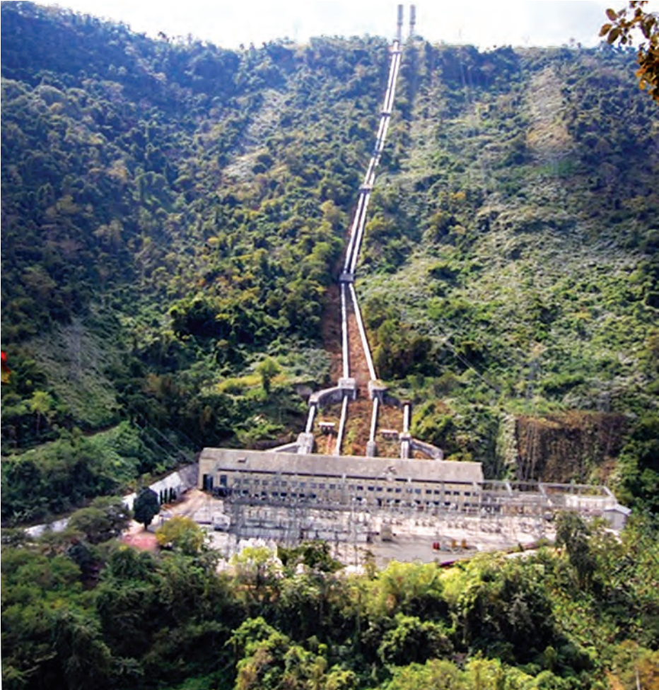
ဘီလူးချောင်းရေအားလျှပ်စစ်ဓာတ်အားပေးစက်ရုံကို တွေ့ရစဉ်။

ငွေတောင်ပြည်က ဓာတ်အားပေးစက်များ ကြံ့ခိုင်မှု မြှင့်တက်လာပြီး စက်စွမ်းအားပြည့် ပြန်လည်မောင်းနှင်နိုင်မှုနှင့်အတူ လျှပ်စစ်ဓာတ်အားများ မြန်မာ့ဓာတ်အားစနစ်သို့ ကောင်းမွန်စွာပို့လွှတ်နိုင်တော့မည်ဖြစ်၍ ဘီလူးချောင်းအမှတ်(၂)ရေအားလျှပ်စစ်ဓာတ်အားပေးစက်ရုံသည် လျှပ်စစ်ဓာတ်အားဖြန့်ဖြူးပေးခြင်းကို နှစ်ပေါင်း ၅၀ ကျော် ရွှေ့ရတုလွန်ကာလအထိ ဆောင်ရွက်ခဲ့ရာမှ အနာဂတ်ကာလ စိန်ရတုအလင်းနှစ်များဆီသို့ စဉ်ဆက်မပြတ် ဆောင်ကြဉ်းလျက်။ ။