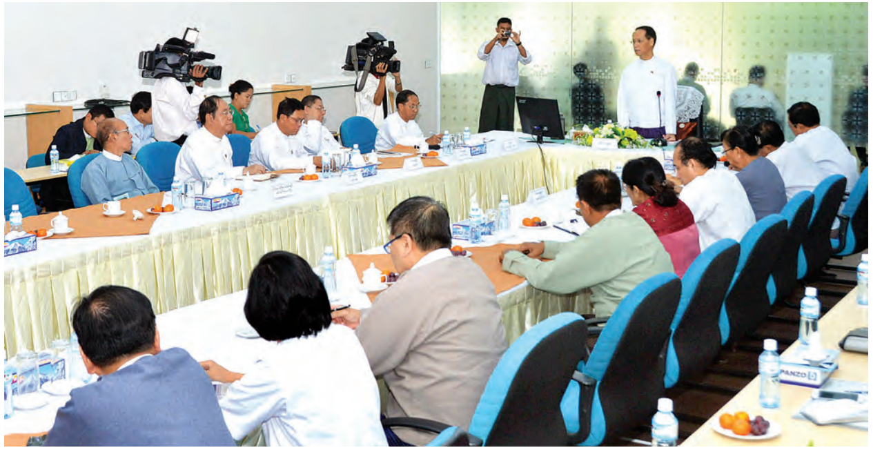
ဒုတိယသမ္မတ ဒေါက်တာ စိုင်းမောက်ခမ်း ရန်ကုန်ပြည်သူ့ဆေးရုံကြီး တိုးချဲ့ပြင်ဆင်မှုမိမိမံပြင်ဆင်ရေး လုပ်ငန်းဆက်ဆံမတီဝင်များ၊ တာဝန်ရှိသူများအား ဆွေးနွေးပြောကြားစဉ်။ (သတင်းစဉ်)

ဆောင်(၃)ရှိ လူနာများနှင့် အရေးပေါ်ကုသဆောင်ရှိ လူနာများအား ကြည့်ရှုအားပေးစကား ပြောကြားပြီး တိုးချဲ့ ၁၂ ထပ် အဆောက်အအုံဆောက်လုပ်နေမှုကို ကြည့်ရှုစစ်ဆေးကာ လိုအပ်သည်များမှာကြားသည်။ ထို့နောက် ဒုတိယသမ္မတသည် ရန်ကုန်ပြည်သူ့ဆေးရုံကြီး Training Centre ၌ ရန်ကုန်ပြည်သူ့ဆေးရုံကြီး တိုးချဲ့ပြင်ဆင်မှုမိမိမံပြင်ဆင်ရေးလုပ်ငန်းဆက်ဆံမတီဝင်များ၊ တာဝန်ရှိသူများနှင့်တွေ့ဆုံ၍ အမှာစကားပြောကြားရာတွင် ရန်ကုန်ပြည်သူ့ဆေးရုံကြီးသည် နှစ်ပေါင်း ၁၀၀ ကျော် သက်တမ်းရှိလာမှုနှင့်