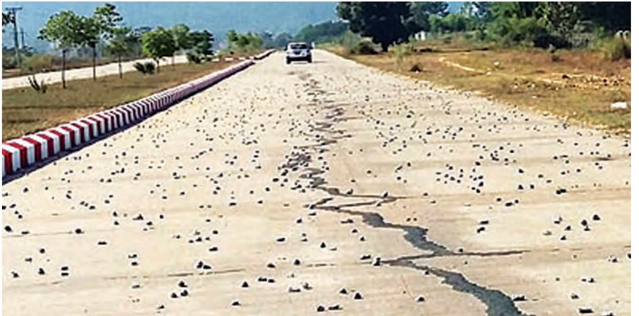
တဆ ထိခိုက်မှုကြုံရနိုင်တယ်”ဟု နေ့စဉ်နီးပါး ဖြတ်သန်းသွားလာနေသူ တစ်ဦးက ပြောသည်။ ကျောက်ကားများ သတ်မှတ်ဝန်ချိန်ထက်ပိုမိုသယ်ယူနေမှု၊ စည်းကမ်းမဲ့

“ကျောက်ကားတွေက ကုန်တင်နိုင်တဲ့အလေးချိန်ထက်လည်း ပိုသယ်နေကြတာကြောင့် ကျောက်တွေဟာ ကားလမ်းမတစ်လျှောက်ပြတ်ကျကျန်ရစ်နေတာမို့ ကားမောင်းရတာ အာရုံနောက်ပါတယ်။ တချို့ကျောက်ကားတွေဆိုရင် ယာဉ်လိုဏ်စင်နဲ့ပါတ်တောင်မပါပါဘူး။ ယာဉ်စည်းကမ်း၊ လမ်းစည်းကမ်းလည်း နားလည်ကြပုံမရဘူး။ ဒီလမ်းက ကားရှင်းတာမို့ တချို့ကားတွေက Over Speed သုံးကြရင် ဒီလိုကျောက်ခဲတွေကြောင့် ယာဉ်မတော်