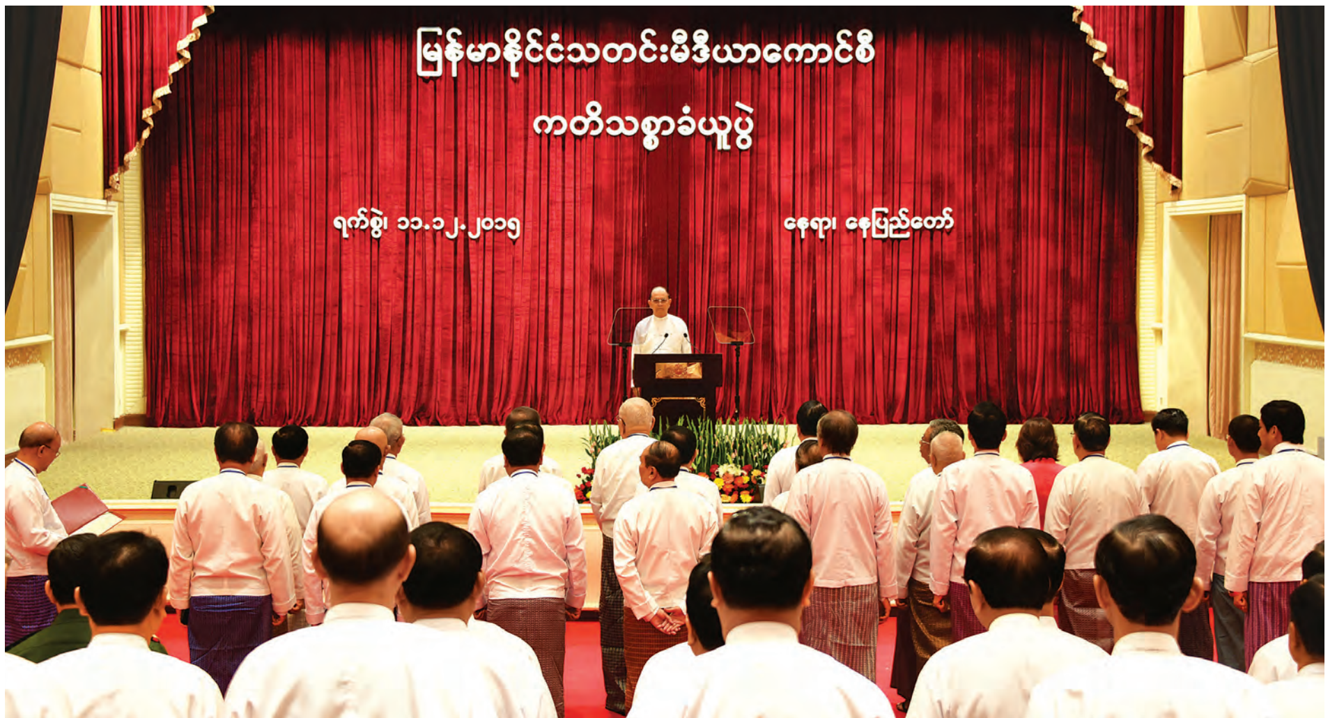
နေပြည်တော် ဒီဇင်ဘာ ၁၁ နိုင်ငံတော်သမ္မတ၏ မိန့်ခွန်းနာခံခြင်းနှင့် မြန်မာနိုင်ငံသတင်းမီဒီယာကောင်စီဝင်များ ကတိသစ္စာပြုခြင်း အခမ်းအနားကို ယနေ့နံနက် ၉နာရီတွင် နေပြည်တော်ရှိ နိုင်ငံတော်သမ္မတအိမ်တော် သဘင်ဆောင်၌ကျင်းပရာ ပြည်ထောင်စု သမ္မတမြန်မာနိုင်ငံတော် နိုင်ငံတော်သမ္မတ ဦးသိန်းစိန် တက်ရောက်မိန့်ခွန်းပြောကြားသည်။ (အပေါ်ပုံ) အခမ်းအနားသို့ ဒုတိယသမ္မတ ဒေါက်တာစိုင်းမောက်ခမ်းနှင့် ဦးညွှန်ထွန်း၊ ပြည်ထောင်စုတရားသူကြီးချုပ် ဦးထွန်းထွန်းဦး၊ ပြည်ထောင်စုရွေးကောက်ပွဲကော်မရှင်ဥက္ကဋ္ဌ ဦးတင်အေး၊ စာမျက်နှာ ၃ ကော်လံ ၁ *

သတင်းမီဒီယာကောင်စီသည် သတင်းမီဒီယာသမားများ၏ အခွင့်အရေးတစ်ခုတည်းကိုသာ ကာကွယ်ရန်အတွက်မဟုတ်ဘဲ ပြည်သူများ၏ သတင်းသိပိုင်ခွင့်ကို ဖြည့်ဆည်းပေးရန်၊ စာနယ်ဇင်းကျင့်ဝတ်ဆိုင်ရာ အဆင့်အတန်းများကို ထိန်းသိမ်းပေးရန်တာဝန်ရှိ