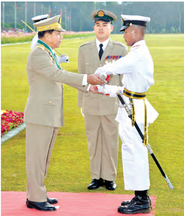
တပ်မတော်ကာကွယ်ရေးဦးစီးချုပ် ဗိုလ်ချုပ်မှူးကြီး သရေစည်သူ မင်းအောင်လှိုင် အောင်စစ်သည်ဆုနှင့် လေ့ကျင့်ရေးထူးချွန်ဆုရရှိသူ ဗိုလ်လောင်းအမှတ်-၇၀၃၃ ဗိုလ်လောင်းအောင်ဆက်မြင့်အား ဆုချီးမြှင့် စဉ်။ (မြဝတီ)

အချိန်တွင် ကြုံတွေ့ခဲ့ရသော ပြည်ပ ကျွေးကျော်မှုနှင့် ပြည်တွင်းလက်နက် ကိုင်ပိုင်ပစ္စည်းများကို ဖြေရှင်းခဲ့ရပြီး ပြည်ထောင်စု မပြိုကွဲရေး၊ တိုင်းရင်း သားစည်းလုံးညီညွတ်မှု မပြိုကွဲရေး၊ အချုပ်အခြာအာဏာတည်တံ့ခိုင်မြဲ ရေးဆိုသည့် အမျိုးသားနိုင်ငံရေး တာဝန်ကိုပါ ထမ်းဆောင်ခဲ့ကြရ ကြောင်း၊ ၁၉၅၈ ခုနှစ်၊ ၁၉၆၂ ခုနှစ် နှင့် ၁၉၈၈ ခုနှစ်များ၌ ဖြစ်ပေါ်ခဲ့သော နိုင်ငံတော်၏အရေးကြီးအချိန်ကာလ များတွင် နိုင်ငံတော်တာဝန်ကို လွှဲပြောင်းထမ်းဆောင်ပြီး တိုင်းပြည် ဖွံ့ဖြိုးတိုးတက်ရေးအတွက် တာဝန်ယူ ဆောင်ရွက်ခဲ့ကြောင်း၊ ပထဝီနိုင်ငံ ရေးအရ မဟာဗျူဟာကျသည့် အနေအထား၊ အိမ်နီးချင်းနိုင်ငံများ၊ လူမျိုးရေးနှင့် နောက်ခံသမိုင်းကြောင်း တို့အရ အချုပ်အခြာအာဏာကို ကာကွယ်ထိန်းသိမ်းနိုင်ရန်အတွက် တပ်မတော်သည် ခေတ်မီတပ်မတော် (Standard Army) ဖြစ်ရန်လို ကြောင်း၊ ခေတ်မီတပ်မတော် တည်ဆောက်နိုင်မှသာ အနာဂတ်တွင် ဖြစ်ပေါ်လာမည့် စစ်အတတ်ပညာနှင့် စစ်နည်းပညာ တိုးတက်မှုများကို ရင်ဆိုင်နိုင်ပြီး တိုင်းပြည်ကို ဘက်ပေါင်းစုံမှ ကာကွယ်နိုင်မည် ဖြစ်ကြောင်း၊ ယနေ့ကမ္ဘာတွင် နည်းပညာ