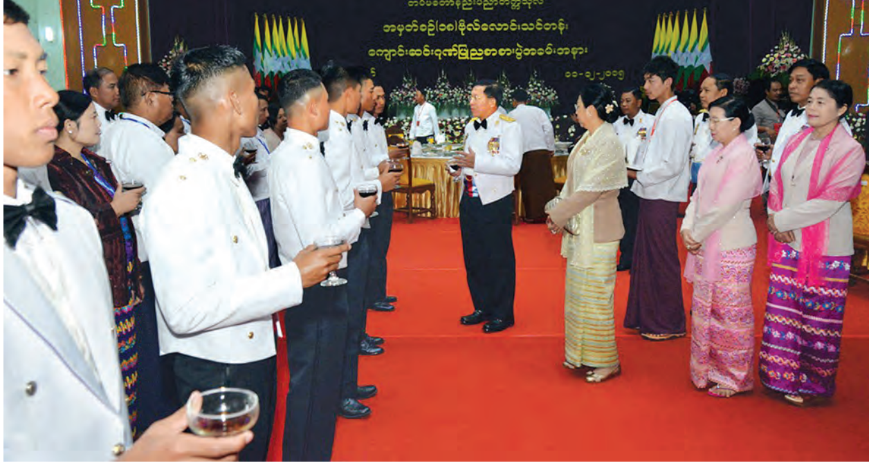
စားပွဲအပြီးတွင် တပ်မတော်ကာကွယ်ရေးဦးစီးချုပ်နှင့်အဖွဲ့ဝင်များ၊ ကျောင်းဆင်းအရာရှိများနှင့် မိဘဆွေမျိုးများ၊ မိဘဆွေမျိုး များနှင့်အတူ ညစာသုံးဆောင်ကြသည်။ မြဝတီတေးဂီတအဖွဲ့က မြန်မာ့စောင်းဖြင့် သီဆိုတီးခတ်ဖျော်ဖြေကြသည်။

ဆင်းအရာရှိများနှင့် မိဘဆွေမျိုးများ တက်ရောက်ကြသည်။ ရှေးဦးစွာ တပ်မတော်ကာကွယ်ရေးဦးစီးချုပ် ပိုလ်ချုပ်မှူးကြီး မင်းအောင်လှိုင်က သင်တန်းဆင်း အရာရှိများအား ရင်းရင်းနှီးနှီး လိုက်လံနှုတ်ဆက်သည်။ (ယာပုံ) ထို့နောက် တပ်မတော်ကာကွယ်ရေးဦးစီးချုပ်နှင့် အဖွဲ့ဝင်များသည် သင်တန်းဆင်းအရာရှိများ၊ မိဘဆွေမျိုး များနှင့်အတူ ညစာသုံးဆောင်ကြသည်။ ညစာသုံးဆောင်နေစဉ် မြဝတီတေးဂီတအဖွဲ့က မြန်မာ့စောင်းဖြင့် သီဆိုတီးခတ်ဖျော်ဖြေကြသည်။ သင်တန်းဆင်း ဂုဏ်ပြုညစာ