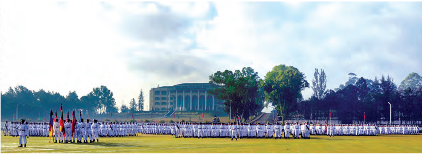
နေပြည်တော် ဒီဇင်ဘာ ၁၁

ခေတ်မီတပ်မတော်တစ်ရပ်ရှိမှသာ စစ်ရေးစွမ်းအား (Military Might) ကို ရရှိမည်ဖြစ်ကြောင်း၊ စစ်ရေးစွမ်းအားရရှိရန်အတွက် တိုက်စွမ်းရည်၊ တိုက်စွမ်းအားရှိရန် လိုအပ်ကြောင်း၊ တိုက်စွမ်းရည်မြင့်မားရန်အတွက် လေ့ကျင့်ရေးဖြင့် လုပ်ဆောင်ရမည်ဖြစ်ပြီး ရုပ်ပိုင်းနှင့် စိတ်ပိုင်းကိုပါ လေ့ကျင့်ပေးရန်လိုကြောင်း၊ တိုက်စွမ်းအားရှိရန်အတွက် ခေတ်မီလက်နက်၊ ခဲယမ်း၊ ယာဉ်ယန္တရားနှင့် ချပ်ဝတ်တန်ဆာများ တပ်ဆင်ပေးရမည်ဖြစ်ကြောင်း၊ တပ်မတော်၏ တိုက်စွမ်းအားမြင့်မားစေရန်အတွက် အဓိကကျသည့် အတတ်ပညာရှင် လူသားအရင်းအမြစ်များဖြစ်သည့်အလျောက် မိမိတို့တတ်သိထားသော အင်ဂျင်နီယာပညာရပ်များကို အသုံးပြုပြီး ကျရာနေရာမှ ပေးအပ်သည့်တာဝန်ကို စွမ်းစွမ်းတစ်ဆောင်ရွက်သွားကြရန်လိုကြောင်း တပ်မတော်ကာကွယ်ရေးဦးစီးချုပ် ဗိုလ်ချုပ်မှူးကြီး သရေစည်သူမင်းအောင်လှိုင်က ယနေ့ နံနက် ၇ နာရီခွဲတွင် ပြင်ဦးလွင်မြို့ တပ်မတော်နည်းပညာတက္ကသိုလ် စစ်ရေးပြကွင်း၌ကျင်းပသော တပ်မတော်နည်းပညာတက္ကသိုလ် ဗိုလ်လောင်းသင်တန်းအမှတ်စဉ်(၁၈) သင်တန်းဆင်း ဂုဏ်ပြုစစ်ရေးပြအခမ်းအနားတွင် ထည့်သွင်းပြောကြားသည်။ (အပေါ်ပုံ)