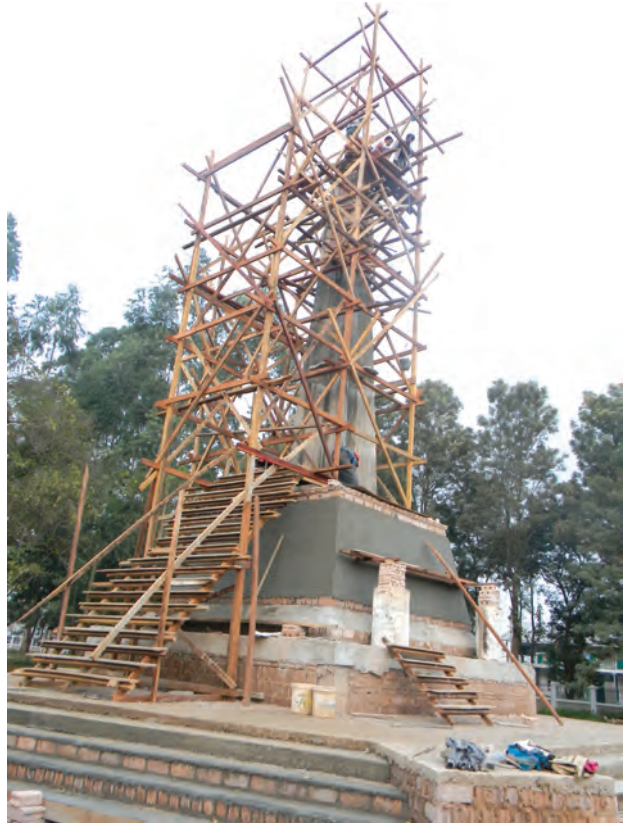
ချမ်းသာ(မိတ္ထီလာ)

မိတ္ထီလာမြို့၌ မြို့နယ်လူမှုဖူလုံရေးရုံးနှင့် ဆေးခန်း အဆောက်အအုံသစ်ဖွင့်ပွဲကို ဒီဇင်ဘာ ၁၀ ရက်က ကျင်းပခဲ့သည်။ ရုံးအဆောက်အအုံသစ်ကို အလုပ်သမား၊ အလုပ်အကိုင်နှင့် လူမှုဖူလုံရေးဝန်ကြီးဌာန ဒုတိယဝန်ကြီး ဦးထင်အောင်နှင့် မိတ္ထီလာ အမှတ်(၁)မဲဆန္ဒနယ်တိုင်းဒေသကြီးလွှတ်တော်ကိုယ်စားလှယ် ဦးစောဌေးတို့က ဖဲကြိုးဖြတ်ဖွင့်လှစ်ပြီး ဒုတိယဝန်ကြီးက လူမှုဖူလုံရေးစီမံကိန်းစနစ်ကို မြန်မာနိုင်ငံတွင် ၁၉၉၆ ခုနှစ်က စတင်အကောင်အထည်ဖော်ခဲ့ကြောင်း၊ လူမှုဖူလုံရေးစီမံကိန်း၏ ရည်ရွယ်ချက်မှာ အလုပ်သမားများ ကျန်းမာရေးကောင်းမွန်တိုးတက်ပြီး အလုပ်လုပ်နိုင်စွမ်းမြင့်မားကာ ကုန်ထုတ်လုပ်မှုတိုးတက်စေရေး၊ အလုပ်သမားများ မကျန်းမာမှု၊ မီးဖွားမှု အလုပ်ခွင်ထိခိုက်ဒဏ်ရာရရှိမှု၊ အသက်အရွယ်ကြီးရင့်မှု၊ သေဆုံးမှုများစသည့် လူမှုဒုက္ခများနှင့် ကြုံတွေ့ရသည့်အခါ အလုပ်သမားနှင့် မိသားစုများအတွက် ထိရောက်ပြည့်စုံသည့်အကျိုးခံစားခွင့်များရရှိစေရေး ဖြစ်ကြောင်း၊ အာမခံအလုပ်သမားများ၏ ကျန်းမာရေးဝန်ဆောင်မှုများကို အရှိန်အဟုန်မြှင့်ဆောင်ရွက်ပေးလျက်ရှိကြောင်း၊ ကင်ဆာနှင့် နှလုံးရောဂါ အထူးကုဆေးရုံနှစ်ရုံကို ဖွင့်လှစ်သွားနိုင်ရေးအတွက် စီစဉ်လျာထားဆောင်ရွက်လျက်ရှိကြောင်း၊ နိုင်ငံတော်၊ အလုပ်ရှင်၊ အလုပ်သမား သုံးပွင့်ဆိုင် ပူးပေါင်းပြီး အာမခံအလုပ်သမားများ၏ လူမှုဘဝလုံခြုံရေး၊ ကျန်းမာရေးစောင့်ရှောက်မှုများ ပိုမိုရရှိခံစားစေရေး ဆောင်ရွက်ပေးခြင်းဖြင့် ကုန်ထုတ်လုပ်မှု တိုးတက်စေပြီး နိုင်ငံတော်ဖွံ့ဖြိုးတိုးတက်မှုကို အထောက်အပံ့ပြုနိုင်မည်ဖြစ်ကြောင်း အမှာစကားပြောကြားသည်။