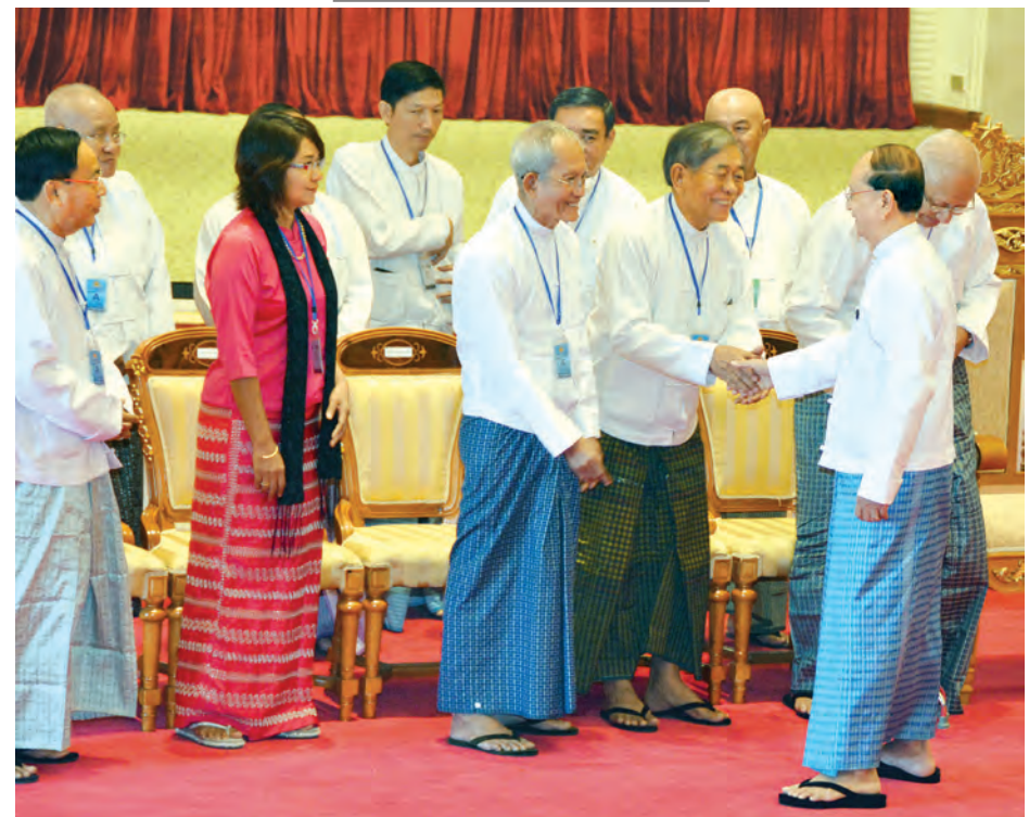
နိုင်ငံတော်သမ္မတ ဦးသိန်းစိန် နိုင်ငံတော်သမ္မတ၏ မိန့်ခွန်းနာခံခြင်းနှင့် မြန်မာနိုင်ငံ သတင်းမီဒီယာကောင်စီဝင် များ ကတိသစ္စာပြုခြင်းအခမ်းအနားသို့ တက်ရောက်ကြသူများအား ရင်းရင်းနှီးနှီးနှုတ်ဆက်စဉ်။ (သတင်းစဉ်)

နိုင်ငံတော်သမ္မတ၏ မိန့်ခွန်းနာခံခြင်းနှင့် မြန်မာနိုင်ငံသတင်းမီဒီယာကောင်စီဝင်များ ကတိသစ္စာပြုခြင်းအခမ်းအနားတွင် နိုင်ငံတော်သမ္မတ ဦးသိန်းစိန် မိန့်ခွန်းပြောကြားစဉ်။ (သတင်းစဉ်) ကို စတင်ဖွဲ့စည်းပေးခဲ့ပါကြောင်း။ စာနယ်ဇင်းကောင်စီ (ယာယီ) အနေဖြင့် သတင်းမီဒီယာဥပဒေ တစ်ရပ် ပေါ်ထွန်းလာရေးကို အဓိက ထား အကောင်အထည်ဖော်ဆောင် ရွက်ခဲ့သည့်အပြင် တစ်ဖက်တွင် လည်း နိုင်ငံကို သိမ်မွေ့ညင်သာသော အသွင်ကူးပြောင်းရေးလုပ်ငန်းများ ဆောင်ရွက်လျက်ရှိရာ သတင်းမီဒီယာ များအနေဖြင့် လွတ်လပ်မှု၊ တာဝန်ခံမှု၊ တာဝန်သိမှုတို့ကို ကျင့်သုံးသည့် ဂုဏ်သိက္ခာရှိသော မီဒီယာများအဖြစ် ရပ်တည်နိုင်ရန် အကောင်အထည် ဖော်ဆောင်ရွက်ခဲ့ရပါကြောင်း။ ယနေ့အချိန်တွင် မိမိတို့သည် ဖွဲ့စည်းပုံအခြေခံဥပဒေပါ ပြဋ္ဌာန်း ချက်များနှင့်အညီ ခေတ်နှင့်လျော်ညီ သော သတင်းမီဒီယာဥပဒေကို ၂၀၁၄ ခုနှစ် မတ် ၁၄ ရက်ကလည်း ကောင်း၊ နည်းဥပဒေကို ၂၀၁၅ ခုနှစ် ဇွန် ၁၇ ရက်က လည်းကောင်း ထုတ်ပြန်ပြဋ္ဌာန်းနိုင်ခဲ့ပြီး ဖြစ်ပါ ကြောင်း၊ ထို့ပြင် သတင်းမီဒီယာ နည်း ဥပဒေ၏ အခန်း ၃ ပါ သတင်းမီဒီယာ