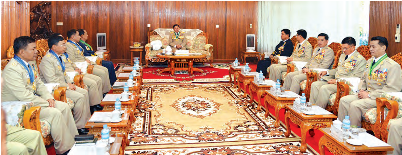
တပ်မတော်ကာကွယ်ရေးဦးစီးချုပ် ဗိုလ်ချုပ်မှူးကြီး သရေစည်သူ မင်းအောင်လှိုင် ထူးချွန်ဆုရရှိကြသည့် ဗိုလ်လောင်းနှစ်ဦးနှင့် ၎င်းတို့၏မိဘများအား တွေ့ဆုံ၍ ဂုဏ်ပြုအမှာစကား ပြောကြားစဉ်။ (မြဝတီ)

ကြသည်။ ယင်းနောက် တပ်မတော် ကာကွယ်ရေးဦးစီးချုပ်က တပ်မတော် နည်းပညာတက္ကသိုလ် ဗိုလ်လောင်း သင်တန်းအမှတ်စဉ်(၁၈)မှ အောင်စစ် သည်ဆုနှင့် လေ့ကျင့်ရေးထူးချွန်ဆု ရရှိသူ ဗိုလ်လောင်းအမှတ်-၇၀၃၃ ဗိုလ်လောင်း အောင်ဆက်မြင့်၊ စာပေ ထူးချွန်ဆုရရှိသူ ဗိုလ်လောင်းအမှတ်- ၇၀၂၁ ဗိုလ်လောင်း အေးချမ်းအောင် တို့အား ဆုများပေးအပ်ချီးမြှင့်သည်။ ထို့နောက် တပ်မတော်ကာကွယ် ရေးဦးစီးချုပ်က သင်တန်းဆင်း ဗိုလ်လောင်းများအား မိန့်ခွန်းပြော ကြားရာတွင် လွတ်လပ်ရေးကြိုးပမ်း မှုသမိုင်းနှင့်အတူ ပေါက်ဖွားလာခဲ့ သော မျိုးချစ်တပ်မတော်ဖြစ်သည့် အတွက် မျိုးချစ်စိတ်ဓာတ် ရှင်သန် ရုံသာမက နိုင်ငံတော်နှင့် နိုင်ငံသား တို့အပေါ် သစ္စာရှိသည့် တပ်မတော် လည်းဖြစ်ကြောင်း၊ တပ်မတော် အနေဖြင့် လွတ်လပ်ရေးရပြီးသည့်