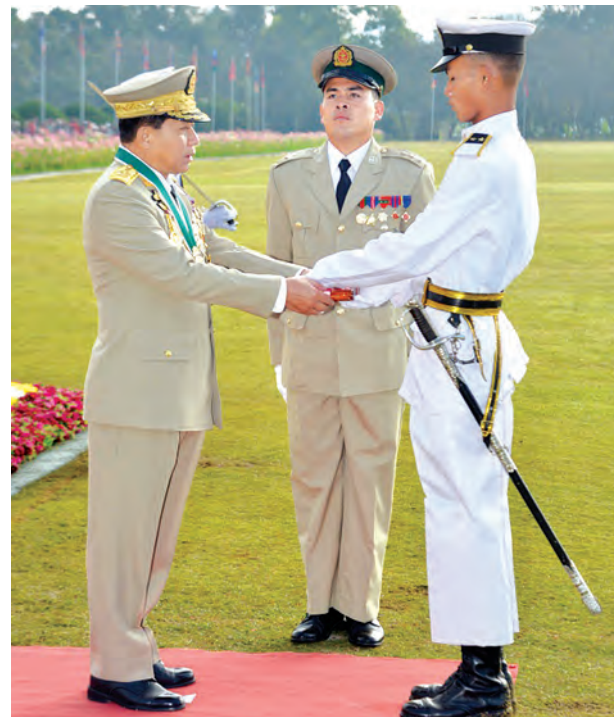
တပ်မတော်ကာကွယ်ရေးဦးစီးချုပ် ဗိုလ်ချုပ်မှူးကြီး သရေစည်သူ မင်းအောင်လှိုင် စာပေထူးချွန်ဆုရရှိသူ ဗိုလ်လောင်းအမှတ်-၇၀၂၁ ဗိုလ်လောင်းအေးချမ်းအောင်အား ဆုချီးမြှင့်စဉ်။

အမြဲမပြတ်ဆည်းပူးလေ့လာပြီး မိမိတို့ ၏အခြေအနေနှင့် ကိုက်ညီအောင် အသုံးချနိုင်ရမည်ဖြစ်ကြောင်း၊ မြန်မာ့ တပ်မတော် စွမ်းရည်ထက်မြက်ရန်၊ ခေတ်မီရန်မှာ မျိုးဆက်သစ် အတတ်