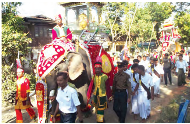
ပဲခူးတိုင်းဒေသကြီး သာယာဝတီခရိုင် စီးကုန်းမြို့နယ်တွင် သမိုင်းဝင် မြသိန်းရဲစေတီတော်ကြီး၏ (၃၂)ကြိမ်မြောက် နှစ်ကျိပ်ရှစ်ဆူ ဘုရားများနှင့် ဗုဒ္ဓမြတ်စွယ်တော် မြို့တွင်းလှည့်လည်အပူဇော်ခံပွဲကို ဒီဇင်ဘာ ၉ ရက်က စတင်ကျင်းပစဉ်။ (ဖွင့်ပွဲတွင် ပဲခူးတိုင်းဒေသကြီးဝန်ကြီးချုပ် ဦးညွှန်ဝင်းနှင့် မြတ်စွယ်တော်ပူဇော်ပွဲကျင်းပရေးကော်မတီဥက္ကဋ္ဌတို့က ဖွင့်လှစ်ပေးခဲ့ပြီး ပွဲတော်ကို ၁၀ ရက်ကြာကျင်းပမည်ဖြစ်ကြောင်း သိရသည်။) ကိုသက်(စီးကုန်း)