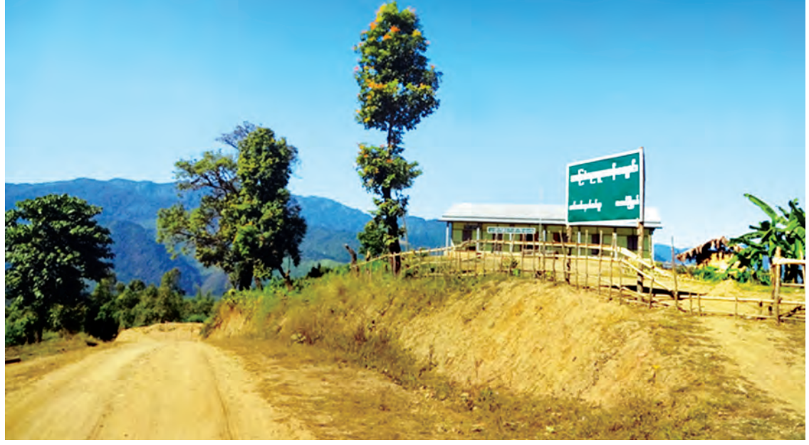
လဟယ်မြို့နယ် ဆော့လော်နောက်အင်းကျေးရွာ အခြေခံပညာမူလတန်းကျောင်းကို တွေ့ရစဉ်။

၅၂ ကျောင်း၊ အမကခွဲ ၂၃ ကျောင်း၊ အမကတွဲတစ်ကျောင်းနဲ့ ဘုန်းတော်ကြီးသင်ပညာရေး ကျောင်းနှစ်ကျောင်း ဖွင့်လှစ်သင်ကြားပေးနေပါတယ်။ နယ်စပ်ရေးရာဝန်ကြီးဌာနက ဖွင့်လှစ်ထားတဲ့ နယ်စပ်ဒေသတိုင်းရင်းသားလူငယ်များ ဖွံ့ဖြိုးရေးသင်တန်းကျောင်းတွေမှာ နာဂတိုင်းရင်းသား ကလေးငယ်တွေ တက်ရောက်သင်ကြားနေသလို ပြည်ထောင်စုတိုင်းရင်းသားလူမျိုးများ ဖွံ့ဖြိုးရေးတက္ကသိုလ်၊ ပြည်ထောင်စုတိုင်းရင်းသားလူငယ်များစွမ်းရည်ဖွံ့ဖြိုးရေးဒီဂရီကောလိပ် (ရန်ကုန်နှင့်စစ်ကိုင်း)တွေမှာ တက်ရောက်သင်ယူနေကြပါတယ်။ ဒါကြောင့် နာဂကိုယ်ပိုင်အုပ်ချုပ်ခွင့်ရဒေသမှာ လူစွမ်းအားအရင်းအမြစ်များ ဖွံ့ဖြိုးတိုးတက်ရေးအတွက် အခြေခံကောင်းတွေ ရရှိထားပြီးဖြစ်တာမို့ အခြားသောဒေသများနည်းတူ ဖွံ့ဖြိုးတိုးတက်လာမယ်လို့ယုံကြည်မိရင်း နာဂမြေမှ ပန်းကလေးများလန်းပါစေလို့ ဆုတောင်းဆန္ဒပြုမိပါတယ်။