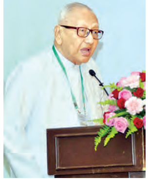
မြန်မာသတင်းမီဒီယာကောင်စီဥက္ကဋ္ဌ ဦးခင်မောင်လေး အမှာစကားပြောကြားစဉ်။

စတုတ္ထအကြိမ်မြောက် မီဒီယာဖွံ့ဖြိုးတိုးတက်မှုညီလာခံ(ဒုတိယနေ့)ကို ဒီဇင်ဘာ ၁၁ ရက်တွင် ရန်ကုန်မြို့၊ ချက်ထရီယံဟိုတယ်၌ ဆက်လက်ကျင်းပမည်ဖြစ်သည်။ ညီလာခံဒုတိယနေ့တွင် သတင်းအချက်အလက်ရယူသိရှိပိုင်ခွင့်မှ ပိုမိုကောင်းမွန်သော လူမှုအသိုက်အဝန်းဆီသို့ ရပ်ရွာအခြေပြု မီဒီယာများထွက်ပေါ်လာသည့် ရပ်ရွာလူထု၏ အသံ၊ အားကောင်းသည့် မီဒီယာအသံများ လုံခြုံမှုရှိစေရန် ကာကွယ်ခြင်း၊ ဖြစ်ထွန်းလာမည့် တိုင်းရင်းသားမီဒီယာအခင်းအကျင်းနှင့် စိန်ခေါ်မှုများနှင့် မြန်မာမီဒီယာဖွံ့ဖြိုးတိုးတက်ရေးအတွက် နိုင်ငံတကာမှ ပူးပေါင်းဆောင်ရွက်မှုများ၊ အတွေ့အကြုံနှင့် ရှေ့ဆက်မည့်လုပ်ငန်းစဉ်များ အစရှိသည့် ကဏ္ဍ ၁၀ ခုကို အဓိကထားဆွေးနွေးမည်ဖြစ်ကြောင်း သိရသည်။ တတိယအကြိမ် မီဒီယာဖွံ့ဖြိုးတိုးတက်မှုညီလာခံကို ၂၀၁၄ ခုနှစ် စက်တင်ဘာ ၁၈ ရက်နှင့် ၁၉ ရက်တို့က "Moving towards a sustainable media environment" ခေါင်းစဉ်ဖြင့် ပြုလုပ်ခဲ့သည်။