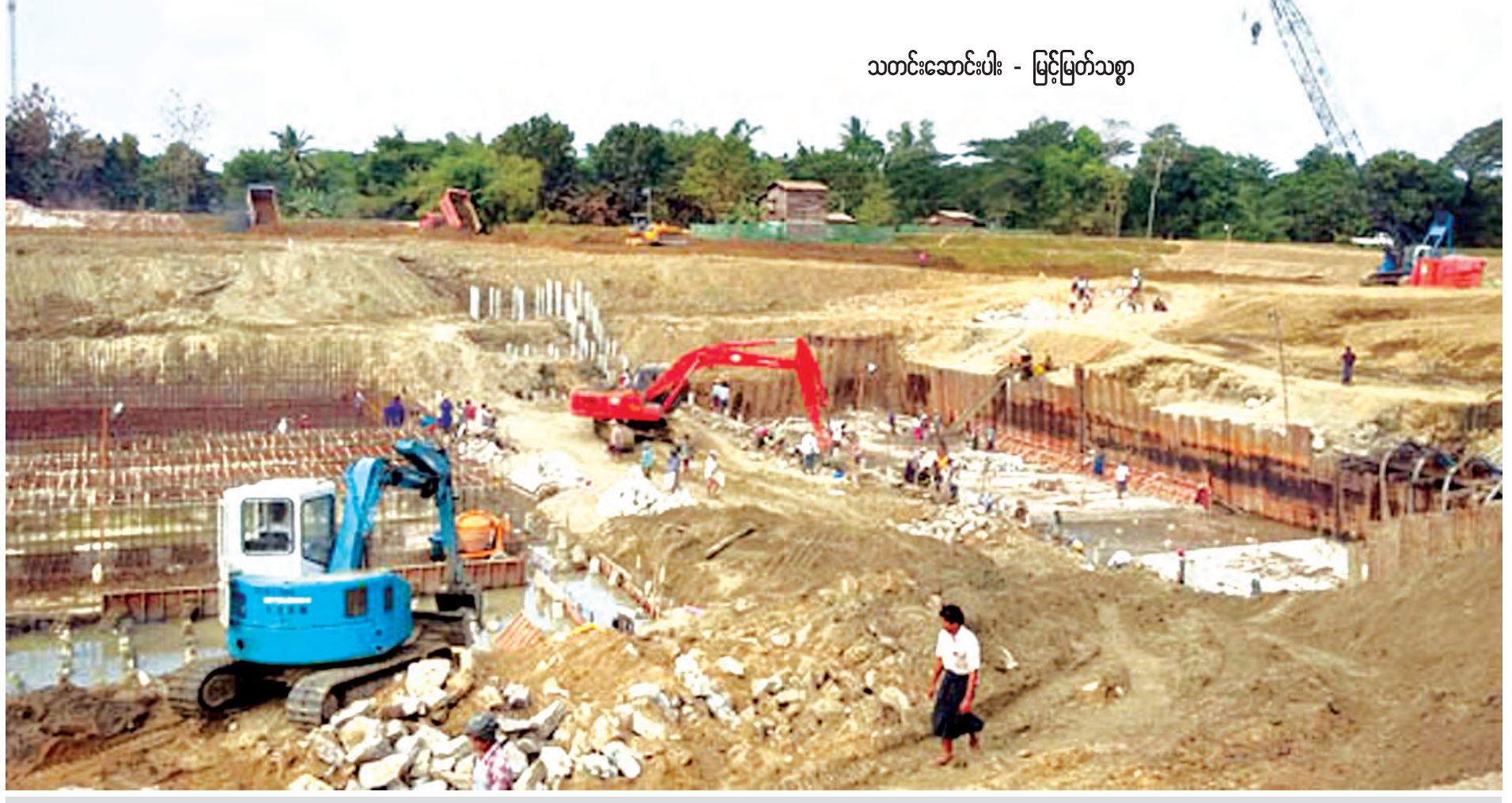
ညောင်တုန်းမြို့နယ်ရှိ မဲဇလီ(၂)ရေထိန်းတံခါး တည်ဆောက်ရေးလုပ်ငန်းခွင်ကို တွေ့ရစဉ်။

ရန်ကုန် ဒီဇင်ဘာ ၁၀ နံနက်ခင်းနေပြည်တော်အောက်တွင် ညောင်တုန်းမြို့နယ် မဲဇလီ(၂)ရေထိန်းတံခါးတည်ဆောက်ရေးလုပ်ငန်းခွင်၌ စက်အားလူအားဖြင့် အလုပ်သမားများ လုပ်ငန်းခွင်ဝင်လျက်ရှိသည်။ ရေထိန်းတံခါးတည်ဆောက်မှုကို ဆည်မြောင်းဦးစီးဌာန တည်ဆောက်ရေး(၆)မှ တည်ဆောက်လျက်ရှိကာ ညွှန်ကြားရေးမှူး၊ လက်ထောက်ညွှန်ကြားရေးမှူးနှင့် ဦးစီးအရာရှိတို့က အနီးကပ်ကြီးကြပ်လျက် ၂၀၁၆ ခုနှစ် မတ်လတွင် ပြီးစီးဖွင့်လှစ်နိုင်ရန် ကြိုးပမ်းဆောင်ရွက်လျက်ရှိသည်။