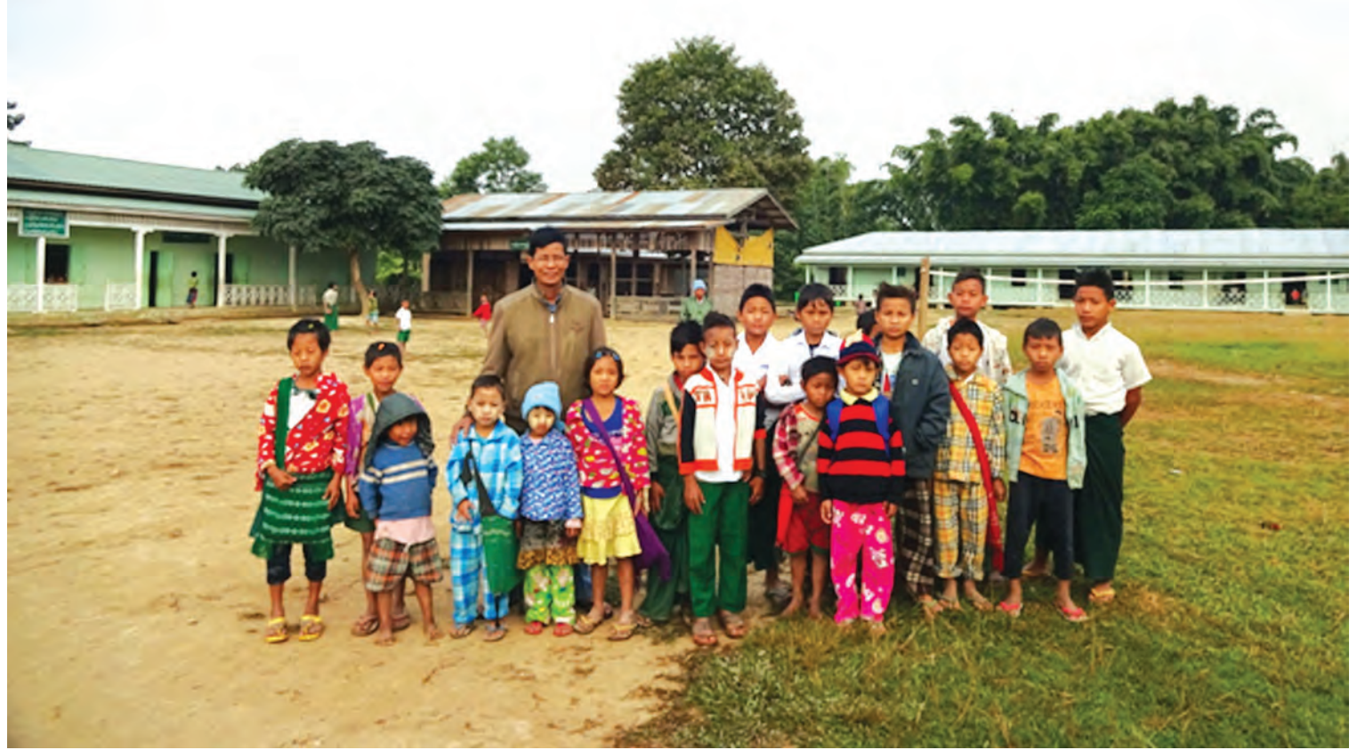
နန်းယွန်းမြို့နယ် တကားကျေးရွာ အခြေခံပညာမူလတန်းကျောင်းမှ ကျောင်းသားကျောင်းသူများကို တွေ့ရစဉ်။

နာဂကိုယ်ပိုင်အုပ်ချုပ်ခွင့်ရဒေသ အတွင်းက လေရိုး၊ လဟယ်၊ နန်းယွန်းမြို့နယ်တွေမှာ၊ စစ်ကိုင်းတိုင်းဒေသကြီးအတွင်းက ခန္တီးမြို့နယ်မှာ ဖောက်လုပ်ပေးခဲ့တဲ့ လမ်းတွေဟာ နာဂတိုင်းရင်းသား သွေးချင်းများရဲ့ လူမှုစီးပွားဘဝကို ဖွံ့ဖြိုးတိုးတက်စေရုံမက ရင်သွေးငယ်တွေရဲ့ ပညာရည်မြင့်မားရေးကို အများကြီး အထောက်အကူပြုနေမှန်း သိလိုက်ရတဲ့အခါ အလွန်ကြည်နူးဝမ်းသာ ဖြစ်ခဲ့မိပါတယ်။ နိုဝင်ဘာ ၂၄ ရက်မှာ ကျွန်တော်တို့အဖွဲ့ဟာ ခန္တီးမြို့နယ်ထဲက ၂၀၁၅-၂၀၁၆ ဘဏ္ဍာနှစ် ခွင့်ပြုလုပ်ငန်းဖြစ်တဲ့ တိန်အင်း-လက်ပံသာ-မှန်ပင်-ကောင်းမှု-ဖောင်းဆိုင်-ပခုမုန်းရွာသစ် ၄၀/၀ မိုင်အနက် မြေလမ်း ၁၀/၀မိုင် စတင်ဖောက်လုပ်ခြင်းလုပ်ငန်းကို သွားရောက် ကွင်းဆင်းကြည့်ရှုခဲ့ပါတယ်။ ကောင်းမှုကျေးရွာမှာ ခဏနားကြရင်း ရပ်မိရပ်ဖတွေနဲ့ တွေ့ဆုံစကားပြောကြည့်လိုက်တဲ့အခါ... လမ်းပေါက်သွားမယ်ဆိုရင်ဖြင့် ဒီဒေသက ကလေးတွေအနေနဲ့ စက်ဘီး၊ ဆိုင်ကယ်တွေစီးပြီး ခန္တီးမြို့အထိ ကျောင်းသွားတက်နိုင်တော့မှာဖြစ်ပါတယ်။ အခုနေခါမှာတော့ ခန္တီးမြို့ပေါ်က အသိအိမ် အမျိုးအိမ်တွေမှာ အဆောင်တွေမှာ သွားရောက်နေထိုင်ပြီး ကျောင်းတက်နေရတာဖြစ်လို့ စရိတ်စက အများကြီး သက်သာသွားမှာဖြစ်ပါတယ်လို့ ဝမ်းပန်းတသာပြောပြကြပါတယ်။ လက်ပံသာကျေးရွာမှာ လီဆူတိုင်းရင်းသားသွေးချင်းများလည်း နေထိုင်လျက်ရှိကြပြီး ကချင်ပြည်နယ်ရဲ့ နာမည်ကျော်ဂရိတ်ဖရူသီးတွေ အောင်မြင်စွာစိုက်ပျိုးထားတာ တွေ့ခဲ့ရပါတယ်။