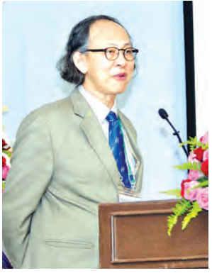
အရှေ့တောင်အာရှ ဆိုင်ရာ မီဒီယာ အကဲဖြတ်သုံးသပ်သူ Mr. Kavi Chongkittavorn အမှာစကားပြောကြားစဉ်။

တိုင်းရင်းသားဘာသာစကား ရှစ်မျိုးဖြင့် သတင်းစာထုတ်ဝေမည်ဖြစ်ကြောင်း၊ လေးနှစ်တာကာလအတွင်း ဆောင်ရွက်ခဲ့သည့် မီဒီယာပြုပြင်ပြောင်းလဲမှု၏ အကျိုးရလဒ်များအား ပြီးခဲ့သည့် နိုဝင်ဘာရွှေ့ကောက်ပွဲ၌ မီဒီယာများ၏ ဆောင်ရွက်ခဲ့မှုအပေါ်တွင် တွေ့မြင်ရမည်ဖြစ်ကြောင်း ပြောကြားသည်။ (ယာပုံ)