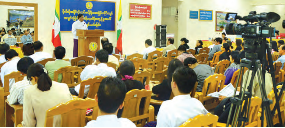
နေပြည်တော် ဒီဇင်ဘာ ၁၀

ကျန်းမာရေးဝန်ကြီးဌာန ပြည်သူ့ကျန်းမာရေးဦးစီးဌာန ဗဟိုကူးစက်ရောဂါတိုက်ဖျက်ရေးဌာနခွဲမှ ဆောင်ရွက် လျက်ရှိသော ကာကွယ်ဆေးဖြင့် ကာကွယ်၍ရသော ရောဂါများစောင့်ကြပ်ကြည့်ရှုခြင်းလုပ်ငန်းသည် ပိုလီယို