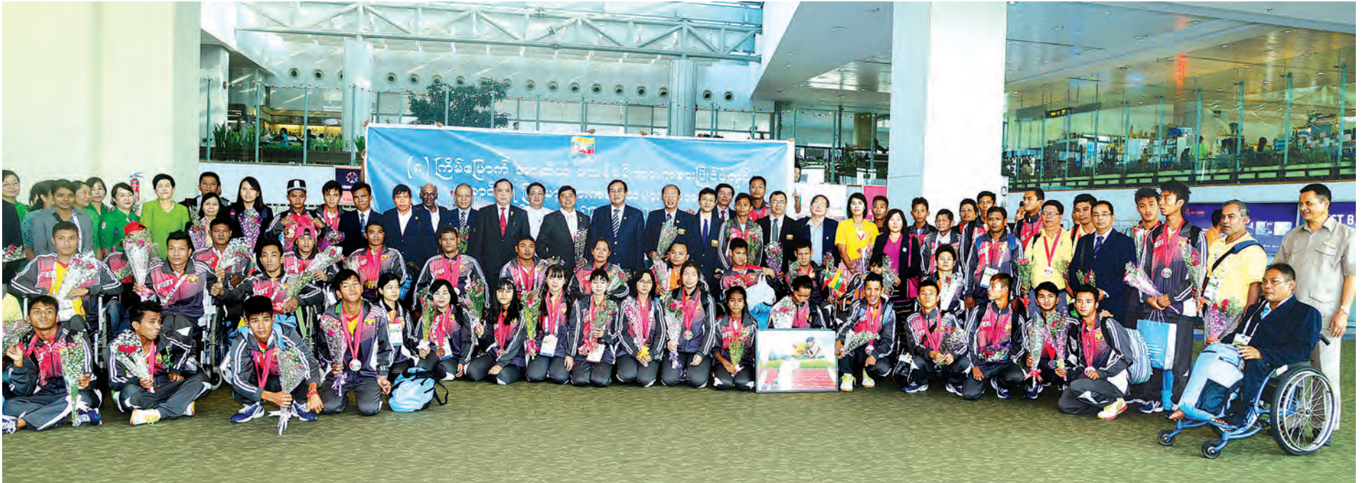
ရန်ကုန် ဒီဇင်ဘာ ၁၀