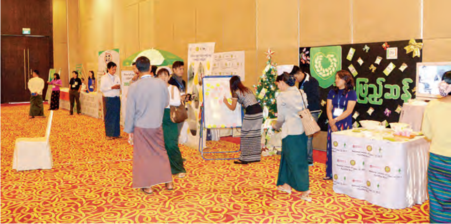
အဏုအာဟာရပြည့်ဆန် စတင်မိတ်ဆက်ခြင်း အခမ်းအနား၌ အာဟာရပြည့်ဆန်ထုတ်လုပ်သည့် အဖွဲ့များ လာရောက်ပြသမှုကို တွေ့ရစဉ်။

ကျွန်တော်တို့အနေနဲ့ မြန်မာ နိုင်ငံတစ်ဝန်းလုံးမှာရှိတဲ့ ပြည်သူ တွေအတွက် အာဟာရမြှင့်တင်ဖို့ ရည်ရွယ်ပါတယ်။ ကျွန်တော်တို့ အနေနဲ့ အတတ်နိုင်ဆုံးဒီအာဟာရ ပြည့်စွက်ဆန်တွေကို ဖြန့်ဖြူးရောင်း ချပေးဖို့အတွက် အချိတ်အဆက် တွေ လုပ်ပြီးပါပြီ။ ကုန်စုံဆိုင်တွေ အထိလိုက်လံဖြန့်ဖြူးသွားဖို့ လုပ် ဆောင်ထားပါတယ်။ အာဟာရ ပြည့်ဆန်ကို စားသုံးခြင်းအားဖြင့် တစ်နေ့တာမှာ အမြဲတမ်းစိတ်ရွှင် လန်းပြီး ဝိတာမင်အများဆုံးရတဲ့ အတွက်ကြောင့် သွေးအားနည်း ရောဂါအပါအဝင် တခြားရောဂါ ပေါင်းများစွာကို ကာကွယ်နိုင်မှာ ဖြစ် ပါတယ်။