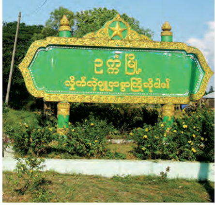
သတင်း-မောင်မောင်မြင့်ဆွေ စာတို-မောင်ချစ်ကြည်

ကျေးရွာအနီးတွင်ရှိသော ဥက္ကံသကြားစက်ရုံရာသီထွက်လာခဲ့သည်။ ရန်ကုန်တိုင်းဒေသကြီးအတွင်းတစ်ခုတည်းသောသကြားစက်ရုံရာသီထွက်စက်ရုံစားမိသည်။ ဥက္ကံမြို့ထွက်အရောက် သကြားစက်ဘက်သို့ လမ်းညွှန်ထားသော ဆိုင်းဘုတ်ကိုတွေ့ရသည်။ ဥက္ကံမြို့မှသကြားစက်အထိ ၁၉ မိုင် ရှိပြီး ကတ္တရာလမ်းခင်းထားရာ အချို့နေရာများ၌ ကတ္တရာလမ်းအပေါက်များဖြစ်နေသည်က လွဲပြီး ကောင်းမွန်မှုရှိနေသေးသည်။ အချိန်တိုအတွင်း သကြားစက်ကိုရောက်ရှိခဲ့ရာ ဥက္ကံသကြားစက်က လည်ပတ်မှုမရှိဘဲ ရပ်နားထားကြောင်း သိရသည်။