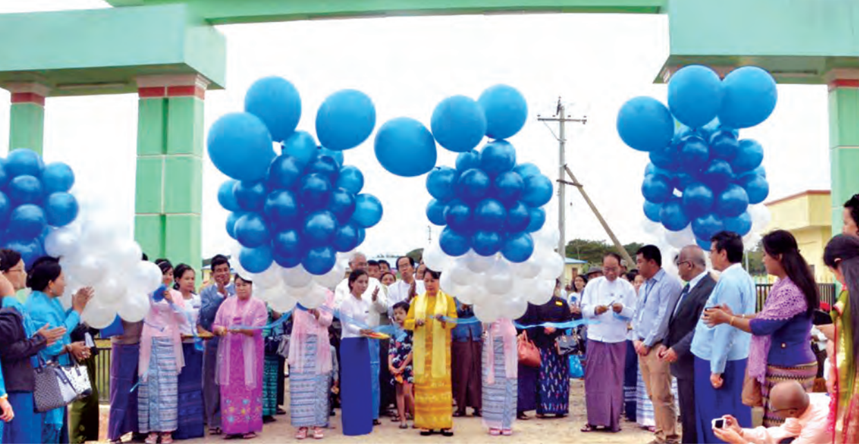
ပြည်ထောင်စုဝန်ကြီး ဒေါက်တာ ဒေါ်မြတ်မြတ်အုန်းခင်နှင့် တာဝန်ရှိသူများ သဘာဝဘေးအန္တရာယ်စီမံခန့်ခွဲမှုသင်တန်းကျောင်းအောင် မုခ်ဦးကို ဖဲကြီးဖြတ်ဖွင့်လှစ်ပေးစဉ်။ (သတင်းစဉ်)

နေပြည်တော် ဒီဇင်ဘာ ၅ သဘာဝဘေးဒဏ် ခုခံနိုင်စွမ်း မြှင့်မားသော လူမှုအသိုက်အဝန်း ဖြစ်ပေါ်လာစေရန်၊ သဘာဝဘေး အန္တရာယ် စီမံခန့်ခွဲမှုနယ်ပယ်တွင် ကျွမ်းကျင်ပညာရှင်များ ပေါ်ထွက်လာ စေရန်၊ နိုင်ငံအတွင်း သဘာဝဘေး လျော့ပါးရေးဆိုင်ရာ နိုင်ငံတကာ အသိပညာ၊ ဗဟုသုတများ ကျယ်ပြန့် စွာ ပို့ချပေးနိုင်ရန်နှင့် သုတေသန လုပ်ငန်းများ ဆောင်ရွက်သွားရန် စသည့်ရည်ရွယ်ချက်များဖြင့် မြန်မာ နိုင်ငံတွင် ပထမဆုံးနှင့် တစ်ခုတည်း သောကျောင်းအဖြစ် တည်ဆောက်ခဲ့ သော သဘာဝဘေးအန္တရာယ် စီမံ ခန့်ခွဲမှုသင်တန်းကျောင်း (Disaster Management Training Center) ဖွင့်ပွဲအခမ်းအနားနှင့် သဘာဝဘေး အန္တရာယ်ဆိုင်ရာ စီမံခန့်ခွဲမှု အခြေခံ သင်တန်းအမှတ်စဉ်(၁/၂၀၁၅) ဖွင့်ပွဲ ကို စာမျက်နှာ ၈ ကော်လံ ၁