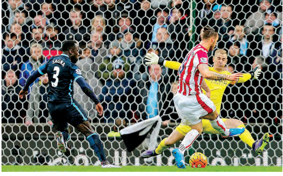
* ကျောပိုးမှ အိမ်ရှင် စတုတ်စီးတီး၏ အနိုင်ရိုက် ပွဲချိန် ခုနစ်မိနစ်နှင့် ၁၅ မိနစ်တွင် ကွင်းလယ်ကစားသမားများဖြစ်သော ရှာကျူရီ ဖန်တီးပေးပြီး မာကိုအာနော့တိုပစ်က နှစ်ဂိုးစလုံးက သုံးပွဲနိုင်၊ ငါးပွဲသရေကျထားသည်။ စတုတ်အသင်း ရမှတ် ၂၂ မှတ် ရရှိခဲ့ပြီး မန်စီးတီးမှာ ရမှတ် ၂၉ မှတ်ဖြင့် ယနေ့ပွဲနွဲ့ရိုက်ခဲ့သည့်အတွက် ဇယားထိပ်မှ ဆင်းပေးရတော့မည်ဖြစ်သည်။

ပုသိမ် ဒီဇင်ဘာ ၅ ရောဝတီတိုင်းဒေသကြီး ပုသိမ်မြို့၌ ဒီဇင်ဘာလ ပထမပတ်စုပေါင်းလမ်းလျှောက်ပွဲကို ဒီဇင်ဘာ ၅ ရက် နံနက် ၅ နာရီခွဲက တိုင်းဒေသကြီးဝန်ကြီးချုပ် ဦးသိန်းအောင်နှင့် တိုင်းဒေသကြီးဝန်ကြီးများ၊ တိုင်းဒေသကြီး/ခရိုင်/မြို့နယ်အဆင့် ဌာနဆိုင်ရာများ၊ ဆရာဆရာမများနှင့် ကျောင်းသားကျောင်းသူများသည် တိုင်းဒေသကြီးအစိုးရအဖွဲ့ရုံးရှေ့မှ စုပေါင်း လမ်းလျှောက်ကြရာ ရုပ်တုဝိုင်းအနီးသို့ ရောက်ရှိပြီး စုပေါင်းသွေးပူလေ့ကျင့်ခန်းများ ပြုလုပ်ကြသည်။ မောင်မောင်မြင့်