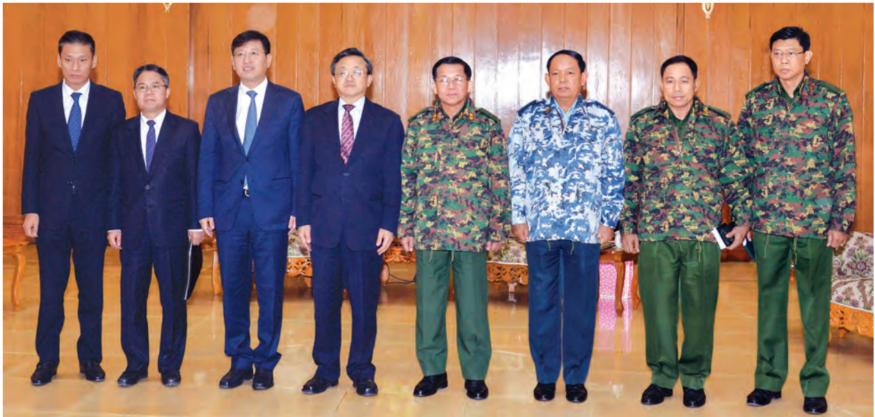
တပ်မတော်ကာကွယ်ရေးဦးစီးချုပ် ဗိုလ်ချုပ်မှူးကြီး မင်းအောင်လှိုင်နှင့် တပ်မတော်အကြီးအကဲများ၊ တရုတ်ပြည်သူ့သမ္မတနိုင်ငံအစိုးရ၏ အထူးသံတမန်နှင့် နိုင်ငံခြားရေးဝန်ကြီးဌာန ဒုတိယဝန်ကြီး မစ္စတာ လျီကျန်းမင်နှင့်အဖွဲ့တို့ ပူးပေါင်းဆောင်ရွက်မှုဆိုင်ရာကိစ္စရပ်များကို ဆွေးနွေးကြသည်။ (မြဝတီ)

တွေ့ဆုံပွဲသို့ တပ်မတော်ကာကွယ်ရေးဦးစီးချုပ်နှင့်အတူ ညွှန်ကြားကွပ်ကဲရေးမှူး (ကြည်း၊ ရေ၊ လေ) ပူးတွဲတာဝန် ကာကွယ်ရေးဦးစီးချုပ်(လေ)ဗိုလ်ချုပ်ကြီး ခင်အောင်မြင့်၊ ကာကွယ်ရေးဦးစီးချုပ်ရုံး(ကြည်း)မှ တပ်မတော်အရာရှိကြီးများ တက်ရောက်ကြပြီး တရုတ်ပြည်သူ့သမ္မတနိုင်ငံအစိုးရ၏ အထူးသံတမန်နှင့် နိုင်ငံခြားရေးဝန်ကြီးဌာန ဒုတိယဝန်ကြီးနှင့်အတူ မြန်မာနိုင်ငံဆိုင်ရာ တရုတ်နိုင်ငံသံအမတ်ကြီး မစ္စတာ ဟုန်လျန်နှင့် တာဝန်ရှိသူများ တက်ရောက်ကြသည်။ (မြဝတီ)