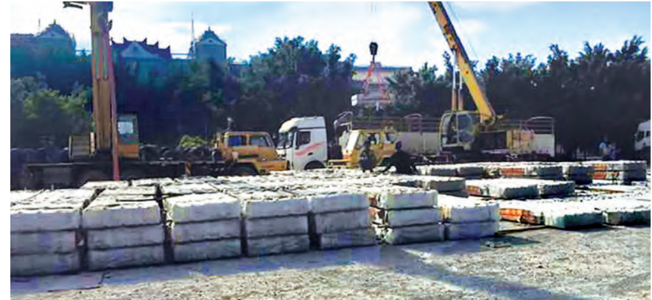
ရခိုင်ပြည်နယ်တွင် ဆောက်လုပ်မည့်နေအိမ်များအတွက် တရုတ်နိုင်ငံ ယူနန်ပြည်နယ်အစိုးရမှ လျှို့ဝှက်မှုသည် အလူမီနီယံဇင့်သွပ်ပြားချပ်အထုပ်များကို တွေ့ရစဉ်။

ရေကြီး၊ ရေလျှံမှုနှင့် မြေပြိုမှုများ ဖြစ်ပွားခဲ့ပြီး မကွေးတိုင်းဒေသကြီး၊ စစ်ကိုင်းတိုင်းဒေသကြီး၊ ရခိုင် ပြည်နယ်နှင့် ချင်းပြည်နယ် အပါ အဝင် တိုင်းဒေသကြီး၊ ပြည်နယ် တို့၌ သဘာဝဘေးအန္တရာယ်များ ကြုံတွေ့ခဲ့ကြရပြီး အိမ်ထောင်စု ပေါင်း ၄၂၂၀၆ မှ ပြည်သူလူထု