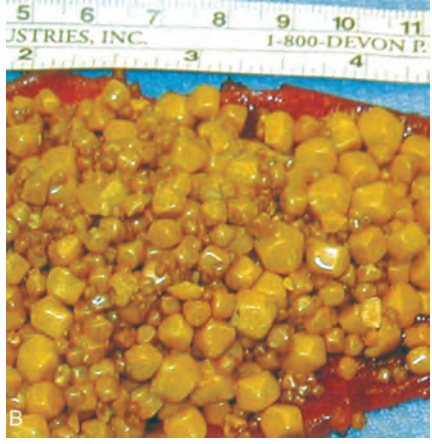
အဆီကျောက်သေးသေးလေးတွေ ကျောက်ပျော်ဆေးနဲ့ ပျော်လို့ရနိုင်ပါတယ်။ အသံလှိုင်းနဲ့ ကျောက်ပျော်အောင်လုပ်တာ။

သည်းခြေကျောက်တွေ အမျိုးမျိုးရှိတဲ့အထဲက ကိုလက်စထရော့ (Cholesterol) အဆီကျောက်တွေကို ကျောက်ပျော်ဆေးနဲ့ ကျောက်ပျော်သွားအောင် ကုလို့ရပါတယ်။ ဂျပ်လင် (Moon Bear) တွေရဲ့ သည်းခြေထဲမှာပါတဲ့ တိုင်းအက်စစ်တစ်မျိုးဖြစ်တဲ့ အာဆီ ဒီအောက်စီကိုလစ်အက်စစ်ဟာ အဆီကျောက်တွေကို ပျော်စေနိုင်ပါတယ်။ အဲဒီဆေးနဲ့ အဆီသည်းခြေကျောက်ပျော်အောင် ကုလို့ရပါတယ်။ ဒါပေမယ့် သည်းခြေကျောက် သိပ်ကြီးရင်တော့ မပျော်နိုင်ပါဘူး။ အဆီကျောက် သေးသေးလေးတွေကိုပဲ ပျော်သွားအောင်လုပ်လို့ရတာပါ။ ပြီးတော့ ပစ်ဖျက်ရောင်ချယ် သည်းခြေကျောက်တွေကိုလည်း ဆေးနဲ့ ပျော်လို့မရပါဘူး။