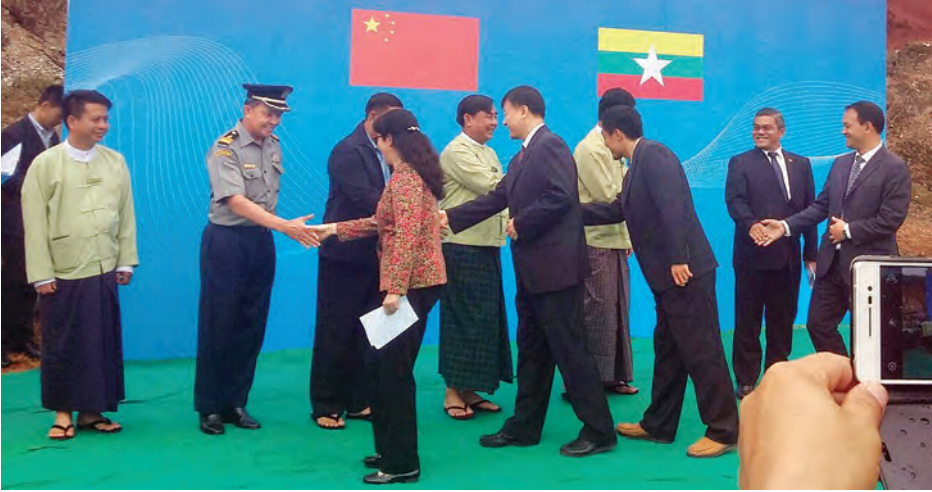
တရုတ်နိုင်ငံ ယူနန်ပြည်နယ်အစိုးရမှ မြန်မာနိုင်ငံသဘာဝဘေးသင့်ဒေသများအတွက် ပစ္စည်းများလျှို့ဝှက်မှုသည် အခမ်းအနားတွင် နှစ်နိုင်ငံတာဝန်ရှိသူများ ရင်းရင်းနှီးနှီးနှုတ်ဆက်စဉ်။

တရုတ်ပြည်သူ့သမ္မတနိုင်ငံ ယူနန်ပြည်နယ်အစိုးရ နိုင်ငံတကာရေးရာပူးပေါင်းဆောင်ရွက်ရေးရုံးမှ မြန်မာနိုင်ငံ အမျိုးသားသဘာဝဘေးအန္တရာယ်ဆိုင်ရာ စီမံခန့်ခွဲမှုကော်မတီသို့ဆက်သွယ်၍ ရခိုင်ပြည်နယ်တွင် ဆောက်လုပ်မည့် နေအိမ်များအနက် နေအိမ်အလုံး ၅၀၀၀ အတွက် ဆားငန်ရေထိခံနိုင်သော အလူမီနီယံဇင့်သွပ်ပြားချပ်ရေ နှစ်သိန်းကို ပေးပို့လျှို့ဝှက်ခဲ့သည်။