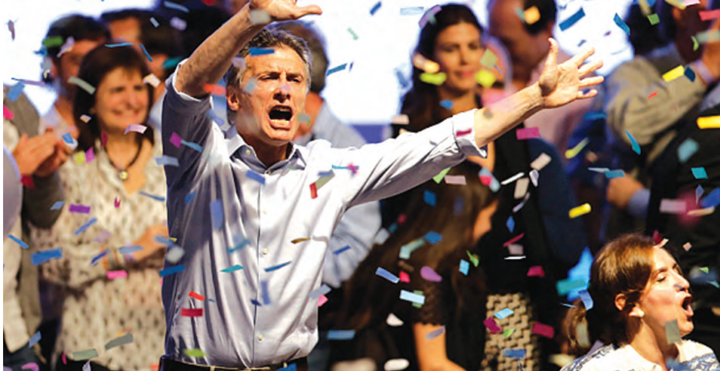
အာဂျင်တီးနား ရွေးကောက်ပွဲတွင် အောင်မြင်မှုရရှိခဲ့သည့် သမ္မတလောင်း မစ္စတာ မာကရီ။

အာဂျင်တီးနားနိုင်ငံ၏ ဒုတိယအကျော့ ရွေးကောက်ပွဲကို အိမ်နီးချင်း ဘရာဇီးလ်နှင့် ပင်နီစွဲလားနိုင်ငံတို့က စိတ်ဝင်တစားရှိနေကြသည်။ စီးပွားရေး အခက်အခဲ တွေ့နေသော ဘရာဇီးလ်နှင့် ပင်နီစွဲလားတို့သည်လည်း နိုင်ငံရေး လမ်းဆုံလမ်းခွဲသို့ ရောက်ရှိနေခြင်းကြောင့် ဖြစ်သည်ဟု နိုင်ငံရေးလေ့လာသူတို့က ဆိုသည်။ သမ္မတ ခရစ္စတီးနားဖာနန်ဒက် ကာချနာအစိုးရ လက်ထက်တွင် သက်သာချောင်ချိရေး စီမံကိန်းများ