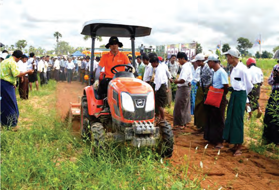
Daedong လယ်ယာသုံးစက်ကိရိယာပစ္စည်းများလက်တွေ့မောင်းနှင်သရုပ်ပြစဉ်

ကျွန်တော့်ရဲ့လယ်ယာလုပ်ငန်းခွင်မှာ အသုံးပြုဖို့ ထွန်စက်ဝယ်ယူခွင့်နေတာကြာပါပြီ။ ဒါပေမယ့် ထွန်စက်ဝယ်ယူဖို့ အခက်အခဲဖြစ်နေပါတယ်။ အခု သမဝါယမလမ်းကြောင်းကနေ အရစ်ကျငွေချေစနစ်နဲ့ ဒေဒ် ၆၀ HP လယ်ထွန်စက် (၁)စီးကို ဝယ်ယူခဲ့ပါတယ်။ လယ် (၁)ဧကရဲ့ ကုန်ကျစရိတ်ဟာ ဒီဇယ်ဆီဖိုး (၄၅၀၀) ကျပ် ဝန်းကျင်ပဲ ကုန်ကျပါတယ်။ ရိတာနဲ့ထွန်မယ်ဆိုရင် တစ်နေ့ပျမ်းမျှ (၁၀) ဧကမှ (၁၅) ဧကအထိပြီးပါတယ်။ ထယ်ခွံဆိုရင်တော့ (၈)ဧကမှ (၁၀)ဧကထိပြီးပါတယ်။ နွားနဲ့ထွန်မယ်ဆိုရင် ထယ်ခဲမာရင် ထယ်ရေးမညက်ပါဘူး။ စက်နဲ့ထွန်တဲ့အခါ ထယ်ခဲမာရင်လည်း စက်အားနဲ့ဆိုတော့ ထယ်ရေးညက်ပါတယ်။ ဒါကြောင့် စက်နဲ့အသုံးပြုတဲ့အတွက် သီးနှံအထွက်တိုးပါတယ်။ စက်နဲ့ထွန်ယက်စိုက်ပျိုးရတဲ့ အတွက် သီးနှံပိုမိုပြီးအထွက်တိုးခြင်း၊ အချိန်ကုန်သက်သာခြင်းများ ရရှိခဲ့ပါတယ်။ မိမိကျေးရွာတွင်သာမက အခြားမြို့နယ်များသို့လည်း ထွန်စက်အငှားလိုက်ရခြင်းတို့ကြောင့် မိသားစုဝင်ငွေလည်းရရှိပြီး မိသားစုစီးပွားရေးလည်း ပိုမိုကောင်းမွန်လာပါတယ်။ စီးပွားရှာတဲ့နေရာမှာလည်း အဆင်ပြေတဲ့အတွက် အရစ်ကျငွေချေစနစ်နဲ့ ပေးဆပ်ရမဲ့အချိန်တိုင်းမှာ အခက်အခဲမရှိ ပေးဆပ်နိုင်ပါတယ်။