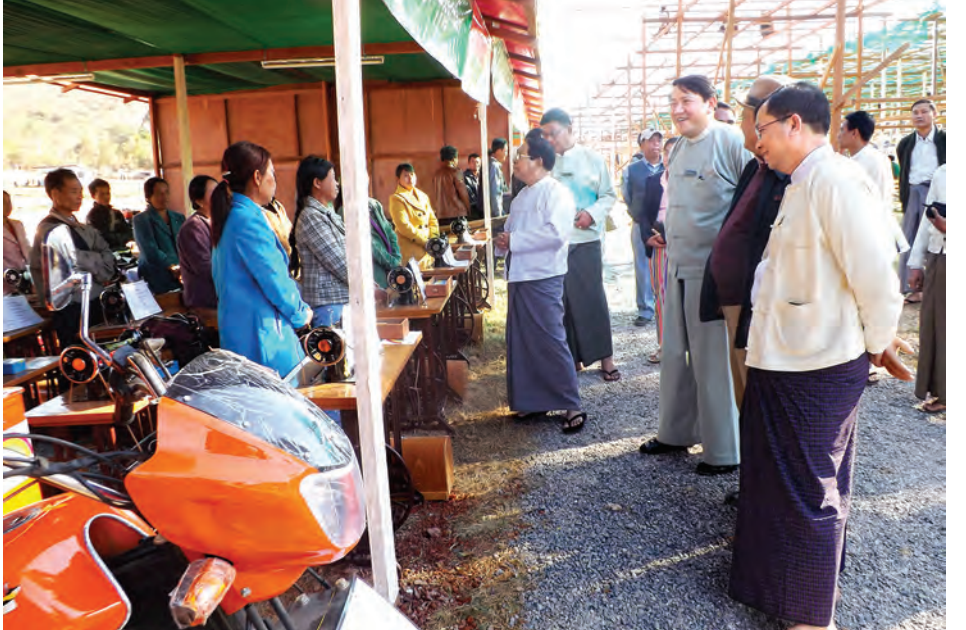
အရစ်ကျငွေချေစနစ်ဖြင့် ရောင်းချပေးသည့် လုပ်ငန်းသုံးစက်ကိရိယာပစ္စည်းများ