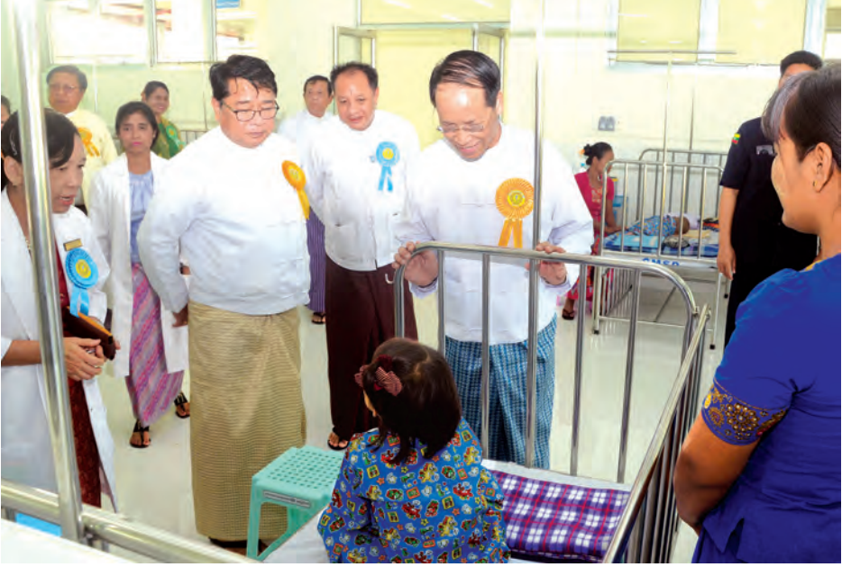
ဒုတိယသမ္မတ ဒေါက်တာစိုင်းမောက်ခမ်း ကလေးရောဂါအထူးကုဆေးရုံကြီးအတွင်း ဆေးကုသမှုခံယူနေသည့် ကလေးငယ်များအား ကြည့်ရှုအားပေးစဉ်။ (သတင်းစဉ်)

ပြည်ထောင်စုသမ္မတမြန်မာနိုင်ငံတော် ဒုတိယသမ္မတ ဒေါက်တာစိုင်းမောက်ခမ်းသည် ယနေ့ နံနက် ၉ နာရီခွဲတွင် နေပြည်တော် ဥက္ကရသီရိမြို့နယ်၌ ဖွင့်လှစ်သည့် ကလေးရောဂါအထူးကုဆေးရုံကြီး ဖွင့်ပွဲအခမ်းအနားသို့ တက်ရောက်သည်။