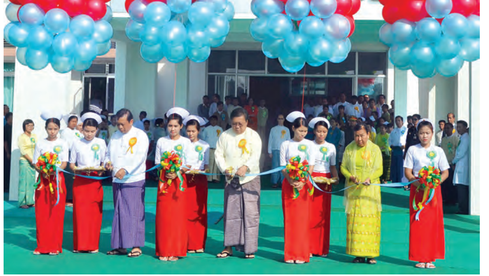
ဆရာဝန်၊ သူနာပြုကျွမ်းကျင်ဝန်ထမ်းများ၊ ဆေးဝါးနှင့် အထောက်အကူပြုပစ္စည်းကိရိယာများ၊ ကျန်းမာရေးဝန်ထမ်းအိမ်ရာနှင့် လူမှုစီးပွားဘဝ လိုအပ်ချက်များကို တတ်အားသရွေ့ ထောက်ပံ့ကူညီနိုင်ပြီဖြစ်၍ တိုးတက်သည့် နေပြည်တော် ကလေးဆေးရုံကြီးအပါအဝင် စုစုပေါင်း ကလေးရောဂါအထူးကုဆေးရုံကြီး ငါးရုံရှိလာပြီဖြစ်ကြောင်း သိရသည်။ (သတင်းစဉ်)

မြန်မာနိုင်ငံတွင် ရန်ကုန်မြို့၊ ရန်ကင်းမြို့နယ်၌ ခုတင်(၅၅၀)ဆုံ ကလေးဆေးရုံကြီး တစ်ရုံ၊ ဒဂုံမြို့နယ်၌ ခုတင်(၅၅၀)ဆုံ ကလေးဆေးရုံကြီး တစ်ရုံ၊ မန္တလေးမြို့၌ ခုတင်(၅၅၀)ဆုံ ကလေးဆေးရုံကြီးနှင့် ခုတင်(၃၀၀)ဆုံ ကလေးဆေးရုံကြီးတစ်ရုံတို့ ဖွင့်လှစ်ထားပြီး ယခုဖွင့်လှစ်