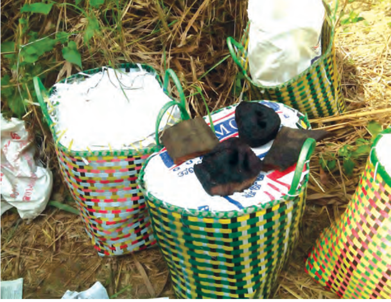
တရား မဝင်ဆင်သားရေခြောက်များကို နိုင်လွန် ခြင်းများဖြင့် သယ်ဆောင် လာသည်ကို သိမ်းဆည်းရမိစဉ်။

အား စုံစမ်းဖော်ထုတ် အရေးယူပေးပါရန်တိုင်ကြားချက်အရ ဖဒိုနယ်မြေရဲစခန်းက ဖြစ်မှုကျူးလွန်သူများအား အမြန်ဆုံးဖမ်းဆီးရမိနိုင်ရေးအတွက် ဆောင်ရွက်လျက်ရှိကြောင်း သိရသည်။ သတင်းနှင့်စာတိုက်-ခင်ကို(ကျောက်တံခါး)