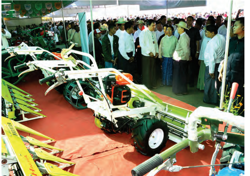
အရစ်ကျငွေချေစနစ်ဖြင့် ရောင်းချပေးသည့် လယ်ယာသုံးစက်ကိရိယာပစ္စည်းများ