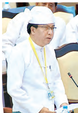
ဒုတိယဝန်ကြီး ဒေါက်တာဇော်မင်းအောင်။

ယင်းနောက် နည်းပညာနှင့် သက်မွေးပညာရေးဥပဒေကြမ်းနှင့် စပ်လျဉ်း၍ အမျိုးသားလွှတ်တော် ဥပဒေကြမ်းကော်မတီ၏ အစီရင်ခံစာကို ကော်မတီအတွင်းရေးမှူး ဒေါက်တာ မြတ်ဉာဏ်စိုးက ပြန်လည်ဖတ်ကြားတင်သွင်းပြီး ယင်းဥပဒေကြမ်းအား တစ်ပိုင်းချင်းစီအလိုက်