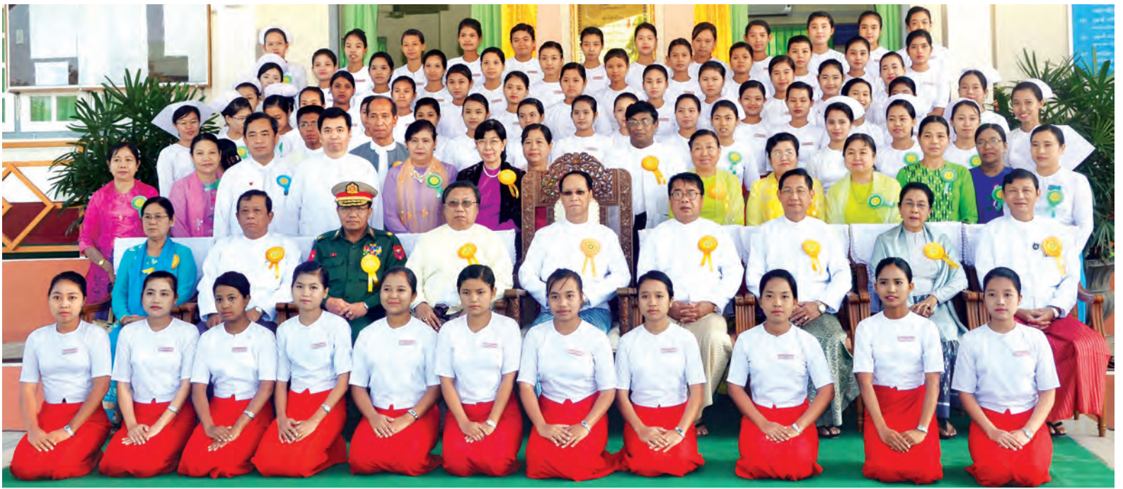
ဒုတိယသမ္မတ ဒေါက်တာစိုင်းမောက်ခမ်း၊ သူနာပြုသင်တန်းကျောင်းနှင့် သားဖွားသင်တန်းကျောင်းဖွင့်ပွဲအခမ်းအနားတွင် တက်ရောက်ကြသူများနှင့်အတူ စုပေါင်းမှတ်တမ်းတင်ဓာတ်ပုံရိုက်စဉ်။ (သတင်းစဉ်)

ဆက်လက်၍ ဒုတိယသမ္မတသည် အဆိုပါ ဆေးရုံဝင်းအတွင်းရှိ သားဖွား သင်တန်းကျောင်းဖွင့်ပွဲအခမ်းအနားသို့ တက်ရောက်သည်။ အခမ်းအနားတွင် နေပြည်တော် ကောင်စီဝင် ကျန်းမာရေးတာဝန်ခံ ပါမောက္ခ ဒေါက်တာပိုင်စိုး၊ ကျန်းမာရေးဝန်ကြီးဌာန ဒုတိယဝန်ကြီး