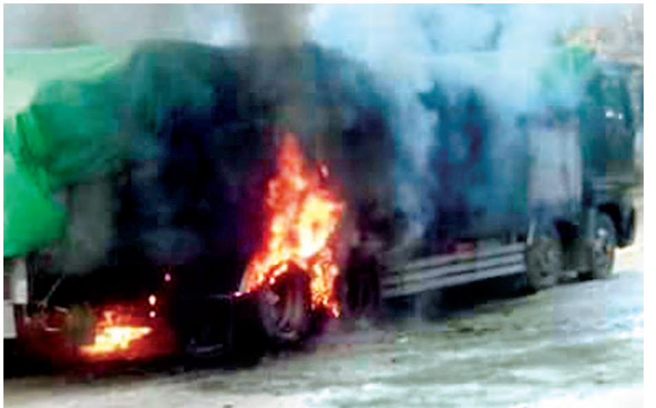
(၁၂)ဘီးယာဉ် နောက်ဘီးတာယာများ အပူလွန်ကဲ၍ မီးလောင်မှု ဖြစ်ပွားနေသည်ကို တွေ့ရစဉ်။

နေပြည်တော် ဒီဇင်ဘာ ၂ မကွေးတိုင်းဒေသကြီး ဂန့်ဂေါမြို့နယ် ခေါင်းတုံကျေးရွာအနီး မုံရွာ-ဂန့်ဂေါ-ကလေးကားလမ်း မိုင်တိုင်အမှတ်(၉၆/၀-၁) ကြား၌ ဒီဇင်ဘာ ၁ ရက် ညနေ ၅ နာရီခွဲက ယာဉ်တစ်စီး မီးလောင်မှုဖြစ်ပွားကြောင်း သတင်း အရ ဂန့်ဂေါခရိုင် မြို့နယ်အုပ်ချုပ်ရေးမှူးများ၊ မြို့နယ်ရဲတပ်ဖွဲ့မှူးဦးစီး သည့်တပ်ဖွဲ့ဝင်များ၊ မြို့နယ်မီးသတ်ဦးစီးမှူးဦးစီးသည့် မီးသတ်တပ်ဖွဲ့ဝင် များနှင့် မီးသတ်ယာဉ်နှစ်စီး၊ ကျေးရွာနေပြည်သူများ ပူးပေါင်း၍ ဝိုင်းဝန်း ငြိမ်းသတ်ခဲ့ရာ ညနေ ၅ နာရီ မိနစ် ၄၀ တွင် မီးငြိမ်းသွားခဲ့သည်။