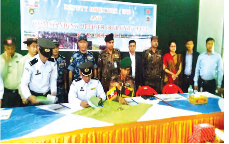
လေ့စားရွှေ့ပြောင်းသွားလာသူများ လွှဲပြောင်းလက်ခံရန် မောင်တောခရိုင်(လဝက)မှူးနှင့် အမှတ်(၁၇) BGB တပ်ရင်းမှူးတို့ လက်မှတ်ရေးထိုးနေစဉ်။ (အပေါ်ပုံ)