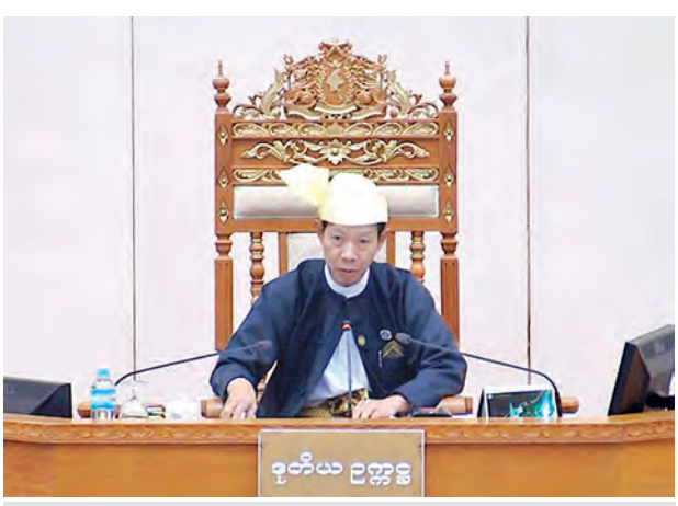
ပြည်သူ့လွှတ်တော် (၁၃)ကြိမ်မြောက် ပုံမှန်အစည်းအဝေး ကျင်းပရာ ဒုတိယဥက္ကဋ္ဌ ဦးနန္ဒကျော်စွာ တက်ရောက်စဉ်။

အစည်းအဝေးတွင် ပြည်သူ့လွှတ်တော် သယံဇာတနှင့် သဘာဝပတ်ဝန်းကျင်ထိန်းသိမ်းရေးဆိုင်ရာ ကော်မတီနှင့် ပြည်သူ့လွှတ်တော် စီးပွားရေးနှင့် ကုန်သွယ်လုပ်ငန်း ဖွံ့ဖြိုးတိုးတက်ရေး ကော်မတီတို့၏ လေ့လာတွေ့ရှိချက်နှင့် သဘောထား မှတ်ချက်များပါဝင်သော အစီရင်ခံစာများကို ဖတ်ကြားတင်သွင်းကြသည်။ ဆက်လက်ပြီး အစီရင်ခံစာများနှင့်စပ်လျဉ်း၍ ဆွေးနွေးလိုသည့် ကိုယ်စားလှယ်များရှိပါက အမည်