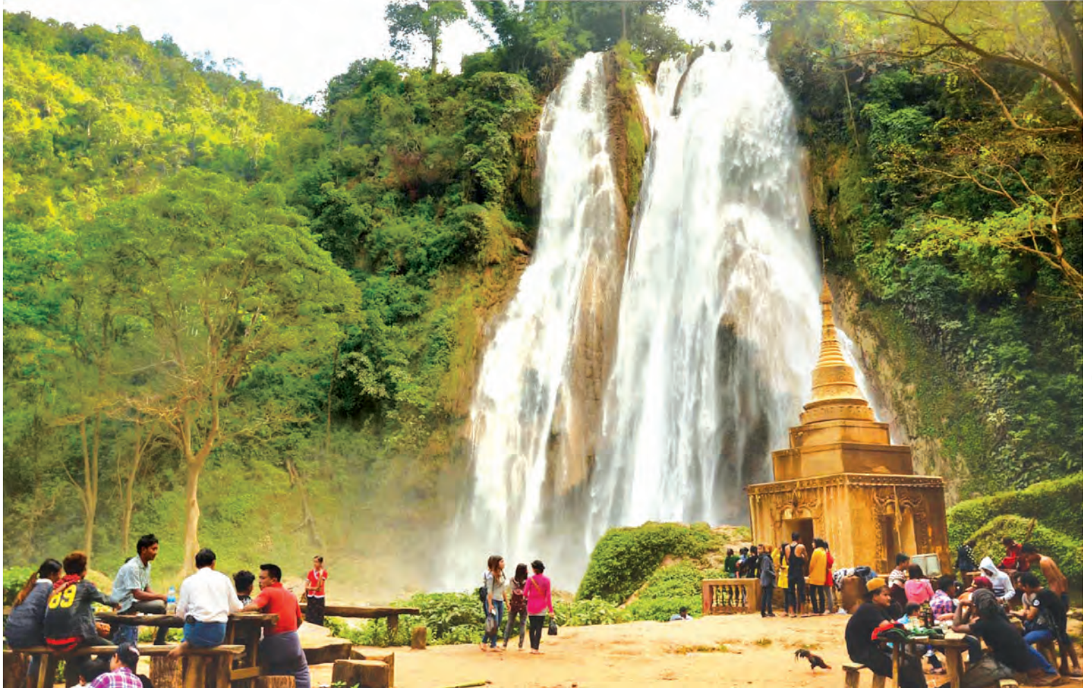
ပြင်ဦးလွင်မြို့ရှိ ဓာတ်တော်ချိုင့်ရေတံခွန်ကို လာရောက်လည်ပတ်သူများနှင့် တွေ့ရစဉ်။