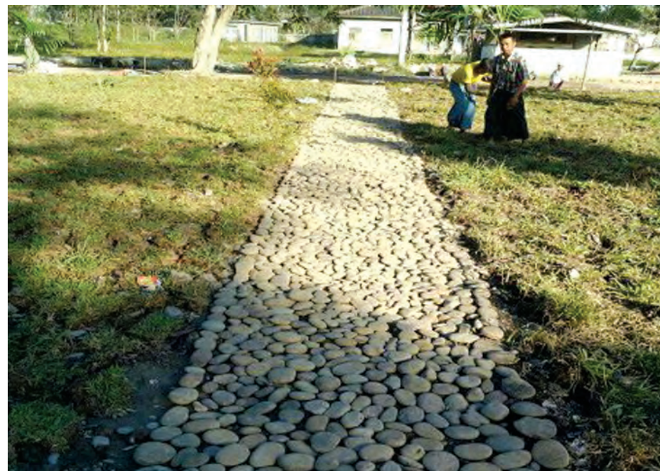
ကျောင်းပန်းခြံကို အဆင့်မြင့်တင်ပြုပြင်နေစဉ်။