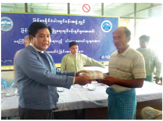
ငါးလုပ်ငန်းအဖွဲ့ချုပ်အနေဖြင့် တတ်နိုင်သမျှ ထောက်ပံ့ငွေများ ပေးအပ်ကြောင်း ပြောကြားသည်။

တိုက်ကြီးမြို့နယ်တွင် ဩဂုတ်လနှင့်စက်တင်ဘာလအတွင်း ရေကြီးနစ်မြုပ်ခဲ့သည့် ငါး၊ ပုစွန်ကန်များသို့ မြန်မာနိုင်ငံ ငါးလုပ်ငန်းအဖွဲ့ချုပ်က ထောက်ပံ့ငွေများ ပေးအပ်ပုံကို နိုဝင်ဘာ ၃၀ ရက် နံနက် ၁၀ နာရီက ကျင်းပခဲ့ကြောင်း သိရသည်။