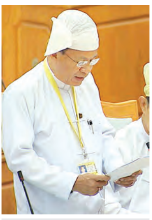
ပြည်ထောင်စုဝန်ကြီး ဒေါက်တာကလေး ရှင်းလင်းတင်ပြစဉ်။

အစည်းအဝေး၌ ပြည်သူ့လွှတ်တော်နှင့် အမျိုးသားလွှတ်တော်တို့က သဘောတူညီထားသည့် အမြန်လမ်းမကြီးများဥပဒေကို ပြင်ဆင်သည့် ဥပဒေကြမ်း၊ လမ်းနှင့်တံတားအသုံးပြုခြင်းဆိုင်ရာဥပဒေကို ဒုတိယအကြိမ်ပြင်ဆင်သည့် ဥပဒေကြမ်းနှင့် လမ်းမကြီးများ ဥပဒေကို ဒုတိယအကြိမ် ပြင်ဆင်သည့်ဥပဒေကြမ်းတို့ကို ပြည်ထောင်စုလွှတ်တော်က အတည်ပြုသည်ဟု မှတ်ယူ၍ လွှတ်တော်က မှတ်တမ်းတင်ကြောင်း ဆုံးဖြတ်သည်။ ထို့နောက် နိုင်ငံတော်သမ္မတထံမှ ပေးပို့သည့် ပေကျင်းကနဦးစာတမ်းကို မြန်မာနိုင်ငံက ပါဝင်လက်မှတ်ရေးထိုးနိုင်ရန် ကိစ္စနှင့်စပ်လျဉ်း၍ ပြည်ထောင်စုဝန်ကြီးဒေါက်တာကလေးက ပေကျင်းကနဦး