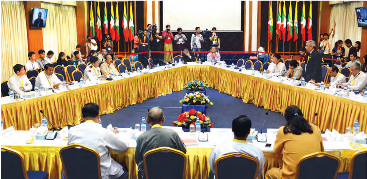
နိုင်ငံရေးဆွေးနွေးမှုဆိုင်ရာ မူဘောင်(မူကြမ်း)ရေးဆွဲရေး တတိယနေ့အစည်းအဝေးကျင်းပနေစဉ်။

ယခုဆွေးနွေးခဲ့သည့် သုံးရက်အတွင်း၌ မူဘောင်တွင်ပါရှိရမည့် အခန်း ၁၀ ခန်းအပြင် အဲဒီထဲမှဆွေးနွေးရမည့် အကြောင်းအရာကိစ္စများ