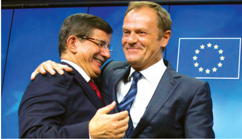
ဘရပ်ဆဲလ် နိုဝင်ဘာ ၃၀

တူရကီအနေဖြင့် ရွှေ့ပြောင်းနေထိုင်သူများ ဥရောပသို့ဝင်ရောက်ရာတွင် ငွေကြေးနှင့်ဗီဇာအကူအညီများ ပေးသွားရန် အီးယူနှင့်ပူးပေါင်း ဆောင်ရွက်သွားမည်ဖြစ်ကြောင်း၊ အိမ်နီးချင်းနိုင်ငံများနှင့် ခြေလှမ်းသစ်များ စတင်ပြုဖြစ်ကြောင်း ဝန်ကြီးချုပ်က တနင်္ဂနွေနေ့တွင် ကတိပြုပြောကြားလိုက်သည်။