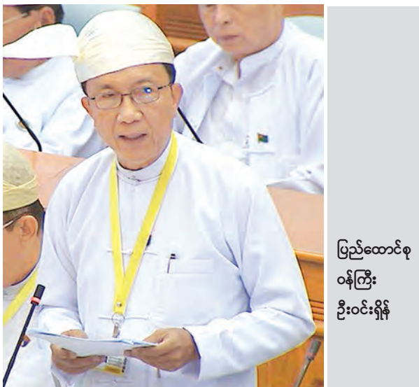
ပြည်ထောင်စု ဝန်ကြီး ဦးဝင်းရှိန်

မှတ်ချက်။ ပြည်ပချေးငွေဖြင့် ဆောင်ရွက်သည့်စီမံကိန်းလုပ်ငန်း၏အကောင် အထည်ဖော်မှုအလိုက် ချေးငွေများထုတ်ယူသုံးစွဲခြင်း၊ အရင်း ပြန်လည်ပေးဆပ်ခြင်းနှင့် ငွေလဲလှယ်နှုန်းပြောင်းလဲခြင်းတို့ ကြောင့် ပြည်ပကြွေးမြီစာရင်းပမာဏ ပြောင်းလဲမှုရှိပါသည်။