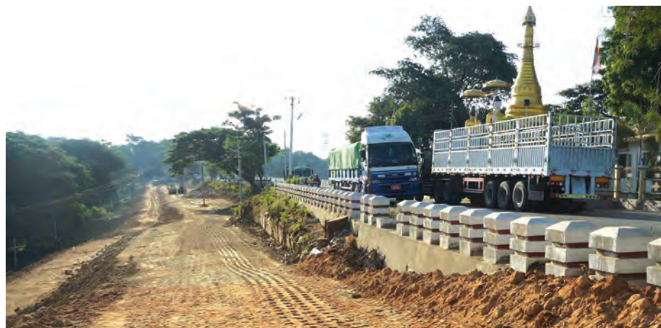
မိတ္ထီလာ နိုဝင်ဘာ ၃၀ မန္တလေးကားလမ်းမကို ယူဇနကုမ္ပဏီ ကတာဝန်ယူ တိုးချဲ့ဖောက်လုပ်လျက် ရှိကြောင်း သိရသည်။ အရှေ့ဘက်ကန်ပေါင်အနီး ရန်ကုန်-မန္တလေးကားလမ်းပိုင်း တွင်တည်ရှိကာ ကျဉ်းမြောင်းပြီး နေရာသည် အာရှအထူးပြေးလမ်းမ ကြီး အမှတ်(၁)တွင်ပါဝင်ပြီး ယခင် ကပေ ၆၀ ကျော်မြင့်သည့်ကုန်းပေါ် တွင်တည်ရှိကာ ကျဉ်းမြောင်းပြီး

မော်တော်ယာဉ်ကြီးများ ဖြတ်သန်း သွားလာရာတွင် အဆင်မပြေဖြစ်ခဲ့ ရသည်။ အာရှအထူးပြေးလမ်းမကြီး အမှတ်(၁)ပေါ်တွင် ပါဝင်ခဲ့သော လမ်းဖြစ်ပြီး ယာဉ်ကြီး/ငယ်များ၊ မော်တော်ဆိုင်ကယ်များနှင့် လမ်းသွား လမ်းလာများ အဆင်ပြေချောမွေ့စွာ သွားလာနိုင်ရေးအတွက် ယာဉ်သွား လမ်း တိုးချဲ့ဖောက်လုပ်နေခြင်းဖြစ် သည်။ ပေ ၆၀ ကျော်မြင့်သည့် ကုန်းပေါ်ဘေးတွင်ကပ်လျက် ယင်း အမြင့်ပေအတိုင်း စက်ယန္တရားကြီး များဖြင့် မြေဖို့ပြုပြင်ပြီး မူလလမ်း နှင့်တိုးချဲ့လမ်း စုစုပေါင်း ပေ ၁၀၀ အကျယ် လမ်းမကြီးဖြစ်အောင် တိုးချဲ့ဖောက်လုပ်မည် ဖြစ်ကြောင်း သိရသည်။ ချမ်းသာ(မိတ္ထီလာ)