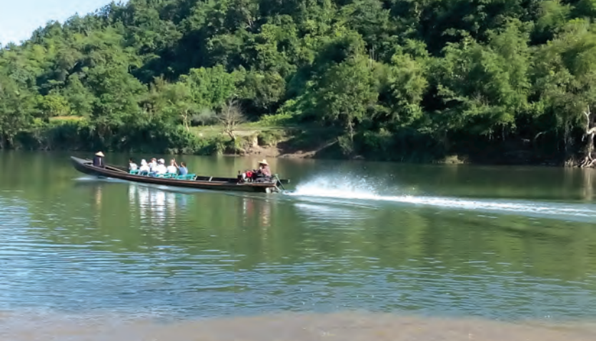
ဒုဋ္ဌဝတီမြစ်အတွင်း ရေယာဉ်ဖြင့် လည်ပတ်နေသော နိုင်ငံခြားသားများ။