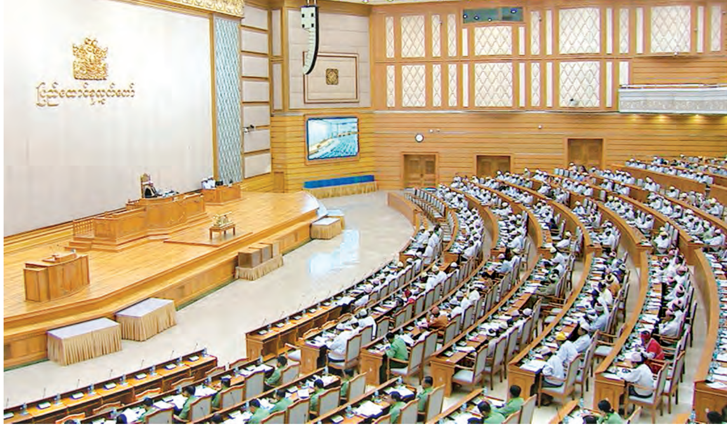
ပထမအကြိမ် ပြည်ထောင်စုလွှတ်တော် (၁၃) ကြိမ်မြောက် ပုံမှန်အစည်းအဝေး ပဉ္စမနေ့ကျင်းပစဉ်။ (သတင်းစဉ်)

ပထမအကြိမ် ပြည်ထောင်စုလွှတ်တော် (၁၃)ကြိမ်မြောက် ပုံမှန်အစည်းအဝေး ပဉ္စမနေ့ကို ယနေ့မုန်းလွဲ ၁ နာရီခွဲတွင်ကျင်းပရာ ပြည်ထောင်စုလွှတ်တော်က အတည်ပြုသည်ဟု မှတ်ယူရမည့် ဥပဒေကြမ်းသုံးခုအား မှတ်တမ်းတင်ခြင်း၊ မြန်မာနိုင်ငံက ပါဝင်လက်မှတ်ရေးထိုးရေးကိစ္စ သုံးခုနှင့်စပ်လျဉ်း၍ ဆွေးနွေးခြင်း၊ ၂၀၁၄-၂၀၁၅ ဘဏ္ဍာရေးနှစ် ဒုတိယ ခြောက်လပတ် အမျိုးသားစီမံကိန်းဆောင်ရွက်မှု အစီရင်ခံစာနှင့်စပ်လျဉ်း၍ ရှင်းလင်းဆွေးနွေးခြင်း၊ လွှတ်တော်၏ အဆုံးအဖြတ်ရယူခြင်းနှင့် ၂၀၁၅-၂၀၁၆ ဘဏ္ဍာရေးနှစ် ပြည်ထောင်စု၏ နောက်ထပ်ဘဏ္ဍာငွေခွဲဝေသုံးစွဲရေး ဥပဒေကြမ်းနှင့်စပ်လျဉ်း၍ ဆွေးနွေးခြင်းတို့ကို ဆောင်ရွက်ခဲ့ကြသည်။ စာမျက်နှာ ၈ ကော်လံ ၁ □