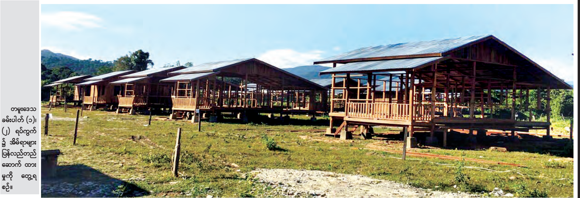
တမူးဒေသ ခမ်းပါတ် (၁)၊ (၂) ရပ်ကွက် နှင့် အိမ်ရာများ ပြန်လည်တည်ဆောက် ထားမှုကို တွေ့ရစဉ်။