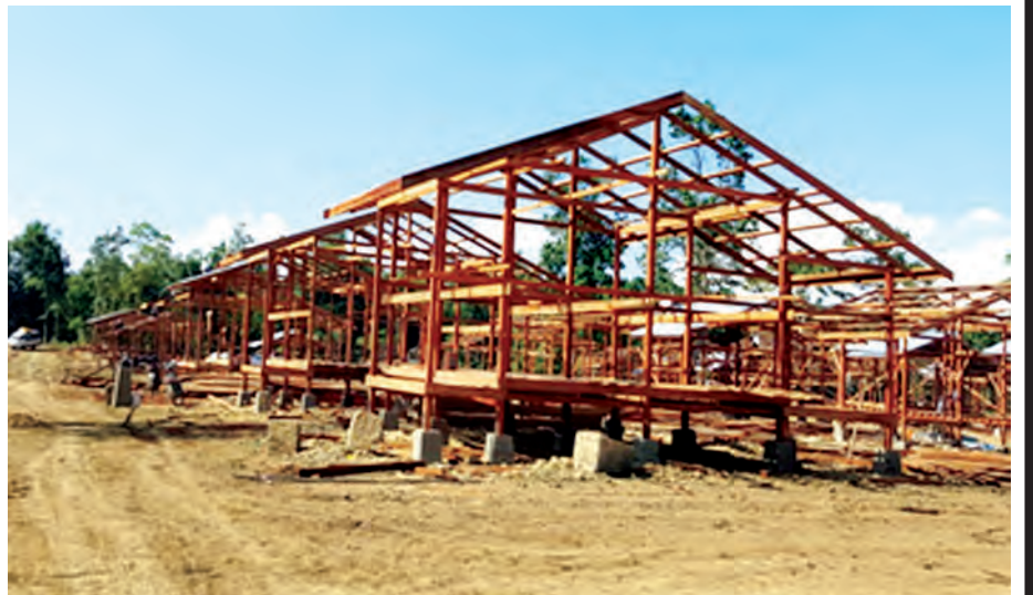
ထင်းဇင်ကျေးရွာ ပြန်လည်ထူထောင်ရေးအတွက် အိမ်ရာများဆောက်လုပ်ထားမှုကို တွေ့ရစဉ်။