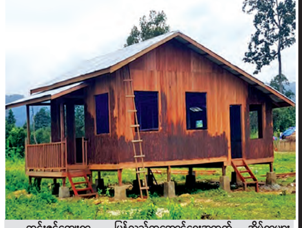
ထင်းဇင်ကျေးရွာ ပြန်လည်ထူထောင်ရေးအတွက် အိမ်ရာများ ဆောက်လုပ်ထားမှုကို တွေ့ရစဉ်။