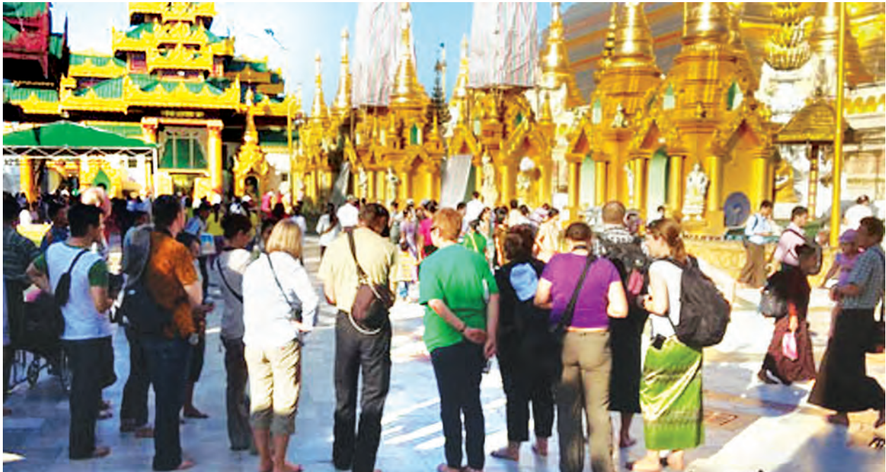
ရွှေတိဂုံစေတီတော်၌ ဘုရားဖူးပြည်သူများ၊ လာရောက်လေ့လာကြသည့် ပြည်ပခရီးသွားဧည့်သည်များအား တွေ့ရစဉ်။

ဂျပန်အစိုးရ၏အစီအစဉ်ဖြင့် အရှေ့တောင်အာရှနိုင်ငံများသို့ (၄၂)ကြိမ်