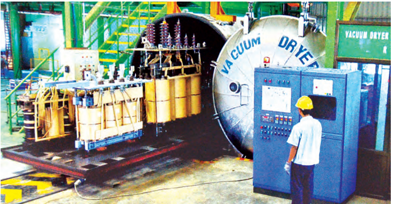
ဂျပန်မှ ဟီတာချီကုမ္ပဏီနှင့် SOE Electric & Machinery တို့ ပူးပေါင်းထုတ်လုပ်သည့် ထရပ်စဖော်မာထုတ်လုပ်ရေးလုပ်ငန်းခွင်ကို တွေ့ရစဉ်။

ကျော် နယ်သာလန်နိုင်ငံမှ ထရပ်စဖော်မာထုတ်လုပ်မှု ထောက်ခံချက်ပေးသောအဖွဲ့က အသိအမှတ်ပြုခံထားရသော ကုမ္ပဏီဖြစ်ကြောင်း