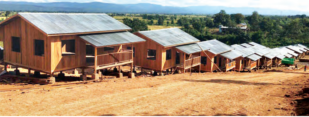
တမူးဒေသ ကနန်ကျေးရွာ၌ အိမ်ရာများ အစီအရိအောက်လုပ်ထားမှုကို တွေ့ရစဉ်။