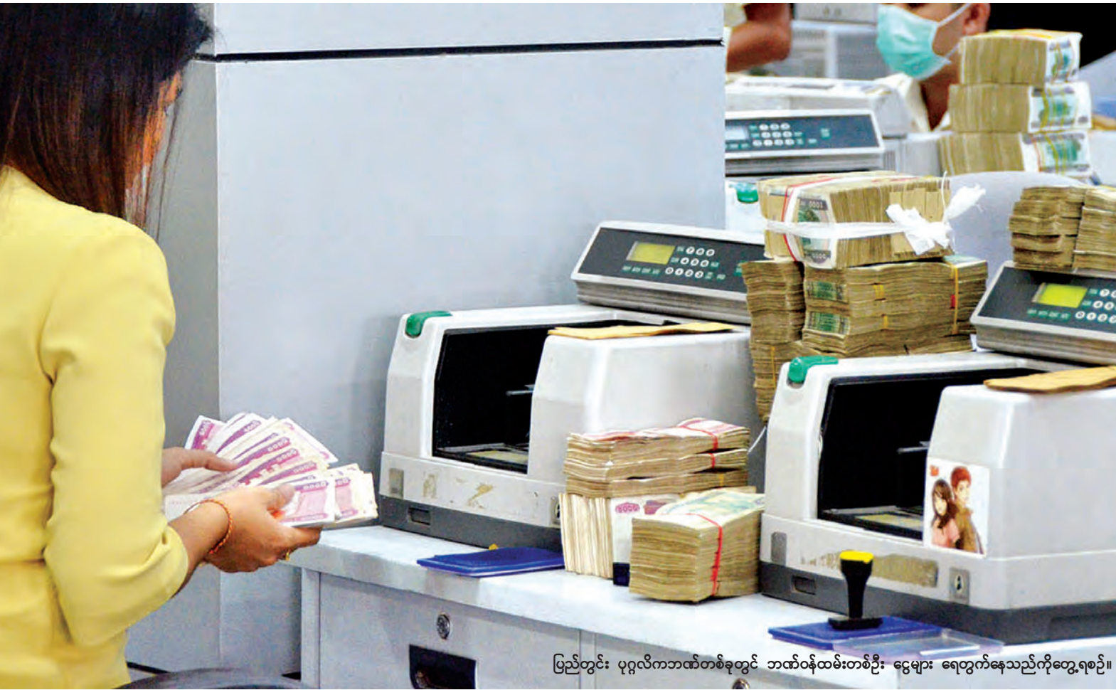
ပြည်တွင်း ပုဂ္ဂလိကဘဏ်တစ်ခုတွင် ဘဏ်ဝန်ထမ်းတစ်ဦး ငွေများ ရေတွက်နေသည်ကိုတွေ့ရစဉ်။

သတင်း-မြင့်မောင်စိုး၊ ဓာတ်ပုံ-တင်စိုး(မြန်မာ့အလင်း)