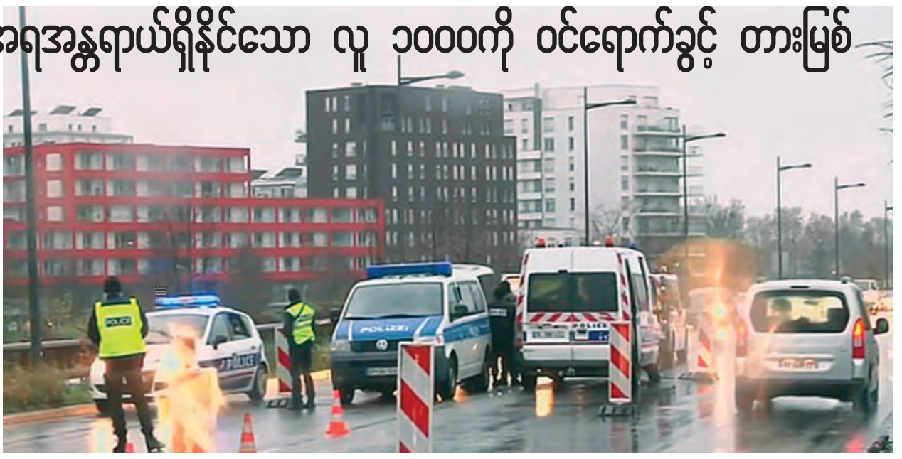
ပြင်သစ်နိုင်ငံ ပါရီမြို့၌ ကျင်းပမည့် ကုလသမဂ္ဂအစည်းအဝေးကို တက်ရောက်မည်ဖြစ်သည်။ နိုဝင်ဘာ ၂၉ ရက် နှင့် ၃၀ ရက်တို့တွင် မြို့တော်ပါရီအနီးရှိ ယာဉ်ကြော

နိုင်ငံပေါင်း ၁၅၀ နီးပါးမှ ခေါင်းဆောင်များသည် နိုဝင်ဘာ ၃၀ ရက်တွင်