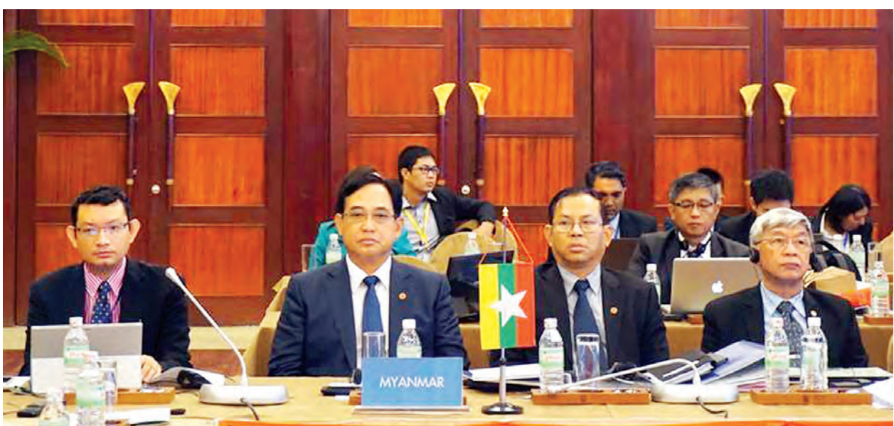
ပြည်ထောင်စုဝန်ကြီး ဦးဇေယျာအောင် (၁၅)ကြိမ်မြောက် အာဆီယံသတင်းအချက်အလက်နှင့် နည်းပညာဆိုင်ရာဝန်ကြီးများ အစည်းအဝေးနှင့် ဆက်စပ်အစည်းအဝေးများသို့ တက်ရောက်စဉ်။

နေပြည်တော် နိုဝင်ဘာ ၂၉ - စွမ်းအင်ဝန်ကြီးဌာနနှင့် ဆက်သွယ်ရေးနှင့် သတင်းအချက်အလက် နည်းပညာဝန်ကြီးဌာန ပြည်ထောင်စု ဝန်ကြီး ဦးဇေယျာအောင်သည် (၁၅)ကြိမ်မြောက် အာဆီယံ သတင်း အချက်အလက်နှင့် နည်းပညာဆိုင်ရာ ဝန်ကြီးများ အစည်းအဝေးနှင့်ဆက်စပ် အစည်းအဝေးများသို့ တက်ရောက် ၍ မြန်မာနိုင်ငံ၏ ဆက်သွယ်ရေး ကဏ္ဍသည် လျင်မြန်စွာဖွံ့ဖြိုးတိုးတက် လျက်ရှိကြောင်း၊ တယ်လီဖုန်းအသုံး ပြုနိုင်မှုသည် ၂၀၁၀-၁၁ ခုနှစ်တွင် ငါးရာခိုင်နှုန်းအောက်သာ ရှိခဲ့ရာမှ ယနေ့အချိန်တွင် ၆၀ ရာခိုင်နှုန်းကျော် အထိ တိုးတက်သုံးစွဲလာနိုင်ပြီဖြစ် ကြောင်းနှင့် ဈေးနှုန်းများသည်လည်း အများပြည်သူ အလွယ်တကူသုံးစွဲ နိုင်သည့် ဈေးနှုန်းဖြစ်လာသဖြင့် ဆက်သွယ်ရေးဝန်ဆောင်မှုများအား ပြောကြားသည်။