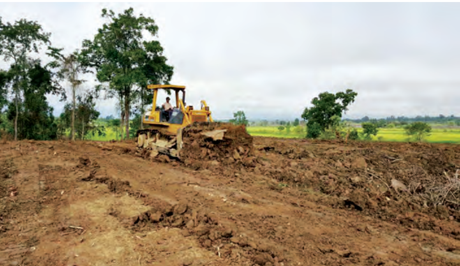
မင်းသမီးကျေးရွာ ပြည်သူများလုပ်ကိုင်စားသောက်ရန်အတွက် စက်ယန္တရားဖြင့် မြေယာဖော်ထုတ်နေမှုကို တွေ့ရစဉ်။