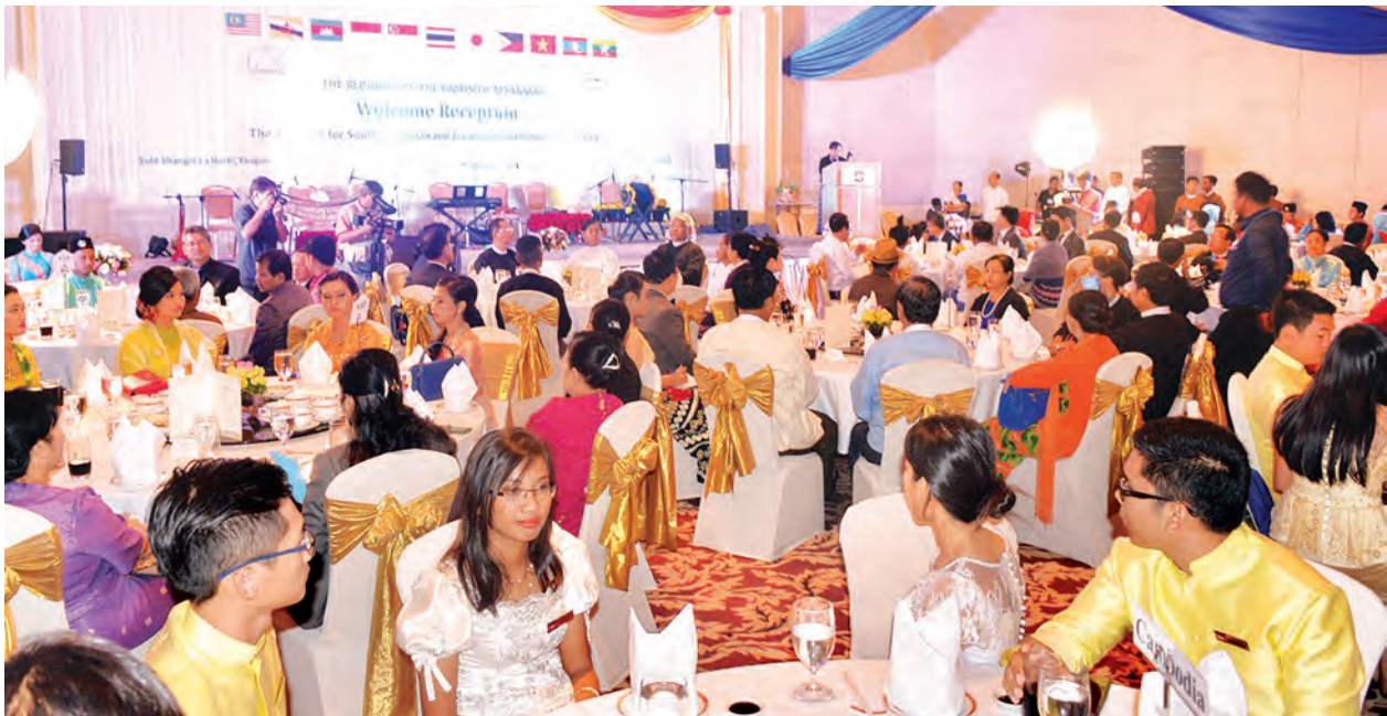
၃ နာရီခွဲတွင် ရန်ကုန်မြို့၊ ကမ်းနားလမ်းရှိ ဗိုလ်အောင်ကျော်ဆိပ်ကမ်းမှ ပြန်လည်ထွက်ခွာသွားရာ ရန်ကုန်မြို့ပေါ်ရှိတက္ကသိုလ်များမှ ပါမောက္ခချုပ်များနှင့် တာဝန်ရှိသူများက ပို့ဆောင်နှုတ်ဆက်ကြပြီး ကျောင်းသား ကျောင်းသူများက တေးသီချင်း၊ အကများဖြင့် ဖျော်ဖြေနှုတ်ဆက်ပေးခဲ့ကြကြောင်း သိရသည်။

မြန်မာနိုင်ငံ၌ သုံးရက်တာရောက်ရှိနေသည့် အရှေ့တောင်အာရှနှင့် ဂျပန် လူငယ်များလိုက်ပါလာသော သင်တန်းပေးပို့ရေးအဖွဲ့သည် ယနေ့ညနေ