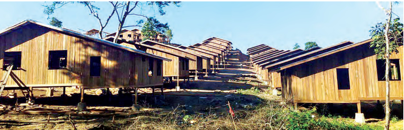
က နန်ကျေး ရွာ ၌ စနစ် တကျ ဆောက်လုပ် ထား သည့် အိမ် ရာများ ကို တွေ့ရစဉ်။