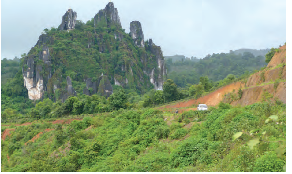
နေပြည်တော်-ပင်လောင်းလမ်းပိုင်းရှိ တောင်ပေါ်ဒေသရှုခင်းကို တွေ့ရစဉ်။

တောင်ပေါ်လမ်း၏ အချို့နေရာများတွင် တောင်ပြိုမှု များမကြာခဏဖြစ်သဖြင့် ချောက်ကမ်းပါးများကို မဒမ တိုင်များ အခိုင်အမာ စည်းနှောင်ထားသည့် မြေထိန်းနံရံ များဖြင့် ကာရံထားသည်။ သို့တိုင်အောင် မိုးအရွာများလျှင် မြေထိန်းနံရံ ပြုလုပ်ထားသည့် မဒမတိုင်များက အတွဲ လိုက်အောက်သို့လျှောကျလေ့ရှိသည်။ ကျွန်တော်တို့ ပင်လောင်းသို့ သွားနေစဉ် မိုင်တိုင်အမှတ်(၃၅/၂) တွင် တောင်ပြိုကာ မြေထိန်းနံရံတစ်ခုလုံး အပေါ်လမ်းမှ အောက်လမ်းပေါ်သို့ ကျနေခဲ့သဖြင့် ကားလမ်းက သွား၍