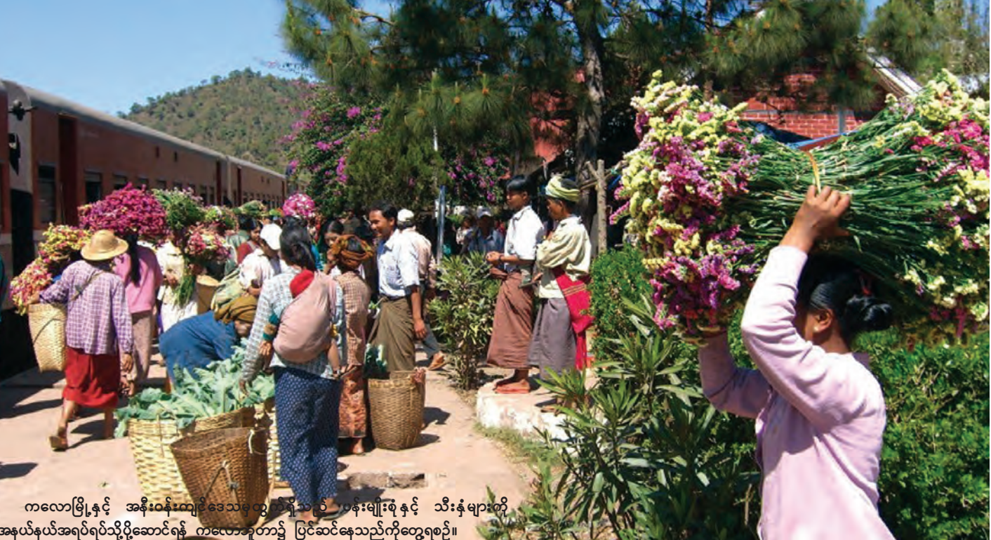
ကလေးမြို့နှင့် အနီးဝန်းကျင်ဒေသမှလွှဲလာသည့် ပန်းမျိုးစုံနှင့် သီးနှံများကို အနယ်နယ်အရပ်ရပ်သို့ပို့ဆောင်ရန် ကလေးဘူတာ၌ ပြင်ဆင်နေသည်ကိုတွေ့ရစဉ်။