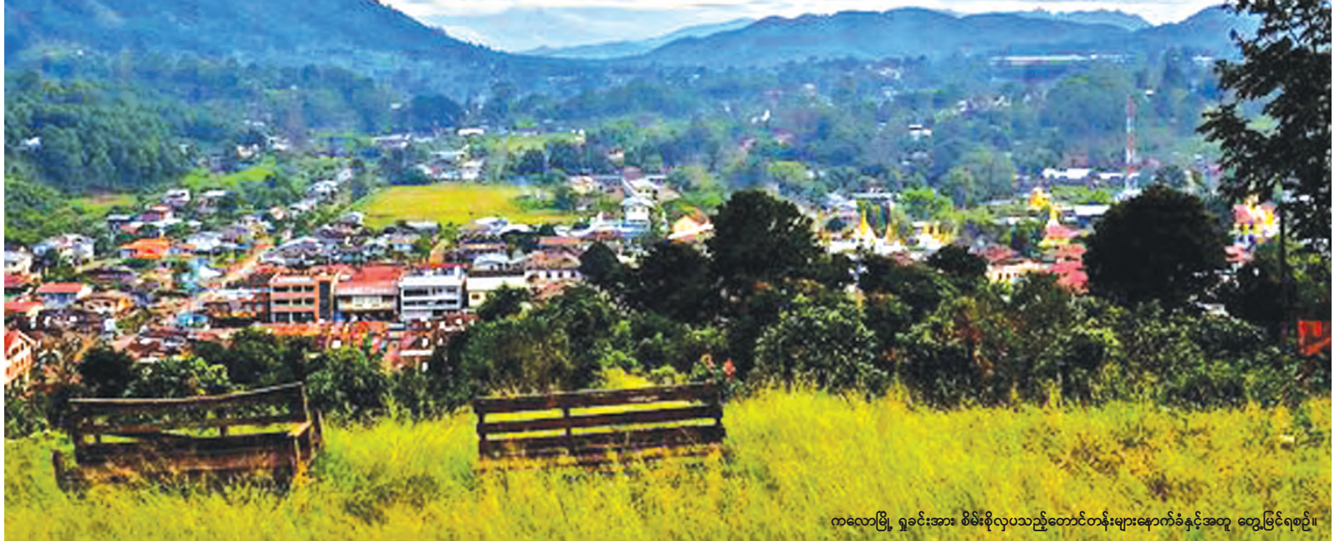
ကလေးမြို့ ရှမ်းအား စိမ်းစိုလှပသည့်တောင်တန်းများနောက်ခံနှင့်အတူ တွေ့မြင်ရစဉ်။

သတင်းဆောင်းပါး-မောင်မောင်မြင့်ဆွေ