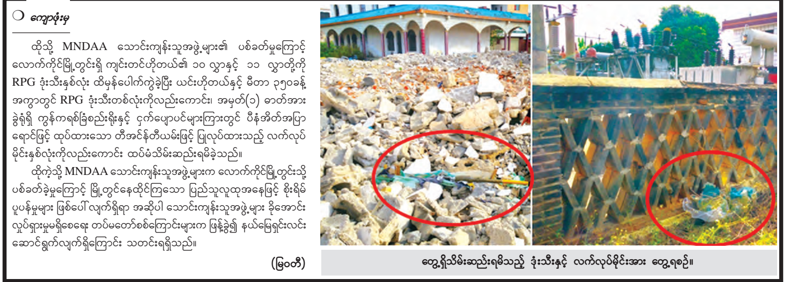
တွေ့ရှိသိမ်းဆည်းရမိသည့် ခုံးသီးနှင့် လက်လုပ်မိုင်းအား တွေ့ရစဉ်။

နေပြည်တော်နှင့် မန္တလေးမြို့ တို့ အနီးတစ်ဝိုက်တွင် ယနေ့ တိမ်အသင့်အတင့် ဖြစ်ထွန်းမည်။ မနက်ဖြန်အတွက် ခန့်မှန်းချက် မှာ တနင်္လာရက်တိုင်းဒေသကြီးနှင့် မွန်ပြည်နယ်တို့တွင် နေရာကွက် ကျား မိုးထစ်ချွန်းရွာမည်။ ဘင်္ဂလားပင်လယ်အော် အခြေ အနေမှာ ကပ္ပလီပင်လယ်ပြင်နှင့် ဘင်္ဂလားပင်လယ်အော်တို့တွင် တိမ်အသင့်အတင့်မှ တိမ်ထူထပ် နေသည်။ (မိုး/ဇလ)