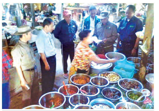
မကွေးတိုင်းဒေသကြီး အောင်လံမြို့၌ နိုဝင်ဘာ ၂၇ ရက်က တောရိုင်း တိရစ္ဆာန်အသားများ တရားမဝင်ရောင်းချမှုမရှိစေရေးအတွက် မြို့နယ်သစ်တော ဦးစီးဌာန ဝန်ထမ်းများ၊ မြို့နယ်စည်ပင်သာယာရေးဝန်ထမ်းများနှင့် ဈေး ကော်မတီပူးပေါင်းအဖွဲ့တို့ မြို့မဈေးအတွင်းရှိ စားသောက်ဆိုင်များကို စစ်ဆေးခြင်း၊ ပညာပေးခြင်းလုပ်ငန်းများ ဆောင်ရွက်ကြစဉ်။ သိန်းလွင်(ပြန်/ဆက်)

၄၀ မှာဆိုက်ရောက်သွားမှာ ဖြစ်ပါ တယ်”ဟု ဂန့်ဂေါဘူတာမှ တာဝန် ရှိသူတစ်ဦးက ပြောပြသည်။ ယခုအခါ ဂန့်ဂေါ-ကလေး ရထားလမ်းတွင် လမ်းတံတားများ ဆက်လက်ပြုပြင်တည်ဆောက်လျက် ရှိပြီး အမှတ်(၁၃၉) အဆန်နှင့် အမှတ်(၁၄၀) အစုန်လူစီးရထားများ ခရီးစဉ်အစမှ အဆုံးထိပြေးဆွဲနိုင်ခြင်း မရှိသေးသော်လည်း အမှတ် (၁၃၉) အဆန်လူစီးရထားမှ အမှတ် (၁၁/၁၀၀၁) အဆန်ကားရထားသို့ ဟံသာဝတီဘူတာတွင် ပြောင်းလဲ စီးနင်း၍ ဂန့်ဂေါမြို့ကလေးသို့ လည်းကောင်း၊ အမှတ် (၁၁/၁၀၀၂) အဆန်ကားရထားမှ အမှတ်(၁၄၀) အစုန်လူစီးရထားသို့ ဟံသာဝတီ ဘူတာတွင်လည်းကောင်း ပြောင်းလဲ စီးနင်းနိုင်ပြီဖြစ်သည်။ ကြီးမြင့်နိုင်(လျှိုင်ကော်)