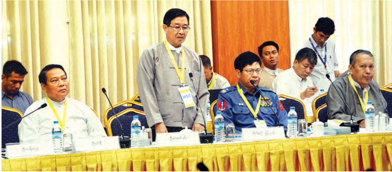
နိုင်ငံရေးဆွေးနွေးမှုဆိုင်ရာ မူဘောင်(မူကြမ်း)ရေးဆွဲရေးကော်မတီ၏ ဒုတိယနေ့အစည်းအဝေး၌ ပြည်ထောင်စုဝန်ကြီး ဦးအောင်မင်း ပြောကြားစဉ်။

သော်လည်းကောင်း၊ ဖြစ်ပေါ်နေတဲ့ အနေအထားအရသော်လည်းကောင်း ပြောင်းလဲ၊ ပြင်လွယ်ဖြစ်နိုင်ဖို့နဲ့ NCA ကိုအခြေခံမယ်ဆိုတဲ့ သဘောထား တွေနဲ့ အခြေခံပြီးတော့ အလွတ် သဘော ဆွေးနွေးခဲ့ကြတာ ဖြစ်ပါ တယ်”ဟု မြန်မာနိုင်ငံ ငြိမ်းချမ်းရေး နှင့် ပြန်လည်ထူထောင်ရေးလုပ်ငန်း ပဏ္ဍိတ (MPC)မှ ဦးအောင်နိုင်ဦး က ဆွေးနွေးပွဲအပြီးတွင် ပြောကြား သည်။ တိုင်းရင်းသား လက်နက်ကိုင် အစုအဖွဲ့ကိုယ်စား မြန်မာနိုင်ငံလုံး ဆိုင်ရာ ကျောင်းသားများဒီမိုကရက် တစ်တပ်ဦး (ABSDF)မှ ဒုတိယ ဥက္ကဋ္ဌ ရဲဘော်မျိုးဝင်းက ဆွေးနွေး ညှိနှိုင်း၍ သဘောထားများ ရရှိလာ ပါက အစုအဖွဲ့တစ်ခုနှင့် မူကြမ်း ရေးဆွဲနိုင်ရန် ဆက်လက်လုပ်ဆောင် သွားမည်ဖြစ်ကြောင်းပြောကြားသည်။ နိုင်ငံရေး ဆွေးနွေးမှုဆိုင်ရာ မူဘောင်(မူကြမ်း)ရေးဆွဲရေးကော်မတီ အစည်းအဝေး တတိယနေ့ကို နိုဝင်ဘာ ၃၀ ရက် နံနက် ၉ နာရီတွင် ဆက်လက်ဆွေးနွေးမှုများ ပြုလုပ် သွားမည်ဖြစ်ကြောင်း သိရသည်။