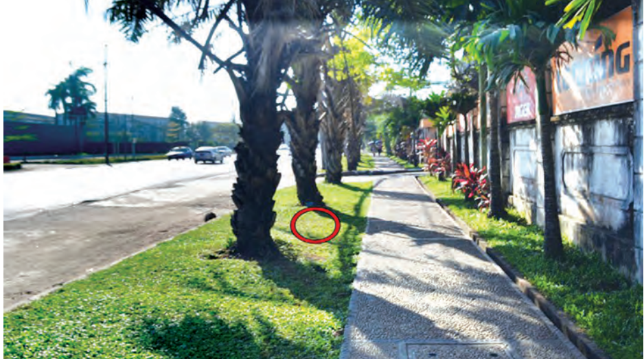
လုယက်မှုဖြစ်ပွားသည့်နေရာ။

ရှိသူကို ဘုရင့်နောင်နယ်မြေရဲတပ်ဖွဲ့ စခန်းက ဖော်ထုတ်စစ်ဆေး ဆောင် မျိုးမင်းသိန်း(မရမ်းကုန်း)