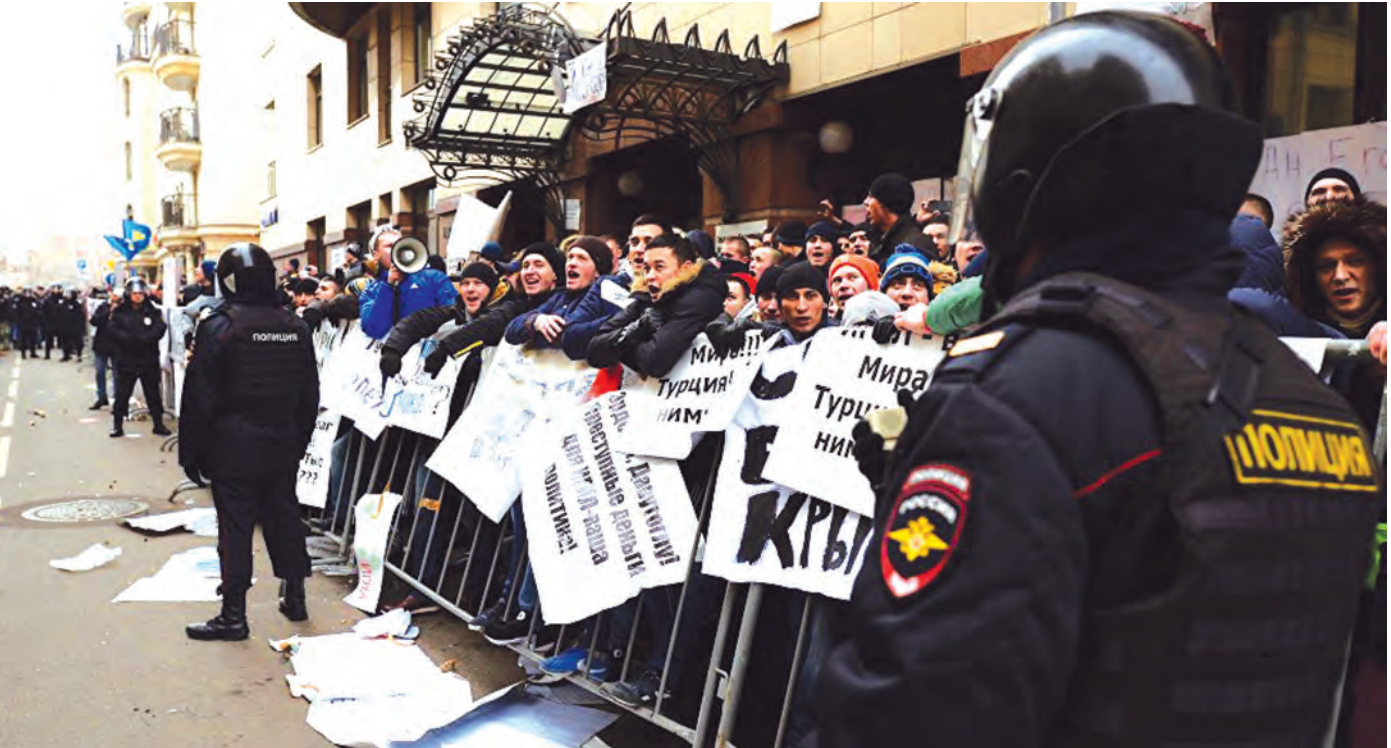
မော်စကိုမြို့တော်ရှိ တူရကီသံရုံးရှေ့တွင် ရုရှားပြည်သူများက တူရကီနိုင်ငံကို ဆန့်ကျင်ကန့်ကွက်နေစဉ်။

သုခ ရောင်ရွေးခဲ့သော်လည်း မိမိတို့၏ပိုင်နက်နယ်မြေကို ကာကွယ်ပိုင်ခွင့်ရှိကြောင်း တူရကီသမ္မတ အာဒိုဂန်က ပြောကြားသည်။ အမေရိကန်သမ္မတ ဘားရက်အိုဘား