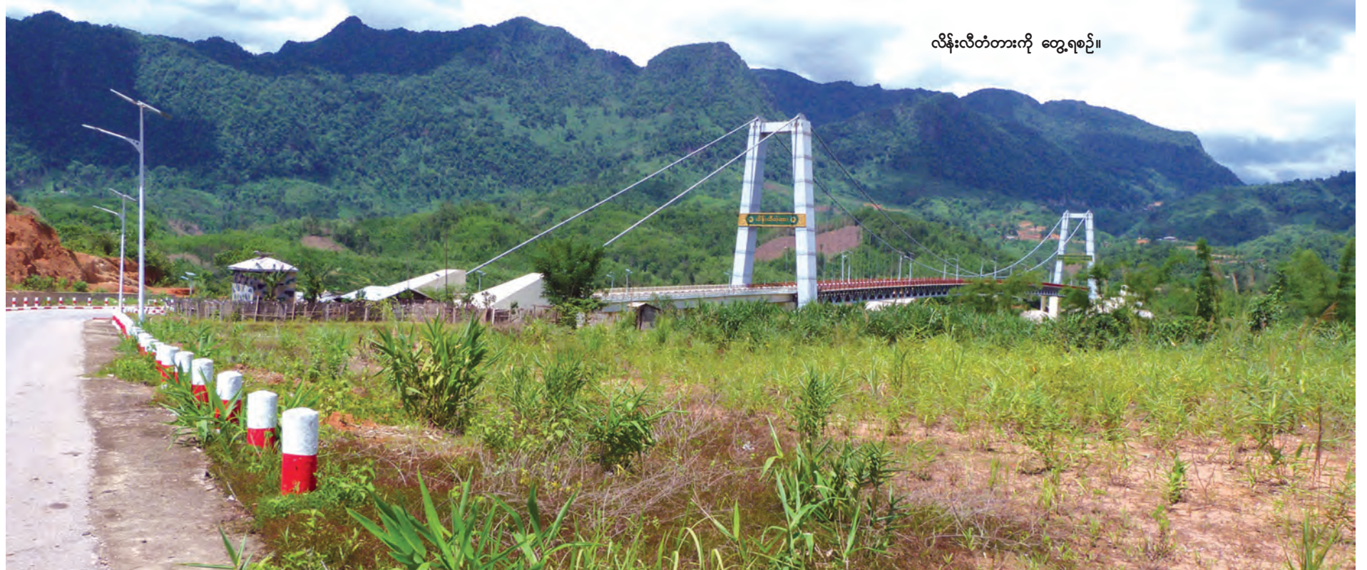
လိန်းလီတံတားကို တွေ့ရစဉ်။