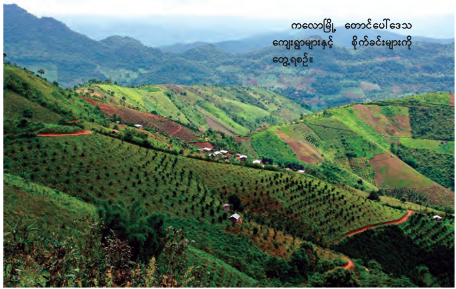
ကလေးမြို့ တောင်ပေါ်ဒေသ ကျေးရွာများနှင့် စိုက်ခင်းများကို တွေ့ရစဉ်။

ကလေးမြို့တွင်းသို့ ကျွန်တော်တို့ပြန်လာခဲ့သည်။ မိတ်ဆွေအိမ်တွင်တစ်ညတာတည်းခိုပြီး နံနက်စောစော ရန်ကုန်သို့ ကားဖြင့်ပြန်ရန်စီစဉ်ထားသည်။ ကလေးမြို့တွင် နှစ်ရက်ခန့်နေချင်၊ လေ့လာချင်စိတ်ရှိနေသော်လည်း အလုပ်တာဝန်များကရှိနေသေးသည်။ အပန်းဖြေ ခရီးသက်သက်လာဦးမည်ဟု တွေးကာတစ်ချိန်ချိန်တွင် တစ်ခေါက် ပြန်လာဦးမည်ဟု စိတ်ထဲစွဲမှတ်ထားမိသည်က အမှန်ပင်။ ။