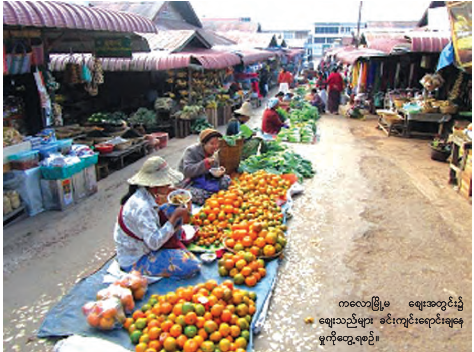
ကလေးမြို့မှ ဈေးအတွင်း၌ ဈေးသည်များ ခင်းကျင်းရောင်းချနေ မှုကိုတွေ့ရစဉ်။

ဘူတာအတွင်းခရီးသည်များမှာ ဒေသခံများ၊ ကမ္ဘာလှည့်ခရီးသွားအချို့နှင့် လိုက်ပါပို့ဆောင်သူများအပြင် ဒေသထွက်ကုန်များတင်ဆောင်ရန်ပြင်ဆင်နေသူများကိုလည်း တွေ့မြင်ရသည်။ ကလေးမြို့သို့ ကားဖြင့် ရန်ကုန်မှ လာလျှင် ၁၆ နာရီကြာမြင့်ပြီး ပဲခူးမြို့မှ သွားလျှင်ကလေးမြို့သို့ ၁၄ နာရီကြာမြင့်သည်။ တစ်ဖန်ကလေးမှ မန္တလေးမြို့သို့ မော်တော်ကားဖြင့် ၈ နာရီခန့်မောင်းနှင်ရပြီး ကလေးမြို့မှသာစည်မြို့သို့ ၈ နာရီခန့်မောင်းနှင်ရကြောင်း သိရ သည်။