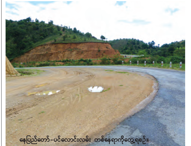
နေပြည်တော်-ပင်လောင်းလမ်း တစ်နေရာကိုတွေ့ရစဉ်။