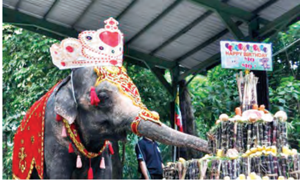
သတင်းဆောင်းပါး-ခင်ရတနာ

၂၀၀၃ ခုနှစ်မှာ ရန်ကုန်တိရစ္ဆာန်ဥယျာဉ်ကြီးကို ဝိတိုရိယခေတ် လက်ရာအတိုင်း ပြန်လည်ပြုပြင်မွမ်းမံခဲ့ပြီးနောက်ပိုင်းမှာ လာရောက်သူဟာ တစ်နှစ်မှာ