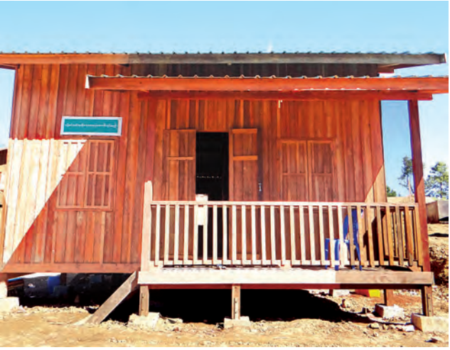
ဟားခါးမြို့ သဘာဝဘေးသင့်သူများအတွက် အသစ်ပြန်လည်ဆောက်လုပ်ပေးထားသည့် လူနေအိမ်တစ်လုံးကို တွေ့ရစဉ်။