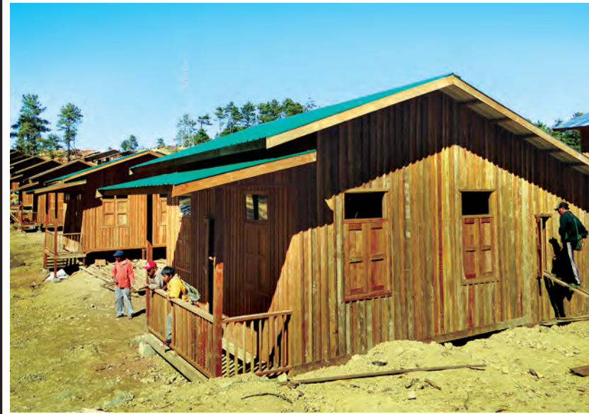
ဟားခါးမြို့ သဘာဝဘေးသင့်သူများအတွက် ဆောက်လုပ်ဆဲ လူနေအိမ် တစ်လုံးကို တွေ့ရစဉ်။