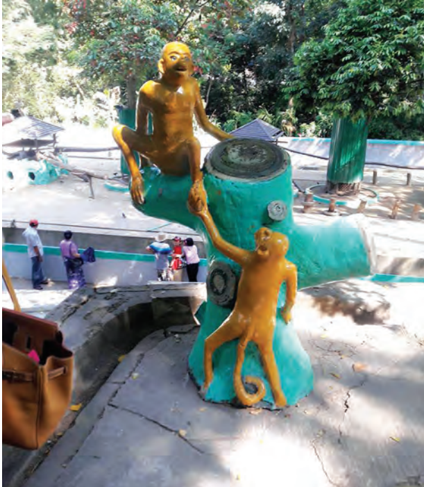
ရိုခဲ့တယ်လို့ တစ်ဆင့်စကား မှတ်သားဖူးပါတယ်။

ဒုတိယကမ္ဘာစစ်ကြီးဖြစ်ပွားတဲ့ ၁၉၄၂ ခုနှစ်မှာ ရန်ကုန်တစ်မြို့လုံး စစ်ဒဏ် သင့်ခဲ့ရချိန်မှာ တိရစ္ဆာန်ရုံကြီးလည်း ကိုယ်တိုင်ကိုယ်ကျ ပါဝင်ခံစားခဲ့ရသေးပါတယ်။ ရှေးလူကြီးအချို့ရဲ့ ပြောစကားအရဆိုရင် ကျားလောင်အိမ်တွေ ငုံးဒဏ်ကြောင့် ပွင့်ထွက်ကုန်တာမို့ ကျားတွေ အပြင်ထွက်လာတာတောင်