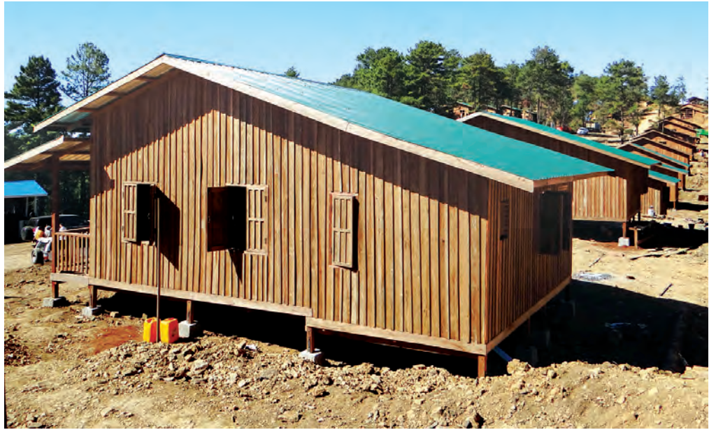
ဟားခါးမြို့ သဘာဝဘေးသင့်သူများအတွက် အသစ်ပြန်လည်တည်ဆောက်ထားသည့် လူနေအိမ်များကို အတန်းလိုက် (အပေါ်ပုံ)နှင့် မျက်နှာစာဘက်(အောက်ပုံ)တို့ကို တွေ့ရစဉ်။