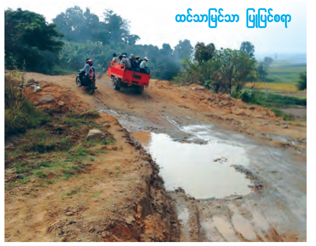
ထင်သာမြင်သာ ပြုပြင်စေရာ

စစ်ကိုင်းတိုင်းဒေသကြီး ကသာ ကပ်လျက်ကွင်းလမ်းကလည်း တော် ခရိုင် အင်းတော်-ပန်းမောက်ကား တော်ကိုဆုံးပါတယ်။ အန္တရာယ်ကြား လမ်းမှ အင်းရွာကျေးရွာအနီးလမ်း က ခက်ခက်ခဲခဲကို မောင်းနှင်သွားလာ မိုင်တိုင်အမှတ် (၁၉/၇)မှ(၂၀/၃) ရတာပါ။ ဒီလမ်းနေရာလေးကို စိတ် အတွင်းလမ်းမှာ ဇူလိုင်နှင့်ဩဂုတ် အေးချမ်းသာစွာဖြတ်သန်းသွားလာ လများက မိုးသည်းထန်စွာ ရွာသွန်း နိုင်ရေး အမြန်ဆုံးပြုပြင်ပေးစေချင်ပါ မှုကြောင့် ပျက်စီးသွားခဲ့သည်။ ထိုသို့ ပျက်စီးသွားသောကား ကပ်လျက်ကွင်းလမ်းကလည်း တော် ခရိုင် အင်းတော်-ပန်းမောက်ကား က အင်အားစွမ်းအား ယနေ့အချိန်ထိ ပြန် လည်ပြုပြင် ဆောင်ရွက်ပေးခြင်း မရှိ သည့်အတွက် ကားလမ်းပျက်နေရာ နှင့်ကပ်လျက်ကွင်းလမ်းမှ ခရီးသွား ပြည်သူများ၊ ယာဉ်ကြီး/ ယာဉ်ငယ် များမှာ အန္တရာယ်ကြားမှ ခက်ခဲ ဆိုးရွားစွာလမ်းကို သွားလာနေကြရ ကြောင်း သိရသည်။ “အင်းတော်-ပန်းမောက် ကား လမ်းမှာ ဒီနေရာက ပျက်စီးမှုဖြစ်တာ အချိန်ကာလအတော်ကြာနေပါပြီ။ ယနေ့အချိန်ထိပြုပြင်ဆောင်ရွက်ပေး တာမတွေ့ရဘူး။ ကားလမ်းပျက်နဲ့ ကပ်လျက်ကွင်းလမ်းကလည်း တော် ခရိုင် အင်းတော်-ပန်းမောက်ကား မကြာခဏဆို သလို သွားလာနေတာပါ။ ဒီကား လမ်းပျက်အနီးကပ်လျက် ကျားခေါင်း တောင်တန်းတောင်ခြေက မြေသား များ ဒီနှစ်ထဲမှာပြုကျပြီး ကတ္တရာ ကားလမ်းပေါ် မြေများဖုံးလွှမ်း သွားခဲ့ပါတယ်။ ဒီတစ်ရက် နှစ်ရက် အတွင်းမှာလည်း တောင်ခြေမှမြေ များ အက်ကွဲနိမ့်ဆင်း ပြုကျလာတာ တွေ့ရလို့ လမ်းဌာနနဲ့ သက်ဆိုင်ရာ ဆက်စပ်ဌာန၊ အဖွဲ့အစည်းတွေကို ထူးခြားဖြစ်စဉ်အဖြစ် အကြောင်းကြား