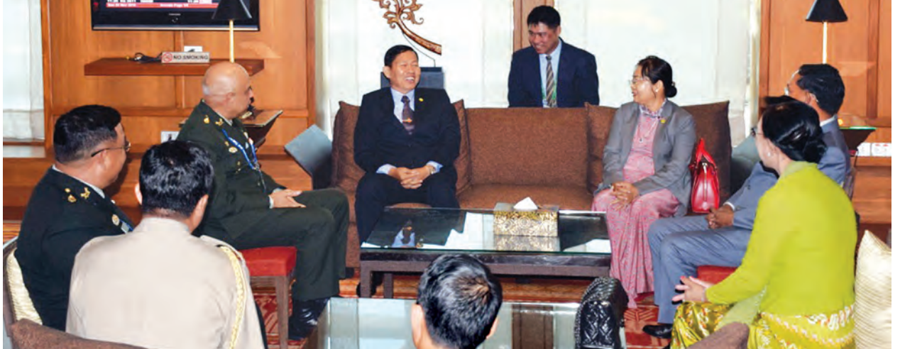
ချစ်ဆွေနှင့်ဇနီး၊ တာဝန်ရှိသူများက ကြိုဆိုနှုတ်ဆက်ခဲ့ကြပြီး လေဆိပ်မှ Siam Kempinski Hotel သို့ ရောက်ရှိရပ်နားခဲ့ကြောင်း သတင်းရရှိသည်။ (အပေါ်ပုံ) (မြဝတီ)

ဒုတိယတပ်မတော်ကာကွယ်ရေးဦးစီးချုပ် ဦးဆောင်သော ကိုယ်စားလှယ်အဖွဲ့အား ထိုင်းဘုရင့်တပ်မတော် ထိုင်းဘုရင့်ကြည်းတပ်ဌာနချုပ်မှ ဒုတိယစစ်ဦးစီးအရာရှိချုပ် Lt. Gen Varah Boonyasit နှင့်ဇနီး၊ မြန်မာနိုင်ငံဆိုင်ရာ ထိုင်းစစ်သံမှူး Col.Salawin Uttarak နှင့် အရာရှိကြီးများ၊ ထိုင်းနိုင်ငံဆိုင်ရာ မြန်မာသံအမတ်ကြီး ဦးဝင်းမောင်နှင့် ဇနီး၊ စစ်သံမှူး ဗိုလ်မှူးချုပ်