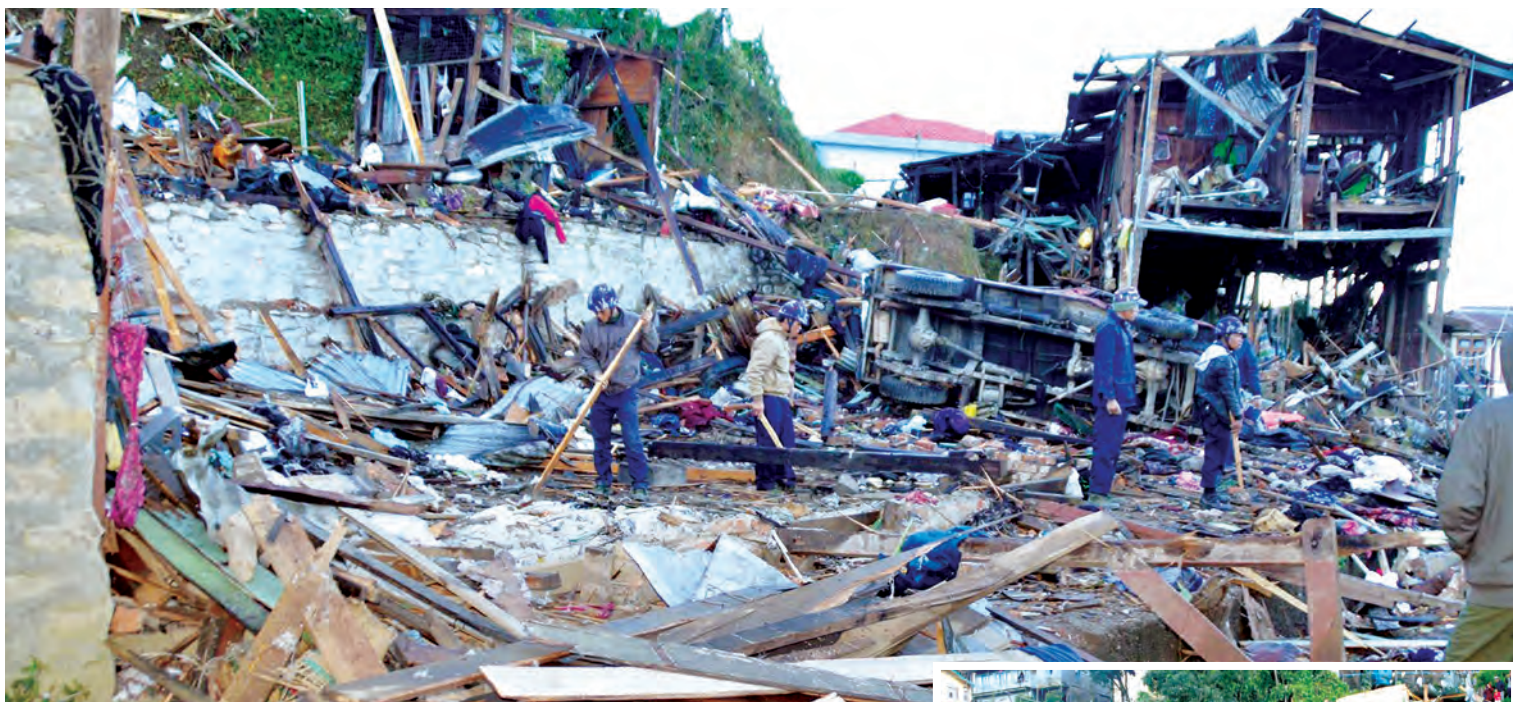
သတင်း - ခင်ရတနာ