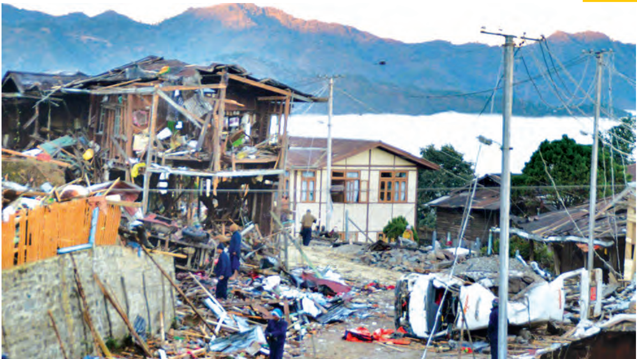
ဟားခါးမြို့၌ ပေါက်ကွဲမှုဖြစ်ပွားပြီးနောက် နေအိမ်အပျက်အစီးများကို တွေ့ရစဉ်။

ပေါက်ကွဲတာဖြစ်ပါတယ်။ သေတဲ့သူတွေထဲက ဒေါ်ထောင်သင်းတလွဲ (၄၆နှစ်)ဟာ ယမ်းစိမ်းကြိုးခွေ သိမ်းဆည်းရမိမှုနဲ့ ပြစ်ဒဏ်ကျခံဖူးသူဖြစ်ပါတယ်။ သူ့အလောင်းကိုလည်း ဒီနေ့နံနက် ၆ နာရီမှာ ဦးနီယာဘိဝံသရဲ့ ခြံဝင်းထဲက ဝက်ခြံထဲမှာ ဒဏ်ရာတွေနဲ့ သေဆုံးနေတာကို တွေ့ရတယ်။