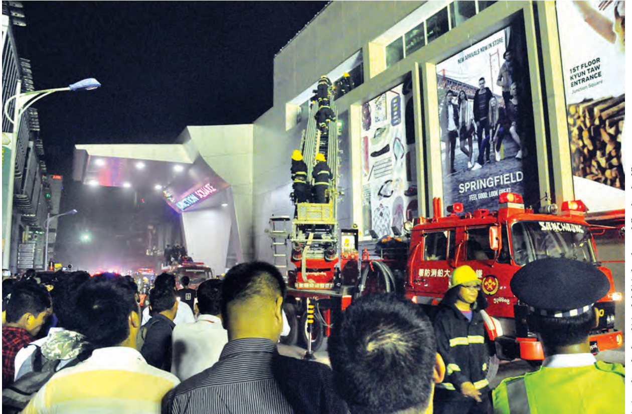
JUNCTION SQUARE မီးလောင်ရာတွင် အဆင့်မြင့်လှေကားပါ မီးငြိမ်းသတ်ရေးယာဉ်များ မီးငြိမ်းသတ်နေသည်ကို တွေ့ရစဉ်။

ရန်ကုန်မြို့၊ ကမာရွတ်မြို့နယ် (၇) ရပ်ကွက် ပြည်လမ်းပေါ်ရှိ JUNCTION SQUARE ကုန်တိုက်၌ ဇူလိုင် ၂၃ ရက် ည ၈နာရီခန့်က မီးလောင်မှုဖြစ်ပွားသည်။