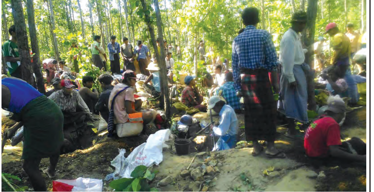
တရားမဝင် ရွှေလာရောက်တူးဖော်သူများအား တွေ့ရစဉ်။