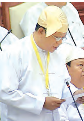
ဒုတိယဝန်ကြီး ဒေါက်တာဝင်းမြင့် မြေကြားစဉ်။

ပထမအကြိမ် ပြည်သူ့လွှတ်တော် (၁၃)ကြိမ်မြောက် ပုံမှန်အစည်းအဝေးကို ယနေ့နံနက် ၁၀ နာရီတွင် နေပြည်တော်ရှိ လွှတ်တော်အဆောက်အအုံ ပြည်သူ့လွှတ်တော်ခန်းမ၌ ကျင်းပရာ အရေးကြီးအဆိုတစ်ခု တင်သွင်းခြင်း၊ ကြယ်ပွင့်ပြပေးခွန်းလေးခု မေးမြန်းခြင်းနှင့် မြေကြားခြင်း၊ အစီရင်ခံစာနှစ်ခု တင်သွင်းခြင်းနှင့် ဥပဒေကြမ်းနှစ်ခု ဆွေးနွေးအတည်ပြုခြင်းများ ဆောင်ရွက်ကြသည်။