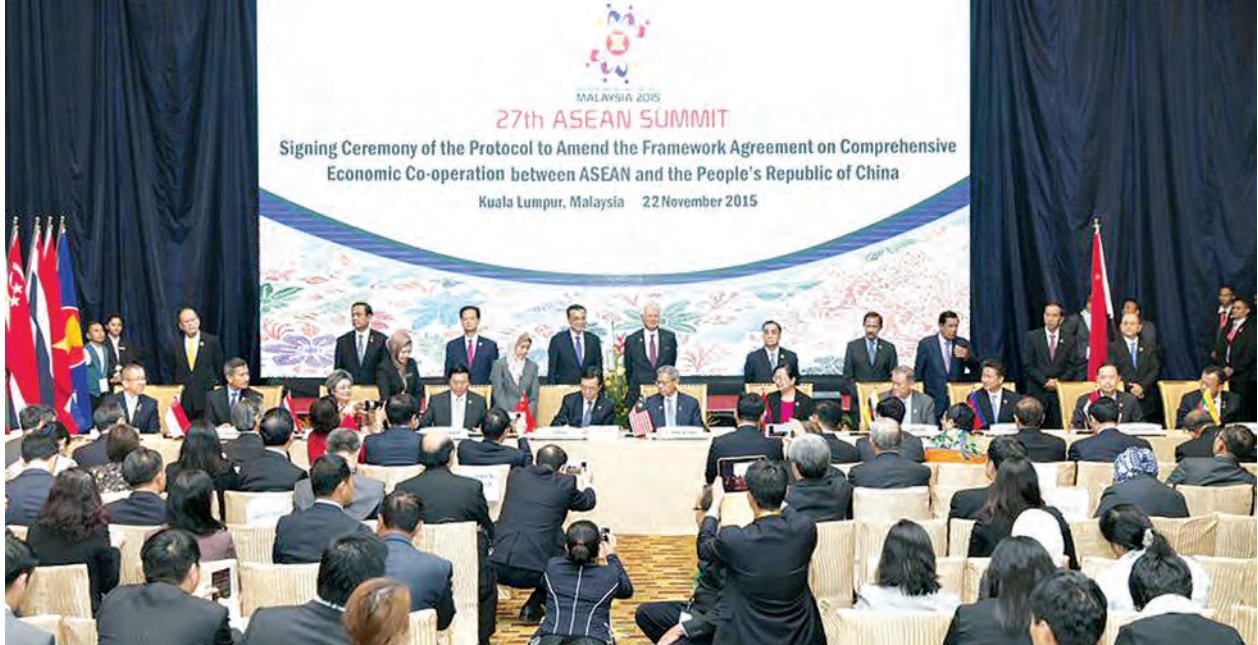
သည့်။ အပြန်အလှန်ရင်းနှီးမြှုပ်နှံမှုမှာ အမေရိကန်ဒေါ်လာ ဘီလီယံ ၁၅၀ ကျော်အထိရှိလာကြောင်း ထုတ်ပြန်ချက်တွင် ဖော်ပြသည်။ နှစ်ဖက်က ၂၀၂၀ ပြည့်နှစ်အရောက်တွင် နှစ်ဖက်ကုန်သွယ်မှုကို အမေရိကန်ဒေါ်လာ တစ်ထရီလီယံ အထိရောက်ရှိရန် မျှော်မှန်းထားသည်ဟု ဆိုသည်။ (ဆင်ဟွာ)

ပေကျင်း နိုဝင်ဘာ ၂၃ တရုတ်ပြည်သူ့သမ္မတနိုင်ငံနှင့် အရှေ့တောင်အာရှနိုင်ငံများအသင်း (အာဆီယံ)တို့အကြား တစ်ဖက်ကုန်သွယ်မှုနယ်ပယ်ဖွံ့ဖြိုးရေး ပူးပေါင်းဆောင်ရွက်ရေး လက်မှတ်ရေးထိုးလိုက်ကြသည်။ အဆိုပါ သဘောတူညီချက်တွင် ကုန်ပစ္စည်းများ၊ ဝန်ဆောင်မှု၊ ရင်းနှီးမြှုပ်နှံမှု၊ စီးပွားရေးနှင့် နည်းပညာပူးပေါင်းဆောင်ရွက်မှုတို့ပါဝင်ပြီး မူလအာဆီယံ-တရုတ်လွတ်လပ်သောကုန်သွယ်ရေး သဘောတူညီချက်(အေစီအက်ဖ်တီအေ)ကို ထပ်လောင်းဖြည့်စွက်ခြင်းဖြစ်ကြောင်း တရုတ်ကူးသန်းရောင်းဝယ်ရေးဝန်ကြီးဌာနထုတ်ပြန်ချက်တွင် ဖော်ပြသည်။ အာဆီယံအဖွဲ့ဝင်နိုင်ငံများက တရုတ်နိုင်ငံနှင့်အတူ ကူးသန်းရောင်းဝယ်ရေးဆက်သွယ်ရေးနည်းပညာ၊ ဆောက်လုပ်ရေး၊ ပညာရေး၊ ပတ်ဝန်းကျင်ရေးရာ၊ ဘဏ္ဍာရေး၊ ခရီးသွားနှင့်ပို့ဆောင်ရေးကဏ္ဍများ မြှင့်တင်ရန်ကြိုးပမ်းနေချိန် တရုတ်နိုင်ငံကလည်း ဝန်ဆောင်မှု၊ ဆောက်လုပ်ရေးအင်ဂျင်နီယာအတတ်ပညာများ၊ ခရီးသွားအေဂျင်စီနှင့်ခရီးသွားလုပ်ငန်းများတွင် မြှင့်တင်သွားရန် သန္နိဋ္ဌာန်ချထားသည်ဟု ဆိုသည်။ အေစီအက်ဖ်တီအေသည် အာဆီယံ ၁၀ နိုင်ငံနှင့် တရုတ်နိုင်ငံတို့အကြား ၂၀၀၂ ခုနှစ်တွင် ကနဦးသဘောတူညီပြီး ၂၀၁၀ ခုနှစ်တွင်အပြီးသတ်သဘောတူညီသည့် လွတ်လပ်စွာ ကုန်သွယ်ရေးဒေသဖြစ်သည်။ နှစ်ဖက်ကုန်သွယ်မှုပမာဏသည် ၂၀၀၂ ခုနှစ်က အမေရိကန်ဒေါ်လာ ၅၄ ဒသမ ၈ ဘီလီယံသာရှိခဲ့ရာမှ ၂၀၁၄ ခုနှစ်တွင် ၄၈၀ ဒသမ ၄ ဘီလီယံအထိတိုးလာခဲ့ရာ ကိုးဆန်းပါးကုန်သွယ်မှုမှာ တိုးတက်လာခဲ့သည်ဟု ဆိုသည်။ တရုတ်နိုင်ငံသည် အာဆီယံ၏အကြီးဆုံးကုန်သွယ်ဖက်ဖြစ်သကဲ့သို့ အာဆီယံသည်လည်း တရုတ်နိုင်ငံ၏တတိယအကြီးဆုံး ကုန်သွယ်ဖက်ဖြစ်