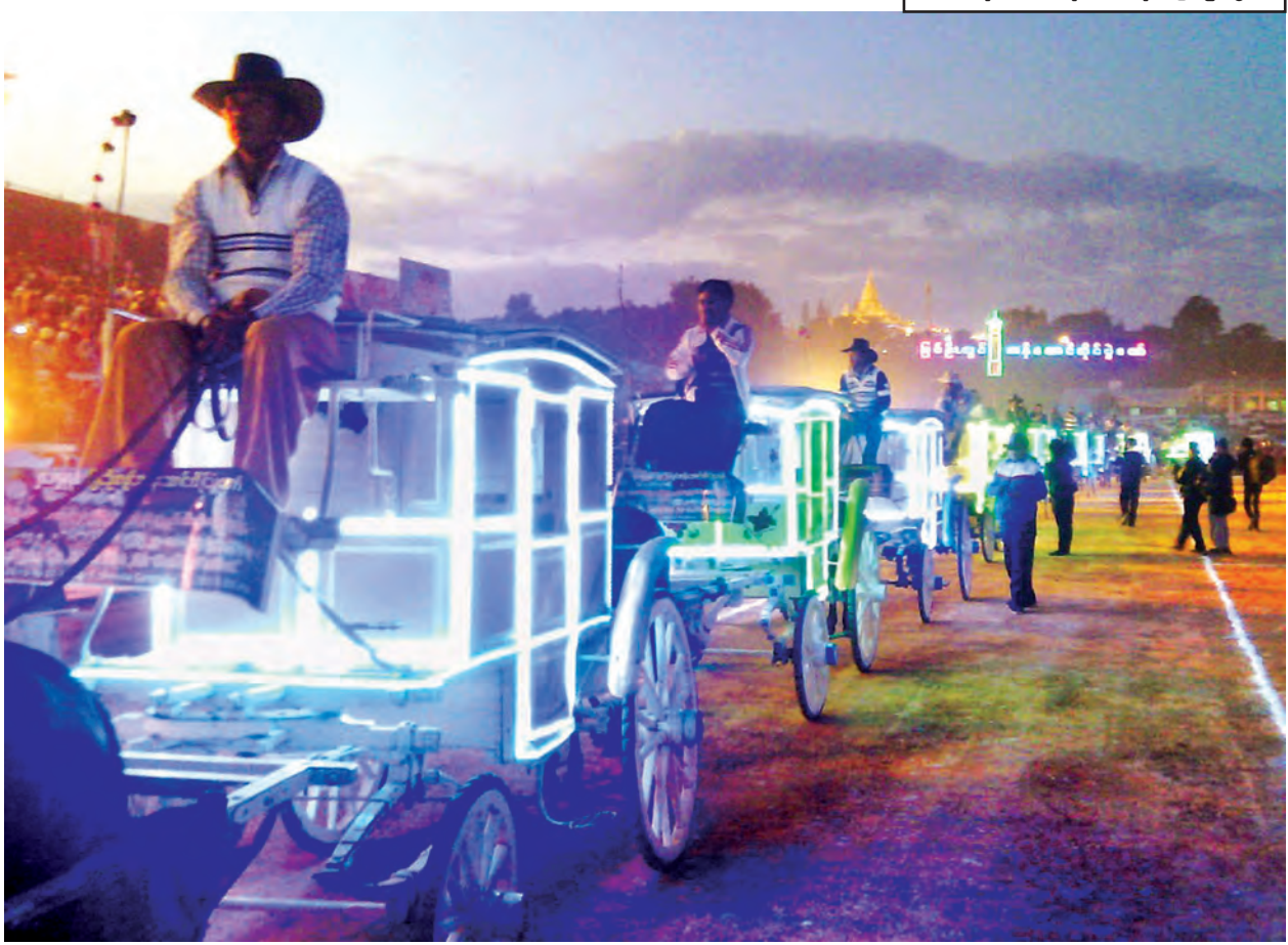
ပြင်ဦးလွင် တန်ဆောင်တိုင်ပွဲတော်ကို မြို့၏ အမှတ်သင်္ကေတ ရထားလုံးများရောင်စုံမီးထွန်း၍ ကွင်းအတွင်းလှည့်ပတ်ခြင်းဖြင့် ထူးခြားစွာ ဖွင့်ပွဲကျင်းပသည်ကို ဤသို့တွေ့ရသည်။

ယခုနှစ် ပြင်ဦးလွင်တန်ဆောင် တိုင် မီးပုံးပျံ့ပွဲတော်ကို နေ့အလှ အရပ် ၆၅ လုံး၊ စိန်နားပန် ၂၉ လုံး၊ ညမီးကျည် ၁၅ လုံး စုစုပေါင်း ၁၀၉ လုံးဖြင့် ယှဉ်ပြိုင်လွှတ်တင်ကြမည် ဖြစ်ရာ ဖွင့်ပွဲကျင်းပရာ ကွင်းအတွင်း သို့ ကျောင်းသား ကျောင်းသူလေး များ၏ အကအလှအဖွဲ့က နေရာယူ စာမျက်နှာ ၃ ကော်လံ ၁ ❖