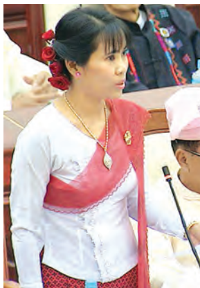
ရေးမဲဆန္ဒနယ်မှ ဒေါ်မိမြင့်သန်း မေးမြန်းစဉ်။

ယင်းနောက် ရေးမဲဆန္ဒနယ်မှ ပြည်သူ့လွှတ်တော်ကိုယ်စားလှယ် ဒေါ်မိမြင့်သန်း၏ “မြန်မာနိုင်ငံတွင် မူးယစ်ဆေးဝါး စွဲနေသူများအတွက် ဆေးကုသ ဖြတ်တောက်သည့် ဆေးခန်းမည်မျှရှိ၍ မည်သည့်မြို့နယ်များတွင် ဖွင့်လှစ်ထားကြောင်းနှင့် ရေးမြို့နယ်၊ လမိုင်းမြို့နှင့် ခေါ်ဇာမြို့တို့တွင် ဆေးခန်းများ ဖွင့်လှစ်ပေးရန်