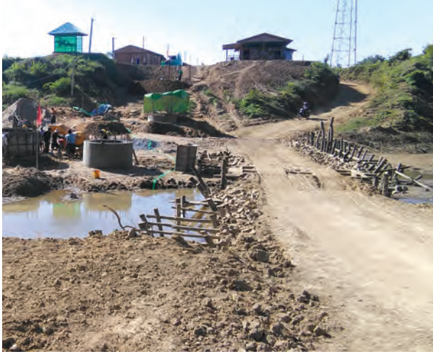
ခက်ခဲကြောင်း၊ တံတားတည်ဆောက် ချောမွေ့ပြီး ဒေသတွင်း ကျေးရွာများ ပြီးစီးပါက ဒေသခံပြည်သူများ သွားလာရာတွင်နှင့် ကုန်စည်ကူးသန်း ရောင်းဝယ်ရေးတွင်ပါ အဆင်ပြေ သိရသည်။

ကန်ဘလူ နိုဝင်ဘာ ၂၃ စစ်ကိုင်းတိုင်းဒေသကြီး ကန်ဘလူ မြို့နယ်အတွင်းရှိ ကျွန်းလှ-ချပ်သင်း-ကောလင်းလမ်း မိုင်တိုင် အမှတ် (၄/၂)နှင့် (၄/၃)ကြား၌ တံတားအမှတ် (၁/၅)ချောင်းခြားချောင်းကူး တံတားကို ၂၀၁၅-၂၀၁၆ဘဏ္ဍာနှစ် နိုင်ငံတော်ခွင့်ပြုရန်ပုံငွေဖြင့် တည်ဆောက်လျက်ရှိကြောင်း သိရသည်။ အဆိုပါ ချောင်းခြားချောင်းကူး တံတားကို ခွင့်ပြုရန်ပုံငွေ ကျပ်သန်း ၈၃၀ ဖြင့် လမ်းဦးစီးဌာနက တာဝန်ယူတည်ဆောက်နေခြင်း ဖြစ်ပြီး အရှည် ၃၅၀ပေ၊ အကျယ် ၂၄ပေရှိ သံကူကွန်ကရစ် အမျိုးအစားဖြစ်ကြောင်း သိရသည်။ ချောင်းခြားချောင်းသည် မိုးရာသီ ချောင်းရေလာ ချိန်တွင် ရေစီးသန်ပြီး ချောင်းရေကျ ချိန်တွင်လည်း ရေမှာခါးဝက်ခန့် ရှိနေသဖြင့် ဖြတ်သန်းသွားလာရန်