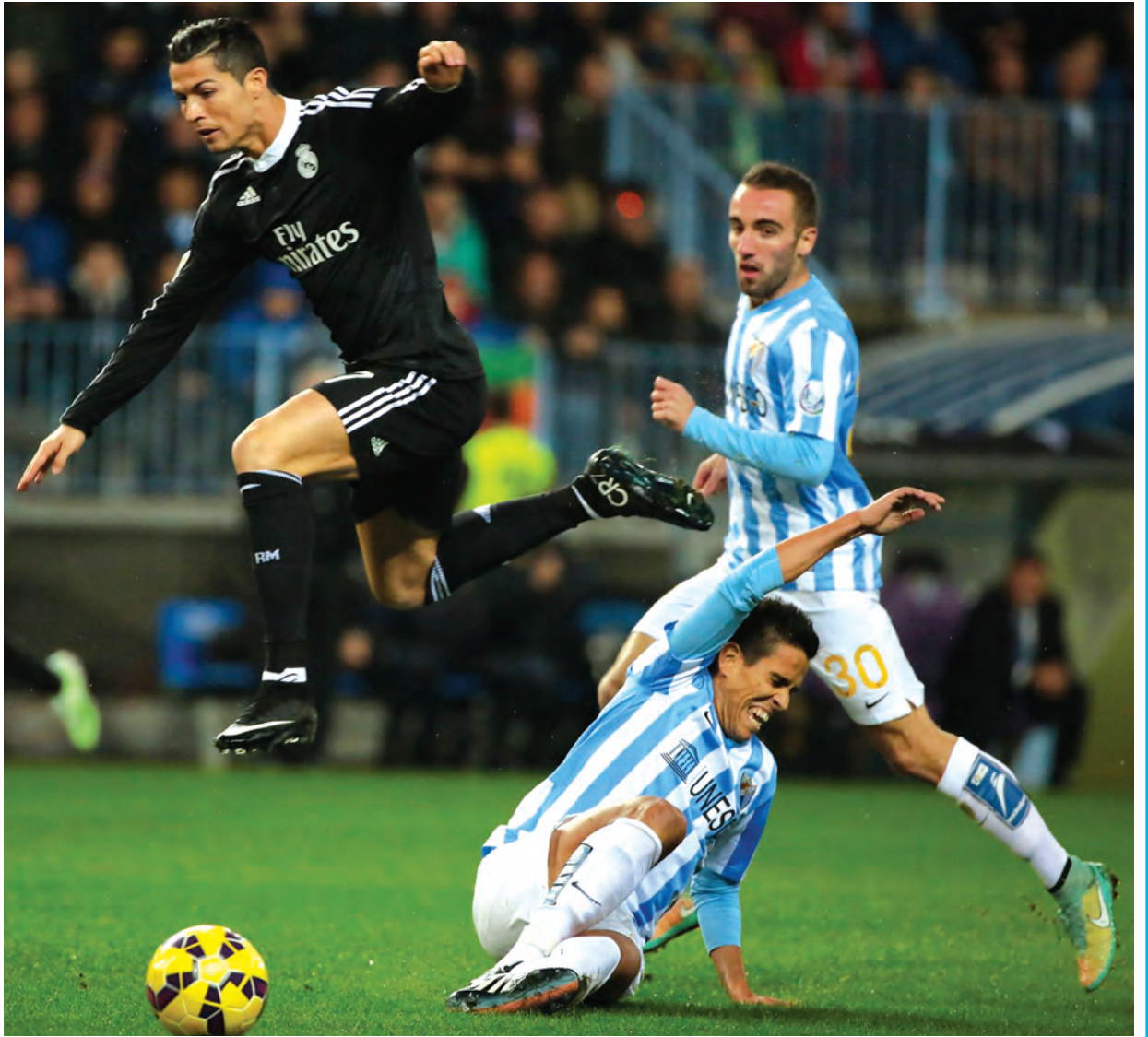
အက်သလက်တီကိုတို့ ဒီပွဲမှာ အနိုင်ဆုံးတစ်မှတ်ရယူပါလိမ့်မယ်။

အုပ်စု(C)မှာ ဂါလာတာစာရေးတို့ လေးမှတ်ရနေသလို အက်သလက်တီကိုတို့က ခုနစ်မှတ်ရရှိနေပါတယ်။ ပထမအကျော့ ဂါလာတာစာရေးကွင်းမှာ အက်သလက်တီကိုတို့ နှစ်ဂိုးပြတ်ရှုံးထားတာမို့ အခုပွဲမှာ နိုင်ပွဲပြန်ယူပါလိမ့်မယ်။ လောလောဆယ် နောက်ဆုံးသုံးပွဲကစားခဲ့တဲ့ ခြေစွမ်းအရ