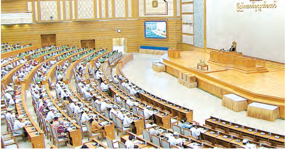
၏ အခန်းကဏ္ဍကို သိရှိနားလည်စေခြင်းစသည့် အကျိုးကျေးဇူးများရရှိမည်ဖြစ်ကြောင်း ဆွေးနွေးသည်။

ထို့ပြင် မြန်မာ-အစွရေး လုံခြုံမှုအဆင့်အတန်းရှိသော သတင်းအချက်အလက် ကာကွယ်ရေးဆိုင်ရာ သဘောတူညီချက်ကို မြန်မာနိုင်ငံမှ လက်မှတ်ရေးထိုးနိုင်ပါက ပြည်ထောင်စုသမ္မတမြန်မာနိုင်ငံတော်နှင့် အစွရေးနိုင်ငံတို့အကြား ကာကွယ်ရေးဆိုင်ရာ လုံခြုံရေးအဆင့်အတန်း မြင့်တက်စေရန် အထောက်အကူဖြစ်စေနိုင်ခြင်း၊ နှစ်နိုင်ငံလုံခြုံရေးဆိုင်ရာကိစ္စရပ်များအား အပြန်အလှန်ပူးပေါင်းဆောင်ရွက်နိုင်ခြင်း၊ သတင်းအချက်အလက်များ ဖလှယ်နိုင်ခြင်း၊ နည်းပညာရပ်ပိုင်းဆိုင်ရာ ကျွမ်းကျင်မှုများကို ရရှိစေနိုင်ခြင်း၊ အပြန်အလှန် အလည်အပတ်သွားရောက်မည့် ခရီးစဉ်များအတွက် လုံခြုံရေးခွင့်ပြုချက်များ ရရှိနိုင်ခြင်း၊ နိုင်ငံတော်လုံခြုံရေးအတွက် အကျိုးဖြစ်ထွန်းမှုများ ရရှိနိုင်ခြင်းနှင့် ကာကွယ်ရေးဆိုင်ရာ လုံခြုံမှုအဆင့်အတန်း