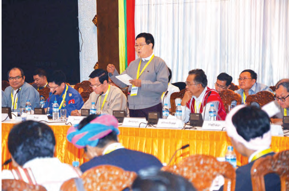
ပြည်ထောင်စုဝန်ကြီး ဦးအောင်မင်း တရားဝင်မှတ်ပုံတင်ထားသည့် နိုင်ငံရေးပါတီ ၉၁ ပါတီ ကိုယ်စားပြု ကိုယ်စားလှယ်ရွေးချယ်ပွဲတွင် ပြောကြားစဉ်။

ပြည်ထောင်စု ငြိမ်းချမ်းရေး ဆွေးနွေးမှု ပူးတွဲကော်မတီ(UPDJC) တွင်ပါဝင်မည့် အစုအဖွဲ့သုံးစုမှ ကိုယ်စားလှယ်များ၏ ပထမဆုံး အစည်းအဝေးကို နိုဝင်ဘာ ၂၄ ရက် နံနက် ၉ နာရီတွင် ရန်ကုန်မြို့၊ ရွှေလီ ထားသည့် တိုင်းရင်းသားလက်နက် ကိုင်အဖွဲ့အစည်း ရှစ်ဖွဲ့မှ ကိုယ်စား လှယ် ၁၆ ဦးနှင့် နိုင်ငံရေးပါတီအစု အဖွဲ့မှ ကိုယ်စားလှယ် ၁၆ ဦးကို