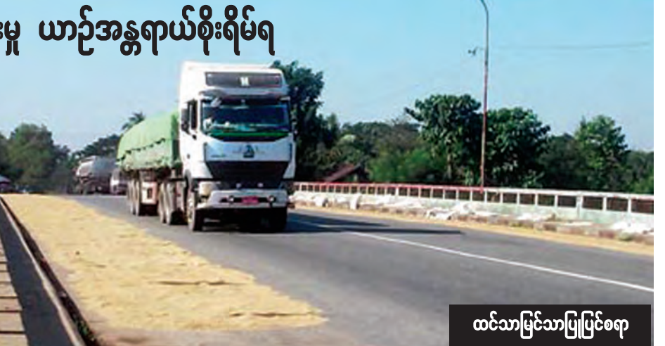
ထင်သာပြင်သာပြင်ဖြစ်စရာ

မြန်မာနိုင်ငံ တစ်ဝန်းလုံးတွင် ကောက်ဦးစပါးများ ရင့်မှည့်လာသဖြင့် ရိတ်သိမ်းပြီးစပါးများ ဈေးကောင်း ရရှိရန် ရိတ်သိမ်းခြွေလှေ့စက်များဖြင့် မိုးရွှောင်ရိတ်သိမ်းလျက်ရှိပြီး စိုစွတ် နေသော စပါးများခြောက်သွေ့စေရန် ကျယ်ဝန်းသော မြေကွက်လပ်များ တွင် နေလှန်းရမည့်အစား မော်တော် ယာဉ်များ၊ ခရီးသွားပြည်သူများ၊ ကျောင်းသား ကျောင်းသူများ၊ နေ့စဉ်သွားလာနေသော လမ်းမ ကြီးပေါ်တွင် စပါးများလှန်းခြင်း၊ ချိန်တွယ်ခြင်း၊ ကားတင်ကားချလုပ် ခြင်းများကို ပဲခူးတိုင်းဒေသကြီး မြို့နယ်အချို့တွင် ပြုလုပ်နေကြ သည်ကိုတွေ့ရသည်။ လမ်းမပေါ်တွင် သွားလာနေသော ယာဉ်ကြီး/ ယာဉ်