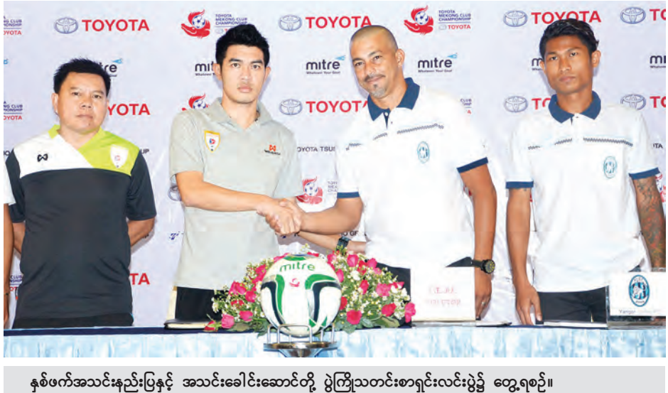
နှစ်ဖက်အသင်းနည်းပြနှင့် အသင်းခေါင်းဆောင်တို့ ပွဲကြိုသတင်းစာရှင်းလင်းပွဲ၌ တွေ့ရစဉ်။

ရမည်ဖြစ်ကြောင်း၊ သို့သော် မိမိတို့ အနေဖြင့် ဆီမီးတက်မည်ဟု ယုံကြည် ကြောင်း၊ လာအိုတိုက်ယိုတာအသင်းနှင့် ပွဲဦးထွက်ပွဲတွင် အနိုင်ရမည်ဟု ယုံကြည်ကြောင်း၊ ယင်းကဲ့သို့ ပြော ကြားခြင်းမှာ ပြိုင်ဘက်အသင်းကို အထင်သေး၍မဟုတ်ဘဲ ပြိုင်ဘက် နှစ်သင်း၏ အနေအထားကို လေ့လာ ပြီး၍ဖြစ်ကြောင်း၊ လာအိုတိုက်ယိုတာ အသင်းကို အနိုင်ကစားရန်လိုသည့် အပြင် ဂိုးများစွာသွင်းယူနိုင်ရန် လို ကြောင်း၊ နိုင်ငံခြားသားနှစ်ဦးသာပါ မည်ဖြစ်သော်လည်း ပြည်တွင်းကစား သမားများ၏ခြေစွမ်းကို အပြည့်အဝ ယုံကြည်ကြောင်း” ဖြင့် ပြောကြား သည်။ လာအိုတိုက်ယိုတာအသင်း နည်းပြ ချုပ် ခမ်ဒါရာက “ပထမပွဲ၌ ရှုံးနိမ့် ထား၍ ယခုပွဲကိုမဖြစ်မနေ အနိုင် ကစားရမည်ဖြစ်ကြောင်း၊ ရန်ကုန် အသင်းကို အနိုင်ကစားနိုင်ရန်ပြင်ဆင် ထားကြောင်း၊ ခက်ခဲသည့်ပွဲစဉ်တစ်ပွဲ ကို ကျော်ဖြတ်နိုင်မည်ဟု ယုံကြည် ကြောင်း”ဖြင့် ပြောကြားခဲ့သည်။