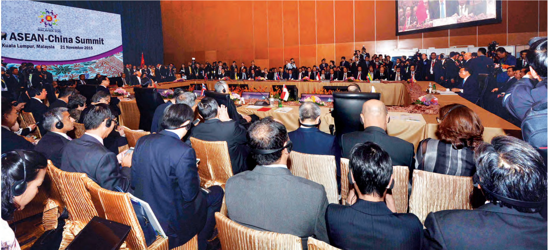
ကွာလာလမ်ပူ နိုဝင်ဘာ ၂၁