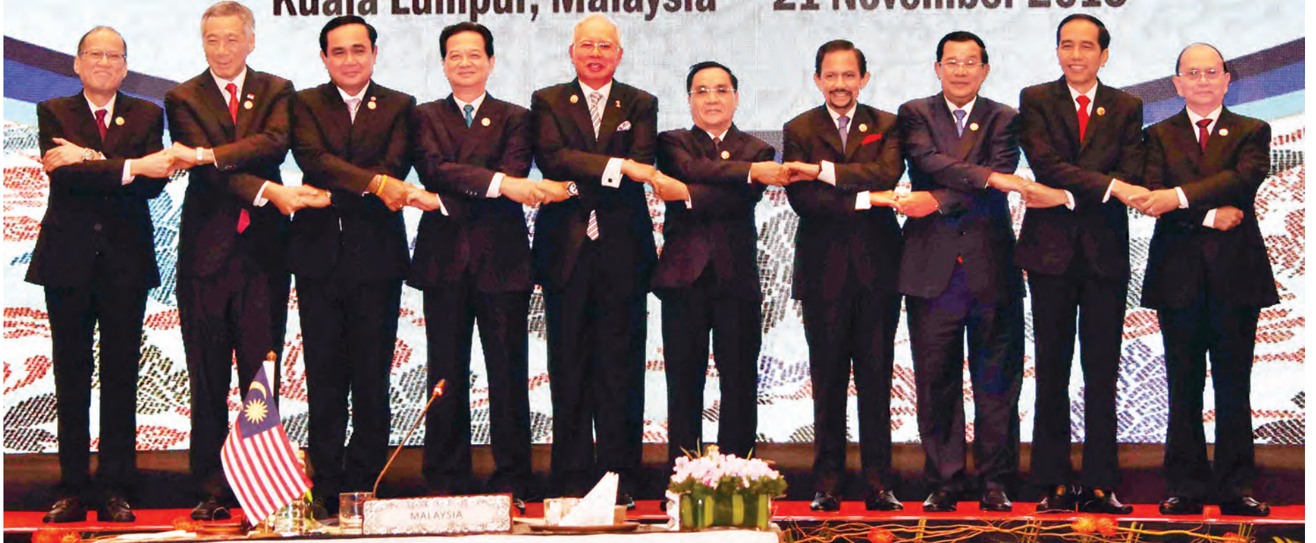
နိုင်ငံတော်သမ္မတ ဦးသိန်းစိန် (၂၇)ကြိမ်မြောက် အာဆီယံထိပ်သီးများကုန်သွယ်ရေးအဖွဲ့အစည်းအဝေးတွင် အာဆီယံနိုင်ငံများမှ နိုင်ငံအကြီးအကဲ၊ အစိုးရအဖွဲ့အကြီးအကဲများနှင့်အတူ စုပေါင်းမှတ်တမ်းတင်ဓာတ်ပုံရိုက်စဉ်။