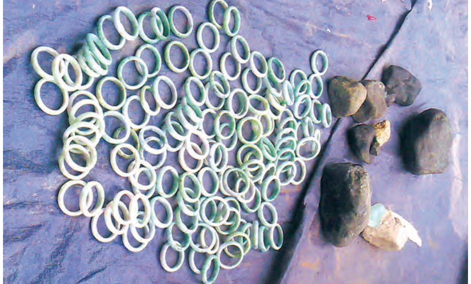
ကိုလို၊ ကျောက်စိမ်း လက်ကောက် သစ်သားပန်းပု ရုပ်တုသုံးရပ် ၁၂၇ ကွင်း (၈ ဒသမ ၅)ကိုလိုနှင့် တို့ကို သိမ်းဆည်းရမိခဲ့ကြောင်း သိရသည်။ စိုးဝင်း

နောင်ချိုမြို့အဝင် ယာယီအခြေပြု တရားမဝင်ကုန်သွယ်မှု တားဆီးထိန်းချုပ်မှု ညွှန်ကြားရေးမှူးဦးစိုးလွင်ဦးစီးသော ဌာနစုံပူးပေါင်း စစ်ဆေးရေးအဖွဲ့သည် နိုဝင်ဘာ ၁၉ ရက်က မန္တလေးမှ မူဆယ်ဘက်သို့ မောင်းနှင်လာ သော ယာဉ်ပေါ်မှ တရားမဝင်အကောက်ခွန်မဲ့ သစ်သားပန်းပုရုပ်တုနှင့် ကျောက်စိမ်းတုံး၊ ကျောက်စိမ်းလက်ကောက်များ ဖမ်းဆီးရမိခဲ့ကြောင်း သိရသည်။ ဖြစ်စဉ်မှာ နိုဝင်ဘာ ၁၉ ရက် နံနက် ၉ နာရီခန့်က မန္တလေးမှ မူဆယ်ဘက်သို့ မောင်းနှင်လာသော ယာဉ်အမှတ် DD/--- ရွှေနဒီ ယာဉ်ငယ်ကို ရပ်တန့် စစ်ဆေးရာ ယာဉ်ပေါ်မှ ကျောက် စိမ်းတုံး ၃၆