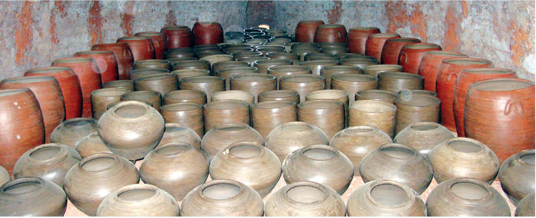
အိုးဖုတ်သည့် မီးဖိုအတွင်းသို့ ပုံလောင်းပြီး အိုးများကို မီးပြင်းတိုက်ရန် စီတန်ထည့်သွင်းထားစဉ်။

အိုးအလုပ်ရုံအတွင်း မြေကြီးများကို လက်ဖြင့် နယ်နေသူအလုပ်သမားတစ်ဦးကို တွေ့ရသည်။ အနီးရှိ မြေမှုန့်များကို ဖြူးထည့်လိုက်၊ ရွှံ့မြေများဖြင့်နယ်လိုက်