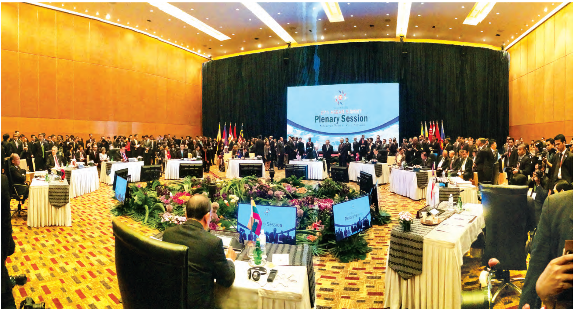
(၂၇)ကြိမ်မြောက် အာဆီယံထိပ်သီး မျက်နှာစုံညီအစည်းအဝေးသို့ အာဆီယံနိုင်ငံများမှ နိုင်ငံအကြီးအကဲ၊ အစိုးရအဖွဲ့အကြီးအကဲများ တက်ရောက်ကြစဉ်။ (သတင်း၊ စာမျက်နှာ-၆)