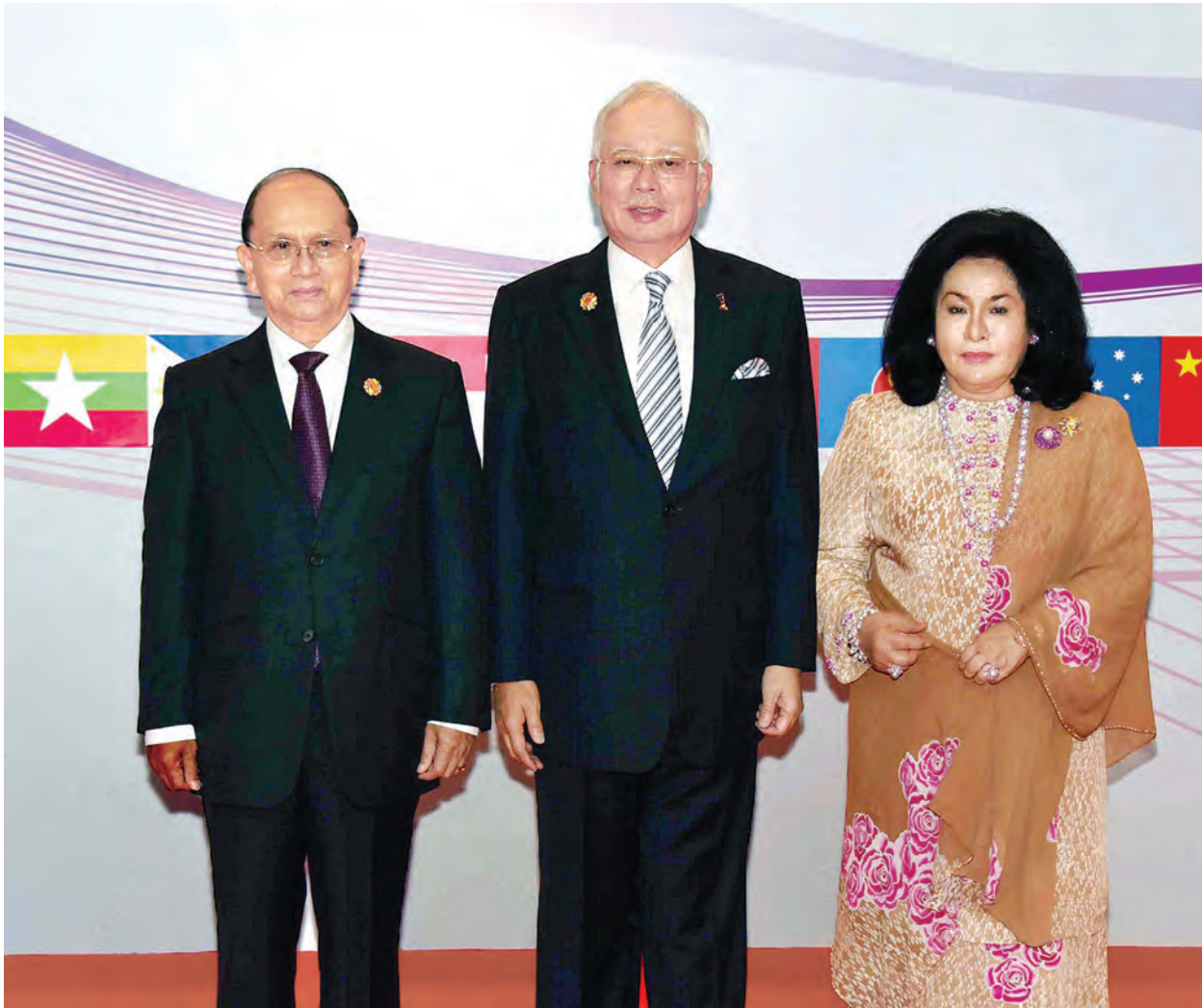
နိုင်ငံတော်သမ္မတ ဦးသိန်းစိန် မလေးရှားနိုင်ငံဝန်ကြီးချုပ် ဒါတွတ်ဆရီ မူဟာမက် နာဂျစ် ဘင်တွန်း အဗ္ဗူ ရာဇတ်နှင့်ဇနီးတို့နှင့်အတူ မှတ်တမ်း တင်ဓာတ်ပုံရိုက်စဉ်။

မြန်မာနိုင်ငံတွင် အစိုးရနှင့် တိုင်းရင်းသား လက်နက်ကိုင်အဖွဲ့ ရှစ်ဖွဲ့တို့အကြား တစ် နိုင်ငံလုံး အပစ်အခတ်ရပ်စဲရေးစာချုပ်ကို ၂၀၁၅ ခုနှစ် အောက်တိုဘာ ၁၅ ရက်တွင် လက်မှတ်ရေးထိုးခဲ့ပြီး မိမိတို့ သမိုင်းတွင် စာမျက်နှာသစ်တစ်ခု ဖွင့်လှစ်ခဲ့။