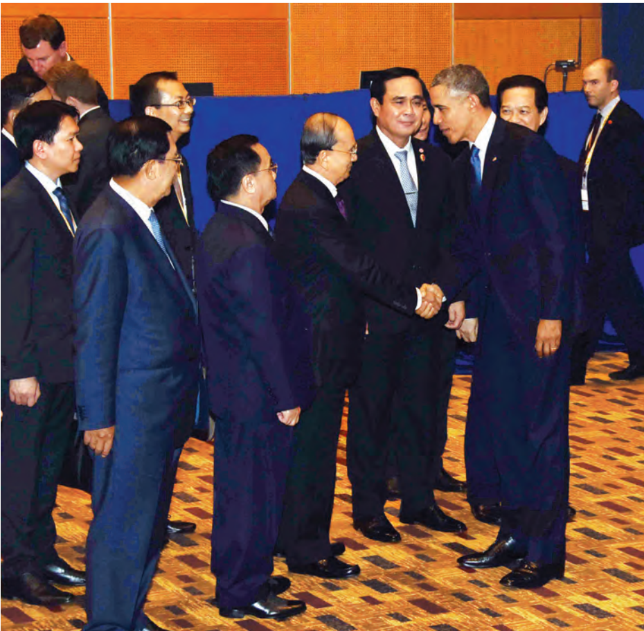
အာဆီယံထိပ်သီးအစည်းအဝေးတွင် နိုင်ငံတော်သမ္မတ ဦးသိန်းစိန်နှင့် အမေရိကန်သမ္မတ မစ္စတာ ဘားရက် အိုဘားမားတို့ ရင်းရင်းနှီးနှီးနှုတ်ဆက်စဉ်(အပေါ်ပုံ)နှင့် အာဆီယံနိုင်ငံများမှ အကြီးအကဲများနှင့် အမေရိကန်သမ္မတတို့ စုပေါင်းမှတ်တမ်းတင်ဓာတ်ပုံရိုက်စဉ်။ (ယာပုံ)

နိုင်ငံတော်သမ္မတ ဦးသိန်းစိန် နှင့် ဂျပန်ဝန်ကြီးချုပ် မစ္စတာ ရှင်ဖိုအာဘေးတို့ တွေ့ဆုံဆွေးနွေး စဉ်။