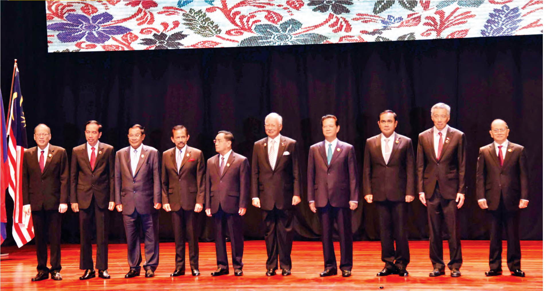
နိုင်ငံတော်သမ္မတ ဦးသိန်းစိန် (၂၇)ကြိမ်မြောက်အာဆီယံထိပ်သီးအစည်းအဝေးဖွင့်ပွဲအခမ်းအနားတွင် အာဆီယံနိုင်ငံများမှ နိုင်ငံအကြီးအကဲ၊ အစိုးရအဖွဲ့အကြီးအကဲများနှင့်အတူ စုပေါင်းမှတ်တမ်းတင် ဓာတ်ပုံရိုက်စဉ်။