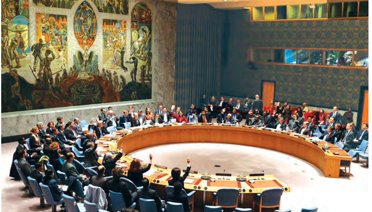
က အိုင်အက်စ်အကြမ်းဖက်အဖွဲ့နှင့် အလားတူအခြားအကြမ်းဖက်အဖွဲ့များက ပြုလုပ်သည့် ကြောက်မက်ဖွယ်ကောင်းသည့် အကြမ်းဖက်တိုက်ခိုက်မှုများနှင့် ပြန်ပေးဆွဲသတ်ဖြတ်ခြင်း၊ ဖမ်းဆီးချုပ်နှောင်ထားခြင်းအပါအဝင် အခြားအကြမ်းဖက်မှုများကို နှိမ်နင်းတိုက်ဖျက်ရန် ပူးပေါင်းညှိနှိုင်းလုပ်ဆောင်သွားကြရန် အတွက် အမေရိကန်နိုင်ငံ နယူးယောက်ရှိ ကုလသမဂ္ဂဌာနချုပ်တွင် နိုဝင်ဘာ ၂၀ ရက်က တိုက်တွန်းပြောကြားခဲ့သည်။ (ဆင်ဟွာ)

ကုလသမဂ္ဂလုံခြုံရေးကောင်စီက ဆုံးဖြတ်ချက်တစ်ရပ်ချမှတ်ပြီးနောက် ကုလသမဂ္ဂဆိုင်ရာ ပြင်သစ်နိုင်ငံ အမြဲတမ်းကိုယ်စားလှယ် ဖရန်ဆွာ ဒီလက်တာ