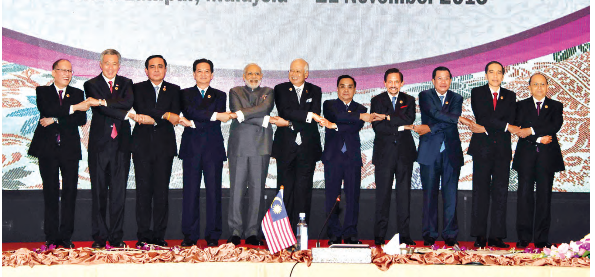
(၁၃)ကြိမ်မြောက် အာဆီယံ-အိန္ဒိယ ထိပ်သီးအစည်းအဝေးသို့ တက်ရောက်ကြသော အာဆီယံနိုင်ငံများမှ ခေါင်းဆောင်များနှင့် အိန္ဒိယဝန်ကြီးချုပ်တို့ စုပေါင်းမှတ်တမ်းတင် ဓာတ်ပုံရိုက်စဉ်။

ညပိုင်းတွင် နိုင်ငံတော်သမ္မတသည် မလေးရှားနိုင်ငံ ဝန်ကြီးချုပ်နှင့် ဇနီးတို့က ကွာလာလမ်ပူ ကွန်ဗင်းရှင်းစင်တာ၌ အာဆီယံနိုင်ငံများ၊ ဆွေးနွေးဖက်နိုင်ငံများ၏ နိုင်ငံအကြီးအကဲ၊ အစိုးရအဖွဲ့အကြီးအကဲများအား တည်ခင်းဧည့်ခံသည့် ညစာစားပွဲသို့ တက်ရောက်ခဲ့သည်။ (သတင်းစဉ်)