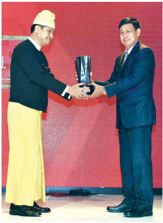
၂၀၁၅ ခုနှစ် အာဆီယံစီးပွားရေးဆိုင်ရာဆုပေးပွဲ အခမ်းအနားအပြီး ဆုရရှိသူများ စုပေါင်းမှတ်တမ်းတင် ဓာတ်ပုံရိုက်စဉ်။ (ပြန်/ဆက်)