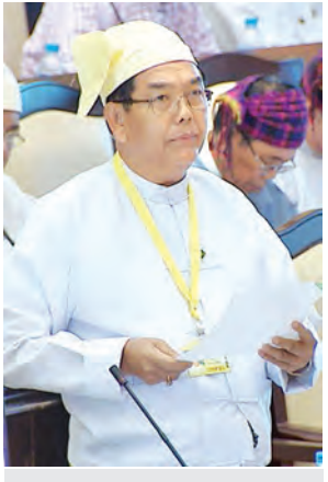
ဒုတိယဝန်ကြီး ဦးအုန်းသန်း။

ထို့နောက် ပြည်သူ့လွှတ်တော်က ပြင်ဆင်ချက်ဖြင့် အတည်ပြုပေးလိုသည့် နိုင်ငံခြားသုံးငွေစီမံခန့်ခွဲမှု ဥပဒေကို ပြင်ဆင်သည့်