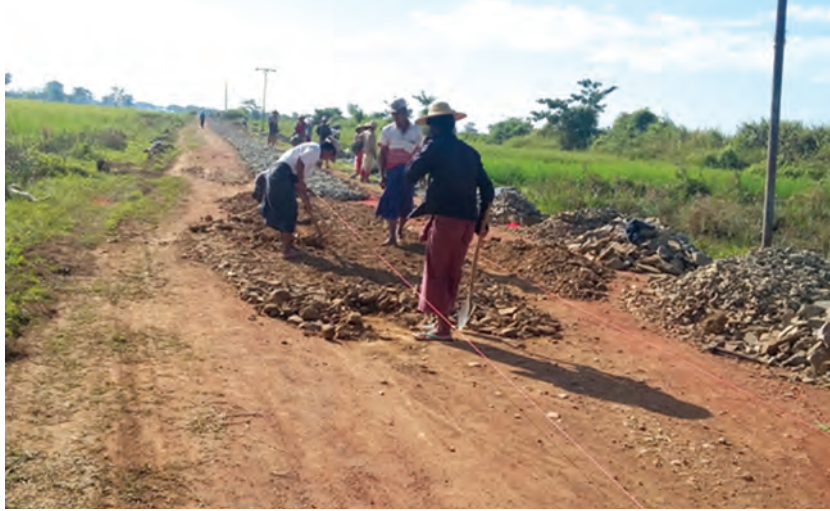
မြင့်ထွန်းမင်း(ကောလင်း)

ဝန်းသိုမြို့နယ် စိန်လည်ကျေးရွာတောင်ဘက်မှ သရက်အိုက်ကျေးရွာအထိ အရှည် တစ်မိုင်ခွဲအကျယ် ၁၈ ပေရှိ မြေသားလမ်းကို ကျောက်ချောလမ်းအဖြစ် အဆင့်မြှင့်တင်နေခြင်းဖြစ်သည်။ ကောလင်း-ဝန်းသို ကျေးရွာချင်းဆက်လမ်းသည် ကျေးရွာအချင်းချင်း ဆက်သွယ်သွားလာရေးအပြင် မကျီးကျွန်းကျေးရွာအုပ်စု၊ လက်ပံကြီးတောကျေးရွာအုပ်စု၊ ကြိုင်းခွင်ကျေးရွာအုပ်စုများမှ ကျေးရွာ ၃၀ ခန့်အတွက် ကောလင်းမြို့ပေါ်သို့ သွားလာရာတွင်လည်း အားထားအသုံးပြုနေရသည့် လမ်းဖြစ်သောကြောင့် ကျောက်ချောခင်းမှုများ ဆောင်ရွက်ပြီးစီးပါက ကျေးရွာအချင်းချင်း ဆက်သွယ်ရေး ပိုမိုအဆင်ပြေစေမည်အပြင် ကျေးရွာများမှ လယ်ယာထွက်ကုန်များကို ကောလင်းမြို့ပေါ်သို့ တင်ပို့ရာ၌လည်း ပိုမိုလွယ်ကူလာစေမည်ဖြစ်ကြောင်း သိရသည်။