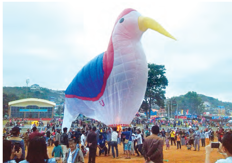
တောင်ကြီး နိုဝင်ဘာ ၂၀

ရမ်းပြည်နယ်(တောင်ပိုင်း) တောင်ကြီးမြို့ အဝေရာမီးပုံးပျံကွင်း၌ နိုဝင်ဘာ ၁၉ ရက်က ဒေသခံပြည်သူများက ပြိုင်ပွဲဝင်နေ့လွှတ်အရပ်အုပ်စု၊ ခြေနှစ်ချောင်း၊ ခြေလေးချောင်း၊ မီးပုံးအရပ်များဖြင့် လွှတ်တင်ယှဉ်ပြိုင်ကြသည်။