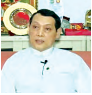
အာဆီယံဥက္ကဋ္ဌ ကာလအတွင်း တာဝန်ယူနေတဲ့ နေပြည်တော် ကြေညာချက်ကို ကြေညာပြီး

အာဆီယံထိပ်သီးအစည်းအဝေးကတော့ နိုဝင်ဘာ ၂၀ ရက်နဲ့ ၂၂ ရက်မှာကျင်းပမှာဖြစ်ပါတယ်။ ဒီထိပ်သီးအစည်းအဝေးဟာအင်မတန်ကိုအရေးကြီးတဲ့အစည်းအဝေးဖြစ်ပါတယ်။ ဒီနှစ်ကုန်မှာ အာဆီယံကိုနိုင်ငံတကာက နေပြီတော့အာဆီယံ အသိုက်အဝန်းကြီးချိန်း ဖြစ်ပေါ်လာမှာကို မြင်တွေ့နိုင်မယ့်အတွက်ဖြစ်ပါတယ်။ မနက်တုန်းက ကျွန်တော်တို့နိုင်ငံ