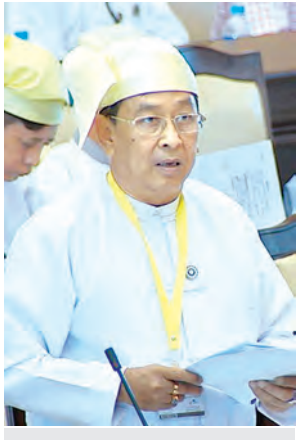
ဒုတိယဝန်ကြီး ဦးထင်အောင်။

ထို့နောက် ဥပဒေကြမ်းကော်မတီက မြန်မာနိုင်ငံ စာရင်းအင်း ဥပဒေကြမ်း၊ ပုဂ္ဂလိကပညာရေး ဥပဒေကြမ်းတို့နှင့်စပ်လျဉ်းသည့် အစီ