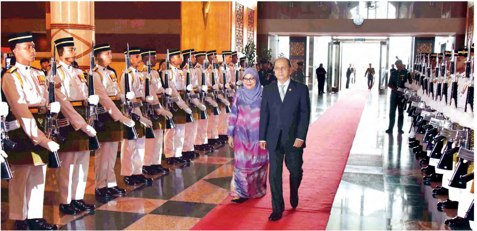
နိုင်ငံတော်သမ္မတ ဦးသိန်းစိန်အား မလေးရှားနိုင်ငံ အမျိုးသမီး၊ မိသားစုရေးရာနှင့် လူ့အဖွဲ့အစည်းဖွံ့ဖြိုးတိုးတက်ရေးဝန်ကြီး YB Dato Sri Rohani Binti Abdul Karim က ကွာလာလမ်ပူလေဆိပ်၌ ကြိုဆိုနှုတ်ဆက်စဉ်။