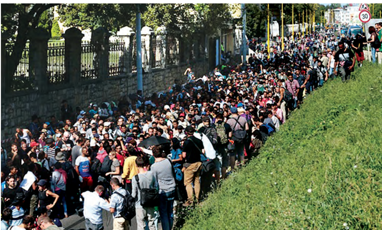
ဩစတြီးယားသို့ သွားရောက်ရန်ကြိုးစားနေသည့် ဆီးရီးယားရွှေ့ပြောင်းဒုက္ခသည်များကို တွေ့ရစဉ်။

နိုင်ငံဘာ ၁၃ ရက် ပါရီအကြမ်းဖက်မှုကြီးလွန်သူများကို ရှာဖွေဖမ်းဆီးရန် မြေလှန်ရှာဖွေနေစဉ်တွင် ပြင်သစ်နယ်စပ်ဂိတ်၌ ဟန့်တားစစ်ဆေးမှုများကို ပြုလုပ်နေသည်။ ဥရောပနိုင်ငံ ငါးနိုင်ငံက ဒုက္ခသည်များဝင်ရောက်မှုကို ထိန်းချုပ်ရန် ၁၉၈၅ ခုနှစ်က အတည်ပြုခဲ့သည့် ရှင်ဂန်းသဘောတူစာချုပ်ကို ရပ်ဆိုင်းထားခဲ့သည်။ ရှင်ဂန်းသဘောတူညီချက်ပြန်လှန်သုံးသပ်ရေးအတွက် တောင်းဆိုသည့်အပြင် ဆူနီယာလည်း အတည်ပြုနိုင်ခဲ့သည်။ ထို့ကြောင့်ပင် ဒုက္ခသည်များ လက်ခံမှုရပ်ဆိုင်းရန်နှင့် နယ်စပ်များ ပိတ်ထားရန်တောင်းဆိုနေကြသည့်ဥရောပဒေသ လက်ယာယိမ်းနိုင်ငံရေးအုပ်စုများသည် လူထုထောက်ခံမှုများ ပိုမိုရရှိလာသည်။