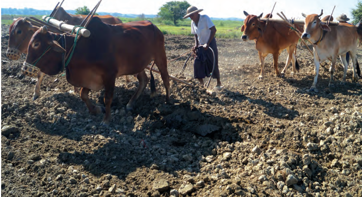
ဖြင့် နံနက်ပိုင်းအငှားလိုက်ခတ်ရှင်းလျှင် ငါးထောင်ကျပ်ရရှိကြောင်း၊ နေ့စားလုပ်သားများမှာ အမျိုးသားတစ်ဦးလျှင် တစ်နေ့လုပ်အားခ ငါးထောင်ကျပ်

မြေများကို ပြုပြင်ထွန်ယက်ရာ၌ ထွန်စက်ဖြင့်မြေပြင်ခံမှာ တစ်နာရီလျှင် ကျပ်တစ်သောင်းခန့်ထောင်မှ နှစ်သောင်းကျပ်အထိ ထွန်စက်အမျိုးအစားကိုလိုက်၍ ဝန်ဆောင်စရိတ်ပေးဆောင်ရပြီး နွားရှဉ်းအငှားလိုက်သူများအနေ