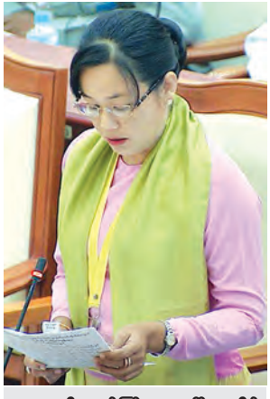
ဒုတိယဝန်ကြီး ဒေါ်စုစုလှိုင် မြေကြားစဉ်။

ကို လူတိုင်းအကျုံးဝင်ပြီး တန်းတူညီမျှမှုရှိစွာ သင်ယူခွင့်ရရှိစေရန်နှင့် အားလုံးအတွက် ဘဝတစ်သက်တာ သင်ယူခွင့်ရရှိစေရန် ဆက်လက်ဆောင်ရွက်သွားမည် ဖြစ်ပါကြောင်း၊ အဆင့်မြင့် ပညာကဏ္ဍတွင်လည်း အကြောင်း အမျိုးမျိုးကြောင့် နေ့သင်တန်း မတက်ရောက်နိုင်သော