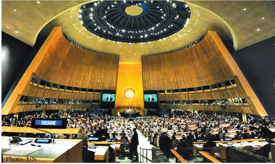
အကြိမ်(၇၀)မြောက် ကုလသမဂ္ဂအထွေထွေညီလာခံကျင်းပနေမှုကို တွေ့ရစဉ်။

သံအမတ်ကြီး ဦးကျော်တင်က မြန်မာနိုင်ငံသည် သီးခြားရွေးထုတ်မှုမရှိခြင်း၊ ဘက်လိုက်မှုကင်းခြင်းနှင့် နိုင်ငံရေးသွတ်သွင်းမှုကင်းခြင်းစသည့် အခြေခံမူများကို ဆန့်ကျင်၍ နိုင်ငံတစ်နိုင်ငံချင်းစီအပေါ် ဦးတည်ချမှတ်သည့် ဆုံးဖြတ်ချက်အဆိုများကို ဆန့်ကျင်ကြောင်း၊ Universal Periodic Review (UPR) သည် နိုင်ငံအားလုံး၏ လူ့အခွင့်အရေးအခြေအနေများကို တစ်ပြေးညီ ဆွေးနွေးသည့် အားထားဖွယ်အကောင်းဆုံးယန္တရား တစ်ခုဖြစ်ကြောင်း၊ ထို့ကြောင့် မြန်မာနိုင်ငံက ပြီးခဲ့သည့် ရက်သတ္တပတ်အတွင်းက ဂျီနီဗာမြို့၌ ပြုလုပ်ခဲ့သည့် Universal Periodic Review (UPR) ပြန်လည်သုံးသပ်မှု ဒုတိယအကျော့တွင် တက်ကြွစွာ ပါဝင်ခဲ့ပါကြောင်း။