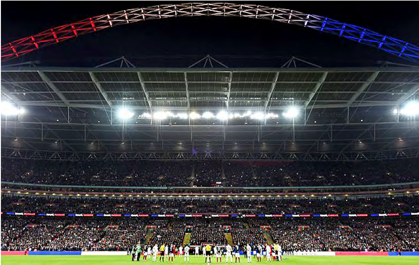
အင်္ဂလန်နှင့်ပြင်သစ်ခြေစမ်းပွဲမကစားမီ နှစ်ဖက်ပရိသတ်နှင့်ကစားသမားများ ပါရီမြို့တိုက်ခိုက်ခံရမှုအတွင်း သေဆုံးဒဏ်ရာရသူများအတွက် ငြိမ်သက်ဆုတောင်းစဉ်။