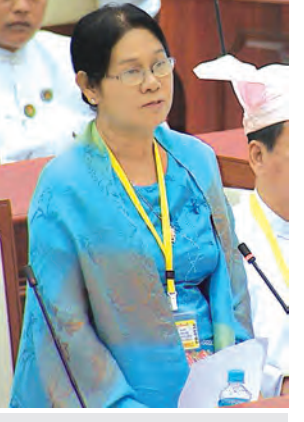
ဒုတိယဝန်ကြီး ဒေါ်လှလှသိန်း ရှင်းလင်းတင်ပြစဉ်။

၂၀၁၄-၂၀၁၅ ဘဏ္ဍာနှစ် အမျိုးသားစီမံကိန်းဒုတိယခြောက်လပတ် အစီရင်ခံစာသည် ၂၀၁၄ ခုနှစ်အောက်တိုဘာလမှ ၂၀၁၅ ခုနှစ်