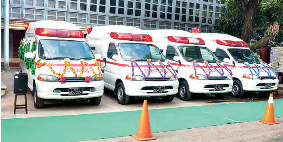
ရန်ကုန်ပြည်သူ့ဆေးရုံကြီးနှင့် ခုတင် (၅၀၀) ဆံ့ အထူးကုဆေးရုံသို့ လှူဒါန်းသည့် လူနာတင်ယာဉ်များ။

ယနေ့လှူဒါန်းသည့် ဂျပန်နိုင်ငံ ထုတ် တိုယိုတာ လူနာတင်ယာဉ်