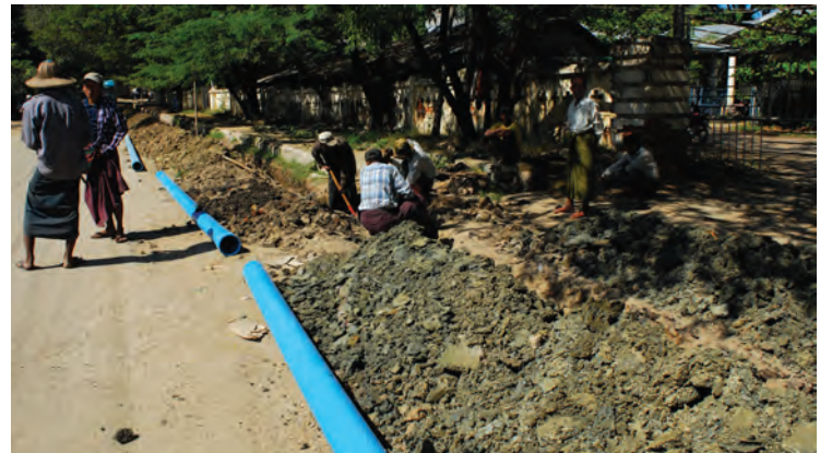
မြို့တွင်း ရေတင်/ရေဖြန့် ပိုက်လိုင်းများ တူးဖော်နေခြင်း။