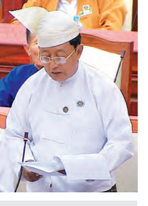
ဝမ်းတွင်း မဲဆန္ဒနယ်မှ ဦးသန်းမြင့် မေးမြန်းစဉ်။

အချက်အလက်များကို စုံလင်စွာ သိရှိလိုခြင်းနှင့် ရေငန်ဝင်ရောက်၍ စပါးပျက်စီးရသောမြို့နယ်၊ ဒေသအားလုံးတို့အား အဆိုပါ စပါးမျိုးစေ့ကို ဖြန့်ဝေပေးရန် အစီအစဉ်ရှိ/မရှိနှင့်စပ်လျဉ်း၍ မေးမြန်းရာ လယ်ယာစိုက်ပျိုးရေးနှင့် ဆည်မြောင်းဝန်ကြီးဌာန ဒုတိယဝန်ကြီး