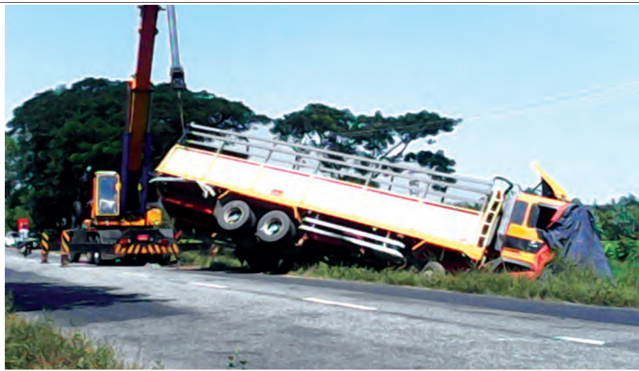
နိုဝင်ဘာ ၁၈ ရက် နံနက် ၄ နာရီခန့်က ရန်ကုန်-မော်လမြိုင် အဝေးပြေးကားလမ်းမကြီးပေါ်၌ သထုံ မြို့နယ် ဇရစ်ချောင်ကျေးရွာအုပ်စုအနီးတွင် လိမ္မော်သီးများ တင်ဆောင်လာသော ၁၂ ဘီး ကုန်တင်ယာဉ်သည် ရှေ့မှကားကိုကျော်တက်စဉ် အရှိန်မထိန်းနိုင်ဘဲ တစ်ဖက်ယာဉ်ကြောသို့ရောက်ရှိ တိမ်းမှောက်သွားစဉ်။ ခွန်(ဝင်းပ)

သွားရပြီးတော့ ဟိုရောက်တော့ ဘာ မီးကိုမှ မတွေ့ခဲ့ရပါဘူး။ “အခုလည်း အသံအနေအထား အသက်လတ်ပိုင်းလောက် လူတစ်ဦး ဖုန်းဆက်လာတာနဲ့သွားတော့ ဘာ မီးမှမတွေ့ခဲ့ရပါဘူး”ဟု မြို့နယ် မီးသတ်ဦးစီးမှူးက ပြောသည်။ ထိုကဲ့သို့ မြို့နယ်မီးသတ်ဦးစီး ဌာနသို့ မီးသတင်းလိမ်လည်ပေး၍ ပြည်သူများအား အထိတ်တလန့် ဖြစ်စေရန်ပြုလုပ်သူအား ဖော်ထုတ် အရေးယူ ဆောင်ရွက်သွားမည်ဖြစ် ကြောင်း သိရသည်။ အိမွန်ဆွေ(ရေစကြို)