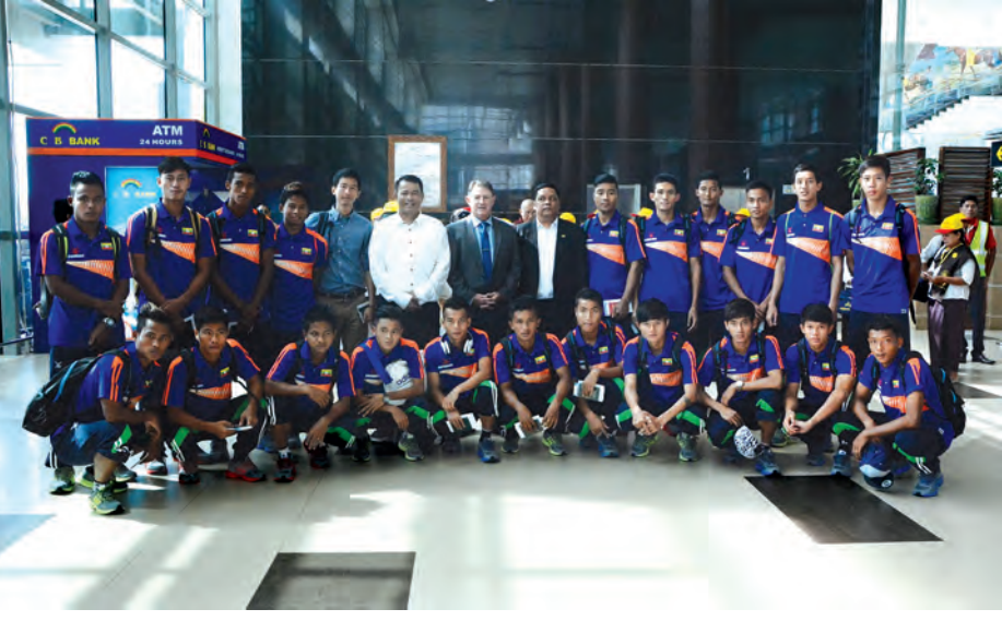
မြန်မာယူ-၂၁ အသင်းအား ရန်ကုန်အပြည်ပြည်ဆိုင်ရာလေဆိပ်မှ မထွက်ခွာမီ တွေ့ရစဉ်။

မြန်မာတို့ရဲ့ ကထိန်ပွဲ နှိပ်ဖျော့ခြင်းဖြစ်သံ... ဂေါ်ဒီလာ လည်းပါဝင်... ခြင်နိုင်ဆေးခွေ / ဘက်စုံသုံး ရေမွှေးဆပ်ပြာ