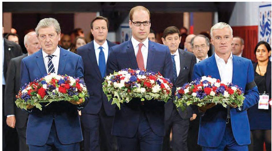
အင်္ဂလန်-ပြင်သစ်ခြေစမ်းပွဲမကစားမီ ဗြိတိန်အိမ်ရှေ့မင်းသားဝီလျံ၊ ဗြိတိန်ဝန်ကြီးချုပ်နှင့် နှစ်နိုင်ငံနည်းပြများကို တွေ့ရစဉ်။

ကဝ နိုဝင်ဘာ ၁၈ ကဝမြို့နယ် အမှတ် (၁) ရပ်ကွက်ကွင်းအမှတ် (၁၀၉၂-ခ)မစောဘုရား ကွင်း ဦးပိုင်အမှတ် (၇၆) လယ်မြေ ၁ ဒသမ ၆၆၈ တောင်သူဦးကိုလွင် စိုက်ပျိုးထားသော ပုလဲသွယ်မိုးစပါးအထွက်နှုန်းမှန်ကန်ရေးအတွက် စံကွက် ရိတ်သိမ်းပွဲကို နိုဝင်ဘာ ၁၅ ရက် နံနက်က ကျင်းပခဲ့ကြောင်းသိရသည်။ အဆိုပါစံကွက်မှ တစ်ကေလျှင် ပျမ်းမျှ ၁၀၂ ဒသမ ၈၉ တင်းနှုန်း ထွက်ရှိခဲ့ကြောင်း သိရသည်။ ကျော်ကျော်(ပြန်/ဆက်)