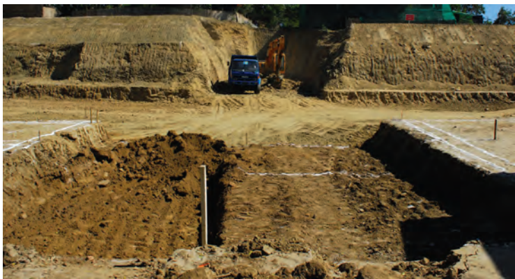
မြစ်ရေတင်စက်တည်ဆောက်မည့်မြေနေရာ ပြုပြင်နေခြင်း။

မင်းဘူးမြို့ တိုးချဲ့ရေပေးဝေရေးလုပ်ငန်း များကိုဆောင်ရွက်ရာတွင် တည်ဆောက်ရေး လုပ်ငန်းများကို ပွင့်ဦးကုမ္ပဏီကလည်း ကောင်း၊ ရေတင်နှင့် ရေဖြန့်ဝေပိုက်လိုင်းများ သွယ်တန်းခြင်းလုပ်ငန်းကို WWW ကုမ္ပဏီ က လည်းကောင်း၊ ရေမြှုပ်ပန်နှင့် ရေတင် စက်များတပ်ဆင်ခြင်းလုပ်ငန်းနှင့် တိုင်း ဒေသကြီး လျှပ်စစ်ဖြန့်ဖြူးရေးလုပ်ငန်းမှ လျှပ်စစ်သွယ်တန်းခြင်း လုပ်ငန်းများကို