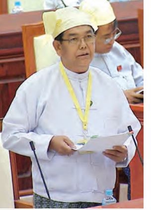
ဒုတိယဝန်ကြီး ဦးအုန်းသန်း မြေကြားစဉ်။

အန္တရာယ်ကျရောက်သည့် ဒေသများတွင် ပြောင်းလဲလာသည့် ရာသီဥတုနှင့် လိုက်လျောညီထွေ ရှိပြီး ရေလိုအပ်ချက်နည်းပါးသည့် သက်လျင် စပါးမျိုးများ ပြောင်းလဲ စိုက်ပျိုးစေခြင်းအပါအဝင် အခြားနည်းလမ်းပေါင်းစုံဖြင့် ဆောင်ရွက်ပေးလျက်ရှိကြောင်း။