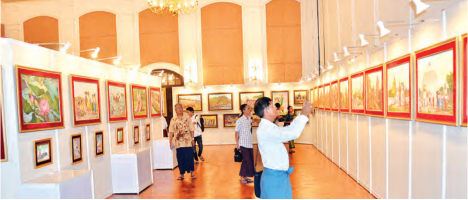
မြန်မာနိုင်ငံ၏ အသက်အကြီးဆုံး ဂန္ထဝင်ပန်းချီဆရာကြီး ဦးစန်းလှိုင်၏ တစ်ကိုယ်တော်ပန်းချီပြပွဲသို့ လာရောက်ကြည့်ရှုလေ့လာကြသည့် ပန်းချီဝါသနာရှင်များကို တွေ့ရစဉ်။

ဆရာကြီး ဦးစန်းလှိုင်သည် ကိုယ်ပိုင်ရေးဟန်နှင့် အောင်မြင်သော စာနယ်ဇင်းသရုပ်ဖော် ပန်းချီပညာရှင်ဖြစ်သည်။ မျဉ်းခြစ် (Line) မင်ခြစ်များကို အသေးစိတ်ကျစွာဆွဲနိုင်သည့် ပန်းချီဆရာတစ်ဦးဖြစ်သည်။ ထူးခြားချက်မှာ မြန်မာဆန်ဆန် အရောင်များကို အသုံးပြုလေ့ရှိပြီး မြန်မာမှုပန်းချီလက်ရာတွင် ဦးဆောင်ဦးရွက်ပြုသူတစ်ဦးဖြစ်သည်။