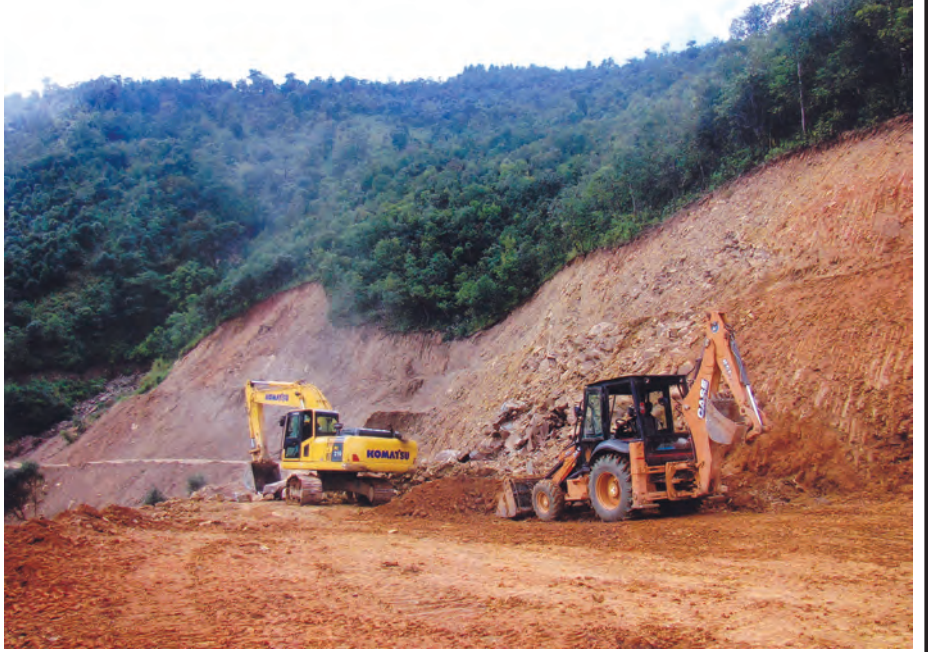
ဟားခါး-ဂန့်ဂေါကားလမ်းတွင် တောင်ပြိုမြေများ ဖယ်ရှားနေစဉ်။

အရှည် ၃၁ မိုင်ကျော်ရှိ တီးတိန်-ရိဒ်ကားလမ်းတွင်လည်း လမ်းသားပျက်စီးမှု သုံးနေရာ၊ တောင်ပြိုခြင်းနေရာ ၂၀ ရှိခဲ့ကာ အရှည် ၅၈ မိုင်ကျော်ရှိ ဂန့်ဂေါ-အိုက္ကားကားလမ်းတွင် တောင်ပြိုမှု ၉၆ နေရာ ရှိခဲ့သည်။ ကျောက်တော်-ပလက်ဝကားလမ်း ၁၃ မိုင်ကျော်တွင် လမ်းသားပျက်စီးမှု တစ်နေရာ၊ ရေပြန်ပျက်စီးမှု ငါးစင်းနှင့် မဲဆော်တံတားတစ်စင်း ပျက်စီးခဲ့ပြီး ယခုအခါ