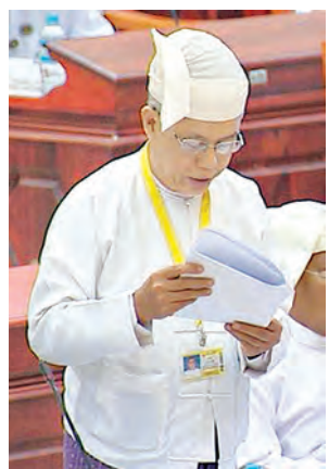
နိုင်ငံသားပိုင်သင်္ဘောလိုင်းများ အဖြစ် ရာနှုန်းပြည့်ရင်းနှီးမြှုပ်နှံ ဆောင်ရွက်လျက်ရှိသည့် သင်္ဘော လိုင်းလုပ်ငန်း သုံးခုရှိပြီး မြန်မာ့