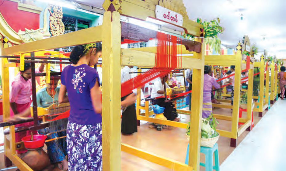
ယမန်နှစ်က မိတ္ထီလာမြို့၌ ကျင်းပခဲ့သည့် မသိုးသင်္ကန်းရက်ပြိုင်ပွဲကို တွေ့ရစဉ်။

မိတ္ထီလာ နိုဝင်ဘာ ၁၇ မိတ္ထီလာမြို့တွင် နဂါးရုံ မဟာ ဗောဓိစေတီတော် ဘဏ္ဍာတော်ထိန်း ဂေါပကအဖွဲ့က ကြီးမှူးကျင်းပသည့် (၄၅)ကြိမ်မြောက် မသိုးသင်္ကန်းပြိုင် ရက်လုပ်ပူဇော်ပွဲနှင့် သံဃာတော် အပါး ၁၀၀၀ ကျော်တို့ကို ဆွမ်းသပိတ် ၁၀၀၀ ကျော် ဆက်ကပ်လောင်းလှူပွဲအား နိုဝင်ဘာ ၂၅ ရက် မှ ၂၆ ရက် (တန်ဆောင်မုန်းလဆန်း ၁၄ ရက်မှ တန်ဆောင်မုန်းလပြည့်နေ့) အထိ နန်းတော်ကုန်းရပ်ကွက် ယင်းစေတီတော် ပညာဓိက တန်ဆောင်၌ ကျင်းပမည်ဖြစ်ကြောင်း သိရသည်။ နှစ်စဉ်နှစ်တိုင်း ကျင်းပမြဲဖြစ်သည့် မသိုးသင်္ကန်း ပြိုင်ရက်လုပ်ပူဇော်ပွဲကို ပြိုင်ပွဲဝင် ကျေးရွာများက ရက်ကန်းစင်ငါးစင်ဖြင့် နိုဝင်ဘာ ၂၅ ရက် ညနေ ၅ နာရီမှ စတင်ပြီး မသိုးသင်္ကန်းများ ပြိုင် ရက်လုပ်ပူဇော်ကြမည်ဖြစ်သည်။ ဆက်လက်၍ နိုဝင်ဘာ ၂၆ ရက် တန်ဆောင်မုန်းလပြည့် နံနက် ၅ နာရီ ၁၅ မိနစ်တွင် မသိုးသင်္ကန်း ဆက်ကပ်လှူဒါန်းထားသည့် ဗုဒ္ဓရုပ်ပွားဆင်းတုတော်များကို အနောက်ဘက်ခြမ်းမှ လှူဒါန်းလှူပေးခြင်းဖြင့် ဆွမ်းသပိတ် ၁၀၀၀ ကျော် ဆက်ကပ်လောင်းလှူမည့် တန်ဆောင်မုန်းလပြည့်နေ့တွင် ဆွမ်းသပိတ် ၁၀၀၀ ကျော် ဆက်ကပ်လောင်းလှူပွဲကို တစ်လုံး ငွေကျပ် ၃၅၀၀ နှုန်းဖြင့် ကပ်လှူပူဇော်လိုသူများ အနေဖြင့် နဂါးရုံ မဟာဗောဓိစေတီတော် ဘဏ္ဍာတော်ထိန်း ဂေါပကအဖွဲ့သို့ ဆက်သွယ် လှူဒါန်းနိုင်ကြောင်း သိရသည်။ ချမ်းသာ(မိတ္ထီလာ)