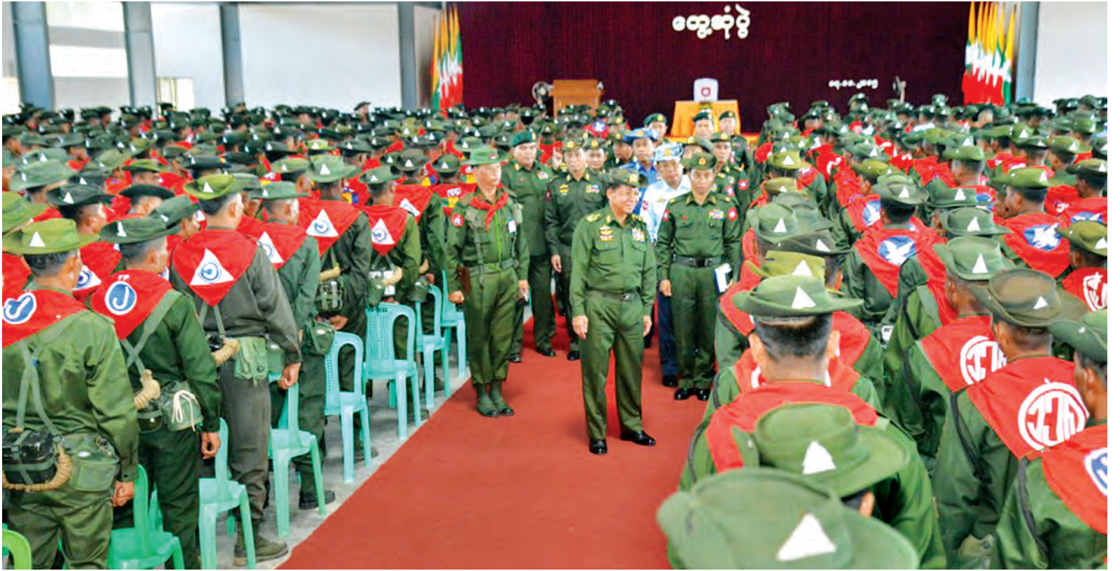
တပ်မတော်ကာကွယ်ရေးဦးစီးချုပ် ပိုလ်ချုပ်မှူးကြီး မင်းအောင်လှိုင် အုတ်တွင်းတပ်နယ်မှ အရာရှိ၊ စစ်သည်များ၊ နည်းပြအရာရှိများနှင့် သင်တန်းသားများနှင့် တွေ့ဆုံပွဲတွင် တက်ရောက်လာသူများအား ရင်းရင်းနှီးနှီးနှုတ်ဆက်စဉ်။

တွေ့ဆုံပွဲမတိုင်မီ တပ်မတော်ကာကွယ်ရေးဦးစီးချုပ်နှင့် အဖွဲ့ဝင်များသည် ကေတုမတီ တောင်ငူမြို့ရှိ မြို့ကျေးသို့သွားရောက်ရာ တိုင်းမှူးက မြို့ကျေး သန့်ရှင်းသာယာလှပရေးဆောင်ရွက်နိုင်မည့် အခြေအနေများကို ရှင်းလင်းတင်ပြပြီး တပ်မတော်ကာကွယ်ရေးဦးစီးချုပ်က ကေတုမတီ တောင်ငူမြို့သည် သက်တမ်းနှစ် ၅၀၀