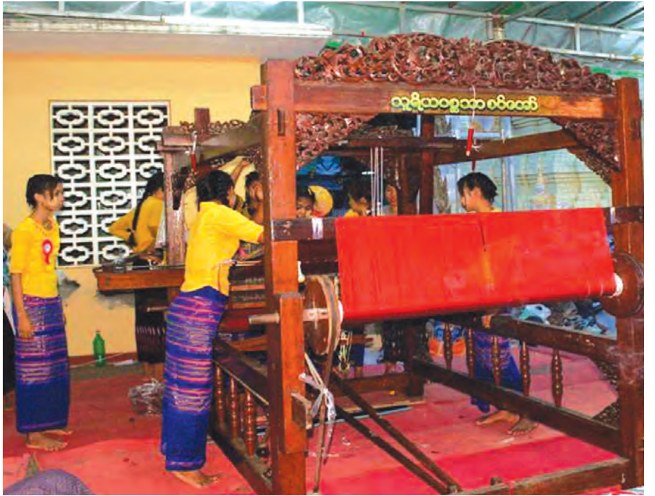
ယမန်နှစ်ကလည်း မုံရွာရှိ ရွှေစည်းခုံစေတီတော်မြတ်ကြီးတွင် မသိုးသင်္ကန်းကပ်လှူပြိုင်ပွဲကြီးကို ကျင်းပခဲ့သည်။

ယနေ့အထိ ပြိုင်ပွဲဝင်ရန် စာရင်း ပေးထားသော အသင်း ၁၀ သင်း ရှိသွားပြီဖြစ်ကာ ပြိုင်ပွဲဝင်အသင်းများ သည် နိုဝင်ဘာ ၁၉ ရက်တွင် မဲစနစ်ဖြင့်ရွေးပြီး ပြိုင်ကြရမည်ဖြစ် သည်။ ထို့နောက် နိုဝင်ဘာ ၂၃ ရက်နေ့နှင့် ၂၅ ရက် မွန်းတည့် ၁၂ နာရီအထိ လေ့ကျင့်ခွင့်ရရှိကြမည် ဖြစ်သည်။