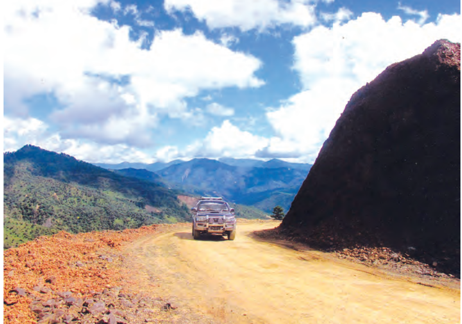
ဟားခါး-ဂန့်ဂေါကားလမ်းမှ တောင်ပြိုမြေများကို ဖယ်ရှားပြီးနောက် တွေ့ရစဉ်။

သတင်းဆောင်းပါး-ခရမ်းစိုးမြင့်