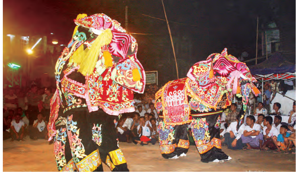
ယမန်နှစ်က ညောင်တုန်းမြို့၏ တန်ဆောင်တိုင်ပွဲတော်၌ ဆင်အကဖြင့် ဖျော်ဖြေမှုကိုတွေ့ရစဉ်။

ရှမ်းပြည်နယ်(မြောက်ပိုင်း) သီပေါမြို့နယ် ဘော်ကြီးကျေးရွာ၌ လွန်ခဲ့သောနှစ်ပေါင်း ၂၀၀၀ ကျော်က သီရိဓမ္မာသောကမင်းကြီး တည်ထားကိုးကွယ်ခဲ့သည့် ဘော်ကြီးဘုရားကြီးပရိဝုဏ်အတွင်းရှိ ဘုန်းတော်ကြီးကျောင်းဝင်း၌ ဂန္ဓကုဋီတိုက်တည်ဆောက်ရန် တူးဖော်ရာမှ တွေ့ရသော ရှေးဟောင်းဗုဒ္ဓရုပ်ပွားဆင်းတုတော်များ။ (အဆိုပါ ရှေးဟောင်းဗုဒ္ဓရုပ်ပွားဆင်းတုတော်များကို ဇူလိုင် ၂၃ ရက်က အဆု ၃၅၀ နှင့် အောက်တိုဘာ ၂၄ ရက်က ၅၆ ဆု တူးဖော်တွေ့ရှိခဲ့ခြင်းဖြစ်ကြောင်း၊ ဘော်ကြီးဘုရားသည် ပုဂံပြည်ရှင် အနော်ရထာမင်းနှင့် ရှမ်းပြည်စော်ဘွားကြီး၏ သမီးတော် မင်းသမီး စောမွန်လှတို့၏ သမိုင်းကြောင်းများနှင့် ဆက်စပ်လျက်ရှိသောကြောင့် စိတ်ဝင်စား၍ အနယ်နယ်အရပ်ရပ်မှ လာရောက်ဖူးမြော်သူပြည်သူများဖြင့် စည်ကားလျက်ရှိကြောင်း သိရသည်။) စိုင်း(သီပေါ)