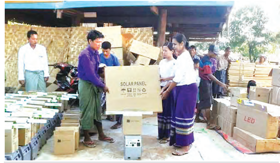
ခင်ဦးမြို့နယ်ကျေးလက်ဒေသဖွံ့ဖြိုးတိုးတက်ရေးဦးစီးဌာနမှ မြို့နယ်တွင်းရှိ ကျေးရွာများ၌ ဆိုလာမီးတပ်ဆင်နိုင်ရေး ဒေသခံများသို့ ပေးအပ်စဉ်။