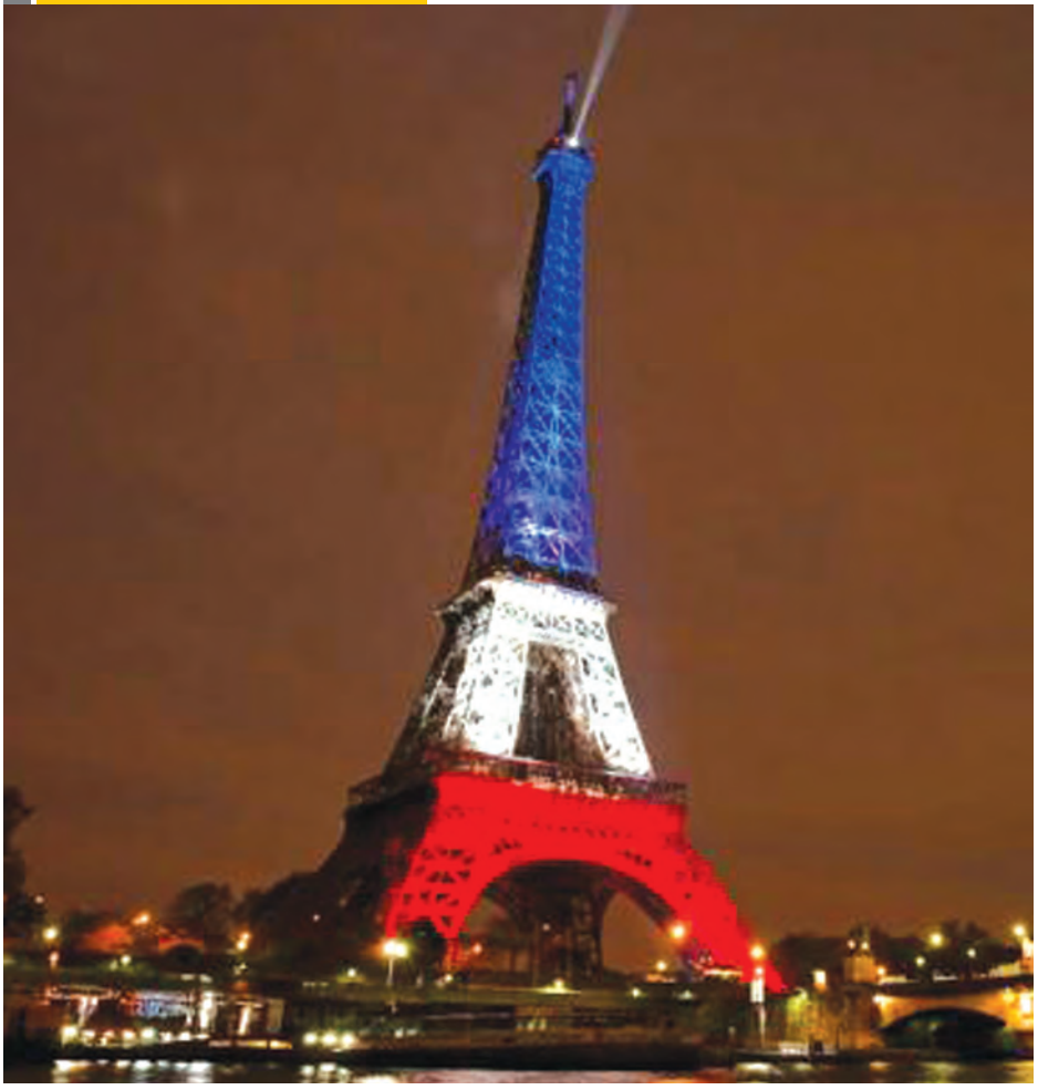
ပါရီအကြမ်းဖက်တိုက်ခိုက်မှုတွင် သေဆုံးသွားသူများကို ဂုဏ်ပြုသောအားဖြင့် အိမ်ထောင်စုကို နိုင်ငံတော် ကိုယ်စားပြုအရောင်များဖြင့် စီးထွန်းထားစဉ်။