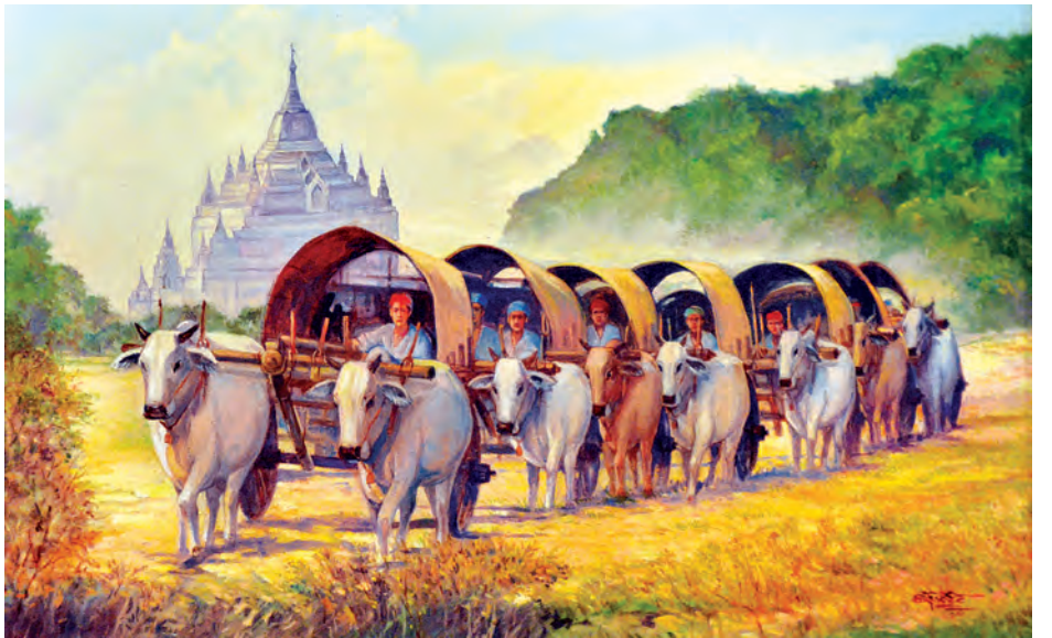
မြန်မာနိုင်ငံ၏ အသက်အကြီးဆုံး ဂန္ထဝင်ပန်းချီဆရာကြီး ဦးစန်းလှိုင်၏ တစ်ကိုယ်တော်ပန်းချီပြပွဲ၌ ပြသထားသော ပန်းချီကားတစ်ချပ်ကို တွေ့ရစဉ်။

ဦးစန်းလှိုင်သည် မျဉ်းခြစ်၊ မင်ခြစ်တွင်သာမကဘဲ ဥရောပပန်းချီနည်းစနစ် (Medium) များဖြစ်သော ဆီဆေး၊ ရေဆေးပန်းချီကားချပ်များကိုလည်း ရေးဆွဲနိုင်သူဖြစ်သည်။ ကျော်ကြားခဲ့သော လက်ရာများမှာ ဇာတ်ကြီးဆယ်ဘွဲ့ အနှစ်ချုပ် ၅၅၀ နိပါတ်တော်ဇာတ်လမ်း လက်ရာများ၊ ဧကရီစုဘုရားရုပ်ပြု၊ ပတ္တမြားငမောက်နှင့် ရတနာပုံနန်းတွင်း လျှို့ဝှက်ဇာတ်လမ်းများ၊ မြသပိတ်တောင်အဆင်းနှင့် မင်းကွန်းဇေတဝန်ည အစရှိသောလက်ရာများ ဖြစ်ကြသည်။ ပြသထားသော ပန်းချီကားများမှာ နိုင်ငံရေး၊ စီးပွားရေး၊ လူမှုရေးအကြောင်းအရာစုံ၊ ရသစုံပြသထားပြီး လေးပေ သုံးပေ၊ နှစ်ပေ သုံးပေဆိုင် ဆီဆေးပန်းချီကား ၁၀၅ ကား ပြသထားကာ ပြပွဲကို ဇူလိုင် ၁၇ ရက်မှ ၁၈ ရက်အထိ ပြသမည်ဖြစ်ကြောင်း သိရသည်။