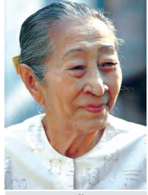
လူထုဒေါ်အမာ

လာမည့် နိုဝင်ဘာ ၂၉ ရက်တွင်ရောက်ရှိမည့် ပြည်သူချစ်သော စာရေးဆရာမကြီး လူထုဒေါ်အမာ၏ နှစ် ၁၀၀ ပြည့် မွေးနေ့အထိမ်းအမှတ်အဖြစ် ဆရာမကြီး၏ ထင်ရှားကျော်ကြားခဲ့သော ပြည်သူချစ်သော အနုပညာ စာအုပ်ကို ဂုဏ်ပြုသောအားဖြင့် ပြည်သူချစ်သော လူထု ဒေါ်အမာနှင့် အနုပညာသည်များ ဆိုသည့်ခေါင်းစဉ်ဖြင့် မန္တလေးမြို့ခံ စာရေးဆရာ ဆူးငှက်က နိုဝင်ဘာ ၂၆ ရက်တွင် ချမ်းအေးသာစံမြို့နယ် (၈၄)လမ်း (၃၁) လမ်းထောင့် မေ့သာလာခန်းမ၌ ဟောပြောသွားမည်ဖြစ်ကြောင်း သိရသည်။