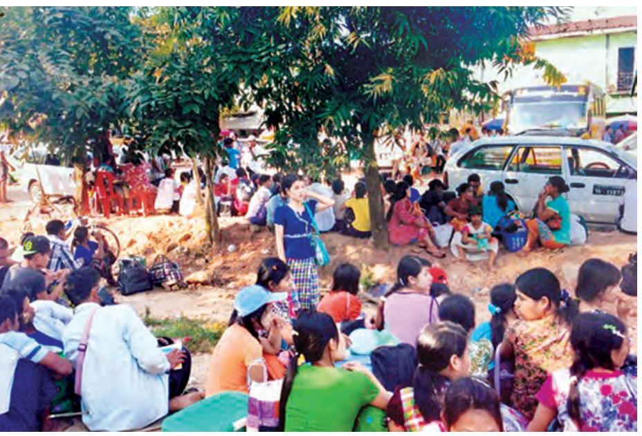
ဌာနေပြန်မည့် ခရီးသွားများပြား ကောက်ခံပြေးဆွဲခြင်းများကို ခရီး ခရီးသည်များက ဆိုသည်။ သဖြင့် ကြားကားများယာဉ်စီးခ ပိုမို သွားများ ကြုံတွေ့ခဲ့ရကြောင်း ခင်ဆိုင်

အလားတူ ရန်ကုန်-ဟင်္သာတ ခရီးစဉ်တွင် လိုက်ထရပ်ယာဉ်ငယ် များ ခရီးသည်တစ်ဦးလျှင် ကားခ ငွေကျပ် ၇၀၀၀ နှုန်းဖြင့် ဝင်ရောက် ပြေးဆွဲသည်ကို မြင်တွေ့ရသည်။ ပုသိမ်ခရီးစဉ်တွင် အဆင့်မြင့်ယာဉ် ငယ်များ ခရီးသည် ၁၄ ဦး၊ ဟင်္သာတ ခရီးစဉ်တွင် လိုက်ထရပ်ယာဉ်ငယ် များ ခရီးသည် ၂၀ ဝန်းကျင် တင်ဆောင် ပြေးဆွဲရာ ရန်ကုန်မြို့ တွင်း ပြေးဆွဲသည်ထက် ဝင်ငွေပိုရ သည်”ဟု ယာဉ်လုပ်သားတစ်ဦးက ဆိုသည်။ ရန်ကုန်- ပုသိမ် မိုင် ၁၁၃ မိုင် ခရီးတွင် ပုံမှန်ကားခ ငွေကျပ် ၃၀၀၀- ၃၅၀၀ ဝန်းကျင်၊ ၉၅ မိုင်ဝန်းကျင် ရှိသော ရန်ကုန်- ဟင်္သာတခရီးစဉ်တွင် ပုံမှန်ကားခငွေကျပ် ၂၀၀၀-၃၀၀၀ ဝန်းကျင်သာရှိသည်။ ယခုနှစ် ဘကြိန် ပိတ်ရက်မတိုင်မီ ရက်များအတွင်း