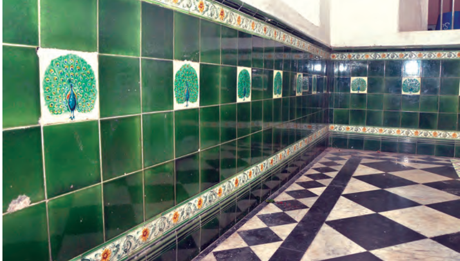
နှစ်ပေါင်း ၇၀ ကျော်ကြာမြင့်ခဲ့ပြီဖြစ်သည့် ဒေါင်းတံဆိပ်ကျောင်ကျောက်ပြားများ

“သိမ်တော်ကြီးရဲ့ မှတ်တမ်းဟာ ဗုဒ္ဓဘာသာဝင်တွေအဖို့ စံထားလောက်တဲ့ အဖြစ်အပျက်တွေကို ပြနေတယ်။ မဟာသိမ်တော်ကြီး ပြန်ပြင်ဆောက် မှုမှာ မြန်မာလူမျိုးတွေရဲ့ ဇွဲနဲ့ သဒ္ဓါတရားကို မျက်ဝါးထင်ထင် မြင်ခဲ့ရတယ်။ သိမ်တော်ကြီးကျောင်းတိုက်အတွင်းက မြတ်စွာဘုရားကျောင်းတော်ကြီးဟာ တည်ထောင်ချိန်ကနေ အခုထိ လူမျိုးမရွေး၊ ဘာသာမရွေးကို မြို့လယ်ကောင်မှာ