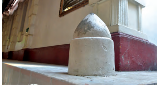
လွန်ခဲ့သည့်နှစ်ပေါင်း ၂၀၀၀ ကျော်က စတင်သမုတ်ခဲ့သော မဟာသိမ် တော်ကြီး၏ သိမ်သမုတ်တိုင်

ဒုတိယကမ္ဘာစစ်ဖြစ်ပွားဖြစ်နောက် စစ်တွင်းကာလတွင် ရန်ကုန်မြို့သည် ဗုံးဒဏ်ကို အလူးအလဲခံစားခဲ့ရပြီး အပျက်အစီးများကို ပြန်လည်ထူထောင်