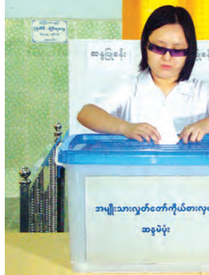
သတင်း-တင်ဝင်းလေး(ကြည့်မြင်တိုင်)

ကြည့်မြင်တိုင်မြို့နယ် မကျည်းတန်းတောင် အရှေ့ရပ်ကွက် မျက်မမြင်ကျောင်းဝင်းခန်းမရှိ မဲရုံအမှတ် (၁) တွင် အသက် ၁၈ နှစ်ပြည့် အမြင်အာရုံချို့ယွင်းပြီး ဆန္ဒမဲပေးမည့်သူ ၅၅ ဦးရှိကြောင်း သိရသည်။