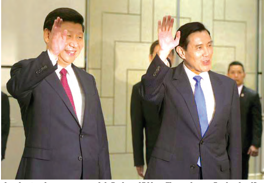
တိုးတက်လာခဲ့သည်။ “ကျွန်တော်တို့အနေနဲ့ ဒီမှာလူတိုင်းကို ကတိပြုပြောကြားလိုတာက တော့ ကျွန်တော်တို့ အရင်ကထက် ရည်မှန်းချက်တွေကို ပိုမိုပေါက်မြောက်အောင်မြင်ဖို့ ကြိုးပမ်းသွားမှာ ဖြစ်ပါတယ်။ တိုင်ပင်ရေးလက်ကြားဟာ ပိုမိုငြိမ်းချမ်းအောင် လုပ်ဆောင်သွားရမှာပါ။ နှစ်နိုင်ငံလုံးက ပိုမိုပူးပေါင်းဆောင်ရွက်မှုတွေ ပြုလုပ်နေပါတယ်” ဟု စင်ကာပူသို့ မထွက်ခွာမီလေဆိပ်၌ မာရင်ဂျီးက သတင်းထောက်များအား ပြောကြားသည်။ (ရိုက်တာ)

တရုတ်(တိုင်ပင်)နှင့် တရုတ်နိုင်ငံမှ ခေါင်းဆောင်များသည် ရွှေ့ကောက်ပွဲများ ကျင်းပရန် သီတင်းပတ်များအလို ကိုယ်ပိုင်အုပ်ချုပ်ခွင့်ရ ဒီမိုကရက်တစ်ကျွန်းပေါ်တွင် ပေကျင်းဆန်ကျင်ရေး မြင့်တက်လာချိန် စနေနေ့က နှစ် ၆၀ ကျော်အတွင်း ပထမဆုံးအကြိမ်အဖြစ် တွေ့ဆုံဆွေးနွေးသည်။ တရုတ်သမ္မတ ရှီကျင့်ဖျင်နှင့် တိုင်ပင်သမ္မတ မာရင်ဂျီးတို့သည် ၁၉၄၉ ခုနှစ် တရုတ်ပြည်တွင်းစစ်အပြီး ပထမဆုံးအကြိမ်အဖြစ် စင်ကာပူနိုင်ငံ၌ တွေ့ဆုံခဲ့ကြသည်။ တိုင်ပင်သမ္မတနှင့် ပါလီမန်ရွှေ့ကောက်ပွဲများမကျင်းပမီ ယင်းတို့ တွေ့ဆုံခြင်းဖြစ်သည်။