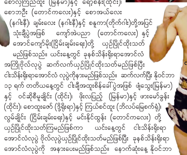
လက်ပူလီလိတ်(ထိုင်း)

သတင်းဆောင်းပါး - မောင်စိန်လွင်(မြန်မာ့အလင်း)