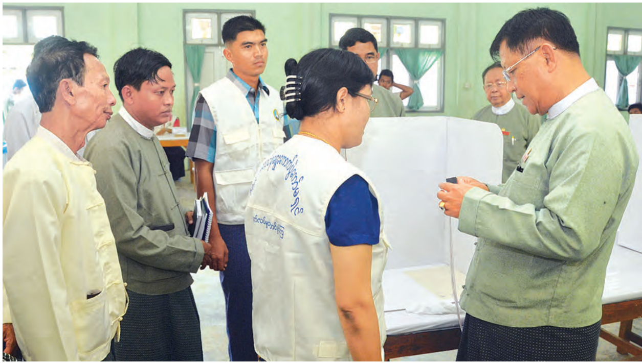
တားရန်၊ ဆန္ဒပြုခန်း၏ နောက်ကျော ရွေးကော်မရှင် ဦးတင်အေးသည် ပြည်ထောင်စုနယ်မြေအတွင်း မဲရုံများအား လိုက်လံကြည့်ရှုစစ်ဆေးခဲ့သည်။

နေပြည်တော် နိုဝင်ဘာ ၇ ပြည်ထောင်စု ရွေးကောက်ပွဲ ကော်မရှင်ဥက္ကဋ္ဌ ဦးတင်အေးသည် အဖွဲ့ဝင် ဦးအောင်မြင့် ကော်မရှင် အဖွဲ့ဝင်များမှ တာဝန်ရှိသူများနှင့် အတူ ပုဗ္ဗသီရိမြို့နယ် ညောင်ပင်ကြီး စုကျေးရွာအုပ်စုရှိ မဲရုံအမှတ်(၁)နှင့် အမှတ်(၂)၊ ဇေယျသီရိမြို့နယ် ဇေယျသီရိရပ်ကွက် အမှတ်(၅) အခြေခံ ပညာအထက်တန်း ကျောင်းဝင်း အတွင်းရှိ မဲရုံများ၊ ဘောဂသိဒ္ဓိ ရပ်ကွက် အမှတ်(၆)အခြေခံ ပညာ အထက်တန်းကျောင်းဝင်း အတွင်းရှိ မဲရုံများနှင့် ပုဗ္ဗသီရိမြို့နယ် ဘုရင့်နောင်ရပ်ကွက်ရှိ မဲရုံအမှတ် (၃)တို့အား လိုက်လံကြည့်ရှု စစ်ဆေးသည်။ (ယာဝုံ)