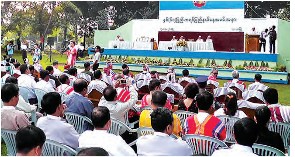
ကိုလည်းကောင်း၊ စတုတ္ထအကြိမ် မြောက် အမျိုးသားအားကစားပွဲတော် ထူးချွန်ဆုများကို လည်းကောင်း၊ စိုက်ပျိုးရေးနှင့်မွေးမြူရေး ထူးချွန် ဆုများကို လည်းကောင်း၊ နိုင်ငံတော် ထူးချွန်ဆုများကို လည်းကောင်း၊ (ဆို)က၊ရေး၊တီး)ပြိုင်ပွဲ ရွှေ ရတပ်ဖွဲ့ဝင်ထူးချွန်ဆုများကို လည်း တံဆိပ်ဆုများကို လည်းကောင်း၊ ကောင်း ချီးမြှင့်ခဲ့သည်။