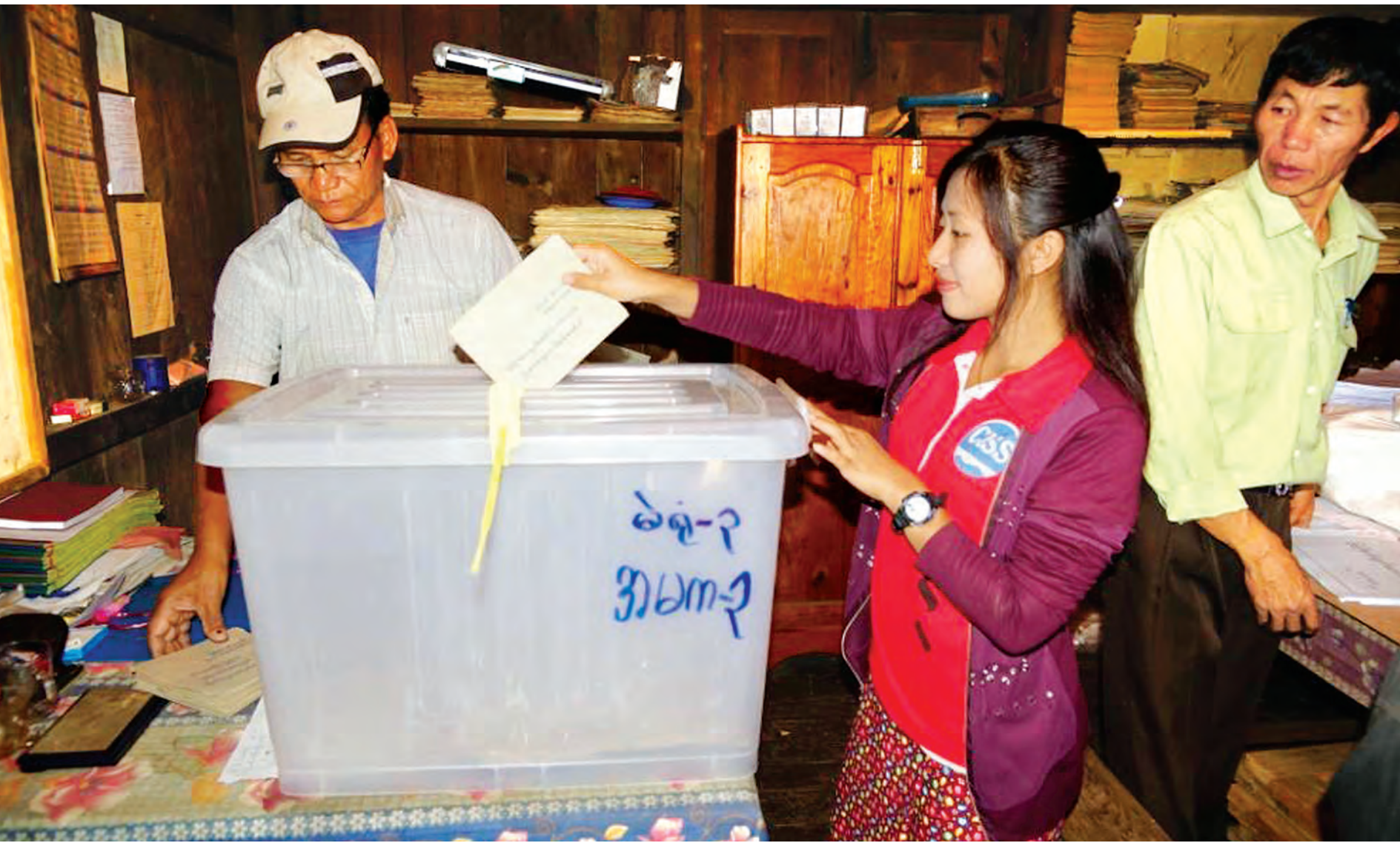
ချင်းပြည်နယ် ဖလမ်းမြို့ပေါ် (၄)ရပ်ကွက်တွင် ခရီးထွက်ခွာရန်ရှိသည့် ဝန်ထမ်းများ၊ တာဝန်ထမ်းဆောင်ရမည့်ဝန်ထမ်းများနှင့် မဲဆန္ဒရှင်ပြည်သူများ နိုဝင်ဘာ ၅ရက်က ကြိုတင်မဲပေးနေမှုကို တွေ့ရစဉ်။

(နိုင်ငံတော်သမ္မတ ဦးသိန်းစိန် နိုဝင်ဘာလ ၅ ရက်နေ့က မကွေးတိုင်းဒေသကြီး ခရီးစဉ်တွင် ပြည်သူများနှင့် တွေ့ဆုံမှာကြားမှုမှ ကောက်နုတ်ချက်)