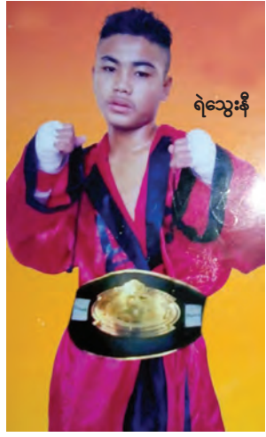
ရဲသွေးနီ

အဆိုပါ နှစ်(၆၀) ပြည့် ကရင် ပြည်နယ်နေ့တွင် ကရင်ယဉ်ကျေး မှုရိုးရာ ဒုံးယိုမ်းအသင်း ၂၀ ကျော် ဝင်ရောက် ယှဉ်ပြိုင်မည် ဖြစ်ပြီး အခြားအငြိမ့် ပွဲများ၊ စတိတ်ရိုးပွဲများ နှင့် ဖိုးချစ်ဇာတ်သဘင် ပွဲများလည်း ပါဝင်ကပြ