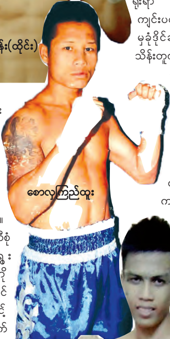
စောလှကြည်ထူး