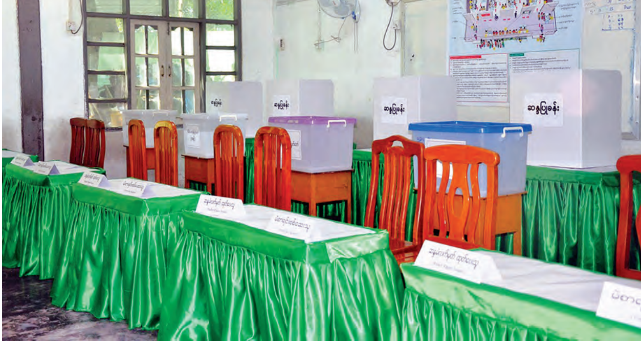
ဗဟန်းမြို့နယ် ရွေးကော်မကြား (၂)ရပ်ကွက် အ-မ-က (၃)၌ ဆန္ဒမဲပေးနိုင်ရန် မဲရုံပြင်ဆင်ထားမှုကို တွေ့ရစဉ်။

ရွေးကောက်ပွဲ ကျင်းပမယ့်နေ့မှာ သတင်းမီဒီယာတွေကိုတော့ မဲရုံပရဝဏ်အတွင်းမှာတော့ ဓာတ်ပုံရိုက်ခွင့်၊ ဝင်ရောက်ခွင့်ပြုပေးမယ့် မဲရုံအတွင်းမှာတော့ ဓာတ်ပုံ ရိုက်ကူးခွင့်မရှိပါဘူး။ နိုင်ငံတကာ လေ့လာသူတွေကို မဲရေတွက်ရာမှာ ပါတီအသီးသီးက မဲရုံကိုယ်စားလှယ်တွေနည်းတူ လေ့လာခွင့်ပြုထားပါတယ်။