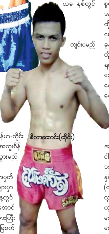
စီလာထောင်း(ထိုင်း)

အမှတ် ပွဲတော်ကြီး မြို့ အမှတ် (၄) သီရိကွင်းပြင် စည်ကား သိုက် ခဲ့ပြီး ယခုနှစ်တွင် ကွင်းကြီး၌ ပင်ကြောင်း သိရသည်။ မြန်မာနိုင်ငံ၏ ပါတီစုံ အထွေထွေ ရွေးကောက်ပွဲ ကြီးကို နိုဝင်ဘာ ၈ ရက်တွင် ဖြစ်ခြင်းကြောင့် ပွဲတော်ရက်နှင့် တိုက်နေ၍ နိုဝင်ဘာ ၁၀ ရက်မှ ၁၅ ရက်သို့ နောက်ဆက်ကာ ကျင်းပမည် ဖြစ်သည်။ ပြည်နယ် နေ့ တွင် နှစ်စဉ်နှစ်တိုင်း မြန်မာ့ရိုးရာ အောင်လံလှပွဲ၊ လက်ဝှေ့ပြိုင်ပွဲများကို ထည့်သွင်းကျင်းပခဲ့သော်လည်းယခုနှစ်တွင် မြန်မာ-ထိုင်း ရိုးရာ လက်ဝှေ့တွဲ ဆိုင်းရှစ်ဆိုင်းနှင့်အထူးစိန်ခေါ်ပွဲများကို ထည့်သွင်းကျင်းပသွားမည် ဖြစ်ကြောင်း သိရသည်။