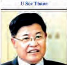
U Soe Thane 5 November 2015 1:23pm ET FIVE years ago, no one could have dreamed of what is happening today in Myanmar. Tens of thousands of people are attending rallies around the country, political

process and ignoring the magnitude of change unfolding before us. This is by no means intended to minimize the logistical issues and other problems bedeviling the daunting task of staging nationwide polls. But just as it was fashionable to characterise bold, new reforms in Myanmar three or four years ago as a "miracle" to be embraced, it is now equally fashionable to criticise, assuming cynical motives behind key policies and initiatives. People in Myanmar want reconciliation among opposing groups in society, and above all they want a good future for their children. In as to the wider world. We have laid the foundations for future economic growth, provided macroeconomic stability, overhauled the old and dysfunctional exchange rate system, nearly doubled tax revenues mainly through better enforcement, and liberalized trade. We have managed two very important international tenders, on telecoms and oil and gas exploration, which together have brought in several billion dollars in investment. Also, we have taken significant steps towards coming back to the international economic community. We are now working to