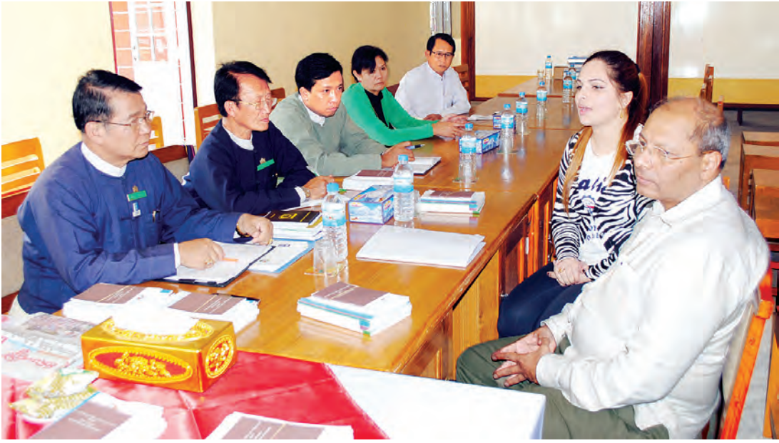
တောင်ကြီး နိုဝင်ဘာ ၆

တောင်ကြီးမြို့ ကမ္ဘောဇရိပ်သာ၌ နိုဝင်ဘာ ၆ ရက် မွန်းလွဲ ၂ နာရီက အိန္ဒိယသံအမတ်ကြီး ကော်ဒ်မိုဒိုပီဒါယသည် ရှမ်းပြည်နယ်ရွေးကောက်ပွဲကော်မရှင်ဥက္ကဋ္ဌနှင့် အဖွဲ့ဝင်များကို လာရောက်တွေ့ဆုံကြောင်း သိရသည်။ အဆိုပါတွေ့ဆုံပွဲတွင် အိန္ဒိယသံအမတ်ကြီးက နိုဝင်ဘာ ၈ ရက် တွင်ကျင်းပမည့် ပါတီစုံဒီမိုကရေစီ အထွေထွေရွေးကောက်ပွဲ