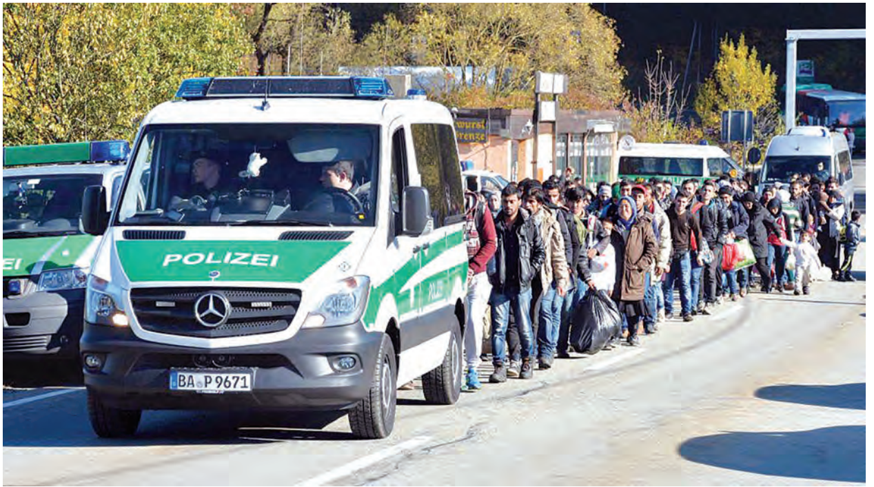
နိုင်ငံတို့မှဖြစ်ပြီး ယခုနှစ် ပထမ ၁၀ လပိုင်းအထိ ဂျာမနီသို့ရောက်ရှိလာသော ဒုက္ခသည်အရေအတွက်မှာ ၇၅၀၀၀ ရှိကြောင်း သိရသည်။ (အင်န်အိတ်ချ်ကေ)

ဂျာမနီနိုင်ငံသို့ ဒုက္ခသည်လျှောက်လွှာလျှောက်ထားသော သုံးပုံတစ်ပုံမှာ စီးပွားရေးနိမ့်ကျသောနိုင်ငံများ ၂၀ မှာ အယ်လ်ဘေးနီးယားနှင့် ကိုဆိုပို