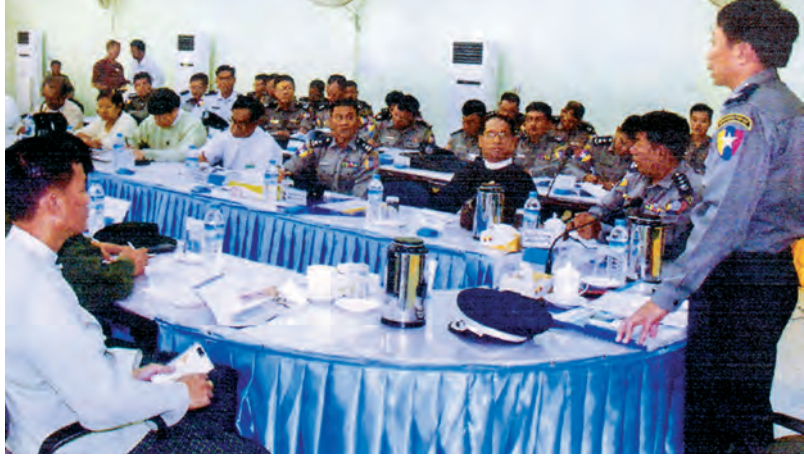
ရွေးကောက်ပွဲကာလ လုံခြုံရေးဆောင်ရွက်မှုအတွက် အောက်တိုဘာလနောက်ဆုံးပတ်က မွန်ပြည်နယ်ရဲတပ်ဖွဲ့မှူးရုံး ရာမညာဇနည်အစည်းအဝေးခန်းမ၌ ကျင်းပရာ မြို့နယ်ရဲတပ်ဖွဲ့ဌာနချုပ်မှ ရဲလေ့ကျင့်ရေးအရာရှိချုပ် ရဲမှူးချုပ် ဇော်စိုးသန်း၊ မွန်ပြည်နယ်ရဲတပ်ဖွဲ့ ဒုတိယ ပြည်နယ်ရဲတပ်ဖွဲ့မှူး ရဲမှူးကြီးသောင်းဝင်း၊ မွန်ပြည်နယ်ရွေးကောက်ပွဲကော်မရှင်ဥက္ကဋ္ဌ ဦးသိန်းထွန်းအေးနှင့် တာဝန်ရှိ သူများ တက်ရောက်ဆွေးနွေးကြစဉ်။