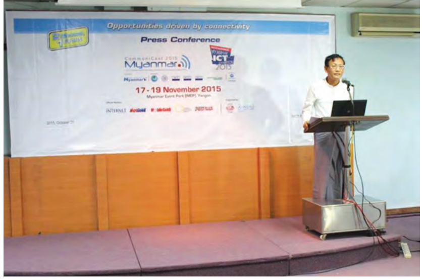
နိုဝင်ဘာ ၁၇ ရက်မှ ၁၉ ရက်အထိ ကျင်းပသွား မည်ဖြစ်ကြောင်း သိရသည်။ International Myanmar ICT Exhibition 2015 ပြပွဲတွင် ပြည်တွင်းပြည်ပ နည်းပညာကုမ္ပဏီ