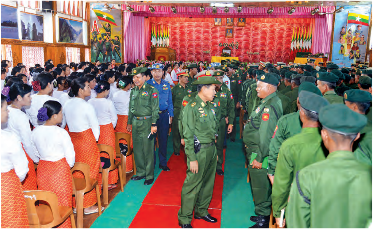
ရအောင် ထာဝရထိန်းသိမ်းကာကွယ် စောင့်ရှောက်သွားရမည်ဖြစ်ကြောင်း ပြောကြားသည်။

ယင်းသို့ တွေ့ဆုံရာတွင် ဒုတိယဗိုလ်ချုပ်မှူးကြီး စိုးဝင်းက မိမိတို့နိုင်ငံသည် အဓိကတိုင်းရင်းသားလူမျိုးများဖြစ်သည့် ကချင်၊ ကယား၊ ကရင်၊ ချင်း၊ ဗမာ၊ မွန်၊ ရခိုင်၊ ရှမ်း အပါအဝင် တိုင်းရင်းသားလူမျိုးပေါင်း ၁၀၀ ကျော် စုပေါင်း၍ ပြည်ထောင်စုမြန်မာနိုင်ငံတစ်ဝန်းလုံး၌ ချစ်ကြည်ရင်းနှီးစွာ ရောနှောနေထိုင်ကြလျက်ရှိရာ မိမိတို့တပ်မတော်သည်လည်း ယင်းတိုင်းရင်းသားလူမျိုးများဖြင့် ပါဝင်ဖွဲ့စည်းထားသည့် ပြည်ထောင်စုတပ်မတော်ဖြစ်ကြောင်း၊ သို့ဖြစ်၍ မိမိတို့တပ်မတော်သား အရာရှိ၊ စစ်သည်အားလုံးတို့သည် ပြည်ထောင်စုစိတ်ဓာတ် တစ်နည်းအားဖြင့် မြန်မာစိတ်ဖြင့် ပြည်ထောင်စုသမ္မတ မြန်မာနိုင်ငံတော်ကြီးအား ကမ္ဘာတည်သရွေ့ မိမိတို့ပိုင်နက်နယ်မြေ မပျက်မယွင်းဘဲ အစွန့်ရှည်တည်တံ့နိုင်အောင် အချုပ်အခြာအာဏာ လက်လွှတ်မဆုံးရှုံး