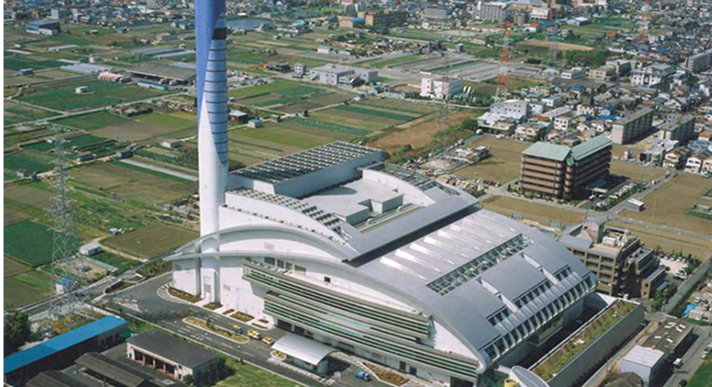
ဂျပန်နိုင်ငံ၌ အမှိုက်မှ စွမ်းအင်ထုတ်ယူသည့် စက်ရုံကိုတွေ့ရစဉ်။

တစ်နေ့က ကြေးမုံသတင်းစာမှာ စွန့်ပစ်အမှိုက်ကနေ လျှပ်စစ်ဓာတ်အား ထုတ်လုပ်မယ့် သတင်းတစ်ပုဒ်ဖတ်လိုက်ရပါတယ်။ သတင်းထဲမှာ ရန်ကုန်မြို့က နေ့စဉ်ထွက်ရှိနေတဲ့ အမှိုက်တန်ချိန် ၁၆၀ မှာ တန်ချိန် ၆၀ လောက်ကိုသုံးပြီး လျှပ်စစ်ဓာတ်အားမဂ္ဂါဝပ် ၇၀၀ ကို ထုတ်လုပ်မယ့်ဆိုတာသိရလို့ ဝမ်းမြောက်ကြိုဆိုရပါတယ်။