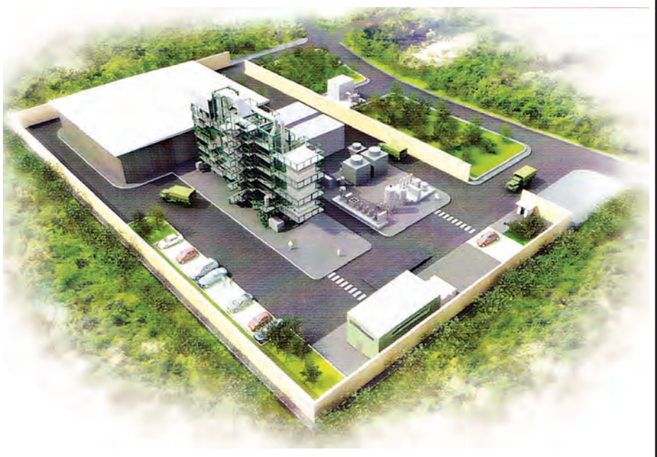
ရန်ကုန်တိုင်းဒေသကြီး ရွှေပြည်သာမြို့နယ်တွင် အကောင်အထည်ဖော်တည်ဆောက်လျက်ရှိသည့် စွန့်ပစ် အမှိုက်မှ စွမ်းအင်ထုတ်လုပ်မည့် စက်ရုံပုံစံငယ်ကိုတွေ့ရစဉ်။

လွန်ခဲ့တဲ့၁၅ နှစ်လောက်က သင်တန်းတစ်ခုမှာ သင်တန်းဖော်တစ်ယောက်ရဲ့ အမှိုက်နဲ့ပတ်သက်တဲ့