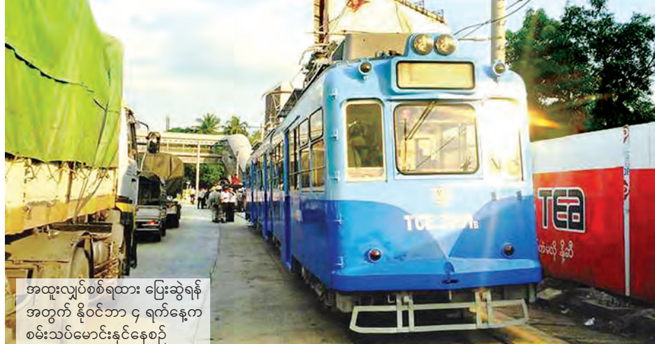
အထူးလျှပ်စစ်ရထား ပြေးဆွဲရန် အတွက် နိုဝင်ဘာ ၄ ရက်နေ့က စမ်းသပ်မောင်းနှင်နေစဉ်

စတင်ပြေးဆွဲပေးမည့် လျှပ်စစ် ရထားသည် Rail Bus Engine (RBE) ပုံစံမျိုးဖြစ်ပြီး အဲကွန်းစနစ်နှင့် ဆိုဖာထိုင်ခုံများ တပ်ဆင်ပေးထား သည်။ ယခုထုတ်သို့ ကားလမ်းမပေါ်တွင် လျှပ်စစ်ရထား ပြေးဆွဲပေးခြင်းသည်