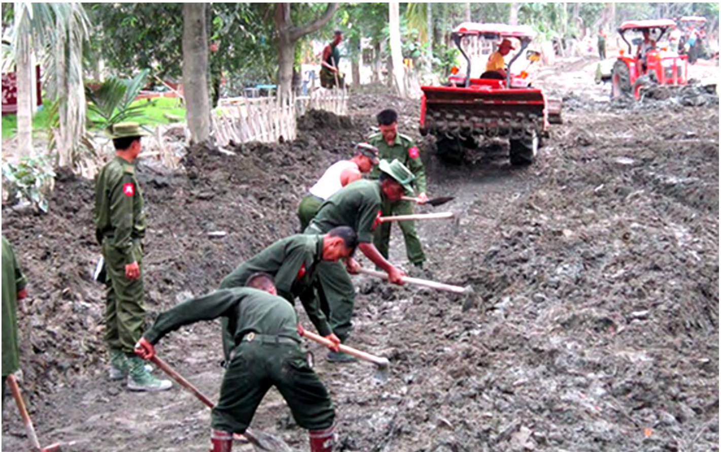
ရေဘေးသင့်ဒေသများ ရေပြန်ကျချိန်တွင် လမ်းမပေါ်တွင်တင်ရှိနေသည့် နန်းများအား တပ်မတော်သားများ ဖယ်ရှားရှင်းလင်းပေးခဲ့စဉ်။ (မြဝတီ)

ကာကွယ်ရေးဝန်ကြီးဌာနသည် ဖွဲ့စည်းပုံအခြေခံ ဥပဒေပုဒ်မ (၂၀)(င)တွင် ပါရှိသည့် “ပြည်ထောင်စု မပြိုကွဲရေး၊ တိုင်းရင်းသားစည်းလုံးညီညွတ်မှု မပြိုကွဲ ရေးနှင့် အချုပ်အခြာအာဏာတည်တံ့ခိုင်မြဲရေးတို့ကို ကာကွယ်စောင့်ရှောက်ရန် တပ်မတော်တွင် အဓိက တာဝန်ရှိသည်။”ဟူ၍ လည်းကောင်း၊ “ပုဒ်မ (၂၀)(စ) တွင် တပ်မတော်သည် နိုင်ငံတော်၏ဖွဲ့စည်းပုံအခြေခံ ဥပဒေကိုကာကွယ်စောင့်ရှောက်ရန် အဓိကတာဝန်ရှိ သည်။”ဟူ၍လည်းကောင်း ဖော်ပြပါရှိရာ တပ်မတော် သည် ဖွဲ့စည်းပုံအခြေခံဥပဒေက အုပ်စိုးထားသော ပြဋ္ဌာန်းချက်များအတိုင်း တိကျစွာလိုက်နာ ဆောင်ရွက် လျက်ရှိပြီး ပြည်ထောင်စုအစိုးရအဖွဲ့ရုံး၏ ဦးဆောင်မှု အောက်တွင် နိုင်ငံတော်၏ ပြုပြင်ပြောင်းလဲရေး လုပ်ငန်းများ၌လည်း ပါဝင်ဆောင်ရွက်လျက်ရှိပါ ကြောင်း ရေးသားတင်ပြလိုက်ရပါသည်။