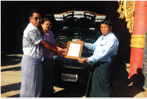
မန္တလေး အောင်မြေသာစံမြို့နယ်ရှိ မြင့်မြတ်ရတနာ လူမှုကူညီရေးအသင်းတွင်အသုံးပြုရန် နိဗ္ဗာန်ယာဉ်တစ်စီးကို မြင့်မြတ်ရတနာ လူမှုကူညီရေးအသင်းသား အသင်းသူများနှင့် ဦးထွန်းဇော်မိသားစု(တော်ဝင်နန်းအထည်ဆိုင်)တို့က စုပေါင်း၍ နိုဝင်ဘာ ၅ ရက်က ပေးအပ်လှူဒါန်းစဉ်။ ကျော်ထူး(မန္တလေး)