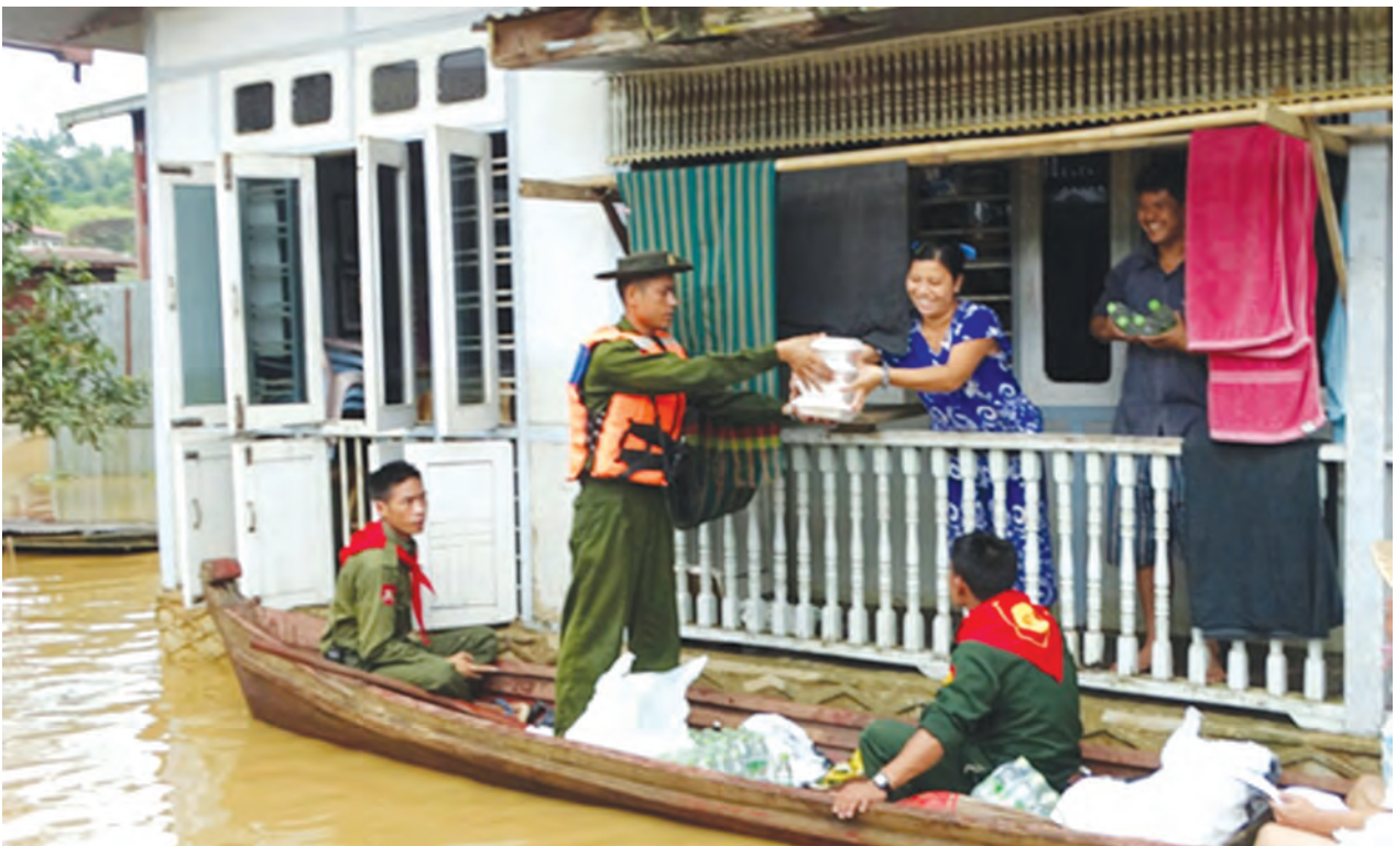
ရေဘေးသင့်ပြည်သူများအား တပ်မတော်မှ ထောက်ပံ့ပစ္စည်းများ လိုက်လံမျှဝေနေပုံ။

ငွေသားနှင့်ပစ္စည်းတန်ဖိုး ၇၁၁ သန်းကျော် ၂၀၁၅ ခုနှစ် ဇူလိုင်လနှင့်ဩဂုတ်လများအတွင်း ဖြစ်ပေါ်ခဲ့သော ရေဘေးအန္တရာယ်ကျရောက်မှုများတွင် တိုင်းဒေသကြီး/ပြည်နယ် ၁၁ ခုရှိ ရေကြီး/ရေလျှံမှု ဖြစ်ပွားခဲ့သော ဒေသများသို့ တပ်မတော်တပ်ရင်း၊ တပ်ဖွဲ့မှ အရာရှိ၊ စစ်သည်များသည် ချက်ချင်းသွားရောက်၍ လူ၊ တိရစ္ဆာန်နှင့်ပစ္စည်းများ ရွှေ့ပြောင်းပေးခြင်း၊ ကျန်းမာရေး စောင့်ရှောက်မှုများ ဆောင်ရွက်ပေးခြင်း၊ ထောက်ပံ့ရေးပစ္စည်းများပေးအပ်ခြင်း၊ သဲအိတ်၊ မြေအိတ် များစီချ၍ တာတမံများပြုလုပ်ပေးခြင်း၊ လှိုင်းကာများ ပြုလုပ်ပေးခြင်း၊ ရေလမ်းကြောင်းညွှန်ပြခြင်း၊ ရေကျသွားသောနေရာများတွင် နန်းများဖယ်ရှားခြင်း၊ လေယာဉ်ပြေးလမ်း၊ ကားလမ်းများကို ရွှံ့နှင့်နန်းမြေများ ဆေးကြောပေးခြင်း၊ ဆေးရုံ/ဆေးခန်းနှင့် စာသင်ကျောင်းများကို သန့်ရှင်းရေးပြုလုပ်ပေးခြင်းနှင့် ချွံနွယ်များ ရှင်းလင်းပေးခြင်းတို့ကို ဆောင်ရွက်ပေးခဲ့သည်။ စာမျက်နှာ (ခ) သို့