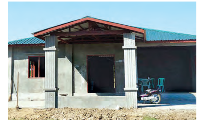
အရေးပေါ်ရှေးဦးပြုစုခြင်းစခန်းအဆောက်အအုံ ၈၀ ရာခိုင်နှုန်းကျော်ပြီးစီး