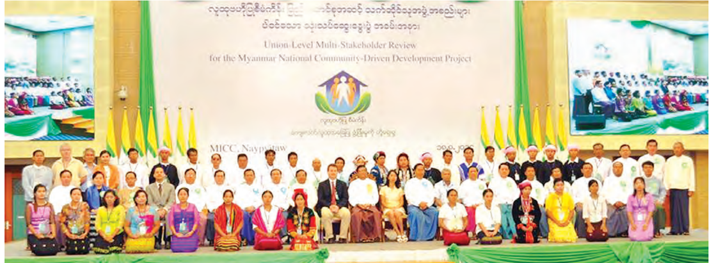
၂၀၁၄ ခုနှစ် ဩဂုတ် ၁၈ ရက်တွင် ကျင်းပခဲ့သည့် လူထုပဟိုပြုစီမံကိန်းပြည်ထောင်စုအဆင့် သက်ဆိုင်သူအဖွဲ့အစည်းများပါဝင်သော သုံးသပ်ဆွေးနွေးပွဲအခမ်းအနားကို တွေ့ရစဉ်။

ကျေးရွာအဆင့် စီမံကိန်းတစ်နှစ် ပြီးဆုံးပြီဆိုတာနဲ့ ကော်မတီဝင်တွေရဲ့ လုပ်ဆောင်နိုင်စွမ်းနဲ့ စီမံကိန်းရဲ့ ရလဒ်ကို ပြန်လည်စစ်ဆေးနိုင်ဖို့ ကျေးရွာလူထုစစ်ဆေးပွဲ တွေ ကျင်းပတာမို့ စီမံကိန်းအရည်အသွေးအပေါ် လူထု ကိုယ်တိုင် ပြန်လည်သုံးသပ်ခွင့်ရပါတယ်။ ဒီလိုကျေးရွာ အဆင့်၊ ကျေးရွာအုပ်စုအဆင့်အလိုက် သုံးသပ် ဆွေးနွေး ပြီး ရလာတဲ့ရလဒ်တွေကို မြို့နယ်အဆင့်၊ ပြည်ထောင်စု အလိုက် သုံးသပ်ဆွေးနွေးပွဲတွေပြုလုပ်ပြီး တက်ရောက် လာသူအားလုံးက အကြံပြုဆွေးနွေးကြပါတယ်။ ဒီလို