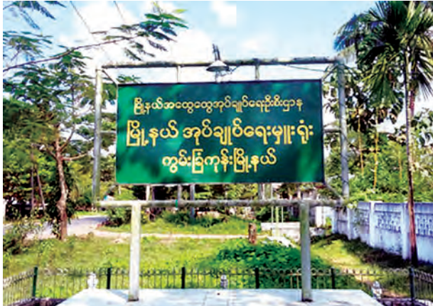
လိုက်နာဆောင်ရွက်ဖို့ စေ့စပ်ညှိနှိုင်း ပြီးစီးအောင်မြင်အောင် ဆောင်ရွက် ရေးကော်မတီနဲ့ ပူးပေါင်းပြီး ငါးကြိမ် ထိုင်တိုင် ဆွေးနွေးထားပါတယ်။ အထွေထွေအုပ်ချုပ်ရေး ဦးစီးဌာန အားလုံးအဆင်ပြေနေ အေးချမ်းစွာ ဦးညီညီက

ပြည်တွင်း ၈၁ မဲပေးပြီးပါပြီ။နိုဝင်ဘာ ၅ ရက်အထိ ရရှိထားတာပါ။ မဲတံဆိပ်တို့ကို ရှင်းလင်းပြတ်သားမှုဖြစ်အောင် လေဆာတုံးနဲ့ ဆောင်ရွက်ပေးထားပြီးတော့ အလွန်ဖိနှိပ်ဖို့ မလိုသလို ဖွဖလေးနှိပ်မယ်ဆိုရင်လည်း အရောင်မှိန်နိုင်တာဆိုတာကို သိစေချင်ပါတယ်။ ရပ်ကွက်/ကျေးရွာ ကြိုတင်မဲ ၁၄၀ ကိုတော့ နိုဝင်ဘာ ၄ ရက်ထဲက ရထားပြီးပါပြီ။ မဲပေးတဲ့ ပြည်သူတွေ လွတ်လွတ်လပ်လပ်နဲ့ အေးချမ်းစွာမဲပေးနိုင်အောင် မဲရုံပေါင်း ၁၇၈ ရုံကို စီမံထားရှိပြီးတော့ ပါတီခြောက်ပါတီ ဝင်ရောက်ယှဉ်ပြိုင်မှာပါ။ စောင့်ကြည့်လေ့လာရေးအဖွဲ့အပါအဝင် မဲရုံမှူးတွေကအစ သတ်မှတ်ချက်အတိုင်း လေးစား