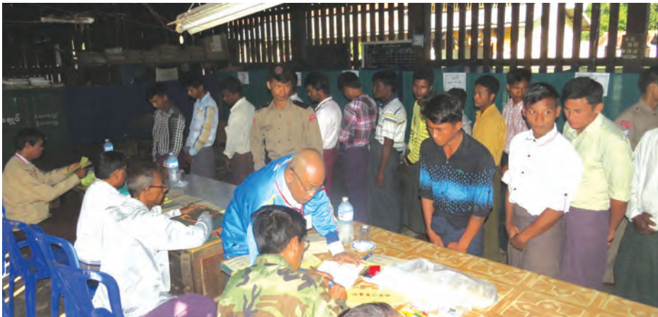
ရပ်/ကျေး ရွေးကောက်ပွဲကော်မရှင်အဖွဲ့ခွဲများက စာရင်းတွင် စနစ်တကျပေးနိုင်ရန်နှင့် မိမိတို့ဆန္ဒပြုလိုက်သည့် ကြိုတင်မဲများကို ပယ်မဲများဖြစ်မသွားစေရန် သတိပြုရ

အချုပ်သားများ ကြိုတင်ဆန္ဒမဲပေးနိုင်ရန်အတွက် အကျဉ်းဦးစီးဌာနနှင့် အမှတ်(၁)ရဲစခန်းတို့မှ တာဝန်ရှိသူများနှင့် မြို့နယ်ရွေးကောက်ပွဲကော်မရှင်အဖွဲ့ခွဲ အဖွဲ့ဝင်များ၊