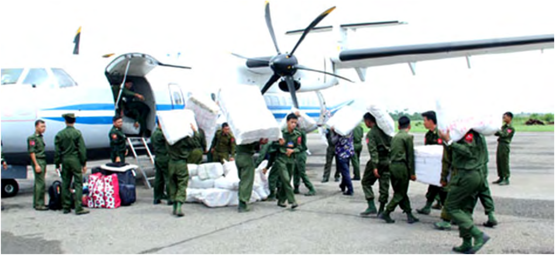
ရေဘေးသင့်ဒေသများသို့ တပ်မတော်မှ ထောက်ပံ့ပစ္စည်းများအား လေယာဉ်ဖြင့် သယ်ယူပို့ဆောင်ပေးခဲ့စဉ်။