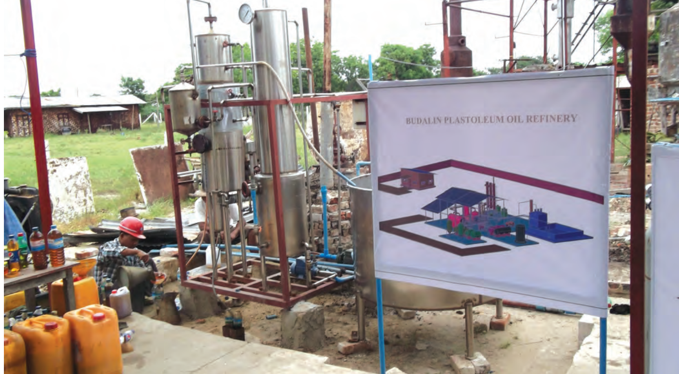
စွန့်ပစ်ပလတ်စတစ်အမှိုက်မှ လောင်စာဆီပြန်လည်ထုတ်ယူနေစဉ်။

တန်ဖိုးနည်း၊ တန်ဖိုးသင့်စတဲ့ စကားလုံးတွေ ခေတ်စားတဲ့ ဒီနေ့အချိန်ကာလမှာ တစ်ဦးချင်း၊ တစ်ယောက်ချင်းစီက တန်ဖိုးမြင့်စိတ်ဓာတ်အဖြစ် ပြောင်းလဲရင်းအရွေးများဆီကို ဆက်ချီကြဖို့ အမှိုက်က ပေးတဲ့ စာကတစ်ဆင့် ရေးသားလိုက်ပါတယ်။