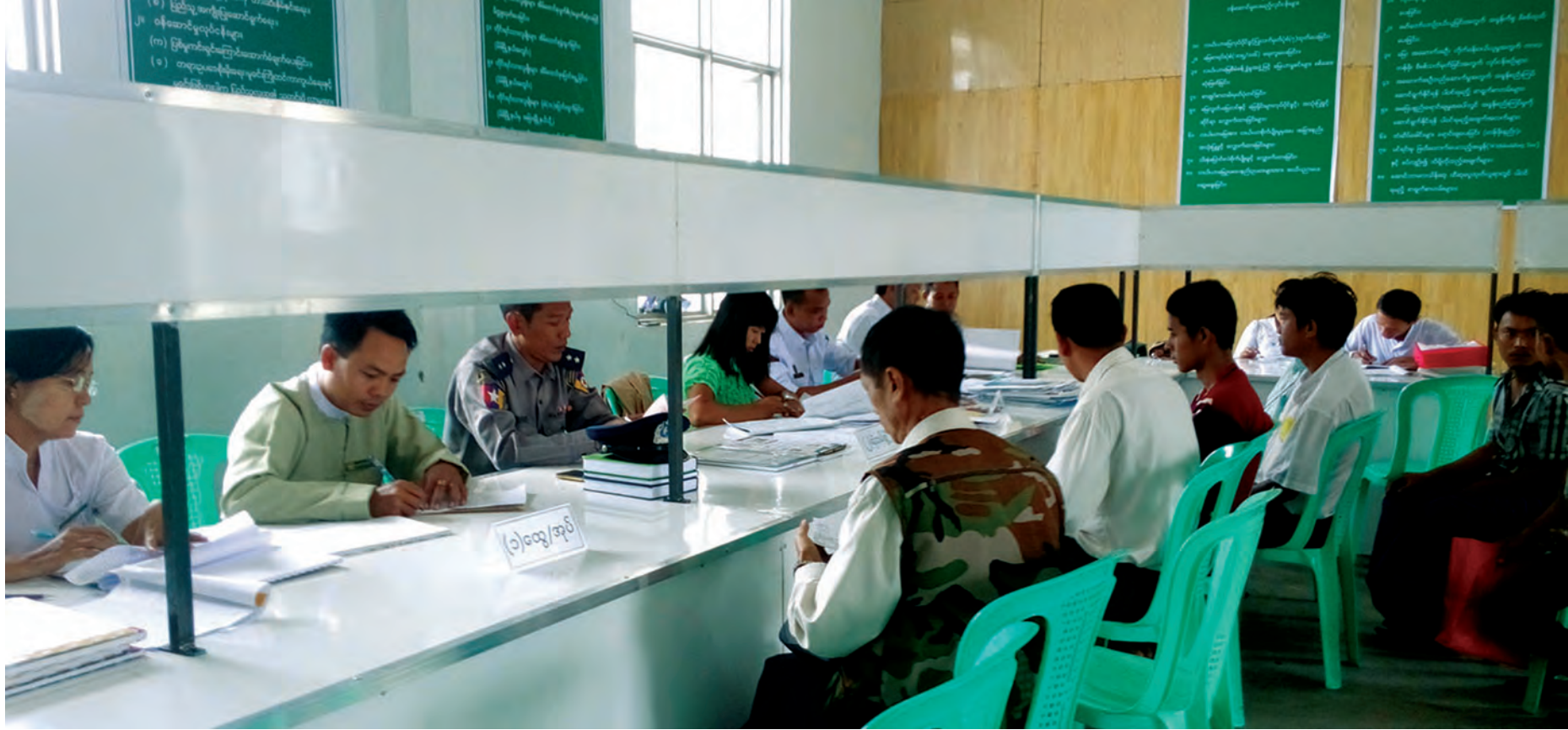
နေပြည်တော်ကောင်စီနယ်မြေ ဥက္ကဋ္ဌသီရိခရိုင် ပုဗ္ဗသီရိမြို့နယ် ပြည်သူ့ဝန်ဆောင်မှုရုံးကို တွေ့ရစဉ်။

ပြည်သူ့ဝန်ဆောင်မှုရုံးများသည် ပြည်သူများအတွက် အမှန်တကယ် လိုအပ်ပါကြောင်း၊ ယခုအချိန်အထိ OSS ရုံးများသို့ သွားရောက်ဆောင်ရွက်ရန်မသိသေးသည့် ပြည်သူများရှိနေသေးကြောင်း၊ ပြည်သူများအနေဖြင့် ဆက်ဆံရမည့် ရုံးတစ်ရုံး တိုးလာသည်ဟုမြင်လျှင် မကောင်းပါကြောင်း၊ ဝန်ဆောင်မှုပေးကြမည့် ဝန်ထမ်းများအနေဖြင့် ပြည်သူတို့၏ အခြေခံ လိုအပ်ချက်များကို စိတ်ရင်းစေတနာကောင်းများဖြင့် ဥပဒေနှင့်အညီ