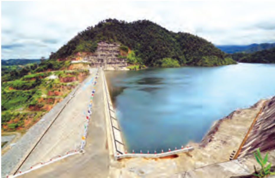
လျှပ်စစ်ဓာတ်အားထုတ်လုပ်ရာတွင် ရေအားလျှပ်စစ်မှအဓိကရယူလျက်ရှိရာ ပဲခူးတိုင်းဒေသကြီး ဖြူးမြို့နယ်ရှိ ဖြူးချောင်းရေလှောင်တံခံကို တွေ့ရစဉ်။

ဓာတ်အားပေးရေးကော်ပိုရေးရှင်းများကို ၂၀၁၅ ခုနှစ် ဧပြီလ ၁ ရက်နေ့မှစ၍ ဖွဲ့စည်းဆောင်ရွက်သွားနိုင်ခဲ့ပြီဖြစ်ပါသည်။