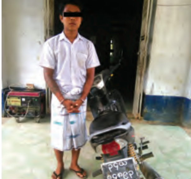
အကျဉ်းထောင်မှလွတ်လာသူ ခိုးမှုဖြင့် ထပ်မံအရေးယူခံရ