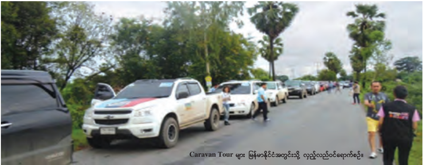
Caravan Tour များ မြန်မာနိုင်ငံအတွင်းသို့ လှည့်လည်ဝင်ရောက်စဉ်။

ကျွန်တော်တို့နိုင်ငံ ရင်ဆိုင်ခဲ့ရတဲ့ ရေကြီး ရေလျှံမှုဖြစ်ရပ်မှာ တစ်တိုင်းပြည်လုံးအတိုင်းအတာ နဲ့ နီးကြားစွာပါဝင်လာဖို့အတွက် လူငယ်တွေဟာ သူတို့တတ်နိုင်တဲ့အတိုင်းအတာအတွင်းကနေ စိတ်ကူးစိတ်သန်းအသစ်တွေနဲ့ မမောနိုင်မပန်းနိုင် ကြိုးပမ်းလှုံ့ဆော်ခဲ့ကြပါတယ်။ တစ်ဆက်တည်းမှာပဲ အရပ်ဘက် လူမှုအဖွဲ့အစည်းများ၊ တပ်မတော် တပ်ရင်းတပ်ဖွဲ့များ၊ ရဲတပ်ဖွဲ့၊ မီးသတ်တပ်ဖွဲ့၊ အစိုးရ အဖွဲ့အစည်းများဟာလည်း ကယ်ဆယ်ထောက်ပံ့ရေးမှာ အင်အားများကို အစွမ်းကုန်အသုံးပြုခဲ့ကြတာ ချီးကျူးဂုဏ်ပြုရမှာ ဖြစ်ပါတယ်။ (နိုင်ငံတော် သမ္မတ၏ ၂၀၁၅ ခုနှစ် စက်တင်ဘာလ ၁ ရက်နေ့တွင် ပြောကြားသည့် ရေဒီယိုမိန့်ခွန်းမှကောက်နုတ်ချက်)