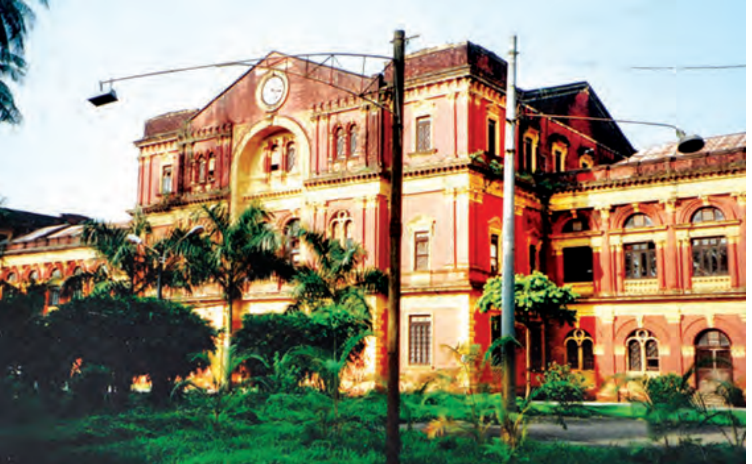
ရန်ကုန်မြို့ သိမ်ဖြူလမ်းရှိ ဝန်ကြီးများရုံး ရှေ့မျက်နှာစာကိုတွေ့ရစဉ်။

ဩဇာပြည့်လွန်နှစ်များကစ၍ သူတို့အဖွဲ့တွေ တစ်ဖွဲ့ပြီးတစ်ဖွဲ့ ရောက်လာကြသည်။ နိုင်ငံတော်အစိုးရအပေါ် ယုံကြည်အားကိုးစွာ ရောက်လာကြခြင်းပင်။ မှတ်မိနေပါသေးသည်။ ရုံးက လူကြီးတွေနှင့် သူတို့အဖွဲ့တွေ တွေ့ဆုံညှိနှိုင်းအစည်းအဝေးတစ်ခု ပြုလုပ်၍ပြီးလျှင် ပြီးချင်း ကျွန်တော်တို့ နတလရုံးအနေဖြင့် အစည်းအဝေးမှတ်တမ်းကို နေ့ချင်းပြီး ထုတ်နိုင်အောင် လုပ်ရသည်။ ပညာရေး၊ ကျန်းမာရေး လုပ်ငန်း၊ စိုက်ပျိုးရေးလုပ်ငန်း၊ လမ်းပန်းဆက်သွယ်ရေးလုပ်ငန်း၊ သာသနာရေးလုပ်ငန်း၊ စွမ်းအင်လုပ်ငန်း၊ ဆက်သွယ်ရေးလုပ်ငန်း၊ ပြည်သူ့ဆက်ဆံရေးလုပ်ငန်း၊ မွေးမြူရေးလုပ်ငန်း၊ အိမ်ရာဆောက်လုပ်ရေးလုပ်ငန်း၊ သယ်ယူပို့ဆောင်ရေးလုပ်ငန်း၊ သစ်တောလုပ်ငန်း၊ ကုန်သွယ်ရေးလုပ်ငန်း၊ သတ္တုတူးဖော် ထုတ်လုပ်ရေးလုပ်ငန်း၊ လူမှုဝန်ထမ်းနှင့် သမဝါယမလုပ်ငန်းများ အပါအဝင် လုပ်ငန်းဆောင်ရွက်မတ်(၁၈)ခုနှင့် သက်ဆိုင်သော နယ်စပ်ဖွံ့ဖြိုးရေး လုပ်ငန်းဆောင်တာအကြောင်းအရာများကို တင်ပြကြရာ တင်ပြချက်၊ လမ်းညွှန်ချက်များအပေါ် မူတည်၍ ရန်ပုံငွေများ လျာထားဆောင်ရွက်ပေးခြင်း၊ ကျောင်းကိစ္စဆိုလျှင် ပညာရေးလုပ်ငန်းဆောင်ရွက်မတ်သို့ ညှိနှိုင်းအကြောင်းကြားခြင်း၊ ထို့နည်းတူစွာ ဆေးရုံဆေးခန်းကိစ္စဆိုလျှင် ကျန်းမာရေး လုပ်ငန်းဆောင်ရွက်မတ်၊ လမ်းနှင့်တံတားကိစ္စဆိုလျှင် လမ်းတံတားလုပ်ငန်းဆောင်ရွက်မတ်၊ စွမ်းအင်လုပ်ငန်းဆိုလျှင် စွမ်းအင်လုပ်ငန်းဆောင်ရွက်မတ်တို့သို့ ညှိနှိုင်း