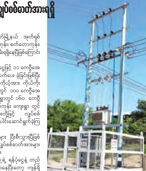
အဆိုပါ ကျေးရွာနေ ဒေသခံတစ်ဦးက ပြောပြသည်။ ကျော်သီဟ(ပြန်/ဆက်)

စစ်ကိုင်းတိုင်းဒေသကြီး အင်းတော်မြို့နယ် အုတ်ရွစ်ကုန်းကျေးရွာအုပ်စုအတွင်းရှိ အုတ်ရွစ်ကုန်း၊ စက်တောကုန်း၊ သစ်ပုံလွင် ကျေးရွာများအားလုံး လျှပ်စစ်ဓာတ်အားရရှိနေပြီဖြစ်ကြောင်း သိရသည်။ တိုင်းဒေသကြီးအစိုးရအဖွဲ့၏ ရန်ပုံငွေဖြင့် ၁၁ ကေဗီအေလင်း ၄ ဒဿမ ၄ မိုင်အား တည်ဆောက်ပေး ခဲ့ခြင်းဖြစ်ပြီး ကျေးရွာမီးလင်းရေး ကော်မတီများ၏ ကိုယ့်အား ကိုယ်ကိုး အစီအစဉ်ဖြင့် စက်တောကုန်း ကျေးရွာတွင် ၁၀၀ ကေဗီအေ ထရန်စဖော်မာတစ်လုံး၊ သစ်ပုံလွင်ကျေးရွာတွင် ၁၆၀ ကေဗီအေ ထရန်စဖော်မာတစ်လုံး၊ အုတ်ရွစ်ကုန်း ကျေးရွာ တွင် ၁၀၀ ကေဗီအေ ထရန်စဖော်မာတစ်လုံးတို့ဖြင့် လျှပ်စစ်ဓာတ်အားရရှိရေးလုပ်ငန်းများကို စုပေါင်းဆောင်ရွက်ခဲ့ကြသည်။