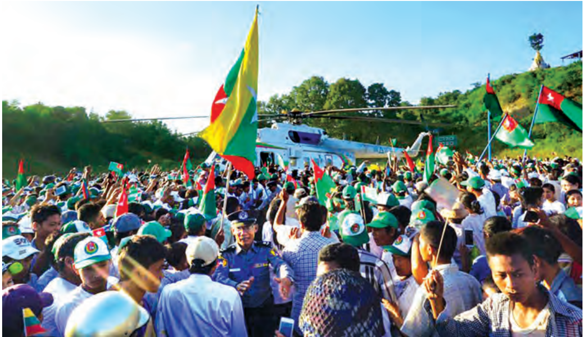
နိုင်ငံတော်သမ္မတ ဦးသိန်းစိန်၊ တပ်မတော်ကာကွယ်ရေးဦးစီးချုပ် ဗိုလ်ချုပ်မှူးကြီး မင်းအောင်လှိုင်နှင့်အဖွဲ့ဝင်များ ကံမမြို့သို့ရောက်ရှိရာ ဒေသခံပြည်သူများက ကြိုဆိုကြစဉ်။

ပါတီခုံဒီမိုကရေစီ အထွေထွေရွေးကောက်ပွဲကြီး ကျင်းပရန် (၂)ရက်သာလိုတော့သည်