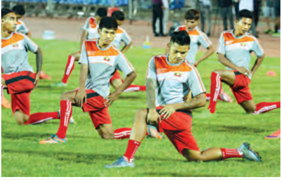
မြန်မာ့လက်ရွေးစင်အသင်း ရန်ကုန်မြို့၌ လေ့ကျင့်မှုများပြုလုပ်နေစဉ်။

ရမှတ် ကိုးမှတ်ဖြင့် ဇယားထိပ်တွင် ဦးဆောင်နေပြီး ၁၆ သင်းအဆင့်သို့ တက်ရောက်ရန် သေချာသွားပြီ ဖြစ်သည်။ အာဆင်နယ်မှာ သုံးမှတ် သာရရှိထားပြီး ၁၆ သင်းအဆင့်သို့ တက်ရောက်ရန် မှေးမှိန်ခဲ့သည်။ အခြားပွဲစဉ်အဖြစ် အုပ်စု (F) မှ အိုလံပီယာကွိုစ်နှင့် ဒိုင်နမိုဇာဂရက် ပွဲတွင် အိုလံပီယာကွိုစ်က နှစ်ဂိုး- တစ်ဂိုးဖြင့် အနိုင်ရခဲ့ပြီး ဂိုးကွာခြား ချက်ကြောင့် အဆင့် ၂ တွင် ရပ်တည် နေသည်။ ဒိုင်နမိုဇာဂရက်မှာ သုံးမှတ် သာ ရရှိထားသည်။