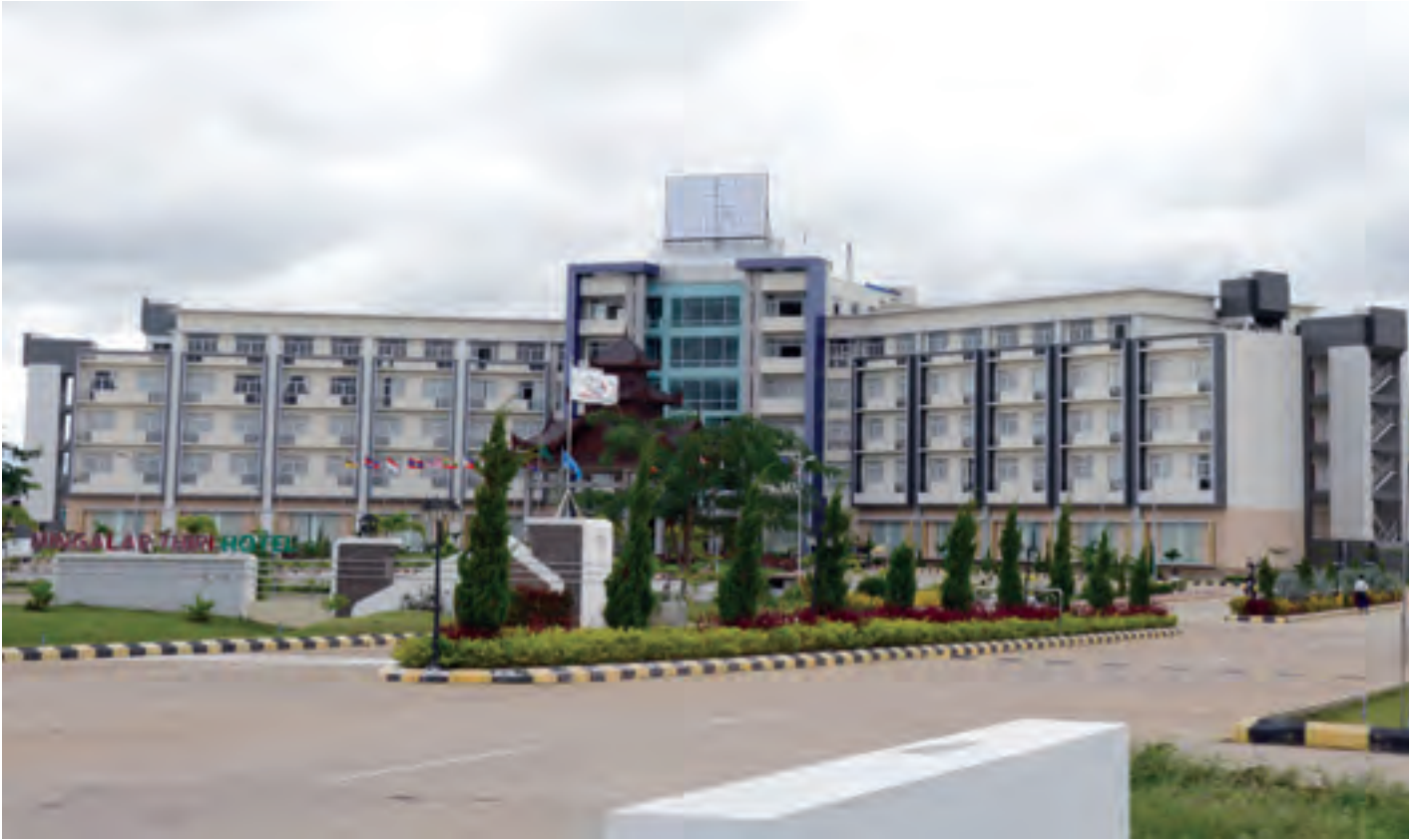
နေပြည်တော် ဟိုတယ်နန်ရီ မင်္ဂလာဒုံရိဟိုတယ်အားတွေ့ရစဉ်။

ယူမူမပြုခြင်းသည်လည်း တာဝန်သိခရီးသွားဧည့်သည်တစ်ဦး၏ အလေ့အထကောင်းများဖြစ်သည်။