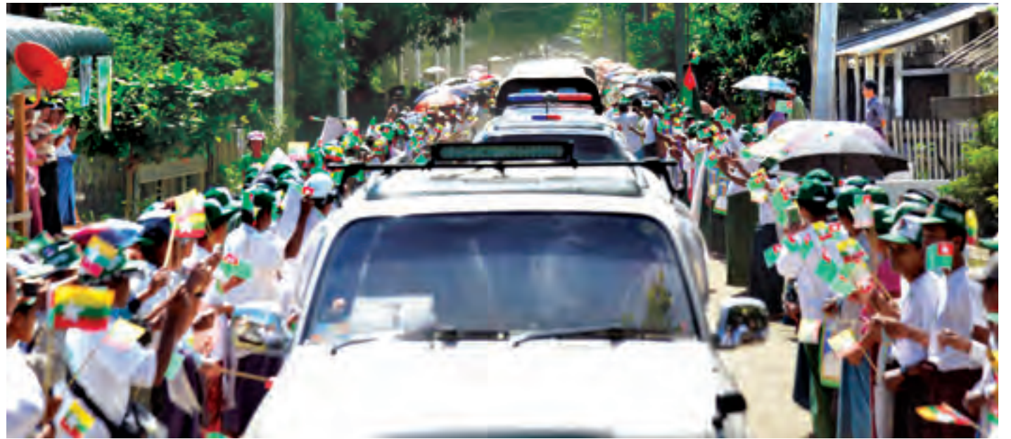
နိုင်ငံတော်သမ္မတ ဦးသိန်းစိန်နှင့်အဖွဲ့ယာဉ်တန်း စေတုတ္တရာမြို့သို့ရောက်ရှိရာ ဒေသခံပြည်သူများက သောင်းသောင်းဖြူဖြူဆိုကြစဉ်။

ယင်းနောက် နိုင်ငံတော်သမ္မတသည် စလင်းမြို့