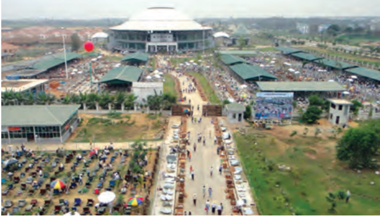
မြန်မာ့ကျောက်မျက်ရတနာအရောင်းပြပွဲ၌ လေလံတင်ရောင်းချရန် ခင်းကျင်းထားသော ကျောက်စိမ်းများအား ရတနာကုန်သည်များ ကြည့်ရှုစစ်ဆေးနေစဉ်။

လက်ရှိအစိုးရတာဝန်ယူပြီးချိန်မှစ၍ သဘာဝသယံဇာတများကို ရေရှည် သားစဉ်မြေးဆက်ခံစားနိုင်ရန် တွင်းထွက်သယံဇာတထုတ်လုပ်ရေးဆိုင်ရာ မူဝါဒများ ချမှတ်ဆောင်ရွက်ခဲ့သည်။