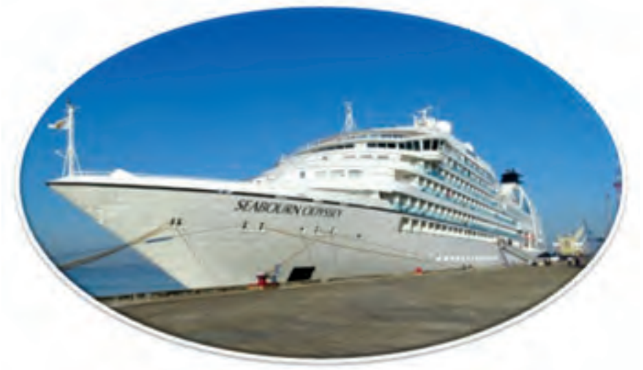
Cruise သင်္ဘောဖြင့် မြန်မာနိုင်ငံသို့ ဝင်ရောက်စဉ်။

ဖြစ်စေသော ဓာတ်ပုံရိုက်မှတ်တမ်းရယူခြင်းမျိုးမပြုလုပ်ပါနှင့်။ ဘာသာရေးနှင့် သက်ဆိုင်သော နေရာများသို့သွားမည်ဆိုလျှင် သင့်တင့်လျောက်ပတ်သော အဝတ်အစားများကို ဝတ်ဆင်ပါ စသည်ဖြင့် ဆောင်ရန်၊ ရှောင်ရန်များ အချက်အလက် ပေါင်း ၃၀ တို့ကို စိတ်ဝင်စားဖွယ် သရုပ်ဖော်ပုံများဖြင့် ပြုစုထားသော Dos and