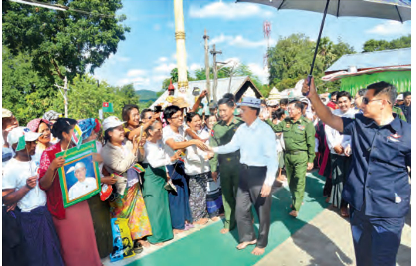
နိုင်ငံတော်သမ္မတ ဦးသိန်းစိန် ငမဲမြို့မှ ဒေသခံပြည်သူများအား ရင်းရင်းနှီးနှီးနှုတ်ဆက်စဉ်။ (သတင်းစဉ်)