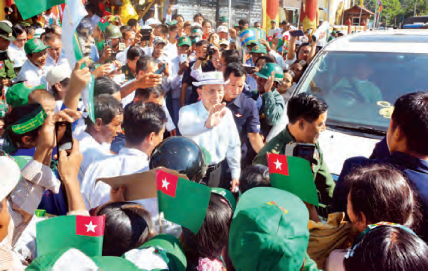
နိုင်ငံတော်သမ္မတ ဦးသိန်းစိန်အား စလင်းမြို့မှ ဒေသခံပြည်သူများက တစ်ခဲနက်ကြိုဆိုနှုတ်ဆက်ကြစဉ်။