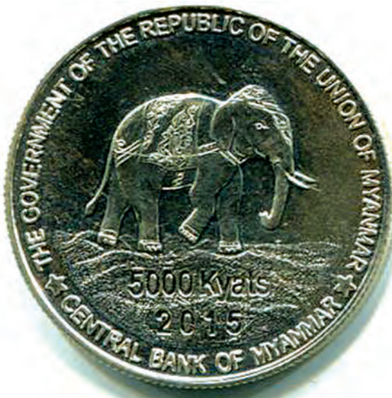
အထိမ်းအမှတ်ဒင်္ဂါး၏ကျောဘက်