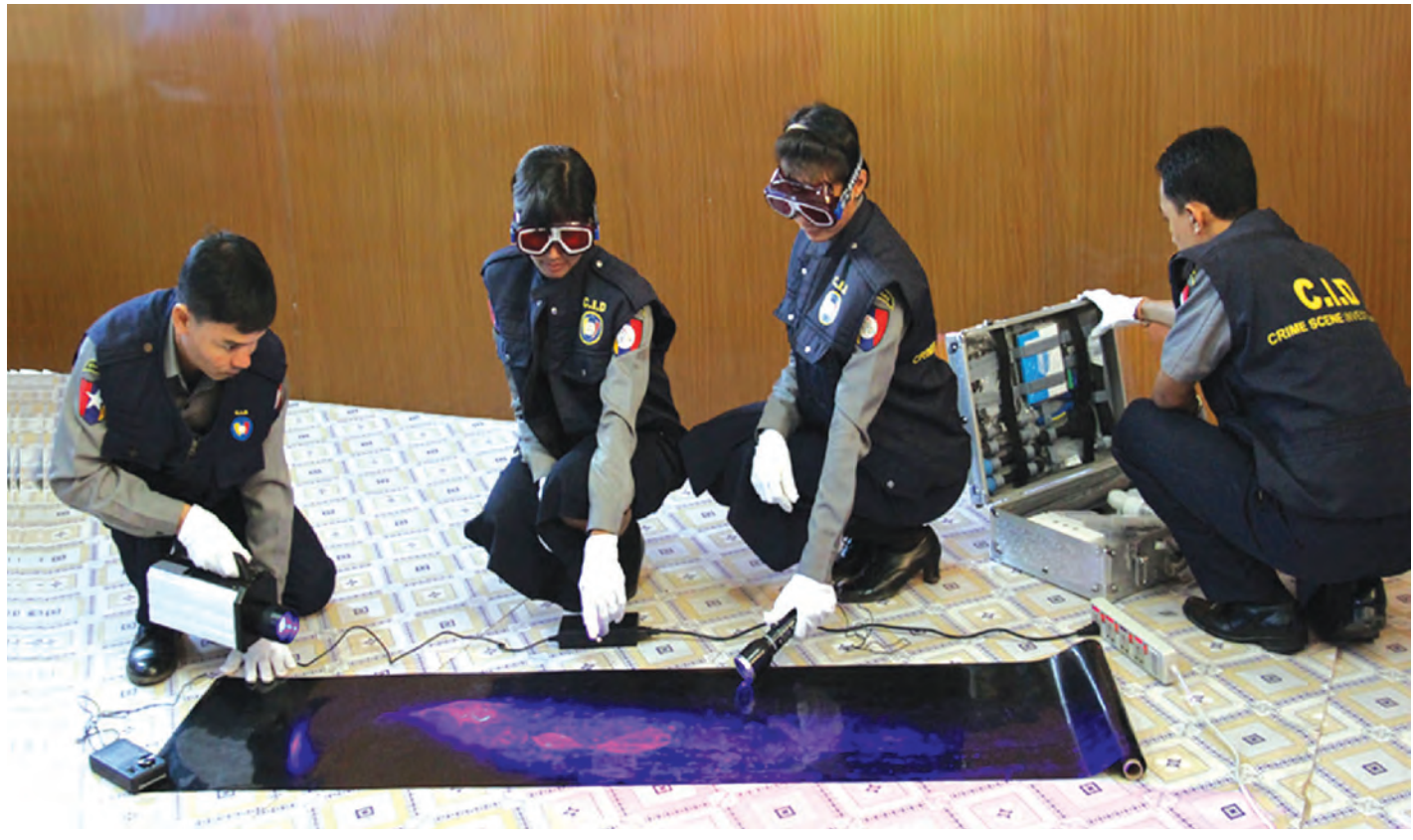
မှောင်ခိုရံတပ်ဖွဲ့မှ မှောင်ခိုထုတ်ဆောင်ရွက်နေမှုမှတ်တမ်း။

လွတ်လပ်ရေးရပြီးကတည်းက လက်နက်ကိုင် ပဋိပက္ခတွေ့ မြန်မာနိုင်ငံမှာ ပေါ်ပေါက်ခဲ့ပါတယ်။ ဒီပဋိပက္ခတွေ့ကြောင့် သောင်းနဲ့ချီတဲ့ နှစ်ဖက်စလုံး က တပ်သားတွေ အသက်ဆုံးရှုံးခဲ့ကြရပါတယ်။ လက်နက်ကိုင် ပဋိပက္ခဒေသတွေမှာ နေထိုင်ကြတဲ့ သိန်းနဲ့ချီသော ပြည်သူတွေဟာ စစ်ဘေးစစ်ဒဏ် ကို ခါးစည်းခံခဲ့ရပါတယ်။ အားလုံးဟာ ကိုယ့် တိုင်းရင်းသား ကိုယ့်ပြည်သူတွေပဲ ဖြစ်ကြပါတယ်။ (နိုင်ငံတော်သမ္မတ၏ ၂၀၁၅ ခုနှစ် အောက်တိုဘာ လ ၁၅ ရက်နေ့ MICC-2 ၌ ကျင်းပသည့် NCA လက်မှတ်ရေးထိုးပွဲ အခမ်းအနားတွင် ပြောကြားခဲ့ သည့် မိန့်ခွန်းမှ ကောက်နုတ်ချက်)