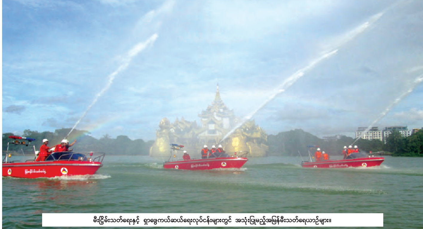
မီးငြိမ်းသတ်ရေးနှင့် ရှာဖွေကယ်ဆယ်ရေးလုပ်ငန်းများတွင် အသုံးပြုမည့်အမြန်မီးသတ်ရေယာဉ်များ။

ပြည်ထဲရေးဝန်ကြီးဌာနသည် အုပ်ချုပ်ရေးအာဏာ သက်ရောက်ခြင်းဖြင့် တရားဥပဒေစိုးမိုးမှုကိုရရှိစေပြီး နိုင်ငံတော်တည်ငြိမ်မှုနှင့်ဖွံ့ဖြိုးမှုတို့ကို ဖြစ်ထွန်းစေရေး ဆိုသည့် အမျိုးသားလုံခြုံရေး မူဝါဒတစ်ရပ်ကို ချမှတ် အကောင်အထည်ဖော် ဆောင်ရွက်လျက်ရှိပါကြောင်း ရေးသားတင်ပြလိုက်ရပါသည်။