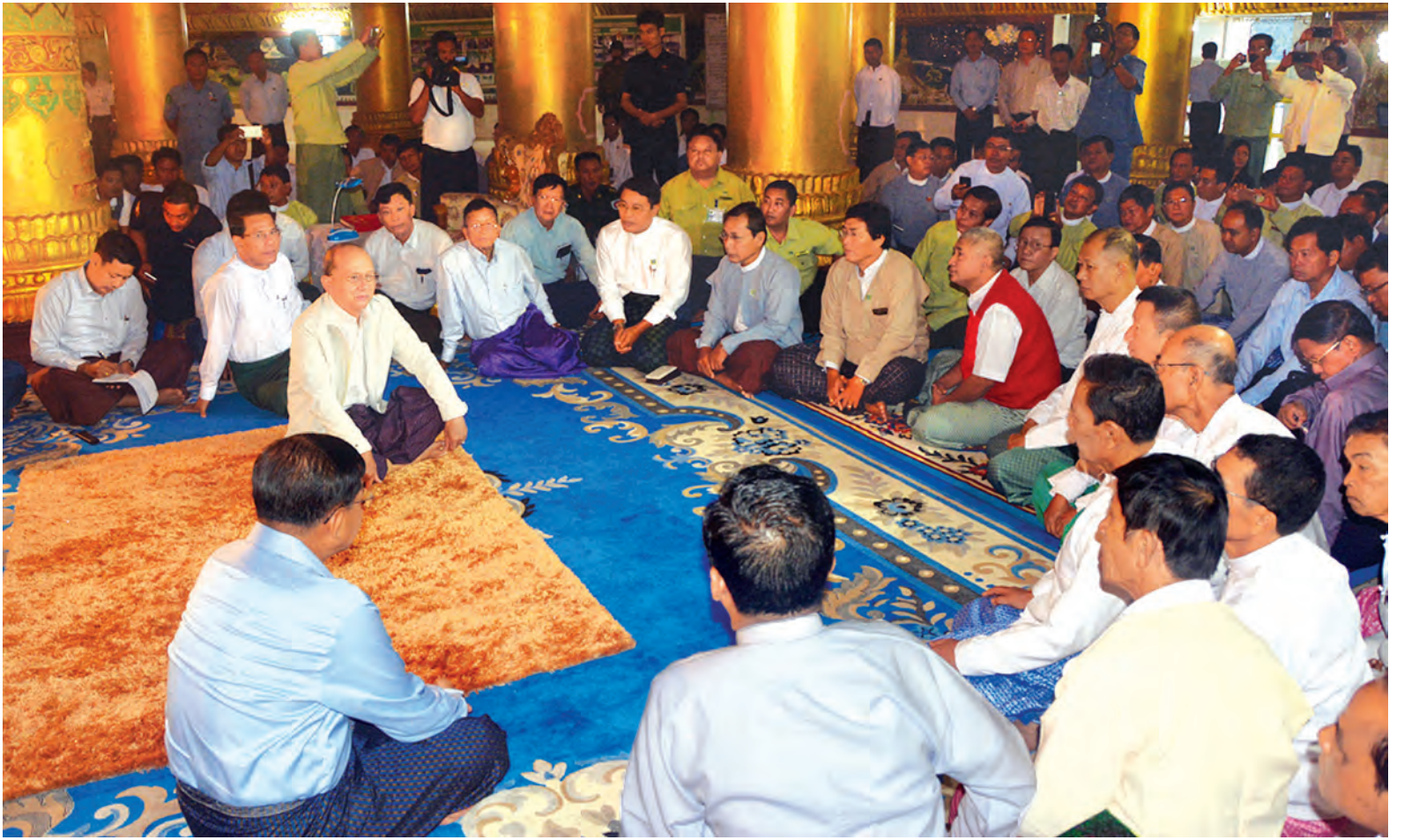
နိုင်ငံတော်သမ္မတ ဦးသိန်းစိန် လောကနန္ဒာစေတီတော်ဝင်းအတွင်း စစ်တွေမြို့မှ မြို့မိ မြို့ဖများနှင့် တာဝန်ရှိသူများအား တွေ့ဆုံမှာကြားစဉ်။

မိမိတို့တာဝန်ယူချိန်တွင် ရခိုင်ပြည်နယ်ဖွံ့ဖြိုးတိုးတက်ရေးအတွက်