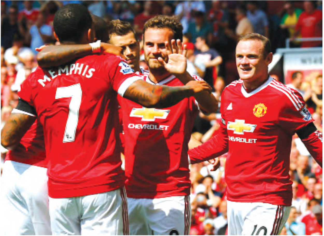
သရေပွဲတွေအဆုံးသတ်မယ့် မန်ယူကိုပဲ ယုံကြည်ပေးရမှာပါ

ဒီနစ်မှာခြေစွမ်းကောင်းတွေရနေတဲ့ ဝက်စ်ဟမ်းဟာ တိုက်စစ်အားကောင်းပေမယ့် ခံစစ်ပိုင်းအားနည်းချက်တွေရှိနေပါတယ်။ အထူးသဖြင့် အိမ်ကွင်းမှာ ရမှတ်အပြည့် မရဆောင်နိုင်တာကလည်း ဝက်စ်ဟမ်းအတွက် စိုးရိမ်စရာတစ်