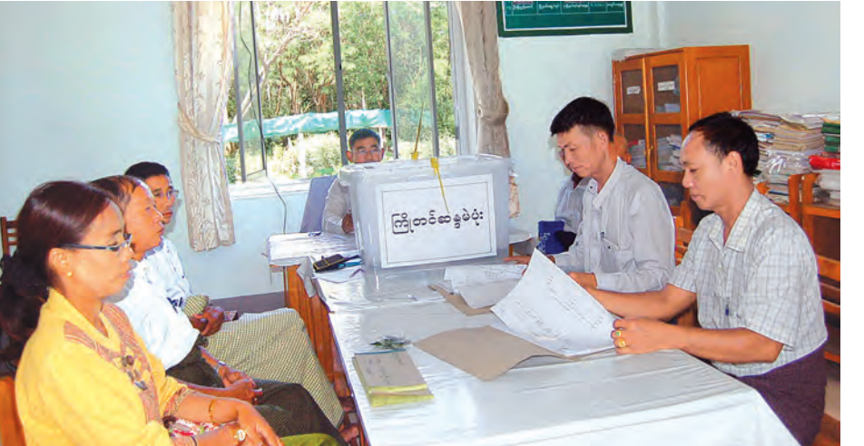
လေ့လာသိရှိရွေးကောက်ပွဲကော်မရှင်အဖွဲ့ခွဲမှ ကြိုတင်မဲလက်မှတ်များထုတ်ပေးနေစဉ်။

နိုင်ငံဘာလ ၁ ရက်နေ့မတိုင်မီကတည်းက သက်ဆိုင်ရာ ရပ်ကွက်/ကျေးရွာကော်မရှင်အဖွဲ့ခွဲများအလိုက် စတင်ထုတ်ပေးနေပြီဖြစ်ကြောင်းသိရသည်။ “မဲဆန္ဒရှင်သက်သေခံလက်မှတ်တွေကို နိုဝင်ဘာလ ၁ ရက်နေ့မတိုင်ခင် အောက်တိုဘာလ ၃၁ ရက်နေ့ ညနေကတည်းက တပ်မတော်ရပ်ကွက်ကြီး(၃)ခုနဲ့ ရပ်ကွက်/ကျေးရွာကော်မရှင်အဖွဲ့ခွဲများအလိုက် မဲစာရင်းမှာပါတဲ့ နံပါတ်တွေနဲ့ တိုက်စစ်ပြီး အိမ်ထောင်စုတစ်ခုချင်းက အိမ်ထောင်ဦးစီး ဒါမှမဟုတ် အိမ်မှာရှိတဲ့သူတစ်ယောက်ကနေ မဲပေးမယ့်သူတွေရဲ့ မဲစာရင်းနံပါတ်နဲ့ လာရောက်ထုတ်ယူနေတာတွေရှိပါတယ်။ နောက်ပြီး ဒီမဲဆန္ဒနယ်မှာ ယှဉ်ပြိုင်ကြမယ့် ပါတီတွေက လူတွေကလဲ ရပ်ကွက်/ကျေးရွာတွေထဲထိဆင်းပြီး တစ်အိမ်ချင်းမှာရှိတဲ့ မဲဆန္ဒရှင်တွေရဲ့ မဲစာရင်းနံပါတ်တွေကိုကြည့်ပြီး ကော်မရှင်အဖွဲ့ခွဲတွေနဲ့ ပူးပေါင်းပြီး သက်သေခံလက်မှတ်ထုတ်ပေးတဲ့နေရာမှာ အဆင်ပြေအောင် ကူညီဆောင်ရွက်ပေးနေတာတွေရှိပါတယ်။ နောက်ပြီးကော်မရှင်အနေနဲ့လည်း အဖွဲ့ခွဲတွေအလိုက် မဲစာရင်းနံပါတ်တွေနဲ့ မဲဆန္ဒရှင်နာမည်တွေကို သက်သေခံလက်မှတ်တွေပေါ်မှာ ရေးထားပြီးသားဖြစ်တဲ့အတွက် မဲစာရင်းနံပါတ်သိရင် ချက်ချင်းထုတ်ပေးလို့ ရအောင်လုပ်ပေးထားတယ်ဆိုတော့ နိုဝင်ဘာလ ၅ ရက်နေ့လောက်ဆို တော်တော်များများ ထုတ်ပေးပြီးသားဖြစ်နေအောင်ဆောင်ရွက်နေပါတယ်” ဟု ကော်မရှင်အဖွဲ့ခွဲဥက္ကဋ္ဌက ပြောကြားသည်။ မဲဆန္ဒရှင်သက်သေခံလက်မှတ်များကို နိုဝင်ဘာလ ၇ ရက်နေ့အထိ ထုတ်ပေးသွားမည်ဖြစ်ပြီး နိုဝင်ဘာလ ၈ ရက်နေ့အထိ မထုတ်ရသေးပါက မဲပေးမည့် မဲရုံအနီးတွင် ထုတ်ပေးနိုင်ရန် ဆောင်ရွက်ထားပြီး နိုင်ငံသားစိစစ်ရေးကတ်ပါရှိ မဲပေးခွင့်အမှတ်စဉ်နံပါတ်မှတ်မိပါကလည်း မဲပေးနိုင်ကြောင်း မြို့နယ်ရွေးကောက်ပွဲကော်မရှင်အဖွဲ့ခွဲဥက္ကဋ္ဌထံမှ သိရသည်။