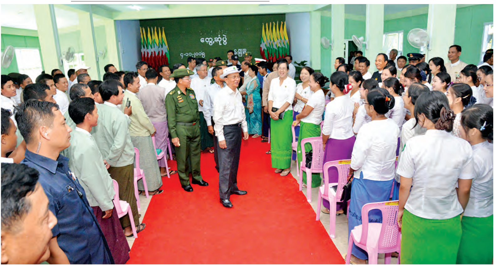
နိုင်ငံတော်သမ္မတ ဦးသိန်းစိန် ရမ်းဗြဲမြို့နယ်မှ တာဝန်ရှိသူများ၊ ဒေသခံပြည်သူများနှင့်တွေ့ဆုံပွဲတွင် တက်ရောက်လာသူများအား ရင်းရင်းနှီးနှီးနှုတ်ဆက်စဉ်။ (သတင်းစဉ်)

ယင်းနောက် နိုင်ငံတော်သမ္မတသည် မာန်အောင်မြို့ အောင်ဇေယျခန်းမ၌ မြို့မိ မြို့ဖများ၊ မြို့နယ်စီမံခန့်ခွဲမှုကော်မတီ၊ မြို့နယ်ဖွံ့ဖြိုး