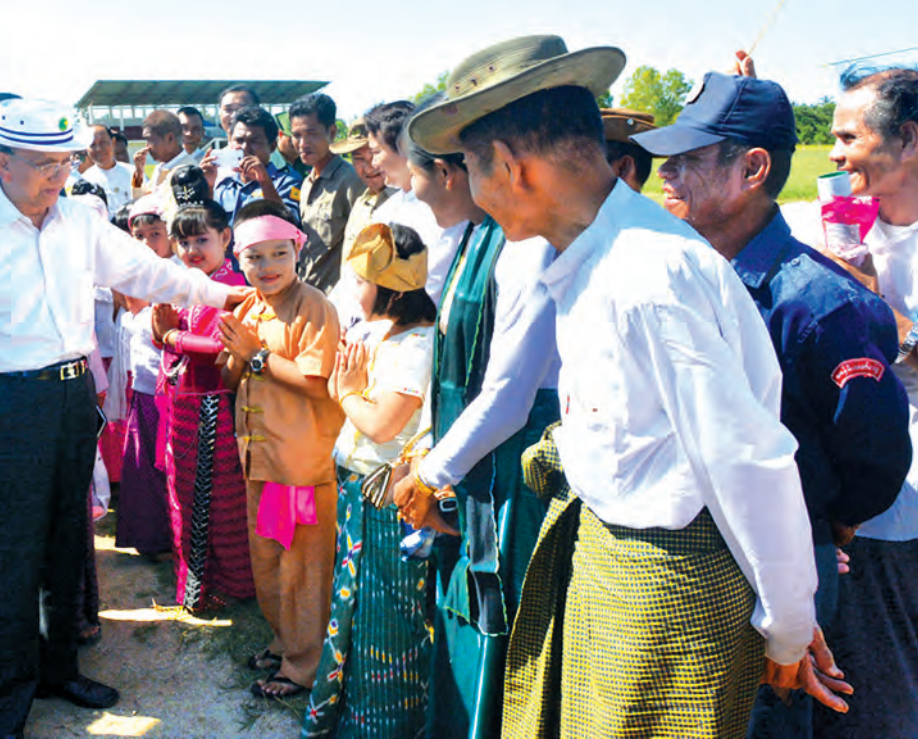
နိုင်ငံတော်သမ္မတ ဦးသိန်းစိန်အား မာန်အောင်မြို့မှ ဒေသခံပြည်သူများက ရင်းရင်းနှီးနှီးနှုတ်ဆက်စဉ်။ (သတင်းစဉ်)

ထို့နောက် မာန်အောင်မြို့နယ် ဖွံ့ဖြိုးတိုးတက်ရေး အထောက်အကူပြုကော်မတီဥက္ကဋ္ဌက မြို့နယ်အတွက် လိုအပ်သည်များကို တင်ပြသည်။