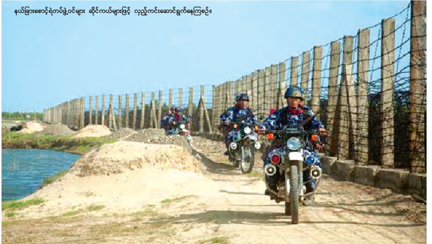
နယ်ခြားစောင့်ရဲတပ်ဖွဲ့ဝင်များ ဆိုင်ကယ်များဖြင့် လှည့်ကင်းဆောင်ရွက်နေကြစဉ်။

နိုင်ခဲ့သဖြင့် ထုတ်လုပ်မှုတွင်လည်း ဘိန်းတန်ချိန် ၈၇၀ တန်မှ ၆၇၀ တန်ထိ ၂၃ ရာခိုင်နှုန်း လျော့ချနိုင်ခဲ့၍ စိုက်ပျိုးမှုနှင့်ထုတ်လုပ်မှုကို ၂၀၁၄ ခုနှစ်တွင် ထိန်းချုပ် နိုင်ခဲ့သည်။