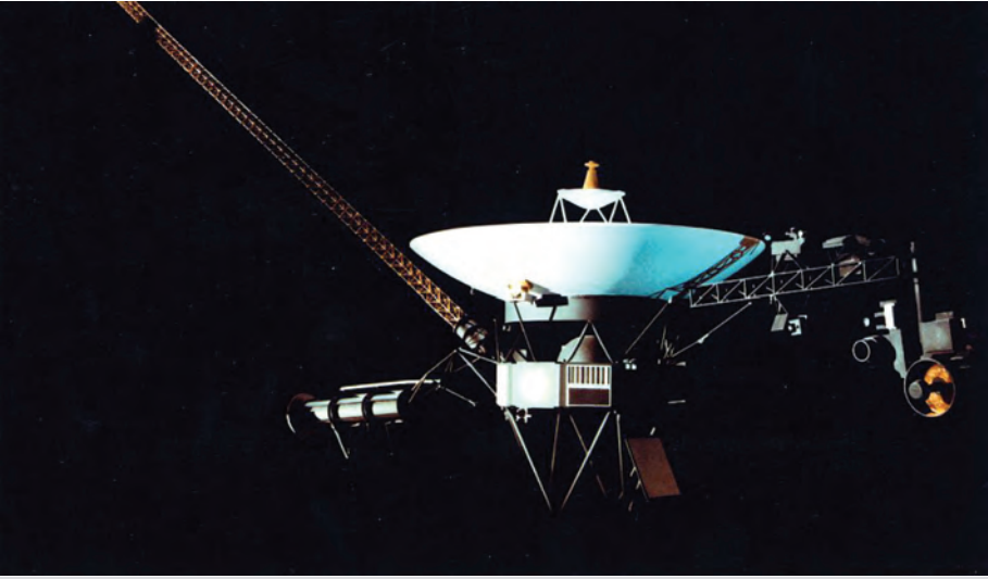
နေစကြဝဠာ နယ်နိမိတ်အပိုင်းအခြားကိုကျော်လွန်ရောက်ရှိသွားသော ဗြိုင်ယေဂျာ-၁ အာကာသယာဉ်

အမေရိကန်တို့က မာကျူရီအာကာသယာဉ်ဖြင့် လူသားတို့ကို အာကာသထဲသို့ ပို့ဆောင်မည့် အစီအစဉ်ကို ၁၉၅၈ ခုနှစ် အောက်တိုဘာလက ထုတ်ပြန်ကြေညာခဲ့သည်။ ၁၉၅၉ ခုနှစ် ဇန်နဝါရီလတွင် ဆိုဗီယက်တို့က Luna-1 အာကာသယာဉ်ကို လအနီးသို့ ချဉ်းကပ်နိုင်စေခဲ့သည်။ ဆိုဗီယက်တို့က ၁၉၆၀ ခုနှစ် ဧပြီလတွင် အာကာသထဲသို့ ကမ္ဘာ့ပထမဦးဆုံးသော လူသားတစ်ဦးကို စေလွှတ်နိုင်ခဲ့သည်။ . . . အမေရိကန်တို့ကလည်း နောက်တစ်လ