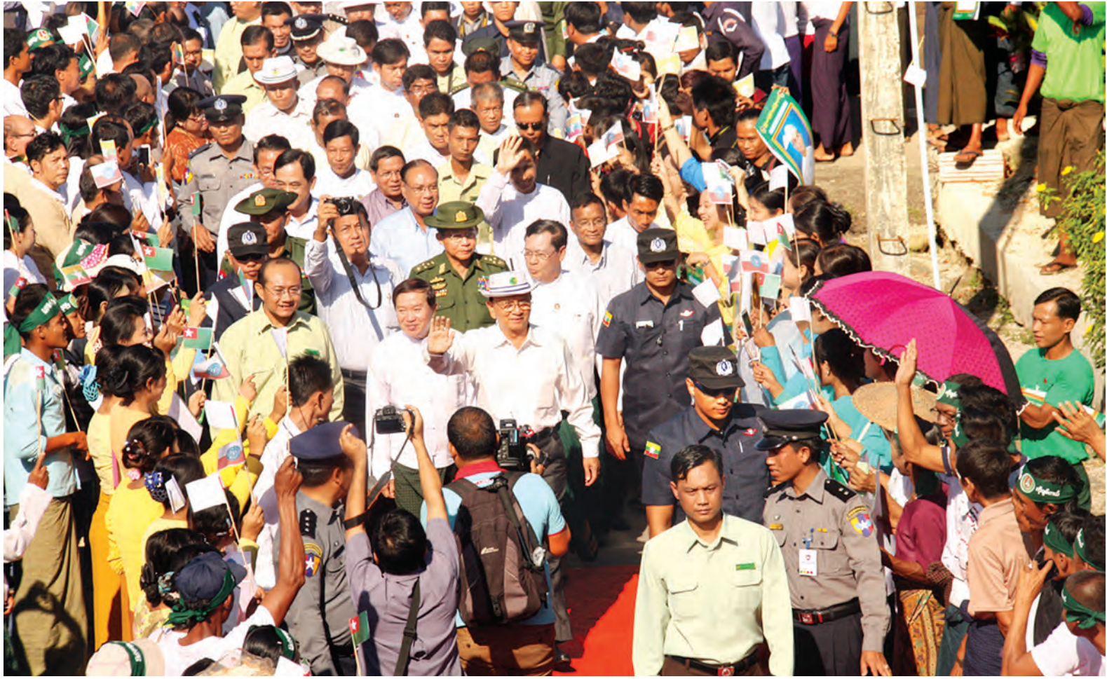
နိုင်ငံတော်သမ္မတ ဦးသိန်းစိန်အား သံတွဲလေဆိပ်၌ ဒေသခံပြည်သူများက တစ်ခဲနက်ကြိုဆိုကြစဉ်။

ဆက်လက်၍ နိုင်ငံတော်သမ္မတနှင့်အဖွဲ့သည် ရဟတ်ယာဉ်များဖြင့် ထွက်ခွာခဲ့ပြီး ရမ်းဗြဲမြို့သို့ ရောက်ရှိစာမျက်နှာ ၉ သို့