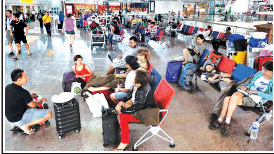
ရန်ကုန် နိုဝင်ဘာ ၄

အင်ဒိုနီးရှားတွင် ကျွန်းတစ်ခုရှိ မီးတောင်မှပြာမှုန်များ ပန်းထွက်လာသဖြင့် ဘာလီလေဆိပ်တွင် နိုင်ငံတကာခရီးစဉ် ရာပေါင်းများစွာအား ဖျက်သိမ်းခဲ့ရကြောင်း တာဝန်ရှိသူများက နိုဝင်ဘာ ၄ ရက်တွင် ပြောကြားသည်။ အဆိုပါ ကျွန်းမှ ငူရတ်ရိုင်းလေဆိပ်အား ကြာသပတေးနေ့နံနက်အထိ ပိတ်ထားမည်ဖြစ်ပြီး အခြေအနေကိုပြန်လည်သုံးသပ်ကာ လေဆိပ်ပြန်ဖွင့်မည်ဟုတာဝန်ရှိသူများက ကြေညာခဲ့သည်။ လန်ဗတ်ကျွန်းပေါ်ရှိ ရန်ဂျာနီမီးတောင်မှ ပြာမှုန်များသည် လွန်ခဲ့သောသီတင်းပတ်မှစပြီး ပန်းထွက်ခဲ့သည်။ မိုးလေဝသဌာန၏ကြေညာချက်အရ မီးတောင်ပေါက်ကွဲမှုများ ပိုမိုဖြစ်လာနိုင်သည်ဟုဆိုသည်။ခရီးသွားအများဆုံးလာရောက်သည်လူလိုလအတွင်းတွင်လည်း အရှေ့ဂျာဗားရှိ ရောင်း မီးတောင်ပေါက်ကွဲမှုကြောင့် ဘာလီတွင် ခရီးသည်ဦးရေ သောင်းချီပြီး သောင်တင်ခဲ့သည်။ ဂျေတီ