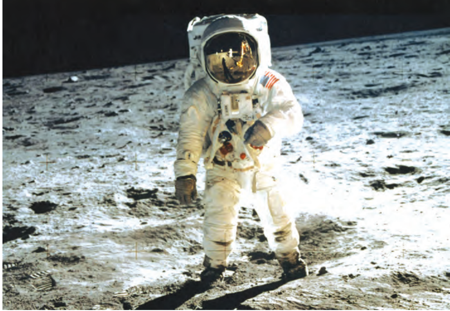
အမေရိကန် အာကာသသူရဲကောင်း အမ်းစတရောင်းနှင့် အော်လ်ဒရင်တို့ ၁၉၆၉ခုနှစ်က ပထမဆုံးအကြိမ် လပေါ်သို့ ဆင်းသက်စဉ်။

ခရီးပေါက်အောင် စွမ်းဆောင်နိုင်ခဲ့ပြီကို အောင်လံထူပြလိုက်ခြင်းပင် ဖြစ်သည်။ ဗြိုင်ယေဂျာ-၁ အာကာသယာဉ်နှင့် မရှေးမနှောင်း လွှတ်တင်ခဲ့သော ဗြိုင်ယေဂျာ-၂ အာကာသယာဉ်သည်လည်း မတူညီသောလမ်းကြောင်းပေါ်၌ မရပ်မနားခရီးနှင့် နေဆံပင်ဖြစ်သည်။ ဗြိုင်ယေဂျာ-၁က အထက်ပါ သတင်းပေးပို့ချက်များကိုမျှ ဗြိုင်ယေဂျာ-၂က ပေးပို့ခြင်းမရှိသေးပေ။ မည်သို့ပင်ဆိုစေကာမူ ကမ္ဘာ့လူသားတို့၏စွမ်းဆောင်ရည်ကြောင့် နေစကြဝဠာမှ မဟာစကြဝဠာကြီးဆီသို့တိုင် ထိုးဖောက်ရောက်ရှိနေပြီဆိုသည်ကို မည်သူကမျှ အငြင်းပွားနိုင်ကြတော့မည်မဟုတ်ပေ။ ။