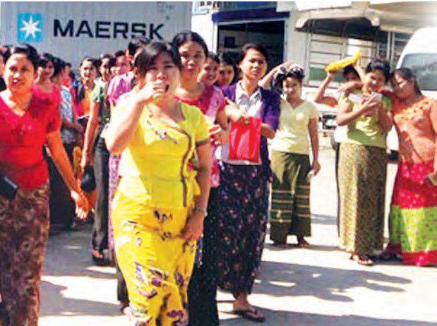
ရန်ကုန် နိုဝင်ဘာ ၄

နိုင်ငံတော်က အနည်းဆုံးလုပ်ခလစာကို ငွေကျပ် ၃၆၀၀ သတ်မှတ်ပေးခဲ့ပြီး အဆိုပါသတ်မှတ်ချက်နှင့်အတူ လိုက်နာရန်အချက်(၅)ချက်ပါရှိရာ မလိုက်နာသော အလုပ်ရှင် အချို့ကြောင့် လှိုင်သာယာစက်မှုဇုန်ရှိ အထည်ချုပ်စက်ရုံအချို့မှ အလုပ်သမားများအခက်အခဲခိုင်ခိုင်နေရသည်။ တာဝန်ရှိသူများက ဖြေရှင်းဆောင်ရွက်ပေးသည့်တိုင် လိုက်နာမှုအားနည်းသည့်အတွက် မြောက်ဘက်ကမ်းခြေ (North Shore) အထည်ချုပ်စက်ရုံမှ အလုပ်သမား ၈၀၀ ခန့် အောက်တိုဘာ ၂၇ ရက်မှစ၍ ယနေ့အထိ ဆန္ဒထုတ်ဖော်လျက်ရှိပြီး အလုပ်ရှင်က ခုံသမာဓိ၏ဆုံးဖြတ်ချက်ကို လိုက်နာမှုမရှိဘဲ ဆက်လက်ဆောင်ရွက်နေသဖြင့် လိုက်နာသည်အထိ ဆက်လက်ဆန္ဒထုတ်ဖော်သွားမည်ဖြစ်ကြောင်း အဆိုပါစက်ရုံအလုပ်သမားများထံမှ သိရသည်။