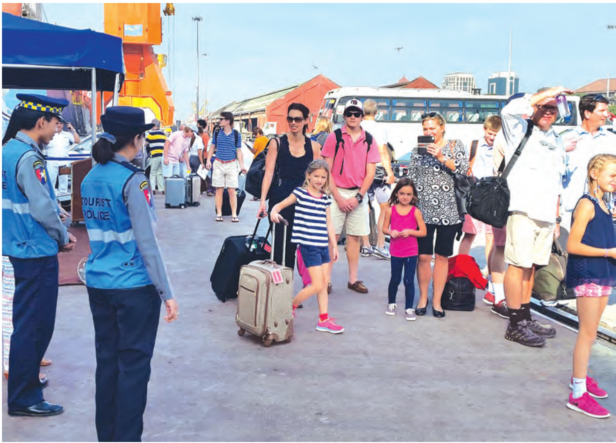
မြန်မာနိုင်ငံအတွင်းသို့ လာရောက်လည်ပတ်ကြသည့် နိုင်ငံခြားသားခရီးသွားများအား တွေ့ရစဉ်။