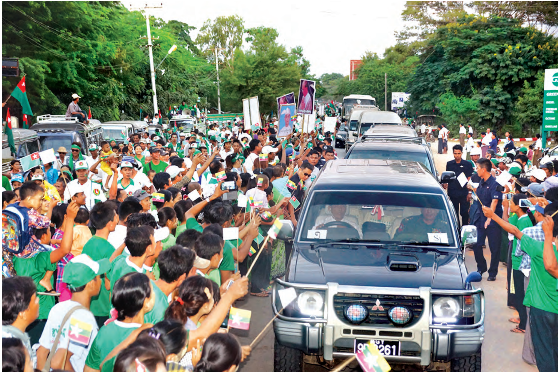
နိုင်ငံတော်သမ္မတ ဦးသိန်းစိန်၊ တပ်မတော်ကာကွယ်ရေးဦးစီးချုပ် ဗိုလ်ချုပ်မှူးကြီးမင်းအောင်လှိုင်နှင့်အဖွဲ့အား မကွေးမြို့ရှိ ဒေသခံပြည်သူများက သောင်းသောင်းဖြူဖြူဆိုနုတ်ဆက်ကြစဉ်။ (သတင်းစဉ်)

နေပြည်တော် နိုဝင်ဘာ ၄ ရက် ရခိုင်ပြည်နယ် စစ်တွေမြို့၌ရောက်ရှိနေသော ပြည်ထောင်စုသမ္မတမြန်မာနိုင်ငံတော် နိုင်ငံတော်သမ္မတ ဦးသိန်းစိန်သည် တပ်မတော်ကာကွယ်ရေးဦးစီးချုပ် ဗိုလ်ချုပ်မှူးကြီး မင်းအောင်လှိုင်၊ ပြည်ထောင်စုဝန်ကြီးများ၊ ပြည်နယ် ခေတ္တဝန်ကြီးချုပ်၊ အနောက်ပိုင်းတိုင်းစစ်ဌာနချုပ်တိုင်းမှူး၊ ဒုတိယဝန်ကြီးများနှင့်အတူ ယနေ့နံနက်၆နာရီတွင် စစ်တွေမြို့ လောကနန္ဒာစေတီတော်သို့ သွားရောက်ဖူးမြော်ကြည်ညိုပြီး ဆွမ်း၊ ပန်း၊ ရေချမ်းများ ဆက်ကပ်လှူဒါန်းကြသည်။ စာမျက်နှာ ၈ ကော်လံ ၁ *