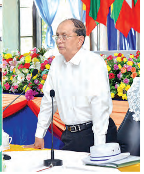
နိုင်ငံတော်သမ္မတ ဦးသိန်းစိန် မာန်အောင်မြို့ အောင်ဇေယျခန်းမ၌ မြို့မိမြို့ဖများ၊ ဌာနဆိုင်ရာတာဝန်ရှိသူများနှင့် ဒေသခံပြည်သူများအား တွေ့ဆုံအမှာစကားပြောကြားစဉ်။ (သတင်းစဉ်)

တိုးတက်ရေး အထောက်အကူပြုကော်မတီနှင့် မြို့နယ်စည်ပင်သာယာရေးကော်မတီတို့မှ ဥက္ကဋ္ဌများနှင့် အဖွဲ့ဝင်များ၊ ဌာနဆိုင်ရာတာဝန်ရှိသူများနှင့် ဒေသခံပြည်သူများအား တွေ့ဆုံသည်။