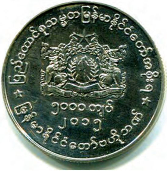
အထိမ်းအမှတ်ဒင်္ဂါး၏ရှေ့ဘက်