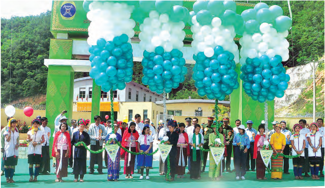
ဩဂုတ်လ ၂၂ ရက်က ဘီလူးချောင်းအမှတ်(၃) ရေအားလျှပ်စစ်စက်ရုံအား ဒေသခံ တူးချွန်ကျောင်းသူလေးများက ဖဲကြိုးဖြတ်၍ ဖွင့်လှစ်ပေးကြစဉ်။

လျှပ်စစ်ကို အသုံးပြုခြင်းဖြင့် မီးဖိုချောင် သူသက်တမ်းနှင့်တူစွာ မြှင့်တင်နေသည့် မီးခိုးကျပ်ခိုးများကို ရှင်းထုတ်ပစ်ရဦးမည်။