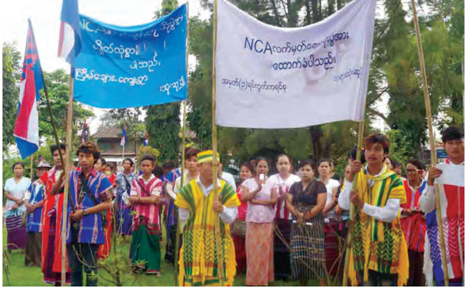
နေမျိုးလွင် (ပြန်/ဆက်)

ဆိုင်ရာများ၊ လူမှုရေးအသင်းအဖွဲ့များ၊ မြို့ပေါ်လေးရပ်ကွက်နှင့် ကျေးရွာများမှ ဒေသခံပြည်သူများက NCA သဘောတူစာချုပ် လက်မှတ်ရေးထိုးပွဲကို ထောက်ခံရေး၊ ပြည်တွင်းငြိမ်းချမ်းမှု တည်ဆောက်ရေး၊ နိုင်ငံတွေ့ဆုံဆွေးနွေးပွဲ အမြန်ဆုံး ဖြစ်ပေါ်လာရေး၊ ခိုင်မြဲသောငြိမ်းချမ်းရေးလိုလားသည့် ပြည်သူများဆန္ဒဟူ၍ စုပေါင်းသံပြိုင်ကြွေးကြော်ကာ ထောက်ခံခဲ့ကြောင်း သိရသည်။