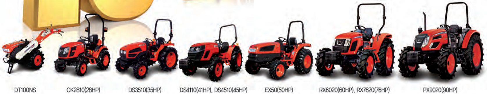
DT100NS CK2810(28HP) DS3510(35HP) DS4110(41HP), DS4510(45HP) EX50(50HP) RX6020(60HP), RX7620(76HP) PX9020(90HP)

ဝယ်လိုအား၏ လိုအပ်ချက်သည် အခြေအနေအလိုက် ပြောင်းလဲနိုင်ပါသည်။