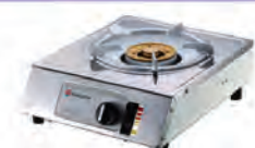
SAKURA ဝက်(စ်)မီးခို