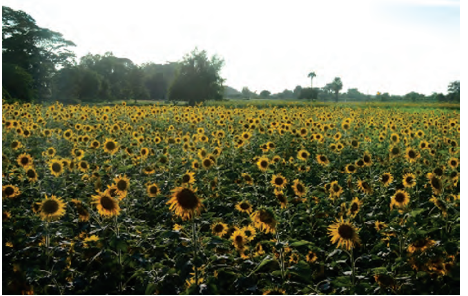
သာစည်မြို့နယ် ဆည်ကြီးတောင်ကျေးရွာအနီးမှ အောင်မြင်ဖြစ်ထွန်းနေသော နေကြာစိုက်ခင်း။