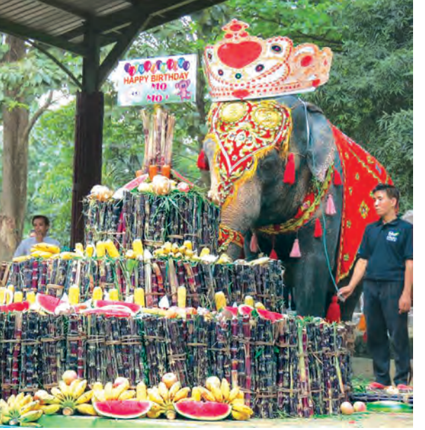
မိမိ၏(၆၂)နှစ်မြောက်မွေးနေ့ပွဲတွင် လာရောက်ကြသည့် စည့်ပရိသတ်များနှင့် မိမိကို တွေ့ရစဉ်။

တယ်။ ပြီးတော့ ဖရဲသီးတွေ၊ ပန်းသီးတွေ၊ ပြောင်းဖူးတွေနဲ့ အလှဆင် ထည့်ပေးတာပေါ့။ သူ့အသက်စေ့ စာကလေး ၆၂ ကောင်ကိုလည်း သူ့ကိုယ်တိုင်လွှတ်ခိုင်းရတာပေါ့။