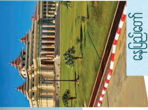
နေပြည်တော်