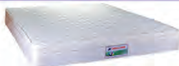
စပရင်မေ့ရာ