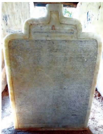
မင်းတုန်းမင်းတရားကြီးမဟာဗောဓိညောင်ပင်နှင့် စေတီတော်ကြီးသို့လှူဒါန်းခဲ့သောအလှူတော်များ မှတ်တမ်းတင်ထားသည့် မဟာဗောဓိရွှေညောင်တော်ကျောက်စာသံပိုင်းမော်ကွန်း။

သီတဂူဆရာတော်အရှင်ဉာဏိသီရိ တွဲဖက်ရွှေကျင်သာသနာပိုင် (၄) အဂ္ဂမဟာပဏ္ဍိတ Ph.D., D.Litt.