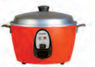
TATUNG သက်စိုသုံးပေါင်းအိုး

စပရင်မေ့ရာ၊ ရေမြှုပ်မေ့ရာ၊ ပရိဘောဂ၊ မင်္ဂလာခန်းဝင်ပစ္စည်း အမျိုးမျိုးအပြင် ပြည်ပမှ တင်သွင်းသော အိပ်ခန်းသုံး ပစ္စည်းအမျိုးမျိုး နှင့် မီးဖိုချောင်သုံး ပစ္စည်းအမျိုးမျိုးတို့အား Sweety Home Living Mall များ နှင့် အခြားအနယ်နယ်ရှိ Sweety Home အရောင်းဆိုင်များတွင် ဝယ်ယူရရှိနိုင်ပါသည်။