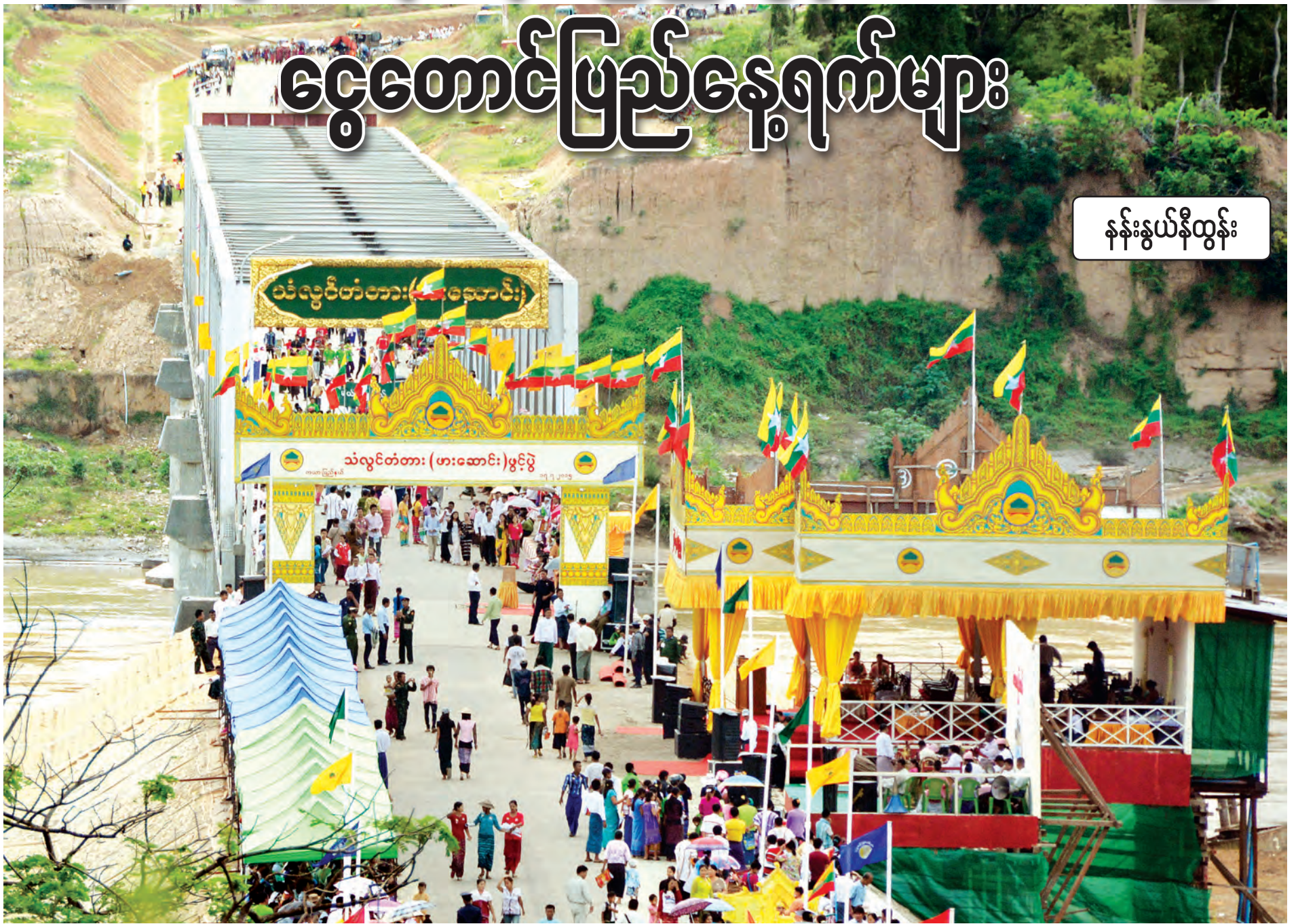
၂၀၁၅ ခုနှစ် ဇူလိုင် ၁၇ ရက်က သံလွင်တံတား (ဖားဆောင်း) ဖွင့်ပွဲ အခမ်းအနား ကျင်းပခဲ့စဉ်။

နေမင်းကြီး အလင်းရောင်ဖျော့လာသည်နှင့်တစ်ပြိုင်နက် မျက်လုံးများက အိမ်နံရံထက်မှ အဖြူရောင်သစ်လွင်နေသည့် မီးခလုတ်လေးဆီသို့ အကြည့် ရောက်သည်။ သားသမီးများ စနောက်မည်စိုးသဖြင့်သာ နေလုံးကြီး ပျောက် ကွယ်သည်အထိ စောင့်နေရခြင်းဖြစ်သည်။ ခုတော့ ဒေါ်ဂဲလဲရစွဲ မီးခလုတ်ကို အားပါးတရ ဖွင့်သည်။ “ဖြောက်ခနဲ” ဖြူလွလွ အယ်အီးဒီမီးရောင်က အိမ်တစ်လုံးကို ဖုံးလွှမ်းသွားသောအခါ ဆက်တိုက်ပင် တီပွီခလုတ်ကိုဖွင့်ဖို့