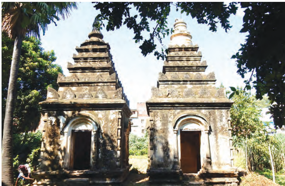
အလှူတော်များ သိမ်းဆည်းထားသည့် ရာ ကျောက်စာစာတိုက် အမှတ်တိုက်ဘဏ္ဍာအိမ် (အဆောက်အအုံများကို ဒေသခံအိန္ဒိယနိုင်ငံသားများ ပြုပြင်ထားသောကြောင့် မြန်မာ့လက်ရာများ မကျန်ရှိတော့ပေ။)

ယသံ-တန်ခိုးကျော်စောခြင်းကို။ ဓရော- ဆောင်တော်မူနိုင်သော၊ ဇေယျာဝတီ အာသဘ ဥသဘော- လူအပေါင်းတို့ထက်မြတ်သော၊ ဥသဘမြောက်ပြီး အာသဘကြီး ဖြစ်တော်မူသော။ ယော သုရက္ခဘူပေါ- အကြင်နတ်အပေါင်းတို့ထက် မြတ်သည်၏ အဖြစ်ကြောင့်၊ သုရက္ခဋ္ဌက မလာသနမည်သော ပြဟ္မာမင်း တည်းဟူသော တရားမင်းမြတ်သည်။ သေဝနိကဇန္တူ- မိမိကိုမှီကုန်သော တိုင်းနိုင်ငံသူ ရှင်လူ အပေါင်းတို့၌၊ သီတံ-သီတေန- ချမ်းအေး လှစွာသော၊ ဒယာဥဒကံ-ဒယာဥဒကေန- မေတ္တာ တည်းဟူသော ရေအေးဖြင့်၊ ဥဘေတု-သိဗ္ဗတု- သွန်းလောင်းဖျန်းဆွတ်ပါစေသတည်း။ သသော သုရက္ခဘူပေါ- ထိုနတ်အပေါင်းတို့ထက် မြတ်သည်၏ အဖြစ်ကြောင့်၊ သုရက္ခဋ္ဌက မလာသနမည်သော ပြဟ္မာမင်း တည်းဟူသော တရားမင်းမြတ်သည်။ တပံ၊ အဇ္ဈတ္တိကဗာဟိရသန္တာန်၌ကျရောက်လာသော ပူပန်ခြင်း ဒုက္ခကို။ တပ-တပန္နော- မိမိပူပန်စေလျက်၊ ဟဝေ-ကေန္တေန- စင်စစ်သဖြင့်။ သဒါ သဒါ- အခါ ခပ်သိမ်း။ သုခံ- ကိုယ်စိတ်နှစ်ဖြာချမ်းသာစွာ။ သေတု၊ အတ္တဘော၌ ဘေးနှောမရှိဘဲ ပကတိ ဖြစ်ပါစေ သတည်း။