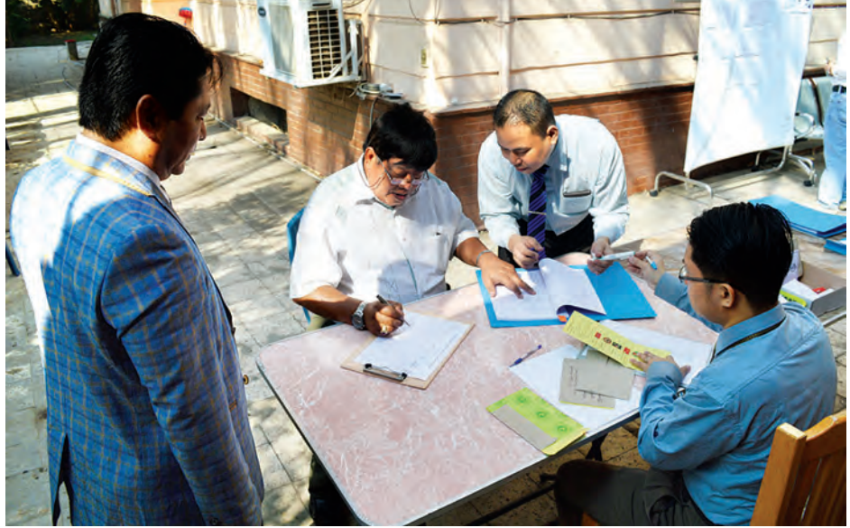
အီဂျစ်နိုင်ငံ ကိုင်ရိုမြို့ရှိ မြန်မာသံရုံး၌ ကြိုတင်ဆန္ဒမဲ လာရောက်ပေးသူများကို တွေ့ရစဉ်။

အောက်တိုဘာ ၁၃ ရက်မှ ၁၇ ရက် အထိ ကြိုတင်ဆန္ဒမဲပေးခဲ့ကြသည့် မဲဆန္ဒရှင်စုစုပေါင်း ၁၁၉၀၆ ဦး ရှိကြောင်း၊ ကြိုတင်ဆန္ဒမဲလာရောက် ပေးကြသည့် ပြည်ပရောက်မြန်မာ နိုင်ငံသားများ အဆင်ပြေချောမွေ့စွာ မဲပေးနိုင်ရေးအတွက် မြန်မာသံရုံး၊ မြန်မာအမြဲတမ်းကိုယ်စားလှယ်အဖွဲ့ ရုံး၊ မြန်မာကောင်စစ်ဝန်ချုပ်ရုံး များအနေဖြင့် လိုအပ်သည်များ စီမံ