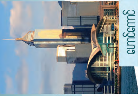
သွေဇ်ကောင်