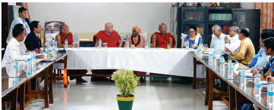
မဟာဗောဓိစေတီတော် အုပ်ချုပ်ရေးရုံးခန်းတွင် သီတဂူဆရာတော်ကြီးနှင့်အုပ်ချုပ်ရေးအဖွဲ့များ အစည်းအဝေးကျင်းပနေစဉ်။

တိုက်မှာ ဘုရားသီတင်းသုံးရန် ပလ္လင်ငယ်ကလေးနှင့် ဟင်းလင်း ဟောင်းလောင်း-ဟိန္ဒူ ပန်းရန်တို့ အကြိမ်ကြိမ် အဖန်ဖန် ပြင်ဆင်ထားသောကြောင့် မြန်မာ့ဟန် မန္တလေး လက်ရာ ယဉ်ကျေးမှုများ ပျောက်ကွယ်လျက်ရှိနေလေပြီ။ ကျောက်စာတိုက်စေတီမှာလည်း မြန်မာစေတီလော၊ ဟိန္ဒူစေတီလော ထင်မှားစရာဖြစ်ပါသည်။ ကျောက်စာ တိုက်ကိုပြင်၍ ကျောက်စာချုပ်ကြီး မပျောက်မပျက်အောင်