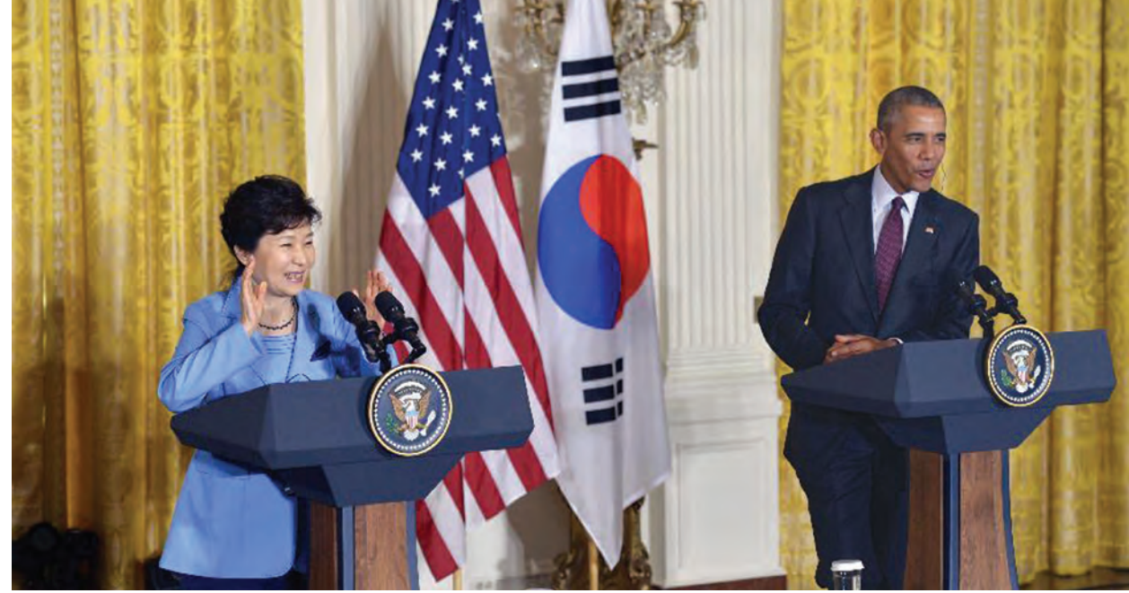
ဝါရှင်တန် အောက်တိုဘာ ၁၇

အမေရိကန်နှင့် တောင်ကိုရီးယားနိုင်ငံတို့အနေဖြင့် မြောက်ကိုရီးယား နိုင်ငံအား ခြောက်နိုင်ငံဆွေးနွေးပွဲကို စောနိုင်သမျှ စောစောဆွေးနွေးနိုင်ရန် တရုတ်နှင့်ပူးပေါင်းဆောင်ရွက်မှု ပိုမိုပြုလုပ်သွားမည်ဖြစ်ကြောင်း သောကြာနေ့က ပူးတွဲကြေညာချက်တွင် ဖော်ပြသည်။ “ကျွန်တော်တို့အနေနဲ့ မြောက်ကိုရီးယားနိုင်ငံကို အဓိပ္ပာယ်ရှိတဲ့ ဆွေးနွေးပွဲ သို့အမြန်ဆုံးပြန်လာဖို့ တရုတ်နိုင်ငံနဲ့ရော အခြားနိုင်ငံတွေနဲ့ပါ ပူးပေါင်း ဆောင်ရွက်မှုတွေကို ဆက်လက်ပြုလုပ်သွားမှာဖြစ်ပါတယ်” ဟု အမေရိကန် သမ္မတ ဘားရက်အိုဘားမားနှင့် တောင်ကိုရီးယားသမ္မတ ပတ်ဂွမ်ဟေးတို့အကြား ဆွေးနွေးပွဲတစ်ရပ်ပြုလုပ်ခဲ့ပြီးနောက် အမေရိကန်-တောင်ကိုရီးယား ပူးတွဲ ကြေညာချက်တွင် ဖော်ပြထားသည်။ တောင်ကိုရီးယားနှင့်အမေရိကန်တို့သည် မြောက်ကိုရီးယားနှင့်ပတ်သက်၍ ပထမဆုံး ပူးတွဲကြေညာချက်ထုတ်ပြန်ခဲ့ခြင်းဖြစ်သည်။ ကိုရီးယားကျွန်းဆွယ်အရေးတွင် တရုတ်နှင့် ပူးပေါင်းဆောင်ရွက်မှုပိုမို ကောင်းမွန်အောင် ဆောင်ရွက်နေသကဲ့သို့ တရုတ်နှင့် တောင်ကိုရီးယားအကြား ဆက်ဆံရေးကိုလည်း ပိုမိုခိုင်မာအောင်တည်ဆောက်နိုင်မှုကို မြင်တွေ့လို ကြောင်း သမ္မတအိုဘားမားက ထုတ်ဖော် ပြောကြားလိုက်သည်။ (ဆင်ဟွာ)