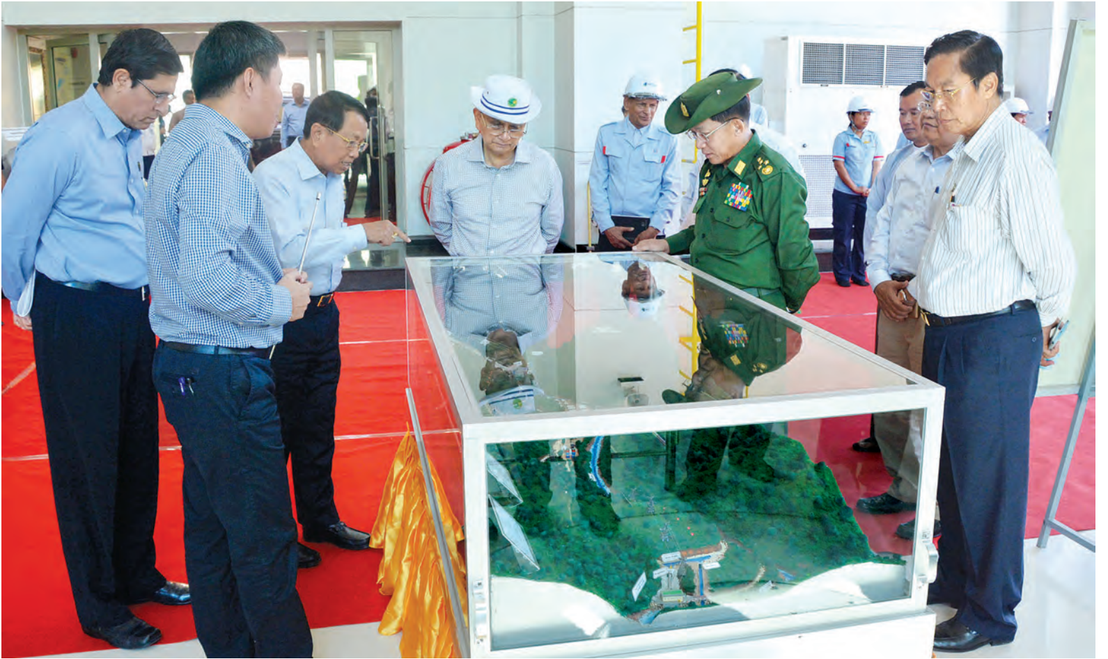
နိုင်ငံတော်သမ္မတ ဦးသိန်းစိန် ဘီလူးချောင်းအမှတ်(၃) ရေအားလျှပ်စစ်စက်ရုံ ပုံစံငယ်ကို ကြည့်ရှုစဉ်။

အဆိုပါ ဆေးရုံကြီးသည် ကျန်းမာရေးဝန်ဆောင်မှု ကောင်းခြင်း