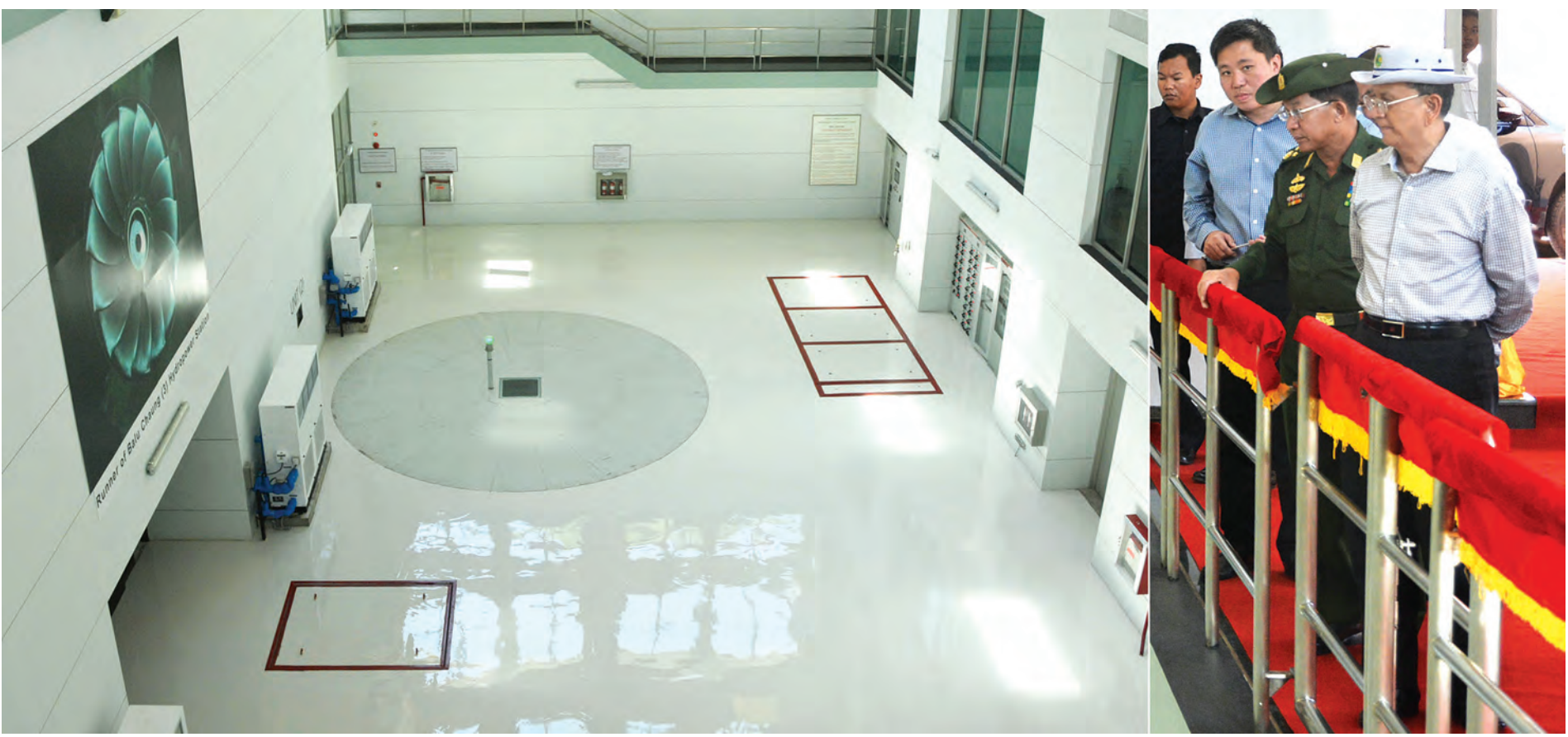
နိုင်ငံတော်သမ္မတဦးသိန်းစိန် ဘိလူးချောင်းအမှတ် (၃) ရေအားလျှပ်စစ်စက်ရုံ၌ ကြည့်ရှုစဉ်။ (သတင်းစဉ်)

နေပြည်တော် အောက်တိုဘာ ၁၇ ကယားပြည်နယ် လျှိုင်ကော်မြို့၌ ရောက်ရှိနေသည့် ပြည်ထောင်စု သမ္မတမြန်မာနိုင်ငံတော် နိုင်ငံတော်သမ္မတ ဦးသိန်းစိန်သည် တပ်မတော် ကာကွယ်ရေးဦးစီးချုပ် ဗိုလ်ချုပ်မှူးကြီး မင်းအောင်လှိုင်၊ ပြည်ထောင်စု ဝန်ကြီးများ၊ ပြည်နယ်ဝန်ကြီးချုပ်၊ အရှေ့ပိုင်းတိုင်းစစ်ဌာနချုပ် တိုင်းမှူးတို့ နှင့်အတူ ယနေ့နံနက်ပိုင်းတွင် လျှိုင်ကော် ပြည်နယ်ပြည်သူ့ဆေးရုံကြီးသို့ ရောက်ရှိပြီး ဆေးရုံအစည်းအဝေးခန်းမ၌ ဆေးရုံအုပ်ကြီးနှင့် ဆရာဝန်များ၊ သူနာပြုများ၊ ကျန်းမာရေးဝန်ထမ်းများအားတွေ့ဆုံသည်။ တွေ့ဆုံပွဲတွင် ဆေးရုံအုပ်ကြီးက ဆေးရုံဆိုင်ရာအချက်အလက်၊