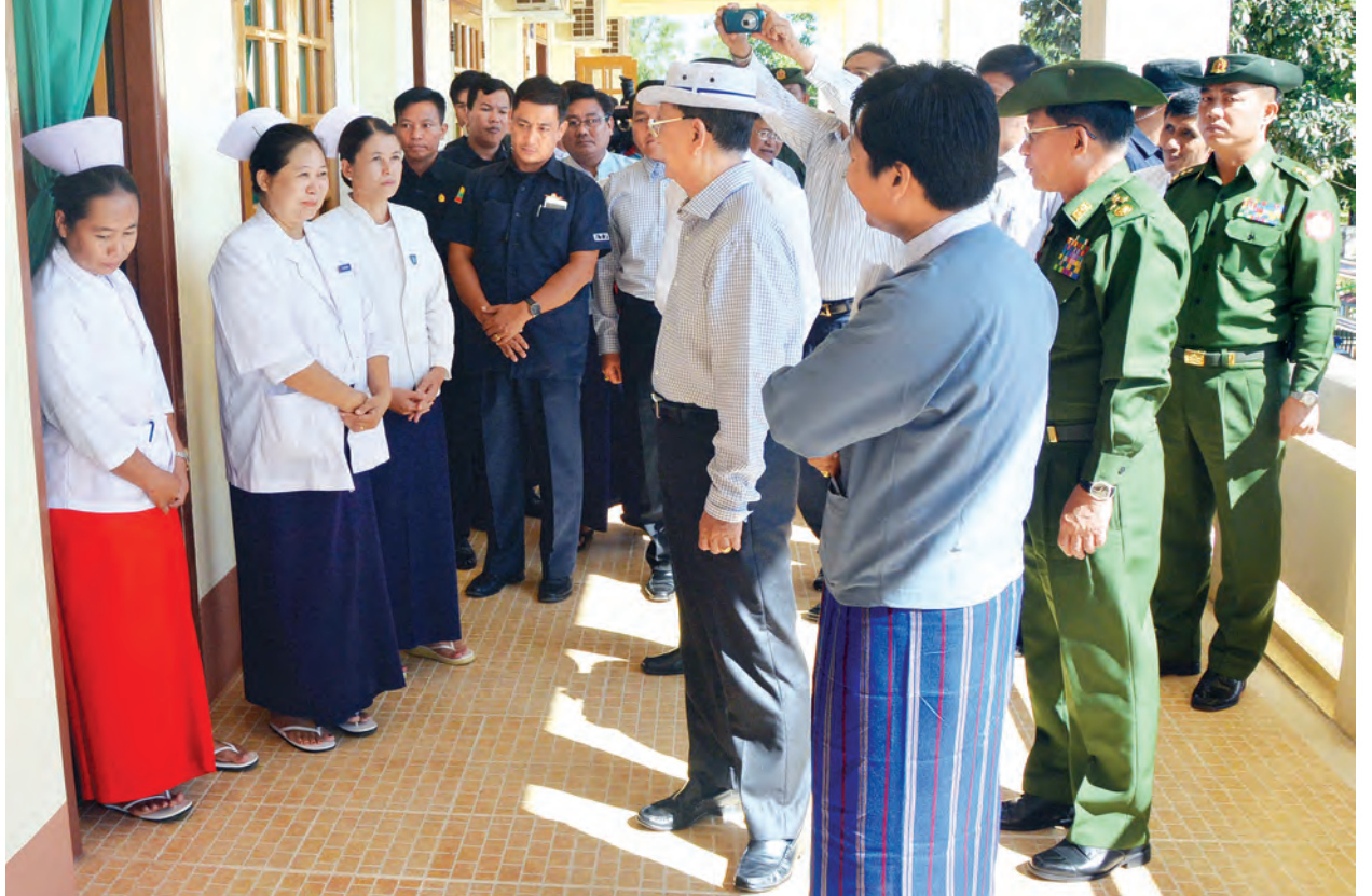
နိုင်ငံတော်သမ္မတ ဦးသိန်းစိန် လွိုင်ကော် ပြည်နယ်ပြည်သူ့ဆေးရုံကြီးရှိ ကျန်းမာရေးဝန်ထမ်းများအား ရင်းရင်းနှီးနှီးနှုတ်ဆက်စဉ်။ (သတင်းစဉ်)

အထည်ဖော် ဆောင်ရွက်နိုင်ရန် အမေရိကန်နိုင်ငံ KTA ကုမ္ပဏီက ၁၉၅၃ ခုနှစ်တွင် စတင်လေ့လာ အစီရင်ခံစာပြုခဲ့ရာ ယင်းအစီရင်ခံစာ ကိုအခြေခံ၍ ၁၉၅၄ ခုနှစ် နှစ်ဆန်း ပိုင်းတွင် ဂျပန်နိုင်ငံ Nippon Koei ကုမ္ပဏီက ဘီလူးချောင်းဒေသကို ကွင်းဆင်းလေ့လာပြီး ဘီလူးချောင်း ပေါ်တွင် ဓာတ်အားပေးစက်ရုံသုံးရုံ တည်ဆောက်လျှင် ၁၂၄ မဂ္ဂါဝပ်ရရှိ နိုင်ကြောင်းနှင့် အင်းလေးကန်မှရေကို ရေလျှောင့်ကန်တစ်ခု ပြုလုပ် ထိန်းသိမ်းပေးခြင်းဖြင့် မဂ္ဂါဝပ် ၂၄၀ ခန့်ရရှိနိုင်ကြောင်း တင်ပြခဲ့သည်။ ၁၉၅၄ ခုနှစ်တွင် ဘီလူးချောင်း စာမျက်နှာ ၉ ကော်လံ ၁ သို့