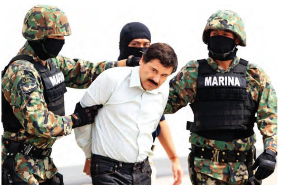
၎င်းလွတ်မြောက်မှုက ပြည်သူလူ ထုကြား အုတ်အော်သောင်းတင်း ဖြစ်ပွားစေခဲ့သည်။ လွန်ခဲ့သော ရက်သတ္တပတ် အနည်းငယ်က ၎င်းကိုဖမ်းဆီးရန် စစ်ဆင်ရေးများကို နိုင်ငံ၏အနောက် မြောက်ဘက်ဒေသများတွင် ပြုလုပ် ခဲ့ကြောင်း ယင်းကြေညာချက်တွင် ဖော်ပြခဲ့သည်။ ၎င်းမူးယစ်ရာဇာကို ပြန်လည်ဖမ်းမိရန် စစ်ဆင်ရေးများ ဆက်လက် ပြုလုပ်မည်ဖြစ်ကြောင်း အစိုးရက ပြောခဲ့သည်။ (ဆင်ဟွာ)

မက္ကဆီကိုစီးတီး အောက်တိုဘာ ၁၇ မက္ကဆီကိုမူးယစ်ရာဇာ ဂစ်မန်း သည် လုံခြုံရေးတပ်ဖွဲ့ဝင်များလက် မှ လွတ်မြောက်သွားကြောင်း၊ ၎င်းသည် နိုင်ငံ၏အနောက် မြောက်ပိုင်း စစ်ဆင်ရေးတွင် ဒဏ်ရာရရှိသွားကြောင်း မက္ကဆီကို အစိုးရက အောက်တိုဘာ ၁၆ ရက် နေ့ထုတ် ကြေညာချက်တွင် ဖော်ပြခဲ့ သည်။ ဖမ်းဆီးမှုမှ ရှောင်တိမ်းစဉ် ဂစ်မန်း၏ ခြေထောက်နှင့်မျက်နှာ တို့တွင် ဒဏ်ရာရရှိခဲ့ကြောင်း ကြေညာချက်အရ သိရသည်။ ဆီနာလိုပါ မူးယစ်ဆေးမှောင်ခို ခေါင်းဆောင် ဂစ်မန်းသည် ဇူလိုင် ၁၁ ရက်က မက္ကဆီကိုမြို့ပြင်ရှိ လုံခြုံရေးတင်းကျပ်သော အယ်တီ ပလာဒီအကျဉ်းထောင်မှ လွတ် မြောက်သွားခဲ့သည်။ ၎င်းကို ဖမ်းဆီး ထားသော အခန်း၏အောက်တွင် ၁ ဒသမ ၅ ကီလိုမီတာ ဥမင်လိုက် ခေါင်းမှတစ်ဆင့် လွတ်မြောက်ခဲ့ခြင်း ဖြစ်သည်။