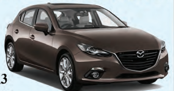
MAZDA3 Brand New