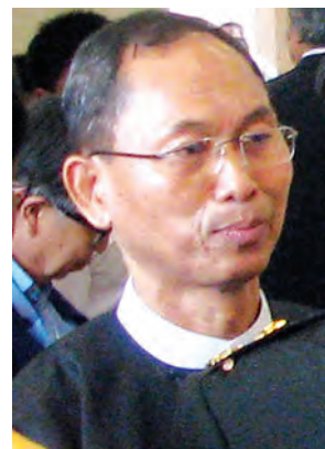
ဦးကိုကိုကြီး (၈၈ မျိုးဆက်)

ဒီနေ့မှာ ကျွန်တော်အင်မတန်စိတ်လှုပ်ရှားတယ်။ နှစ်ပေါင်းများစွာ ပစ်ခတ်တိုက်ခိုက်မှုတွေရှိခဲ့ပြီးတော့ ဒီနေ့မှာ ငြိမ်းချမ်းရေး လက်မှတ်ရေးထိုးနိုင်တယ်ဆိုတော့ ဝမ်းသာမိပါတယ်။ နိုင်ငံတစ်နိုင်ငံ ဖွံ့ဖြိုးတိုးတက်ဖို့ အတွက် ငြိမ်းချမ်းရေးမရှိရင် ဘာမှလုပ်လို့မရပါဘူး။ အဲဒါလည်း ပြည်သူလူထုအားလုံးက မျှော်လင့်ထားတဲ့ အရာပါ။ အားလုံးကလည်း ဝိုင်းဝန်းကြိုးပမ်းနေပါတယ်။ မြန်မာနိုင်ငံရဲ့ ငြိမ်းချမ်းရေးဖြစ်စဉ်ကို ကျွန်တော်တို့ တရုတ်နိုင်ငံအနေနဲ့ အိမ်နီးချင်းနိုင်ငံဖြစ်တာနဲ့အညီ အဲဒီငြိမ်းချမ်းရေးဖြစ်စဉ်ကို အမြဲတမ်းအလေးထားပါတယ်။ ငြိမ်းချမ်းရေးဖြစ်စဉ်အစကတည်းက ကျွန်တော်တို့ တရုတ်နိုင်ငံက အထူးသတိမပြုဘဲအပြစ်အဒွပ်ပေးခဲ့ပါတယ်။ မြန်မာနိုင်ငံရဲ့ အမျိုးသား ပြန်လည်သင့်မြတ်ရေးလုပ်ငန်း အတွက် တရုတ်နိုင်ငံအနေနဲ့ တက်တက်ကြွကြွ ပါဝင် ကူညီပေးနေပါတယ်။ ဒီကိစ္စအားလုံးဟာလည်း မြန်မာ နိုင်ငံအတွက် ကြိုးပမ်းတာ ဖြစ်ပါတယ်။ မြန်မာပြည်သူ လူထုအကျိုးအတွက်ပဲဖြစ်ပါတယ်။ ဒီနေ့လက်မှတ် ရေးထိုးတဲ့အခမ်းအနားမှာ အဖွဲ့ရှစ်ဖွဲ့ပဲ လက်မှတ် ရေးထိုးခဲ့တယ်ဆိုပေမယ့် မြန်မာနိုင်ငံအတွက် အရေး ကြီးတဲ့ အခန်းကဏ္ဍကနေ ပါဝင်နေပါတယ်။ အရင်တုန်း ကလည်း ကူညီခဲ့တယ်။ အခုလည်း မြန်မာနိုင်ငံရဲ့ ငြိမ်းချမ်း ရေးဖြစ်စဉ်နဲ့ပတ်သက်ပြီး ထောက်ခံနေသလို အနာဂတ် မှာလည်း ဆက်လက်ပြီး အကူအညီတွေ ပေးသွားဦးမှာပါ။