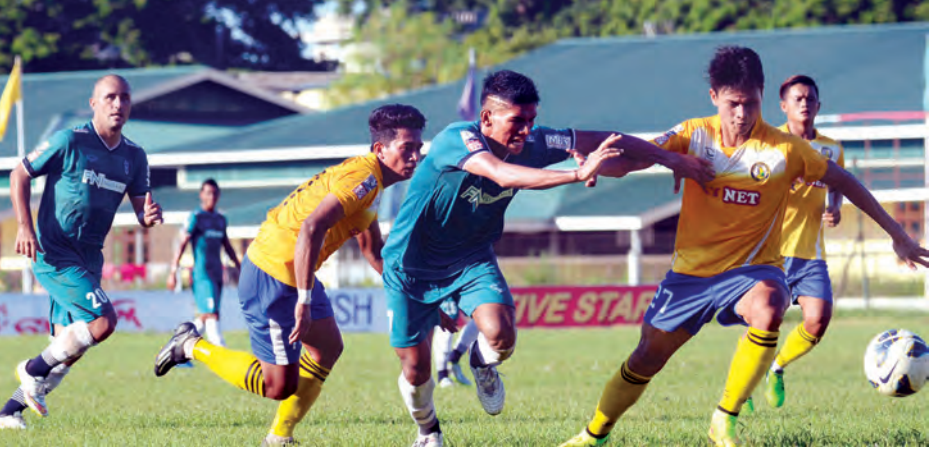
ဇေယျာရွှေမြေအသင်းနှင့် ရန်ကုန်အသင်းတို့ အကြိတ်အနယ်ယှဉ်ပြိုင်ကစားစဉ်။

ပထမနေ့အခြားပွဲစဉ်များတွင် ဗထူးကွင်း၌ ဇွဲကပင်