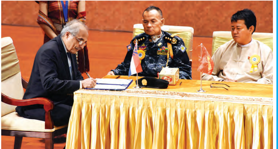
ကုလသမဂ္ဂအတွင်းရေးမှူးချုပ်၏ မြန်မာနိုင်ငံဆိုင်ရာ အထူးအကြံပေးပုဂ္ဂိုလ် မစ္စတာ ဗီဂျေမိဘီးယား လက်မှတ်ရေးထိုးစဉ်။