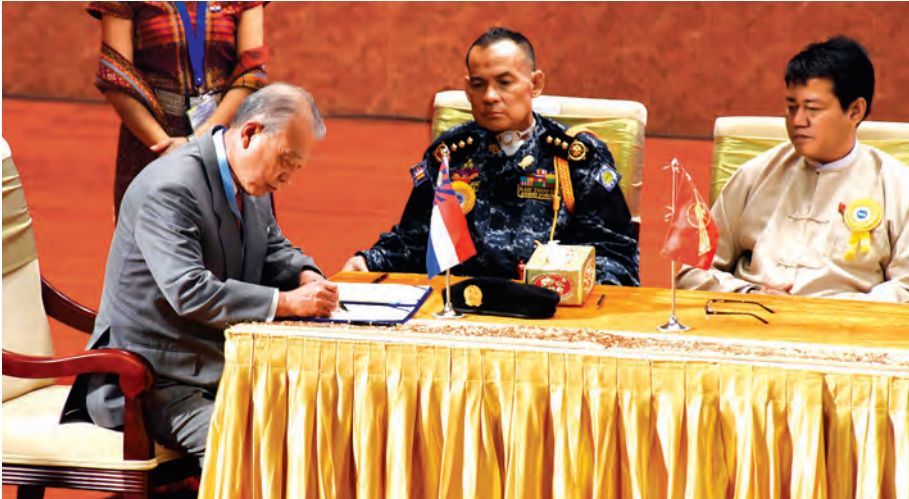
ဂျပန်နိုင်ငံမှ အထူးကိုယ်စားလှယ် H.E.Mr.Yohei SASAKAWA လက်မှတ်ရေးထိုးစဉ်။