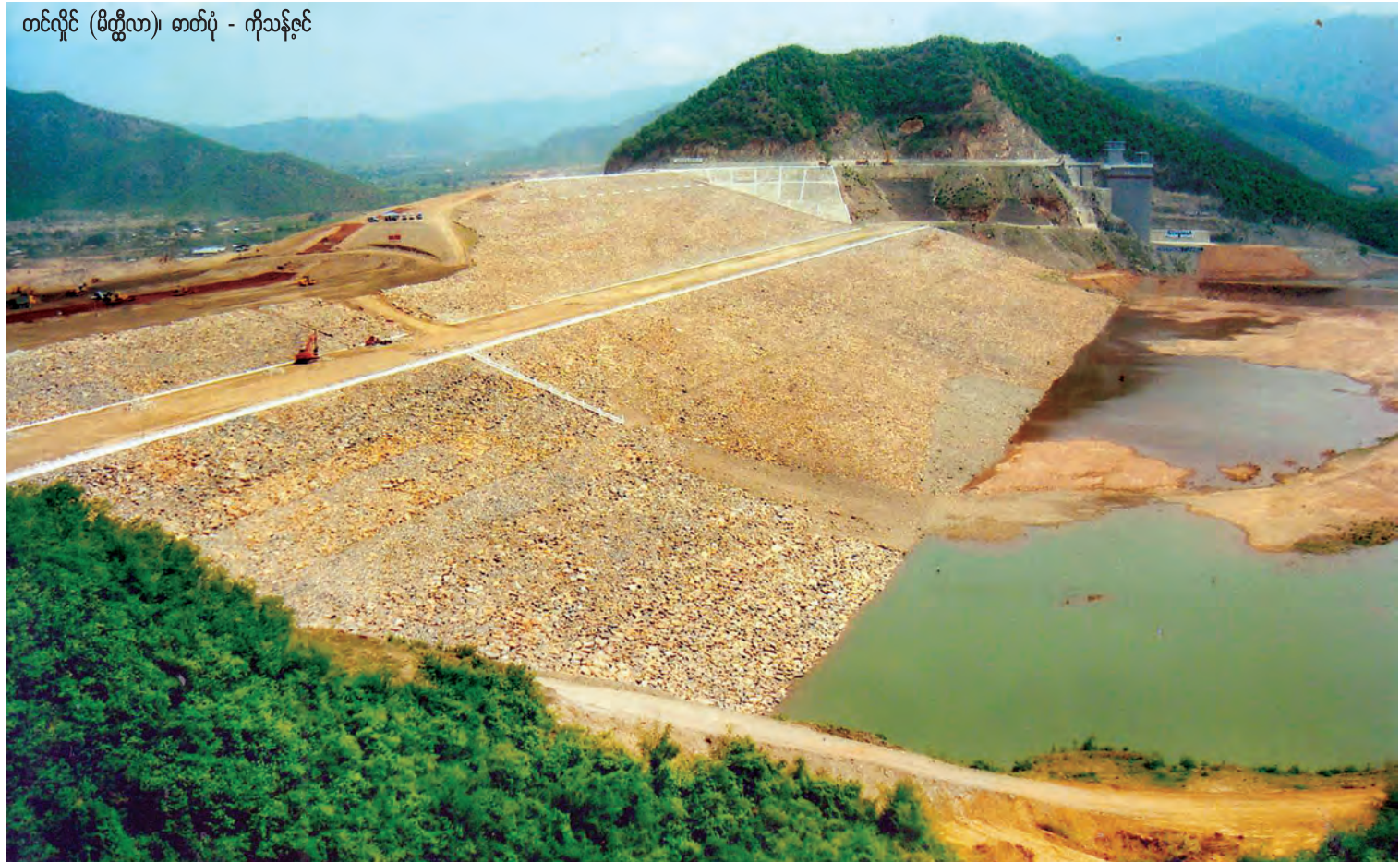
တင်လိုင် (မိတ္ထီလာ)

မြန်မာနိုင်ငံသည် ရေသယံဇာတ ပေါများသောနိုင်ငံဖြစ်သည်။ မြန်မာနိုင်ငံ သည် စိုက်ပျိုးရေးနိုင်ငံဖြစ်၍ ရေလိုသည်။ လယ်ယာစိုက်ပျိုးရေးနှင့် ဆည်မြောင်းဝန်ကြီး