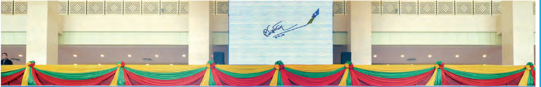
တစ်နိုင်ငံလုံး ပစ်ခတ်တိုက်ခိုက်မှုရပ်စဲရေး သဘောတူစာချုပ် လက်မှတ်ရေးထိုးပွဲအခမ်းအနား The Signing Ceremony of the Nationwide Ceasefire Agreement MICC II, ၁၀-၂၀၁၅