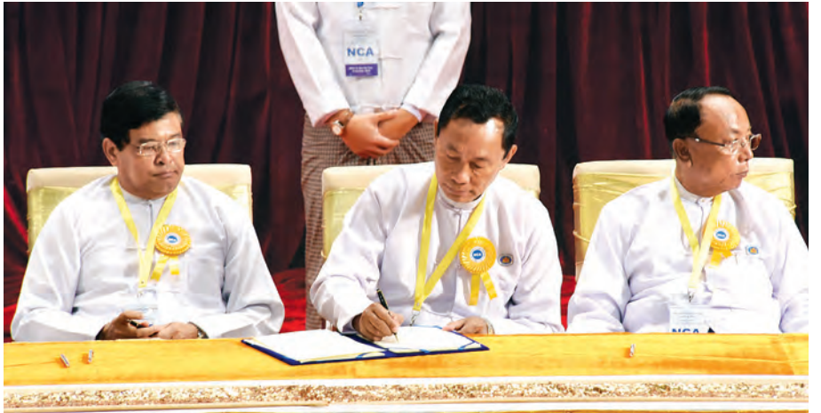
ပြည်သူ့လွှတ်တော်ဥက္ကဋ္ဌ သူရဦးရွှေမန်း လက်မှတ်ရေးထိုးစဉ်။