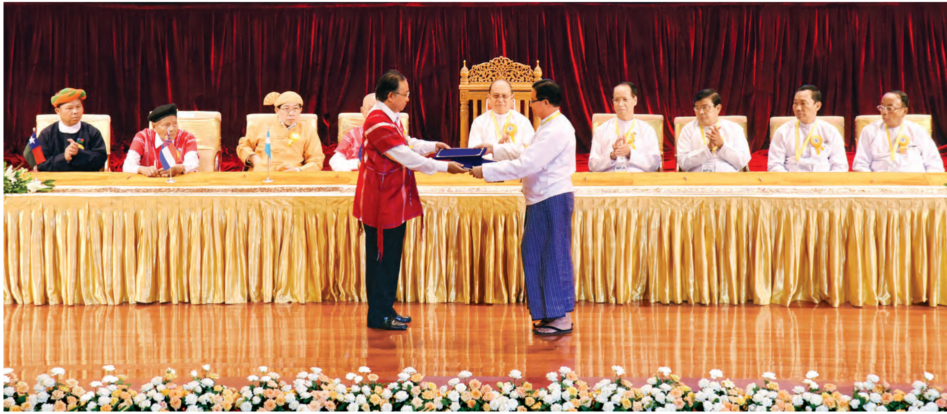
NCA စာချုပ်ကို ပြည်ထောင်စုဝန်ကြီး ဦးအောင်မင်းနှင့် KNU အထွေထွေအတွင်းရေးမှူး ပဒိုစောကွယ်ထူးဝင်းတို့က အပြန်အလှန်လဲလှယ်ကြစဉ်။ (သတင်းစဉ်)

ကိုယ်စားလှယ်တော်များနှင့် အထူးဖိတ်ကြားထားသော ဧည့်သည်တော်များကို မင်္ဂလာအပေါင်းနှင့် ပြည့်စုံပါစေကြောင်း နှုတ်ခွန်းဆက်သအပ်ပါတယ်။ ဒီကနေ့မှာ ကျွန်တော်တို့ မြန်မာနိုင်ငံအတွက် အရေးပါတဲ့ သမိုင်းဝင်နေ့ထူး နေ့မြတ်တစ်ခုဖြစ်ပါတယ်။ နိုင်ငံတော်ရဲ့ ငြိမ်းချမ်းရေးအနာဂတ်အတွက် လမ်းသစ် စာမျက်နှာ ၃ ကော်လံ ၁ *