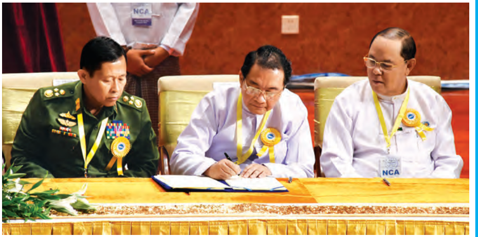
ပြည်ထောင်စုရှေ့နေချုပ် ဒေါက်တာထွန်းရှင် လက်မှတ်ရေးထိုးစဉ်။