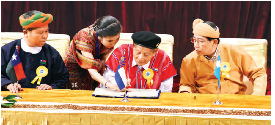
ကရင်အမျိုးသားလွတ်မြောက်ရေးတပ်မတော်ငြိမ်းချမ်းရေးကောင်စီ (KNU/KNLA-PC) ဥက္ကဋ္ဌ စောဌေးမောင် လက်မှတ်ရေးထိုးစဉ်။