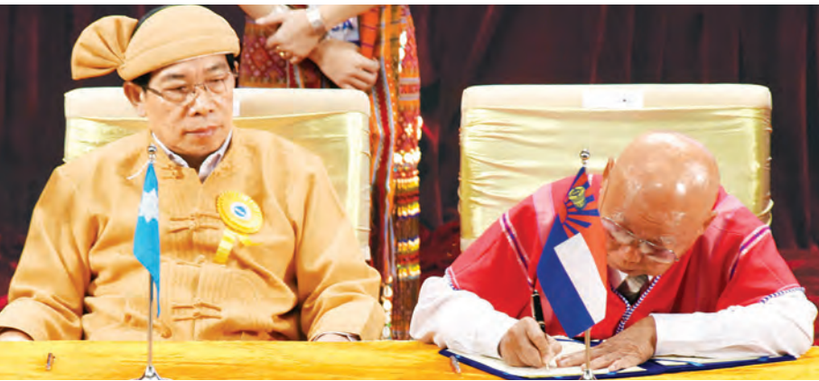
ကရင်အမျိုးသားအစည်းအရုံး (KNU) ဥက္ကဋ္ဌ စောမူတူးစေးဖိုး လက်မှတ်ရေးထိုးစဉ်။