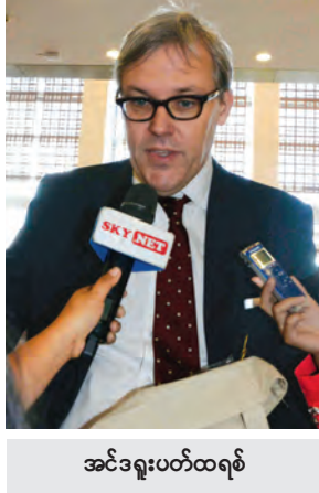
အင်ဒရူးပတ်ထရစ်