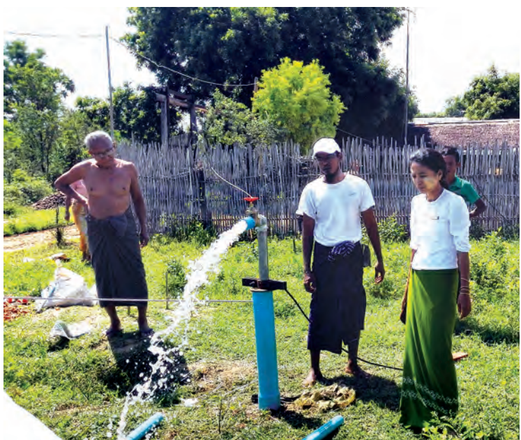
မြိုင်မြို့နယ်ကျေးလက်ဒေသ ဖွံ့ဖြိုးတိုးတက်ရေးဦးစီးဌာနရန်ပုံငွေဖြင့် တောင်ဘို့ကျေးရွာနေ ပြည်သူများကို သန့်ရှင်းသောသောက်သုံးရေ ဖူလုံစွာသုံးစွဲနိုင်ရေးအတွက် ဆောင်ရွက်သည့်လုပ်ငန်းကို အောက်တိုဘာလဒုတိယပတ်က တာဝန်ရှိသူများ ကွင်းဆင်းစစ်ဆေးစဉ်။ စိန်မြိုင် (မြိုင်)

မုံရွာခရိုင် အရာတော်မြို့နယ် သနပ်ခါးထုတ်လုပ်တင်ပို့ရောင်းချသူများအသင်းဖွဲ့စည်းတည်ထောင်ပြီး ပထမဦးဆုံးအကြိမ်အဆင့်မြင့် သနပ်ခါးကုန်ချောထုတ်လုပ်မှုအဆင့်ဆင့် နည်းပညာသင်တန်းကို အောက်တိုဘာ ၁၃ ရက်မှ စတင်၍ ငါးရက်ကြာ အရာတော်မြို့ရှိ အသင်းရုံး၌ ကျင်းပရန် စီစဉ်ထားကြောင်း သိရသည်။ “အရာတော်သနပ်ခါးကို ကုန်ကြမ်းအဖြစ် အလုံးအရင်းနဲ့နယ် အသီးသီးကိုတင်ပို့တာ အောင်မြင်နေပြီလို့ ပြောရင်ရပါပြီ။ အဲဒီအောင်မြင်နေတာကို ဆက်ပြီးသနပ်ခါးကို မိတ်ကပ် ပေါင်ဒါနဲ့လိမ်းခြယ်စရာ ကုန်ချောအဖြစ်ထုတ်လုပ်နိုင်၊ ထုတ်လုပ်တတ်ဖို့နည်းပညာ မျှဝေသင်ကြားပေးဖို့စီစဉ်နေကြတာပါ။ သိပ္ပံနည်းပညာဌာနက ပညာရှင်တွေလာရောက်သင်ကြားပြသနိုင်အောင် စစ်ကိုင်းတိုင်းဒေသကြီး ကုန်သွယ်မှုနှင့်တင်ပို့ရေးဌာန အကူအညီနဲ့ သင်တန်းကိုဖွင့်လှစ်မှာပါ။ အရာတော် သနပ်ခါးအသင်းဝင်တွေနဲ့အတူ စိတ်ပါဝင်စားတဲ့ဘယ်သူမဆို သင်တန်းတက်နိုင်အောင် စီစဉ်နေပါတယ်။ ရန်ကုန်က လာတက်မယ်သူတွေရှိနေတော့ တည်းခိုနေထိုင်စားသောက်ရေး လိုလေသေးမရှိအောင်အသင်းသူအသင်းသားတွေ ဝိုင်းဝန်းဆောင်ရွက်နေပါတယ်” ဟု အရာတော်သနပ်ခါးအသင်းဥက္ကဋ္ဌ ဦးကျော်မိုးထံမှ သိရသည်။ သင်တန်းတွင် သနပ်ခါးတုံးအဆင့်မှ အလှကုန်ပစ္စည်းအမယ်အမျိုးမျိုးထုတ်လုပ်နည်းသင်ကြားပေးရာတွင် သနပ်ခါးစတင်ခွဲစိတ်ဆေးမှုအဆင့်များအပါအဝင် ဈေးကွက်ဝင် ပါကင်ကုန်ချောရရှိသည့် စနစ်များကို အသေးစိတ်တတ်မြောက်အောင် သင်ကြားပေးမည် ဖြစ်ကြောင်း သိရသည်။ ထို့အပြင် သနပ်ခါးအလှကုန်ပစ္စည်းများအပြင် သနပ်ခါးအမြစ်ကိုအဓိကထား၍ ထုတ်လုပ်သော သနပ်ခါးဖြင့် တိုင်းရင်းဆေးကုန်ချောထုတ်လုပ်မှု အဆင့်ဆင့်ကိုပါ သင်ကြားပြသပေးသွားမည်ဖြစ်ကြောင်း သိရသည်။ မျိုးဝင်းထွန်း - မုံရွာ