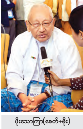
ဖိုးသောကြာ(ခေတ်+မိုး)