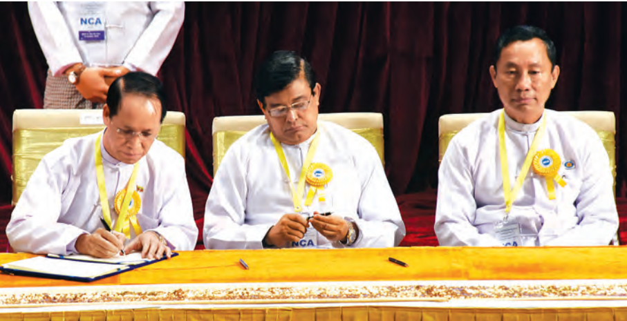
ဒုတိယသမ္မတ ဒေါက်တာစိုင်းမောက်ခမ်း လက်မှတ်ရေးထိုးစဉ်။

နိုင်ငံတော် သမ္မတ ဦးသိန်းစိန် တစ်နိုင်ငံလုံး ပစ်ခတ် တိုက်ခိုက်မှုရပ်စဲရေး သဘောတူစာချုပ် လက်မှတ် ရေးထိုးပွဲ အခမ်းအနားသို့ တက်ရောက်လာကြသူများအား ရင်းရင်းနှီးနှီး နှုတ်ဆက်စဉ်။ (သတင်းစဉ်)