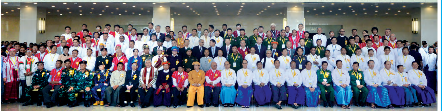
တစ်နိုင်ငံလုံး ပစ်ခတ်တိုက်ခိုက်မှုရပ်စဲရေး သဘောတူစာချုပ်လက်မှတ်ရေးထိုးပွဲအခမ်းအနားအပြီးတွင် နိုင်ငံတော်သမ္မတ ဦးသိန်းစိန်နှင့် တိုင်းရင်းသားခေါင်းဆောင်များ၊ တက်ရောက်လာကြသူများ မြန်မာ အပြည်ပြည်ဆိုင်ရာကွန်ဗင်းရှင်းဗဟိုဌာန-၂ (MICC-2) မြေညီထပ်ရှိ ဧည့်ခန်းမဆောင်၌ စုပေါင်းမှတ်တမ်းတင်ဓာတ်ပုံရိုက်စဉ်။ (သတင်းစဉ်)