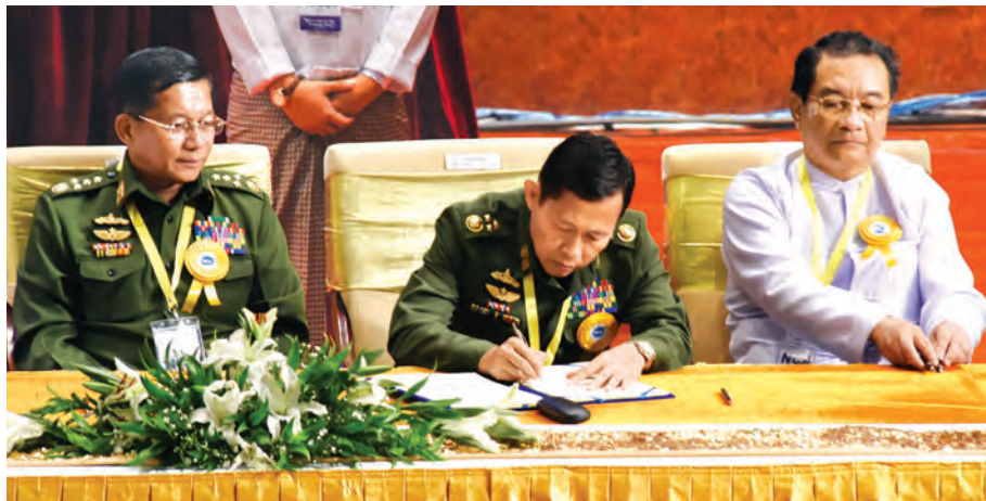
ဒုတိယတပ်မတော်ကာကွယ်ရေးဦးစီးချုပ် ကာကွယ်ရေးဦးစီးချုပ်(ကြည်း) ဒုတိယဗိုလ်ချုပ်မှူးကြီး စိုးဝင်း လက်မှတ်ရေးထိုးစဉ်။