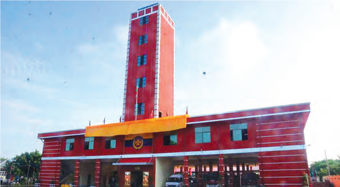
စစ်ကိုင်းတိုင်းဒေသကြီး မုံရွာမြို့ နန္ဒဝန်ရပ်ကွက်တွင် တိုင်းဒေသကြီးအစိုးရအဖွဲ့ ခွင့်ပြုရန်ပုံငွေဖြင့် ဆောက်လုပ်ပြီးစီးခဲ့သည့် တိုင်းဒေသကြီး မီးသတ်ဦးစီးဌာန ရုံးအဆောက်အအုံကို တွေ့ရစဉ်။ (အဆိုပါ အဆောက်အအုံသစ်ကို အောက်တိုဘာလဆန်းပိုင်းက စစ်ကိုင်းတိုင်းဒေသကြီး ဝန်ကြီးချုပ် ဦးသာအေး တက်ရောက် ဖွင့်လှစ်ပေးခဲ့သည်။) (တိုင်းဒေသကြီး ပြန်/ဆက်)