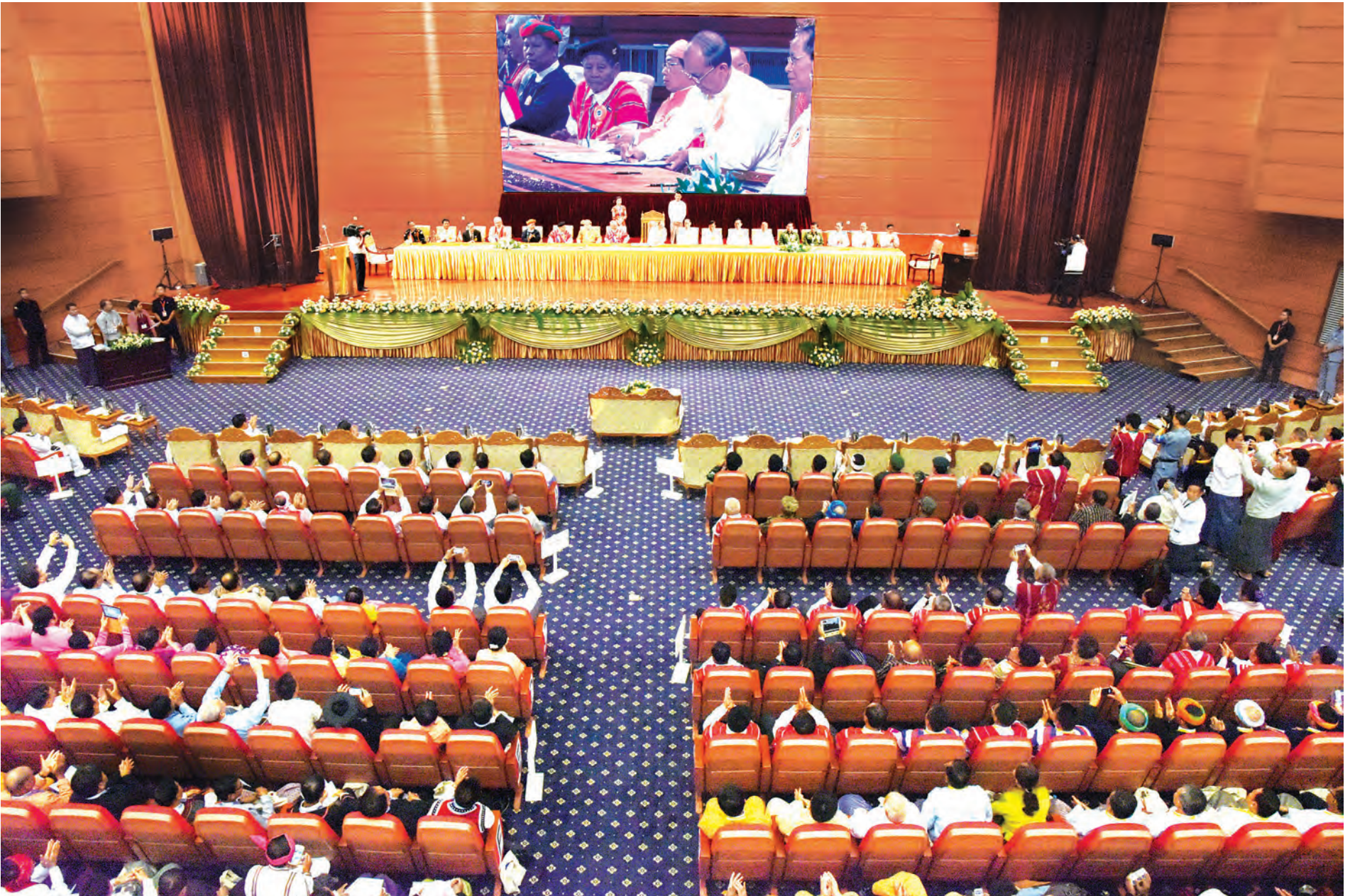
ကျွန်းမှ ထိုင်းနိုင်ငံတို့မှ အထူးကိုယ်စားလှယ်များ၊ နိုင်ငံခြား သံရုံးများမှ သံတမန်များ၊ ကုလသမဂ္ဂလက်အောက်ခံအဖွဲ့အစည်းများမှ တာဝန်ရှိသူများ၊ တစ်နိုင်ငံလုံးပစ်ခတ်တိုက်ခိုက်မှု ရပ်စဲရေးသဘောတူစာချုပ် လက်မှတ်ရေးထိုးပွဲ ကျင်းပရေး ပူးတွဲကော်မတီဝင်များ၊ နိုင်ငံရေးပါတီများမှ တာဝန်ရှိသူများ၊ ရုပ်ရှင်၊ ဂီတ၊ သဘင်တို့မှ ပညာရှင်များ၊ NGO / INGOs များ၊ အထူးဖိတ်ကြားထားသည့် ဧည့်သည်တော်များ တက်ရောက်ကြသည်။ အခမ်းအနားတွင် နိုင်ငံတော်သမ္မတ ဦးသိန်းစိန်က အမှာစကားပြောကြားသည်။ (နိုင်ငံတော်သမ္မတ၏ အမှာစကားကို ရှေ့တွင်ဖော်ပြထားပါသည်။)

ကျွန်းမှ သဘောတူစာချုပ်လက်မှတ်ရေးထိုးပွဲအခမ်းအနားသို့ နိုင်ငံတော်သမ္မတ ဦးသိန်းစိန်၊ ဒုတိယသမ္မတ ဒေါက်တာ စိုင်းမောက်ခမ်းနှင့် ဦးညွှန်ထွန်း၊ ပြည်သူ့လွှတ်တော်ဥက္ကဋ္ဌ သူရဦးရွှေမန်း၊ အမျိုးသားလွှတ်တော်ဥက္ကဋ္ဌ ဦးခင်အောင်မြင့်၊ ပြည်ထောင်စု တရားသူကြီးချုပ် ဦးထွန်းထွန်းဦး၊ တပ်မတော်ကာကွယ်ရေးဦးစီးချုပ် ဗိုလ်ချုပ်မှူးကြီးမင်းအောင်လှိုင်၊ ပြည်ထောင်စုရွေးကောက်ပွဲကော်မရှင် ဥက္ကဋ္ဌ ဦးတင်အေး၊ ဒုတိယတပ်မတော်ကာကွယ်ရေးဦးစီးချုပ် ကာကွယ်ရေးဦးစီးချုပ် (ကြည်း) ဒုတိယဗိုလ်ချုပ်မှူးကြီး စိုးဝင်း၊ ပြည်ထောင်စု ငြိမ်းချမ်းရေး ဖော်ဆောင်ရေးလုပ်ငန်းကော်မတီ ဒုတိယဥက္ကဋ္ဌ ပြည်ထောင်စုဝန်ကြီး ဦးအောင်မင်းနှင့် လွှတ်တော်ကိုယ်စားလှယ် ဦးသိန်းဇော်၊ ပြည်ထောင်စုဝန်ကြီးများ၊ ပြည်ထောင်စုရွေးချယ် ရှမ်းပြည်နယ်ဝန်ကြီးချုပ်၊ ကရင်ပြည်နယ် ခေတ္တဝန်ကြီးချုပ်၊ တပ်မတော်အရာရှိကြီးများ၊ ဒုတိယဝန်ကြီးများ၊ တိုင်းရင်းသားရေးရာဝန်ကြီးများ၊ လွှတ်တော်ကိုယ်စားလှယ်များ၊ တိုင်းရင်းသားလက်နက်ကိုင်အဖွဲ့ ခေါင်းဆောင်များနှင့် အဖွဲ့ဝင်များ၊ မြန်မာနိုင်ငံဆိုင်ရာ နိုင်ငံတကာအသိသက်သေအဖြစ် လက်မှတ်ရေးထိုးမည့် ကုလသမဂ္ဂအတွင်းရေးမှူးချုပ်၏ မြန်မာနိုင်ငံဆိုင်ရာ အထူးအကြံပေးပုဂ္ဂိုလ် မစ္စတာ ဝီဂျေ နမ်ဘီးယား၊ မြန်မာနိုင်ငံဆိုင်ရာ ဥရောပသမဂ္ဂ သံအမတ်ကြီး၊ တရုတ်ပြည်သူ့သမ္မတနိုင်ငံ၊ အိန္ဒိယသမ္မတနိုင်ငံနှင့်