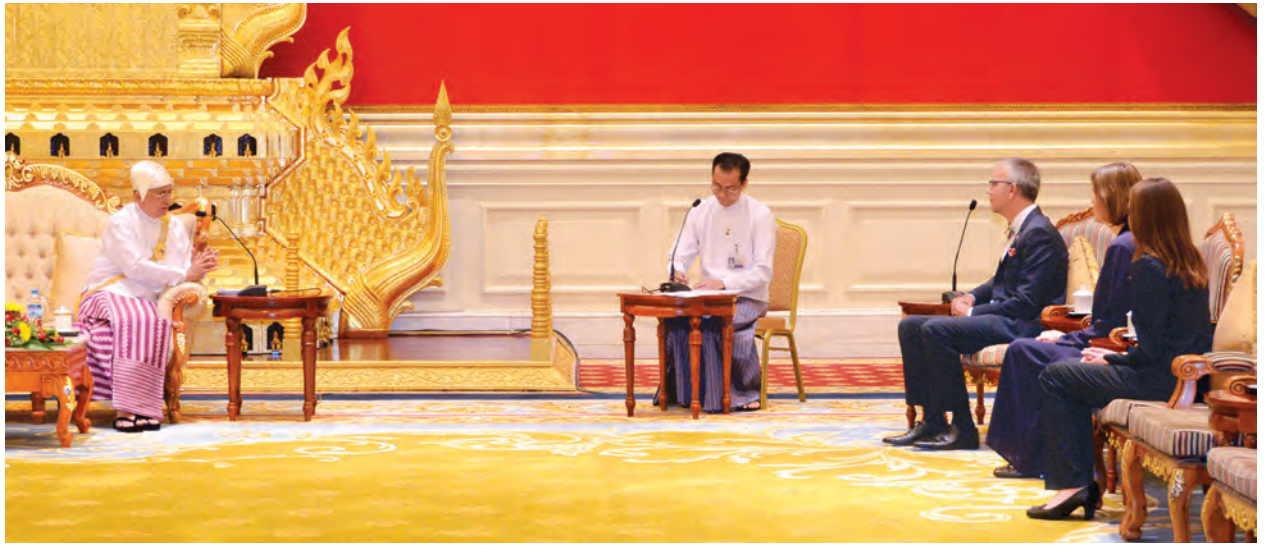
နိုင်ငံတော်သမ္မတ ဦးသိန်းစိန် ဆွစ်ဇာလန်နိုင်ငံ သံအမတ်ကြီး မစ္စတာ ပေါလ်အာဆီဂါအား လက်ခံတွေ့ဆုံစဉ်။ (သတင်းစဉ်)

ပြည်ထောင်စုသမ္မတ မြန်မာနိုင်ငံတော်အိုင်ရာ ဂါနာသမ္မတနိုင်ငံ သံအမတ်ကြီးအဖြစ် ခန့်အပ်ရန် သဘောတူညီပြီး ဖြစ်သော သံအမတ်ကြီး မစ္စတာ ဘင်ဂျမင် ကလီးမန်(တ်) အက်ဟန်သည် ယနေ့နံနက် ၁၁ နာရီတွင်လည်းကောင်း၊ ပြည်ထောင်စု သမ္မတ မြန်မာနိုင်ငံတော်အိုင်ရာ ဆွစ်ဇာလန်နိုင်ငံ သံအမတ်ကြီး အဖြစ် ခန့်အပ်ရန် သဘောတူညီပြီး