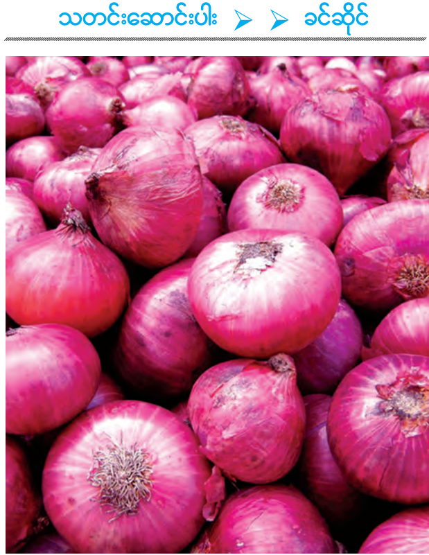
သတင်းဆောင်းပါး > > ခင်ဆိုင်

ပြီး ၂၀၁၃ ခုနှစ်တွင်လည်း ဇန်နဝါရီ ၁၄ ရက်နှင့် ၁၅ ရက် နှစ်ရက်အတွင်း ကြက်သွန်နီပိဿာချိန် ၁၀ သိန်းကျော် ဝင်ရောက်ခဲ့ကြောင်း သိရသည်။ ရန်ကုန် ကုန်စည်ဗိုလ်ဖွင့်ပုံမှန်အားဖြင့် တစ်ရက်လျှင် ကြက်သွန်နီပိဿာချိန် တစ်သိန်းငါးသောင်းဝန်းကျင် ပျမ်းမျှဝင်ရောက်လေ့ရှိသည်။ ထူးခြားမှုအဖြစ် ယခုနှစ် ဩဂုတ် ၂၂ ရက်တွင် ရန်ကုန်ဈေးကွက်သို့ ပိဿာချိန် ၁၈၀၀၀ သာ ဝင်ရောက်ပြီး ဩဂုတ် ၂၁ ရက်တွင်လည်း ပိဿာချိန် ၇၂၀၀၀ သာ ဝင်ရောက်ခဲ့သော်လည်း ဩဂုတ် ၂၂ ရက် ရန်ကုန်ဈေးကွက်ရှိ ကြက်သွန်နီဈေးနှုန်းမှာ ၅၂၅-၅၅၀-၈၅၀-၉၂၅ ကျပ်နှုန်းသာရှိခဲ့ပြီး ယခုအောက်တိုဘာ လဆန်းကဲ့သို့ ဈေးနှုန်းအလွန်မြင့်တက်မှု မရှိခဲ့သည်ကို တွေ့ရသည်။ ကြက်သွန်နီသည် ပြီးခဲ့သည့် လများအတွင်းဖြစ်ပွားခဲ့သော သဘာဝဘေးကြောင့် ထိခိုက်ပျက်စီးမှု အနည်းငယ်သာရှိခဲ့သော်လည်း ဈေးနှုန်းများမှာမူ အောက်တိုဘာလဆန်းမှစ၍ မကြာမီက မြင့်တက်လာခဲ့ခြင်းဖြစ်သည်။