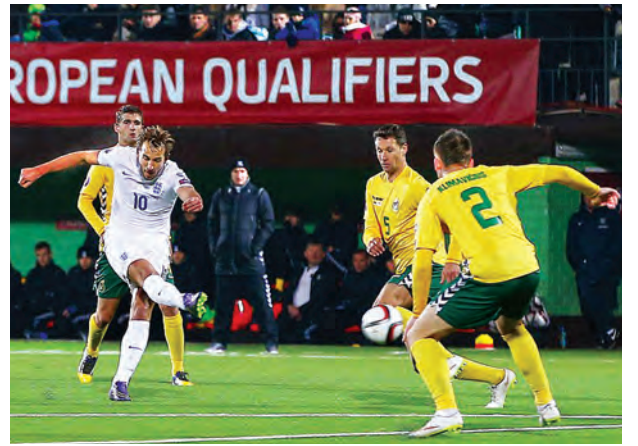
အင်္ဂလန်တိုက်စစ်မှူး ဟယ်ရီကန်း လစ်သူယေးနီးယားဘက်သို့ ဘောလုံး ကန်သွင်းစဉ်။

ပြန်ကြားရေးနှင့် ပြည်သူဆက်ဆံ ရေးဦးစီးဌာန ဒုတိယညွှန်ကြားရေး မှူးချုပ်၊ မြန်မာနိုင်ငံ စာနယ်လင်း ကောင်စီ (ယာယီ)၊ မြန်မာနိုင်ငံ သတင်းစာဆရာများအသင်း၊ မြန်မာ ဂျာနယ်လစ်တွန်ရက်တီမှ တာဝန်ရှိ သူများ၊ ပဲခူးတိုင်းဒေသကြီးအတွင်း ရှိ သတင်းမီဒီယာသမားများနှင့် တိုင်းဒေသကြီးအဆင့် ဌာနဆိုင်ရာ များ တက်ရောက်ကြသည်။ ယနေ့ ကျင်းပသည့် ပဲခူးတိုင်း ဒေသကြီး တိုင်းအဆင့် ဌာနဆိုင်ရာ များနှင့် သတင်းမီဒီယာသမားများ၏ မီဒီယာလုပ်ငန်းဆိုင်ရာ အလုပ်ရုံဆွေး နွေးပွဲကို ပဲခူးတိုင်းဒေသကြီးအတွင်း ပထမဆုံးအကြိမ် ကျင်းပခြင်းဖြစ် ကြောင်း၊ ပဲခူးတိုင်းဒေသကြီးတွင် ဟံသာဝတီတိုင်းဂျာနယ်၊ ပဲခူး သတင်းစဉ်ဂျာနယ်နှင့် ပဲခူးကဝိ ဂျာနယ်တို့ ထုတ်ဝေလျက်ရှိပြီး အွန်လိုင်းမီဒီယာတစ်ခုလည်း မကြာ ခင် ထုတ်လွှင့်သွားမည်ဖြစ်ကြောင်း သိရသည်။