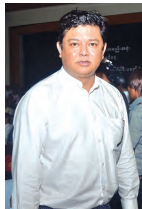
လွင်မိုး

“အရင်က သရုပ်ဆောင်ကြီးတွေ၊ အတွေ့အကြုံရင့် မင်းသားမင်းသမီး ကြီးတွေကို လာရောက်ဂါရဝပြုရတဲ့