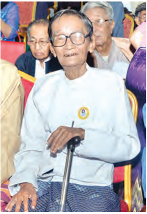
ဗိုလ်ကလေးတင့်အောင်

ရုပ်ရှင်လောက၏ အကယ်ဒမီ များရှင် ဗိုလ်ကလေးတင့်အောင်သည် အနုပညာလောက၏ ဝါရင့်အနုပညာ ရှင်ကြီးဖြစ်သလို အသက်အားဖြင့် လည်း ယနေ့ဆိုလျှင် ၉၄ နှစ် အတွင်းသို့ ရောက်ရှိနေပြီဖြစ်သည်။