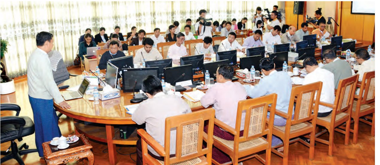
(သတင်းစဉ်)

ရေးဂျာနယ်နှင့် ကမ္ဘောဇတိုင်းဂျာနယ်တို့မှ အယ်ဒီတာချုပ်များနှင့် တာဝန်ခံ အယ်ဒီတာများက မီဒီယာလုပ်ငန်းများဆောင်ရွက်နေမှု၊ မျှော်မှန်းချက်နှင့် စိန်ခေါ်မှုများအပြင် တိုင်းရင်းသားမီဒီယာလုပ်ငန်းများ ဖွံ့ဖြိုးတိုးတက်ရေး အတွက် မူဘောင်တစ်ရပ် ထွက်ပေါ်လာရေး အကြံပြုဆွေးနွေးကြသည်။ တိုင်းရင်းသားမီဒီယာလုပ်ငန်းများ ဖွံ့ဖြိုးတိုးတက်ရေးအတွက် တိုင်းရင်းသားဘာသာနှင့် ထုတ်ဝေသည့် သတင်းစာ၊ ဂျာနယ်များဖွံ့ဖြိုးတိုးတက်လာစေရန် ဘဏ္ဍာရေးအရ အကူအညီပေးရေး၊ သတင်းအချက်အလက်ဖလှယ်ရေး တို့ကို ဆောင်ရွက်ရာတွင် လိုက်နာဆောင်ရွက်ရမည့် အခြေခံမူများ၊ စံနှုန်းများ သတ်မှတ်နိုင်ရန်ဖြစ်ကြောင်း သိရသည်။