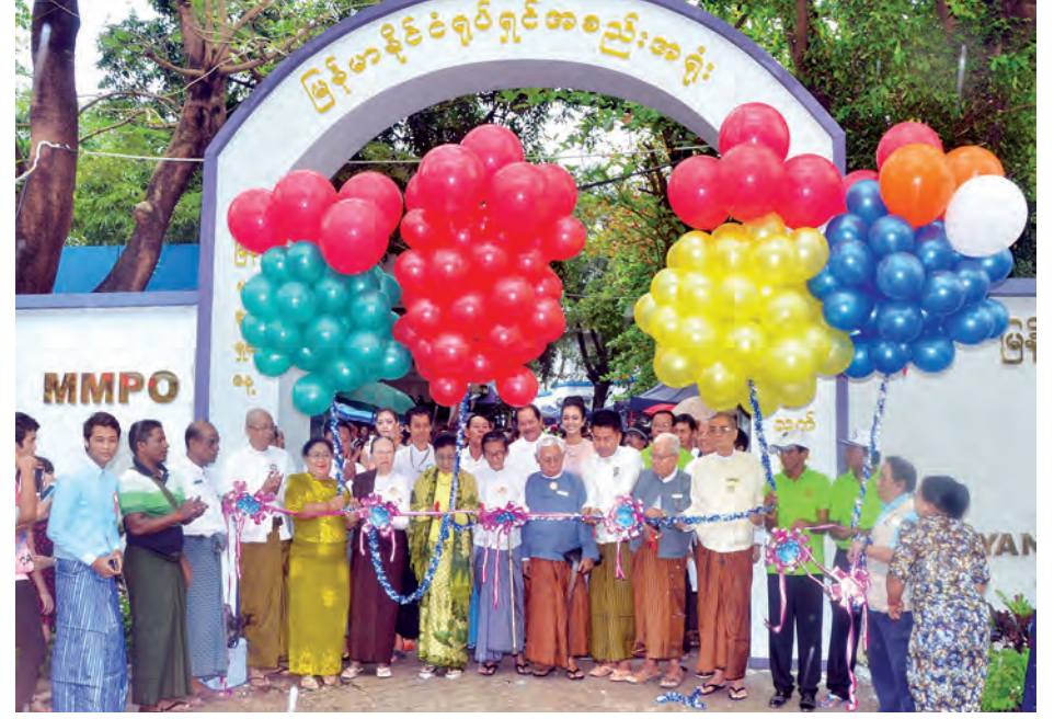
မြန်မာ့ရုပ်ရှင်နေ့နှင့် (၅၂) ကြိမ်မြောက် သက်ကြီးပုဂ္ဂိုလ်တွေအခမ်းအနား ဖွင့်လှစ်စဉ်။

အတွက် အလွန်ပဲဝမ်းသာပီတိ ဖြစ်မိ ပါတယ်။ အနုပညာလောကထဲဝင် ရောက်ပြီး ဒုတိယအကြိမ်မြောက်