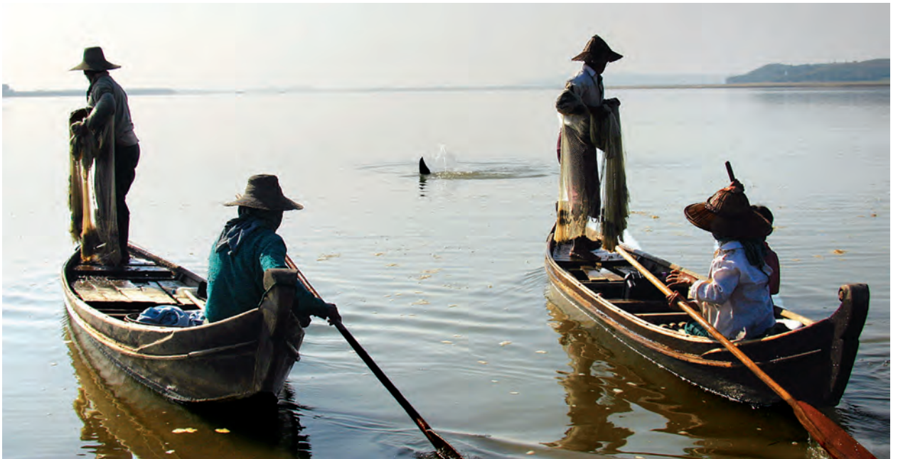
ရေလုပ်သားလှေအနီးမှ ရော့ပတ်လင်းပိုင်တစ်ကောင်။

လုပ်ငန်းဦးစီးဌာနနှင့် သားငှက်ထိန်း သိမ်းရေးအဖွဲ့တို့ ပူးပေါင်းကာ ရော့ပတ်လင်းပိုင် ထိန်းသိမ်းစောင့် ရှောက်ရေးဧရိယာ (Protected Area) သတ်မှတ်၍ တစ်လလျှင် နှစ်ကြိမ်နှင့် ရော့ပတ်လင်းပိုင်များ နေထိုင်ကျက်စားရာ မန္တလေးမြို့မှ ပန်းမော်မြို့အကြား ရော့ပတ်မြစ်ပိုင်း တွင် တစ်နှစ်လျှင် တစ်ကြိမ် ကွင်း ဆင်းလေ့လာသုတေသနပြု ဆောင် ရွက်လျက်ရှိသည်။