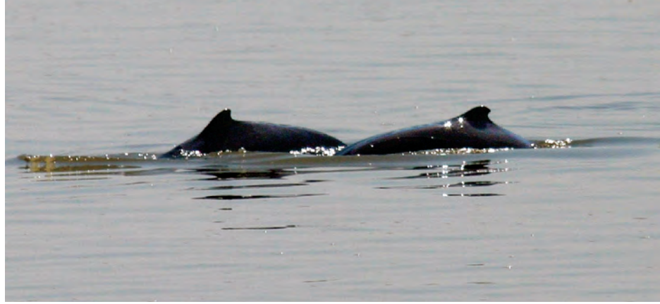
ရော့ပတ်မြစ်အတွင်းမှ လင်းပိုင်နှစ်ကောင်။

အရှေ့ဘက်ကမ်း)မှ စစ်ကိုင်းတိုင်း ဒေသကြီးမင်းကွန်းတောင်ရိုး၊ ဗောဓိ တစ်ထောင် ဘုရားအရှေ့ကမ်း (အနောက်ဘက်ကမ်း) မန္တလေးတိုင်း ဒေသကြီး မန္တလေးမြို့ နန်းတော် ကျွန်းရွာ (အရှေ့ဘက်ကမ်း) အထိ ရော့ပတ်မြစ်ပိုင်းဧရိယာကို ရော့ပတ် လင်းပိုင် ထိန်းသိမ်းစောင့်ရှောက်ရေး ဧရိယာအဖြစ် သတ်မှတ်ဆောင်ရွက် ခဲ့ခြင်း ဖြစ်သည်။