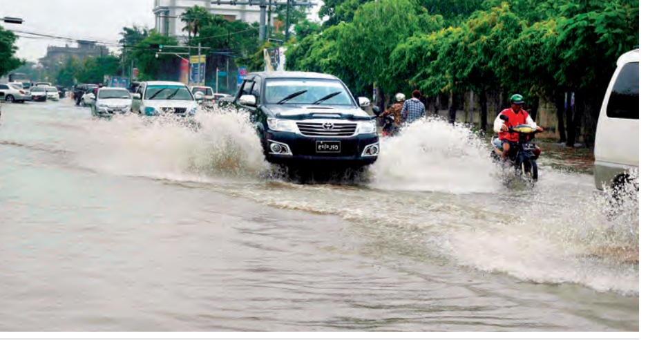
မိုးရွာသွန်းမှုကြောင့် မန္တလေးမြို့တွင်လမ်းပေါ် ရေလျှံနေမှုကို တွေ့ရစဉ်။