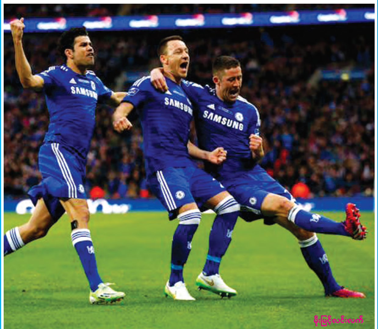
မိုးမြင့်လင်းလက်