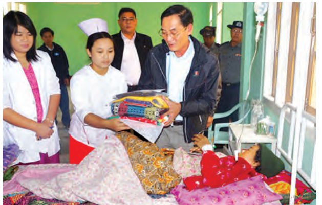
ဦးအား အထက(မော်ချီး)နှင့် လိုခါးလိုတိုက်နယ်ဆေးရုံများ၌ ပြောင်းရွှေ့ကာ ကယ်ဆယ်ရေးစခန်းများ ဖွင့်လှစ်ထားရှိသည်။

မော်ချီးဒေသ တောင်ပေါ်(၁၅)ရပ်ကွက်တွင် အိမ်ခြေ ၂၉ လုံး၊ ဇီးပင်ကွေ့ (၁၆)ကုန်းတွင် အိမ်ခြေ ၁၃ လုံး၊ ယုကောကော်တွင် အိမ်ခြေ ကိုးလုံး၊ စုစုပေါင်း ၅၁ လုံး ပြိုကျပျက်စီးခဲ့ပြီး အိမ်ထောင်စု ၉၈ စု လူဦးရေ ၃၆၉