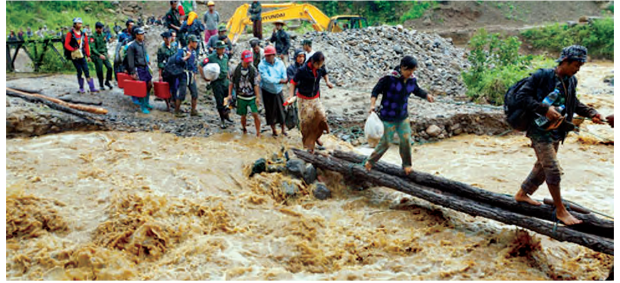
မော်ချီးဒေသအဝင် အမှတ်(၂)တံတား တောင်ကျချောင်းရေကြောင့် တံတားရေကျော်နေသဖြင့် ဒေသခံများ ခက်ခက်ခဲခဲ ချောင်းဖြတ်ကူးနေမှုကိုတွေ့ရစဉ်။

သဘာဝဘေးအန္တရာယ်ကြောင့် အခက်အခဲဖြစ်လျက်ရှိသည့် တိုင်းရင်းသားပြည်သူများအတွက် လိုအပ်လျက်ရှိသော စားသုံးကုန်ပစ္စည်းများ၊ လူသုံးကုန်ပစ္စည်းများ၊ အဝတ်အထည်များနှင့်ဆေးဝါးများကို နေ့စဉ် အချိန်နှင့်တစ်ပြေးညီ ပို့ဆောင်ပေးသွားရန် စီစဉ်ဆောင်ရွက်မည်ဖြစ်ကြောင်း ပြည်နယ်ဝန်ကြီးချုပ်က ပြောကြားသည်။ ထို့အတူ ကယ်ဆယ်ရေးပစ္စည်းများနှင့် သောက်ရေသန့်အပါအဝင် မော်ချီးဒေသတိုင်းရင်းသားပြည်သူများအတွက် လိုအပ်လျက်ရှိသော ပစ္စည်းမျိုးစုံကို ပြည်နယ်အစိုးရအဖွဲ့နှင့်အတူ တပ်မတော်သားများ၊ အဖွဲ့အစည်းများမှ အလှူရှင်များက ဆက်လက်ပို့ဆောင်ပေးလျက် ရှိကြောင်း သိရသည်။ (ခရိုင် ပြန်/ဆက်)