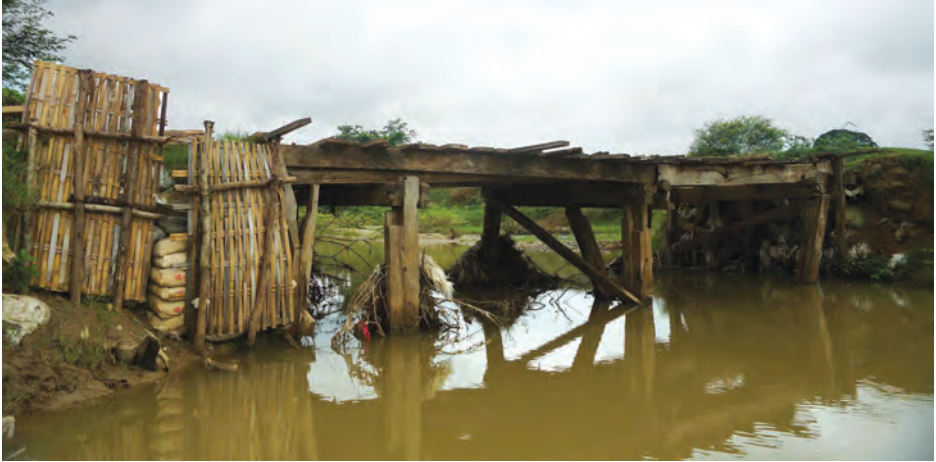
ယခင်ချောင်းကူးတံတားဟောင်းကို တွေ့ရစဉ်။

မိတ္ထီလာ အောက်တိုဘာ ၁၃ မန္တလေးတိုင်းဒေသကြီး မိတ္ထီလာ မြို့နယ် လက်ပံခါးကျောကျေးရွာ အနီးရှိ ကျေးရွာပေါင်း ၂၀ ကျော်မှ ဒေသခံများ ဖြတ်သန်းသွားလာ အသုံးပြုနေသည့် လက်ပံခါးကျော- ဂဠုန်ကုန်း ချောင်းကူးတံတားကို အသစ် ပြန်လည်ဆောက်လုပ်သွား မည်ဖြစ်ကြောင်း သိရသည်။ “ဒီရက်ပိုင်းအတွင်း တံတားသစ် ကို ၂၀၁၅-၂၀၁၆ ဘဏ္ဍာရေးနှစ် တိုင်းဒေသကြီးအစိုးရအဖွဲ့ ဒေသ