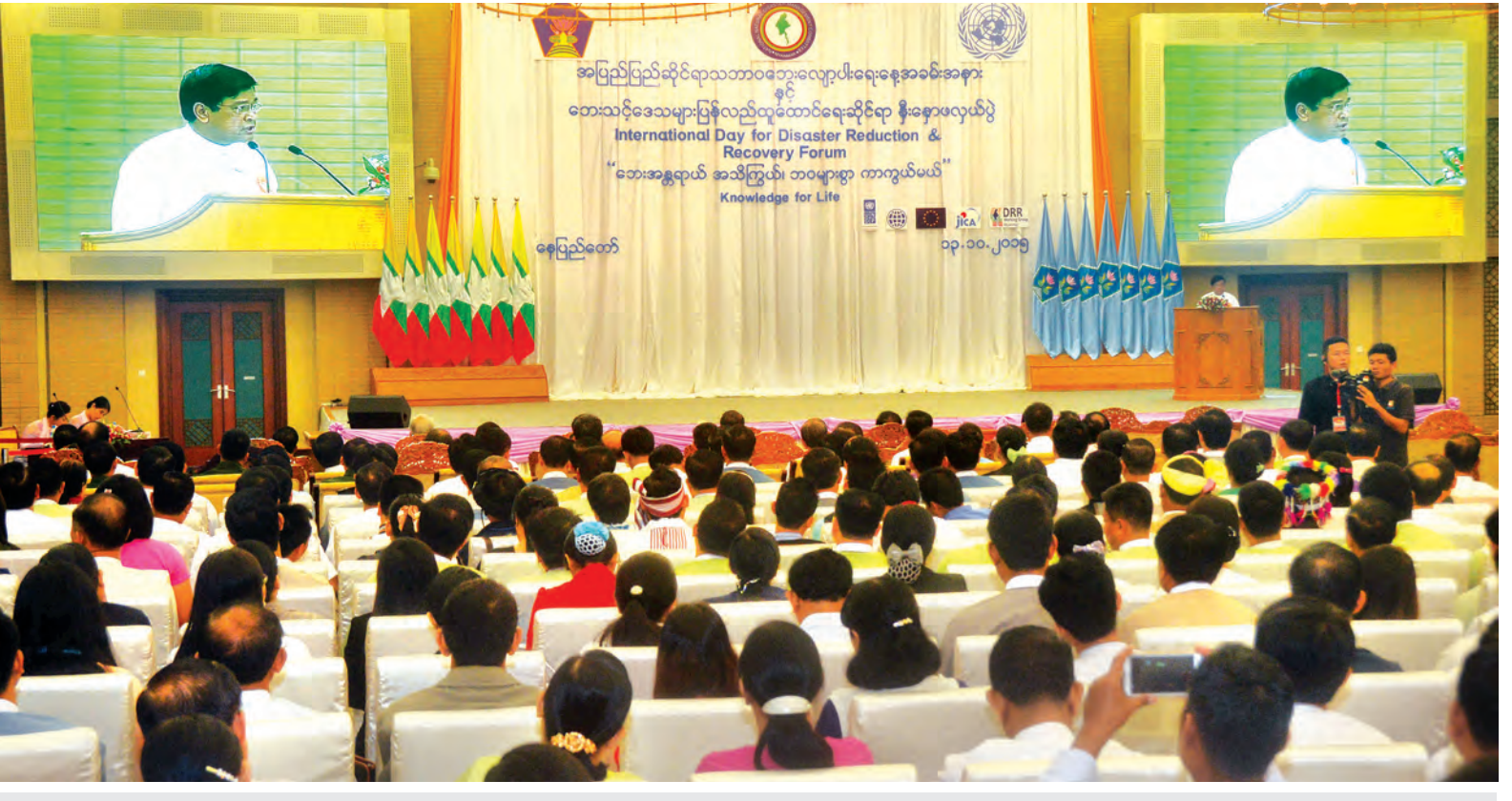
ဒုတိယသမ္မတ ဦးညွှန်ထွန်း အပြည်ပြည်ဆိုင်ရာ သဘာဝဘေးလျော့ပါးရေးနှင့် အခမ်းအနားနှင့် ဘေးသင့်ဒေသများ ပြန်လည်ထူထောင်ရေးဆိုင်ရာ နှီးနှောဖလှယ်ပွဲတွင် အမှာစကားပြောကြား စဉ်။ (သတင်းစဉ်)

ပြန်လည်ထူထောင်ရေး စီမံကိန်း အတွက် အရေးကြီးသည့် အချက်