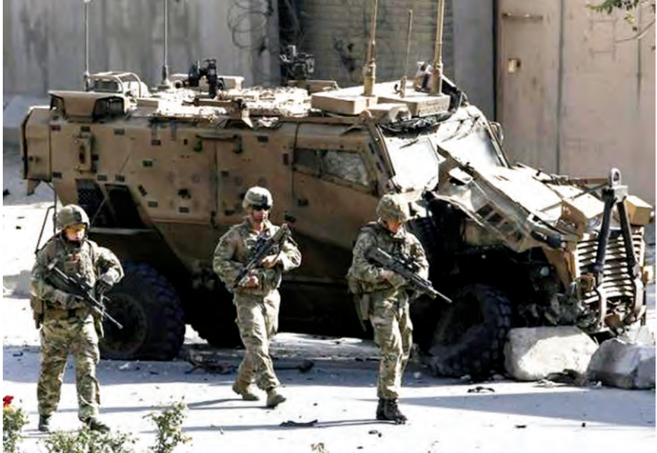
ပြောရေးဆိုခွင့်ရှိသူ ဗိုလ်မှူးကြီး ဘရိန်းထရိုင်းဘတ် က ကို ဖြုတ်ချရန် ကြိုးစားလျက်ရှိရာ တနင်္ဂနွေနေ့က တိုက်ခိုက်မှုသည် ယင်းတို့လက်ချက်ဖြစ်ကြောင်း တာလီဘန်တို့က ဆိုသည်။ (ရိုက်တာ)

ကဘူးလ် အောက်တိုဘာ ၁၁ အာဖဂန်နစ္စတန်မြို့တော် ကဘူးလ်တွင် တနင်္ဂနွေနေ့နံနက် ယာဉ်ကြောရှုပ်ထွေးနေချိန်တွင် အသေခံကား ပုံးခွဲသတ်ဦးက နိုင်ငံခြားတပ်များ ယာဉ်တန်းကို ပစ်မှတ်ထား ပုံးခွဲတိုက်ခိုက်ရာ သေဆုံးသူအရေအတွက် အတိအကျမသိရသေးသော်လည်း အများအပြား သေဆုံးခဲ့ကြောင်း ရိုက်တာသတင်းတစ်ရပ်တွင် ဖော်ပြ သည်။ ဩဂုတ်လတွင် ပုံးခွဲတိုက်ခိုက်မှုများ ဆက်တိုက် ပြုလုပ်ခဲ့ပြီးနောက် တာလီဘန်တို့က အဆိုပါ မြို့လယ် တိုက်ခိုက်မှုမှာ ၎င်းတို့လက်ချက်ဖြစ်ကြောင်း ထုတ်ဖော် ပြောဆိုလိုက်သည်။ အာဖဂန်လုံခြုံရေးတပ်များက ဂျိုင်ရှီယားလမ်းတွင် ပိတ်ဆို့ထားသည့်အပြင်ဘက်တွင် သံချပ်ကာကားများ ကို တွေ့ရကြောင်း ရုပ်မြင်သံကြားသတင်းတစ်ရပ်တွင် ဖော်ပြသည်။ “ဒီတိုက်ခိုက်မှုက နိုင်ငံခြားတပ်တွေရဲ့ ယာဉ်တန်း ကို ပစ်မှတ်ထားတိုက်ခိုက်တဲ့ အသေခံတိုက်ခိုက်မှု တစ်ရပ်ဖြစ်ပါတယ်” ဟု ပြည်ထဲရေးဝန်ကြီးဌာန ဒုတိယ ပြောရေးဆိုခွင့်ရှိသူ နာဂျင်ဒန်နစ်က ပြောသည်။ ယာဉ်တန်းများအနက် တစ်ခုသော ယာဉ်တန်းကို ပုံးခွဲတိုက်ခိုက်ခံရကြောင်း၊ ယခုအချိန်အထိ အသေ အပျောက် စာရင်းမသိရသေးကြောင်း အမေရိကန် ဦးဆောင်သော ညွန့်ပေါင်းစစ်ဘက်ထောက်ပံ့ရေးအဖွဲ့မှ