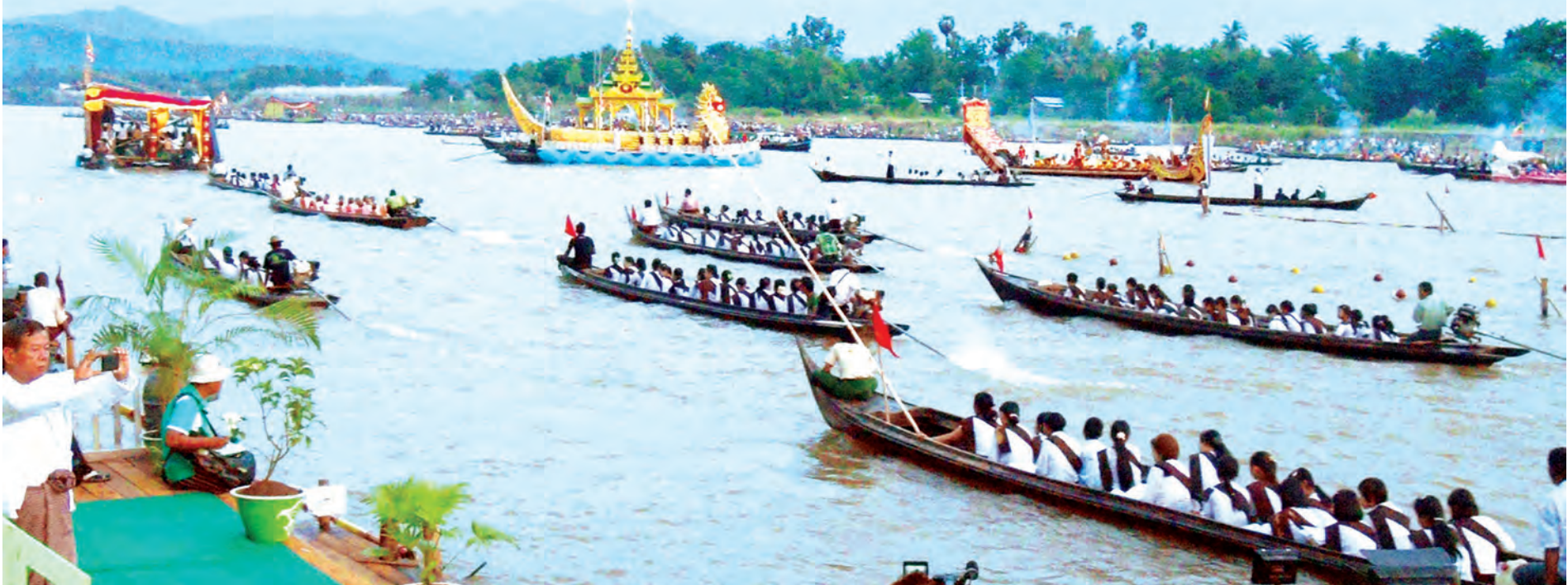
၂၀၁၄ ခုနှစ်က ရွှေကျင်မြို့ မီးမျှောပွဲတော်မြင်ကွင်းကို တွေ့ရစဉ်။

ရွှေကျင် အောက်တိုဘာ ၁၁ တစ်ဝါတွင်းလုံး မိုးသားတိမ်လိပ်တို့ဖြင့် အုံ့ဆိုင်းခဲ့သော ကောင်းကင်ကြီးကို ယခုအခါ အပြာ ရောင် နောက်ခံဖြင့် အချို့ရက်များတွင် ကြိုးကြားကြိုးကြား တွေ့မြင်စပြုနေပြီဖြစ်သည်။ ဤကား ဝါတွင်းကာလကုန်ဆုံး၍ သီတင်းကျွတ်ကာလသို့ ရောက်ရှိလာတော့မည့် လက္ခဏာပင်ဖြစ်သည်။ သီတင်းကျွတ်လပြည့်နေ့တွင် မြန်မာလူမျိုးတို့သည် ရိုးရာယဉ်ကျေးမှုအစဉ်အလာဖြစ်သော မီးထွန်း