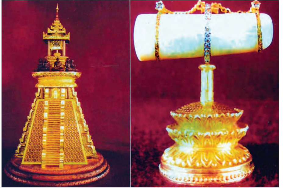
သီရိလင်္ကာနိုင်ငံ ကန္နိမြို့မှပင့်ဆောင်လာသော ပုဒ္ဒမြတ်စွယ်တော် (ကံသာယာ)

အဆိုပါခရီးစဉ်တွင် သီရိလင်္ကာနိုင်ငံရှိ ပုဒ္ဒမြတ်စွယ်တော်ကို ဖူးမြော်ပူဇော်ပြီး စွယ်တော်ပင့်ဆောင်ရာတွင် အသုံးပြုရန်အတွက် စွယ်စုံဆင်နွှဲစီးနှင့် လှူဖွယ်ဝတ္ထုများ လှူဒါန်းခဲ့သည်။ မြန်မာကိုယ်စားလှယ်အဖွဲ့နှင့် လိုက်ပါခဲ့သော မြန်မာနိုင်ငံကုန်သည်ကြီးများအသင်းနှင့် ထပ်မံလိုက်ပါသွားသော တမူးနယ်စပ်ကုန်သွယ်ရေးကုန်သည်များအသင်းတို့ ပူးပေါင်း၍ နှစ်နိုင်ငံကုန်သွယ်ရေး ကိစ္စရပ်များ ဆက်လက်ဆွေးနွေးခဲ့ကြသည်။