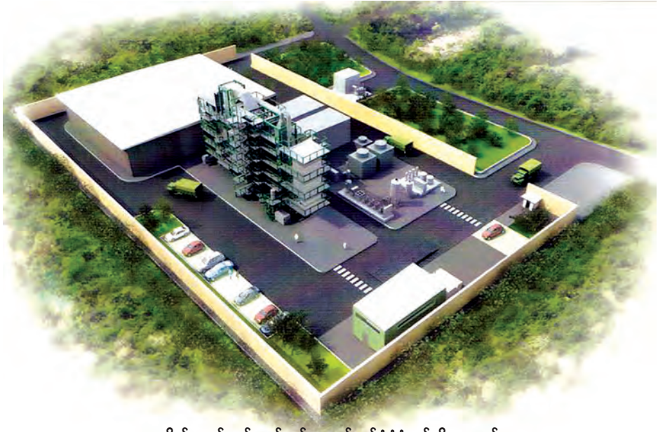
အမှိုက်မှ စွမ်းအင်ထုတ်လုပ်ပေးမည့်စက်ရုံပုံစံငယ်ကိုတွေ့ရစဉ်။

သတင်း-မောင်စိန်လွင် (မြန်မာ့အလင်း)