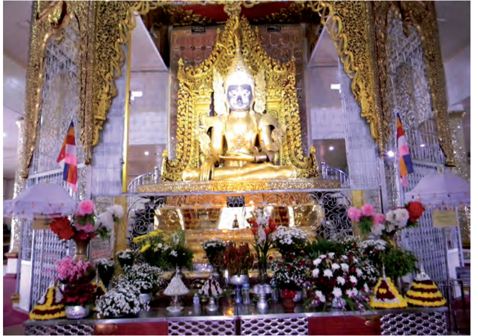
ပူဇော်ပွဲတော်ကြီးဖြစ်ကြောင်း သိရသည်။ ပွဲတော်ကာလအတွင်း ဖိုးချစ် ပွဲတော်ကာလအတွင်း ဖိုးချစ် ဇာတ်သဘင်ပွဲနှင့်အတူ ပျော်ပွဲရွှင်ပွဲများ၊ ဒေသထွက်ကုန်အရောင်းဆိုင်များ၊ အားကစားပြိုင်ပွဲများဖြင့် စည်ကားသိုက်မြိုက်စွာ ကျင်းပမည်ဖြစ်ကြောင်း သိရသည်။ သက်နိုင်(ပြင်ဦးလွင်)

ပြင်ဦးလွင် မဟာမုနိ(ဦးခန္တီ)ဘုရားကြီးကို ၁၂၇၉ ခုနှစ် မှစတင်၍ မန္တလေးမြို့ ရသေ့ကြီး ဦးခန္တီမှ ကြေးဝိသာချိန် ၂၀၀၀ ကျော်ဖြင့် တည်ထားကိုးကွယ်ခဲ့ပြီး ဒေသပတ်ဝန်းကျင်ရှိ ဘုရားဖူးများဖြင့် နေ့စဉ်စည်ကားလျက် ရှိနေသည်။ ယခုပြုလုပ်သည့် ဘုရားပွဲတော်ကြီးမှာ (၂၁)ကြိမ်မြောက် ဗုဒ္ဓ