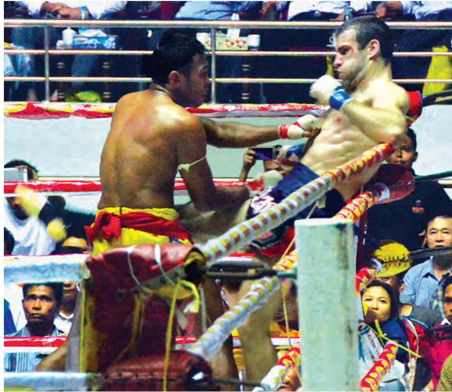
ထွန်းထွန်းမင်း၏ ဘယ်ထောက်လက်သီး ဒန်နီရယ်ဗိုကိုကို ထိုးမိစဉ်။

သတင်း-မောင်စိန်လွင်(မြန်မာ့အလင်း)