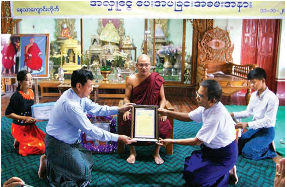
ပြည်ထောင်စုဝန်ကြီး ဦးရဲထွဋ် ကလေးမြို့ နေသာဘုန်းတော်ကြီးကျောင်းအတွင်းရှိ စာကြည့်တိုက်အတွက် အလှူငွေပေးအပ်လှူဒါန်းရာ စာကြည့်တိုက်တာဝန်ရှိသူက ဂုဏ်ပြုမှတ်တမ်းလွှာ ပြန်လည်ပေးအပ်စဉ်။

ကလေး အောက်တိုဘာ ၁၁ ဧည့်သည်နှင့် ဩဂုတ်လအတွင်း ရေကြီးနစ်မြုပ်ခဲ့သည့် ကလေးမြို့ နေသာ စာကြည့်တိုက်အတွက် နေသာ စာကြည့်တိုက်သို့ အလှူငွေ ပေးအပ် လှူဒါန်းပွဲကို အဆိုပါ ဘုန်းတော်ကြီး ကျောင်း၌ အောက်တိုဘာ ၁၁ ရက် နံနက် ၉ နာရီက ကျင်းပသည်။ အဆိုပါ လှူဒါန်းပွဲတွင် ပြန်ကြားရေးဝန်ကြီးဌာန ပြည်ထောင်စုဝန်ကြီး ဦးရဲထွဋ်က ပြည်ထောင်စုအစိုးရအဖွဲ့က လှူဒါန်းသည့် ငွေကျပ်သိန်း ၂၀၀ နှင့် ပြန်ကြားရေးဝန်ကြီးဌာနနှင့် ဆက်စပ်ဆောင်ရွက်လျက်ရှိသည့် ရုပ်သံလိုင်းများနှင့် FM Radio လိုင်းများ ပူးပေါင်းလှူဒါန်းငွေကျပ်သိန်း ၃၀၀ တို့ကို လှူဒါန်းသည်။ ဆက်လက်၍ သရုပ်စာကြည့်တိုက်မှူး ဦးရဲထွဋ်က ငွေကျပ်ငါးသိန်းကို လှူဒါန်းရာ စာကြည့်တိုက်အမှုဆောင်က လက်ခံယူပြီး ဂုဏ်ပြုမှတ်တမ်းလွှာ ပြန်လည်ပေးအပ်သည်။ ကလေးမြို့ နေသာဘုန်းတော်ကြီးကျောင်းအတွင်းရှိ “အားလုံးအတွက် နေသာစာကြည့်တိုက်”သည် အုန်းမောင်း စာကြည့်တိုက်အဖြစ် ၁၉၉၇ ခုနှစ်က စတင်ထူထောင်ခဲ့ခြင်းဖြစ်သည်။ နေသာဘုန်းတော်