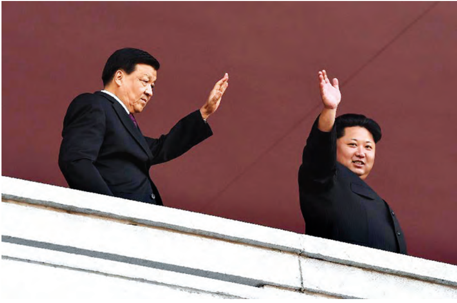
အဆိုပါ စစ်ရေးပြပွဲကို အချိန်နှစ်နာရီကြာ မရပ်မနား ချီတက်ခဲ့ကြရာ ထောင်ပေါင်းများစွာသော တပ်ဖွဲ့ဝင်များနှင့် အရပ်သားများ လည်း ပါဝင်သည်။ အဆိုပါ အခမ်းအနားသို့ ကမ္ဘာ့ခေါင်းဆောင်များ မတက်ရောက်သော်လည်း မြောက်ကိုရီးယားနိုင်ငံ၏ မဟာမိတ် တရုတ်နိုင်ငံမှ ထိပ်တန်းကွန်မြူနစ်ပါတီ တာဝန်ရှိသူတစ်ဦး တက်ရောက်ခဲ့သည်ဟု သိရသည်။ (ဆင်ဟွာ)

ပြုလမ်း အောက်တိုဘာ ၁၁ မြောက်ကိုရီးယား အနေဖြင့် အမေရိကန်တို့၏ မည်သည့်ကျူးကျော် ရန်စေမှုကိုမဆို ကာကွယ်နိုင်စွမ်းရှိကြောင်း မြောက်ကိုရီးယားခေါင်းဆောင် ကင်ဂျုံအန်းက ပြောဆိုလိုက်သည်။ အာဏာရ အလုပ်သမားပါတီ ထူထောင်သည့် နှစ် ၇၀ ပြည့်စစ်ရေးပြပွဲ အခမ်းအနားတွင် ကင်ဂျုံအန်းက အထက်ပါအတိုင်း ပြောဆိုလိုက်ခြင်း ဖြစ်သည်။ အနီရောင်နဖူးစည်းစာတန်းများနှင့်အတူ ချီတက်လာသည့် ထောင်ပေါင်းများစွာသော မြောက်ကိုရီးယား တပ်ဖွဲ့ဝင်များသည် မြို့တော်ရင်ပြင် ဆီသို့ ချီတက်လာကြသည်။ အဆိုပါ ရင်ပြင်ပေါ်တွင် စစ်လေယာဉ်အစင်း ၇၀ အထိ ပျံပစ်ခဲ့သည်။ တင့်ကားများနှင့် ခုံးကျည်တင်ဆောင်ထားသော စစ်ယာဉ်များက မဟူတာကင်ဂျုံအန်း မိန့်ခွန်းပြောကြားရာ ရင်ပြင်ဆီသို့ ချီတက်ခဲ့ကြသည်။