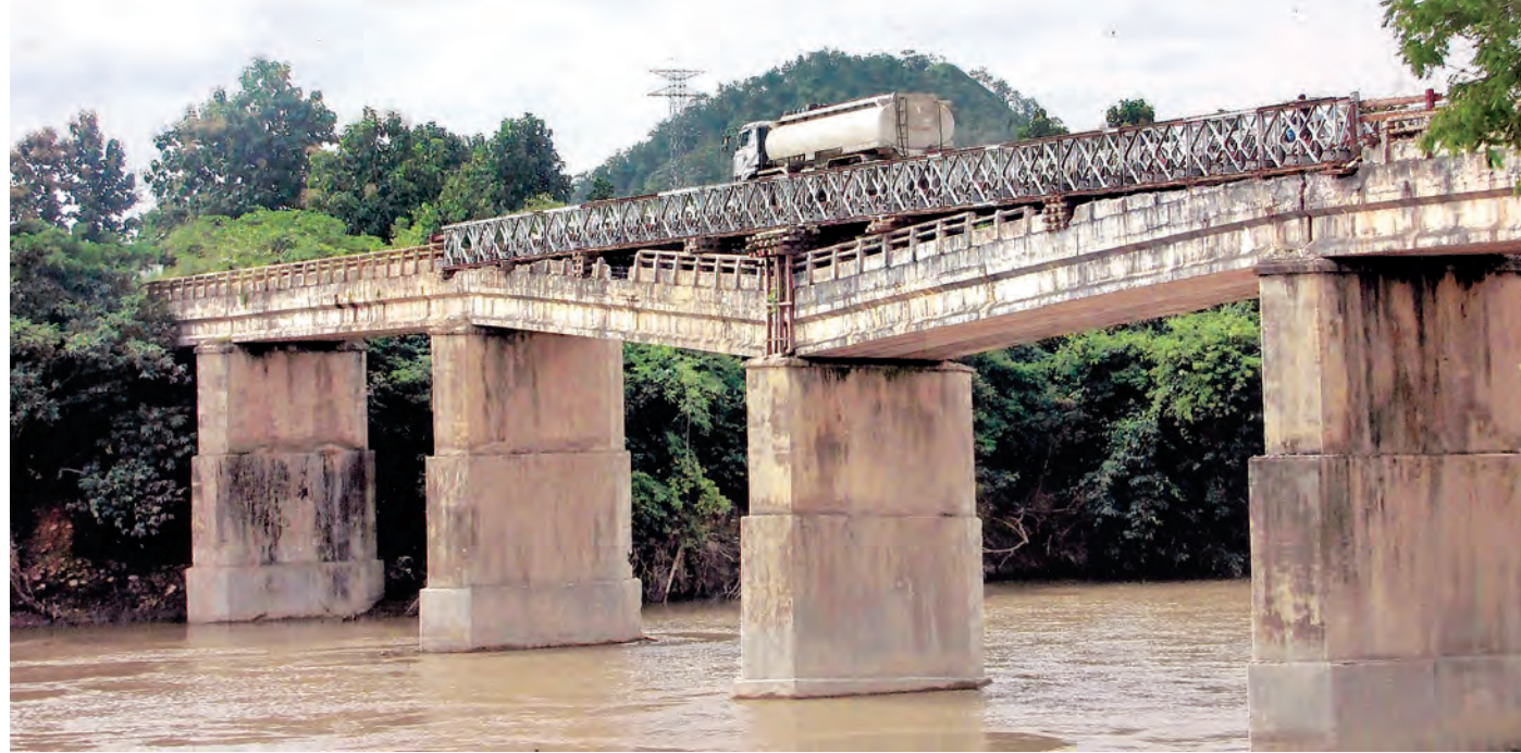
ဂန့်ဂေါ-ကလေးကားလမ်းပေါ်ရှိ ကမ္ဘာ့ဒီတံတား ရေလယ်တိုင်များ နိမ့်ကျသွားခဲ့သောကြောင့် ယာယီဘေလီတံတား ထိုးပေးခဲ့ရာ ကားများ ဖြတ်သန်းမောင်းနှင်နေစဉ်။

သတင်းဆောင်းပါး-ခရမ်းစိုးမြင့်