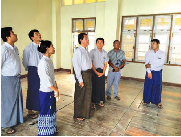
ခွဲခြမ်းဖြစ်ပြီး ၂၀၀၄ ခုနှစ် ဖေဖော်ဝါရီလတွင် ဖွင့်လှစ်ခဲ့ကြောင်း၊ ၂၀၀၄ ခုနှစ်တွင် လေပြင်းတိုက်ခတ်မှုကြောင့် အမှီးများလန့်၍ ပျက်စီးမှုများဖြစ်ပေါ်ခဲ့သဖြင့် သံလွင်မဟာကုမ္ပဏီက အမှီးနှင့်မျက်နှာကြက်များကို ပြန်လည်ပြုပြင်ဆောက်လုပ်ခဲ့ခြင်းဖြစ်ကြောင်း သိရသည်။ ထိုကဲ့သို့ ပျက်စီးမှုများအပေါ် မန္တလေးတိုင်းဒေသကြီးအစိုးရအဖွဲ့၏

အဆိုပါကျောင်းဆောင်ကို ၂၀၀၃ ခုနှစ်က ဒေသကုမ္ပဏီမှ ဆောက်လုပ်