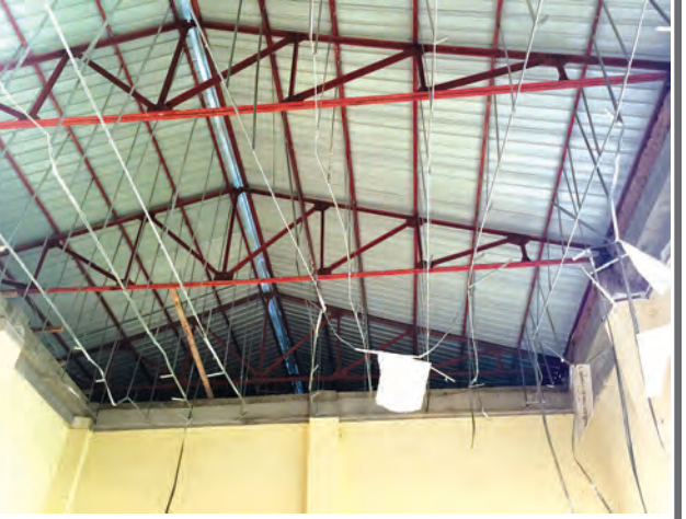
ကြီးကြပ်မှုဖြင့် သံလွင်မဟာကုမ္ပဏီမှ အမြန်ပြန်လည်ပြုပြင်ရန် အောက်တိုဘာ ၁၂ ရက်မှစ၍ ဆောင်ရွက်သွားမည်ဖြစ်ပြီး အခြားအခန်းမျက်နှာကြက်များကိုလည်းစစ်ဆေး၍ လိုအပ်သလို ပြုပြင်ပေးသွားမည်ဖြစ်ကာ ပျက်စီးဆုံးရှုံးခဲ့သည့် ကွန်ပျူတာ ၂၀ လုံးနှင့် စားပွဲတစ်လုံးတို့ကိုလည်း လျှော့ဒါန်းသွားမည်ဖြစ်ကြောင်း သိရသည်။ (တိုင်းဒေသကြီး ပြန်/ဆက်)