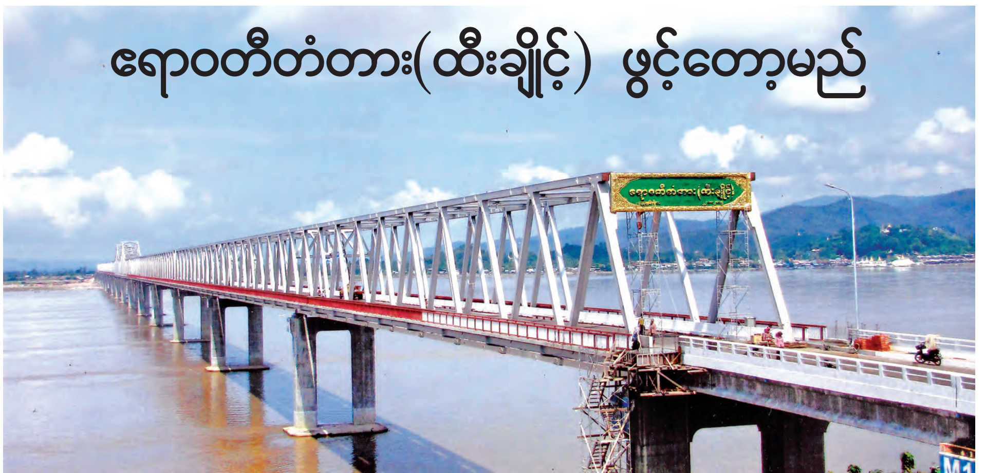
မကြာမီ ဖွင့်လှစ်တော့မည့် ရောဝတီတံတား(ထီးချိုင့်)ကိုတွေ့ရစဉ်။

■ သတင်း-ခရမ်းစိုးမြင့်