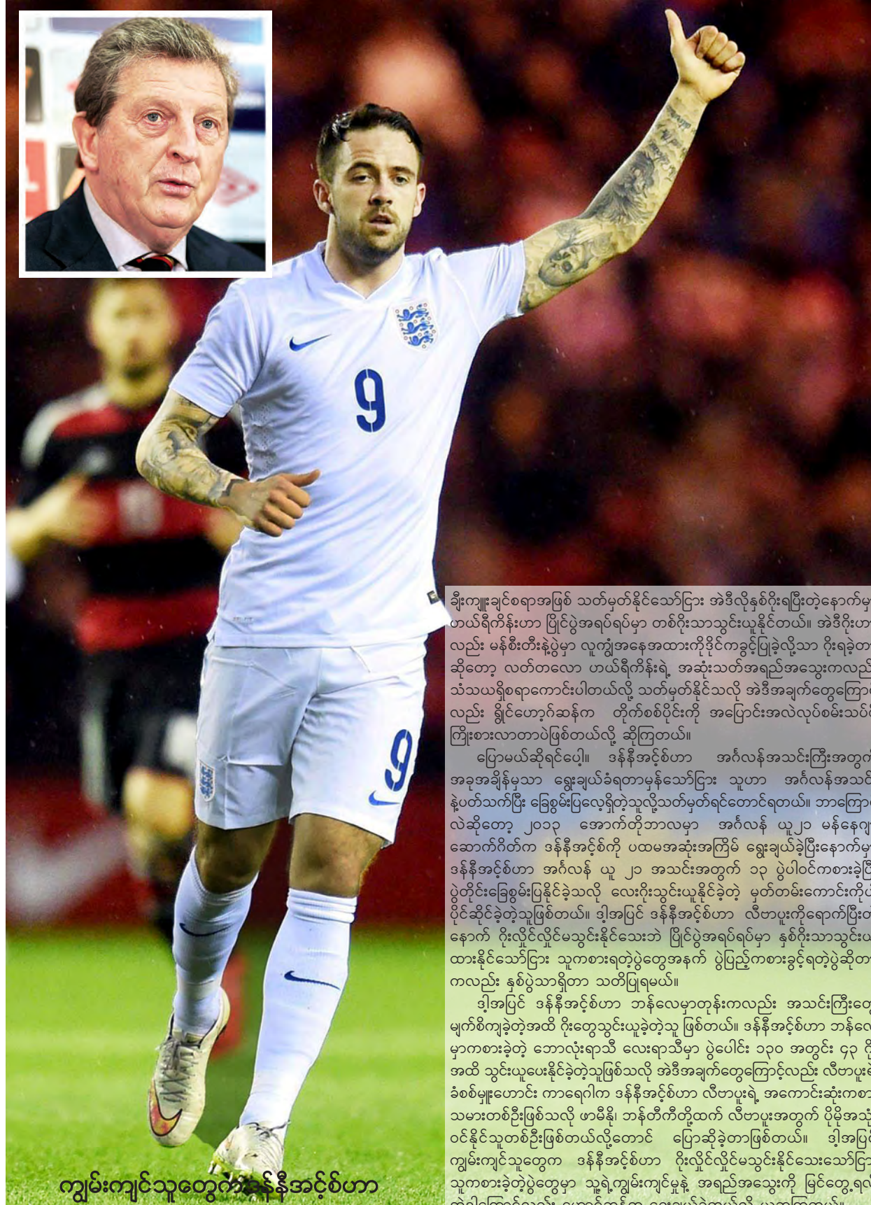
ကျွမ်းကျင်သူတွေက ဒန်နီအင်္ဂ်စ်ဟာ ဂိုးလှိုင်လှိုင်မသွင်းနိုင်သေးသော်ငြား သူကစားခဲ့တဲ့ပွဲတွေမှာ သူ့ရဲ့ကျွမ်းကျင်မှုနဲ့ အရည်အသွေးကို မြင်တွေ့ရလို့ အဲဒါကြောင့်လည်း ဟော့ဂ်ဆန်က ရွေးချယ်ခဲ့တယ်လို့ ယူဆ

အထူးသဖြင့်ပေါ့။ စတားရစ်၊ ဘီရာဟိုနို၊ လမ်းဘတ်တို့ကို မရွေးဘဲ ဒန်နီ အင်္ဂ်စ်ကို ရွေးချယ်ခြင်းဟာ ရွှင်ဟော့ဂ်ဆန်အနေနဲ့ အင်္ဂလန်ရဲ့တိုက်စစ်အင်အား ကို စမ်းသပ်ခြင်းရယ်လို့ ခေါင်းစဉ်တပ်ကြတယ်။ ပြောရရင် အင်္ဂလန်ဟာ ဒီခြေစစ်ပွဲတစ်လျှောက် တိုက်စစ်ပိုင်းအခက်အခဲနဲ့ မကြုံတွေ့ခဲ့ဘူးဆိုတာ မှန်တယ်။ အကိမ်တိုးနီးယားကို အဝေးကွင်းမှာ တစ်ဂိုးတည်းနဲ့နိုင်ခဲ့တဲ့ပွဲက လွဲလို့ ကျန်ပွဲတွေမှာ ဆွစ်ဇာလန်ကို အိမ်ကွင်းမှာ နှစ်ဂိုး၊ အဝေးကွင်းမှာ နှစ်ဂိုး၊ ဆန်မာရီနိုကို အိမ်ကွင်းမှာ ငါးဂိုး၊ အဝေးကွင်းမှာ ခြောက်ဂိုး၊ သလိုဗေးနီး