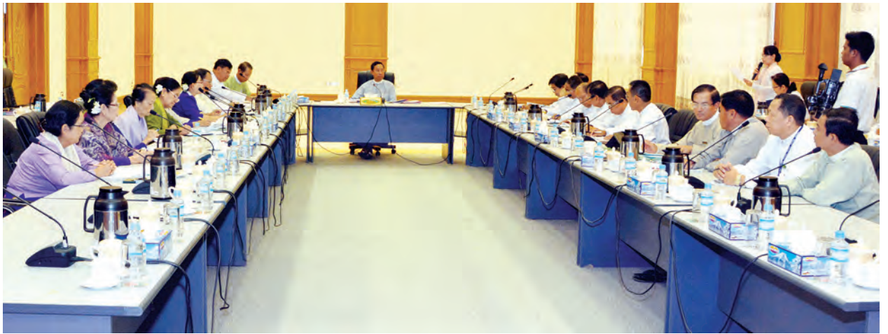
အဆိုပါအစည်းအဝေးသို့ ပြည်သူ့လွှတ်တော်ဥက္ကဋ္ဌ၊ ဒုတိယဥက္ကဋ္ဌ၊ ဥပဒေရေးရာနှင့် အထူးကိစ္စရပ်များ လေ့လာဆန်းစစ်သုံးသပ်ရေးကော်မရှင် အဖွဲ့ဝင်များ၊ ပြည်ထောင်စုလွှတ်တော်ရုံးနှင့် ပြည်သူ့လွှတ်တော်ရုံးတို့မှ တာဝန်ရှိသူများ တက်ရောက်ကြသည်။ (သတင်းစဉ်)

တင်ပြချက်များအပေါ် ပြည်သူ့လွှတ်တော်ဥက္ကဋ္ဌက ပြန်လည်သုံးသပ်ဆွေးနွေးပြီး နိဂုံးချုပ်ပြောကြားသည်။