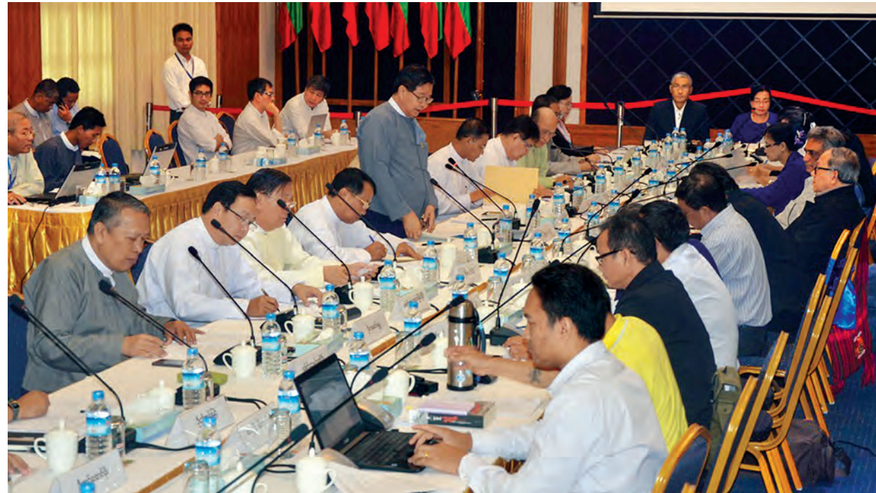
ပြည်ထောင်စုငြိမ်းချမ်းရေးဖော်ဆောင်ရေးလုပ်ငန်းကော်မတီ (UPWC) နှင့် တိုင်းရင်းသားလက်နက်ကိုင်အဖွဲ့အစည်းများ (EAOs) တို့အကြား NCA လက်မှတ်ရေးထိုးနိုင်ရေးအတွက် ဒုတိယအကြိမ် အကြံပြုညှိနှိုင်းအစည်းအဝေးတွင် ပြည်ထောင်စုဝန်ကြီး ဦးအောင်မင်း နှုတ်ခွန်းဆက်စကား ပြောကြားစဉ်။