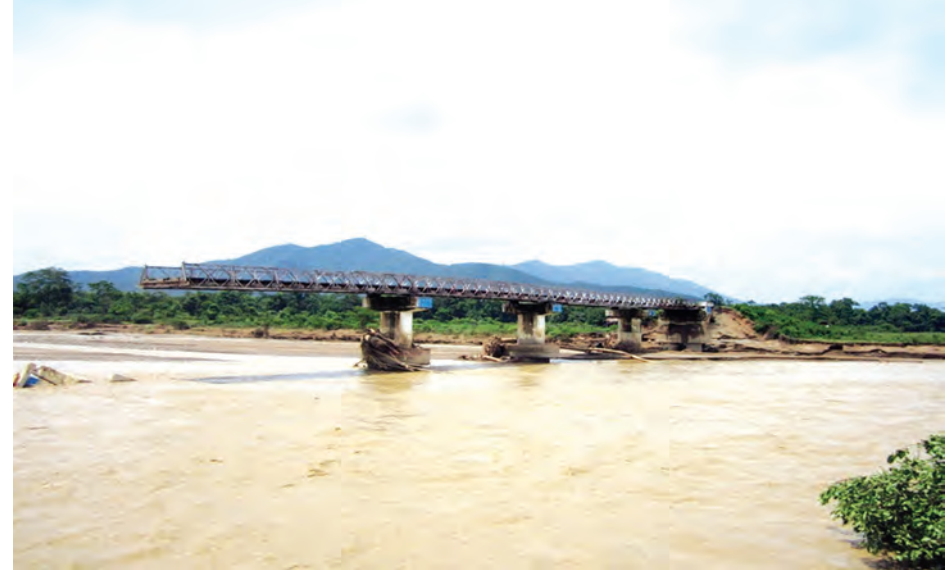
ရခိုင်ပြည်နယ် မိုင် ၂၀/၀-၂၀/ ၁ ကြား တံတားအမှတ်(၁/၂၁) နန်းသလက်ဘေလီတံတား ပေ ၂၁၀ ဘေလီတံတားပြုတ်ပါသွားသည်ကို တွေ့ရစဉ်။ (ဆောက်လုပ်ရေး)