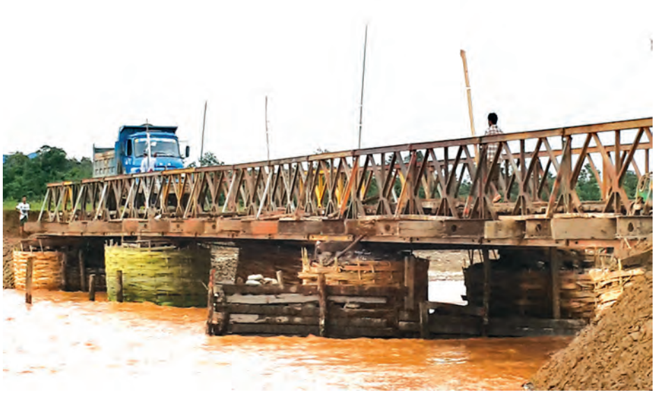
ရခိုင်ပြည်နယ် မိုင် ၂၀/၀-၂၀/ ၁ ကြား နန်းသလက်တံတား(၁/၂၁) ဆောင်ရွက်ပြီးစီး၍ ယာဉ်များ ဖြတ်သန်းနေသည်ကို တွေ့ရစဉ်။ (ဆောက်လုပ်ရေး)