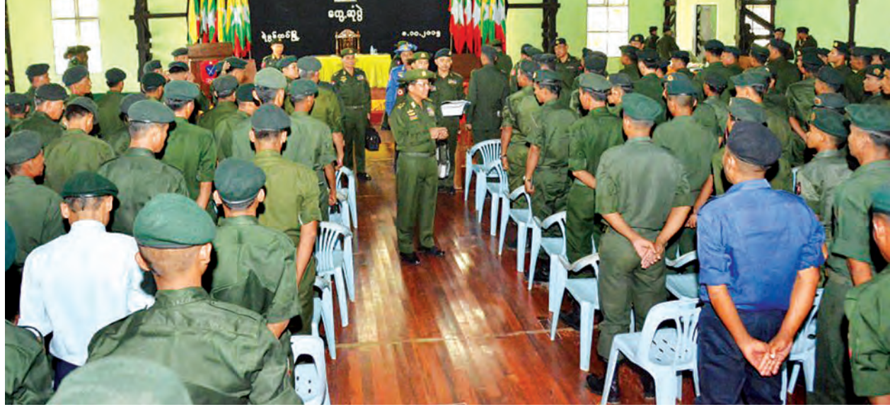
တပ်မတော်ကာကွယ်ရေးဦးစီးချုပ် ဗိုလ်ချုပ်မှူးကြီး မင်းအောင်လှိုင် ရဲမြန်တပ်နယ်ရှိ အရာရှိ၊ စစ်သည်များနှင့် သင်တန်းသားများအား ရင်းရင်းနှီးနှီးနုတ်ဆက်စဉ်။ (မြဝတီ)

တစ်ဦးချင်း စွမ်းရည်ရှိသူများဖြစ်အောင် လုပ်ဆောင်ရန်နှင့် မိမိတပ်ကို စွမ်းရည်ရှိအောင် လုပ်ဆောင်ရန်၊ ထိုသို့တပ်များကောင်းမွန်မှု ပေါင်းစပ်ခြင်းဖြင့် တပ်မတော်ကို ကောင်းအောင်လုပ်ဆောင်ကြရမည်ဖြစ်ကြောင်း၊ တပ်မတော်ကောင်းခြင်း၊ ခိုင်မာခြင်းသည် နိုင်ငံတော်၏စွမ်းရည်ကောင်းမွန်ခိုင်မာစေမည်ဖြစ်ကြောင်း တပ်မတော်ကာကွယ်ရေးဦးစီးချုပ် ဗိုလ်ချုပ်မှူးကြီး မင်းအောင်လှိုင်က ရဲမြန်တပ်နယ်ရှိ အရာရှိ၊ စစ်သည်များနှင့် သင်တန်းသားများအား တွေ့ဆုံစဉ် ထည့်သွင်းပြောကြားသည်။