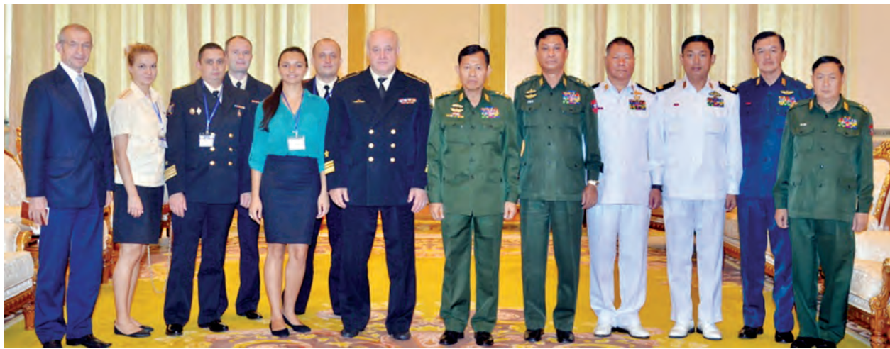
ဒုတိယတပ်မတော်ကာကွယ်ရေးဦးစီးချုပ် ကာကွယ်ရေးဦးစီးချုပ်(ကြည်း) ဒုတိယဗိုလ်ချုပ်မှူးကြီးစိုးဝင်းနှင့် တပ်မတော်အရာရှိကြီးများ၊ ရုရှားဖက်ဒရေရှင်း ရေတပ်မတော်မှ Vice Admiral OLEG V.BURTSEV ဦးဆောင်သောကွယ်စားလှယ်အဖွဲ့ စုပေါင်းမှတ်တမ်းတင် ဓာတ်ပုံရိုက်စဉ်။