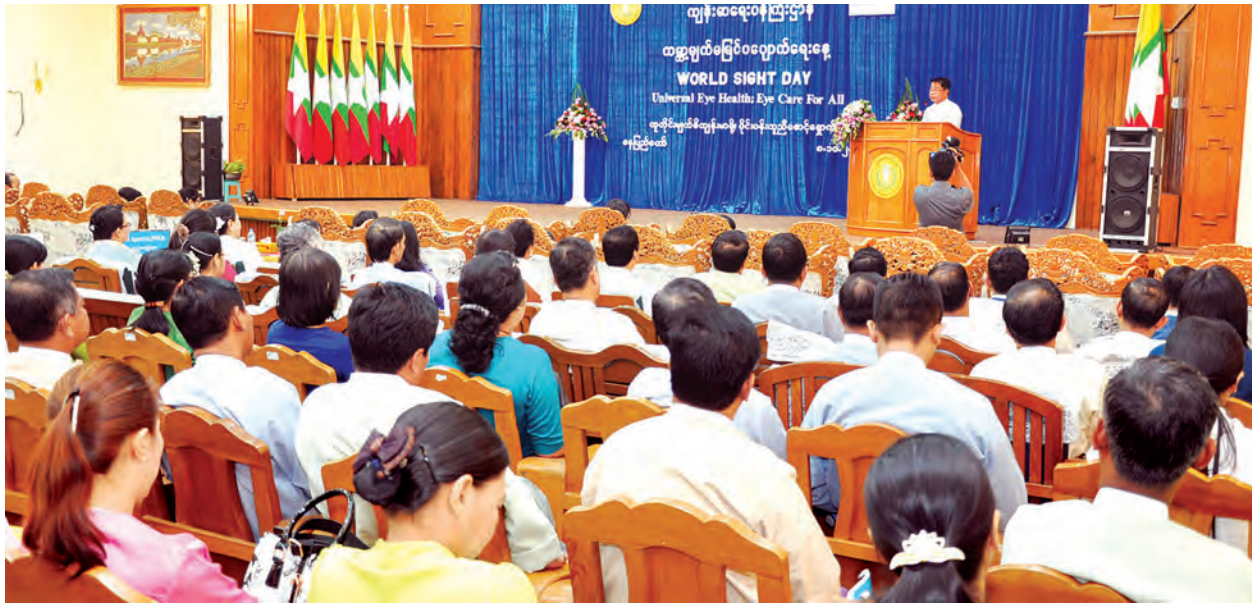
နေပြည်တော် အောက်တိုဘာ ၈

၂၀၁၅ခုနှစ် ကမ္ဘာ့မျက်စိမမြင် ပပျောက်ရေးနေ့အထိမ်းအမှတ်အခမ်းအနားကို နေပြည်တော်ကျန်းမာရေးဝန်ကြီးဌာန အစည်းအဝေးခန်းမ၌ ယနေ့နံနက် ၉ နာရီ၌ကျင်းပရာ ကျန်းမာရေးဝန်ကြီးဌာနပြည်ထောင်စုဝန်ကြီး ဒေါက်တာ သန်းအောင် တက်ရောက်၍ အဖွင့်အမှာစကားပြောကြားသည်။ (အပေါ်ပုံ)