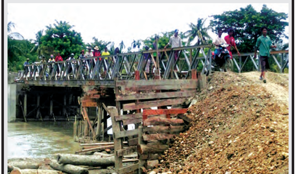
ဂန့်ဂေါ-ကလေးလမ်း မိုင်(၇၈/၃-၇၈/၄)ကြားရှိ ဇင်းကလင်း(၃/၇၉) မူလ ပေ ၁၁၀ မှ ချဉ်းကပ်လမ်းရေတိုက်စားသွားသည့်အပိုင်းကို ပေ ၁၀၀ ဘေးလီတံတား ထပ်ထိုးတည်ဆောက်ခြင်းလုပ်ငန်းဆောင်ရွက် ပြီးစီး၍ ယာဉ်များ ဖြတ်သန်းသွားလာနေသည်ကို တွေ့ရစဉ်။ (ဆောက်လုပ်ရေး)