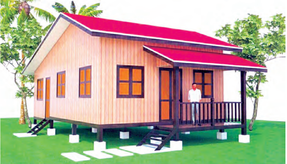
တန်ဖိုးသင့်အိမ်ပုံစံ (၅၄၀ စတုရန်းပေ)