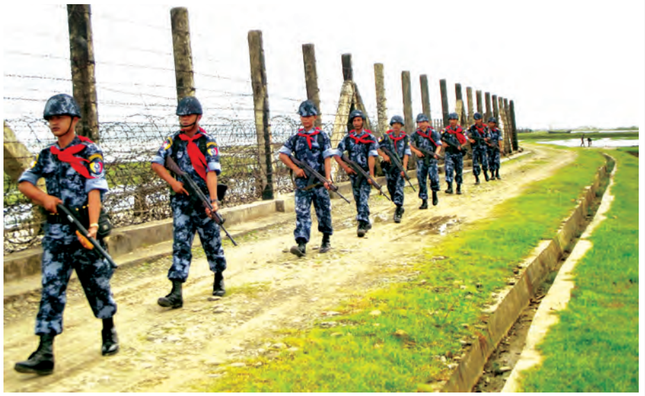
နိုင်ငံတော်လုံခြုံရေးအတွက် နယ်စပ်ခြံစည်းရိုးတစ်လျှောက် ကင်းလှည့်နေသည့် မြန်မာနိုင်ငံရဲတပ်ဖွဲ့ဝင်များ ကို တွေ့ရစဉ်။