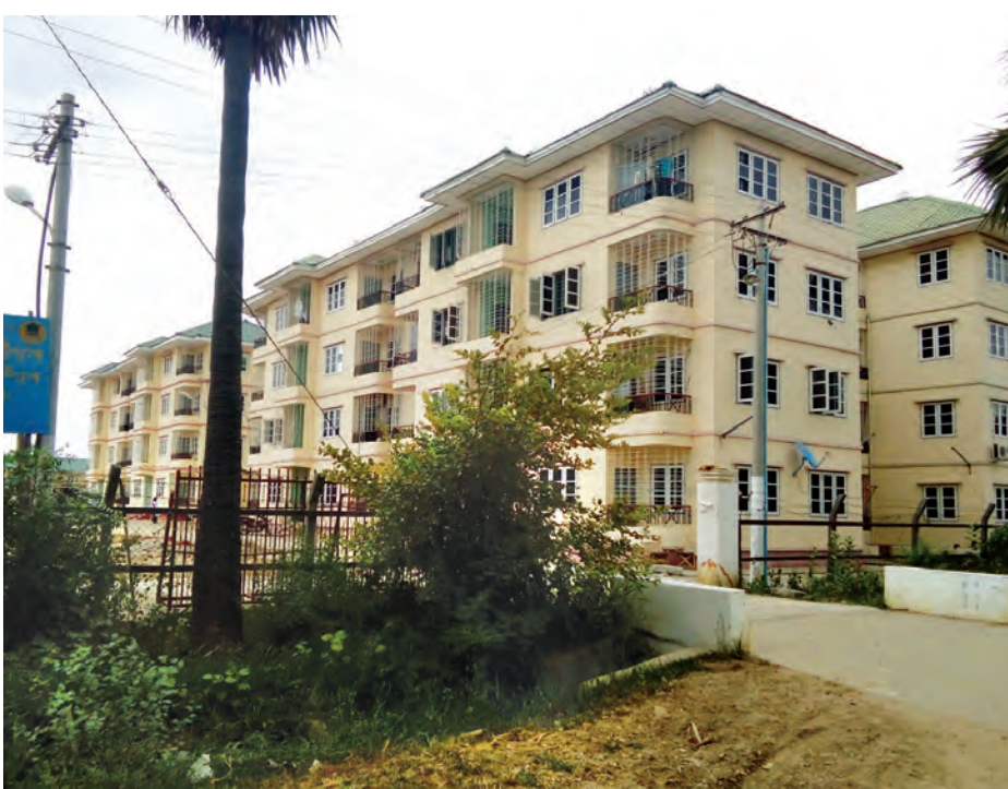
မုံရွာမြို့နေ ဝန်ထမ်းများအတွက် အငှားချပေးထားသော နန္ဒဝန်အိမ်ရာကို တွေ့ရစဉ်။