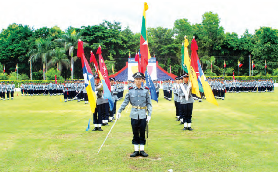
နိုင်ငံတော်နှင့် ပြည်သူများ၏ အသက်အိုးအိမ်စည်းစိမ်လုံခြုံရေးအတွက် ကာကွယ်စောင့်ရှောက်ပေးမည့် ရဲတပ်ဖွဲ့ဝင်များ မွေးထုတ်ပေးရာ မြန်မာနိုင်ငံရဲတပ်ဖွဲ့ သင်တန်းဆင်းအခမ်းအနားတစ်ခုကို တွေ့ရစဉ်။