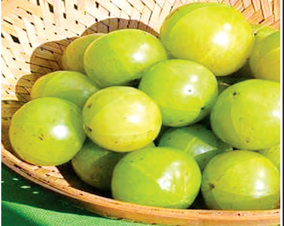
မြင့်ထွန်းမင်း(ကောလင်း)

မြန်မာတို့၏ ထမင်းခိုင်းတွင် ဆီးဖြူသီးကို အစိမ်းတို၍ လည်း ကောင်း၊ သနပ်လုပ်၍လည်းကောင်း နှစ်သက်စွာ စားလေ့ရှိကြသည်။ ဆီးဖြူသီးသည် တို့စရာအဖြစ် သာမက ဆေးဖက်ဝင်လည်း များစွာဝင် သည်။ ဆီးဖြူပင်သည် ပေသုံးဆယ်ခန့် မြင့်ပြီး ရွက်ကြောပင်လတ်မျိုးဖြစ် သည်။ ကိုင်းများဖြာပြီး ပင်စည်တွင် အညိုရောင် အဖွေးအခေါက်ရှိသည်။ အရွက်မှာရွက်လွှဲထွက်ပြီး အပွင့်မှာ စိမ်းဝါရောင်ရှိ၍ အဆုပ်လိုက်ပွင့် သည်။ အသီးမှာ ပြောင်ချော၍ အဝါနုရောင်ရှိသည်။ အသားထူပြီး ခေါင်လိုက် အမြောင်းမြောင်း မြောင့်၊ အစေ့တစ်စေ့သာပါရှိကာ သဘာဝအလျောက် ပေါက်ရောက် သည်။ အထူးသဖြင့် မြန်မာနိုင်ငံ အထက်ပိုင်းဒေသ သမအအေးပိုင်း များတွင် အမြောက်အမြားပေါက် ရောက်သည်။ ဆီးဖြူသီးသည် ချဉ်၊ ချို၊ ဖန်၊