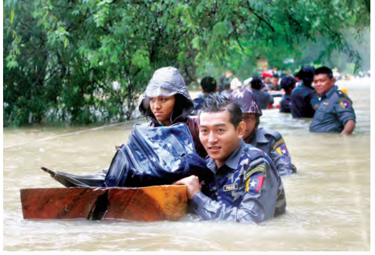
ကရင်ပြည်နယ်(အပေါ်ပုံ)နှင့်ပဲခူးတိုင်းဒေသကြီးအတွင်း(အောက်ပုံ)မိုးသည်းထန်စွာ ရွာသွန်းမှုကြောင့် ရေကြီးရေလျှံမှုဖြစ်ပွားရာ ပြည်သူများဘေးအန္တရာယ်ကင်းရေးအတွက် ကူညီဆောင်ရွက်ပေးသည့် မြန်မာနိုင်ငံရဲတပ်ဖွဲ့ဝင်များ။