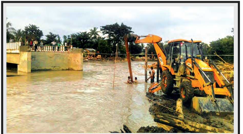
ဂန့်ဂေါ-ကလေးလမ်း မိုင်(၇၈/၃-၇၈/၄)ကြားရှိ ဇင်းကလင်းတံတား မူလ ပေ ၁၁၀ မှ ချဉ်းကပ်လမ်းပြတ်ပါသွားသည်ကို တွေ့ရစဉ်။ (ဆောက်လုပ်ရေး)