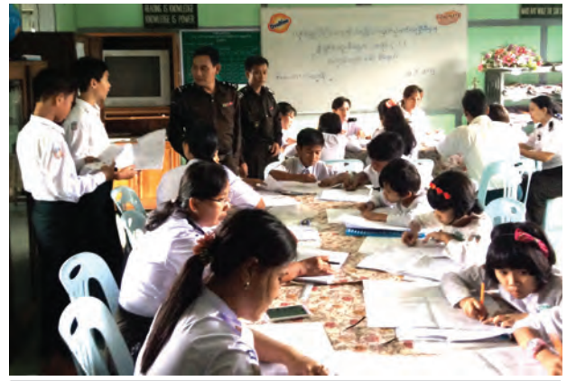
ရန်ကုန် အနောက်ပိုင်းခရိုင် ဗဟန်းမြို့နယ် မွေစေတီလမ်းရှိ အမှတ် (၁) အထက်တန်းကျောင်းတွင်အသက် ၁၀နှစ်ပြည့် ကျောင်းသား ကျောင်းသူ များကို စက်တင်ဘာလစတုတ္ထပတ်က မိုးပွင့်အထူးစီမံချက် အပိုင်း-၂ ဖြင့် ကွင်းဆင်းဆောင်ရွက်ပေးစဉ်။