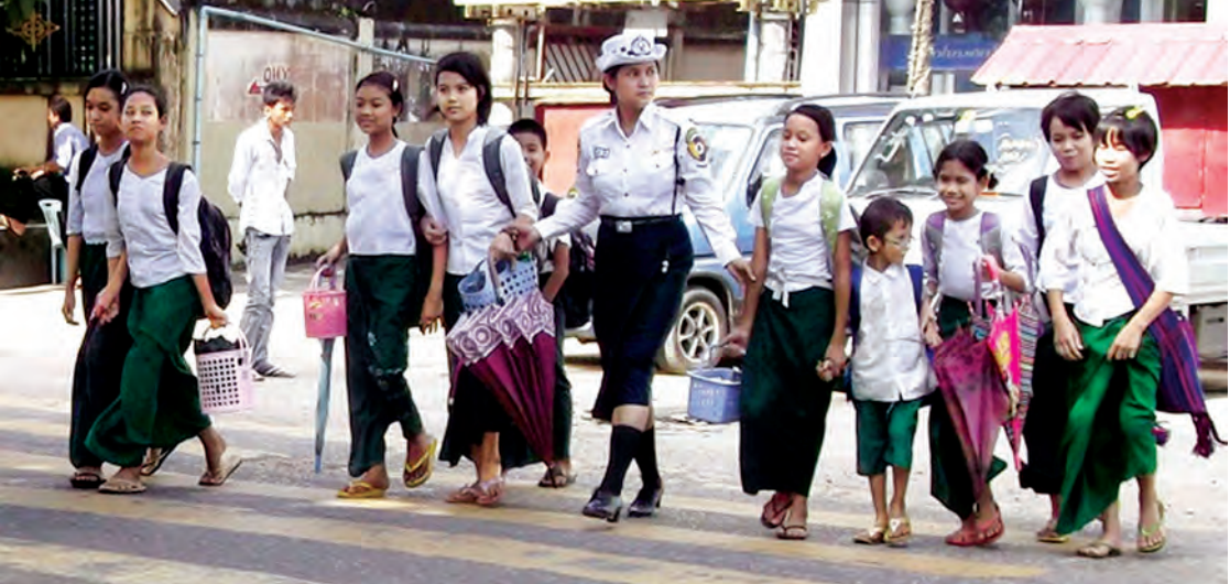
ကျောင်းသူ ကျောင်းသားများ၏ ယာဉ်အန္တရာယ်ကင်းရှင်းရေးအတွက် စောင့်ရှောက်ကူညီပေးသည့် မြန်မာနိုင်ငံရဲတပ်ဖွဲ့ ယာဉ်ထိန်းရဲမေ တစ်ဦးကို တွေ့ရစဉ်။