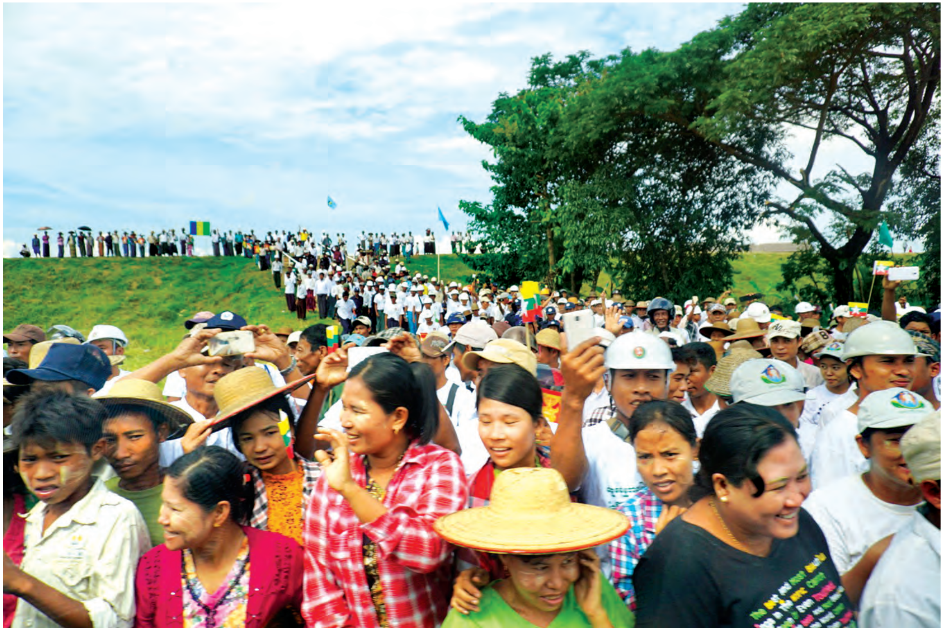
လေးမျက်နှာမြို့နယ် ကညင်သာကျေးရွာအုပ်စု ရွှေဘိုစုကျေးရွာမှ ဒေသခံပြည်သူများက နိုင်ငံတော်သမ္မတအား တစ်ခဲနက်ကြိုဆိုနေကြသည်ကို တွေ့ရစဉ်။