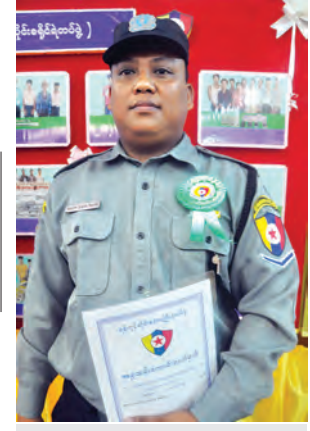
ဒုတပ်ကြပ် ဟိန်းဇော်

ကိုယ့်ရဲ့ ဆောင်ရွက်မှုကို ပီတိဖြစ်ရသလို ပူးပေါင်းဆောင်ရွက်ခဲ့တဲ့ ပြည်သူတွေကိုလည်း ကျေးဇူးတင်ပါတယ်။ နောက်ထပ်လည်း တပ်ဖွဲ့ရဲ့ လုပ်ငန်းပိုင်းတွေအပြင် ပြည်သူ့အကျိုးကိုလည်း ကြိုးစားဆောင်ရွက်သွားမှာပါ။ ပြည်သူလူထုအနေနဲ့မူဝါဒပိုင်းတွေအပြင် လူမှုရေးပိုင်းတွေမှာပါ ပူးပေါင်းဆောင်ရွက်သွားဖို့လိုပါတယ်။ ဒုစရိုက်မှု ဖြစ်ရင် ပြည်သူတွေအနေနဲ့ မထိမ်ချန်ဘဲ အမြင်သက်သေ၊ အကြားသက်