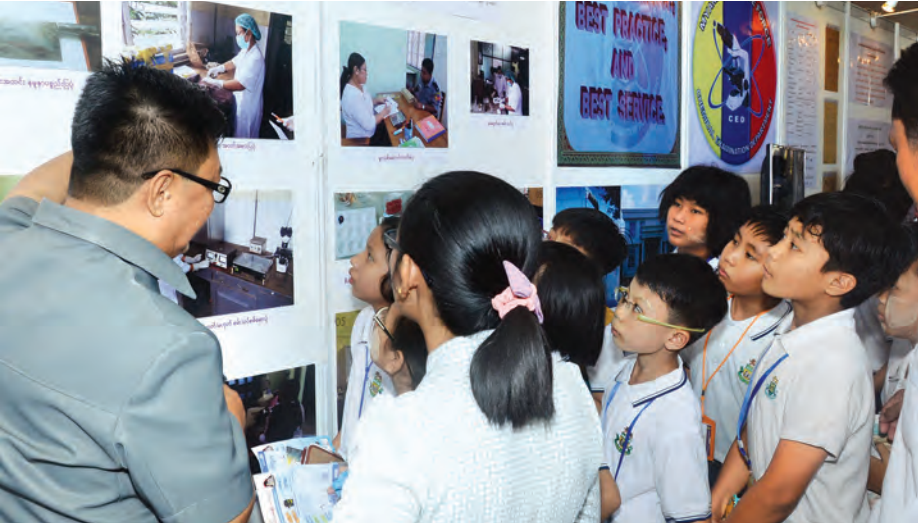
မြန်မာနိုင်ငံရဲတပ်ဖွဲ့ (၅၁)နှစ်မြောက် နှစ်ပတ်လည်နေ့အခမ်းအနားကို နေပြည်တော် သင်္ဂဟတိုက်၌ ကျင်းပရာ ခင်းကျင်းပြသထားသည့် ဂုဏ်ပြုမှတ်တမ်းဓာတ်ပုံများကို ကျောင်းသား ကျောင်းသူများ ကြည့်ရှုလေ့လာကြစဉ်။