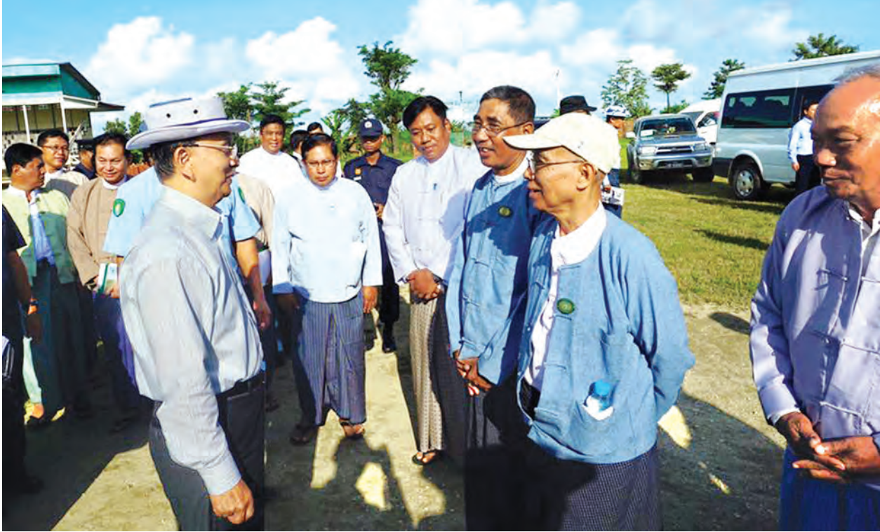
နိုင်ငံတော်သမ္မတ ဦးသိန်းစိန် အင်္ဂုပုမြို့ ဒေသခံပြည်သူများကို ရင်းရင်းနှီးနှီး နှုတ်ဆက်စဉ်။

များ၌ စပါးပြန်လည်စိုက်ပျိုးနိုင်ရန် ဆောင်ရွက်ခဲ့သကဲ့သို့ စပါးစိုက်ပျိုးရန် အချိန်နှောင်းသွားသည့် မြေများတွင် ဆောင်းသီးနှံများ စိုက်ပျိုးနိုင်ရန် ကူညီဆောင်ရွက်ပေးသွားမည် ဖြစ် ကြောင်း။ ဧရာဝတီတိုင်းဒေသကြီးအတွင်း ရေကြီးရေလျှံမှုများကို ကာကွယ်နိုင် ရန်အတွက် လက်ရှိ ရေတားတံဆိပ်များ ကို မြေသားမြှင့်တင်ခြင်း၊ မြစ်ကြောင်း ထိန်းသိမ်းခြင်းလုပ်ငန်းများအား နိုင်ငံတကာနှင့် ပူးပေါင်းဆောင်ရွက် သွားမည်ဖြစ်ကြောင်း။ သဘာဝဘေး ကျရောက်ပြီးချိန် တွင် အားနည်းအုပ်စုများဖြစ်သည့် သက်ကြီးရွယ်အိုများ၊ မိခင်နှင့်ကလေး များ၊ မသန်စွမ်းသူများကို အမျိုးသမီး ရေးရာအဖွဲ့၊ မိခင်နှင့် ကလေးစောင့် ရှောက်ရေးအသင်းတို့ အပါအဝင် လူမှုရေးအသင်းအဖွဲ့များနှင့် ပူးပေါင်း စောင့်ရှောက်သွားရန်လိုကြောင်း။ ထို့ပြင် ကျန်းမာရေးကဏ္ဍတွင် လည်း နောက်ဆက်တွဲရောဂါများ မဖြစ်ပွားစေရန်အတွက် အထူး အလေးထား စောင့်ရှောက်ပေးရန် လိုကြောင်း။ အင်္ဂုပုမြို့နယ်၏ လူမှုစီးပွား ဘဝဖွံ့ဖြိုးတိုးတက်ရေးအတွက်လည်း တိုင်းဒေသကြီးအစိုးရက စီမံချက်ဖြင့် ဆောင်ရွက်ပေးရန်လိုကြောင်း။