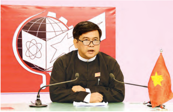
ချစ်ခင်လေးစားရပါသော ပြည်သူ့အပေါင်းတို့ခင်ဗျား- မင်္ဂလာပါလို့ ဦးစွာနှုတ်ခွန်းဆက်သပါတယ်။

လူ့ဘောင်သစ်ဒီမိုကရက်တစ်ပါတီက ဦးအောင်မိုးဇော်က ၎င်းတို့ပါတီ၏ မူဝါဒ၊ သဘောထား၊ လုပ်ငန်းစဉ် စသည်တို့ကို စက်တင်ဘာ ၃၀ ရက် ညပိုင်းက ရေဒီယိုနှင့် ရုပ်မြင်သံကြားအစီအစဉ်များမှ ဟောပြောတင်ပြခဲ့ပါသည်။ အဆိုပါ ဟောပြောချက်အပြည့်အစုံမှာ အောက်ပါအတိုင်းဖြစ်ပါသည်-