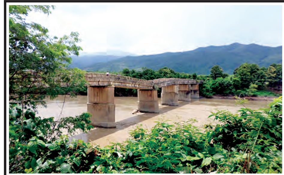
ဂန့်ဂေါ-ကလေးလမ်း မိုင် (၅၁/၅-၅၁/၆) ကြား ကမ္ဘားနီတံတား (၂/၅၂) ၅၉၅ ပေ (၈၅ ပေ RC ရက်မ) ရေလယ်တိုင် နိမ့်ကျသွားပုံ။

မွမ်းမံတည်ဆောက်ရန်အတွက် ဂျပန်အစိုးရက လှူဒါန်းမည့် ဂျပန်ယန်းငွေ ၄၀၀၀၀၀ (ခန့်မှန်းအမေရိကန်ဒေါ်လာ ၄၀၀၀၀၀)ကို လွှဲပြောင်းလက်ခံနိုင်ရေး မြန်မာသံရုံးတို့ကကြိုးကြိုးနှင့် ဆက်သွယ်ဆောင်ရွက်လျက်ရှိသည်။ ထို့ပြင် တရုတ်ပြည်သူ့သမ္မတနိုင်ငံက ကြီးမား၍ မြန်မာ-တရုတ် ချစ်ကြည်ရေးအသင်းနှင့် တရုတ်-မြန်မာ ချစ်ကြည်ရေးအသင်းတို့ ပူးပေါင်းဆောင်ရွက်သည့် Support Myanmar ရန်ပုံငွေရှာဖွေပွဲမှ လက်ခံရရှိသည့် လှူဒါန်းငွေများကို ဆက်လက်လွှဲပြောင်းသွားမည် ဖြစ်ကြောင်း တရုတ်ပြည်သူ့သမ္မတနိုင်ငံသံရုံးမှ သိရသည်။ (သတင်းစဉ်)