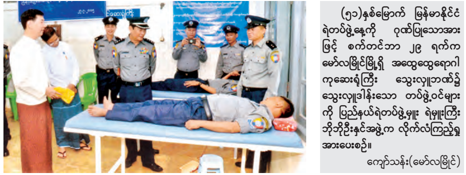
(၅၁)နှစ်မြောက် မြန်မာနိုင်ငံ ရဲတပ်ဖွဲ့နေ့ကို ဂုဏ်ပြုသောအားဖြင့် စက်တင်ဘာ ၂၉ ရက်က မော်လမြိုင်မြို့ရှိ အထွေထွေရောဂါ ကုဆေးရုံကြီး သွေးလျာဘဏ်၌ သွေးလျာခန်းသော တပ်ဖွဲ့ဝင်များကို ပြည်နယ်ရဲတပ်ဖွဲ့မှူး ရဲမှူးကြီး ဘိုဘိုဦးနှင့်အဖွဲ့က လိုက်လံကြည့်ရှု အားပေးစဉ်။

နေပြည်တော်ကောင်စီနယ်မြေ တပ်ကုန်းမြို့နယ် နွယ်ရစ်ကျေးရွာအခြေခံပညာ အလယ်တန်းကျောင်း(ခွဲ) ၌ ကမ္ဘာ့ကျောင်းများနို့တိုက်ကျွေးရေးနေ့ အခမ်းအနား နှင့်အထိမ်းအမှတ် စာစီစာကုံး ပန်းချီပြိုင်ပွဲ ဆုချီးမြှင့် ခြင်း အခမ်းအနားကို စက်တင်ဘာ ၃၀ ရက် နံနက် ၉ နာရီက အဆိုပါ ကျောင်းစာသင်ဆောင်၌ ကျင်းပခဲ့သည်။ ရှေးဦးစွာ မွေးမြူရေး၊ ရေလုပ်ငန်းနှင့် ကျေးလက် ဒေသဖွံ့ဖြိုးရေးဝန်ကြီးဌာန ဒုတိယဝန်ကြီး ဦးတင်ငွေက တင်စိုးလွှင့်