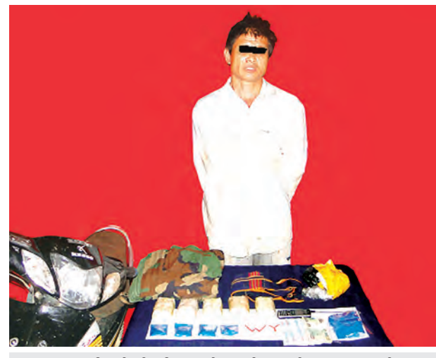
လုံးဆာကို ဖမ်းဆီးရမိ မူးယစ်ဆေးဝါးများနှင့်အတူ တွေ့ရစဉ်။