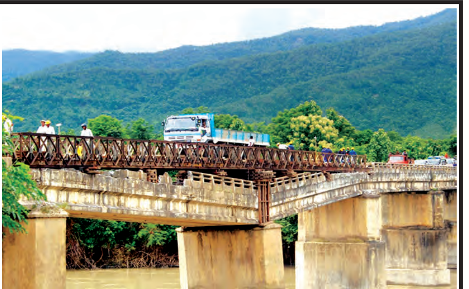
ဂန့်ဂေါ-ကလေးလမ်း မိုင် (၅၁/၅-၅၁/၆) ကြား ကမ္ဘားနီတံတား (၂/၅၂) ပေ ၁၈၀ Double Single Bailey တပ်ဆင်ပြီးစီး၍ ယာဉ်များ ဖြတ်သန်းနေပုံ။