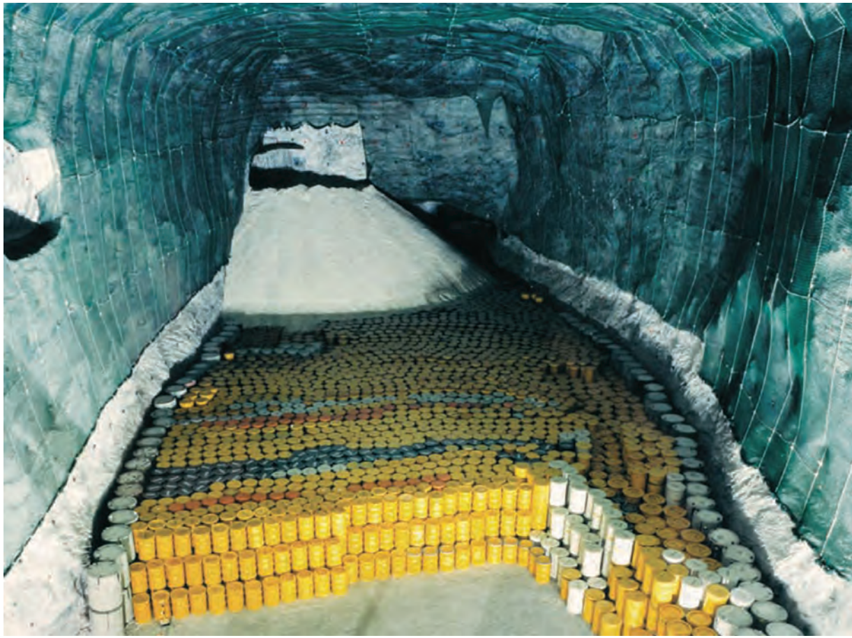
အမေရိကန်ပြည်ထောင်စု နီဗာဒါပြည်နယ် Yucca တောင်အောက်အနက် ငါးကိုလိုမီတာတွင်ရှိသော အဏုမြူစွန့်ပစ်ပစ္စည်းများ သိုလှောင်ရာနေရာ။

မှန်းချက်တစ်ရပ်လည်း ဖြစ်သည်။ အလားတူ အနာဂတ်ကာလ၏ အကာသဆိုင်ရာစီမံကိန်းများနှင့် နေစကြာဝဠာအဖွဲ့အစည်းအတွင်း၌ လူသားတို့ အခြေချနေထိုင်နိုင်မည့် နယ်မြေသစ်ရှာဖွေချဲ့ထွင်ရေးလုပ်ငန်းစဉ်များ တစ်လျှောက်လုံးတွင်လည်း အလယ်အလတ်အဆင့် အဏုမြူပစ္စည်းများကိုလည်း ဓာတ်ရောင်ခြည် ပျံ့နှံ့မှုမရှိအောင် အဆင့်မြင့်နည်းလမ်းများဖြင့် ဖယ်ရှားစွန့်ပစ်နိုင်ပြီဖြစ်သည်။ သို့သော် အဆင့်မြင့်အဏုမြူနည်းပညာက ထက်ကြပ်မကွာ ယှဉ်တွဲလိုက် ပါပြည့်ဆည်းနေရဦးမည် ဖြစ်သည်။ နေစကြာဝဠာအတွင်းသို့ နယ်မြေရှာဖွေချဲ့ထွင်ရေးသည် ကမ္ဘာ့လူသား