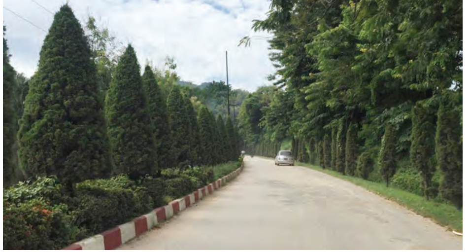
မောင်ယဉ်ကျေး

ဂေါက်ကွင်းလမ်းသည် ဓမ္မသီရိဆေးရုံ၊ တာချီလိတ် (ရီဂျီးနား)ဂေါက်ကွင်းနှင့် မိုးကုတ်ဓမ္မရိပ်သာများသို့သွားသော လမ်းမကြီးတစ်ခုဖြစ်ကာ ဟိုတယ်များ၊ စားသောက်ဆိုင်များလည်း အများအပြားရှိသောလမ်းလည်း ဖြစ်သည်။ လမ်းဘေးဝဲယာတွင် ကျွန်းပင်များ၊ လမ်းလယ်ကျွန်းမှ ပန်းအလှများကြောင့် နေ့ဘက်တွင် သာယာလှပသောလမ်းဖြစ်သော်လည်း ညအခါတွင်မူ လမ်းမီးများမရှိသဖြင့် မှောင်မည်းနေပြီး ဒုစရိုက်သမားများခိုအောင်းနိုင်သည့်အနေအထားဖြစ်နေသဖြင့် အဆိုပါလမ်းမီးတိုင်များအားလုံး မီးပြန်လင်းအောင် သက်ဆိုင်ရာတာဝန်ရှိသူများက ဆောင်ရွက်ပေးရန် ပြည်သူများလိုလားလျက်ရှိကြောင်း သိရသည်။