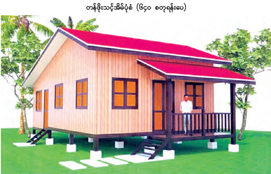
တန်ဖိုးသင့်အိမ်ပုံစံ (၆၄၀ စတုဂံပေ)

ရေဘေးသင့်ဒေသ ပြန်လည်ထူထောင်ရေး ပိုင်းဝန်းကူညီဆောင်ရွက်ပေး