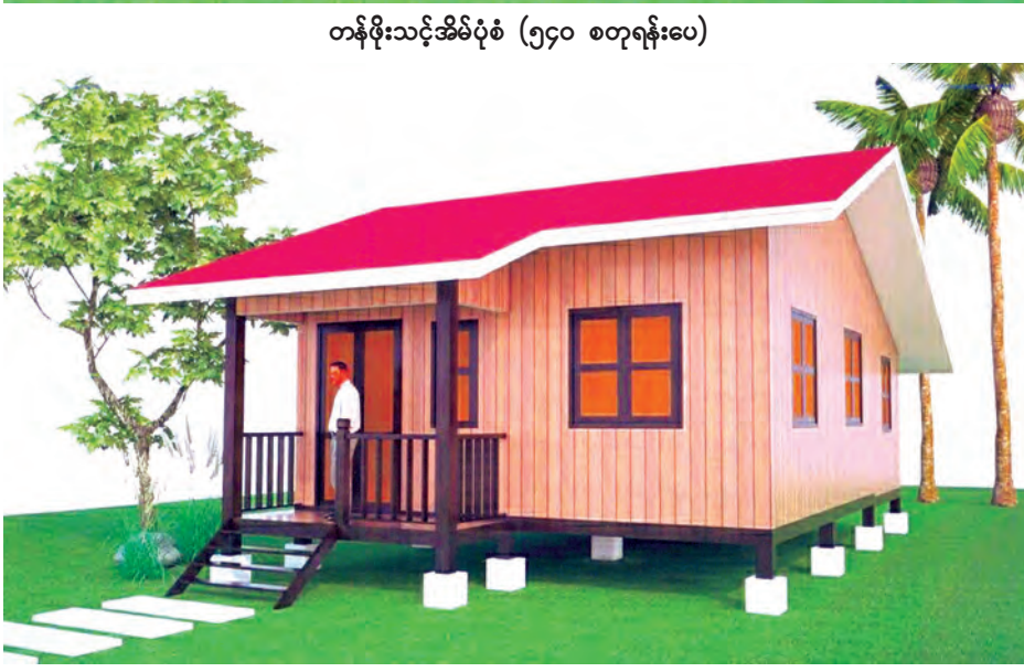
တန်ဖိုးသင့်အိမ်ပုံစံ (၅၄၀ စတုဂံပေ)