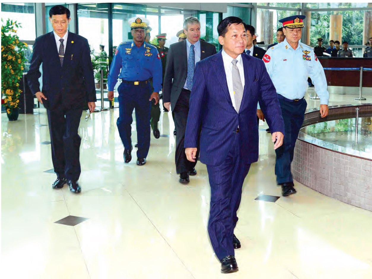
ချစ်ကြည်ရေးခရီးစဉ်အတွင်း တပ်မတော်ကာကွယ်ရေးဦးစီးချုပ်သည် အစ္စရေး နိုင်ငံအစိုးရနှင့် တပ်မတော်တို့မှ တာဝန်ရှိသူများနှင့်တွေ့ဆုံ၍ မြန်မာ့ တပ်မတော်နှင့် အစ္စရေးတပ်မတော်အကြား ချစ်ကြည်ရင်းနှီးမှုနှင့် ပူးပေါင်း ဆောင်ရွက်ရေးကိစ္စရပ်များကို ဆွေးနွေးမည်ဖြစ်ပြီး အထင်ကရနေရာများနှင့် အကြီးစားစက်မှုလက်မှုလုပ်ငန်းများကိုလည်း လေ့လာကြည့်ရှုမည်ဖြစ်ကြောင်း

မြန်မာနိုင်ငံအနေဖြင့် ၁၉၄၉ ခုနှစ် ဒီဇင်ဘာလ ၅ ရက်နေ့တွင် အစ္စရေး-မြန်မာ နှစ်နိုင်ငံ သံတမန်ဆက်ဆံရေး စတင်ထူထောင်ခဲ့သည်။ အစ္စရေး နိုင်ငံဆိုင်ရာ မြန်မာသံရုံးကို အစ္စရေးနိုင်ငံ တဲလ်အဗီးမြို့၌ ၁၉၅၅ ခုနှစ်တွင် ဖွင့်လှစ်ခဲ့ပြီး မြန်မာနိုင်ငံဆိုင်ရာ အစ္စရေးသံရုံးကို ရန်ကုန်မြို့၌ ၁၉၅၇ ခုနှစ် ဒီဇင်ဘာလတွင် ဖွင့်လှစ်ခဲ့သည်။ ယနေ့အချိန်ထိ နှစ်နိုင်ငံသံတမန်နှင့် စစ်ဘက်ဆိုင်ရာဆက်ဆံမှု ၆၂နှစ်ရှိပြီ ဖြစ်ပြီး ဝန်ကြီးချုပ် ဦးနုသည် ၁၉၅၅ ခုနှစ်တွင် လည်းကောင်း၊ အိမ်စောင့်အစိုးရလက်ထက် ဝန်ကြီးချုပ်နှင့် ကာကွယ်ရေးဦးစီးချုပ် ဗိုလ်ချုပ်ကြီး နေဝင်းသည် ၁၉၅၉ ခုနှစ်တွင် လည်းကောင်း အစ္စရေးနိုင်ငံသို့ ချစ်ကြည်ရေးခရီး သွားရောက်ခဲ့သည်။ ယခု ခရီးစဉ်သည် နှစ်ပေါင်း ၅၆ နှစ်နောက်ပိုင်း တပ်မတော်အကြီးအကဲ တစ်ဦး အနေဖြင့် အစ္စရေးနိုင်ငံသို့ သွားရောက်သည့် ချစ်ကြည်ရေးခရီးစဉ်ဖြစ်ပြီး နှစ်နိုင်ငံတပ်မတော် ဆက်ဆံရေးကို ခြေလှမ်းသစ် စတင်ဖွင့်လှစ်နိုင်မည် ဖြစ်သည်။