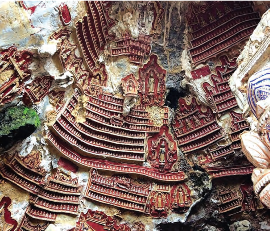
စာမျက်နှာ ၁၆ မှ

ကျွန်တော်တို့ ဖြည်းဖြည်းချင်း လှည့်ပတ်ကြည့်ရှုလေ့လာလိုက်ရုံမှာ ကျွန်ုပ်တို့၏ နေရာများတွင် စေတီငယ် တစ်ဆူစု၊ နှစ်ဆူစုတည်ထားသည် ကို တွေ့မြင်ရသည်။ ရဲတိုက်ပုံသဏ္ဍာန် ထူထပ်ထားသော ကျောက်တိုင်ထိပ် တွင် စေတီငယ်တစ်ဆူတည်ထားသည့် အပြင် စေတီကိုယ်ထည်ကို ရွှေရောင်