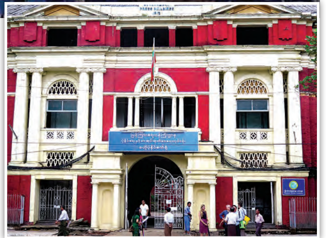
ဆောင်းပါး-ခင်ရတနာ၊ ဓာတ်ပုံ- YHT

လွန်ခဲ့သည့် နှစ်ပေါင်းတစ်ရာကျော်က ရန်ကုန်သည် မြို့တော်ကိုလိုနီတို့ ရုံးစိုက်ရာဒေသတစ်ခုဖြစ်ခဲ့ပြီး ရန်ကုန်မြို့ပြဖွံ့ဖြိုးရေးသည်လည်း ကိုလိုနီခေတ်တစ်လျှောက်လျင်မြန်စွာ ပေါ်ထွန်းခဲ့သည်ကို သမိုင်းဝင် အဆောက်အအုံများမှ တစ်ဆင့် လေ့လာသိရှိနိုင်ပါသည်။ ထိုအဆောက်အအုံများထဲတွင် ဗိုလ်တထောင် မြို့နယ်အတွင်းရှိ ၁၉၀၉ ခုနှစ်ကတည်းက စတင် တည်ဆောက်ခဲ့ပြီး နိုင်ငံတော်၏ အရေးကြီးသော မှတ်တမ်းများ၊ ပြန်တမ်းများနှင့် သန်းခေါင်စာရင်း