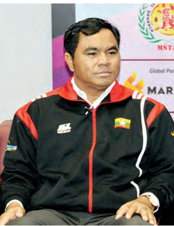
မြန်မာ့ရိုးရာခြင်းလုံးအဖွဲ့ချုပ်ဥက္ကဋ္ဌ ဦးစိုးနိုင်။

စည်းရုံးနိုင်ခဲ့သည်။ ထို့အပြင် အာရှဖိတ်ခေါ် ရိုးရာခြင်းလုံးအားကစားပြိုင်ပွဲကိုပင် ပြီးခဲ့သည့် ၂၀၁၄ ခုနှစ် နိုဝင်ဘာ ၃ ရက်မှ ၅ ရက် အထိ အိမ်ရှင်အဖြစ် လက်ခံကျင်းပနိုင်ခဲ့သည်။ ယခုနှစ် ဒီဇင်ဘာ ၂၇ ရက်တွင်လည်း ဒုတိယအကြိမ် အာရှဖိတ်ခေါ်ရိုးရာခြင်းလုံးခတ်ပြိုင်ပွဲကို ကျင်းပသွားမည်ဖြစ်ရာ အာရှတွင်းနိုင်ငံများဖြစ်သည့် အိန္ဒိယ၊ ဂျပန်၊ ကိုရီးယား၊ မလေးရှား၊ ထိုင်း၊ ကမ္ဘောဒီးယား၊ အိမ်ရှင်မြန်မာနှင့် အာရှတွင်းနိုင်ငံမဟုတ်သည့် ဘရာဇီးနိုင်ငံကပင် ပထမအကြိမ် ဝင်ရောက်ယှဉ်ပြိုင်ခဲ့သည်အထိ အောင်မြင်ခဲ့သည်။ ယခု ဒုတိယအကြိမ်တွင်