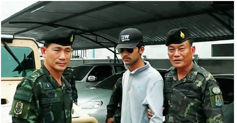
ဖမ်းဆီးရမိခဲ့ပြီးဖြစ်ကြောင်း ထိုင်းအာဏာပိုင်များက ပြောခဲ့သည်။ ထို့ပြင် အာဏာပိုင်အဖွဲ့က အဆိုပါ မနည်း ပိုမိုပါဝင်နိုင်သည်ဟု ယူဆ ဗန်ကောက်ကွဲမှုတွင် လူ ၁၀ ဦးထက် ထားကြသည်။ (အင်န်အိတ်ချ်ကေ)

ကြားဖြတ်ဝန်ကြီးချုပ် ပရာယူချန် အိုချာက အဆိုပါအဓိကသံသယဖြစ်ဖွယ် တရားခံမှာ ဗန်ကောက်ကွဲမှုဖြစ်ပွားသည့် နောက်ကွယ်က ဖြစ်ရပ်အသေးစိတ်ကို ထုတ်ဖော်ပြောဆိုရာတွင် ကူညီမည့်သူဖြစ်ကြောင်း ပြောခဲ့သည်။ ထိုင်းမြို့လယ်ကောင် ဗန်ကောက်ကွဲမှုနှင့်ပတ်သက်ပြီး ယခုချိန်ထိ သံသယဖြစ်ဖွယ် လူခုနစ်ဦးကို