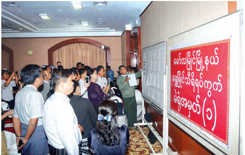
UEC မှ မေလအတွင်းက အရပ်ဘက်လူမှုအဖွဲ့အစည်းများအား လက်တွေ့သရုပ်ပြနေသည့် မြင်ကွင်း။