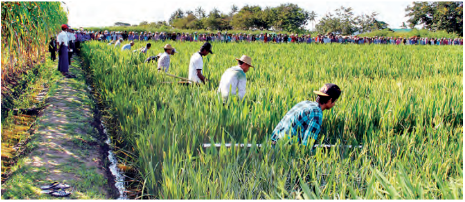
၂၀၁၄-၂၀၁၅ ပညာသင်နှစ်တွင် ရေဆင်းစိုက်ပျိုးရေးတက္ကသိုလ် ကျောင်းသား ကျောင်းသူများ ဝတ်မှုန်ကူးပွဲ၌ စပါးစိုက်ကွင်းအတွင်း လက်တွေ့ကွင်းဆင်းနေစဉ်။

နေပြည်တော် စက်တင်ဘာ ၂ နေပြည်တော် ရေဆင်းစိုက်ပျိုးရေးတက္ကသိုလ်၌ ဆန်စပါးထုတ်လုပ်သည့် ကျွမ်းကျင်ပညာရှင်များ မွေးထုတ်ပေးနိုင်ရန်အတွက် ယခုပညာသင်နှစ်မှစတင်၍ စပါးသီးနှံအထူးပြုသင်ရိုးညွှန်းတမ်းကို စတင်သင်ကြားပို့ချတော့မည်ဖြစ်ကြောင်း သိရသည်။