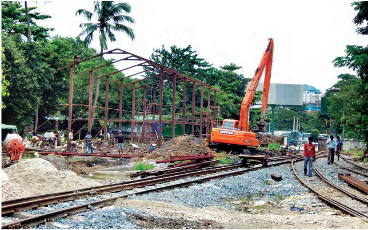
LOCO SHED DEPOT ကို ဝါးတန်းကုန်ရုံ၌ ဆောက်လုပ်နေသည်ကိုတွေ့ရစဉ်။