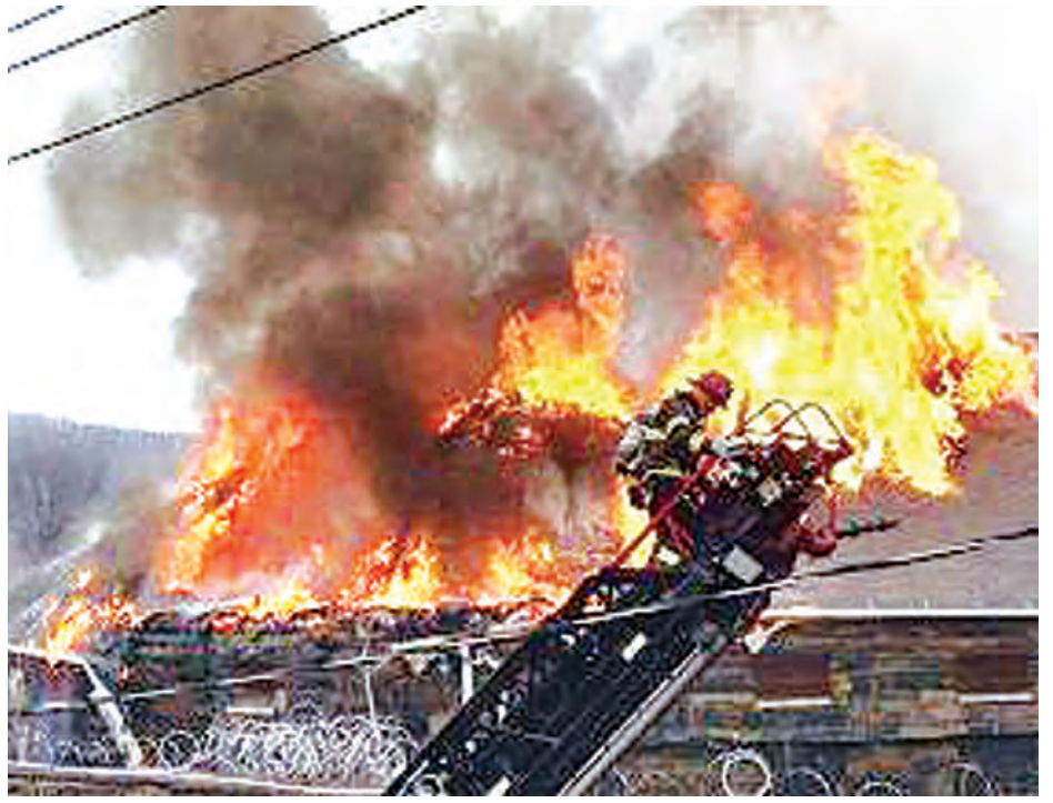
၂၀၁၂ ခုနှစ်တွင် ဗင်နီဇွဲလားသမ္မတက အကျဉ်းထောင်အဆောက်အအုံများကို အရေးပေါ်အခြေအနေကြေညာခဲ့ပြီး အကျဉ်းဦးစီးဝန်ကြီးဌာနကို အကျဉ်းထောင်များအသစ်ပြန်လည်တည်ဆောက်ရန် တိုက်တွန်းခဲ့သည်။ (ဆင်ဟွာ)

ကရာကက်(စ်) စက်တင်ဘာ ၁ ဗင်နီဇွဲလားနိုင်ငံမြောက်ပိုင်း အကျဉ်းထောင်တစ်ခုတွင် မီးလောင်ကျွမ်းမှုကြောင့် လူ ၁၇ ဦးသေဆုံးခဲ့သည်။ သေဆုံးသူထဲမှ ကိုးဦးမှာ အကျဉ်းသားများဖြစ်ပြီး အခြား ၁၆ ဦးမှာလည်း ဒဏ်ရာရရှိခဲ့သည်ဟု တနင်္လာနေ့တွင် သက်ဆိုင်ရာအာဏာပိုင်များက အတည်ပြုခဲ့သည်။ ကာရာဘိုဘိုပြည်နယ်ရှိ Tocuyito အကျဉ်းထောင်တွင် ရှစ်နာရီကြာ မီးလောင်ကျွမ်းမှုကြောင့် အမျိုးသမီးရှစ်ဦးနှင့် အမျိုးသားကိုးဦး သေဆုံးခဲ့သည်ဟု ရှေ့နေချုပ်ရုံးမှ သတင်းထုတ်ပြန်သည်။ သေဆုံးသူ ၁၇ ဦး၏ သေဆုံးမှုကိုစစ်ဆေးရန် အစိုးရ ရှေ့နေများအား ညွှန်ကြားထားပြီးဖြစ်ကြောင်း ဖော်ပြခဲ့သည်။ လျှပ်စစ်ရှောင်ခိုင်းခြင်းကြောင့် မီးလောင်ကျွမ်းခြင်းဖြစ်သည်ဟု လူမှုမီဒီယာများတွင် ဖော်ပြကြသည်။ ဒဏ်ရာရသူများနှင့်သေဆုံးသူများ၏ ကိုယ်ရေးအချက်အလက်များကို အတိအကျမသိရသေးပေ။ ဒဏ်ရာရသူများကို အနီးစပ်ဆုံးဆေးရုံသို့ပို့ဆောင်ပေးခဲ့သည်ဟု မီဒီယာများက ပြောသည်။ အဆိုပါအကျဉ်းထောင်သည် ၂၀၁၄ ခုနှစ်တွင် အစိုးရက ပြန်လည်ပြုပြင်ပေးခဲ့သော အကျဉ်းထောင်များထဲတွင် တစ်ခုအပါအဝင်ဖြစ်ပြီး အကျဉ်းသားများ များပြားနေသည့်အတွက် အကျဉ်းသား ၂၀၀၀ ကို နေရာရွှေ့ပြောင်းခဲ့သည်။