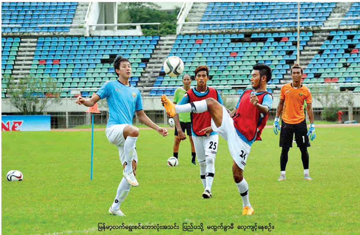
မြန်မာ့လက်ရွေးစင်ဘောလုံးအသင်း ပြည်ပသို့ မထွက်ခွာမီ လေ့ကျင့်နေစဉ်။

မြန်မာနိုင်ငံရေဘေးသင့် ဒေသများ ပြန်လည်ထူထောင်ရေး အထူးရန်ပုံငွေပွဲအဖြစ် မြန်မာ့လက်ရွေးစင်အမျိုးသားအသင်းနှင့် နယူးဇီလန်လက်ရွေးစင် အမျိုးသားအသင်းတို့ လာမည့် စက်တင်ဘာ ၇ ရက် ညနေ ၆ နာရီတွင် ရန်ကုန်မြို့ သုဝဏ္ဏအားကစားကွင်းကြီး၌ ကျင်းပမည်ဖြစ်ကြောင်း မြန်မာနိုင်ငံဘောလုံးအဖွဲ့ချုပ်မှ သိရသည်။