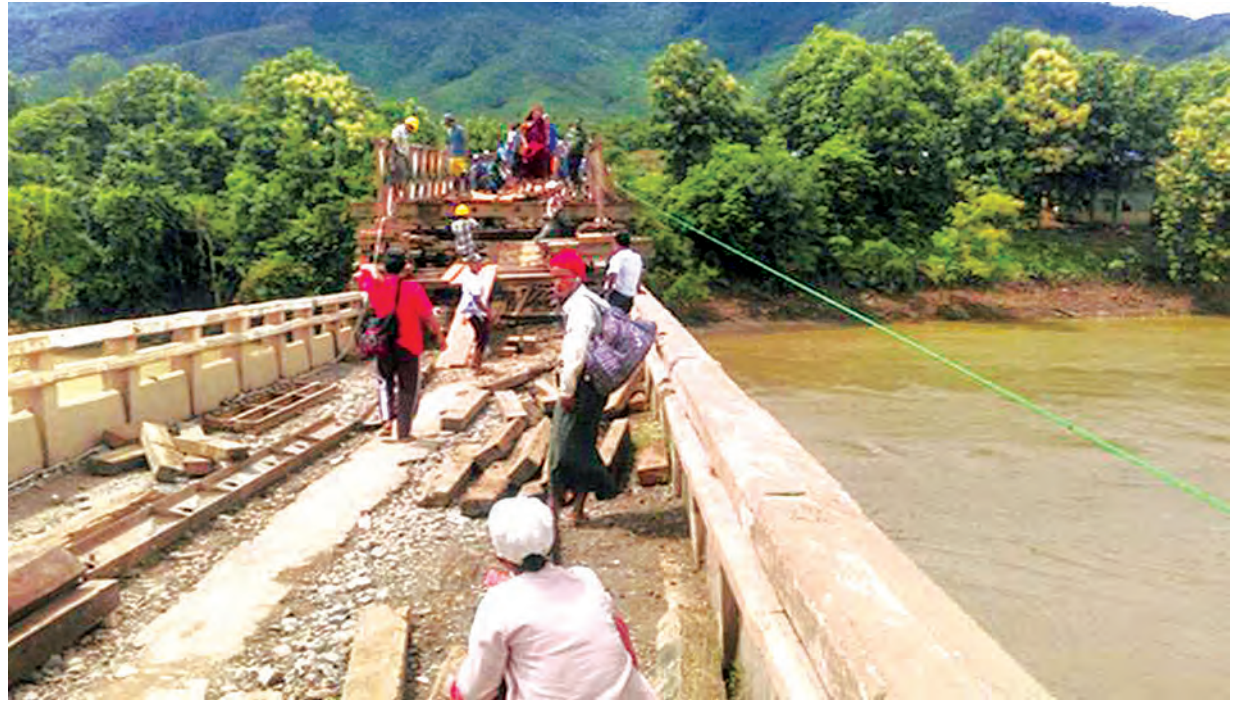
ဂန့်ဂေါ-ကလေးလမ်းမိုင်(၅၀/၃-၅/၄)ကြား တံတားအမှတ်(၂/၅၂) ကမ္ဘာ့နီတံတားပေါ်တွင် ပေ ၁၈၀ ယာယီဘာလီတံတား တည်ဆောက် ထားသည်ကို တွေ့ရစဉ်။

ထိုသို့ဆောင်ရွက်ရာတွင် လုပ်ငန်းစဉ်(၁)အရ ဘေးမဖြစ်မီထိခိုက်ဆုံးရှုံး မှု နည်းပါးစေရန်ဆောင်ရွက်ခြင်း၊ လုပ်ငန်းစဉ်(၂)အရ ဘေးဖြစ်ပွားနေစဉ် ဘေးလွတ်ရာ ရွှေ့ပြောင်းခြင်း၊ ရှာဖွေကယ်ဆယ်ခြင်း၊ အရေးပေါ် ကယ်ဆယ် ထောက်ပံ့ခြင်းနှင့် လုပ်ငန်းစဉ်(၃)အရ မူလအခြေအနေသို့ ပြန်လည်ရောက်ရှိ စေရန်အတွက် ပြန်လည်တည်ဆောက်ခြင်း၊ ပြန်လည်နေရာချထားခြင်း၊ ပြန် လည်ထူထောင်ခြင်းလုပ်ငန်းများကို အရှိန်အဟုန်ဖြင့် ဆောင်ရွက်နိုင်ရန်အတွက် သီးသန့်ရန်ပုံငွေမှ ခွင့်ပြုပေးခဲ့ခြင်းဖြစ်ကြောင်း သိရသည်။ (သတင်းစဉ်)