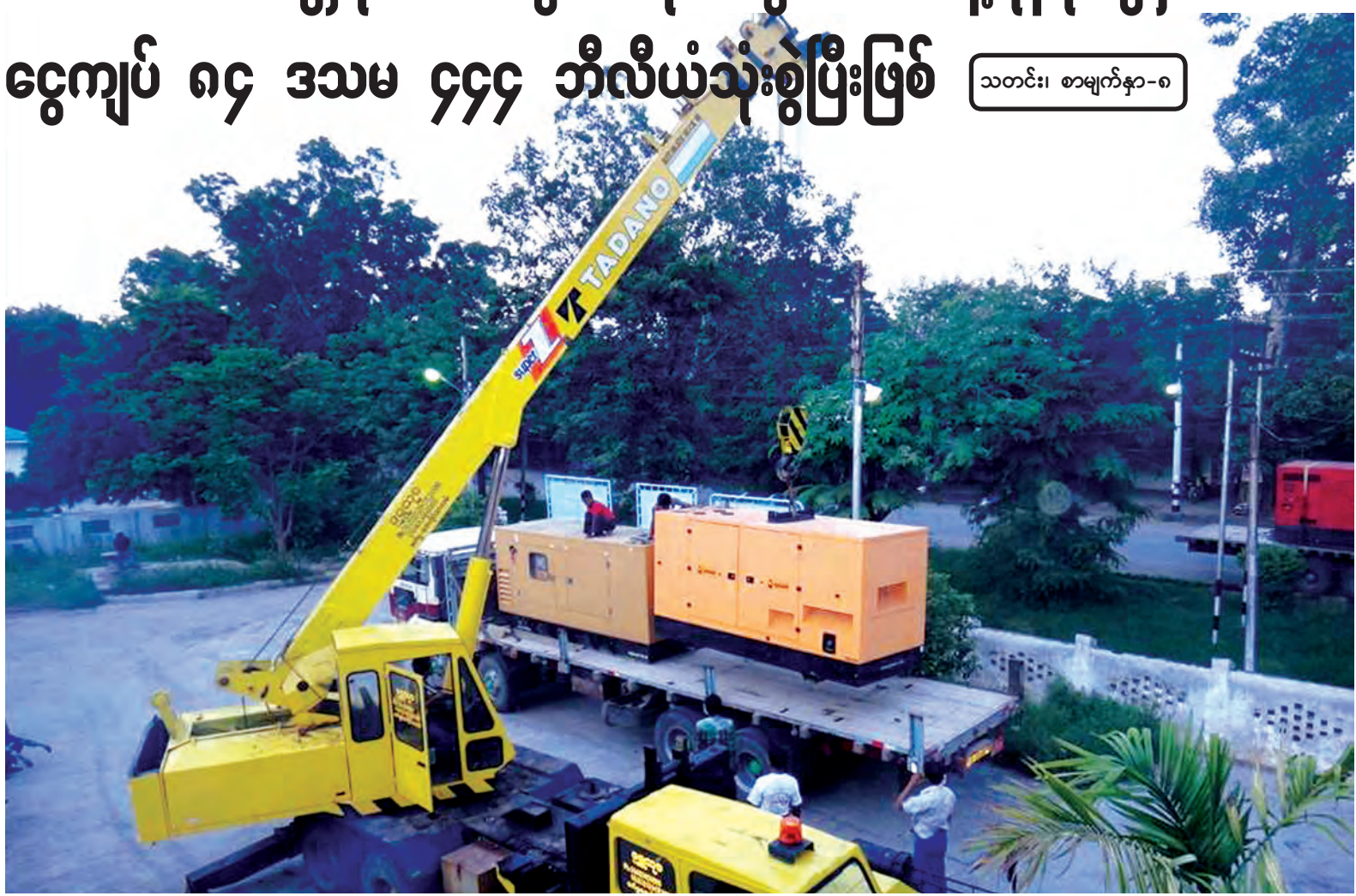
ကလေးမြို့အရေးပေါ် လျှပ်စစ်ဓာတ်အားပေးမည့် မီးစက်များကို ဝန်ချိစက်ဖြင့်သယ်ချနေစဉ်။