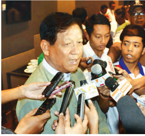
ပြည်ထောင်စု ရွေးကောက်ပွဲကော်မရှင် ဥက္ကဋ္ဌ ဦးတင်အေး မိဒီယာများ၏ မေးမြန်းချက်ကို ဖြေကြားစဉ်။

မဲဆန္ဒရှင်သက်သေခံလက်မှတ်ကို ရွေးကောက်ပွဲနေ့ မတိုင်မီ တစ်ပတ်အလိုတွင် ထုတ်ပေးသွားမည်ဖြစ်ကြောင်း ပြည်ထောင်စုရွေးကောက်ပွဲကော်မရှင်ဥက္ကဋ္ဌ ဦးတင်အေးက စက်တင်ဘာလ ၁ ရက်က ရန်ကုန်မြို့တွင် နိုင်ငံရေးပါတီများနှင့် တွေ့ဆုံစဉ် ပြောကြားသည်။