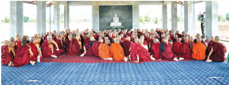
နေပြည်တော်ကောင်စီနယ်မြေ တပ်ကုန်းမြို့နယ် အောင်သီတာပျိုးဥယျာဉ်ကျောင်းတိုက်၌ ရန်ကုန်မြို့ အောင်သီတာစာသင်တိုက်ဆရာတော် ဘဒ္ဒန္တဓမ္မာစာရ (ဂန္ထဝါစကပဏ္ဍိတ) အရှင်သူမြတ်၏လမ်းညွှန်မှု၊ တပ်ကုန်းမြို့ ရွာဦးစွန္ဒာရုံ ဆရာတော်ကြီးနှင့် မဟာသီဟနာဒ ဆရာတော်ကြီးတို့၏ဦးဆောင်မှုဖြင့် ဩဂုတ် ၃၀ ရက်က ဝါခေါင်လပြည့်(မေတ္တာအခါတော်နေ့) က အောင်ဓမ္မဓဏ္ဍသိမ်တော်ကြီးကို သံဃာတော်အရှင်သူမြတ် ၁၆၂ ပါးတို့က ပြီးစီးအောင်မြင်စွာ သမုတ်ခဲ့ကြစဉ်။ မောင်ပု

(၄၅ တာ၊ ၁၄ခန်းစရပ်နှင့် ၇ သံချီညချမ်း အခန်းဆက်ဆောင်းပါးကို အပတ်စဉ် ဗုဒ္ဓဟူးနေ့တိုင်း ဖော်ပြပါမည်။)