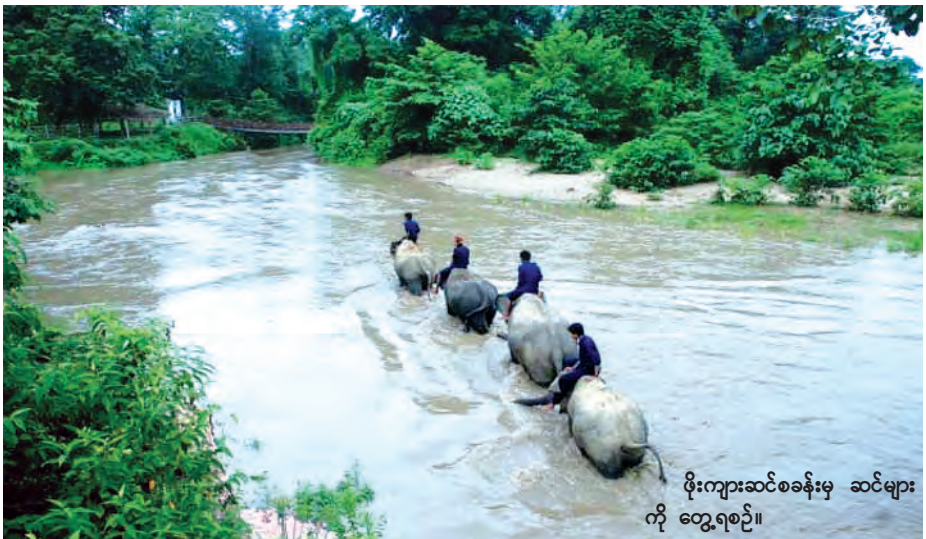
ဖိုးကျားဆင်စခန်းမှ ဆင်များ ကို တွေ့ရစဉ်။

ဆင်ရိုင်းများ အမှတ်မထင် ဝင်ရောက်လာကြသည့်သတင်း၊ တာဝန် ရှိသူများက ပြန်လည်ပို့ဆောင် မောင်းနှင်သည်မှာလည်း သတင်း၊ ဆင်ငယ်လေး တစ်ကောင်ကွဲကျွံ သည်မှာလည်း ရင်နှာစရာသတင်း၊ နေ့စဉ်သတင်းဖတ်ရှုသူများက ထို ဆင်အုပ်စု လှုပ်ရှားသွားလာသည့် သတင်းများကိုပင် စောင့်ကြည့်ဖတ်ရှု သူများ ပို၍များပြားလျက်ရှိသည်ကို တွေ့ရသည်။ တောဆင်ရိုင်းများမှာ ပဲခူးရိုးမ၊ ရခိုင်ရိုးမ၊ တနင်္သာရီသစ် တောကြီးရိုင်းများနှင့် အခြားသော ဒေသများတွင် အကောင်ရေအနည်း ငယ်သာ ကျန်ရှိတော့ကြောင်း ကျွမ်းကျင်သူများက ခန့်မှန်းထားကြ သည်။ သဘာဝပတ်ဝန်းကျင်နှင့် သစ်တောများပြုန်းတီးခြင်းမှာ နှစ် အနည်းငယ်အတွင်း သိသိသာသာ ပိုမိုဆိုးရွားလာသည်ဟုဆိုလျှင် ငြင်း နိုင်သူ ရှားလိမ့်မည်ထင်သည်။ ပဲခူးရိုးမကို အုတ်တွင်း-ပေါက် ခေါင်းလမ်းအတိုင်း ဆိုင်ကယ်တစ်စီး နှင့် ဖြတ်သန်းမောင်းနှင်ဖူးသလို သာဂရ-ကိုးပင် လမ်းကိုလည်း ဆိုင်ကယ်ဖြင့် ဖြတ်သန်းမောင်းနှင် ခဲ့ဖူးသည်။ အုတ်တွင်း-ပေါက်ခေါင်း ရိုးမဖြတ်ကျော် လမ်းတစ်လျှောက် များဆိုလျှင် နေပြောက်ပင်ထိုးနိုင်ခြင်း မရှိဘဲ စိမ့်နေအောင်အေးသည့် နေရာ များလည်း တွေ့ရှိခဲ့ရသည်။ ထို့ကြောင့် ခေါင်းချောင်းဖျား နှင့် မိုင် ၂၀ ဆင်စခန်းဝန်းကျင်၌ သစ်တောကြီးရိုင်းများတွင် တော ဆင်ရိုင်းအုပ်စုများ သဘာဝအတိုင်း ထိုနည်းနှင့်ပင် သာဂရ-ကိုးပင်