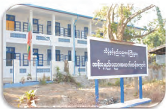
Upgraded Government Technical High School in Dawei

Improved infrastructure for 21 government schools