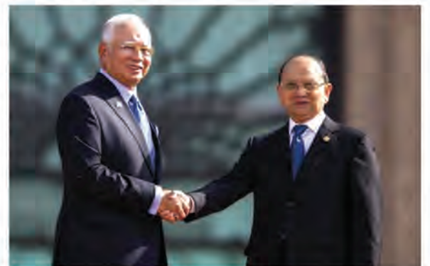
Prime Minister Dato'Sri Mohd Najib receives President U Thein Sein at the Perdana Putra Complex in Putrajaya.

Union Minister for Foreign Affairs of the Republic of the Union of Myanmar