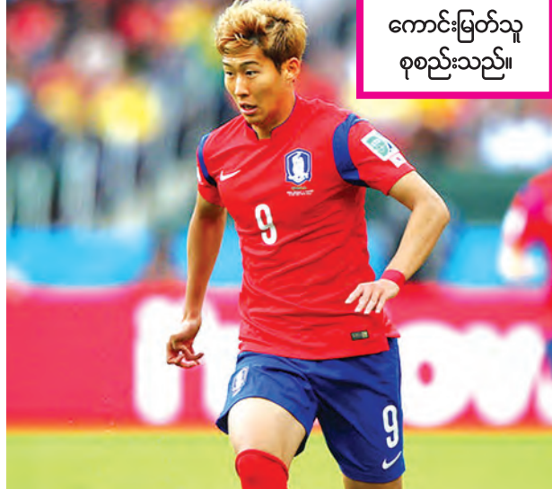
ကောင်းမြတ်သူ စုစည်းသည်။

တောင်ကိုရီးယားလက်ရွေးစင်ကစားသမားတစ်ဦးဖြစ်တဲ့ ဆွန်ဟောင်မင်းကို စပါးက ငါးနှစ်စာချုပ်နဲ့ ခေါ်ယူလိုက်ပြီဖြစ်ပါတယ်။ တောင်ကိုရီးယားတိုက်စစ်မှူး ဆွန်ဟောင်မင်းဟာ လေဗာကူဆင်အသင်းမှာ ၅၈ ပွဲကစားပြီး ၂၁ ဂိုးသွင်းယူပေးနိုင်ခဲ့တဲ့ တိုက်စစ်မှူး ဖြစ်ပါတယ်။ ဆွန်ဟောင်မင်းကို စပါးက ပေါင် ၂၁ ဒသမ ၉ သန်းနဲ့ ခေါ်ယူခဲ့တာဖြစ်ပြီး သူဟာ ကျောနံပါတ် ၇ ဂျာစီအင်္ကျီကို ဝတ်ဆင်ကစားရမှာဖြစ်ပါတယ်။ တောင်ကိုရီးယားတိုက်စစ်မှူးအနေနဲ့ စပါးရဲ့ အဓိကတိုက်စစ်မှူးဖြစ်တဲ့ ဟယ်ရီကီနီးကို အဓိကပံ့ပိုးပေးနိုင်တော့မှာ ဖြစ်ပါတယ်။ စပါးတိုက်စစ်အတွက် ဟယ်ရီကီနီးကို အဓိကပိုက်တွေ ဖန်တီးပေးဖို့ လိုအပ်နေတာပါ။ စပါးအသင်းမှာ အဓိကခြေစွမ်းပြကစားနေတဲ့ ဟယ်ရီကီနီးမှာ အဓိကအားဖြင့် ဂိုးပေါက်ဖန်တီးပေးမယ့် တိုက်စစ်မှူးတစ်ဦး လိုအပ်နေတာပါ။ ယခုအခါ တောင်ကိုရီးယားတိုက်စစ်မှူးကို ခေါ်ယူနိုင်ပြီဖြစ်လို့ လာမယ့် ပရီမီယာလိဂ်ပြိုင်ပွဲမှာ စပါးအသင်းရဲ့ တိုက်စစ်နဲ့အတူ တွေ့ရတော့မှာဖြစ်ပါတယ်။ သူဟာ လေဗာကူဆင်မှာ ခြေစွမ်းရှိတဲ့ တိုက်စစ်မှူးတစ်ဦး ဖြစ်ပါတယ်။