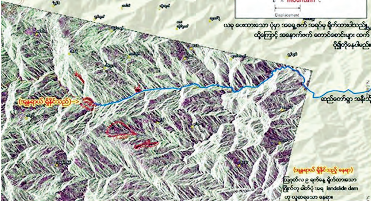
ရှင်းလင်းချက် ■ ရေအိုင်ဖြစ်ပေါ်နေသော နေရာ ■ မူလစီးဆင်းနေသော ချောင်း

ထို့ကြောင့်လည်း ဒေသခံများက သွားရောက်ကြည့်ရှုစစ်ဆေးရန် စီစဉ်နေကြကြောင်း၊ ယင်းနေရာသည် ဆည်တော်ရွာနှင့် အလွမ်းဝေးသော်လည်း မြေပြိုခဲ့လျှင် ရေများအရှိန်အဟုန်ဖြင့် ကျဆင်းလာနိုင်ပြီး ၎င်းတို့ရွာမှာ ရေဘေးအန္တရာယ် ကြုံတွေ့နိုင်ခြင်းကြောင့် စိုးရိမ်နေကြခြင်းဖြစ်သည်။ သဘာဝ မြေပြိုမှုများကြောင့် ကျဉ်းမြောင်းသော ချောင်းမြောင်းများ ပိတ်ဆို့ကာ ဆည်ကဲ့သို့ရေများ စုဝေးနေရာမှ ရေထိန်းနိုင်သည့်နေရာဆုံးအခြေအနေတွင် မြေပြိုကျကာ ယာယီသို့လျော့ခဲ့သော ရေများသည် ရွှံ့နွံများ၊ အမှိုက်သရိုက်များ၊ ဒိုက်များနှင့်အတူ တစ်ဟုန်ထိုးစီးဆင်းမှုကြောင့် ရေစီးကြောင်းအောက်တစ်လျှောက်ရှိ ကျေးရွာများ၌ ပျက်စီးမှုများ ဖြစ်ပေါ်နိုင်ကြောင်း၊ တောင်တန်းဒေသများတွင် ရေခဲအိုင်များ ကျိုးပျက်ခြင်းဖြင့် တောင်ကျ ရေကြောင့် အန္တရာယ်ဖြစ်ပွားသကဲ့သို့ အန္တရာယ်ကြီးမားကြောင်း နှိုင်းယှဉ်သိရှိရသည်။