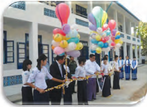
Opening ceremony of Government Technical High School