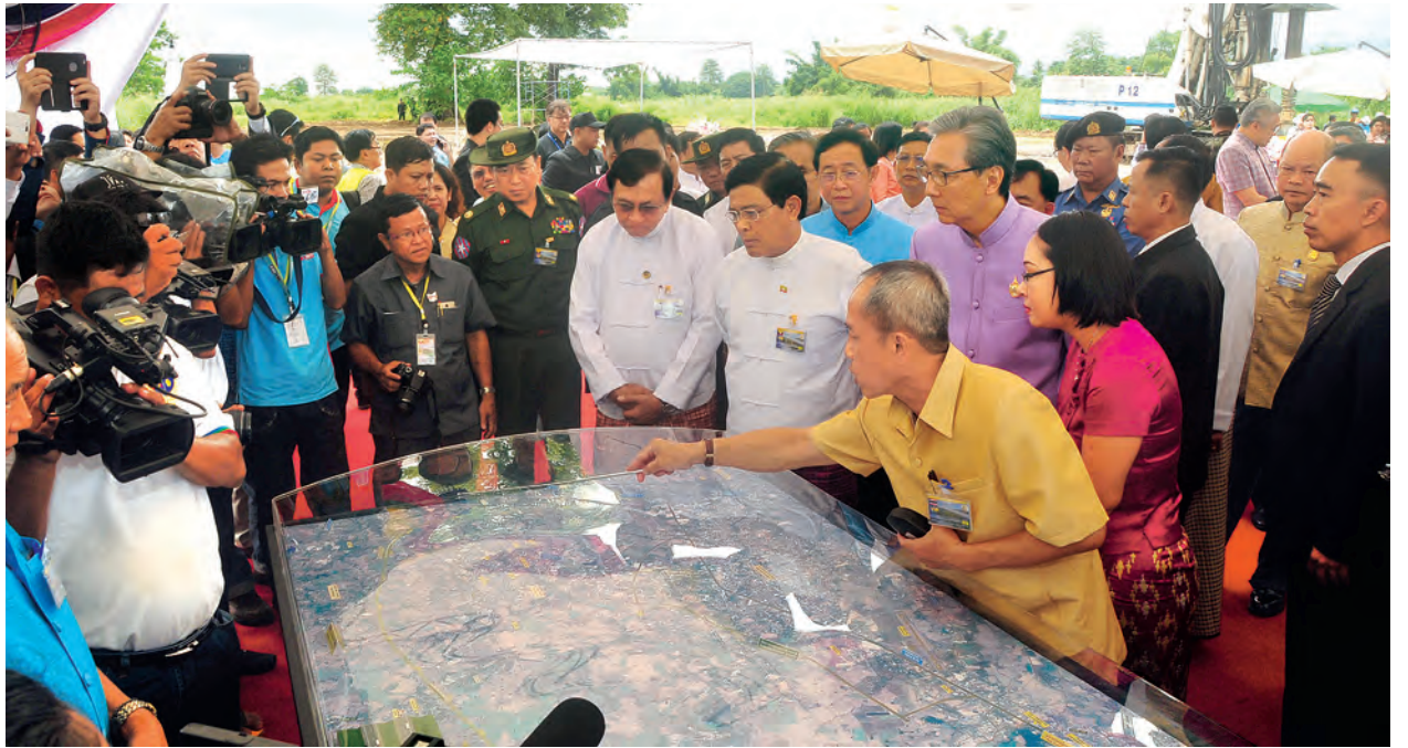
ဒုတိယသမ္မတ ဦးညွှန်ထွန်းနှင့် ထိုင်းနိုင်ငံ ဒုတိယဝန်ကြီးချုပ်တို့ ထိုင်း-မြန်မာ ချစ်ကြည်ရေးတံတား အမှတ်(၂)တည်ဆောက်ရေး ရှင်းလင်းဆောင်ရွက်ခြင်းအားဖြင့် တံတားပုံစံငယ်ကို ကြည့်ရှုစဉ်။

ရှောက်မှုနှင့် တည်ငြိမ်မှုတို့ကို ရှေ့ဆက် တာဝန်ယူကြရမည်ဖြစ်ကြောင်း၊ မျှတသည့် အကျိုးစီးပွားတိုးတက်ဖွံ့ဖြိုးမှုကို ဆောင်ကြဉ်းလာစေမည့် အာရှအမြန်လမ်းမကြီးနှင့် ထိုင်း-မြန်မာ ချစ်ကြည်ရေး ပိုမိုတိုးတက်ကောင်းမွန် အခွင့်ရှိပါစေကြောင်း ပြောကြားသည်။ ထို့နောက် ထိုင်းနိုင်ငံ ဒုတိယဝန်ကြီးချုပ်က မြဝတီ-ကော့ကရိတ် ကြားတွင်ရှိနေသည့်လမ်းကို ပိုမို