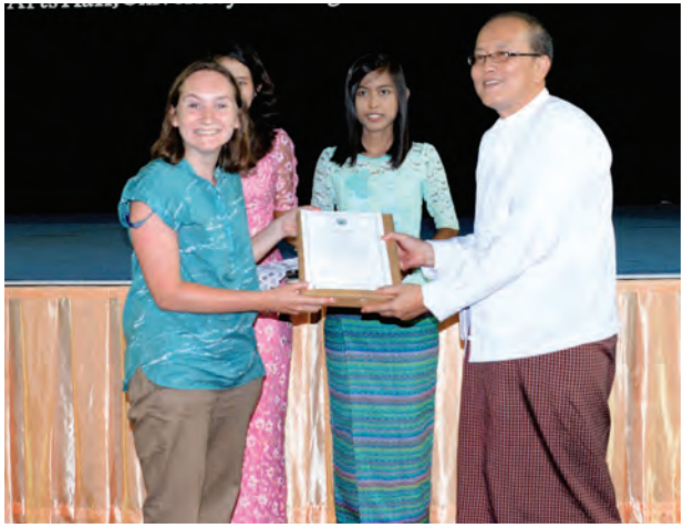
တက္ကသိုလ်တွင် home stay အစီ ပို့ချခြင်းဖြစ်ကြောင်း သိရသည်။ အစဉ်ဖြင့် နှစ်လတာလာရောက် (မြန်မာ့အလင်း)

များက သင်တန်းသား သင်တန်းသူ များအား လက်မှတ်များပေးအပ် ကြသည်။ အောက်စ်ပို့ဒ်(မြန်မာ) အင်္ဂလိပ်စာသင်တန်းသည် နှစ်နိုင်ငံ တက္ကသိုလ်များ နားလည်မှုစာချွန် လွှာ လက်မှတ်ရေးထိုးမှုအရ ဆောင်ရွက်ခြင်းဖြစ်သည်။ ထို့နောက် အောက်စ်ပို့ဒ် တက္ကသိုလ်မှ Native Speaker ကျောင်းသား ကျောင်းသူ များက ရန်ကုန်တက္ကသိုလ် ကျောင်း သား ကျောင်းသူများနှင့် အပြန်အလှန် အမြင်ချင်းဖလှယ်ကြပြီး ရန်ကုန်