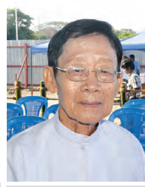
စည်သူရွှေနန်းတင်