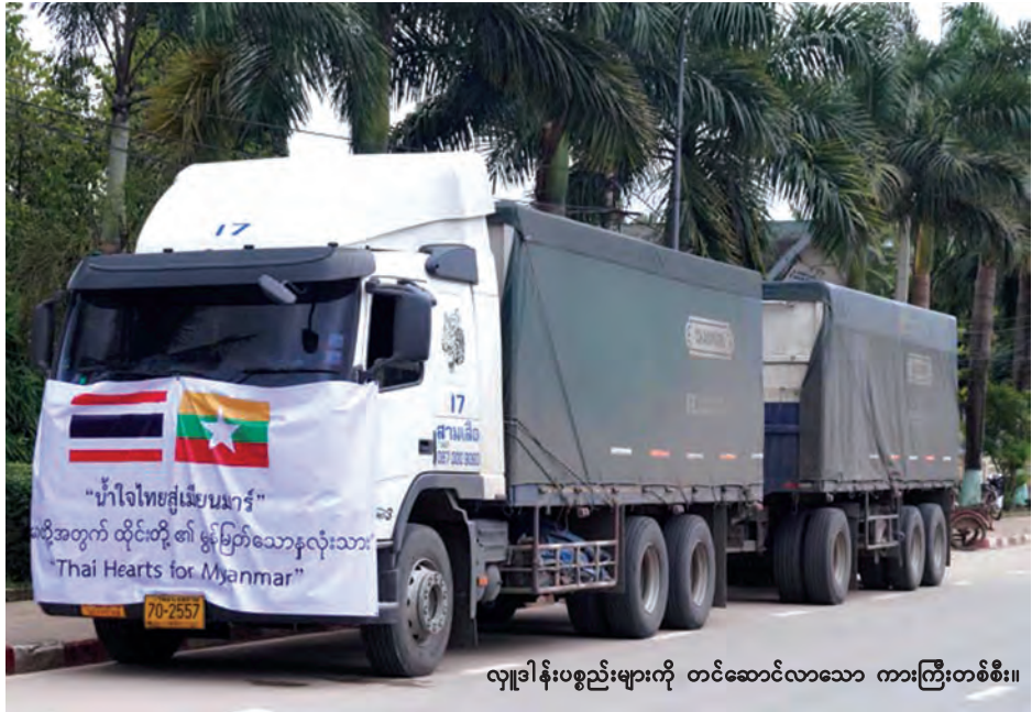
လှူဒါန်းပစ္စည်းများကို တင်ဆောင်လာသော ကားကြီးတစ်စီး။