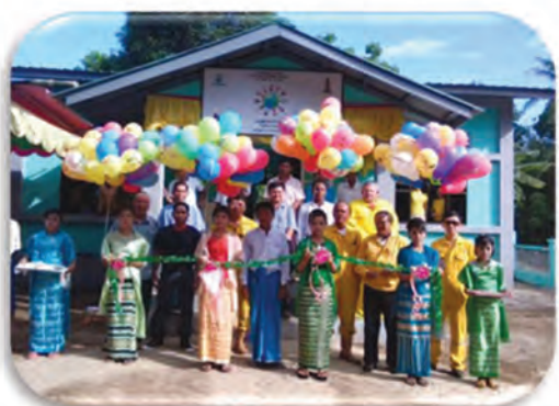
Opening ceremony of ECCD center