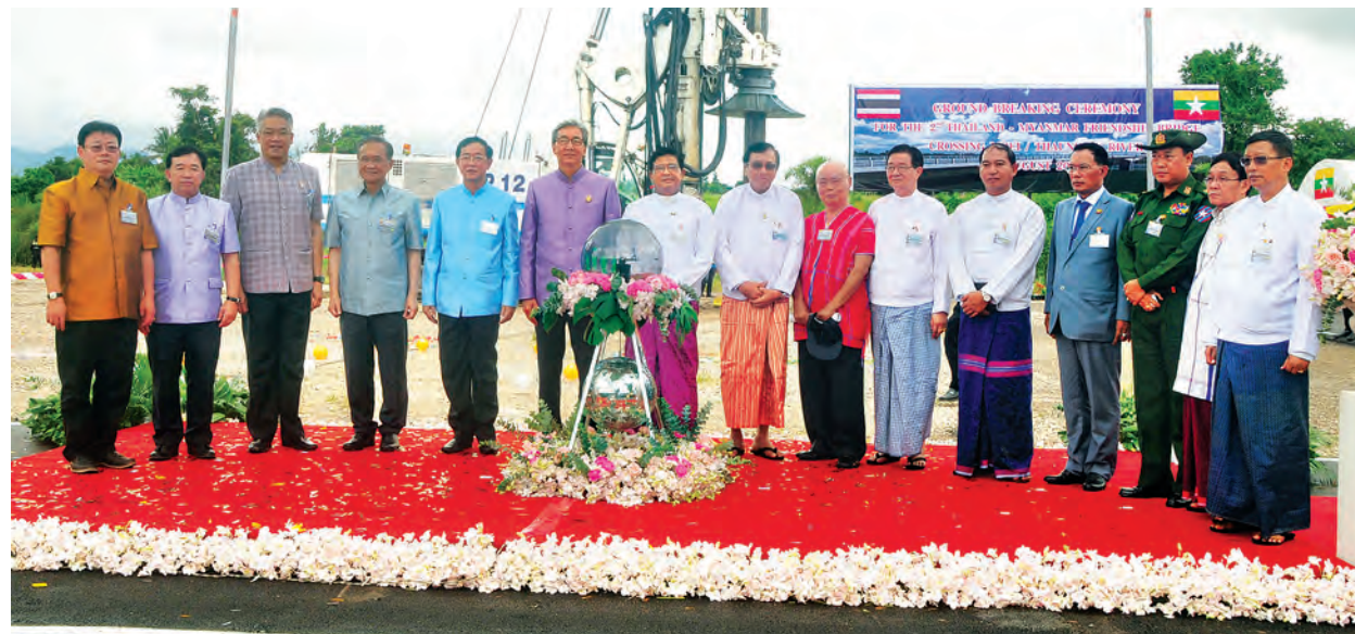
ဒုတိယသမ္မတ ဦးညွှန်ထွန်းနှင့် ထိုင်းနိုင်ငံ ဒုတိယဝန်ကြီးချုပ်တို့ မြန်မာ-ထိုင်း ချစ်ကြည်ရေးတံတား ပန္နက်တင်အခမ်းအနား၌ စုပေါင်းမှတ်တမ်းတင်ဓာတ်ပုံရိုက်စဉ်။

ထိုင်းနိုင်ငံ သယ်ယူပို့ဆောင်ရေးဝန်ကြီးဌာန လမ်းဦးစီးဌာန ညွှန်ကြားရေးမှူးချုပ်က ချစ်ကြည်ရေးတံတား အမှတ်(၂) တည်ဆောက်သွားမည့် ကိစ္စရပ်များကို ရှင်းလင်းပြောကြားသည်။ ယင်းနောက် ထိုင်းနိုင်ငံ ဒုတိယဝန်ကြီးချုပ် Dr.Somkid Jatusripitak က အရှေ့-အနောက် စီးပွားရေး ဧကန်ဆက်သွယ်မှုသည် မြန်မာနိုင်ငံနှင့် ထိုင်းနိုင်ငံတို့အကြားတွင် ရှိသည့် ပိုမိုတိုးတက်လာမည့် ဆက်သွယ်ရေးလမ်းကြောင်းများအတွက် အဆိုပါတံတားကို ဆောက်လုပ်ခဲ့ခြင်းဖြစ်ကြောင်း၊ ၎င်းချစ်ကြည်ရေးတံတားသည် မကြာမီ တာဝန်ခံနိုင်အောင် တည်ဆောက်မည့် အထူးစီးပွားရေးဇုန်အတွက်လည်း အထောက်အကူပြုနိုင်မည် ဖြစ်ကြောင်း၊ ယခုစီမံကိန်းသည် ထိုင်းနှင့် မြန်မာနိုင်ငံအပြင် နိုင်ငံတကာ ကုန်သွယ်ရေးကိုလည်း အထောက်အကူဖြစ်ပြီး အာဆီယံအမြန်လမ်းပုံစံအတိုင်း အဆင့်မီတည်ဆောက်မည့် တံတားဖြစ်ကြောင်း ပြောကြားသည်။ ထို့နောက် ဒုတိယသမ္မတက မြန်မာ-ထိုင်း ချစ်ကြည်ရေးတံတားအမှတ်(၂) ပန္နက်တင် မင်္ဂလာအခမ်းအနားသည် နှစ်နိုင်ငံအကြား ပူးပေါင်းဆောင်ရွက်မှု ပိုမိုမြှင့်တင်ရေးအတွက် သန္နိဋ္ဌာန်ချမှတ်ထားသည်ဟု ယုံကြည်ကြောင်း၊ မြန်မာနိုင်ငံ ဆောက်လုပ်