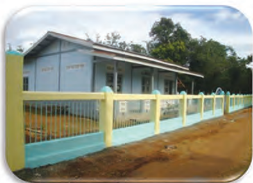
Established ECCD center

Built 53 Early Child Care Development (ECCD) centers since 1997 and trained community members along the Yetagun pipeline in Early Child Care Development skills