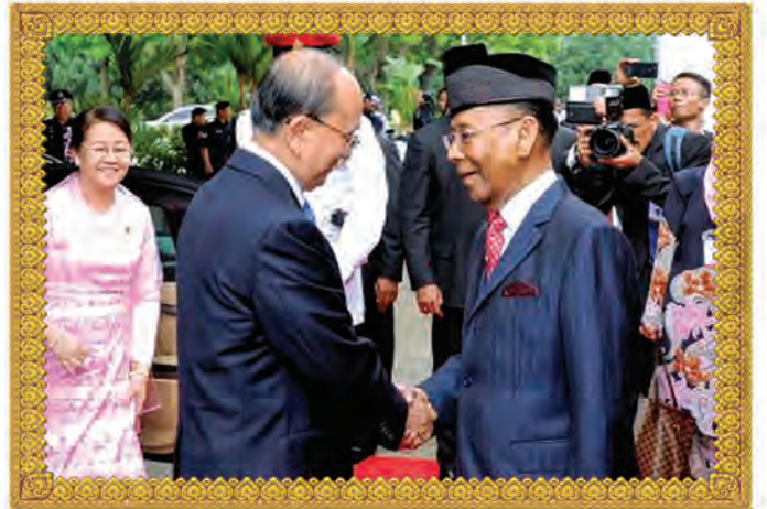
President U Thein Sein visited Malaysia at the invitation of His Majesty Yang di-Pertuan Agong Tuanku Abdul Halim Mu'adzam Shah

Please accept, your Majesty, the assurances of my highest consideration.