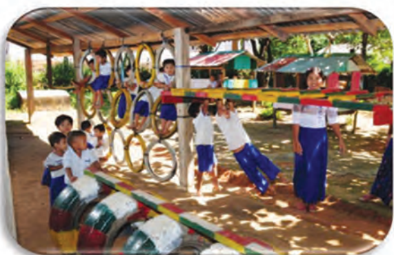
ECCD children's outdoor activities