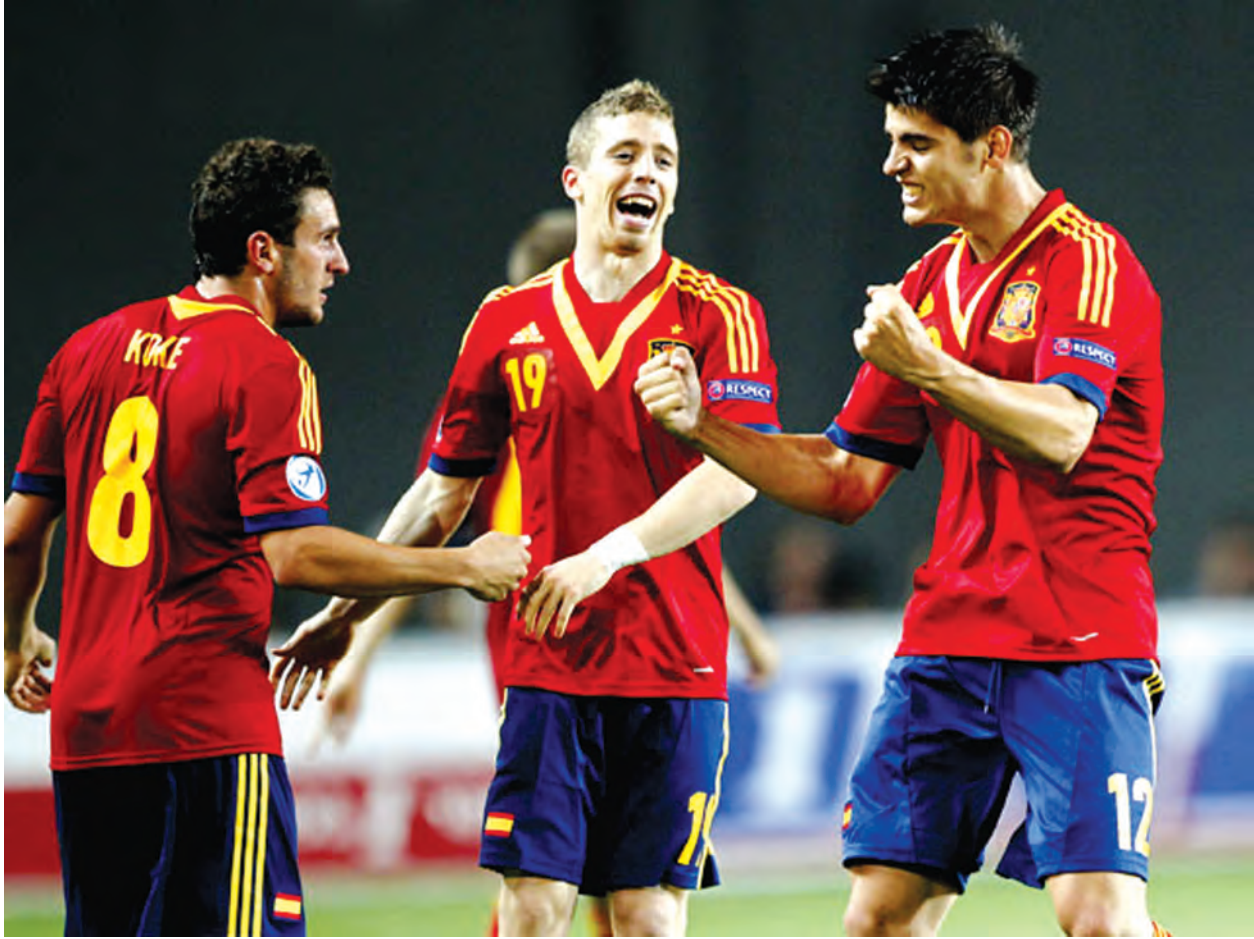
နည်းနေတာမို့ ဒီပွဲမှာ အကြိတ်အနယ်ကစားရမယ့် အနေအထားပါပဲ။ ဟန်ဂေရီတို့က အီတလီလူငယ်တွေကို ဂိုးမရှိသရေပွဲကစားနိုင်တာမို့ ဒီပွဲမှာ အသင်းလိုက်စုစည်းမှုကောင်းကောင်းနဲ့ နိုင်ပွဲကို ရအောင်ရှာဖွေပါလိမ့်မယ်။

ရှုံးပွဲတွေဆက်တိုက်ကြုံတွေ့နေရတဲ့ လက်ချင်စတိန်းတို့ အခုပွဲလည်း အိမ်ကွင်းမှာဆိုပေမယ့် ပွဲကစားမဖြစ်နေပါဘူး။ အစွမ်းနဲ့ အယ်လ်ဘေးနီးယားအသင်းတွေကို ဂိုးပြတ်ရှုံးထားတဲ့ လက်ချင်စတိန်းဟာ တိုက်စစ်ပိုင်းသိသိသာသာအား