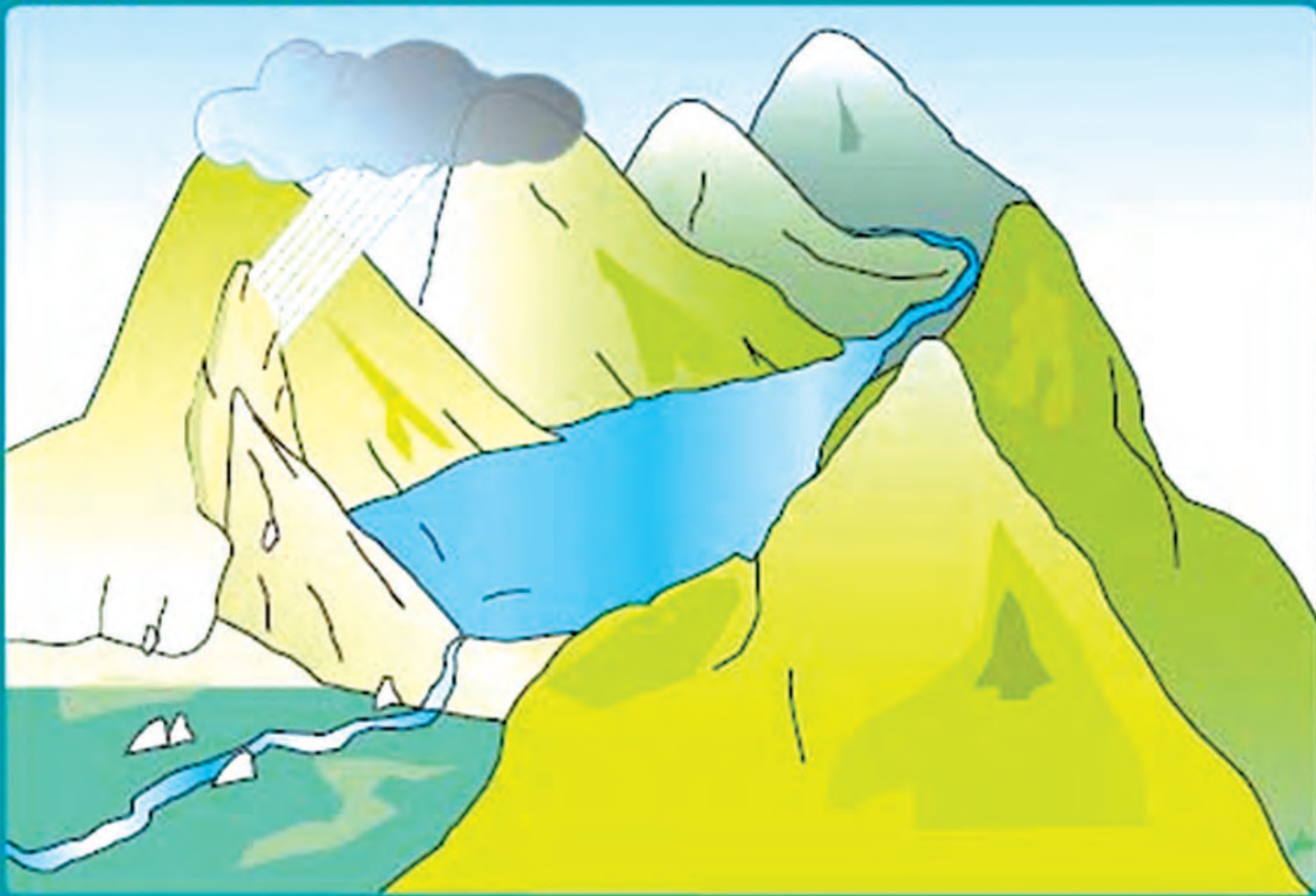
သဘာဝမြေပြိုမှုကြောင့် ကျဉ်းမြောင်းသော ချောင်းများကို ပိတ်ဆို့ကာ ဆည်ကဲ့သို့ရေများစုဝေးလာပုံ

မြေပြိုစက်-စာတည်းမှူး: ဝမ်ဂျ-၃၆၁၄၂၊ စာတည်းအဖွဲ့: ဝမ်ဂျ-၃၆၁၄၂၊ စာတည်းအဖွဲ့: ဝမ်ဂျ-၃၆၁၄၂၊ စာတည်းအဖွဲ့: ဝမ်ဂျ-၃၆၁၄၂၊ စာတည်းအဖွဲ့: ဝမ်ဂျ-၃၆၁၄၂