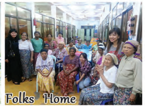
Ladies Old Folks Home