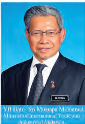
YB Dato' Sri Mustapa Mohamed Minister of International Trade and Industry of Malaysia

Ministry of International Trade and Industry (MITI) နှင့် Malaysia External Trade Development Corporation (MATRADE) တို့တို့ ကိုယ်စားပြုလျက်၊ မိမိအနေဖြင့် ပြည်ထောင်စုသမ္မတမြန်မာနိုင်ငံတော်အစိုးရနှင့် ပြည်သူ့များသားစွာ ရွှေ့ပြောင်းနေထိုင်ရေးနှင့် အလုပ်သမားရေးရာဝန်ကြီးဌာနအဖွဲ့အစည်းများအား နွေးထွေးပျော်ရွှင်စွာ ဆက်သွယ်လိုက်ပါသည်။