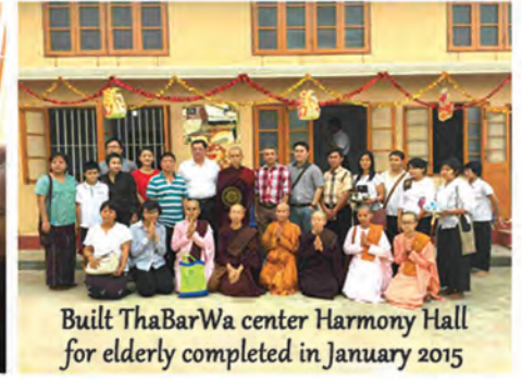
Built ThaBarWa center Harmony Hall for elderly completed in January 2015