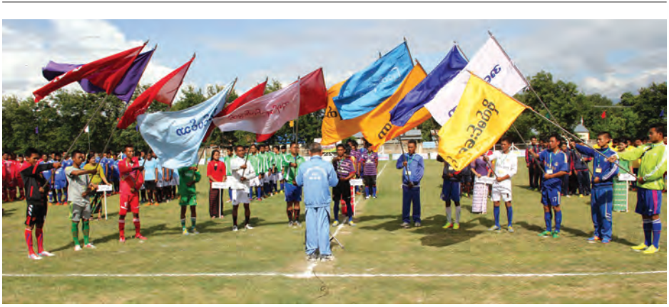
နေပြည်တော်ကောင်စီနယ်မြေ တပ်ကုန်းမြို့ မြို့နယ်အုပ်ချုပ်ရေးမှူးဖလား ရပ်ကွက်၊ ကျေးရွာဘေးလုံးပြိုင်ပွဲကို ဩဂုတ် ၂၇ ရက်က မြို့နယ်အားကစားကွင်းကြီး၌ကျင်းပရာ ကျေးရွာဘေးလုံးအသင်းပေါင်း ၁၃ သင်း အားကစား သမ္မတအဖွဲ့ချုပ်ပြုကြစဉ်။