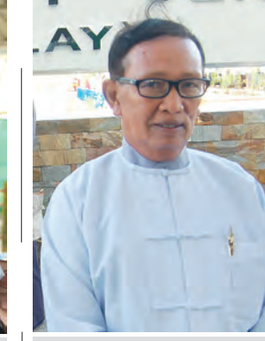
ဒါရိုက်တာ မောင်ယဉ်အောင်