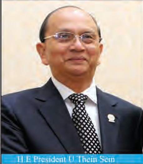
H.E. President U Thein Sein

His Majesty Almu'Tasimu Billahi Muhibbuddin Tuanku Alhaj Abdul Halim Mu'Adzam Shah Ibni Almarhum Sultan Badlishah the Yang Di Pertuan Agong of Malaysia XIV.