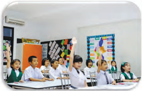
School children enjoying their study

Built 53 Early Child Care Development (ECCD) centers since 1997 and trained community members along the Yetagun pipeline in Early Child Care Development skills