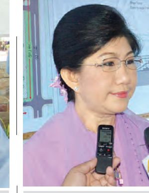
ဒေါ်စန္ဒာခင် (ဒုတိယဝန်ကြီး)