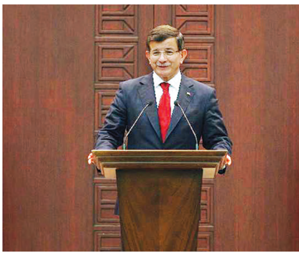
ဝန်ကြီးချုပ်သည် အတိုက်အခံပါတီများကို အကြံရွေးကောက်ပွဲအစိုးရအဖွဲ့တွင် ပါဝင်ရန် တိုက်တွန်းပြောဆိုခဲ့သော်လည်း စီအိတ်ချီပီပါတီနှင့် အမ်အိတ်ချီပီပါတီတို့က ပါဝင်ရန် ငြင်းဆိုခဲ့ကြောင်း သိရသည်။ (ဆင်ဟွာ)

အန်ကာရာ ဩဂုတ် ၂၉ တူရကီဝန်ကြီးချုပ် အာမက် ဒါဘူတိုဂလူသည် ဩဂုတ် ၂၉ ရက်မှ နိုဝင်ဘာ ၁ ရက်နေ့အထိ ကျင်းပရန် လျာထားသော ရှောင်တခင် ရွေးကောက်ပွဲ (snap election) မတိုင်မီ အစိုးရလုပ်ငန်းများ ဆောင်ရွက်ရန်အတွက် အာဏာခွဲဝေအုပ်ချုပ်မည့် ကြားဖြတ် အစိုးရတစ်ရပ်ကို ဖွဲ့စည်းခဲ့သည်။ အစိုးရအဖွဲ့ ရွေးကောက်ပွဲတွင် အဓိကအားဖြင့် ဗျူရိုကရက်များ၊ အများအားဖြင့် ဝန်ကြီးရုံးများအောက်တွင် တာဝန်ထမ်းဆောင်နေသော လက်ထောက်အတွင်းဝန်များနှင့် အတိုက်အခံပါတီမှ ဝန်ကြီးသုံးဦးတို့ဖြင့် ဖွဲ့စည်းထားသည်။ အစွတန်ဘူလ်ရဲဌာနအကြီးအကဲ ဆာလမီ အယ်လ်တီနေဒ်ကို ကြားဖြတ်ပြည်ထောင်စုဝန်ကြီးအဖြစ် ခန့်အပ်ခဲ့သည်။ ဆိုင်အက်တ် ရီလ်မက်စ်နှင့် တူကူတက်ခီတို့ကို ဒုတိယဝန်ကြီးချုပ်များအဖြစ် ခန့်အပ်ခဲ့ကြောင်း သိရသည်။ လက်ရှိ တာဝန်ထမ်းဆောင်နေသော ဒုတိယဝန်ကြီးချုပ်များဖြစ်သည့် နူမန်ကာတယ်မက်နှင့် ရယ်ကင်းအက်ဒိုဂ်တို့ကို ၎င်းတို့ ရာထူးတာဝန်အတိုင်း ဆက်လက် တာဝန်ထမ်းဆောင်စေပြီး အေကေပီပါတီမှ အယ်လီရီအာလာဘိုရ်ကို စွမ်းအင်ဝန်ကြီးအဖြစ် ခန့်အပ်ခဲ့သည်။ အာဒိုဂ်က ဝန်ကြီးချုပ်စာရင်းအကြမ်းကို အတည်ပြုပြီးနောက် ဒါဘူတိုဂလူက ဝန်ကြီးများကို ထုတ်ပြန်ကြေညာခဲ့ခြင်းဖြစ်သည်။