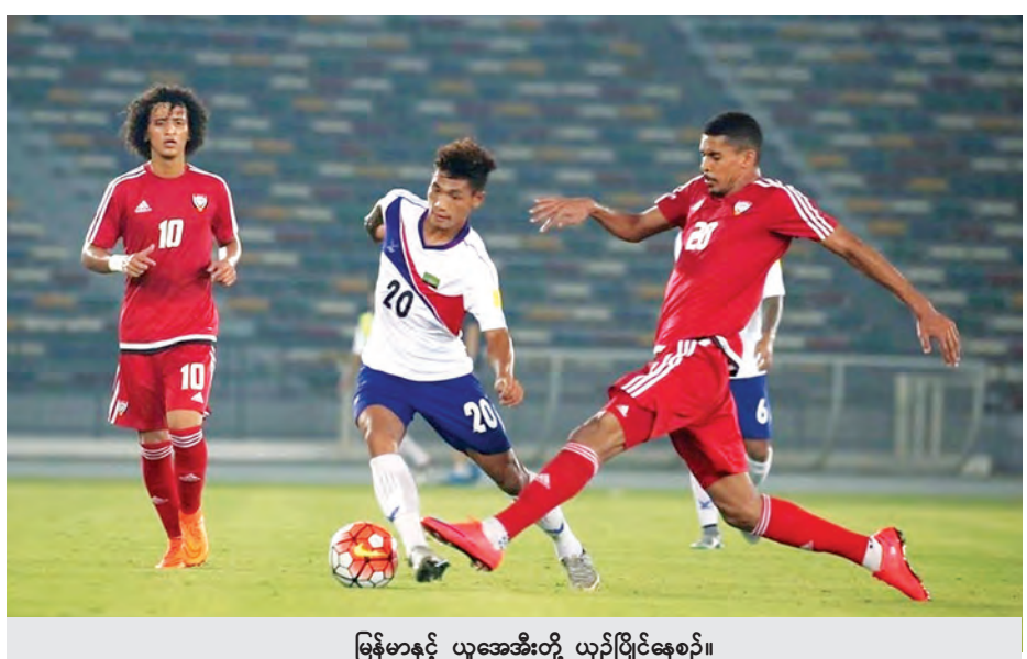
မြန်မာနှင့် ယူအေအီးတို့ ယှဉ်ပြိုင်နေစဉ်။