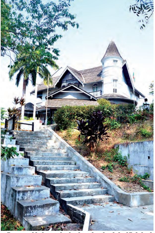
အခြားသော မိန့်ခွန်းကောက်နုတ်ချက်များကိုလည်း ပိုလ်ချုပ်ပြတိုက်တွင် မြင်တွေ့ရသည်။

အဆောက်အအုံသည် ရှေးဟောင်း အမွေ အနှစ် အဆောက်အအုံဟူသည့် ဂုဏ်ပုဒ် ထက်ပင် ပိုမိုကြီးကျယ်ခမ်းနားပြီး မြန်မာ့ လွတ်လပ်ရေးဗိသုကာ ပိုလ်ချုပ်အောင်ဆန်း လုပ်ကြံမခံရမီ သူ၏ မိသားစုနှင့်အတူ နေထိုင်ခဲ့