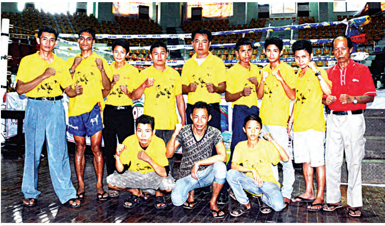
ဟံသာဝတီသား ရိုးရာကလပ်အဖွဲ့သားများကို တွေ့ရစဉ်။

လတ်တလောအနေဖြင့် လေ့ကျင့်ရေး ပစ္စည်းများဝယ်ယူကာ လေ့ကျင့်လျက် ရှိပြီး နောက်ပိုင်းတွင် ရိုးရာလက်တွေ့ ကိုယ်ပိုင်စင်တစ်ခုကိုလည်း ဝယ်ယူ တည်ဆောက်သွားမည်ဖြစ်ကြောင်း