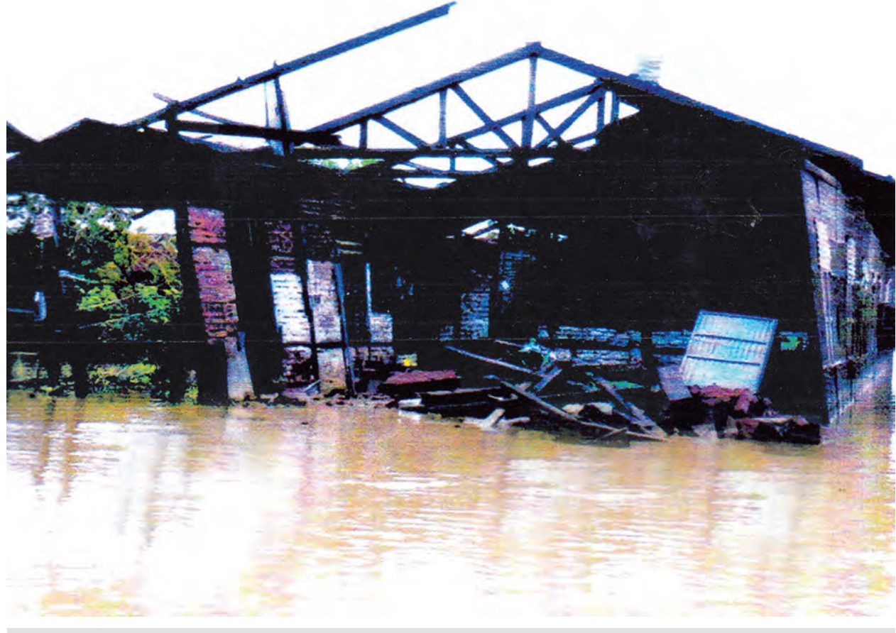
ပုဏ္ဏားကျွန်းမြို့နယ် ပြင်လျားရှည်ရွာ အထက(ခွဲ) မုန်တိုင်းကြောင့် ပျက်စီးသွားပုံ။

ယခု သဘာဝဘေးဆိုးဒဏ်ခံရသော ရခိုင်ဒေသပညာရေးလုပ်ငန်းများ ပြန်လည်ထူထောင်ရေးလုပ်ငန်းများကို လျှပ်တစ်ပြက် ဆောင်ရွက်ရန်နှင့် အောင်မြင်မည်မဟုတ်ဘဲ ရေတိုရေရှည်စီမံချက်ဖြင့် ဆောင်ရွက်မှသာ မူလအခြေအနေသို့ ရောက်ရှိနိုင်မည်ဖြစ်ကြောင်း လေ့လာသိရှိမှုများကို ရေးသားလိုက်ရပေသည်။