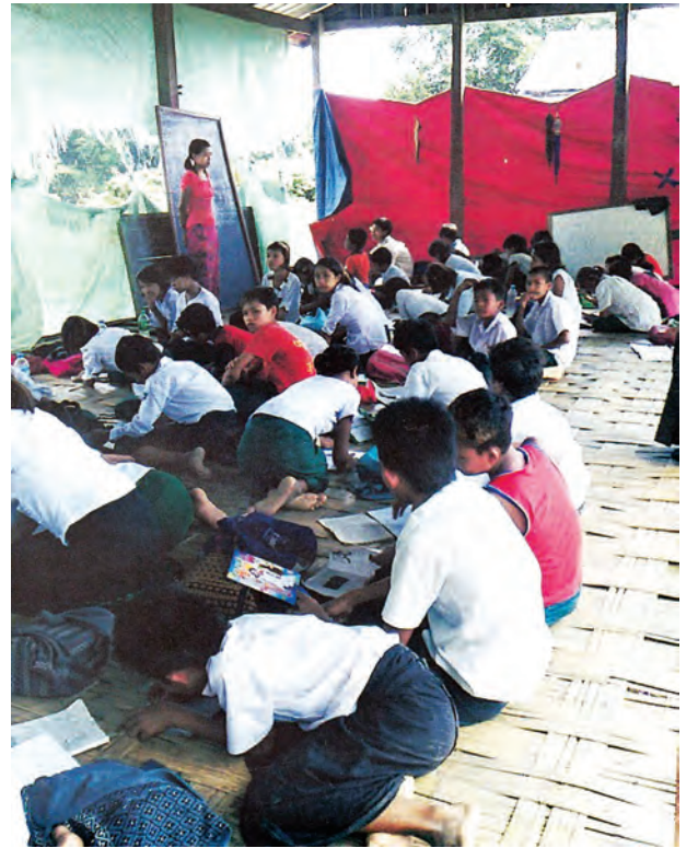
မင်းပြားမြို့နယ်၊ င/တက် မူ(လွန်)ကျောင်းပျက်စီး၍ ယာယီပြင်ဆင်ကာ စာသင်နေပုံ။

ကြသည်။ ရက်ရက်ရောရော လျှော့ဒါန်းခဲ့ကြသည်။ မြန်မာပြည်တစ်နယ်လုံးမှ အဖွဲ့အစည်းများလည်း ပါဝင်လာကြသည်။ လျှော့ဒါန်းလာကြသည်။ ပြည်နယ်တွင်းနှင့် ပြည်နယ်ပြင်ပလျှော့ဒါန်းကြသော ပစ္စည်းများတွင်လည်း ပုံနှိပ်စာအုပ်များ၊ ပလာစတစ်အုပ်များနှင့်စာရေးကိရိယာ မျိုးစုံတို့ပါဝင်ကြောင်း မြင်တွေ့ရသည်။ အချို့ဆို တစ်ဆင့်ကြားရသည်။