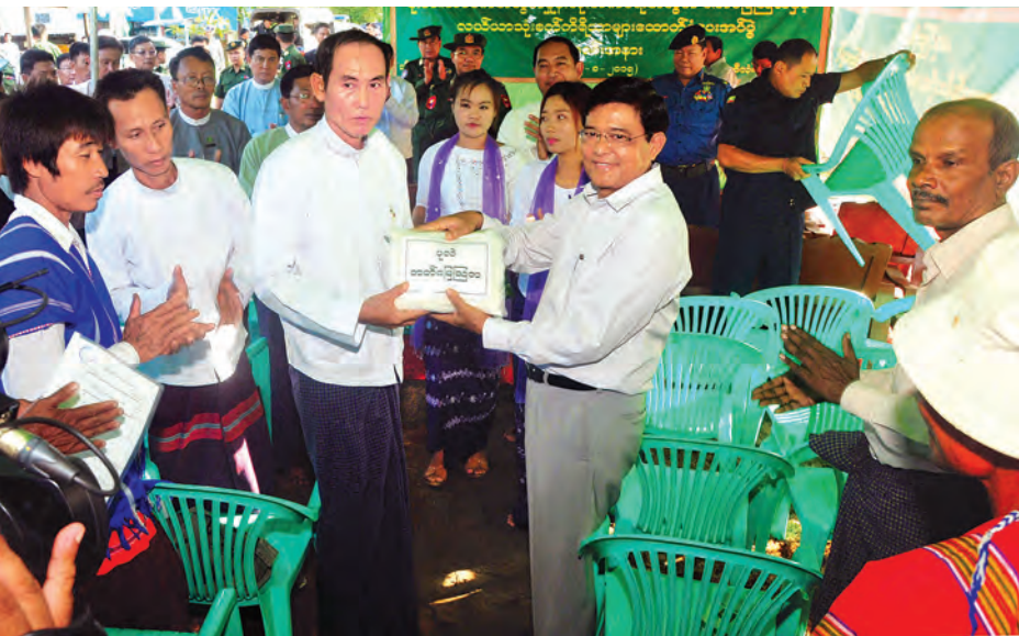
ဒုတိယသမ္မတ ဦးညွှန်ထွန်း တောင်သူများအား ဓာတ်မြေဩဇာများ ထောက်ပံ့ပေးအပ်စဉ်။ (သတင်းစဉ်)

ထောက်ပံ့ပေးအပ်ပြီး တောင်သူများအား ရင်းရင်းနှီးနှီး နှုတ်ဆက်အားပေးစကားပြောကြားသည်။ ဆက်လက်၍ လှိုင်းဘွဲ့မြို့၊ ထိလုံကျေးရွာရှိ ဦးရာမူး၏ စပါးစိုက်ခင်းတွင် စုပေါင်း