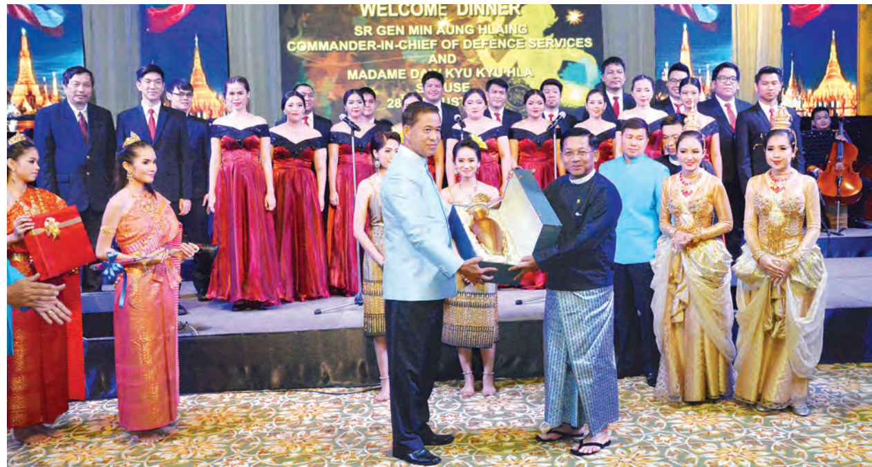
လက်ဆောင်ပစ္စည်းများ အပြန်အလှန်ပေးအပ်ကြသည်။ (အပေါ်) (မြဝတီ)

မှူးကြီး မင်းအောင်လှိုင်နှင့် ဇနီး၊ ထိုင်းဘုရင့်တပ်မတော်ကာကွယ်ရေးဦးစီး ချုပ် General Worapong Sanganetra နှင့် ဇနီးတို့သည် အထိမ်းအမှတ်