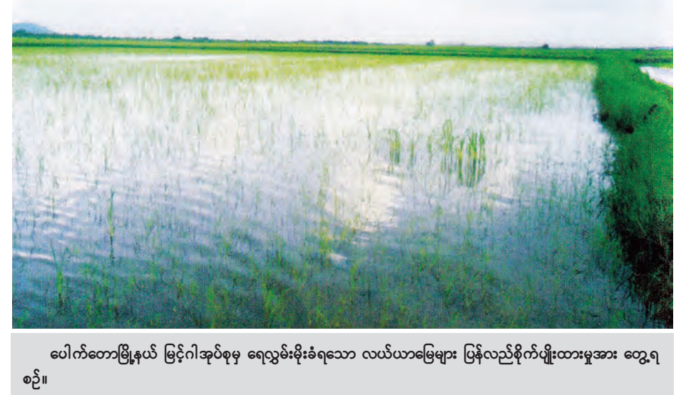
ပေါက်တောမြို့နယ် မြင့်ဂါအုပ်စုမှ ရေလွှမ်းခံရသော လယ်ယာမြေများ ပြန်လည်စိုက်ပျိုးထားမှုအား တွေ့ရ စဉ်။