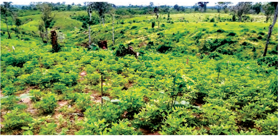
ပြောပြသည်။ ရေတာရှည်မြို့ စိုင်းရဲ ကျောက်မဆင်သစ်တော အနောက် စကွေး၊ မရိုးခုံ၊ သနပ်ခုံ၊ ကြီးပိုင်းဒေသများ၌ မြေပဲကို ဆွာမြို့ အနောက်ဒေသများရှိ အဓိကစိုက်ပျိုးကြပြီး ဈေးကွက်သို့ အများဆုံးတင်ပို့ကာ ဝင်ငွေကောင်း မွန်သည့် ဆီထွက်သီးနှံလည်း ဖြစ်သည်။

ပဲခူးတိုင်းဒေသကြီး ရေတာ ရှည်မြို့နယ် သစ်တောကြီးပိုင်းဒေသ များ၌ မိုးမြေပဲများကို အဓိကစိုက် ပျိုးကြကာ ယခုနှစ် စိုက်ပျိုးသော တောင်သူများ၏ မြေပဲစိုက်ခင်းများ ကို ကြွက်များကိုဖြတ်ဖျက်ဆီးနေ သည့်အတွက် အခက်တွေ့ကြရ ကြောင်း ဒေသခံတစ်ဦးက ပြောသည်။ “တောင်ယာပဲဆိုတာက အလွန် ကောင်းပါတယ်ဆိုရင်တောင် မျိုးသာ သာရကြတာ၊ တောနဲ့နီးတဲ့နေရာတွေ မှာ ကြွက်တွေအားကိုက်တာ၊ မျိုး ဖိုးတောင်ဒီနှစ်တွေ ရပျံမလားမသိ ဘူး” ဟု ကျောက်မဆင်သစ်တော ကြီးပိုင်းအတွင်း တောင်ယာမြေပဲ စိုက်ပျိုးသည့် တောင်သူတစ်ဦးက