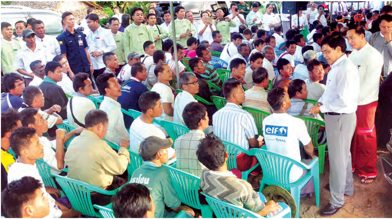
ဒုတိယသမ္မတ ဦးညွှန်ထွန်း ထိလုံကျေးရွာ၌ ဒေသခံပြည်သူများအား အားပေးစကားပြောကြားစဉ်။ (သတင်းစဉ်)

ရှင်းလင်း တင်ပြမှုများအပေါ် ဒုတိယသမ္မတက ဘေးသင့်ပြည်သူများအတွက် ထောက်ပံ့လှူဒါန်းထားသည့် ပစ္စည်းနှင့် အလှူငွေများကို စနစ်တကျ မှတ်တမ်းထား ဆောင်ရွက်ရေး၊ ဘေးသင့်ဒေသများသို့ အချိန်နှင့်တစ်ပြေးညီ လက်ရောက်ဖြန့်ဝေပေးနိုင်ရေး၊ ကြီးကြပ်ရေးအဖွဲ့များတွင် ရပ်ရွာမှ လေးစား