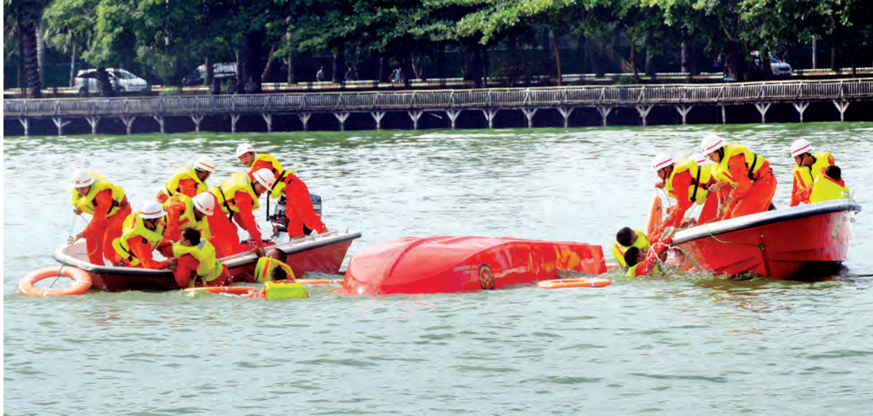
ရန်ကုန်မြို့၊ ကန်တော်ကြီး၌ စက်လှေဖြင့် ရှာဖွေရေးနှင့် ကယ်ဆယ်ရေးလုပ်ငန်း သရုပ်ပြသစဉ်။ (သတင်းစဉ်)

ကျေးဇူးစခန်းတွေ မရှိတဲ့အတွက် အတိအကျတော့ မသိရသေးပါဘူး။ ဟားခါးက အဖွဲ့နဲ့ ဆက်သွယ်ပြီး စုံစမ်းနေပါတယ်။ မနေ့က တွန်းဖိခြေပြုမှုက မိုးကြီးပြီး တောင်ကျရေကြောင့် မြေပြိုမှုဖြစ်တယ်လို့ သိရပါတယ်။ အခုလို ဖြစ်ခဲ့သော်လည်း မြေပြိုမှုတွေ ဆက်ပြီးဖြစ်နိုင်ခြေနည်းတယ်လို့ ခန့်မှန်းရပါတယ်။ လတ်တလော မြေပြိုမှုကို ခံလိုက်ရပေမယ့် နောက်ပိုင်းမှာ ဖြစ်နိုင်ခြေနည်းသွားပြီ ဖြစ်ပါတယ်။”