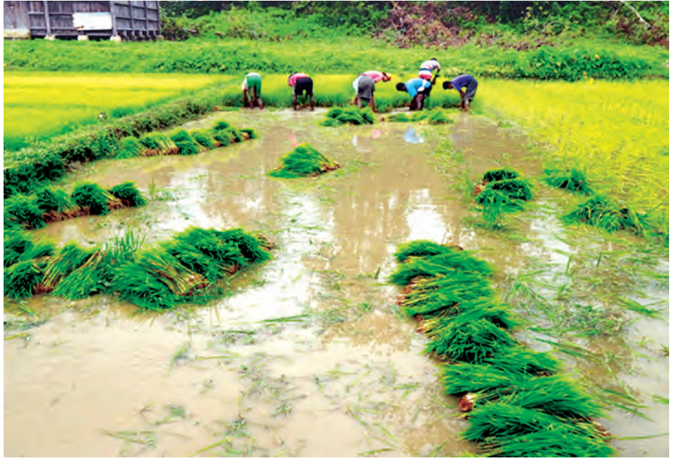
ရခိုင်ပြည်နယ်တွင် လယ်မြေများတွင် စပါးများပြန်လည်စိုက်ပျိုးနေမှုကို တွေ့ရစဉ်။

“ရေကြီးနစ်မြုပ်ခဲ့တဲ့အတွက် မြေရဲ့ သစ်ဆွေးဓာတ် တွေ (Soil Organic Matter) ဆုံးရှုံးသွားလေ့ရှိပါတယ်။ ဒါကြောင့် အခြားဒေသတွေက ရနိုင်သမျှ သစ်ဆွေး မြေဩဇာ၊ သဘာဝမြေဩဇာတွေကို ထည့်သွင်းပေးသင့် ပါတယ်။ နန်းတင်ပို့ခဲ့တာကြောင့် မြေသားဖွဲ့စည်းမှုမှာ ရွံ့စေး၊ သစ်ဆွေးဓာတ် ပါဝင်မှုလျော့နည်းပြီး မြေဖွဲ့စည်းမှု