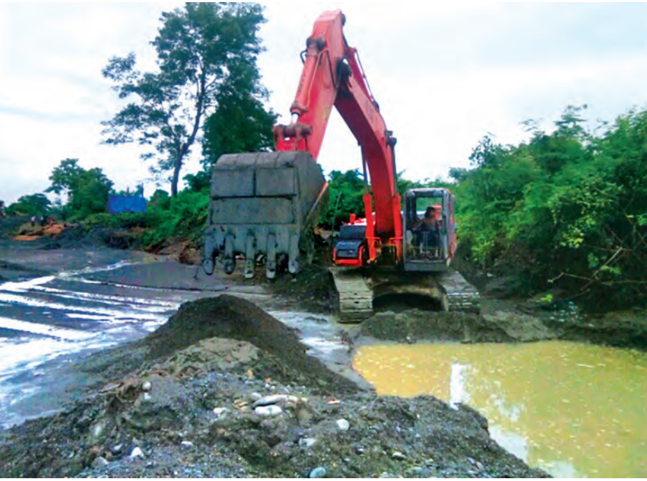
ကလေးဒေသ ပြန်လည်ထူထောင်ရေးလုပ်ငန်းများ ဆောင်ရွက်စဉ်။

သဘာဝဘေးအန္တရာယ်ကြောင့် မြန်မာတစ်နိုင်ငံလုံး ရှိ မြို့နယ်ပေါင်း ၁၈၄ မြို့နယ်၊ ကျေးရွာအုပ်စုပေါင်း သုံးထောင်ကျော်နှင့် တောင်သူပေါင်း နှစ်သိန်းကျော်တို့ စိုက်ပျိုးထားသည့် မိုးသီးနှံစုစုပေါင်းစေ ၁၄ သိန်းကျော် အနက် မိုးစပါးစိုက် စေ ၁၂ သိန်းကျော် ရေလွှမ်းမိုး ခံခဲ့ရသည်။