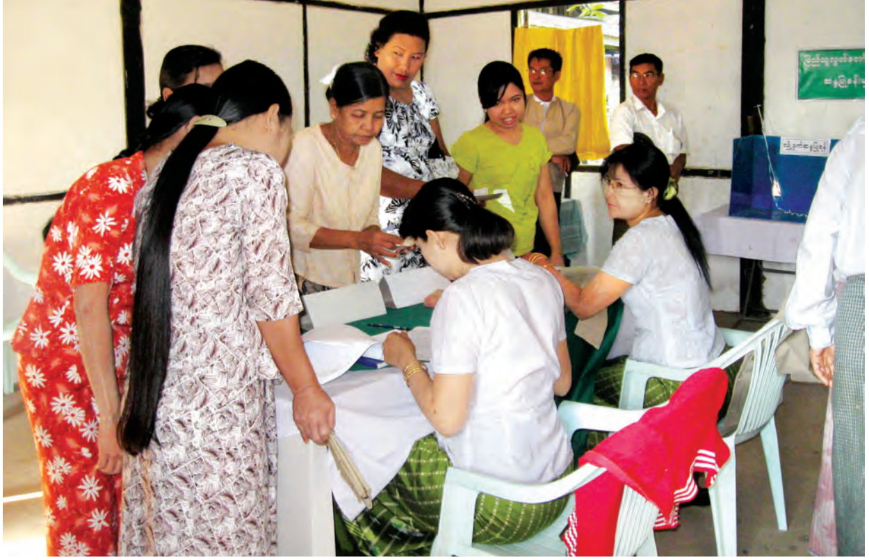
၂၀၁၀ ပါတီစုံဒီမိုကရေစီ အထွေထွေရွေးကောက်ပွဲတွင် ပဲခူးမြို့နယ် ရှင်စောပုရပ်ကွက် မဲရုံအမှတ်(၁)၌ မဲဆန္ဒရှင်ပြည်သူများ ဆန္ဒမဲပေးနေကြစဉ်။ (သတင်းစဉ်)

ဆန္ဒပြုရမည့်နေ့တွင် ရပ်ကွက်/ကျေးရွာခွဲအဖွဲ့ဝင်နှစ်ဦးက မဲရုံကိုယ်စား လှယ်များ/ မဲရုံအကူ ကိုယ်စားလှယ်များ လိုက်ပါလျက် မဲဆန္ဒရှင်၏ နေအိမ်