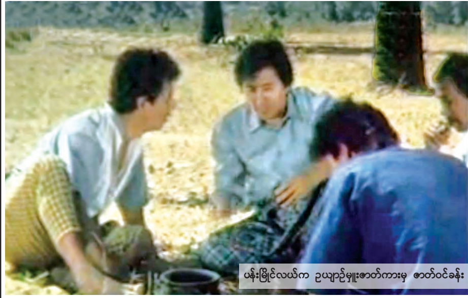
ပန်းမြိုင်လယ်က ဥယျာဉ်မျိုးဇာတ်ကားမှ ဇာတ်ဝင်ခန်း