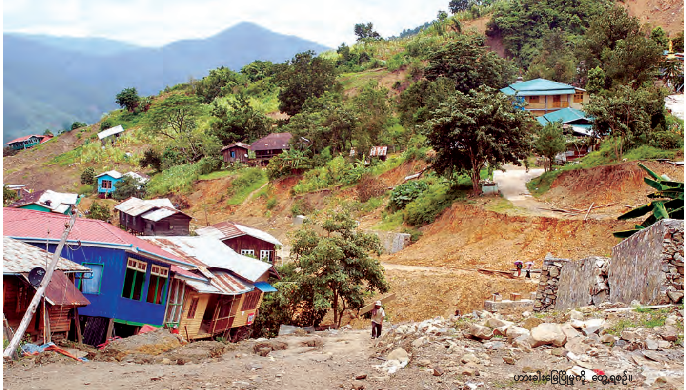
ဟားခါးမြေပြိုမှုကို တွေ့ရစဉ်။

တွေ့ဆုံမေးမြန်း-မင်းသစ် စာတို-နေလင်း(သတင်းစဉ်)