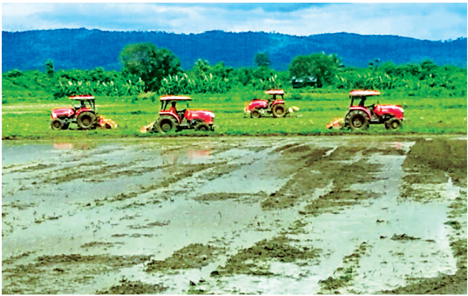
ကလေးမြို့နယ်တွင် ရေကြီးနစ်မြုပ်ခြင်းကြောင့် လယ်မြေများ နုန်းများဖုံးလွှမ်းနေသဖြင့် စိုက်ပျိုးနိုင်ရန် ပြန်လည်ထွန်ယက်နေစဉ်။