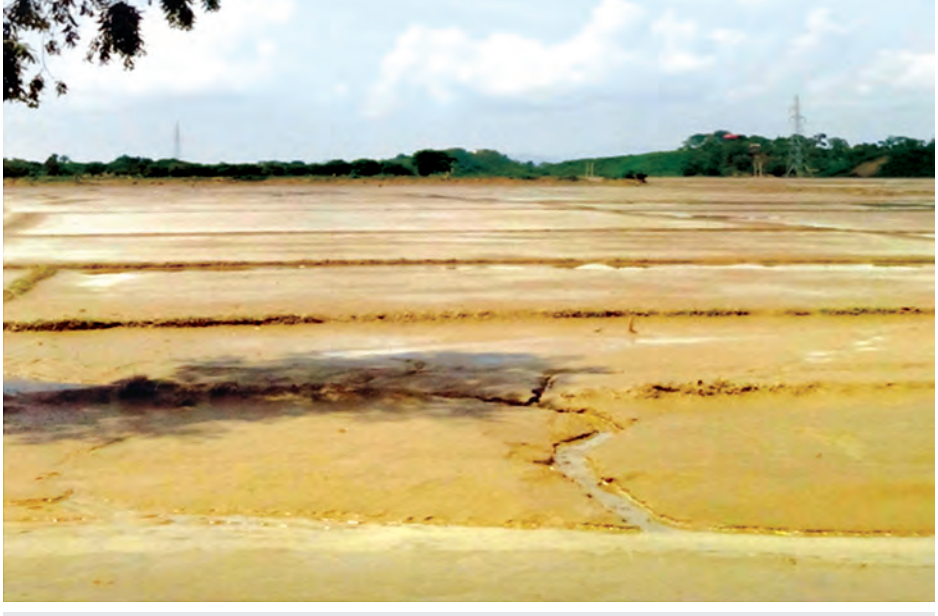
ရခိုင်ပြည်နယ်တွင် လယ်မြေများ၌ နန်းများဖုံးလွှမ်းမှုကို တွေ့ရစဉ်။

ရခိုင်ပြည်နယ်၌ နန်းဖုံးစေ ၂၁၇၆၈ စေနှင့် သဲ၊ ကျောက်စရစ်ဖုံး စေ ၆၀၀၀ ကျော်ရှိရာ မိုးသီးနှံကို အချိန်မီပြန်လည်စိုက်ပျိုးရန် မဖြစ်နိုင်တော့၍ လာမည့်