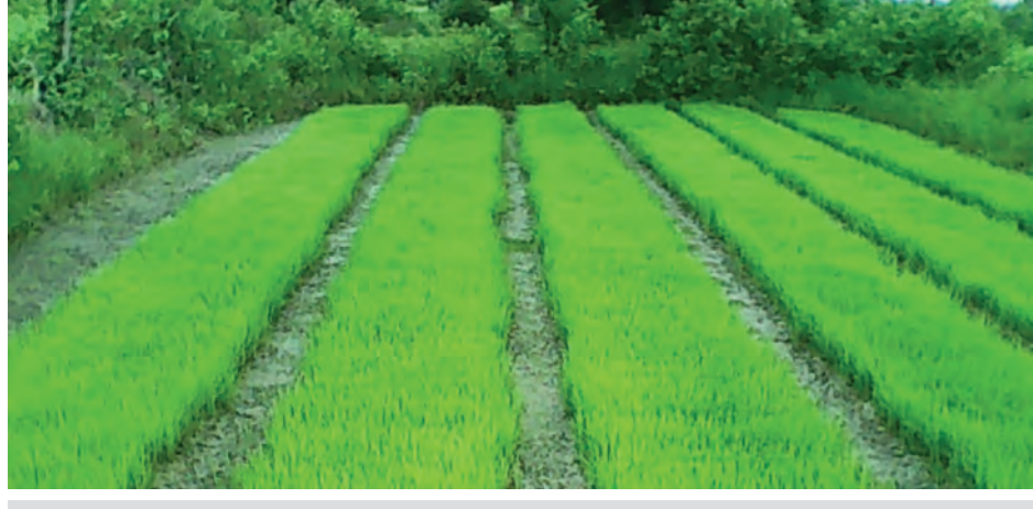
သိပ္ပံနည်းကျပေါင်စနစ်ဖြင့် ရေဆင်း(၃) ပုလဲသွယ်အထွက်တိုးစပါးမျိုး ပျိုးထောင်ထားသည်ကို မြိုင်တွေ့ရစဉ်။