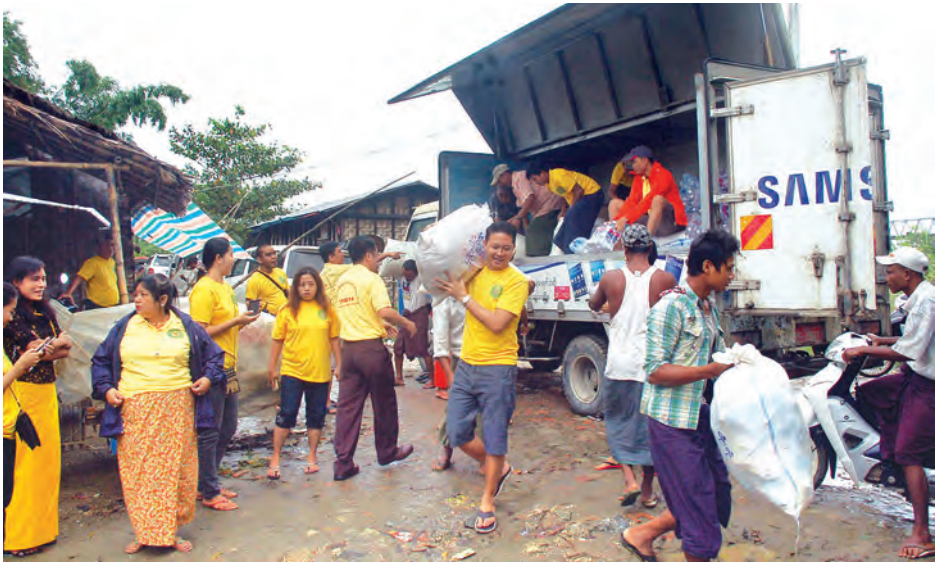
များ၊ ရေသန့်ဘူးများ၊ အစားအသောက်၊ အဝတ်အထည်များနှင့် တစ်အိမ်ထောင်လျှင် ဆန်ငါးပြည်အတွက် ပေးအပ်လှူဒါန်းခဲ့ကြောင်း သိရသည်။ တင်ဖိုး(မြန်မာ့အလင်း)

ရန်ကုန် ဩဂုတ် ၂၆ ရန်ကုန်တိုင်းဒေသကြီး အိမ်ခြံမြေလုပ်ငန်းရှင်များ ပရဟိတအသင်းက ဧရာဝတီတိုင်းဒေသကြီး ညောင်တုန်းမြို့နယ် သောင်တန်းကျေးရွာရှိ ရေဘေးသင့် ပြည်သူများအတွက် ဩဂုတ် ၂၄ ရက်က ထောက်ပံ့ရေးပစ္စည်းများနှင့် အစားအသောက်၊ ဆေးဝါးနှင့် အဝတ်အထည်များကို သွားရောက် လှူဒါန်းခဲ့ကြောင်း သိရသည်။