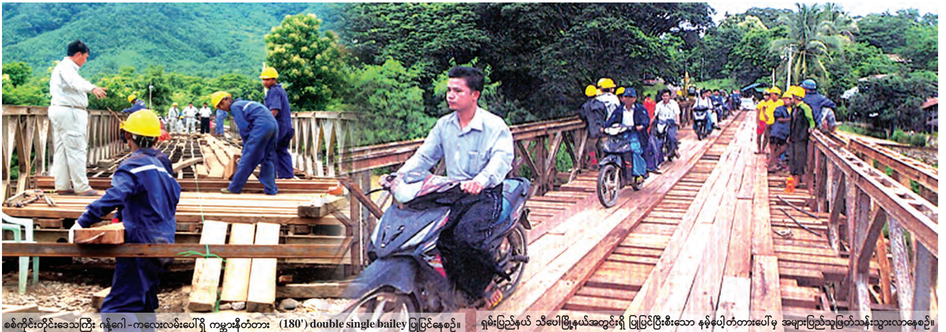
စစ်ကိုင်းတိုင်းဒေသကြီး ဂန့်ဂေါ-ကလေးလမ်းပေါ်ရှိ ကမ္ဘာ့နိတ်တာ (180') double single bailey ပြုပြင်နေစဉ်။