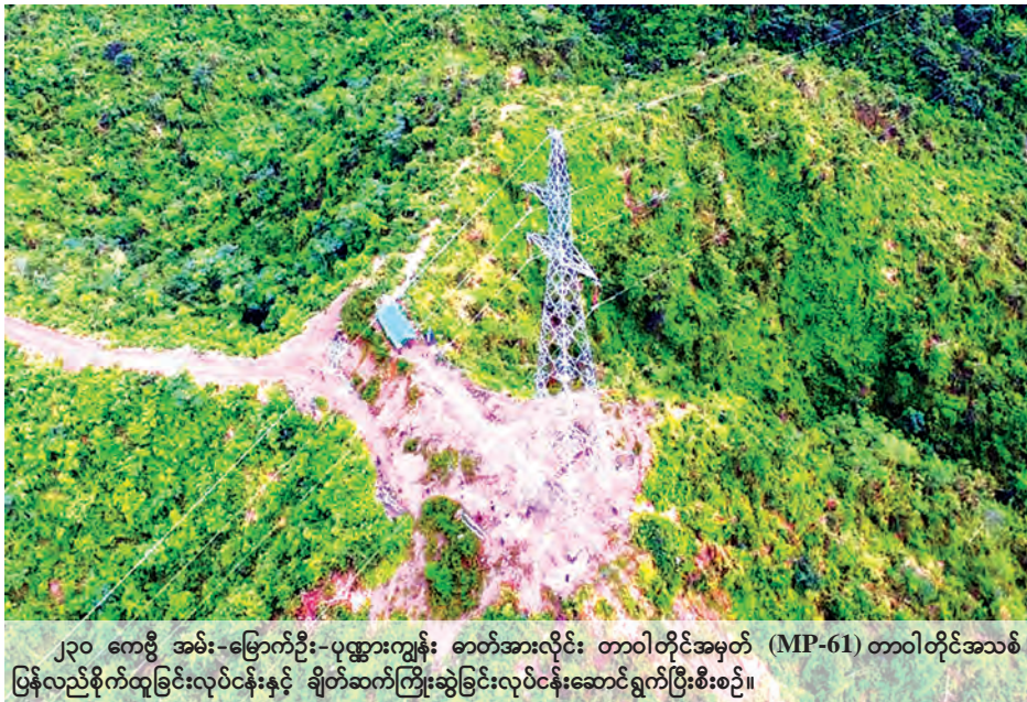
၂၃၀ ကေဗီ အမ်း-မြောက်ဦး-ပုဏ္ဏားကျွန်း ဓာတ်အားလိုင်း တာဝါတိုင်အမှတ် (MP-61) တာဝါတိုင်အသစ် ပြန်လည်စိုက်ထူခြင်းလုပ်ငန်းနှင့် ချိတ်ဆက်ကြိုးဆွဲခြင်းလုပ်ငန်းဆောင်ရွက်ပြီးစီးစဉ်။