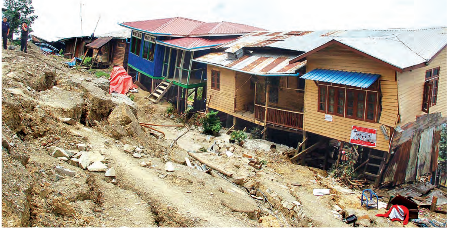
ချင်းပြည်နယ် ဟားခါးမြို့တွင် မိုးသည်ထန်စွာရွာသွန်းမှုကြောင့် မြေပြိုအက်ကွဲဖြစ်ပေါ်ကာ နေအိမ်များပျက်စီးမှုကို တွေ့ရစဉ်။

ဖြေ။ ။ အဓိကအကြောင်းရင်း သုံးခုရှိပါတယ်။ ရာသီ ဥတုပြောင်းလဲမှု၊ လူဦးရေသိပ်သည်းလာမှုနဲ့ လူနေ သိပ်သည်းမှုကြောင့် မြို့ပြချဲ့ထွင် တည်ဆောက်လာမှု ကြောင့်ပါ။ ရာသီဥတုပြောင်းလဲစေတဲ့ အချက်တွေက တော့ အများကြီးရှိပါတယ်။ လူနေသိပ်သည်းမှုကလည်း အမေရိကန်ပြည်ထောင်စုက ဖလော်ရီဒါပြည်နယ်မှာပဲ လွန်ခဲ့တဲ့ ၁၀ စုနှစ်အတွင်းမှာ လူဦးရေ ၂၀ ရာခိုင်နှုန်း တိုးလာပြီး တစ်နိုင်လုံးလူဦးရေတိုးနှုန်းရဲ့ နှစ်ဆ နီးပါးဖြစ်လာပါတယ်။ လူနေသိပ်သည်းလာတော့ အရင် က သဘာဝဘေးကြောင့် အသုံးမပြုခဲ့တဲ့နေရာတွေကို လည်း မြို့ပြချဲ့ထွင်လာတာတွေ ဖြစ်လာပါတယ်။