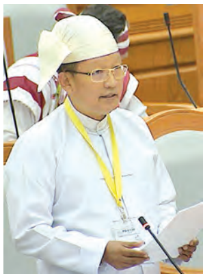
ဒုတိယဝန်ကြီး ဦးတင်ဦးလွင် ပြန်လည်ရှင်းလင်းစဉ်။

အစည်းအဝေးတွင် ပြည်ထောင်စု လွှတ်တော်က အတည်ပြုသည်ဟု မှတ်ယူရမည့် ၂၀၁၂ ခုနှစ် ပြည်သူ့ လွှတ်တော်ဆိုင်ရာဥပဒေကို ပြင်ဆင် သည့်ဥပဒေကြမ်းနှင့် မော်တော်ယာဉ် ဥပဒေကြမ်းကို လွှတ်တော်က မှတ် တမ်းတင်သည်။