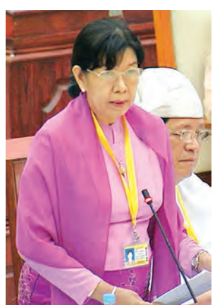
ဒုတိယဝန်ကြီး ဒေါက်တာ ဒေါ်သိန်းသိန်းဌေး ဖြေကြားစဉ်။

တွင်း တူးဖော်ဆောင်ရွက်ပေးပြီးဖြစ် ပါကြောင်း၊ ထို့ပြင် ၂၀၁၅-၂၀၁၆ ခု ဘဏ္ဍာရေးနှစ် မူလရန်ပုံငွေကျပ် ၁၂၂၂ သန်းဖြင့် ကျေးရွာ ၁၁၅ ရွာ တွင် တွင်းနက် ၁၂၃ တွင်းကို ဆောင်ရွက်ရန် ခွင့်ပြုပြီးဖြစ်ပါ ကြောင်း။