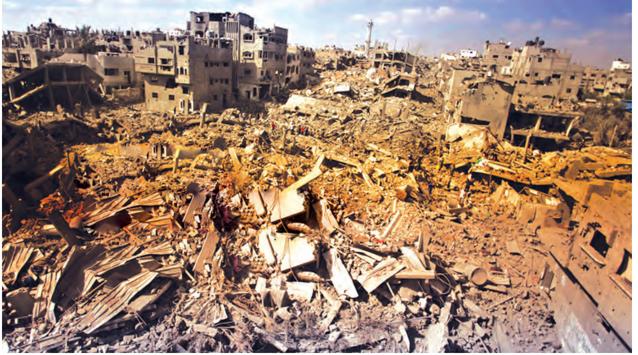
စစ်ဖြစ်ပြီးတစ်နှစ်အကြာ ထင်သလောက်တိုးတက်မှုမရှိသေးသော ဂါဇာကမ်းမြောင်ဒေသအခြေအနေ။

ပါလက်စတိုင်းအစွလာမစ် ဟားမားစ်စစ်သွေးကြွအုပ်စုများနှင့် အစွရေး တပ်ဖွဲ့များ ဂါဇာကမ်းမြောင်ဒေသတွင် တိုက်ပွဲများကို ရပ်ဆိုင်းပြီး တစ်နှစ်အကြာတွင် ယင်းဒေသရှိပြည်သူများသည် အလွန်ဆိုးရွားသော အခြေအနေများနှင့် နေထိုင်ကြရသည်။ နှစ်ဖက်အုပ်စုများသည် ရက်ပေါင်း ၅၀ ကြာ တိုက်ခိုက်မှုဖြစ်ပွားပြီးနောက် လွန်ခဲ့သောနှစ် ဩဂုတ် ၂၆ ရက်တွင် ကာလရှည်ကြာ အပစ်အခတ်ရပ်စဲရေးသဘောတူညီမှုကို ပြုလုပ်ခဲ့ကြသည်။ ဂါဇာ၏ အဆိုးဆုံးဆုံးပင်ပန်းမှုပစ္စည်းပေါက်စတိုင်းဘက်မှ လူပေါင်း ၂၂၀၀ သေဆုံးခဲ့ပြီး အစွရေးဘက်မှ လူ ၇၀ သေဆုံးခဲ့သည်။ စစ်အပြီးအဆောက်အအုံများနှင့် အခြေခံအဆောက်အအုံများ ပြန်လည်တည်ဆောက်မှုမှာ ထင်သလောက် တိုးတက်မှုမရှိခဲ့ပေ။ လူပေါင်း ၁၀၀၀၀၀ မှာ ၎င်းတို့နေရပ်သို့ မပြန်နိုင်သေးကြောင်း သိရသည်။ ကမ္ဘာ့ဘဏ်၏ စာရင်းဇယားများအရ ဂါဇာတွင် အလုပ်လက်မဲ့နှုန်းမှာ ၄၄ ရာခိုင်နှုန်းဖြစ်ပြီး ကမ္ဘာ့အမြင့်ဆုံးဖြစ်ကြောင်း သိရသည်။ လူငယ် အလုပ်လက်မဲ့နှုန်းမှာ ၆၀ ရာခိုင်နှုန်းဖြစ်ကြောင်း သိရသည်။ ကုလသမဂ္ဂစစ်တမ်းများအရ ၎င်းဒေသတွင် အသက်တစ်နှစ်အောက် ကလေးသေဆုံးမှုနှုန်းမှာ နှစ်ပေါင်း ၅၀ အတွင်း ပထမဆုံးအကြိမ်အဖြစ် စတင်မြင့်တက်လျက်ရှိသည်။ ပြောင်းလဲမှုတစ်စုံတစ်ရာမလုပ်ပါက နိုင်ငံရေးမတည်ငြိမ်မှုများ ပြန်လည်ဖြစ်ပွားပြီး ယခင်အခြေအနေသို့ ပြန်လည်ရောက်ရှိနိုင်ကြောင်း ပညာရှင်များက သုံးသပ်သည်။ ဂါဇာပြန်လည်ထူထောင်ရေးတွင် နိုင်ငံတကာမှ စေတနာရှင်များက ၃ ဒသမ ၅ သန်းကျော်ရန် ကတိကဝတ်ပြုခဲ့သည်။ ပြန်လည်တည်ဆောက်ရေးများ နှေးကွေးရသည့် အဓိကအကြောင်းမှာ ဘီလပ်မြေနှင့် သံချောင်းများ စသည့်အခြေခံအဆောက်အအုံအဖွဲ့အစည်းများ ပြတ်လပ်နေခြင်းကြောင့် ဖြစ်သည်။ (အင်န်အိတ်ချ်ကေ)