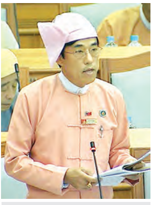
လွှတ်တော်ကိုယ်စားလှယ် ဦးခိုင်မောင်ရည် ထောက်ခံဆွေးနွေးစဉ်။

သူငယ်များ ပါဝင်ပတ်သက်မှုတွင် ကလေးသူငယ်များ၏ အခွင့်အရေးဆိုင်ရာ နောက်ဆက်တွဲ အခြေပြုစာချုပ်တွင် နိုင်ငံပေါင်း ၁၅၉ နိုင်ငံရှိပါကြောင်း၊ အာဆီယံအဖွဲ့ဝင် ၁၀ နိုင်ငံနက် ၈ နိုင်ငံမှာ အတည်ပြုပါဝင်ပြီးဖြစ်ပါ ကြောင်း၊ မြန်မာနိုင်ငံက ပါဝင်လက် မှတ် ရေးထိုးခြင်းဖြင့် ကလေးသူငယ် များ၏ အခွင့်အရေးကို တိုးမြှင့် ကာကွယ်စောင့်ရှောက်ရန် ခိုင်မာစွာ ပြသရာရောက်မည်ဖြစ်ပါကြောင်း၊ ကုလသမဂ္ဂလုံခြုံရေး ကောင်စီတို့ နှစ်စဉ် တင်သွင်းလျက်ရှိသည့် ကလေးသူငယ်နှင့် လက်နက်ကိုင် ပဋိပက္ခများဆိုင်ရာ အစီရင်ခံစာ၏ နောက်ဆက်တွဲစာရင်းမှ မြန်မာနိုင်ငံ အား ပယ်ဖျက်ပေးရန်ကြိုးပမ်းရာ တွင် အထောက်အကူဖြစ်နိုင်မည် ဖြစ်ပါကြောင်းဖြင့် ပြန်လည်ရှင်းလင်း ခဲ့ပြီး လွှတ်တော်၏ အတည်ပြုချက် ရယူခဲ့ရာ လွှတ်တော်က အတည်ပြု ကြောင်း ဆုံးဖြတ်ခဲ့သည်။