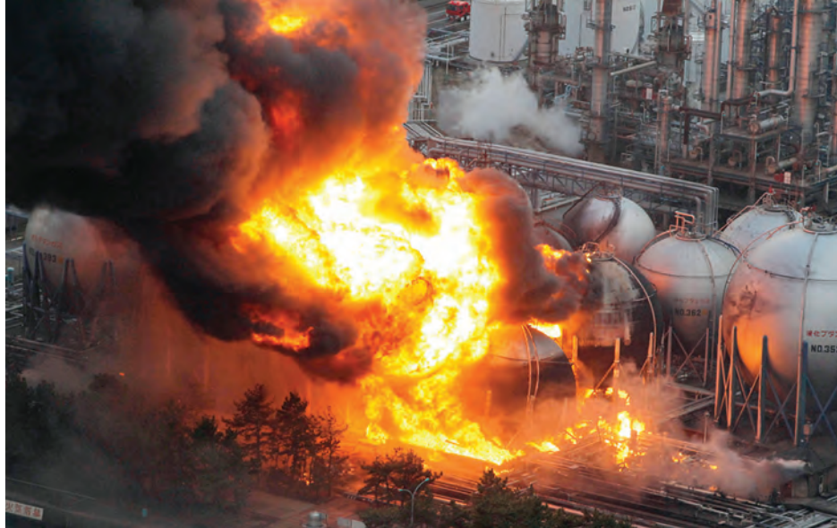
ဂျပန်နိုင်ငံတွင် နျူကလီးယားဓာတ်ပေါင်းဖို မတော်တဆပေါက်ကွဲမှုဖြစ်ပွားစဉ်။

ဤသည်မှာကား အထက်တွင် ဖော်ပြခဲ့သည့် ရေဒီယို သတ္တိကြွ ဖြာထွက်ရောင်ခြည်သင့်မှု ကာကွယ်ရေး လုပ်ငန်း စဉ် များ၏ အဓိကအချက်နှစ်ချက်အနက် ပထမအချက် ကို အလေးထားလုပ်ဆောင်ခြင်းပင်ဖြစ်သည်။