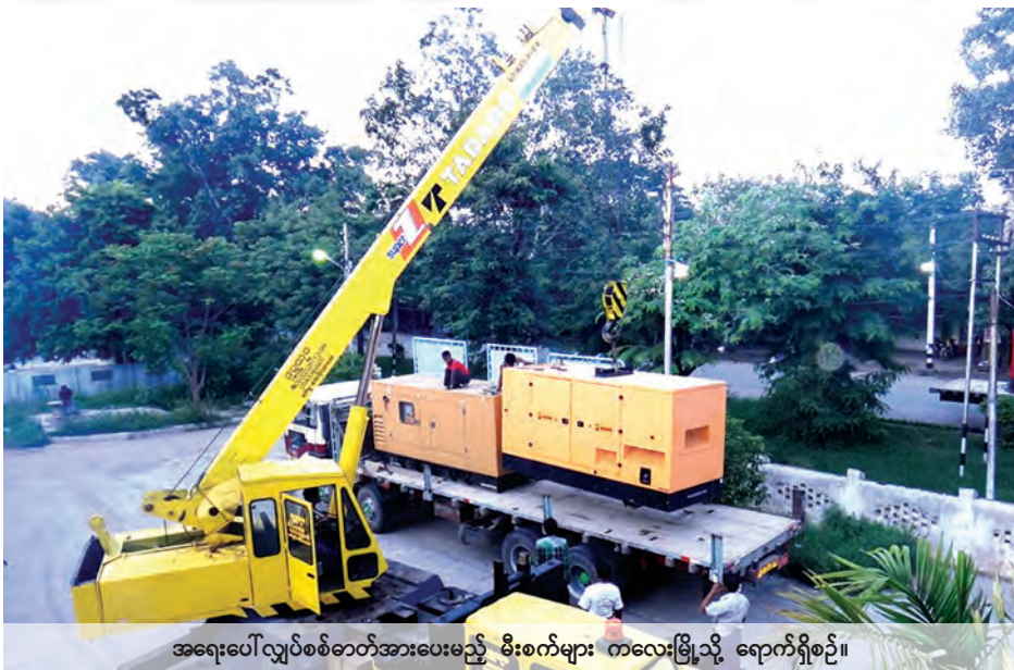
အရေးပေါ်လျှပ်စစ်ဓာတ်အားပေးမည့် မီးစက်များ ကလေးမြို့သို့ ရောက်ရှိစဉ်။