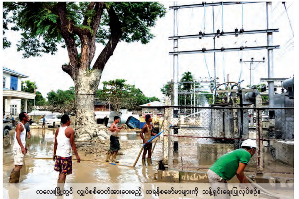
ကလေးမြို့တွင် လျှပ်စစ်ဓာတ်အားပေးမည့် ထရန်စဖော်မာများကို သန့်ရှင်းရေးပြုလုပ်စဉ်။