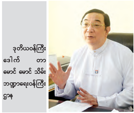
ဒုတိယဝန်ကြီး ဒေါက်တာ မောင် မောင် သိမ်း ဘဏ္ဍာရေးဝန်ကြီး ဌာန

ဒါက မြန်မာနိုင်ငံရဲ့ အတိုင်းအတာနဲ့ပါ။ ဆုံးရှုံးမှုအနေနဲ့ မြန်မာကျပ်ငွေ ၁၆၅ ဘီလီယံခန့်လို့သိရပြီး အမေရိကန် ဒေါ်လာနဲ့ ခန့်မှန်းခြေ ၁၆၅ သန်းလောက် ရှိပါတယ်။ ဒီနေ့အထိ ကမ္ဘာပေါ်မှာ ရေကြီးရေလျှံမှုကြောင့် ပျက်စီးမှုအများဆုံးစာရင်းဝင် ၁၀ မှုရှိပြီး အနိမ့်ဆုံးက ဆုံးရှုံးမှုတန်ဖိုး အမေရိကန်ဒေါ်လာ သန်းပေါင်း ၁၀၀၀၀ ရှိခဲ့တဲ့ ၂၀၀၈ခုနှစ် ဇွန်လတုန်းက အမေရိကန်မှာဖြစ်ခဲ့တဲ့ ရေကြီးရေလျှံမှုပါ။ ဆုံးရှုံးမှုတန်ဖိုး အမေရိကန်ဒေါ်လာ သန်းပေါင်း ၄၃၀၀၀ ရှိခဲ့တဲ့ ၂၀၁၁ ခုနှစ်က ထိုင်းနိုင်ငံရဲ့ ရေကြီးရေလျှံမှုနဲ့ မြေပြိုမှုက ဒီနေ့အထိ ကမ္ဘာပေါ်မှာ ဆုံးရှုံးမှုတန်ဖိုးအကြီးမားဆုံး သဘာဝဘေးတွေ ဖြစ်ပါ တယ်။