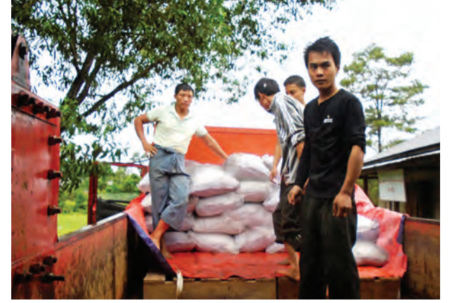
သယ်ယူကာ စစ်ဘေးရှောင်ပြည်သူများသို့ ဆက်လက်ထောက်ပံ့ပေးအပ်သွားမည်ဖြစ်ကြောင်း သက်ဆိုင်ရာတာဝန်ရှိသူများထံမှ သိရသည်။ (ခရိုင် ပြန်/ဆက်)

ပူတာအို ဩဂုတ် ၂၁ ဆွမ်ပရာဘွမ်မြို့နယ် စစ်ဘေးရှောင်ပြည်သူများ၏ လတ်တလော လိုအပ်လျက်ရှိသော စားနပ်ရိက္ခာများအတွက် ကချင်ပြည်နယ်အစိုးရအဖွဲ့၏ လမ်းညွှန်မှု၊ ပူတာအို ခရိုင်အထွေထွေအုပ်ချုပ်ရေးဦးစီးဌာန၏ ကြီးကြပ်မှုဖြင့် မလိခညီအစ်ကိုများ ကုမ္ပဏီက ပထမအကြိမ်အဖြစ် မော်တော်ယာဉ်နှစ်စီးဖြင့် ဆန်အိတ် ၁၂၀ ကို ဩဂုတ် ၂၀ ရက်က ပူတာအိုမြို့နယ် ဆွမ်ပီယာန်ကျေးရွာသို့ ပို့ဆောင်ပေးလျက်ရှိကြောင်း သိရသည်။ ဩဂုတ် ၂၃ ရက်တွင် ဒုတိယအကြိမ်အဖြစ် ဆန်အိတ် ၁၀၀ ကို ပို့ဆောင်ပေးသွားမည်ဖြစ်ပြီး ဆွမ်ပီယာန်ကျေးရွာသို့ ပေးပို့ရောက်ရှိထားသော ဆန်အိတ်များကို ဆွမ်ပရာဘွမ်မြို့နယ်မှ မော်တော်ယာဉ်ဖြင့် လာရောက်