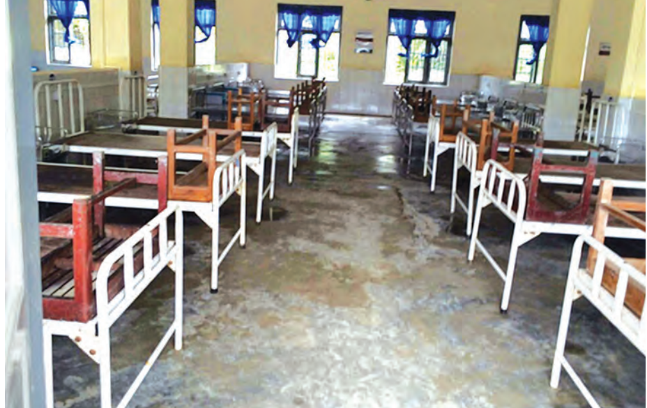
ကလေးမြို့ ပြည်သူ့ဆေးရုံ ကလေးကုသဆောင်အား သန့်ရှင်းရေးပြုလုပ်ပြီးနောက် တွေ့ရစဉ်။

ထိုကဲ့သို့ ကလေးဒေသအပါအဝင် တစ်နိုင်ငံလုံးရှိ သဘာဝဘေးအန္တရာယ်ကြောင့် ပျက်စီးဆုံးရှုံးခဲ့ရသည့် စာသင်ကျောင်း၊ ဆေးရုံ၊ ဆေးခန်း၊ နေအိမ်၊ လမ်း၊ တံတားများ ပြန်လည်ပြုပြင်တည်ဆောက်ရေးအပြင် ရေဘေးသင့် ပြည်သူများ၏ အခြေခံလိုအပ်ချက်များအတွက် သဘာဝဘေးအန္တရာယ်ကာကွယ်ရေး သီးသန့်ရန်ပုံငွေမှ ငွေကျပ် ၃၉ ဒသမ ၀၅၄ ဘီလီယံ သုံးစွဲခဲ့ပြီး ဖြစ်သည့်အပြင် ပျက်စီးဆုံးရှုံးမှုများအတွက် စာရင်းပြုစုရရှိမှုအလိုက် အဆိုပါ သီးသန့်ရန်ပုံငွေဖြင့် ပြန်လည်