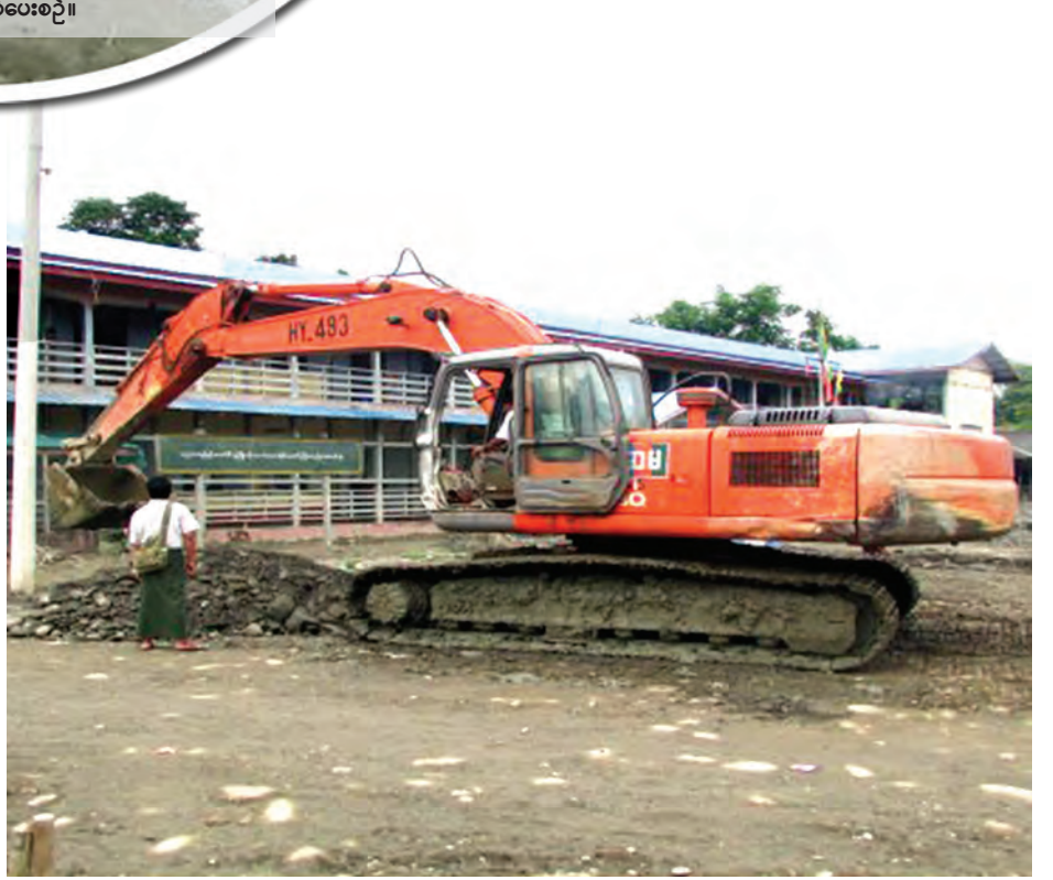
ကလေးမြို့၊ အထက(၁) ကျောင်းဝင်းအတွင်းရှိ ရွှံ့နှံများဖယ်ရှားခြင်းလုပ်ငန်းများ ဆောင်ရွက်နေစဉ်။