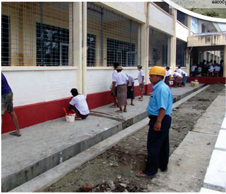
ကလေးမြို့၊ ပြည်သူ့ဆေးရုံ ပင်မဆောင်အား ဆေးသုတ်နေစဉ်။