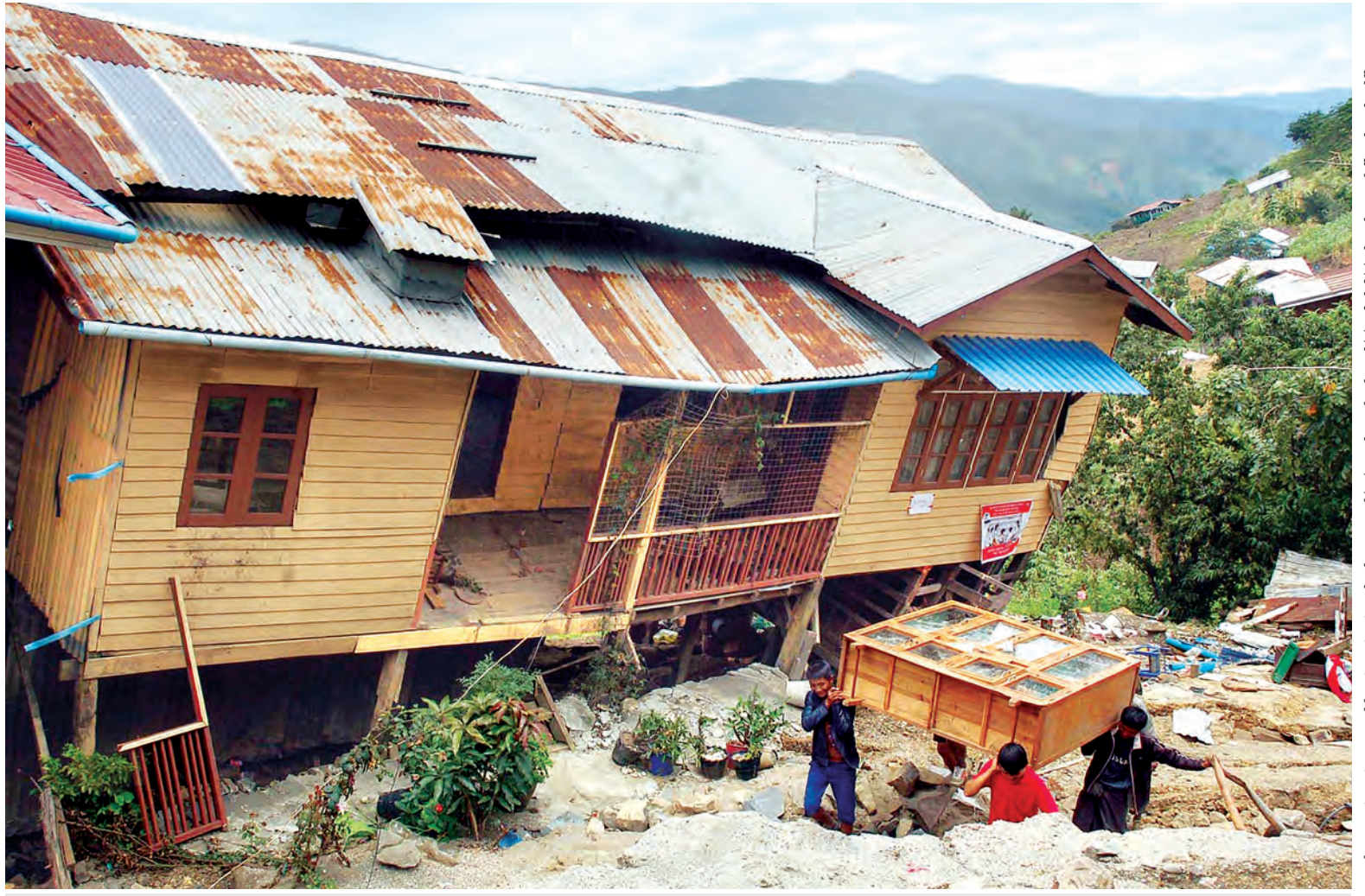
ချင်းပြည်နယ် ဟားခါးမြို့တွင် မိုးသည်းထန်စွာရွာသွန်းမှုကြောင့် မြေပြိုအက်ကွဲပြီး နေအိမ်များပျက်စီးနေသည်ကိုတွေ့ရစဉ်။

ဟားခါး ဩဂုတ် ၂၁ ချင်းပြည်နယ်အတွင်း မိုးသည်းထန်စွာရွာသွန်းပြီး မြေပြိုကျမှုများဖြစ်ပွားခဲ့ရာ လူနေအိမ် အများဆုံးပျက်စီးခဲ့ရသည့် ဟားခါးမြို့တွင် သတ္တုတွင်းဝန်ကြီးဌာန ဘူမိဗေဒဓာတ်သတ္တုရှာဖွေရေးဌာန ဝန်ထမ်းများနှင့် မြန်မာနိုင်ငံဘူမိသိပ္ပံအသင်းတို့ပူးပေါင်းကာ မြေပြိုကျမှု၊ မြေအက်ကွဲမှုများနှင့်