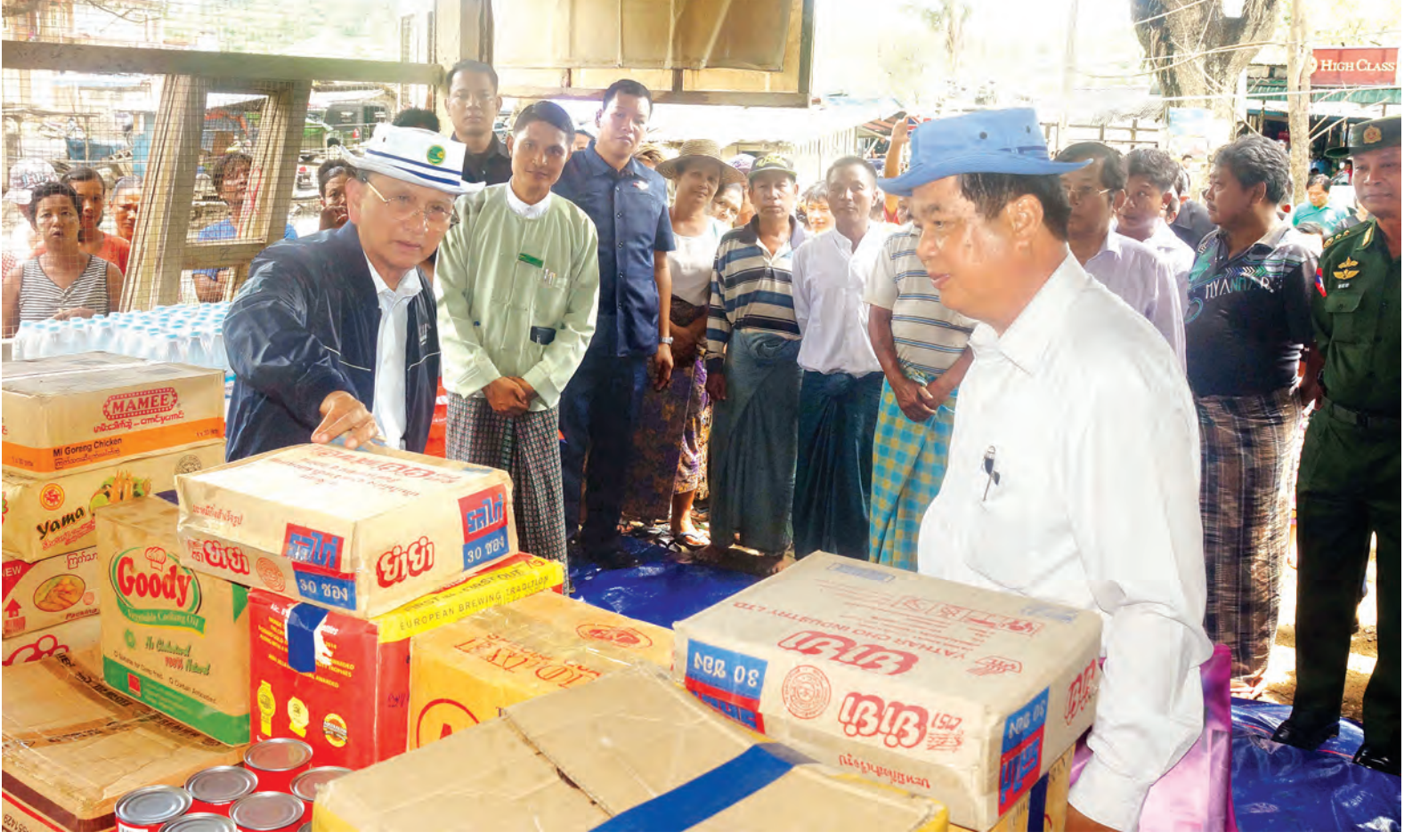
နိုင်ငံတော်သမ္မတ ဦးသိန်းစိန် တိုင်းဒေသကြီးအစိုးရအဖွဲ့က ထောက်ပံ့လှူဒါန်းထားသည့် ကယ်ဆယ်ရေးပစ္စည်းများကို ကြည့်ရှုစစ်ဆေးစဉ်။ (ဓာတ်ပုံ-ပြန်/ဆက်)

နိုင်ငံတော်သမ္မတ ဦးသိန်းစိန် ကွန်ပျူတာတက္ကသိုလ် (ကလေး) ၌ ဆရာ ဆရာမများနှင့် စုပေါင်း မှတ်တမ်းတင်ဓာတ်ပုံရိုက်စဉ်။ (ဓာတ်ပုံ-ပြန်/ဆက်)