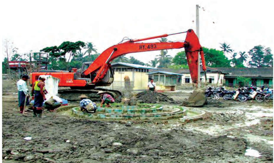
ကလေးမြို့ အမှတ်(၁) အခြေခံပညာအထက်တန်းကျောင်း ကျောင်းဝင်းအတွင်း၌ တင်ကျန်ခဲ့သည့် ရွံ့နွမ်းများကို စက်အား၊ လူအားများ အသုံးပြု၍ ရှင်းလင်းဆောင်ရွက်နေသည်ကို တွေ့ရစဉ်။

ရေဘေးသင့်တောင်သူများအား ဖြန့်ဝေထောက်ပံ့နိုင်ရန် ကလေးမြို့နယ် နတ်ချောင်းကျေးရွာသို့ ပို့ဆောင်ခဲ့သည်။ လတ်တလော စိုက်ပျိုးရေး မျိုးအခက်အခဲဖြစ်ပေါ်နေသော ထောက်ကြန့် ကြာအင်း၊ ကံပုလဲ၊ နတ်ချောင်း၊ နတ်မြောင်းနှင့် ကင်မွန်းခြံ၊ စသည့် ကျေးရွာအုပ်စုများမှ တောင်သူများအတွက် စိုက်ပျိုးမြေကေ ၁၇၆၈ အတွက် စပါးတင်း ၁၂၃၈၈ ကီလိုကို ကလေးမြို့ နတ်ချောင်းကျေးရွာမှတစ်ဆင့် ဖြန့်ဝေပြီးဖြစ်သည်။ ထို့အတူ ရေဘေးသင့် ကျေးရွာများမှ တိရစ္ဆာန်များကို ကာကွယ်ရေးနှင့် ကုသရေးလုပ်ငန်းများ ဆောင်ရွက်ပေးလျက်ရှိရာ ယခုလ ၁၆ ရက်အထိ နွားကောင်ရေ