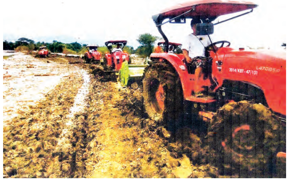
ကလေးမြို့နယ် ထိုမာကျေးရွာလမ်းပေါ်မှ နန်းများကို စက်ယန္တရားများဖြင့် ရှင်းလင်းဖယ်ရှားဆောင်ရွက်စဉ်။

ချထားရေးဝန်ကြီးဌာန ထုတ်ပြန်ချက်အရသိရပြီး အဆိုပါ သဘာဝဘေးခံစားခဲ့ရသည့် ပြည်သူများအတွက် သေဆုံးမှုထောက်ပံ့ကြေးအပါအဝင် တန်ဖိုးငွေကျပ် သန်း ၆၆၀ ဒသမ ၄၃၇ သန်းကို ပေးပို့ထောက်ပံ့ခဲ့ကြောင်း သိရသည်။ သဘာဝဘေးကျရောက်မှုကြောင့် အရေးပေါ်အခြေအနေ ထုတ်ပြန်ခဲ့ရသည့် ကလေးဒေသတွင် ရေဘေးသင့်အိမ်ထောင်စု ၅၃၂၂ စုမှ လူဦးရေ ၂၂၄၀၈ ဦး ရှိခဲ့သည်။ ယခုအခါ ရေပြန်လည်ကျဆင်းနေပြီဖြစ်ရာ ယခုလ ၁၅ ရက်မှ စတင်ကာ နေရပ်များသို့ ပြန်လည်ပြောင်းရွှေ့နေကြပြီး ပြန်လည်ထူထောင်ရေးလုပ်ငန်းများ ဆောင်ရွက်နေကြပြီဖြစ်သည်။