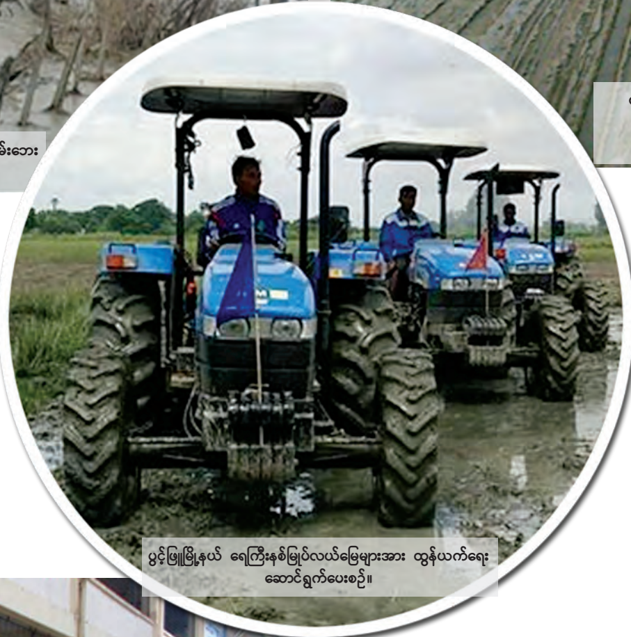
ပွင့်ဖြူမြို့နယ် ရေကြီးနှစ်မြုပ်လယ်မြေများအား ထွန်ယက်ရေး ဆောင်ရွက်ပေးစဉ်။