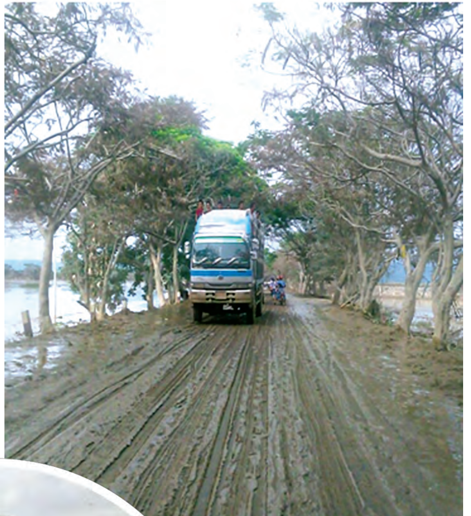
ကလေး-ကျီကုန်း လမ်းပိုင်း၌ လမ်းပေါ်တွင်တင်ကျန်နေသော ရွှံ့နှံများကို ရှင်းလင်းဖယ်ရှားပြီးဖြစ်၍ မော်တော်ယာဉ်များ ဖြတ်သန်းသွားလာနေစဉ်။