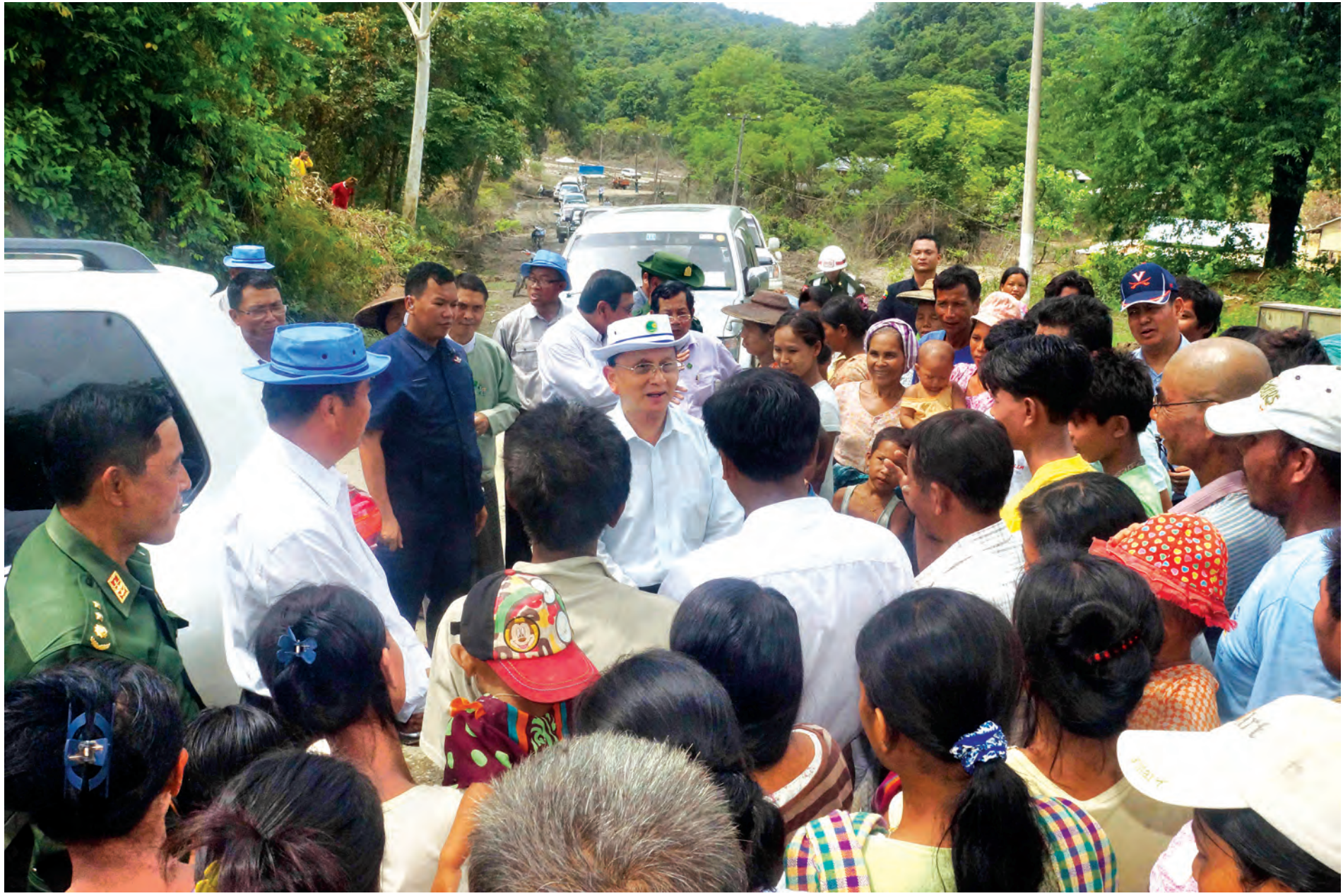
နိုင်ငံတော်သမ္မတ ဦးသိန်းစိန် ကလေးမြို့နယ် နတ်ကြီးကုန်းကျေးရွာအုပ်စု အေးသာယာကျေးရွာ၌ ဒေသခံပြည်သူများအား တွေ့ဆုံအားပေးစဉ်။

မြန်မာနိုင်ငံမီးပြတိုက် အက်ဥပဒေကို ပြင်ဆင်သည့် ဥပဒေကြမ်း အချုပ်ပို-က