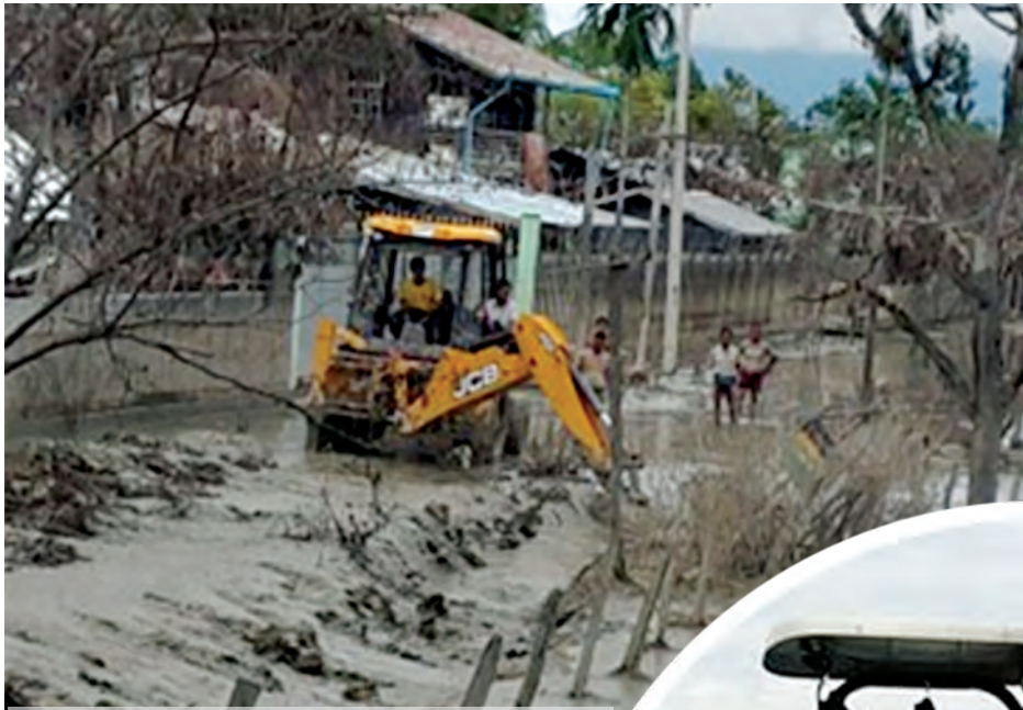
မြို့သာမြို့၊ နယ်မြေ(၁)၊ လမ်းသွယ်(၁၊၂၊၃) လမ်းများ၏ လမ်းဘေး ရေနုတ်မြောင်း တူးဖော်နေစဉ်။