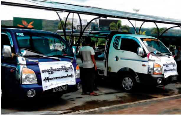
မြင်းခြံမြို့မှ ကားနှစ်စီးဖြင့် လာရောက်၍ လျှောက်လွှာတင်သူများ။