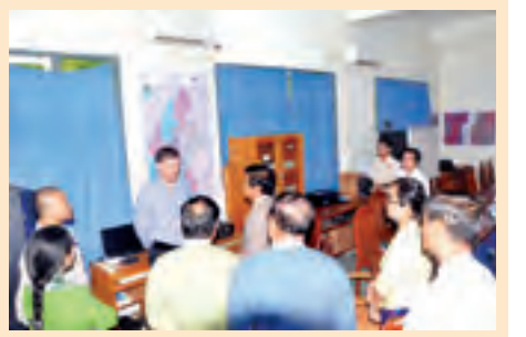
စာမျက်နှာ-၃