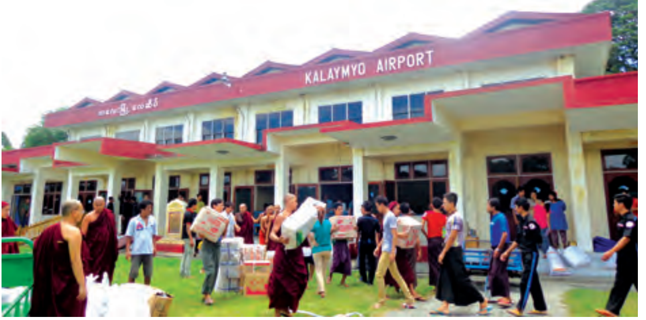
ကလေးလေဆိပ်သို့ ရောက်လာသော ထောက်ပံ့ပစ္စည်းများကို သယ်ယူနေစဉ်။