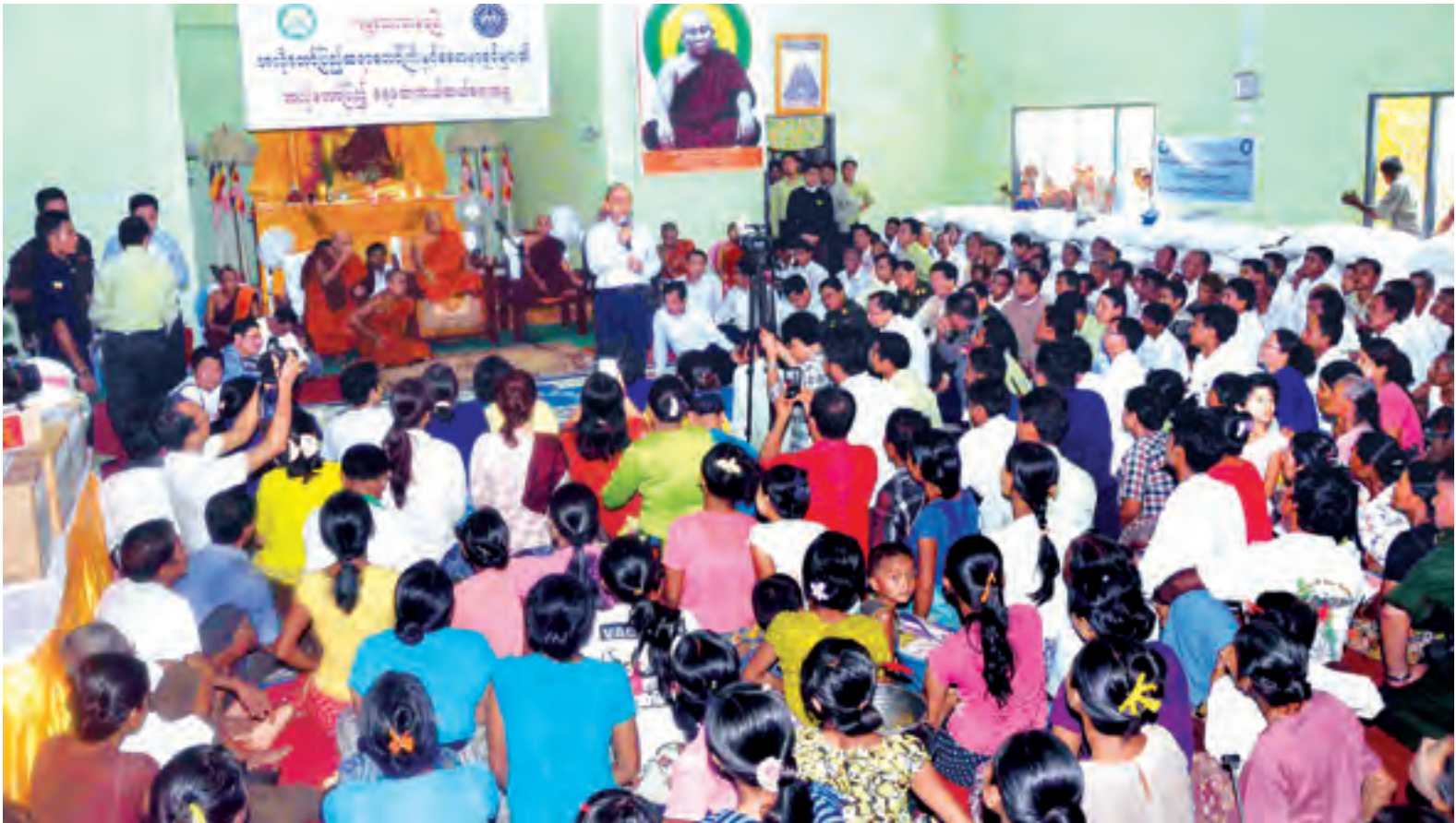
နိုင်ငံတော်သမ္မတ ဦးသိန်းစိန် မြောက်ဦးမြို့ရှိ ရေဘေးသင့်ပြည်သူများနှင့် တွေ့ဆုံကာ ကယ်ဆယ်ရေး၊ ကူညီထောက်ပံ့ရေး၊ ပြန်လည်ထူထောင်ရေးလုပ်ငန်းများနှင့် စပ်လျဉ်း၍ ရှင်းလင်း ပြောကြားစဉ်။

ထို့နောက် နိုင်ငံတော်သမ္မတနှင့် အဖွဲ့ဝင်များသည် မကွေးတိုင်းဒေသ ကြီးမှ ရခိုင်ပြည်နယ်သို့ လေကြောင်း ခရီးဖြင့် ဆက်လက်ထွက်ခွာလာကြ ရာ ရခိုင်ပြည်နယ် စစ်တွေလေဆိပ် တွင် ရခိုင်ပြည်နယ်ဝန်ကြီးချုပ် ဦးမောင်မောင်အုန်းနှင့် တာဝန်ရှိသူ များက ကြိုဆိုကြသည်။