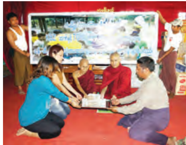
ကံမ ဩဂုတ် ၆

မကွေးတိုင်းဒေသကြီး သရက်ခရိုင် ကံမမြို့နယ်၌ ရောဂါတိုက်ဖျက်ရေး ဝင်ရောက်လျက်ရှိသော မြို့ပေါ် ရပ်ကွက်များနှင့် ရောဂါတိုက်ဖျက်ရေးအဖွဲ့ဝင်များက ကျေးရွာများရှိ ရေဘေးသင့်ပြည်သူများအား KBZ ဘဏ်မိသားစုနှင့် TOMORROW ဂျာနယ်မိသားစုတို့မှ ကျပ်သိန်း ၂၅၀ ကျော်တန်ဖိုးရှိဆန် နှင့်မီးဖိုချောင်သုံးပစ္စည်းများကို ဩဂုတ် ၅ ရက်က လှူဒါန်းခဲ့ပြီး ဒေသခံ စေတနာရှင်များနှင့် ရန်ကုန်မြို့မှ အလှူရှင်များကလည်း လာရောက်လှူဒါန်း လျက်ရှိသည်။ ကံမမြို့ အမှတ် ၂ ရပ်ကွက်၊ ရွှေစည်းခုံဘုရားမိဖုရားရုံတွင် ဆရာတော်၊ သံဃာတော်များ၏ ဦးဆောင်မှုဖြင့် ကူညီထောက်ပံ့ရေးစခန်း ကို ယာယီဖွင့်လှစ်ထားရှိပြီး လာရောက်လှူဒါန်းကြသော ပစ္စည်းများကို ရေဘေးသင့် ပြည်သူများလက်ဝယ်အရောက် ကူညီထောက်ပံ့လှူဒါန်း လျက်ရှိကြောင်း သိရသည်။