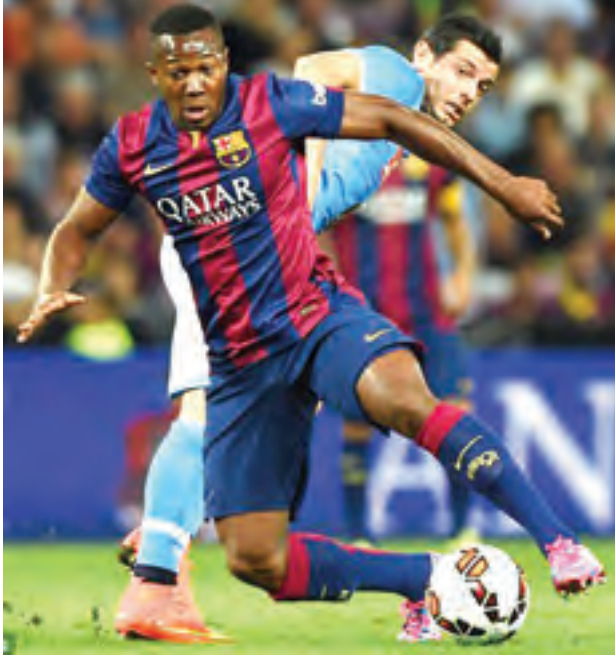
ကောင်းမြတ်သူ - စုစည်းသည်

လီဟာပူးအသင်းအနေနဲ့ လာမယ့်ရာသီမှာ တောင့်တင်းတဲ့အသင်းအဖြစ် တည်ဆောက်နိုင်ဖို့ ကြိုးစားလျက်ရှိပါတယ်။ ဝိုးသွင်းကောင်းတဲ့ တိုက်စစ်မှူးကောင်းတစ်ဦးကို ဖြည့်တင်းဖို့ကြိုးစားနေတာပါ။ ဘာစီလိုနာတောင်ပံ တိုက်စစ်မှူး အဒါမာထရော်ရေးကို အငှားခေါ်ယူဖို့ ပစ်မှတ်ထားနေတယ်လို့ဆိုပါတယ်။ ဘာစီလိုနာက ဘိုင်ယန်မြူးနစ်ကို ရောင်းဖို့တော့ တွန့်ဆုတ်နေတာပါ။ အသက် ၁၉ နှစ်အရွယ်သာရှိသေးတဲ့ ထရော်ရေးကို ဘာစီလိုနာ နည်းပြဟောင်း ဝွာဒီယိုလာကလည်း သူ့အသင်း ဘိုင်ယန်မြူးနစ်ကို ခေါ်ယူဖို့ကြိုးစားနေပါတယ်။ သို့ပေမယ့် ထရော်ရေးဟာ ယခုနှစ်ရာသီမှာ ဘာစီလိုနာ အသင်းရဲ့ အဓိက တိုက်စစ်မှူးဖြစ်လာဖို့ မလွယ်ပါဘူး။ ဘာဖြစ်လို့လည်းဆိုတော့ မက်ဆီနေမှာ ဆွာရက်ဇ် အစရှိတဲ့ ဝိုးသွင်း အကျော်အမော်တွေရှိနေလို့ပါ။ ဒီအတွက် လီဟာပူးအသင်းမှာ အငှားစာချုပ်နဲ့ သွားရောက်ကစားဖို့ ဖြစ်နိုင်ပါတယ်။