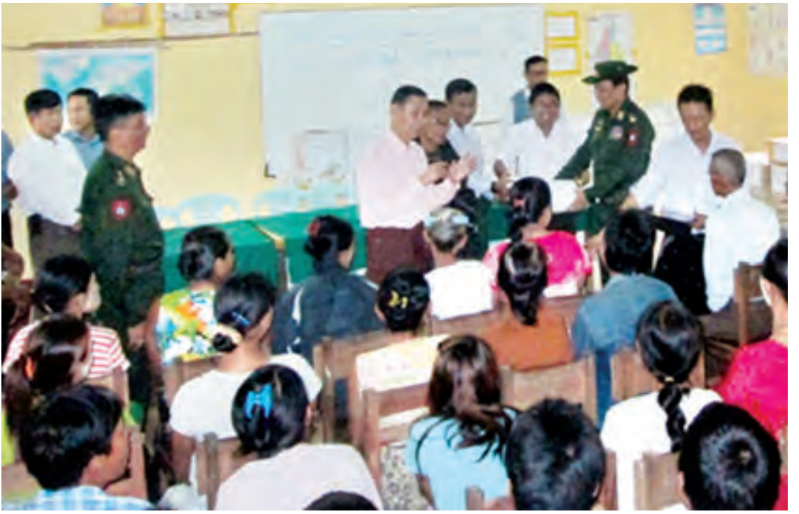
နယ်စပ်ရေးရာဝန်ကြီးဌာန ပြည်ထောင်စုဝန်ကြီး ဒုတိယဗိုလ်ချုပ်ကြီးသက်နိုင်ဝင်း ကျိုက်ထိုမြို့၌ ရေဘေးသင့်ပြည်သူများအား ထောက်ပံ့ပစ္စည်းများ ပေးအပ်စဉ်။

လုပ်ငန်းများကို စနစ်တကျ ဆောင်ရွက်နိုင်ရန်အတွက် စာရင်းဇယားများ တိကျမှန်ကန်ရန် လိုအပ်ကြောင်း၊ ရေဘေးဒုက္ခသည်များ ပျက်စီးပျောက်ဆုံးသွားသည့် မှတ်ပုံတင်နှင့် အခြားအရေးကြီး အထောက်အထားများကို အမြန်ဆုံး ပြန်လည်ထုတ်ပေးရန်လိုအပ်ကြောင်း၊ ကူညီထောက်ပံ့ပေးသည့်ပစ္စည်းများ အမှန်တကယ်လိုအပ်သူများ လက်ဝယ်သို့ ရောက်ရှိရေးအတွက် ကြပ်မတ်ဆောင်ရွက်ရန်လိုအပ်ကြောင်း၊ နေရပ်ပြန်ပြည်သူများကို ဖြည့်ဆည်းပေးရန်လိုအပ်ကြောင်း” မိန့်ကြားခဲ့သည်။ ရခိုင်ပြည်နယ်အတွင်း ရေဘေးထောက်ပံ့မှု ရခိုင်ပြည်နယ်အတွင်း ဇွန်လကုန် ဇူလိုင်လဆန်းပိုင်းတွင် မြို့နယ်အများအပြား ရေကြီးနစ်မြုပ်မှုဘေးနှင့် စတင်ကြုံတွေ့ခဲ့ကြရသည်။ နိုင်ငံတော်သမ္မတကြီး၏ လမ်းညွှန်ချက်အရ နယ်စပ်ရေးရာဝန်ကြီးဌာန ပြည်ထောင်စုဝန်ကြီး ဒုတိယဗိုလ်ချုပ်ကြီးသက်နိုင်ဝင်းသည် တာဝန်ရှိသူများနှင့်အတူ ဇွန် ၂၉ ရက်မှ ဇူလိုင် ၄ ရက်အထိ ရခိုင်ပြည်နယ်အတွင်းရှိ သံတွဲ၊ ကျောက်ဖြူ၊ တောင်ကုတ်၊ အမ်း၊ မအီမြို့များသို့သွားရောက်ခဲ့ပြီး ရေဘေးသင့်ပြည်သူများကို တွေ့ဆုံအားပေးကာ လတ်တလောလိုအပ်သည့် စားနပ်ရိက္ခာ၊ အဝတ်အထည်နှင့် အသုံးအဆောင်ပစ္စည်းများ ထောက်ပံ့ပေးခဲ့သည်။ တစ်ဆက်တည်းမှာပင် ကယ်ဆယ်ရေးလုပ်ငန်းများ ဆောင်ရွက်ထားရှိမှုအခြေအနေ၊ ရေကျသွားသည့်နေရာများ၌ ပြန်လည်နေရာချထားပေးမှုအခြေအနေ၊ လတ်တလောဆောင်ရွက်ရမည့် ပြန်လည်ထူထောင်ရေးလုပ်ငန်းများ၊ ရေရှည်ဆောင်ရွက်ရမည့် ပြန်လည်ထူထောင်ရေးလုပ်ငန်းများကို ကွင်းဆင်းကြည့်ရှုဆောင်ရွက်ခဲ့သည်။ နယ်စပ်ရေးရာဝန်ကြီးဌာနသည် သံတွဲ၊ တောင်ကုတ်၊ အမ်းမြို့နယ်များအတွက် ဆန်