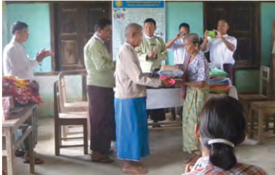
အင်းတော် ဩဂုတ် ၆

စစ်ကိုင်းတိုင်းဒေသကြီး၊ ကသာခရိုင် အင်းတော်မြို့နယ်အတွင်း ရေကြီးမှုဒဏ်ကို ခံစားခဲ့ရသောကျေးရွာများမှ ပြည်သူများအတွက် ထောက်ပံ့ရေးပစ္စည်းများကို စေတနာရှင် ပြည်သူများမှ ပေးအပ်လှူဒါန်းလျက်ရှိကြောင်း သိရသည်။