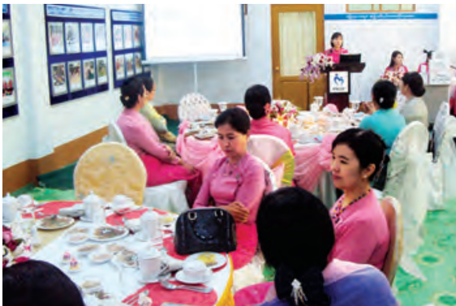
နေပြည်တော် ဩဂုတ် ၆

မြန်မာနိုင်ငံအမျိုးသမီးများနှင့် ကလေးသူငယ်များ ဘဝမြှင့်တင်ရေး အသင်း (MWCDF)၏ နှစ်ပတ်လည် နေ့ အခမ်းအနားကို ဩဂုတ် ၅ ရက် နံနက် ၉ နာရီက နေပြည်တော် ဥက္ကဋ္ဌရသီရိမြို့နယ်ရှိ အသင်းရုံးချုပ်၌