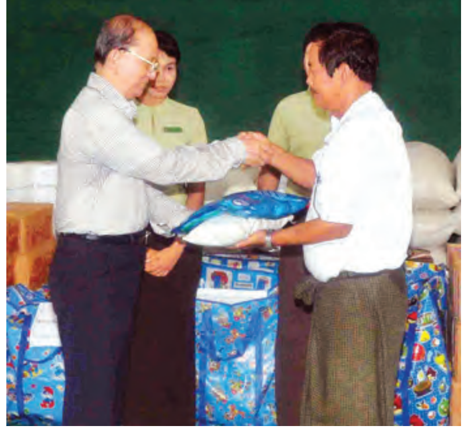
နိုင်ငံတော်သမ္မတဦးသိန်းစိန် မင်းပြားမြို့ ရေဘေးသင့်ပြည်သူများအား ကယ်ဆယ်ရေးပစ္စည်းများ ထောက်ပံ့ ပေးအပ်စဉ်။

ယင်းနောက် နိုင်ငံတော်သမ္မတ က ရေဘေးသင့်ပြည်သူများအား ကယ်ဆယ်ရေး၊ ကူညီထောက်ပံ့ရေး၊ ပြန်လည်ထူထောင်ရေးလုပ်ငန်းများ နှင့် စပ်လျဉ်း၍ ရှင်းလင်းပြောကြားပြီး ကယ်ဆယ်ရေးပစ္စည်းများ ထောက်ပံ့ ပေးအပ်သည်။ ထို့နောက် ဒေသခံပြည်သူတစ်ဦး က ကျေးဇူးတင်စကား ပြန်လည် ပြောကြားကာ ပြည်နယ်ဝန်ကြီးချုပ် က လိုအပ်သည်များကို ဖြည့်စွက် ရှင်းလင်းတင်ပြသည်။