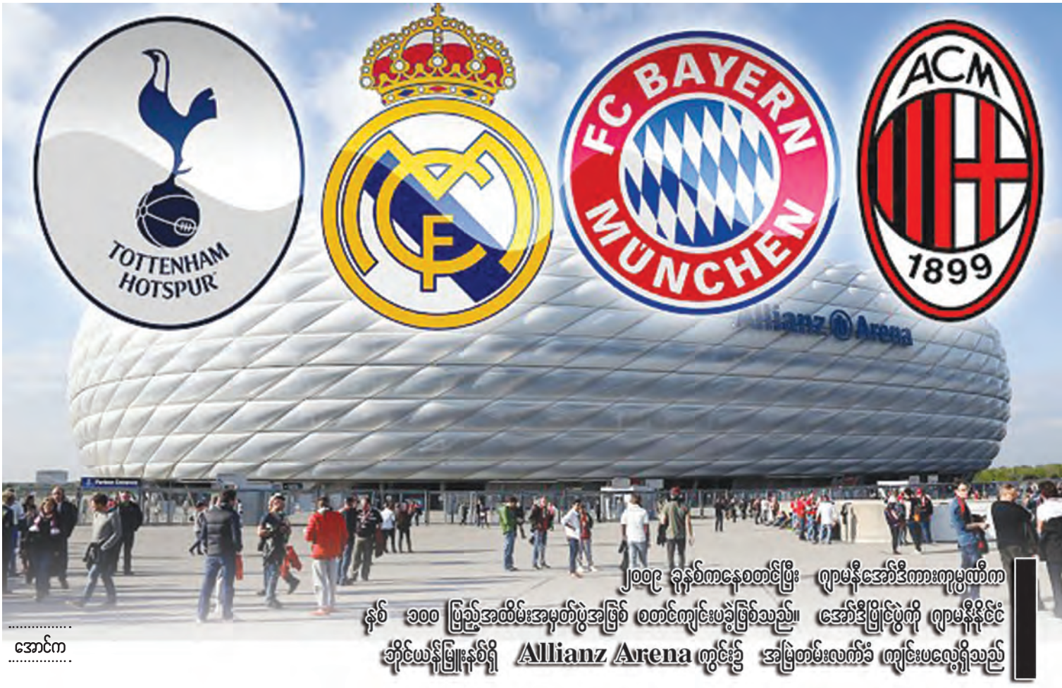
၂၀၀၉ ခုနှစ်ကနေစတင်ပြီး ဂျာမနီအော်ဒီတားကုမ္ပဏီက နှစ် ၁၀၀ ပြည့်အထိမ်းအမှတ်ပွဲအဖြစ် စတင်ကျင်းပခဲ့ခြင်းဖြစ်သည်။ အော်ဒီတားကုမ္ပဏီက ဘိုင်ယန်မြူးနစ်ရှိ Allianz Arena တွင်း၌ အမြဲတမ်းလက်ခံ ကျင်းပလေ့ရှိသည်

အသင်းအား အနိုင်ရရှိကာ ဗိုလ်လုပွဲသို့ တက်ရောက်သွားခဲ့သည်။ သို့သော်လည်း ဗိုလ်လုပွဲတွင် ဘာစီလိုနာအသင်းသည် ဘိုင်ယန်မြူးနစ် အသင်းအား ၂-၀ ဖြင့် အနိုင်ရရှိကာ ချန်ပီယံဖြစ်သွားခဲ့ပြီး တတိယ လုပွဲတွင် အင်တာနေရှင်နယ်အသင်းသည် အေစီမီလန်အသင်းအား ပယ်နယ်တီဖြင့် အနိုင်ရရှိကာ တတိယဆုရရှိသွားခဲ့သည်။ အော်ဒီတား၏ တတိယ အကြိမ် ပြိုင်ပွဲကို ၂၀၁၃ ခုနှစ်တွင် ကစားခဲ့ပြီး ဘိုင်ယန်မြူးနစ်၊ မန်စီးစီး၊ အေစီမီလန် အသင်းနှင့် ဘရာဇီးကလပ် ဆော်ပေါလို အသင်းတို့ ပါဝင်ကစားခဲ့သည်။ ဆီမီးဖိုင်နယ် ပွဲစဉ်တွင် မန်စီးစီးအသင်းသည် အေစီမီလန် အသင်းနှင့်တွေ့ဆုံခဲ့ပြီး မန်စီးစီးအသင်းက ၅-၃ ဖြင့် အနိုင်ရရှိကာ ဗိုလ်လုပွဲသို့ တက် ရောက်သွားခဲ့သည်။ အခြား ဆီမီးဖိုင်နယ် ပွဲစဉ်ဖြစ်သည့် ဘိုင်ယန်မြူးနစ်အသင်းနှင့် ဘရာဇီးကလပ် ဆော်ပေါလိုအသင်းတို့ပွဲစဉ် တွင် ဘိုင်ယန်မြူးနစ်အသင်းက ၂-၀ ဖြင့် အနိုင်ရရှိခဲ့ပြီး ဗိုလ်လုပွဲသို့ တက်ရောက်သွား ခဲ့သည်။ ဗိုလ်လုပွဲတွင် ဘိုင်ယန်မြူးနစ် အသင်းသည် ပရီသတ် ၆၈၀၀၀ ရှေ့တွင် မန်စီးစီးအသင်းကို ၁-၂ ဖြင့် နိုင်ရရှိကာ အော်ဒီတားလားအား ဒုတိယအကြိမ်မြောက် ရရှိသွားခဲ့သည်။ တတိယလုပွဲတွင် အေစီမီလန် အသင်းသည် ဆော်ပေါလိုအသင်းကို ၁-၀ ဖြင့် အနိုင်ရရှိကာ တတိယဆုရရှိသွားခဲ့သည်။