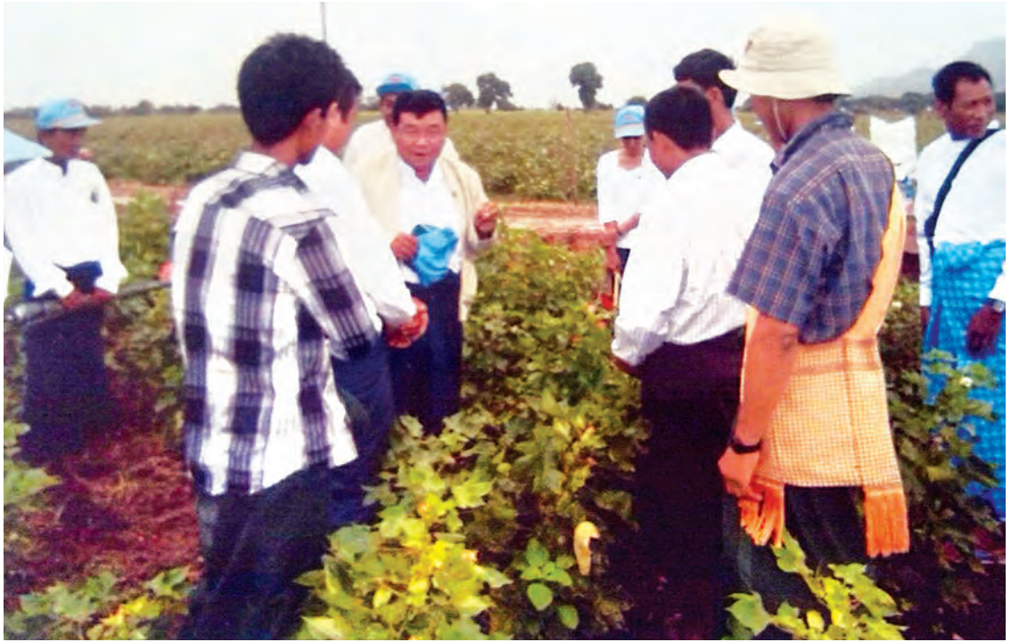
ထွန်းထွန်းနိုင်(ကျောက်ဆည်)

အဆိုပါ တောင်သူပညာပေး ဝါစိုက်ပျိုးနည်းစနစ်များ အသိပညာပေးဆွေးနွေးပွဲသို့ ကျောက်ဆည်မြို့နယ်နှင့် မြစ်သားမြို့နယ်တို့ရှိ ကျေးရွာအုပ်စု ၁၀ အုပ်စုမှ ဝါစိုက်တောင်သူ ၁၀၀ ကျော် တက်ရောက်ခဲ့ကြောင်း သိရသည်။