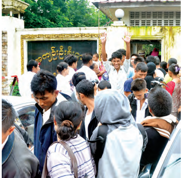
ဇူလိုင် ၃၀ ရက်က ပြစ်ဒဏ်လွတ်ငြိမ်းခွင့်ရ အကျဉ်းသား အကျဉ်းသူ များအား သက်ဆိုင်ရာ အကျဉ်းထောင်အသီးသီးမှ ပြန်လည်လွတ်ပေးရာ အင်းစိန်အကျဉ်းထောင်မှ လွတ်ငြိမ်းခွင့်ရသည့် အကျဉ်းသားများနှင့် လာရောက်ကြိုဆိုကြသည့် မိသားစုများအား တွေ့ရစဉ်။

၁၃၇၇ ခုနှစ်၊ ဒုတိယဝါဆိုလဆန်း ၁၄ ရက်)နေ့တွင် ပြစ်ဒဏ်လွတ်ငြိမ်းခွင့်များ ပေးခဲ့သည်။ အဆိုပါ ပြစ်ဒဏ်လွတ်ငြိမ်းခွင့်တွင် နိုင်ငံတော်၏ မေတ္တာနှင့် စေတနာကို နားလည်ကြပြီး နိုင်ငံတော်သစ်တည်ဆောက်ရေးတွင် တစ်ဖက်တစ်လမ်းမှ အထောက်အပံ့ဖြစ်စေသည့် နိုင်ငံသားများအဖြစ်သို့ ပြုပြင်ပြောင်းလဲစေရေး အတွက် မြန်မာနိုင်ငံသား အကျဉ်းသား ၆၇၅၆ ဦးအား ပြစ်ဒဏ် လွတ်ငြိမ်း သက်သာခွင့်များနှင့် နှစ်နိုင်ငံချစ်ကြည်ရေး၊ နိုင်ငံအချင်းချင်းမိတ်ဖက်ပျက် ဆက်ဆံရေးတို့ကို ရှေးရှုသောအားဖြင့် နိုင်ငံခြားသား အကျဉ်းသား ၂၁၀ အား ပြစ်ဒဏ်လွတ်ငြိမ်းသက်သာခွင့်များပေး၍ ပြည်နှင်ဒဏ်ပေးခြင်းတို့ပါဝင် ပြီး စုစုပေါင်း အကျဉ်းသား အကျဉ်းသူ ၆၉၆၆ ဦးတို့အား ပြစ်ဒဏ် လွတ်ငြိမ်း သက်သာခွင့်များ ခွင့်ပြုပေးခဲ့ကြောင်း သတင်းရရှိသည်။ (သတင်းစဉ်)