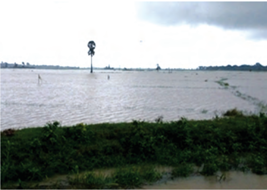
ရေနှစ်မြုပ်နေသော လယ်ကွင်းများကို တွေ့ရစဉ်။