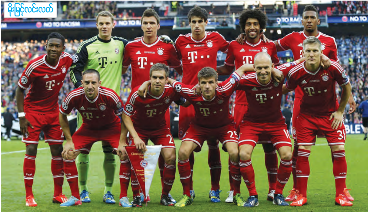
ဘိုင်ယန်မြူးနစ်ဟာ ဂျာမန်စူပါဖလားကို ၁၉၈၇၊ ၁၉၉၀၊ ၂၀၀၀ နှင့် ၂၀၁၂ ခုနှစ်တွေမှာ ရရှိထားပါတယ်။

ဂျာမနီမြေက ထိပ်တန်းကလပ်တွေယှဉ်ပြိုင်ကြတဲ့ ၂၀၁၅ ဂျာမန်စူပါဖလား ပြိုင်ပွဲကိုတော့ လာမယ့်ဩဂုတ် ၂ ရက်မှာ ကျင်းပမှာဖြစ်ပြီး လက်ရှိဘွဲ့ကိုင်လီဂါချန်ပီယံ ဘိုင်ယန်မြူးနစ်နဲ့ လက်ရှိပိုင်ဆိုင်ထားသော ဝုမ်ဘတ်တို့ ဝုမ်ဘတ်မြို့ ဗောဒ်စပါဂန်အရိန်ကွင်းမှာ ယှဉ်ပြိုင်ကစားကြမှာဖြစ်ပါတယ်။ ရာသီအကြို ပြိုင်ပွဲတစ်ရပ်ဖြစ်ပေမယ့် ရာသီသစ်ကို ဆုဖလားကိုင်မြှောက်ပြီး