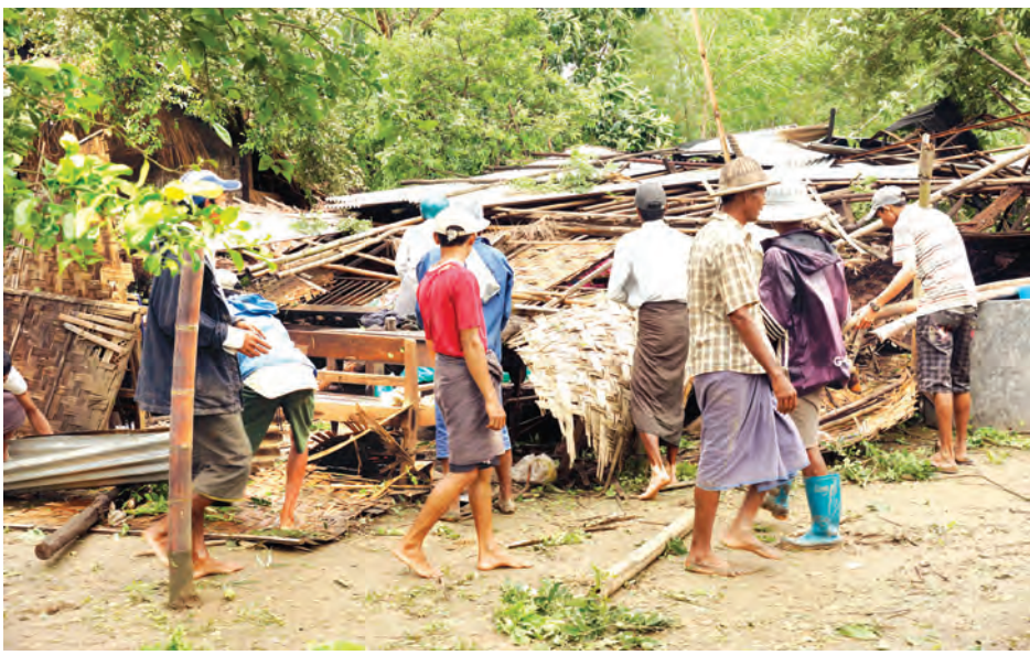
နေအိမ် ၁၁ လုံးနှင့် အမကကျောင်း ထိခိုက်မှုမရှိကြောင်း သိရသည်။ အိမ်သာအမိုး၊ ဘုန်းတော်ကြီး လေဆင်နှာမောင်း တိုက်ခတ်မှုသည် ကျောင်းတို့ပျက်စီးပြီး လူနှင့်တိရစ္ဆာန် ဇူလိုင်လအတွင်း ဒုတိယအကြိမ် တိုက်ခတ်ခြင်းဖြစ်ကြောင်း တာဝန်ရှိသူတစ်ဦးက ပြောသည်။

ပဲခူးတိုင်းဒေသကြီး ပြည်ခရိုင် ပေါင်းတည်မြို့နယ် ပျဉ်ပုံအုပ်စု ထန်းတပင်ကျေးရွာ၌ ဇူလိုင် ၂၉ ရက် ၂၂ နာရီက လေဆင်နှာမောင်း ဝင်ရောက်တိုက်ခတ်ခဲ့သဖြင့် ကျေးရွာအတွင်းရှိ ဘုန်းကြီးကျောင်း၊ စာသင်ကျောင်းနှင့် လူနေအိမ်များ၏ အမိုးများ လေထဲလွင့်ပါကာ နေအိမ် ပြိုလဲမှုနှင့် သစ်ပင်အမြစ်မှ ကျွတ်ထွက်မှုများဖြစ်ခဲ့သည်။ ဖြစ်ပွားရာ နေရာသို့ မြို့နယ်အုပ်ချုပ်ရေးမှူးနှင့် ဌာနဆိုင်ရာများ၊ ရဲတပ်ဖွဲ့ဝင်များ၊ မီးသတ်တပ်ဖွဲ့ဝင်များနှင့် လူမှုရေးအသင်းအဖွဲ့များက သွားရောက်၍ လိုအပ်သည်များကို ကူညီဆောင်ရွက်ပေးခဲ့သည်။