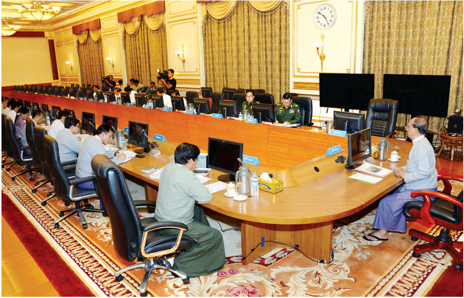
နေပြည်တော် ဇူလိုင် ၃၀

အမျိုးသားသဘာဝဘေးကာကွယ်စောင့်ရှောက်ရေး ဗဟိုကော်မတီအစည်းအဝေးကို ယနေ့ညနေ ၄ နာရီတွင် နိုင်ငံတော်သမ္မတအိမ်တော် အစိုးရအဖွဲ့အစည်းအဝေးခန်းမ၌ကျင်းပရာ ပြည်ထောင်စုသမ္မတမြန်မာနိုင်ငံတော် နိုင်ငံတော်သမ္မတ ဦးသိန်းစိန်တက်ရောက်အမှာစကားပြောကြားသည်။ (အပေါ်ပုံ) ရှေးဦးစွာ နိုင်ငံတော်သမ္မတ ဦးသိန်းစိန်က ဇူလိုင် ၁၆ ရက်ကစတင်၍ တစ်နိုင်ငံလုံးတွင် မိုးအဆက်မပြတ်ရွာသွန်းမှုကြောင့် အချို့တိုင်းဒေသကြီးနှင့် ပြည်နယ်များတွင် ရေကြီးနစ်မြုပ်မှုများဖြစ်ပွားခဲ့ပြီး ကားလမ်း၊ ရထားလမ်းနှင့် တံတားများ၊ စိုက်ခင်းများနှင့်လူနေအိမ်အချို့ ပျက်စီးဆုံးရှုံးမှုများရှိခဲ့ပါကြောင်း၊ အဆက်မပြတ်မိုးရွာသွန်းလျက်ရှိသဖြင့် နိုင်ငံနေရာအနှံ့အပြားတွင် ရေကြီးနစ်မြုပ်မှုများ ဆက်လက်ဖြစ်ပေါ်ပြီး စာမျက်နှာ ၈ ကော်လံ ၁ *