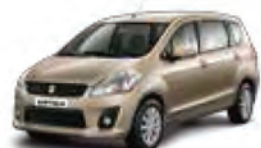
Ecrú Beige Metallic (ZPY)