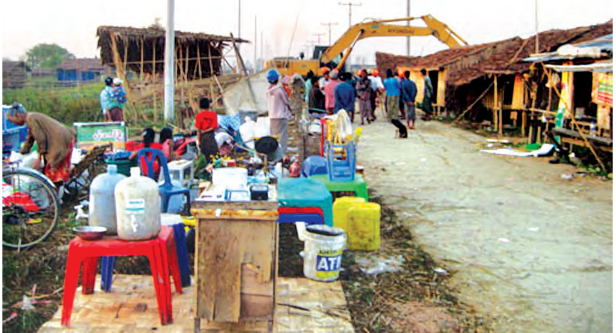
ကျွေးကျော် တဲများကို စက်ယန္တရားများဖြင့် ရှင်းလင်း ဖယ်ရှားစဉ်။

လှိုင်သာယာတွင် အိမ်ခြံမြေများ ရောင်းချဝယ်ယူမှု များမှာ နာဂစ်နောက်ပိုင်း၂၀၀၈ နှစ်ကုန်တွင် လှုပ်လှုပ်