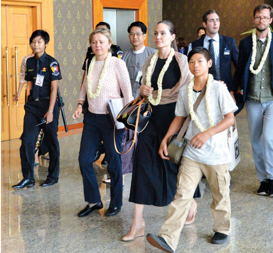
ကုလသမဂ္ဂ ဒုက္ခသည်များဆိုင်ရာ မဟာမင်းကြီးရုံး၏ အထူးကိုယ်စားလှယ် မစ္စ အင်ဂျလီနာ ဂျီလီပစ် နေပြည်တော်လေဆိပ်သို့ ရောက်ရှိစဉ်။

“မြန်မာနိုင်ငံကို ရောက်ရှိပြီး လူတွေအများကြီးနဲ့ တွေ့ဆုံခွင့်ရမှာမို့ ပျော်ရွှင်မိပါတယ်။ UNHCR နဲ့ ပူးပေါင်းပြီး အကူအညီပေးမှုတွေ လည်း လုပ်ဆောင်သွားဖို့ရှိတယ်။ ပထမဆုံးအကြိမ် ရောက်ရှိတာမို့ မြန်မာနိုင်ငံနဲ့ ပတ်သက်ပြီး ဘာမှ မပြောလိုသေးပါဘူး။ မနက်ဖြန်က စပြီး နေရာအချို့ကို သွားရောက်မယ်။ နိုင်ငံသားတွေနဲ့ ဆက်လက်တွေ့ဆုံ သွားဖို့ရှိတယ်”ဟု ကုလသမဂ္ဂ ဒုက္ခသည်များဆိုင်ရာ မဟာမင်းကြီး ရုံး၏ အထူးကိုယ်စားလှယ် မစ္စ အင်ဂျလီနာ ဂျီလီပစ်က ပြောကြား သည်။