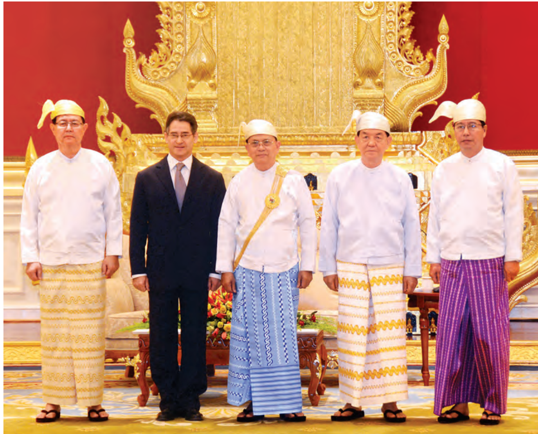
နိုင်ငံတော်သမ္မတ ဦးသိန်းစိန် ချီလီသမ္မတနိုင်ငံ သံအမတ်ကြီးအဖြစ် ခန့်အပ်ခံရသည့် မစ္စတာ ဟာဗီယာ အန်ဒရက်စ် ဘက်ကာ-မာဂ္ဂယ်လ်နှင့် စုပေါင်းမှတ်တမ်းတင်ဓာတ်ပုံရိုက်စဉ်။

အဆိုပါ သံအမတ်ခန့်အပ်လွှာပေးအပ်ပွဲ အခမ်းအနား ဦးသိန်းကျော်နှင့် သံတမန်ရေးရာဦးစီးဌာန ညွှန်ကြားရေး မှူးချုပ် ဦးသူရိန်သန်းဇင်တို့ တက်ရောက်ကြသည်။ (သတင်းစဉ်)