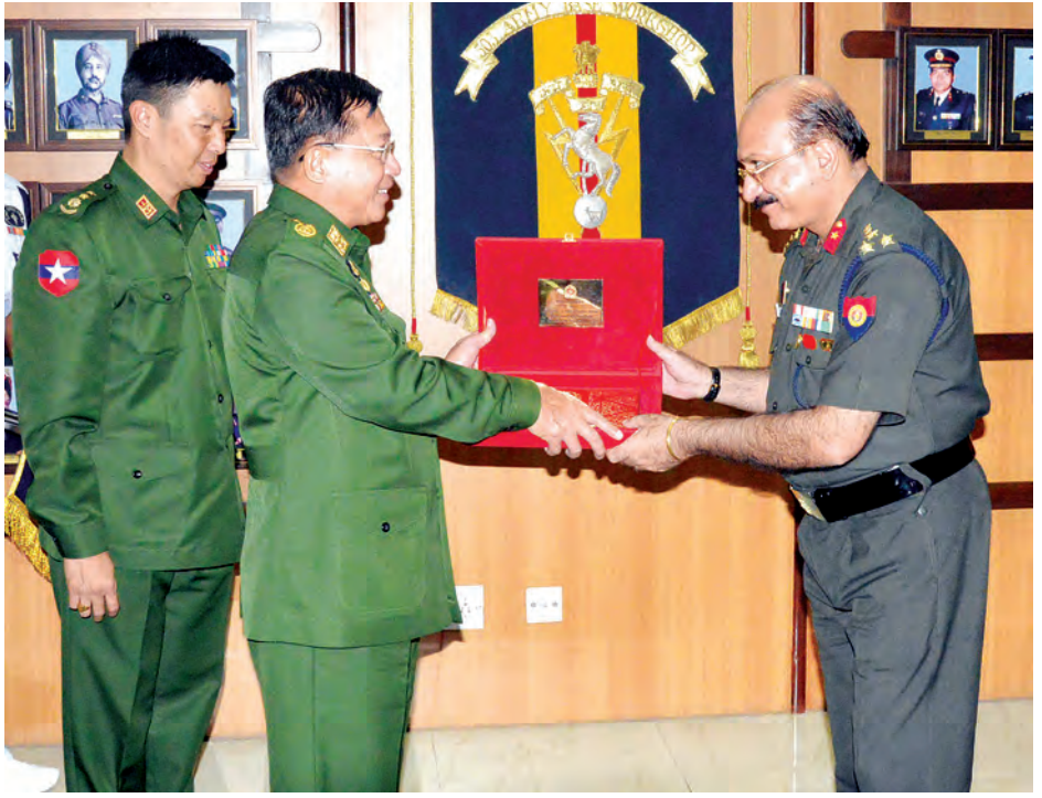
Presentation အား ကြည့်ရှုလေ့လာပြီး တပ်မတော် ကာကွယ်ရေးဦးစီးချုပ်က သိရှိလိုသည်များ မေးမြန်းခဲ့ သည်။

Centre-IMAC Gurgaon သို့ မွန်းလွဲ ၂ နာရီ ၁၅ မိနစ်တွင် ရောက်ရှိပြီး IMAC Gurgaon ၂ Deputy Chief of Naval Staff Vice Admiral RKTattanaik နှင့် အဖွဲ့ဝင်များက ကြိုဆိုသည်။ ဆက်လက်၍ Simulation ခန်းမတွင် ပင်လယ် ရေကြောင်းလုံခြုံရေးဆောင်ရွက်မှုများကို တာဝန် ရှိသူများက ရှင်းလင်းတင်ပြပြီး တပ်မတော်ကာကွယ်ရေး ဦးစီးချုပ်နှင့်အဖွဲ့ဝင်များက သိရှိလိုသည်များကို မေးမြန်း ကာ Simulation နှင့် System ဆိုင်ရာများကို ကြည့်ရှု လေ့လာ၍ ခေတ္တတည်းခိုသည့် ဟိုတယ်သို့ ပြန်လည် ရောက်ရှိသည်။ ထို့နောက် Taj Palace ဟိုတယ် Oval Room တွင် Unique Identification Authority of Function က ရှင်းလင်းပြသသော Biometric System