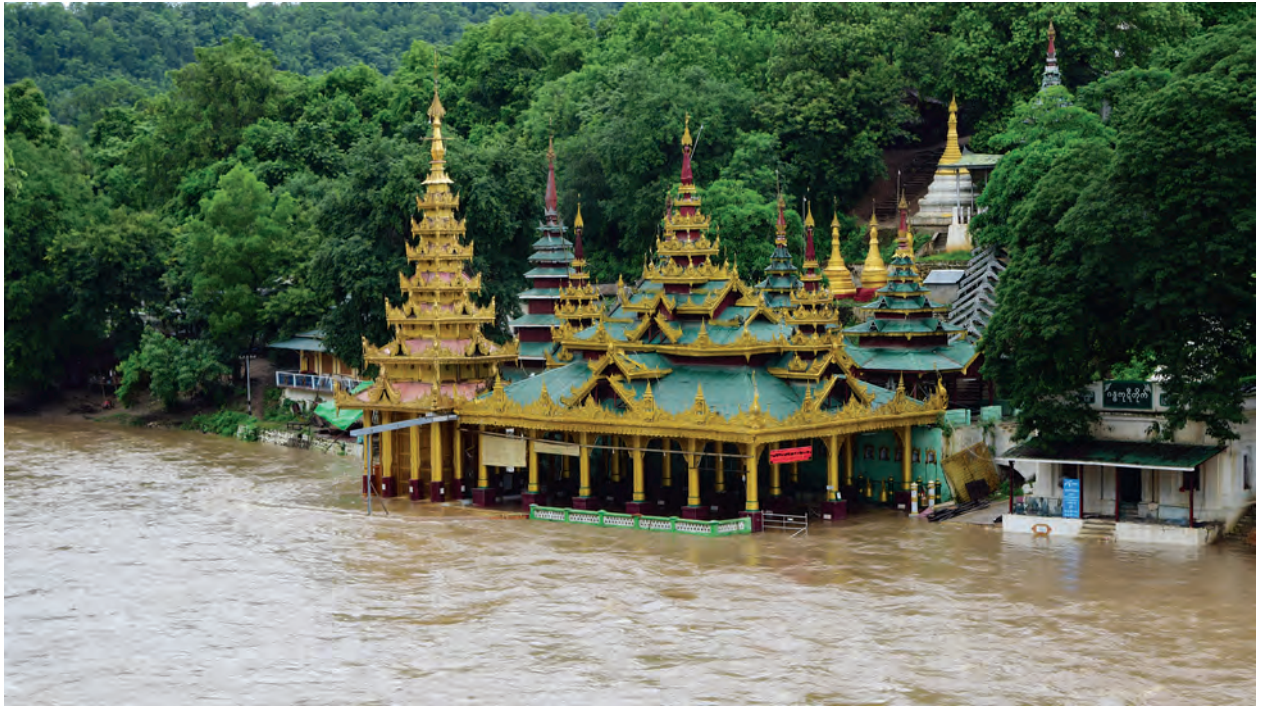
နှင့် ပါဒအောက်စက်တော်ရာခြေတော်ရာမြတ်အား ဘုရားကြီး၏ ဂေါပကအဖွဲ့ဝင်များနှင့်သက်ဆိုင်ရာ မြန်မာနိုင်ငံရဲတပ်ဖွဲ့ဝင်များ၊ ဘုရားကြီးအနီး ရှိကျေးရွာ များမှ အရန်မီးသတ်တပ်ဖွဲ့ဝင်များမှ ရေကင်းများချထား၍ အထူးစောင့်ရှောက်လျက်ရှိကြောင်း သိရသည်။

နမူဒါဟု အမည်တွင်သော မန်းချောင်းသည် ငမဲမြို့နယ်၏ အနောက် တောင်ဘက် (အထက်ဘက်)မှ စတင်၍စီးဆင်းလာရာ ၎င်းမန်းချောင်းရေအား မန်းချောင်း ရေလှောင်တံမံမှ သိုလှောင်ထိန်းသိမ်းထားရှိပြီး မင်းဘူး(စက) မြို့နယ်အတွင်းရှိ လယ်ယာမြေများနေစပါး အောင်ရေအပြည့်အဝပေးနိုင်ရန် အိုင်မရေလွှဲဆည်မှတစ်ဆင့် တောင်မန်းမြောင်းမကြီး၊ မြောက်မန်းမြောင်းမ ကြီးတို့ဖြင့် ဖြန့်ဝေပေးနေလျက်ရှိသည်။ ၂၀၁၆ ခုနှစ် နွေစပါးစိုက်ပျိုးရာသီတွင် စိုက်ပျိုးရေအပြည့်အဝသိုလှောင်ထားနိုင်ပြီး ရေပိုလွှဲပေါက်များမှတစ်ဆင့် စီးဆင်းသော မန်းချောင်းရေများကြောင့် မန်းရွှေစက်တော်ရာဘုရား အောက် စက်တော်ရာမြတ်အား ရေပုံးလွှမ်းသည်အထိ မြင့်တက်လျက်ရှိနေကြောင်း