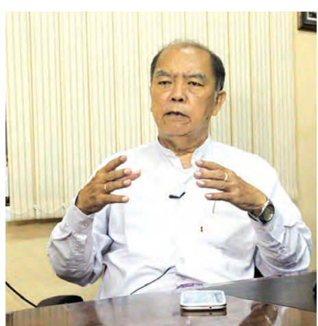
မိုးလေဝသနှင့် ဧကမဇပညာရှင် ဒေါက်တာ ထွန်းလွင် တွေ့ဆုံမေးမြန်းမှုကို ဖြေကြားစဉ်။

မိုးသည်းထန်မယ်၊ လောလောဆယ် အထူး သတိပြုဖို့ လိုအပ်တဲ့ ဒေသကတော့ ရခိုင်ပြည်နယ်နဲ့ ချင်းပြည်နယ် တို့ဖြစ်တယ်။ အဲဒီဒေသတွေမှာ ၂၄ နာရီ အတွင်း မိုးရေချိန် ခြောက်လက်မကနေ ရှစ်လက်မလောက်အထိ ရွာနိုင်တဲ့အနေအထားရှိတယ်။ ဒါကြောင့် ကုန်းပေါ်မှာ မိုးသည်းထန်စွာ ရွာသွန်းမယ်၊ နေရာတွက်ပြီး မိုးကြီးမယ်၊ ပင်လယ်ပြင်မှာဆိုရင်တော့ လေပြင်းတွေတိုက်ပြီး လှိုင်းကြီးမယ်။ ဒါတွေက ရခိုင်ကမ်းရိုးတန်း ကမ်းလွန် ပင်လယ်ပြင်မှာ အနည်းဆုံး ၃၆ နာရီအတွင်း ကြုံတွေ့ နိုင်တဲ့ အနေအထားတွေပါ။ ရခိုင်ကမ်းရိုးတန်း တစ်ခု လုံးနဲ့ ချင်းပြည်နယ်ကုန်းတွင်းပိုင်းဒေသ တချို့အထိ အကျိုးသက်ရောက်မှုရှိနိုင်တဲ့အတွက် သတိပြုဖို့ လိုတယ်။ အထူးသဖြင့် ရခိုင်ပြည်နယ်မြောက်ပိုင်းနဲ့ ချင်း ပြည်နယ်၊ စစ်ကိုင်းတိုင်းအထက်ပိုင်း စတဲ့ ဒေသတွေမှာ မိုးကြီးရင်ဖြစ်တတ်တဲ့သဘာဝဘေးတွေရှိတယ်။ မိုးသည်း ထန်စွာရွာသွန်းရင် မြေပြိုကျခြင်းနဲ့ လျှပ်တစ်ပြက် ရေကြီးမှုတွေကို အထူးဂရုစိုက်ဖို့လိုတယ်။ ပိုပြီးတော့ သတိထားရမယ့် အချက်တစ်ခုကတော့ ရေဖုံးလွှမ်းမှု ခံနေရတဲ့နေရာတွေမှာ ရေပိုတိုးလာနိုင်တယ်။ ကြိုတင် ကာကွယ်ထားဆီးမှုတွေ လုပ်ထားဖို့လိုအပ်ပါတယ်။