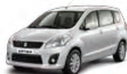
Superior White (26U)