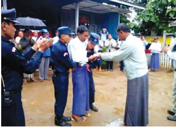
လိုပါက ကောလင်းမီးသတ်ဦးစီးဌာနမှ ဖုန်း-၀၉-၄၀၀၄၂၇၀၉၂ သို့ ဆက်သွယ်လျှော့ခန်းနိုင်ကြောင်း သိရသည်။