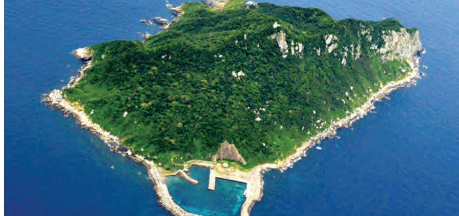
ထားသော အဆောက်အအုံနှင့်တကွ ကျူးရှူး မြောက်ဘက်ပိုင်းထိပ်ရှိ ရှေးဟောင်းဂူသင်္ချိုင်းတို့လည်း ပါဝင်သည်။ ဤလအစောပိုင်းက ယူနက်စကိုစာရင်းတွင် မေဂျီဘောက်စက်မှုတော်လှန်ရေးဒေသများကိုလည်း ထည့်သွင်းထားခဲ့ပြီး ယခုအခါ ဂျပန်နိုင်ငံတွင် ရှေးဟောင်းအမွေအနှစ်စာရင်းဝင်ဒေသ စုစုပေါင်း ၁၅ နေရာရှိလာခဲ့ပြီဖြစ်ကြောင်းသိရ သည်။ (ကျိုနို)

လက်စွပ်ကွင်းအပါအဝင် ယခုအိရန် ဟုခေါ်ဆိုပြီး (ယခင်ပါးရှား) ခေါ် သည့် အရပ်ဒေသမှ ဖြတ်မှန်များ ကိုပါ တွေ့ရှိရကာ နိုင်ငံအတွက် အဖိုးထိုက်တန်သောအရာများ အဖြစ် သတ်မှတ်ထားသည်။ သက်ဆိုင်ရာ ဒေသခံအရာရှိ တစ်ဦးကလည်း ယခုကျွန်းကို ယူနက် စကိုမှပြုလုပ်သော ကမ္ဘာ့ယဉ်ကျေးမှု အမွေအနှစ်စာရင်းတွင် ထည့်သွင်း ရန်အတွက်သင့်တော်ပြီး ဘာသာ ရေးကိုးကွယ်မှုဆိုင်ရာ အစဉ်အလာ ရှိခဲ့သည့်အလျောက် ယခုထိတိုင် နိုင်ငံကို ကိုယ်စားပြုတည်ရှိရန် ရှားပါးကြောင်း ပြောကြားခဲ့သည်။ ထိုနီးသိမ်းစောင့်ရှောက်ထားသော အထိမ်းအမှတ်နေရာတွင် Muna-kata Taisha အထွတ်အမြတ်ဆင်ယင်