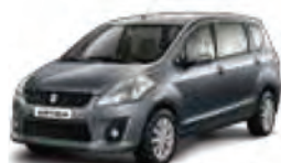
Granite Grey Metallic (ZTN)