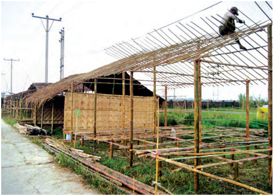
ဖျက်သုတ် ဖျက်သုတ်သို့ ဆောက်လုပ်သူကလည်း ဆောက်လုပ်နေကြသည်။

မြန်မာနိုင်ငံ၏ စီးပွားရေးမြို့တော်ဖြစ်သော ရန်ကုန်မြို့ သည် နိုင်ငံတကာမှ ရင်းနှီးမြှုပ်နှံရန် စိတ်ဝင်စားလျက် ရှိပြီး နိုင်ငံတော်ဘဏ္ဍာငွေအတွက် အခွန်ငွေအများဆုံးကို ရရှိနိုင်သော တိုင်းဒေသကြီးလည်းဖြစ်သည်။ မြန်မာပြည် ၏ အကြီးဆုံးစက်မှုဇုန်ကြီးလည်း တည်ရှိသောကြောင့် စက်မှုမြို့ဖြစ်သော လှိုင်သာယာမြို့၏ ဆယ်စုနှစ်ကျော် ကြာမြင့်ခဲ့သော မြေယာပြဿနာကို အမြန်ဆုံးဖြေရှင်း ဆောင်ရွက်ရန် လိုအပ်နေပြီဖြစ်သည်။