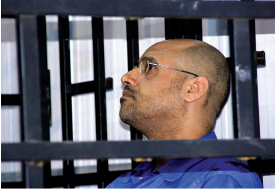
လူ့အခွင့်အရေးအဖွဲ့များကို သဘောမကျမှုများဖြစ်စေသည်။ (အပေါ်ပုံ)

လစ်ပျားတရားရုံးက ဇူလိုင် ၂၉ ရက်က မွမ်မာကဒါဖီ၏ ထင်ရှားကျော်ကြားသော သားတစ်ဦးဖြစ်သည့် ဇာအိမ်အယ်လ်အစ္စလာမ်နှင့် အခြားရှစ်ဦးကို ၂၀၁၁ တော်လှန်ရေး ပုန်ကန်မှု ဖြစ်စဉ်အတွင်း ဆန့်ကျင်ဆန္ဒပြသူများကို သတ်ဖြတ်ခဲ့သည့် စစ်ရာဇဝတ်မှုဖြင့် သေဒဏ်ပေးအပ်ခဲ့သည်။