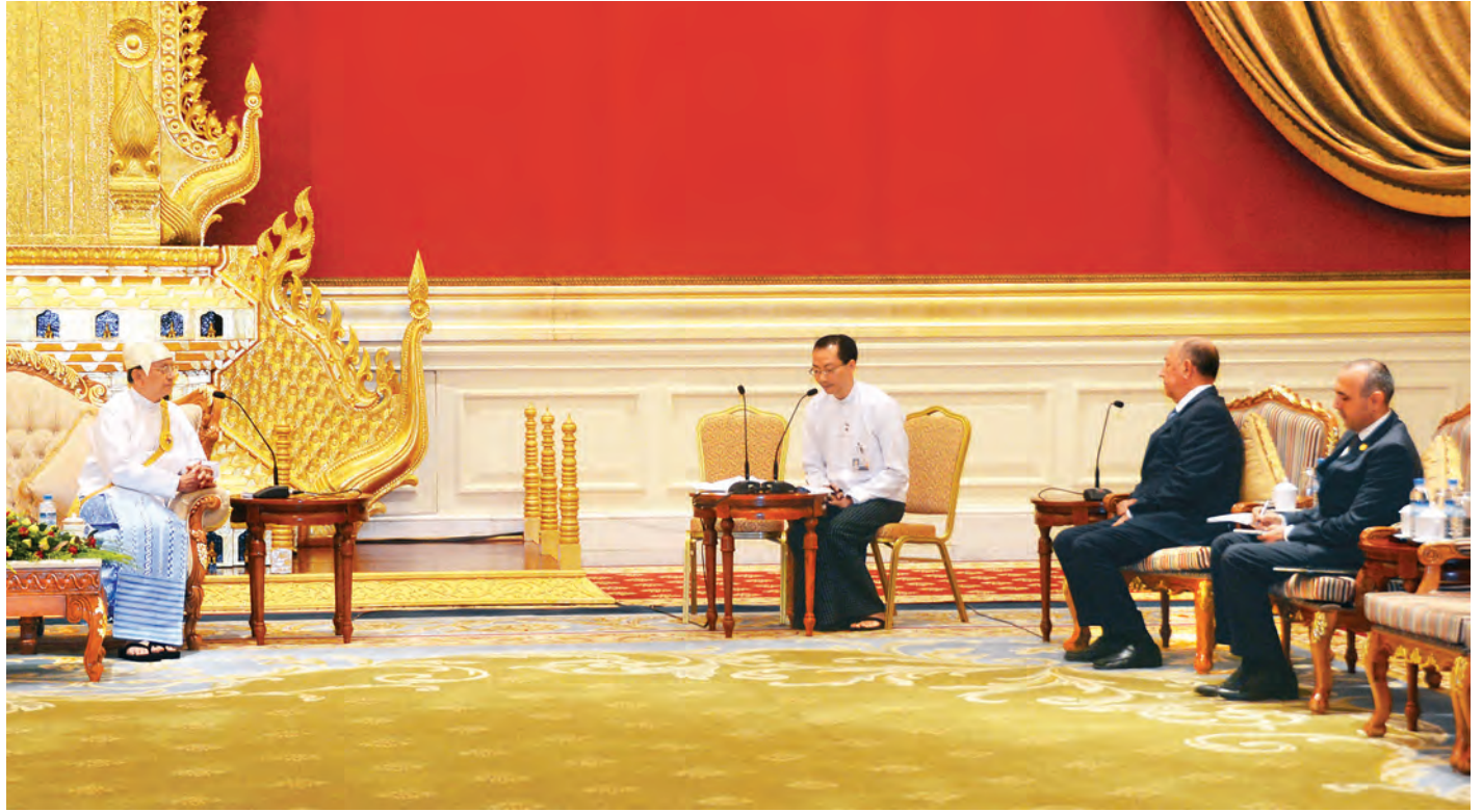
နိုင်ငံတော်သမ္မတ ဦးသိန်းစိန် အဇာဘိုင်ဂျန်သမ္မတနိုင်ငံ သံအမတ်ကြီးအဖြစ် ခန့်အပ်ခံရသည့် မစ္စတာ ကယ်လီ အယ်လီယေးဗစ်ချ် အာလာဗာဒီယက်စ်အား တွေ့ဆုံစဉ်။

ထို့အတူ ပြည်ထောင်စုသမ္မတ မြန်မာနိုင်ငံတော် နိုင်ငံတော်သမ္မတ ဦးသိန်းစိန်ထံ ပြည်ထောင်စုသမ္မတ မြန်မာနိုင်ငံတော်ဆိုင်ရာ တရုတ်ပြည်သူ့သမ္မတနိုင်ငံ သံအမတ်ကြီးအဖြစ် ခန့်အပ်ရန် သဘောတူညီပြီးဖြစ်သော သံအမတ်ကြီး မစ္စတာ ဟုန်လျန်သည် ယနေ့နံနက် ၁၁