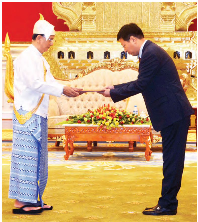
နိုင်ငံတော်သမ္မတ ဦးသိန်းစိန် ထံ တရုတ်ပြည်သူ့သမ္မတနိုင်ငံ သံအမတ်ကြီးအဖြစ် ခန့်အပ် ခံရသည့် မစ္စတာ ဟုန်လျန်က ၎င်း၏သံအမတ်ခန့်အပ်လွှာ ပေးအပ်စဉ်။