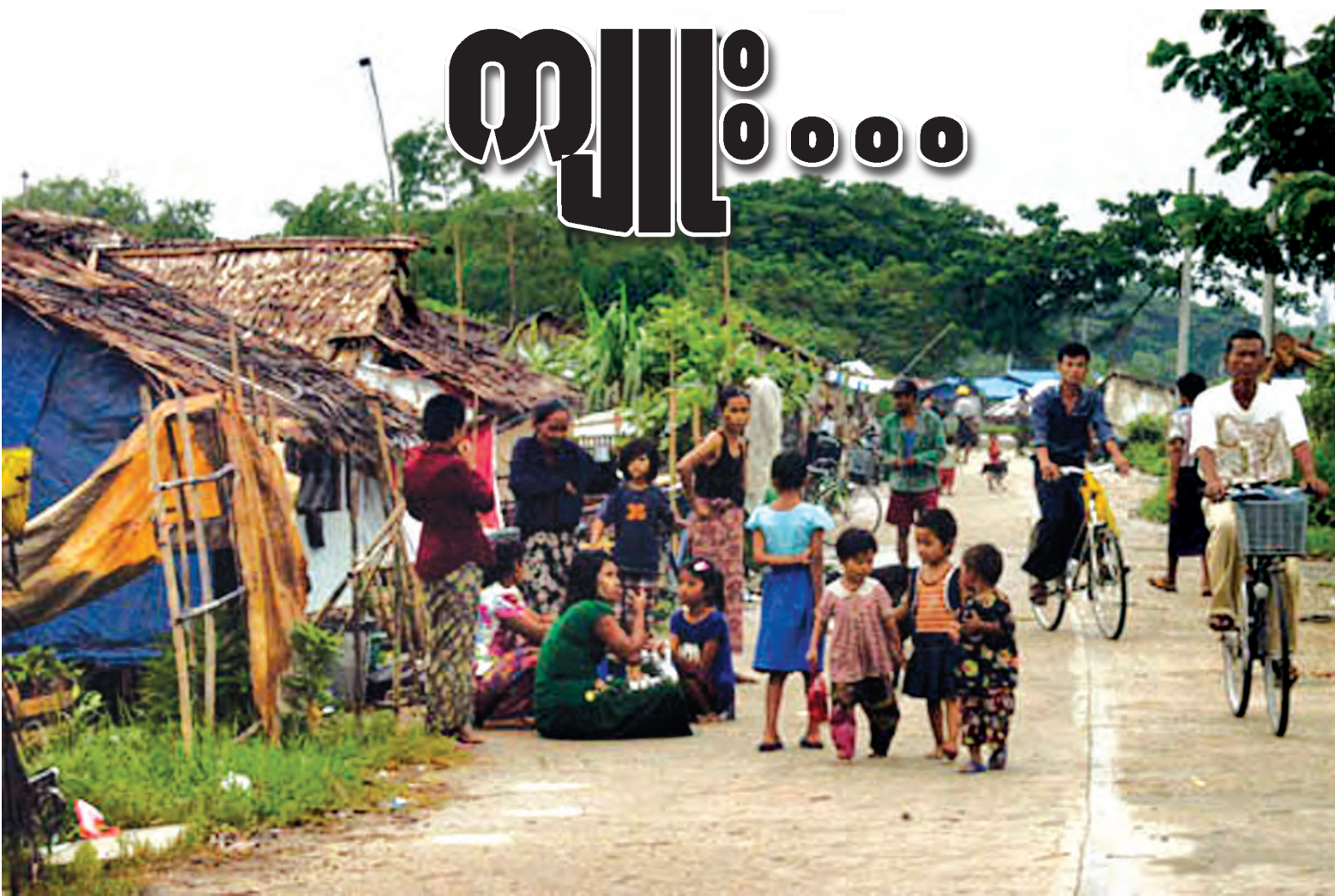
လှိုင်သာယာမြို့နယ်ရှိ ကျေးကျော်တဲများနှင့် မိသားစုဝင်များကို တွေ့ရစဉ်။

ခေါင်းငုံ့ဝင်ရသည့် ဓနိမိုး၊ ထရံက၊ ဝါးကြမ်းခင်းတဲကလေးက နောက်ထပ်ဘယ်နှမိုး၊ ဘယ်နှရာသီခန့်ခိုင်ရည်ရှိပါဦးမည်လဲဟု အတွေးကိုဝင်စေသည်။ ပေါက်ပြဲနေသည့် ဝါးထရံကို ဖာထေးကာရံထားသည့် မြေရေခွံ အိတ်ပိုင်းက လေတိုက်တိုင်း တဖျပ်ဖျပ် ရိုက်ခတ်နေသည်။ “ကျွန်တော်တို့ ဒီမှာနေတဲ့သူတွေက ဧရာဝတီတိုင်းကများတယ်။ နာဂစ်ဖြစ်ပြီး နောက်တစ်နှစ်မှာ ကျွန်တော်တို့ ခုနစ်ယောက်အုပ်စု ဒီလှိုင်သာယာကို ရောက်လာကြတယ်။ စက်ဆန်းမှာ တုန်းကလည်း ကျပန်းအလုပ်နဲ့ပဲ မိသားစုတွေရပ်တည်လာခဲ့ကြတာ။ တောကတက်လာတုန်းက လက်ထဲမှာ ငွေ ၂၀၀၀၀နဲ့ ၁၅ နှစ်အရွယ် သားကြီးက ပန်းရန်အလုပ်လိုက်လုပ်ရပြီး ကျွန်တော်ကတော့ ကြိုတဲ့အလုပ်လုပ်တယ်။ ဒီမှာစနေတုန်းက နေရာခ ၅၀၀၊ ၆၀၀၊ နောက် ၇၀၀၊