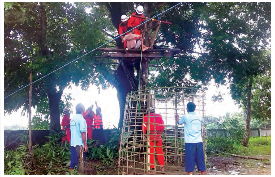
အမျိုးသားသဘာဝဘေး ကာကွယ်စောင့်ရှောက်ရေးဗဟိုကော်မတီနှင့် လူမှုဝန်ထမ်း၊ ကယ်ဆယ်ရေးနှင့် ပြန်လည် နေရာချထားရေးဝန်ကြီးဌာနတို့၏ ညွှန်ကြားမှု၊ ဧရာဝတီတိုင်းဒေသကြီး အစိုးရအဖွဲ့၏ ကြီးကြပ်မှုများဖြင့် ရေဘေးသလုပ်ပြုလေ့ကျင့်ခန်းကို ဇူလိုင် ၂၈ ရက်က ဧရာဝတီတိုင်းဒေသကြီး သာပေါင်းမြို့နယ် တံခွန်တိုင်ကျေးရွာ၌ ပြည်သူ ၂၅၀ ဖြင့် သရုပ်ပြလေ့ကျင့်မှုကို တွေ့ရစဉ်။