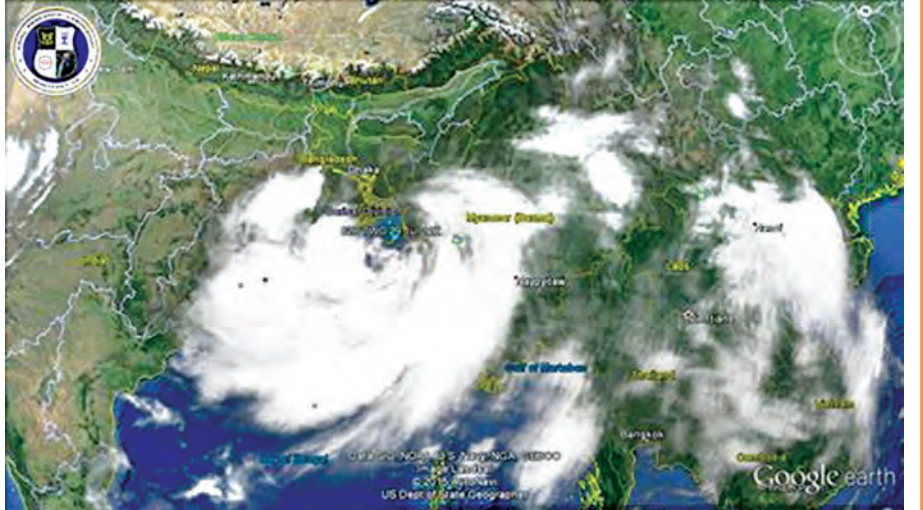
မြန်မာ့အလင်း သတင်းစာ အဖွဲ့မှ ရရှိထားသော ဗဟိုမြေပုံ၊ မြန်မာ့အလင်း သတင်းစာ အဖွဲ့မှ ရရှိထားသော ဗဟိုမြေပုံ၊ မြန်မာ့အလင်း သတင်းစာ အဖွဲ့မှ ရရှိထားသော ဗဟိုမြေပုံ