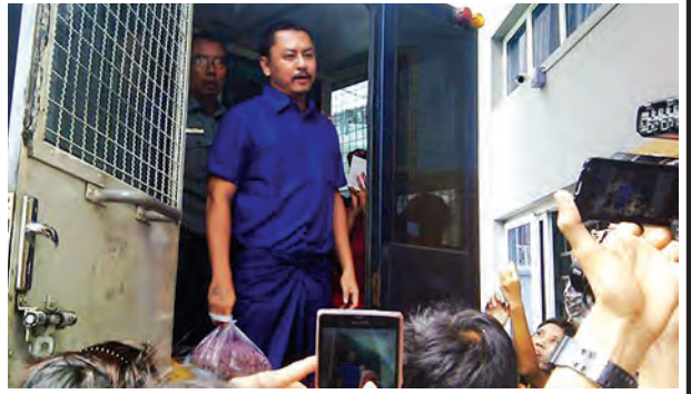
တစ်သက်တစ်ကျွန်းအမိန့်ချပြီးချိန်တွင် မင်းအုပ်စိုးအားတွေ့ရစဉ်။