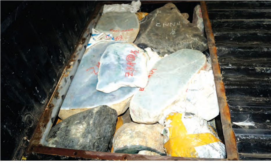
ဖမ်းဆီးရမိထားသော ကျောက်စိမ်းတုံးများ။