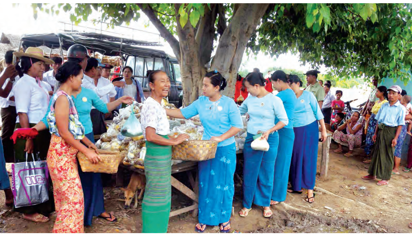
အရာတော်မြို့နယ်အတွင်း မူးမြစ်ရေဝင်ရောက်ခဲ့သည့်ကျေးရွာများတွင် အဖွဲ့အစည်းအသီးသီးနှင့် စေတနာရှင် အလှူရှင်များက ကူညီကယ်ဆယ်ရေးလုပ်ငန်းများ ဆောင်ရွက် လျက်ရှိရာ ဇူလိုင် ၂၈ ရက်က ဇရစ်ကျေးရွာကယ်ဆယ်ရေးစခန်း၌ ထမင်းထုပ်များ ဝေငှနေသည်ကို တွေ့ရစဉ်။ (ခရိုင် ပြန်/ဆက်)

ပိုလ်ချုပ်မှူးကြီးမင်းအောင်လှိုင် အိန္ဒိယတပ်မတော် ရေငုပ်သင်္ဘော အား ကြည့်ရှုလေ့လာ