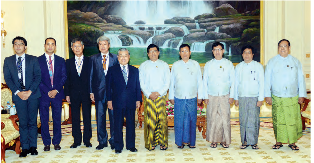
ဒုတိယသမ္မတ ဦးညွှန်ထွန်းနှင့် ဒုတိယဝန်ကြီးများ၊ ဂျပန်နိုင်ငံ ဂျေဂျီအိုအိုအို ဝါရင့်ဥက္ကဋ္ဌ မစ္စတာ ယိုရှိဟိရှိ ရှိဂဲဟိစ ဦးဆောင်သည့် ကိုယ်စားလှယ်အဖွဲ့တို့ ဖူးပေါင်းဆွဲတမ်းတင်ဓာတ်ပုံရိုက်စဉ်။