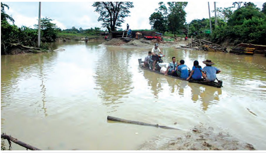
ချောင်းကူးတံတားပျောပါသွားသဖြင့် စက်လှေဖြင့်သွားလာနေကြစဉ်။

ထီးလင်း ဇူလိုင် ၂၈ ယခုရက်ပိုင်းများ၌ ဂန့်ဂေါခရိုင် ထီးလင်းမြို့နယ်တွင် မိုးအဆက်မပြတ် ရွာသွန်းသည့်အတွက် ချောင်းရေများ မြင့်တက်လာရာ ယုံဆင်းကျေးရွာနှင့် မင်းလယ်ကျေးရွာကို ဆက်သွယ်သည့် ကျေးရွာချင်းဆက်လမ်းသန္ဓေချောင်းကူးတံတားမှာ ဇူလိုင် ၂၇ ရက်က ပျောပါသွားခဲ့သည်။ အဆိုပါ တံတားမှာ အရှည် ၂၅ပေ၊ အကျယ် ၁၄ပေ၊ အမြင့် ၁၂ပေရှိ သစ်သားတံတားဖြစ်ကြောင်း နှင့် ၂၀၁၄-၂၀၁၅ ဘဏ္ဍာနှစ်တွင် တိုင်းဒေသကြီး ရန်ပုံငွေကျပ် သိန်း ၅၀ ဖြင့် ဆောက်လုပ်ခဲ့သည့်တံတား ဖြစ်ကြောင်း သိရသည်။ (၁၀၁)