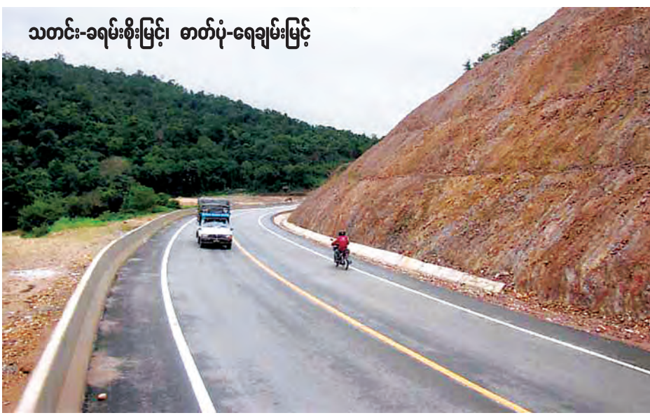
သတင်း-ခရမ်းစိုးမြင့်၊ စာတို-ရေချမ်းမြင့်

မြန်မာနိုင်ငံမှ အာရှနိုင်ငံများနှင့် ဆက်သွယ်သွားလာနိုင်သည့် လမ်းမကြီးများ ရှိသည့်အနက် အမှတ်- ၁ (AH.1) အာရှလမ်းမကြီးသည် ထိုင်း-မြန်မာနယ်စပ် မြဝတီမြို့မှစ၍ မြန်မာအိန္ဒိယနယ်စပ် တမူးမြို့အထိ ကီလိုမီတာ ၁၆၆၅ ရှိသည်။ ထိုအာရှလမ်းမကြီး၏ အစပိုင်းဖြစ်သော မြဝတီ-သင်္ကန်းညီနောင်-ကျောက်ရိတ်အပိုင်းမှာ ယခုအခါ ရာနှုန်းပြည့် ပြီးစီးနေပြီ ဖြစ်သောကြောင့် ဖွင့်ပွဲမပြုလုပ်ရသေးသော်လည်း မော်တော်ယာဉ်များ မြဝတီအထိ ဖြတ်သန်းမောင်းနှင်ခွင့်ပြုလိုက်ပြီဖြစ်သည်ဟု ကြားသိရသဖြင့် ကျွန်တော်တို့အဖွဲ့နှင့်အတူ ကရင်ပြည်နယ် လမ်းဦးစီးဌာနမှ လက်ထောက်အင်ဂျင်နီယာတစ်ဦးတို့ ပါဝင်သောအဖွဲ့သည် ဇူလိုင် ၂၄ ရက်က ဘားအံမြို့မှ ကားတစ်စီးဖြင့် ကျောက်ရိတ်မြို့ကို ဖြတ်သန်းပြီး အာရှလမ်းမကြီးအတိုင်း မြဝတီသို့ ဦးတည်မောင်းနှင် သွားရောက်ခဲ့သည်။ ယခင်က မြဝတီသို့သွားလိုလျှင် ကျောက်ရိတ်က ထွက်ကတည်းက ဒေါနတောင်ကြီးကို ခက်ခဲစွာ ဖြတ်သန်းပြီးသွားရသဖြင့် တောင်ပြိုမှု၊ ရွှေ့မှကားယူကိစ္စနှင့် ကြုံတွေ့လျှင် ကားလမ်းများပိတ်ပြီး ရွှေ့သွားမရတော့သဖြင့် တောင်ပေါ်တွင် ညအိပ်ရသည်သာများသည်။ ယခုအခါ ဒေါနတောင်ကြီးကို ရှောင်ကွင်းဖောက်လုပ်ထားသော အာရှလမ်းမ