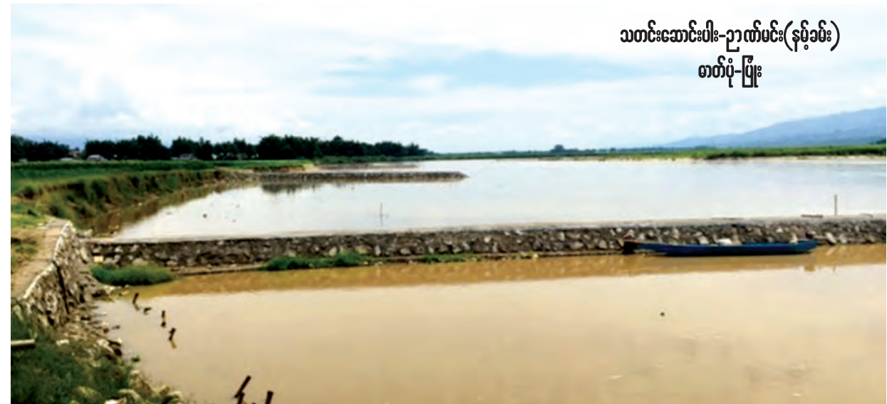
သတင်းဆောင်းပါး-ဉာဏ်မင်း(နမ့်ခမ်း) စာတို-ပြုံး

ဒေသအုပ်ချုပ်ရေးမှ တာဝန်ရှိသူများ၊ ရေအရင်းအမြစ်နှင့် မြစ်ချောင်းများ ဖွံ့ဖြိုးတိုးတက်ရေးဦးစီးဌာနမှ တာဝန်ရှိသူများ ကွင်းဆင်းကြည့်ရှုစစ်ဆေး၍ ရှမ်းပြည်နယ် အစိုးရထံ အဆင့်ဆင့် တင်ပြခဲ့ပြီး ပြည်နယ် အစိုးရက ၂၀၁၄-၂၀၁၅ ဘဏ္ဍာရေး နှစ်တွင် ခွင့်ပြုငွေကျပ် သိန်းပေါင်း ၃၆၀၂ သိန်းဖြင့် ရေအရင်းအမြစ်နှင့် မြစ်ချောင်းများ ဖွံ့ဖြိုးတိုးတက်ရေး ဦးစီးဌာနက ၂၀၁၅ ခုနှစ် ဖေဖော်ဝါရီ ၁၈ရက်မှစတင်၍ နောင်ခမ်းကျေးရွာ ရွှေလီမြစ်ကမ်းခြေ ကမ်းပြိုသော နေရာများတွင် အရှည်ပေ ၁၅၀ ရှိ ကျောက်ဖြည့်သံဆန်ခါ အခြေပြု ရေလွှဲရေကာကို စတင်အကောင်အထည်ဖော်တည်ဆောက်ခဲ့သည်။ ယခုအခါ ရေလွှဲရေကာ ခြောက်ခုကို တည်ဆောက်ပြီးစီးသဖြင့် ကမ်းခြေတွင် မိုးရာသီရေစီးအားသန်သော်လည်း ရေတိုက်စားမှု မရှိတော့ဘဲ ကမ်းပြိုမှုဒဏ်ကို မခံကြရတော့ပေ။ ထို့အပြင် ကမ်းခြေအချို့တွင် မြေနုကျွန်းများပင် ပေါ်ထွန်းလာခဲ့သည်။ ဒေသပြည်သူများကလည်း ကမ်းနံဘေး၊ လယ်ယာမြေ တစ်လျှောက်တွင် စိုက်ပျိုးလုပ်ငန်းအတွက် စပါး၊ ပြောင်း၊ ကြံများကို စိတ်ချမ်းမြေ့စွာ စိုက်ပျိုးနိုင်ကြပြီဖြစ်သည်။ နမ့်ခမ်း