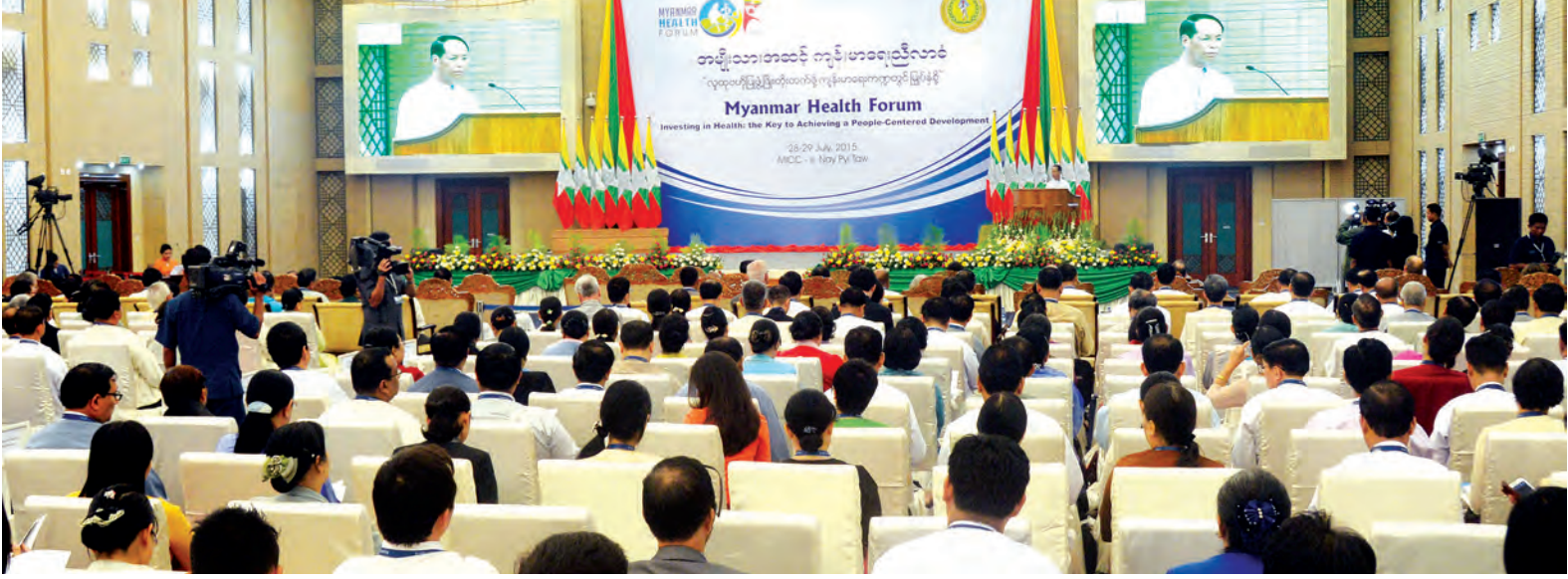
နေပြည်တော် ဇူလိုင် ၂၈

အမျိုးသားအဆင့် ကျန်းမာရေးညီလာခံကို ယနေ့ နံနက် ၉ နာရီတွင် နေပြည်တော်ရှိ မြန်မာအပြည်ပြည်ဆိုင်ရာ စိုင်းမောက်ခမ်းနှင့် ပြည်ထောင်စုဝန်ကြီးများ၊ ဒုတိယဝန်ကြီးများ၊ လွှတ်တော်ကိုယ်စားလှယ်များ၊ သံအမတ်ကြီးများ၊ လှုပ်ရှားရေးအဖွဲ့အစည်းများနှင့် ဖိတ်ကြားထားသူများ တက်ရောက်ကြသည်။