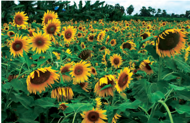
ကြောင့် စိုက်ပျိုးထားသောနေကြာ များ အထွက်နှုန်းမကောင်းဘဲ ရိတ်

ရမည်းသင်းမြို့နယ်အတွင်း နေ ကြာစိုက်ပျိုးသော ကျေးရွာများသည် စားသုံးဆီအတွက် အဓိကထားစိုက် ပျိုးကြခြင်းဖြစ်ပြီး ပိုလျှံမှုသာရောင်းချ ကြသည်။ ယခုနှစ်တွင် မိုးဦးနောက် ကျသဖြင့် နေကြာစိုက်ရက် နောက်ကျ ကာ မိုးရွာသွန်းမှုလည်း နည်းသော