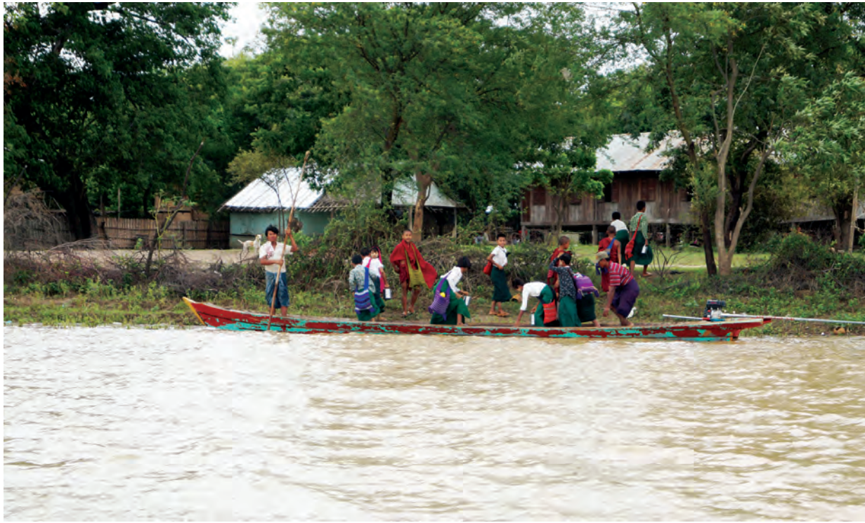
မကွေးတိုင်းဒေသကြီး ဗဟုကုမ္ပဏီမြို့နယ် ကွန်းရွာကျေးရွာအုပ်စု ခြောက်ဦးသား ကျေးရွာကလေးသည် ဧရာဝတီမြစ်ရေကြီးမှုတွင် ရေလယ်ကျွန်းရွာ လေးတစ်ရွာဖြစ်၍ ယင်းကျေးရွာကလေးရှိ အခြေခံပညာအလယ်တန်းကျောင်းတွင် ပညာသင်ကြားလျက်ရှိကြသော ရေစကြိုမြို့နယ် ငါးလဲကျေးရွာနှင့် အောင်သာကျေးရွာမှ အလယ်တန်းကျောင်းသားကျောင်းသူများကို မိဘများက ကျောင်းတက်မပျက်ရန် ဇူလိုင် ၂၇ ရက်က အလက ကျောင်းသို့ စက်လှေဖြင့် ဂရုတစိုက်လိုက်လံပို့ဆောင်ကြသည်ကို တွေ့ရစဉ်။