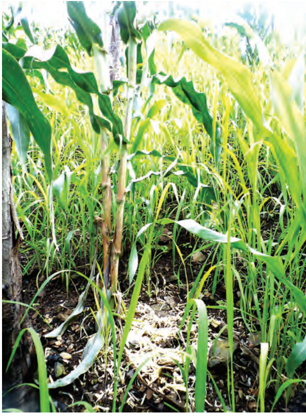
များတွင်လည်း ကြွက်ကာကွယ်နိမ်နင်းနည်း ပညာပေးဟောပြောပွဲများ ပြု လုပ်ပြီး လက်ကမ်းစာစောင်များ ဖြန့်ဝေခဲ့ကြောင်းသိရသည်။ အဆိုပါ ကြွက် ကာကွယ်နိမ်နင်းနည်း ပညာပေးဟောပြောပွဲသို့ ကျေးရွာအုပ်စုချုပ်ရေး မှူးနှင့် ကျေးရွာ ၉ ရွာမှ အုပ်ချုပ်ရေးမှူးများ၊ ဒေသခံတောင်သူများ တက် ရောက်ခဲ့သည်။

ကြွက်ကျရောက်ပျက်စီးမှုမရှိသော မော်သီဒိုကျေးရွာနှင့် ဒိုလာစောကျေးရွာ