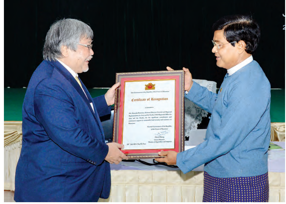
ဒုတိယသမ္မတ ဦးညွှန်ထွန်း၊ FAO ၏ အာရှနှင့် ပစိဖိတ်ဒေသဆိုင်ရာရုံးမှ လက်ထောက်ညွှန်ကြားရေးမှူးချုပ် Dr. Hiroyuki Konuma အား ဂုဏ်ပြုမှတ်တမ်းလွှာ ပေးအပ်စဉ်။

ရမည့်လုပ်ငန်းဖြစ်ပါကြောင်း၊ ဆောင် ရွက်ပြီးစီးမှုများကို ပြန်လည်သုံးသပ် ပြီး ပြည်ထောင်စုဝန်ကြီးဌာနများ၊ တိုင်းဒေသကြီး/ ပြည်နယ်အစိုးရများ နှင့် ကုလသမဂ္ဂအဖွဲ့အစည်းများ အကြား ပူးပေါင်းဆောင်ရွက်သွားရန် လိုအပ်ပါကြောင်း။ မဟာဗျူဟာကျသည့် မူဘောင် ကို ချမှတ်ရာတွင် ပြည်သူ့တိုးတက်မှု၊ ပေါင်းစည်းမှုပုံစံဖြင့် ဆောင်ရွက် ရမည်ဖြစ်ပါကြောင်း၊ ယနေ့ မြန်မာ နိုင်ငံအပါအဝင် ကမ္ဘာ့နိုင်ငံများတွင် စားနပ်ရိက္ခာပူလုံရေးအတွက် ကမ္ဘာ လုံးဆိုင်ရာ အစီအစဉ်များတွင် ပါဝင်ဆောင်ရွက်နေကြပါကြောင်း၊ စက်တင်ဘာလတွင် ကျင်းပမည့် ကုလသမဂ္ဂညီလာခံတွင် ထောင်စု