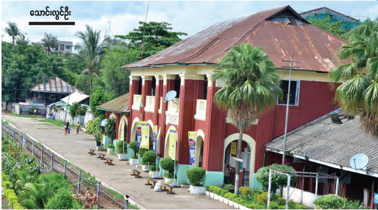
သောင်းလွင်ဦး

ရန်ကုန်မြို့၏ မြို့ပြဖွံ့ဖြိုးမှုကို ယခုအစိုးရလက်ထက်တွင် အကောင်အထည်ဖော်ဆောင်ရွက်ရာ၌ ပြည်ပမှ ရင်းနှီးမြှုပ်နှံမှုများ ပြည်တွင်းမှ ရင်းနှီးမြှုပ်နှံမှုများဖြင့် အကောင်အထည်ဖော်ဆောင်ရွက်ရာတွင် တိုးတက်မှု တစ်ခုတည်းကိုသာ ရှေးရှုဆောင်ရွက်မှုမပြုဘဲ ထိန်းသိမ်းသည့် သဘာဝအရင်းအမြစ်များ၊ ရှေးဟောင်းအမွေအနှစ်များကို ထိန်းသိမ်းဆောင်ရွက်နိုင်ရန် ရထားပို့ဆောင်ရေးဝန်ကြီးဌာနသည် ပြည်သူတို့၏ ဆန္ဒနှင့် တစ်သားတည်းဖြစ်စေရန် ကြိုးပမ်းဆောင်ရွက်သွားမည်ဖြစ်ကြောင်း သိရှိရပါသည်။ ဥပမာအားဖြင့် “ကြည့်မြင်တိုင်ဘူတာ ဖွံ့ဖြိုးတိုးတက်ရေးမှ ရှေးဟောင်းအမွေအနှစ် ထိန်းသိမ်းမှုများ စနစ်ကျပြုလား” ဟူသော ခေါင်းစဉ်ဖြင့် ၁၇-၆-၂၀၁၅ ရက်နေ့ မြန်မာ့အလင်း သတင်းစာပါ ခင်ရတနာ၏ သတင်းဆောင်းပါးအား ရထားပို့ဆောင်ရေးဝန်ကြီးဌာန ပြည်ထောင်စုဝန်ကြီးက ဖတ်ရှုမိသည့်အချိန်တွင် ထိုသတင်းဆောင်းပါးရေးသူ၏အပေါ် ရထားပို့ဆောင်ရေးဝန်ကြီးဌာန