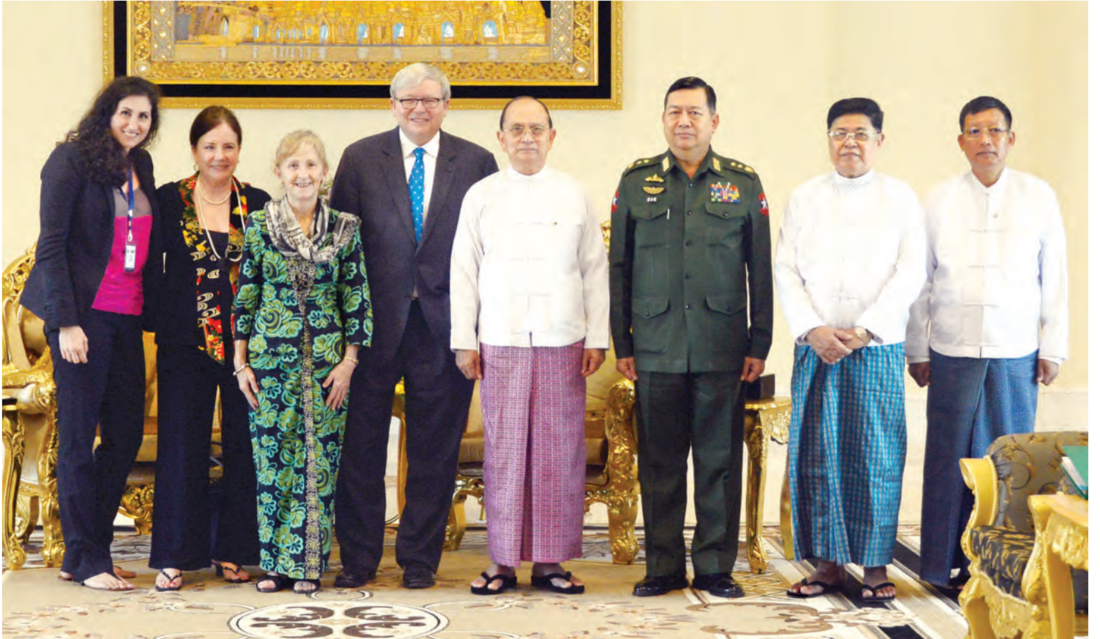
နိုင်ငံတော်သမ္မတ ဦးသိန်းစိန် အမေရိကန်ပြည်ထောင်စု နယူးယောက်မြို့အခြေစိုက် အာရှလူမှုအဖွဲ့အစည်းဆိုင်ရာမူဝါဒအဖွဲ့ဥက္ကဋ္ဌ (ဩစတြေးလျနိုင်ငံ ဝန်ကြီးချုပ်ဟောင်း) မစ္စတာ ကီပင်ရစ် ဦးဆောင်သည့် ကိုယ်စားလှယ်အဖွဲ့နှင့် စုပေါင်းမှတ်တမ်းတင်ဓာတ်ပုံရိုက်စဉ်။ (သတင်းစဉ်)

တွေ့ဆုံပွဲသို့ ပြည်ထောင်စုဝန်ကြီး ဒုတိယဗိုလ်ချုပ်ကြီးကိုကို ဦးစိုးသိန်း၊ ဒုတိယဝန်ကြီး ဦးတင်ဦးလွင်နှင့် တာဝန်ရှိသူများ တက်ရောက်ကြသည်။ (သတင်းစဉ်)